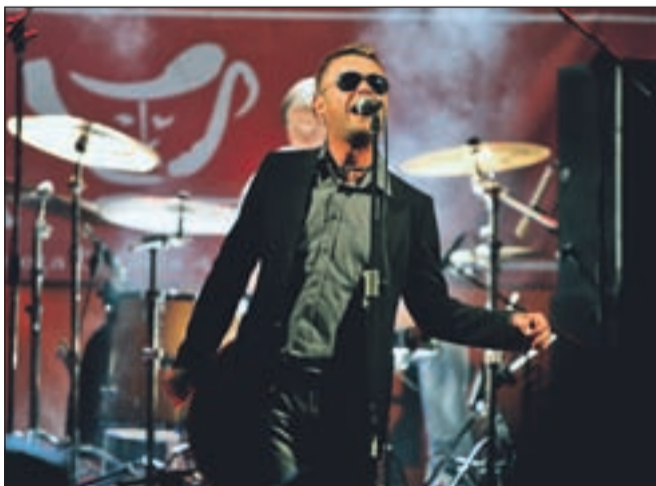
Pevac skupine Big Foot Mama