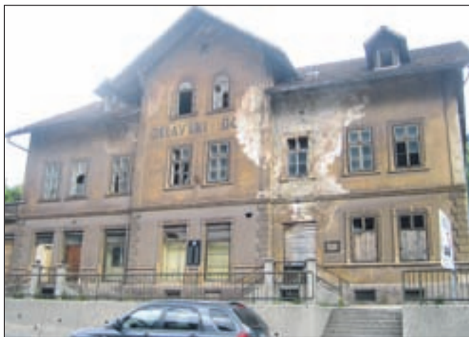
Delavski dom pri Jelenu - z rešenim vprašanjem lastništva naj bi se propadajočemu objektu vendarle začeli pisati boljši časi.

Občina Jesenice je priznala lastništvo Delavskega doma pri Jelenu Železarni Jesenice. To je bila ena od pomembnejših točk v nedavno sklenjenem dogovoru med Občino Jesenice, Slovensko industrijo jekla in Železarno Jesenice glede ureditve ne-rešenih premoženjskih za-