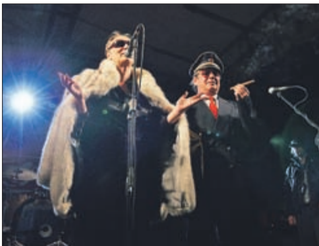
Govor sta imela tudi maršal Tito in Jovanka.