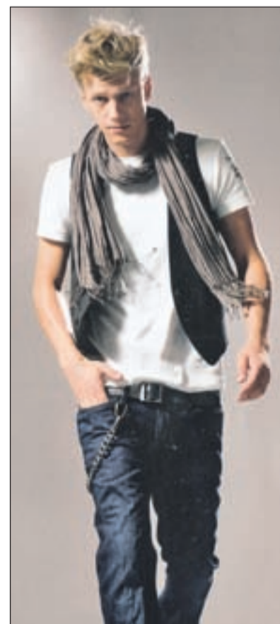
Asimetrična sproščenost. Naj bo pri vas podobno.

gov sem zbrala fotografije samozavestnih mladeničev, vi pa boste nadaljevali v tem slogu, kajne? Videz naj bo čim bolj sproščen. Obožujete preprostost ali igro novih vzorcev in oblik? Odločitev je vaša! Šal naj bi izražal osebnostni slog, zato ga kombinirajte k svojim najljubšim oblačilom. Na srajco in suk-