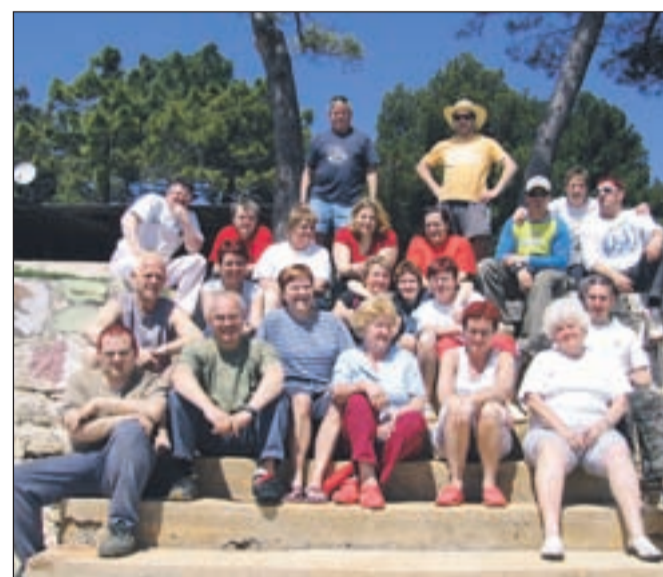
Vodstvo ZDPM Jesenice in prostovoljci