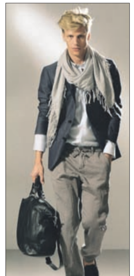
Šal trikotne oblike, stkan v različnih vezavah: idealen za raznovrstne stile

njič, na tanek pulover in tudi na majico. Le kdo pravi, da preprosta majica in šal ne moreta najti skupnega jezika? Kratki rokavi in šal - zakaj pa ne!? Lahko ga uporabite, da vas malo pogreje ali pa samo za okras. Pri tem ni pomembno, da se barva ujema z vašim oblačilom, stil naj vsekakor se. Barvne kombinacije