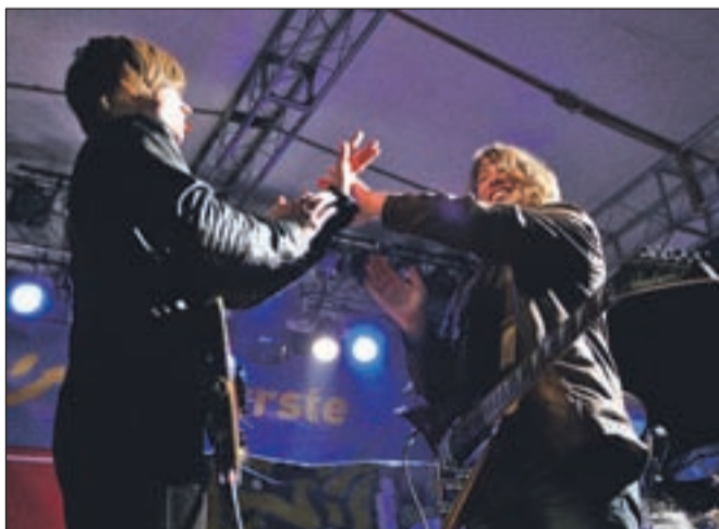
Domača zasedba Chill Out