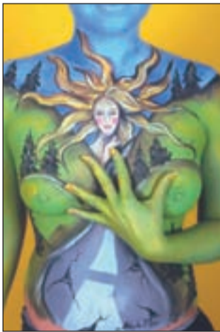
Tjaškino poslikano telo bo krasilo naslovnico pesniške zbirke.