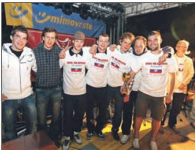
Najboljša ekipa v rolerhokeju