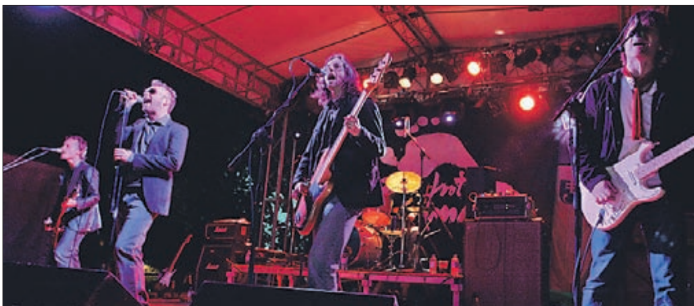
Zvezde večera so bili člani zasedbe Big Foot Mama. | BESEDILO IN FOTOGRAFIJE: ANKA BULOVEC