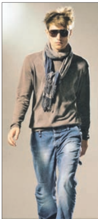
Dvobarvni šal, zavezan na najosnovnejši način

Prve šale so kot modne dodatke v 18. stoletju nosili francoski in britanski vojaki, ki so se vrnili iz indijskih vojn. Vzorci in oblike teh šalov so vplivali na evropske različice naslednjih sto let. V 19. stoletju so bili zelo priljubljeni indijski šali, predvsem kašmirski s storžastim motivom. V 20. stoletju so šali modni dodatek dnevnih in večernih oblačil, 21. stoletje pa nam je prineslo nove osvežitve. Trendovski šali so pravokotne ali trikotne oblike, stekani v različnih vezavah ali vzorcih, včasih tudi potiskani, in z dodanimi cofki ali resicami. Pomembno je, da so čim lažji in mehki. Kako jih boste nosili okrog vratu in ramen, je prepuščeno vaši domišljiji. Za nekaj začetnih nami-