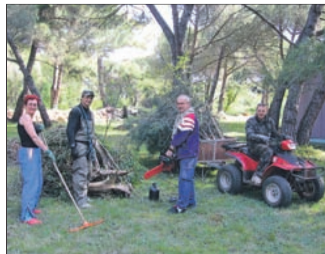
Prostovoljci pri delu v letovišču

Prijavnice za letošnje letovanje za učence so še na voljo na osnovnih šolah, prijave za mlade družine in druge pa so možne v pisarni ZDMJ Jesenice.