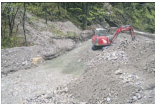
Strugo potoka Bela so na dveh delih začeli urejati konec aprila.