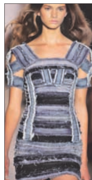
Sama svoja mojstrica? Narežite kose starih kavbojk in si sešijte obleko. Preprosto, a izvorno.

tične imajo volance. Število volancov prilagodite na obliko in dolžino vaših nog. Bolj preproste pa se igrajo z različnimi rezi in poudarjenimi šivi za sestavljanje. Ker so sedaj še hladni dnevi, spodaj oblecite tanek pulover ali bluzo. Moda je jeans tokrat ujela v okvir, ki bi mu lahko rekli bukoličen ali vsaj močno podeželski.