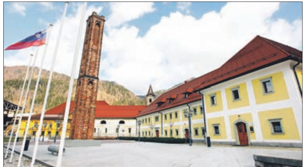
Stara Sava je že sedaj privlačno urbano središče Jesenic, z zaključkom obnove pa bo še bolj zanimiva za obiskovalce.

"Celotno fužinarsko zgodbo bomo na atraktiven način prikazali tudi obiskovalcem. Zgodba o življenju fužinarjev je že pripravljena - deklica bo po območju Stare Save iskala svojega očeta, fužinarja, in