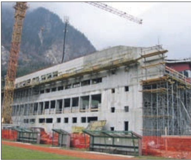
Obnova Hale Podmežakla