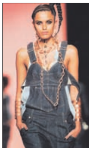
Navdih osemdesetih: hlače na lac so za oba.