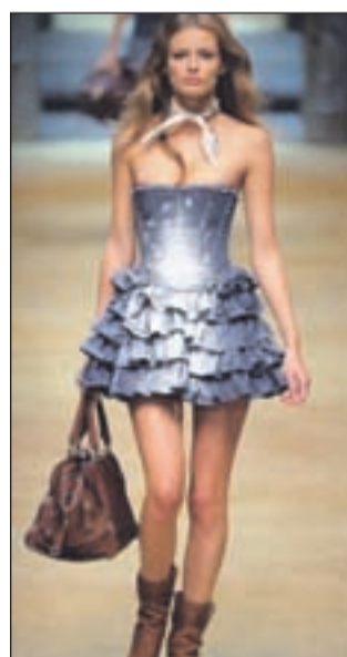
Country look - podeželski videz: rutica, obleka z volanci in škornji. Zajahajte kot že nešteto krat.

Za ženske se mi zdijo zanimive športne kreacije za vsak dan kot tudi tiste kreacije za slovesne priložnosti. Morda namig za vse tiste, ki znate biti same svoje mojstrice: iz starih kavbojk, ki vam niso več prav, narežite kose in sešijte obleko. Obleka iz jeansa ima naravnice, je stisnjena v pasu in ima rahel trapez spodaj, da lahko hodimo. Roman-