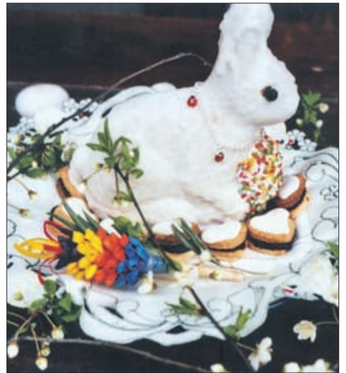
Velikonočni zajček iz biskvita

Na podoben način bralka Jelka pripravi tudi velikonočno jagnje iz biskvita, kakršnega je pekla Pogačarjeva mama pred več kot sto leti. Edina daleč naokrog je imela dva kovinska modelčka za peko, manjšega za peko biskvita iz enega jajca, večjega pa za peko iz dveh jajc. Jelka jagnje okraši še bolj kot zajčka, posuje ga tudi s kokosovo moko, mu doda oči iz brinovitih jagod in doda iz papirja ali iz blaga