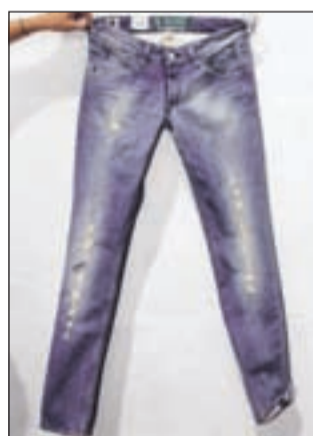
Raztrgano ali zguljeno: najbolj seksi moške kavbojke

Ni več rokarski ali posut z neti, temveč ga najdemo med protagonisti v romantičnih zgodbah mehkih videzov. Najbolj modni modeli so videti znošeno. Vzorci, ki jih povzročajo izpiranje z varikino, so pravi modni hit. Pa peskani efekti tudi. Vse to je džins z letošnjo letnico. Moški boste najbolj seksi v kavbojkah z umetnimi raztrganinami, ženske pa v obleki iz jeansa. Hlače na lac so za oba. So ohlapne in spodaj na dolžini dvakrat zavihane. Z nami je zgodba osemdesetih. Tako bo torej z jeansom v pomladi. Ko pa se bo pomlad prevesila v poletje, bodo kavbojske zgodbe zasledovale močno obdelan jeans, lahko romantično mehak, v ženskih oblačilih nabran v volance.