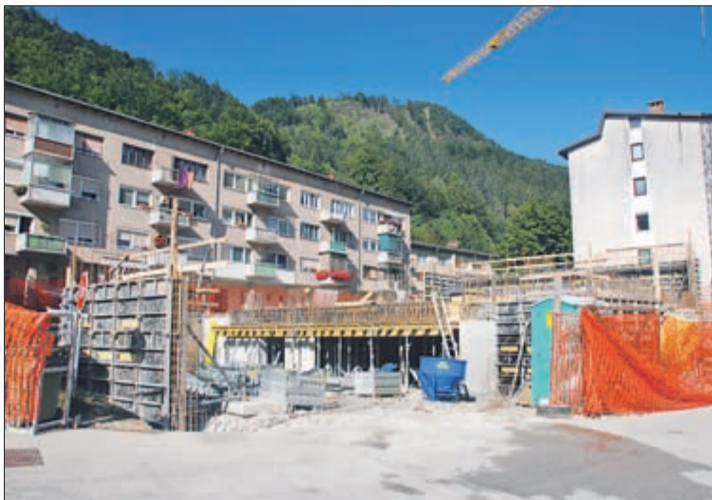
Blok z oskrbovanimi stanovanji naj bi bil zgrajen do pomladi prihodnje leto. Objekt bo imel pritličje in še štiri etaže, v kleti pa bodo garaže.