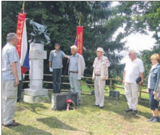
Delegacija borcev in predstavnikov občine pri spomeniku na Obranci

kritike in omalovaževanja pomena revolucije, ki nam je v bistvu omogočila velik razcvet demokracije in socialne. Zadnji pojavi v družbi pa kažejo na ponavljanje zgodovine izpred druge svetovne vojne. Vsekakor pa še