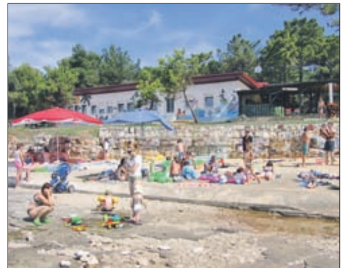
Plaža v Pinei, v ozadju letovišče