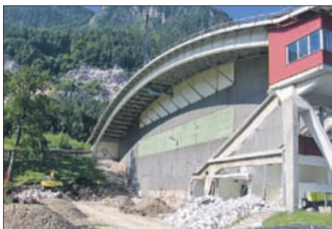
Začetek gradbenih del na vzhodni strani športne dvorane, kjer bo nova tribuna.

Ob podpisu pogodbe so vsi izrazili optimizem, da bo prva faza obnove končana do septembra prihodnje leto. Izvajalci bodo vsa dela opravljali tako, da ne bo motena hokejska sezona na ledeni ploskvi v dvorani. J. R.