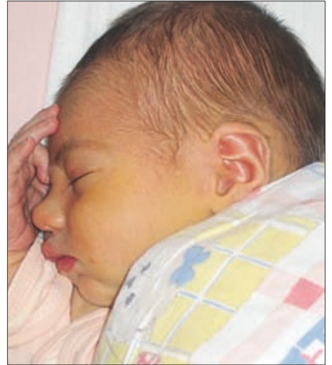
Lovro - v Sloveniji je tako ime 1214 moškim. To ime je v zadnjih letih spet vse bolj priljubljeno.

najbolj priljubljeno fantovsko ime v Sloveniji že deseto leto. Temu imenu sledijo še imena Jan, Nejc in Nik. Druga najpogostejša imena so bila še Žiga, Žan, Jakob, Jaka in Matic. Med deklicami pa imenu Lana po pogostnosti sledijo imena Sara, Eva, Nika, Ana, Lara, Neža in Zala.