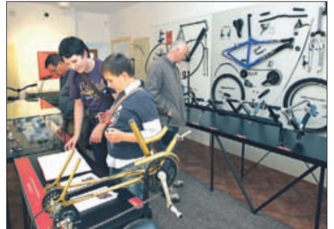
V muzeju so si obiskovalci lahko ogledali razstavo Dve kolesi in par nog.