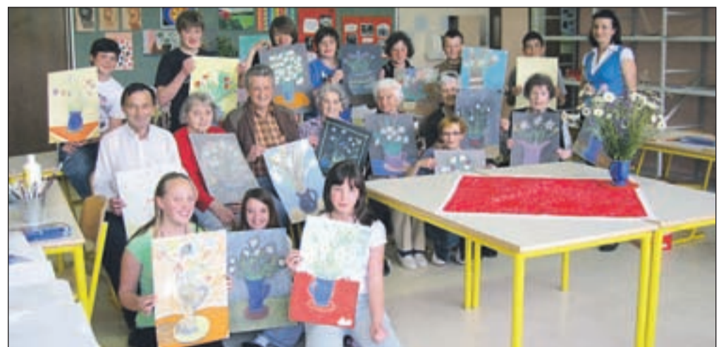
V slikanju vaze z rožami so se preskusili tako učenci kot starostniki.

Razvojna agencija Zgornje Gorenjske je že tretje leto zapored speljala projekt Mladi razveseljujemo starejše, katerega namen je medgeneracijsko povezovanje. V njem sodelujejo učenci osnovnih šol z Jesenic, iz Kranjske Gore in Mojstrane ter stanovalci Doma upokojencev dr. Franceta Berglja Jesenice. Kot je povedala vodja projekta Eldina Čosotović iz Razvojne agencije Zgornje Gorenjske, so pripravili več srečanj otrok in starostnikov, s katerimi so želeli popestriti vsakdanje aktivnosti stanovalcem v domu upokojencev, učenecem pa približati razumevanje oseb v vseh starostnih obdobjih. Na Jesenicah so potekala tri srečanja. Na prvem so učenci obiskali dom upokojencev in nastopil je mladinski pevski zbor z Osnovne šole Toneta Čufarja.