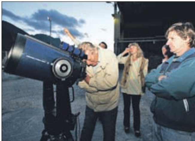
Pod vodstvom jeseniškega Astronomskega društva Nova so s teleskopi prvo ozrli zvezdo Arktur, kasneje Saturn.