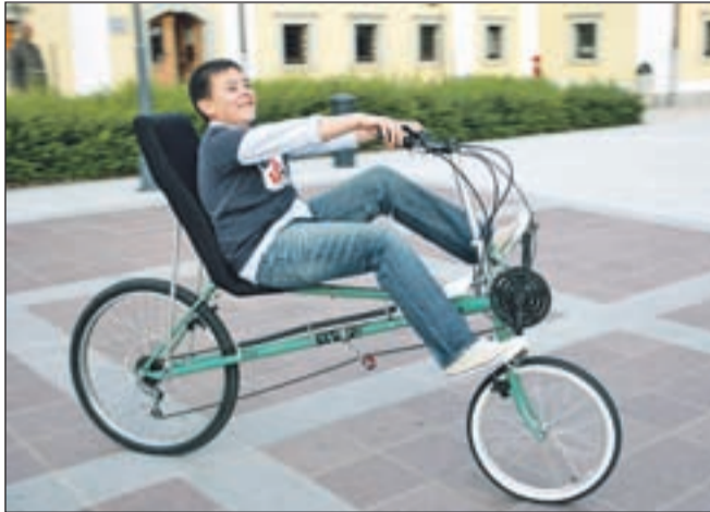
Demonstracija starih in novih koles: na fotografiji je deček v tako imenovanem ležečem kolesu.

Gornjesavski muzej Jesenice je konec junija pripravil poletno muzejsko noč.