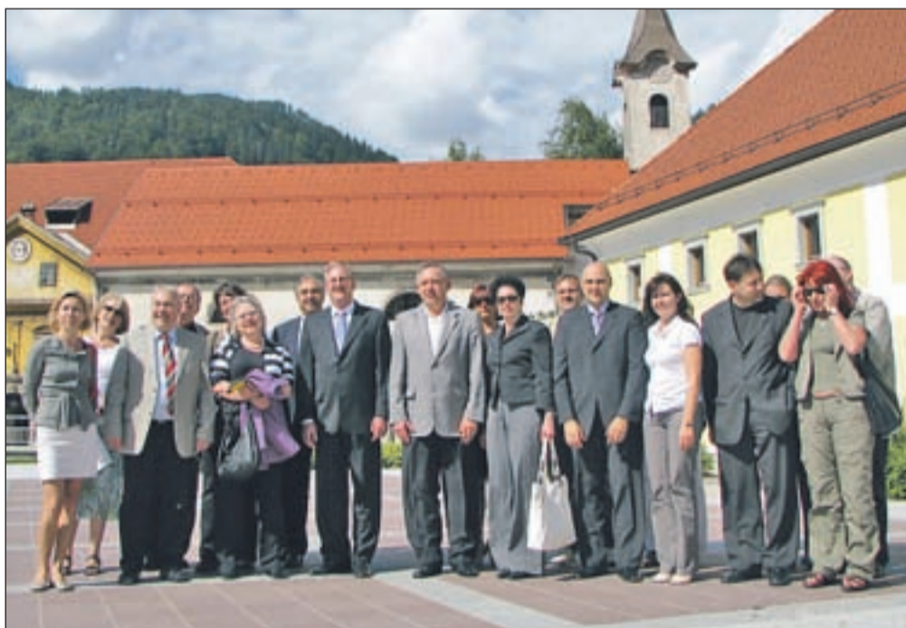
Predstavniki jeseniške občine s prijatelji iz Nagolda na Stari Savi.