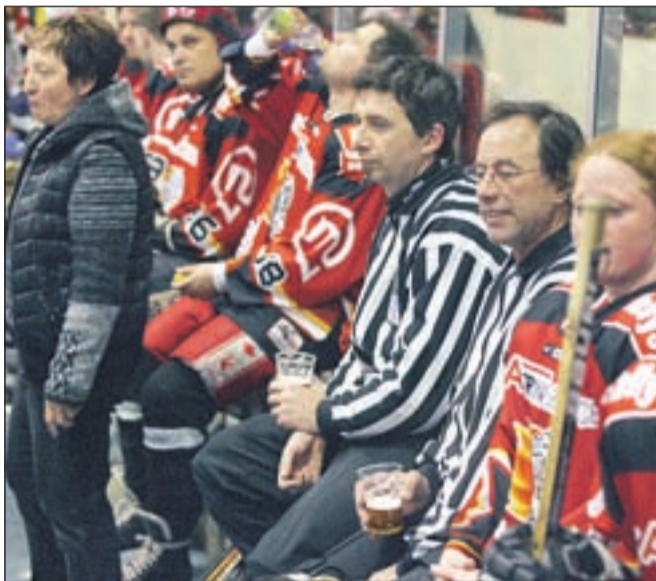
Rdeči so medse posadili sodnika.