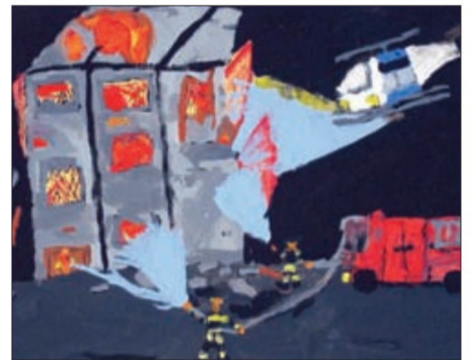
Selma, 7. razred