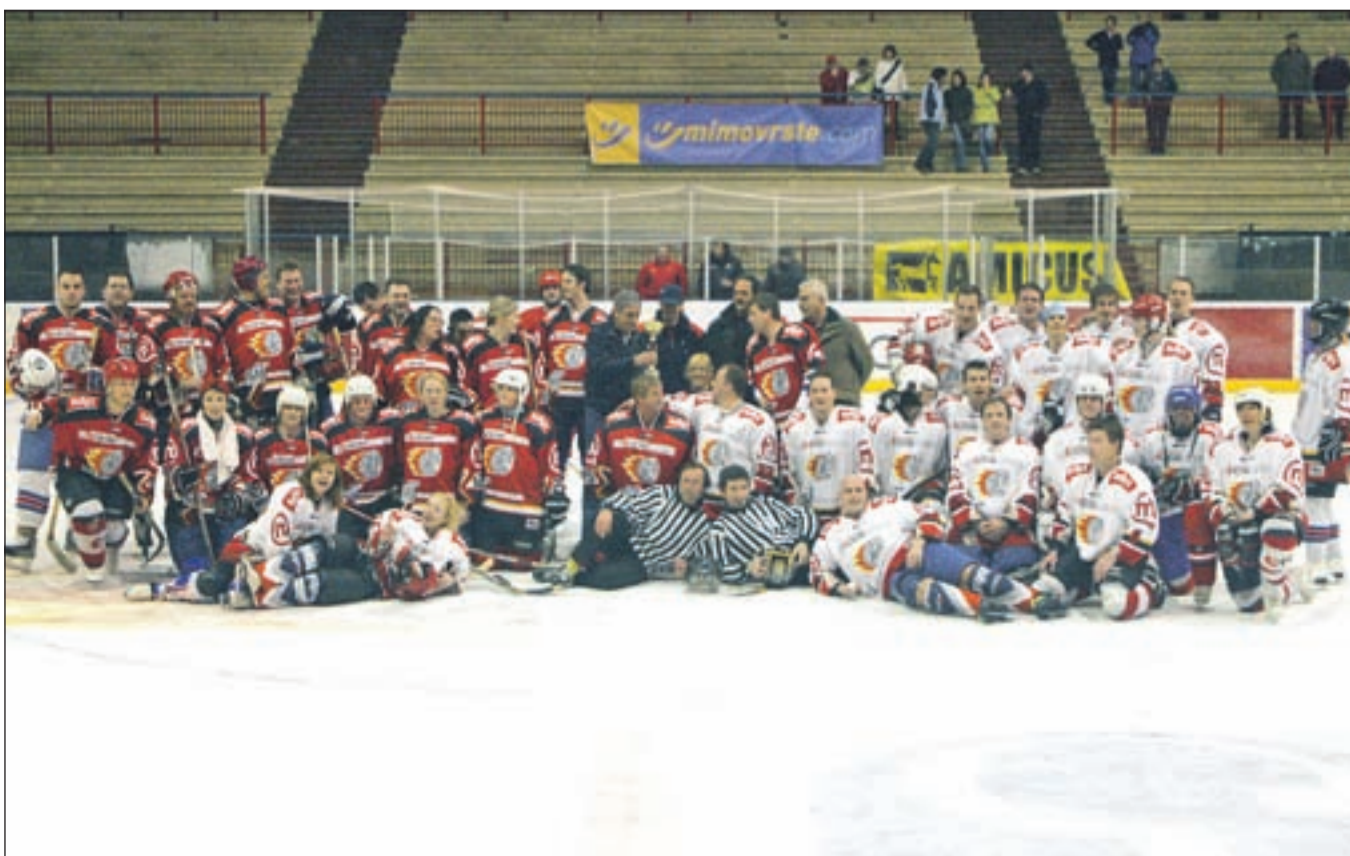
Beli in rdeči so sestavljali tako hokejistke kot hokejisti, predstavniki zdravstvenih domov na Gorenjskem in jeseniške bolnišnice.