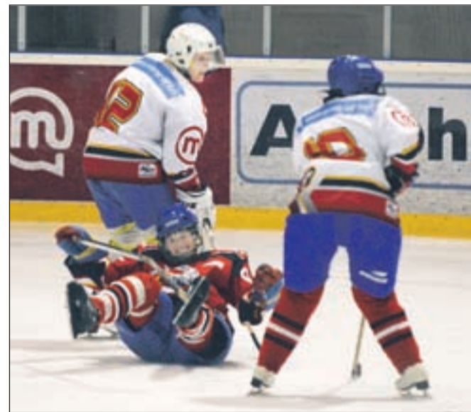
Ženski del zdravstvenih domov v elementu