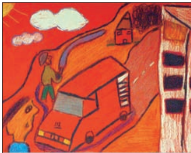
Luka, 8. razred

suhimi barvicami. Češkova je še dodala, da so mnogi učenci navdih za ustvarjanje dobili na reševalni akciji, v sklopu katere so jim gasilci prikazali reševanje iz višjih nadstropij: "Poleg tega so se učenci preizkusili v gašenju z gasilnim aparatom in zbijanju tarče z vodnim curkom, ogledali pa so si tudi opremo gasilskega avta."