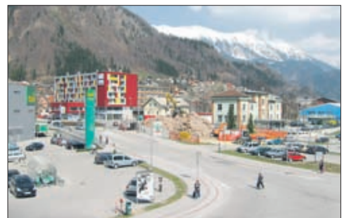
S porušitvijo stare stavbe kadrovske se je odprla nova panorama tega dela Jesenic.