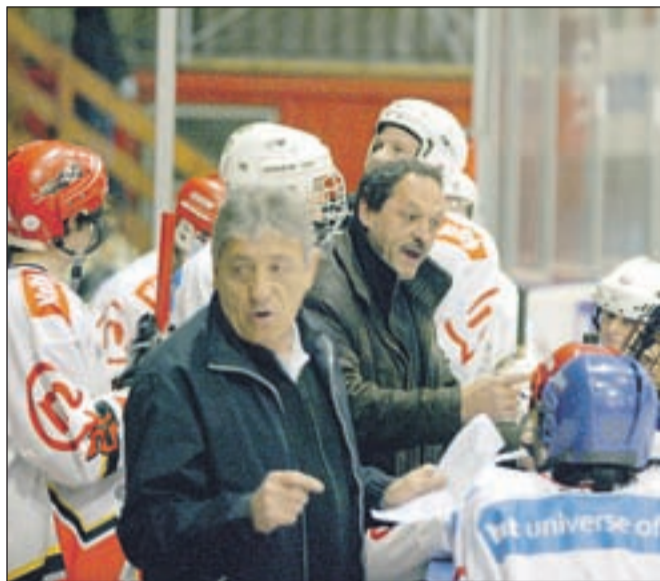
Še zadnje priprave v taboru belih

BESEDILO: ALENKA BRUN