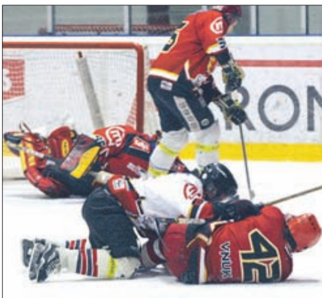
Vroča akcija pred golom, na koncu so več spretnosti pokazali beli.