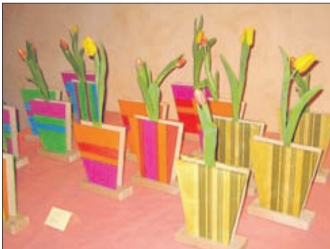
... izvirne lesene vaze ter še vrsta drugih unikatnih izdelkov.