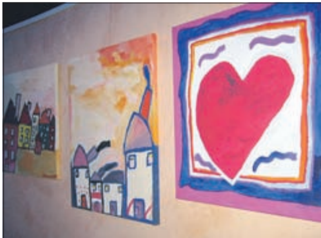
Naprodaj so čudovite slike, ki so jih naslikali učenci ...