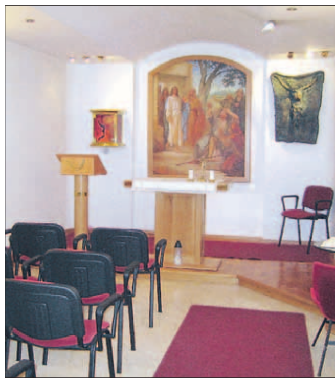
Kapela Marije Pomagaj v kleti jeseniške bolnišnice je ves čas odprta, vanjo zahajajo pripadniki vseh veroizpovedi.

Poleg katoliškega duhovnika pa v jeseniško bolnišnico prihajajo tudi duhovniki