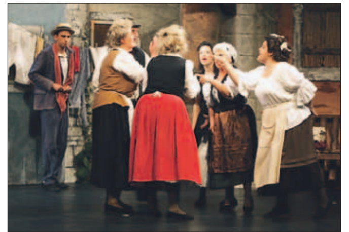
Utrinek z ene od predstav - Primorske zdrahe