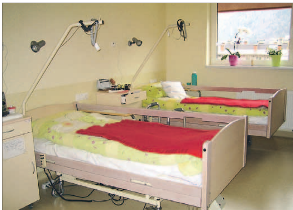
Prijetno urejene sobe v mansardi je dobilo petnajst stanovalcev.