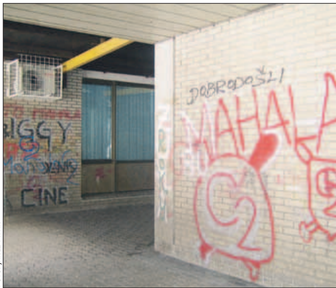
Center 2: Zapušeni lokali, kopica grafitov ... A prvi znaki oživljanja so tu, pred kratkim so odprli nov frizerski salon, v nekaj dneh vrata odpira nova prodajalna čevljev.