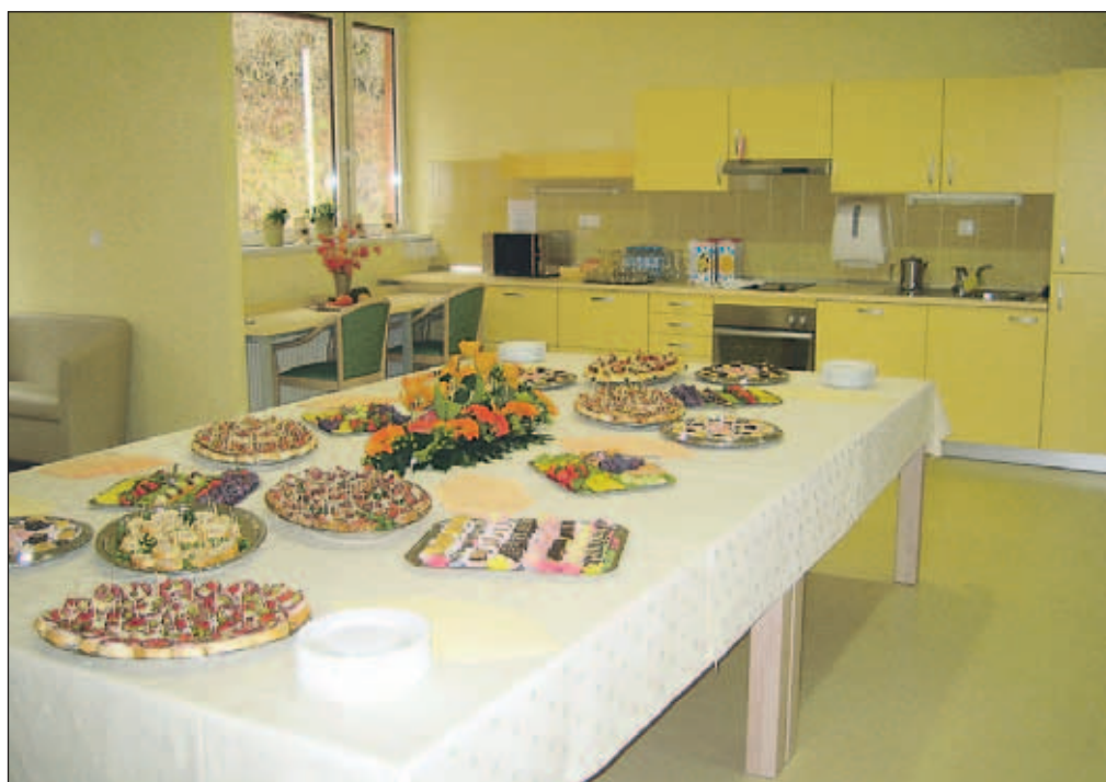
Skupni prostori v sončnem oddelku