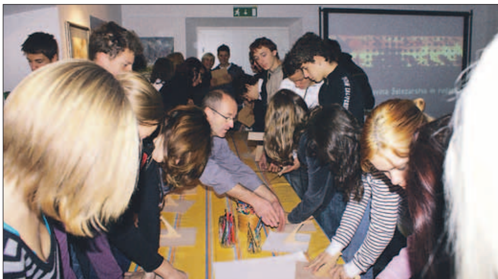
Utrinek z muzejske delavnice, ki so se je udeležili dijaki Srednje šole Jesenice.