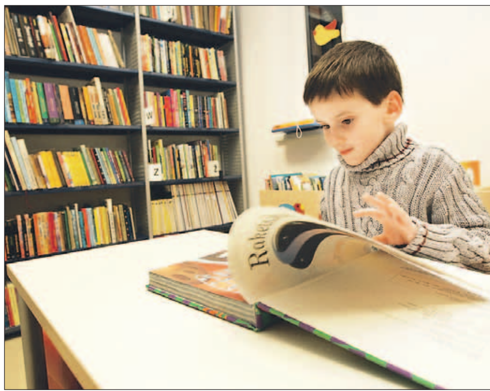
Otroci so se razveselili otroškega kotička.