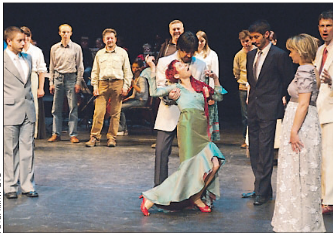
Občinstvo je največ točk podelilo opereti Planinska roža.