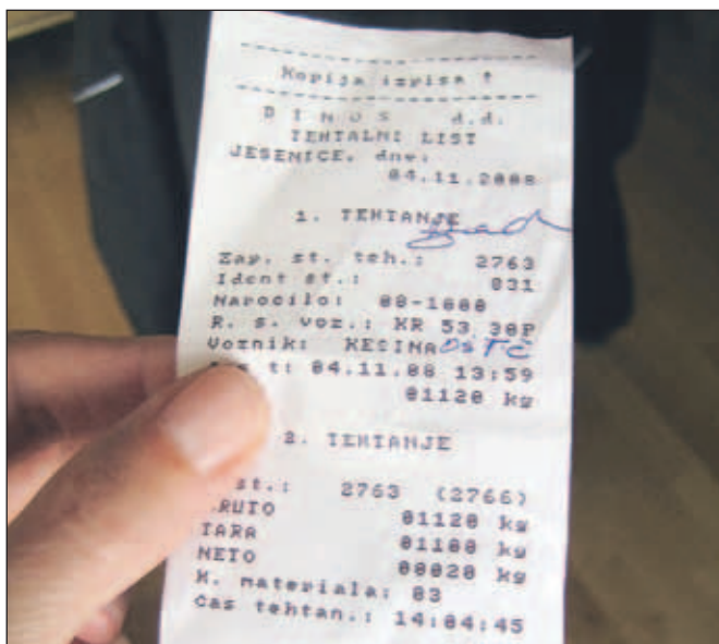
Listič, ki dokazuje sistem tehtanja 20 kilogramov težkega zavoja odpadnega papirja - najprej stehatajo prazen avto, nato polnega in iz tega izračunajo težo papirja ...

Hišne nabiralnike vsakodnevno polnijo kupi reklam in drugih obvestil, ki jih marsikdaj niti ne pogledamo, temveč jih enostavno vržemo v smeti. Bolj ekološko osveščeni jih odložijo v zabojnike za papir na ekoloških otokih, večina pa jih - ker jo najpreprosteje - še vedno odvrže kar v običajni zabojnik za smeti. Jeseničan Niko Kešina , ki stanuje v eni od stolpnice v Centru 2, je dalj časa opazoval kupe reklam, ki se nabirajo pri nabiralnikih. Ker mu je mar za okolje in rad pomaga tudi drugim, je prišel na idejo, da bi začel zbirati odpadni papir in ga nato enkrat mesečno odpeljal na Dinos. Zbrani denar pa bodo nakazali Osnovni šoli Toneta Čufarja. "Iz denarja, ki ga na ta način pridobijo, kupijo zvezke in šolski pribor tistim učencem, ki jim tega ne morejo kupiti starši. Nekatere učence celo pošljejo na počitnice," je povedal Niko Kešina. Da bi preskusil, kako poteka oddaja papirja na Dinosu, je pred dnevi tja poskusno odpeljal paket odpadnega papirja. Žal pa se je vrnil močno razočaran nad načinom,