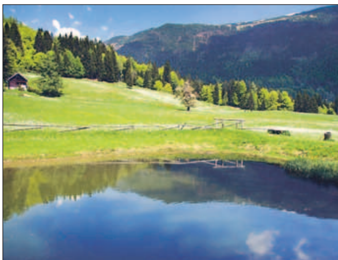
Zoisov park, avtor Saša Manojlovič, Ljubljana