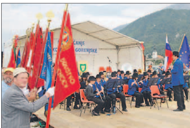
Goste so ob prihodu pozdravili zvoki Pihalnega orkestra Jesenice-Kranjska Gora.