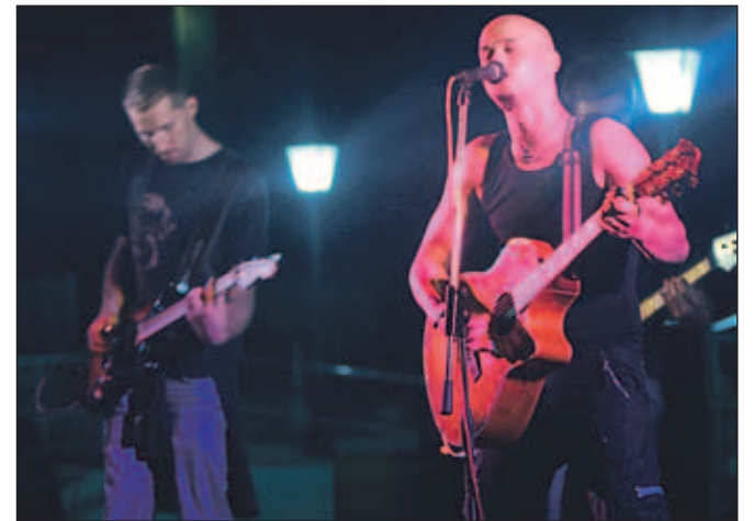
Za trše ritme so poskrbeli Maršali.