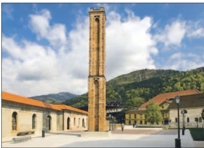
Nedelja na Jesenicah (Stara Sava), avtor Jure Kravanja, Celje