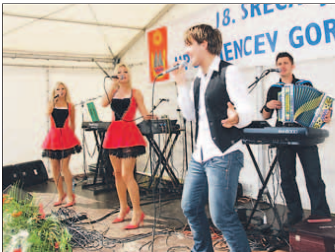
nato pa še mladi člani zasedbe Turbo angels, ki so prav tako navdušili...