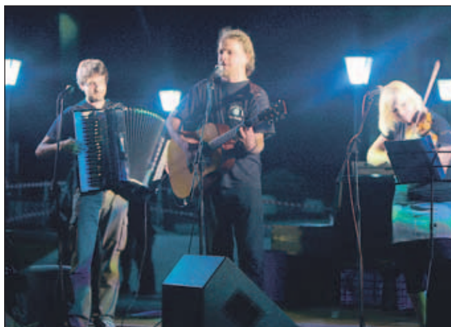
Beer Belly so navdušili z irsko, škotsko in keltsko glasbo.