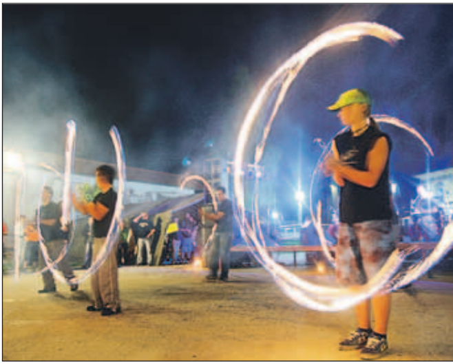
Glasbeno-artistična skupina Čupakabra je prikazala spretnosti žongliranja in ognjeni šov.