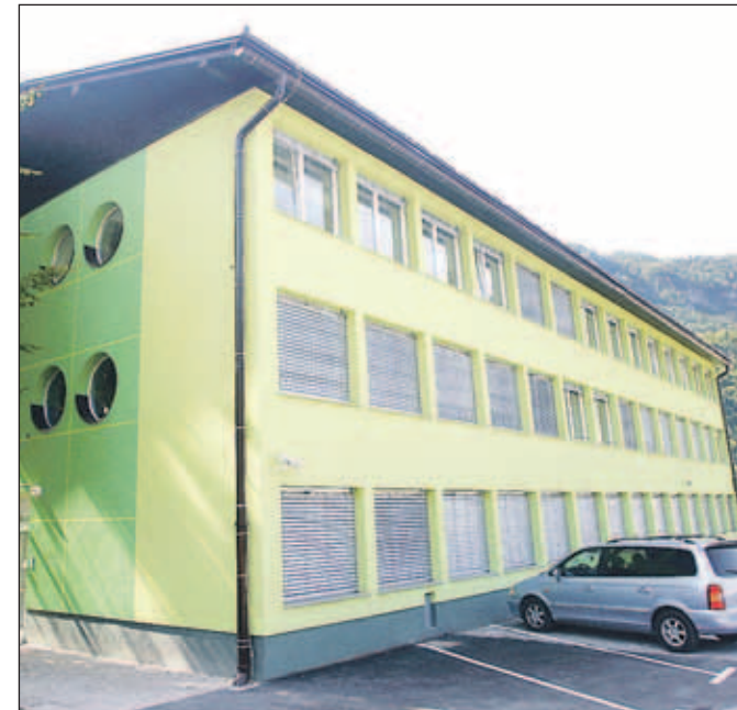
Novi prostori Visoke šole za zdravstveno nego Jesenice na Spodnjem Plavžu

davalnici, ki lahko sprejmeta po 80 študentov. V prvi etaži sta sodobna knjižnica in računalniška učilnica, v drugi etaži pa še ena manjša predavalnica za 60 študentov, dekanat in kabineti. V prihajočem študijskem letu bo v klopi sedlo 130 rednih in izrednih študentov prve generacije in 140 študentov druge generacije, skupaj torej okrog 270 študentov. Zanimanje za vpis v šolo je bilo veliko in po besedah dekanice so že na prvem vpisnem roku zabeležili izredno dober vpis. Hkrati s povečevanjem števila študentov na šoli širijo tudi programe, tako so v postopek akreditacije že oddali vlogo za magistrski študij zdravstvene nege. Računajo, da bodo prve študente v magistrski študij vpisali že prihodnje leto. To je tudi eden od pomembnih pogojev za preoblikovanje visoke šole v fakulteto, kar je dolgoročni cilj tako vodstva šole kot tudi ustanoviteljice, Občine Jesenice.