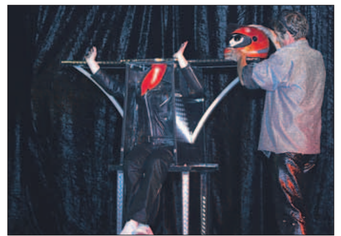
Magic Brane - Phenomena med čarovniško točko