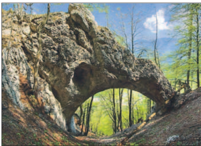
Naravni most na Mežakli, avtor Saša Manojlovič, Ljubljana