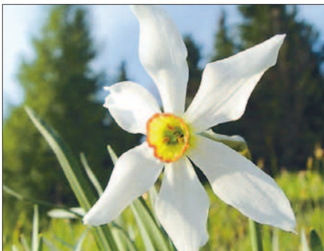
Ključavnica, avtor Ivan Šenveter, Jesenice