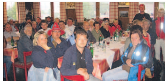
Udeleženci srečanja v Planini pod Golico