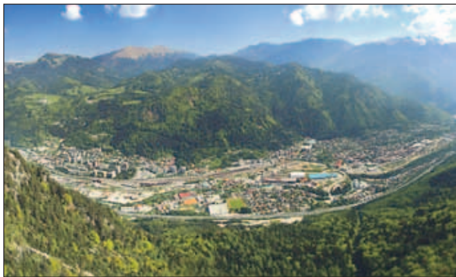
Panorama Jesenic, avtor Saša Manojlovič, Ljubljana

Na Razvojni agenciji Zgornje Gorenjske so izbrali osem fotografij z Javnega natečaja za izbor najlepših fotografij občine Jesenice in iz njih izdelali nove razglednice Jesenic. Dobiti jih je mogoče v Turistično-informacijskem centru na Jesenicah.