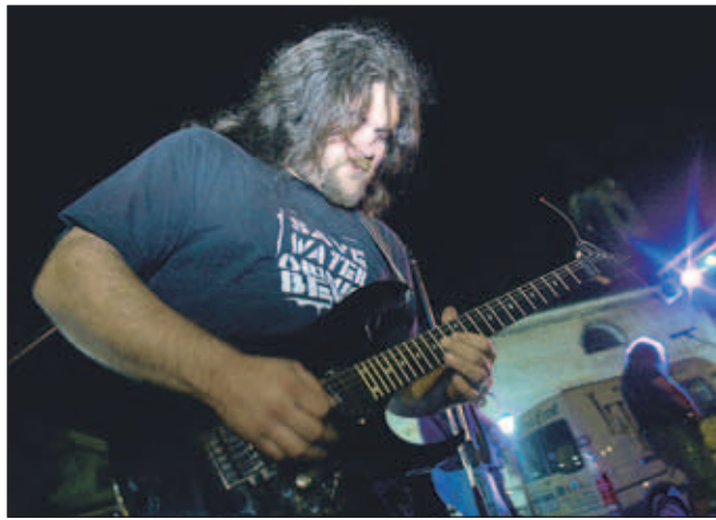
Kitarist hard rock skupine Lady's First

Prvi petek v septembru je bil na Trgu na Stari Savi pod okriljem občine Jesenice v sklopu projekta Sejem bil je živ potekal celovečerni koncert. Dogodek so organizirali jeseniški zavod za šport, Mladinski center Jesenice in Klub jeseniških študentov.