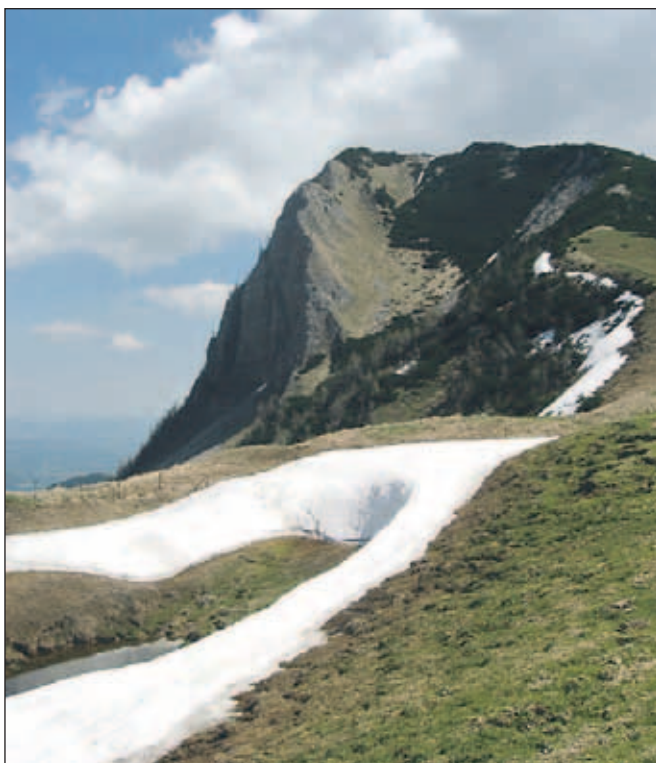
Klek, avtor Nejc Pogačnik, Jesenice