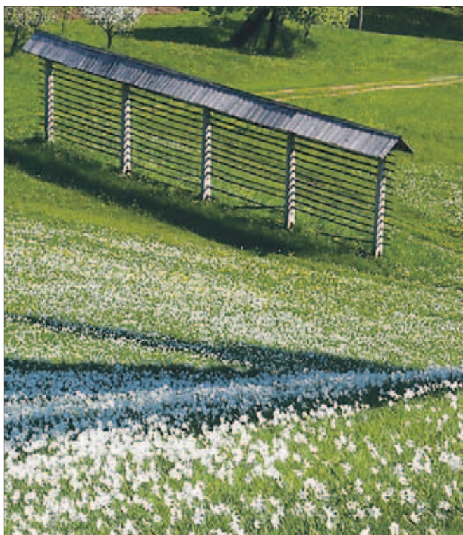
Kozolec, avtor Bogdan Bricelj, Mojstrana