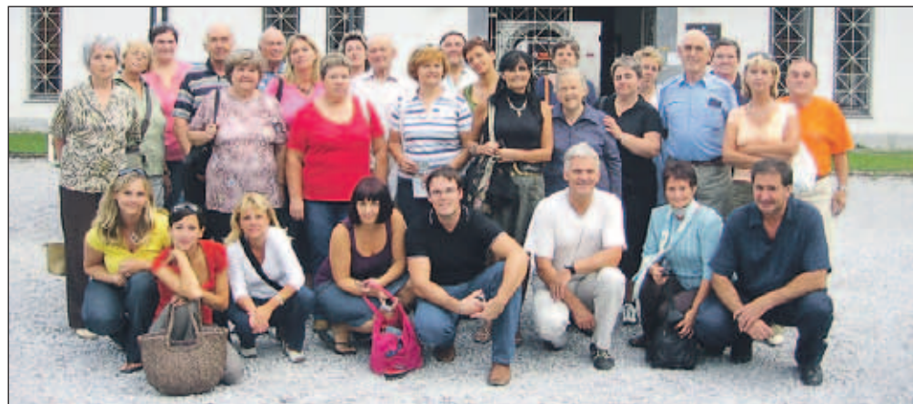
Udeleženci izleta na Vrhniko