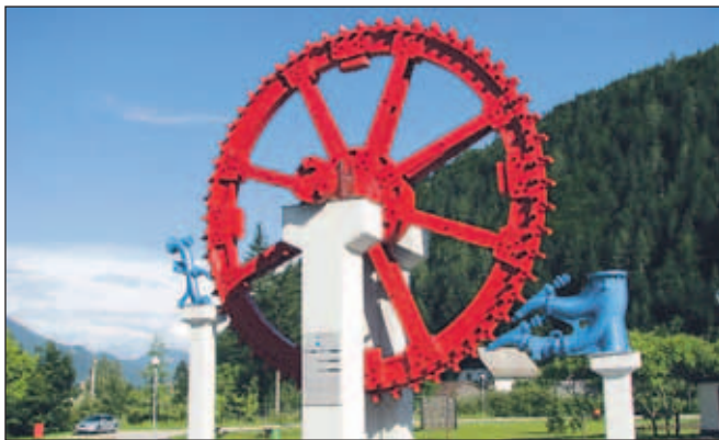
Turbina, avtor Barbara Klinar, Hrušica