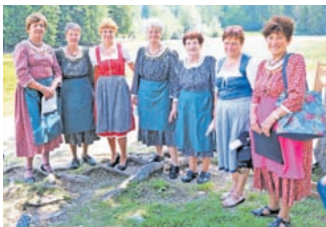
Ljudske pevke z Jezerskega

Povezovalni del programa so zaupali Maši Karničar in Maji Lesar, pred prigonom ovc pa so na odru, kjer so v popoldanskem delu glasbene vajeti prevzeli Veseli Begunčani, nastopile ljudske pevke domačega društva upokojencev ter simpatični narodno-zabavni trio Jutro. Našel pa se je celo kakšen pogumen par, ki se je še pred popoldnevom že zavrtel pred plesišču.