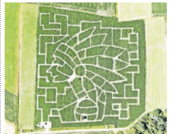
Koruzni labirint na Krtini ima motiv Indijanca.