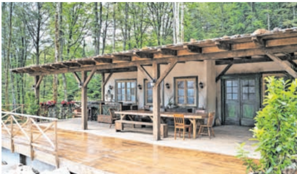
Letošnja kmetija naj bi stanovalcem nudila precej manj ugodja kot njene predhodnice.