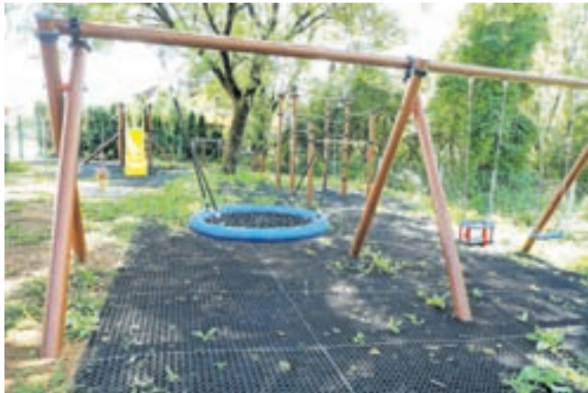
Nova otroška igrala na Prebačevem

kjer so bila doslej. Poleg tega so v Šenčurju nasprotni zbirnega centra namestili tudi pet naprav za fitnes na prostem. Kot je povedal šenčurski župan Ciril Kozjek, bodo tudi v prihodnje z nakupom igral in fitnes naprav skrbeli za dobro fizično pripravljenost občanov, otrokom pa zagotovili varno mesto za preživljanje prostega časa.