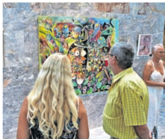
Razstava bo v Sokolskem domu v Škofji Loki na ogled do konca letošnjega avgusta.

Razstava bo na ogled do 31. avgusta 2022.