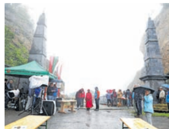
Najstarejši cestni prelaz v Evropi krasita dva kamnita obeliska v čast cesarju Karlu VI., stara skoraj tristo let. Kamen so pripeljali iz Ljubljane na dvajsetih vozovih, za kar so potrebovali 187 vlečnih konj.