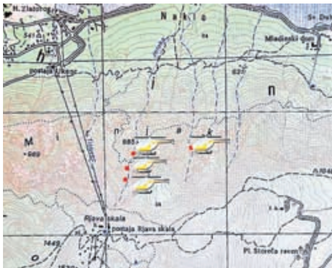
Zemljevid s točkami reševanja na območju Vogla

Na planinskih kartah so markirane poti običajno rdeče obarvane. Polna črta so lahke poti, prekinjena rdeča