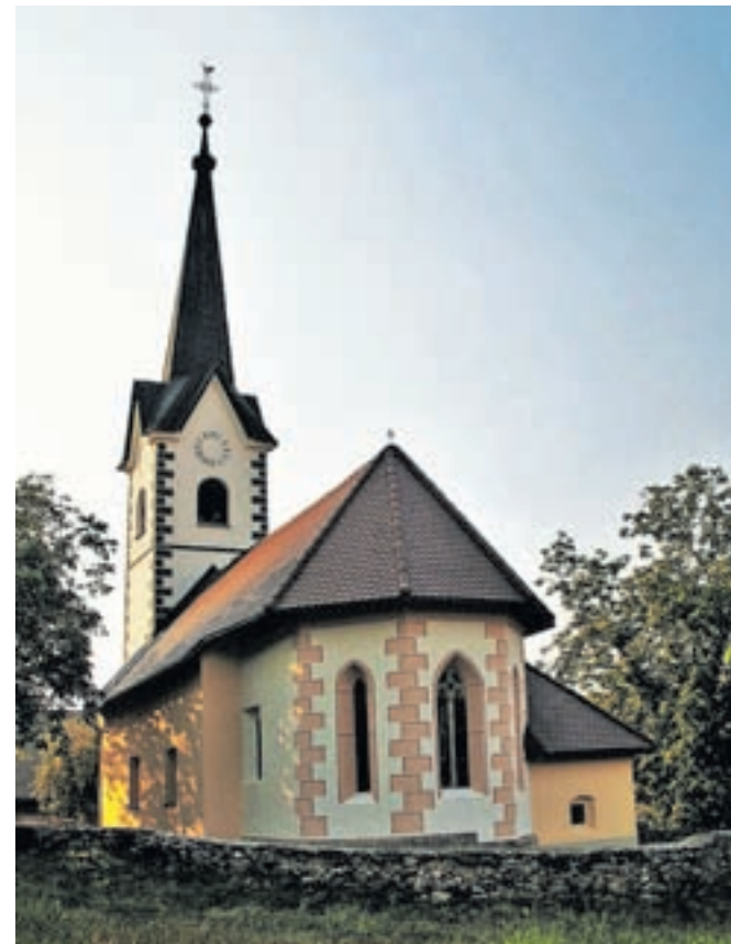
Cerkev na Okroglem je po obnovi zasijala v vsej svoji lepoti.