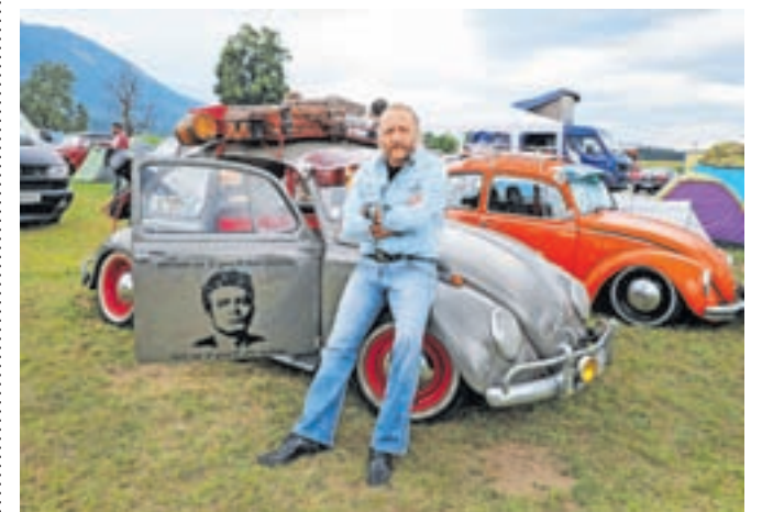
Na leškem letališču so se srečali ljubitelji Volkswagenovih zračno hlajenih vozil.