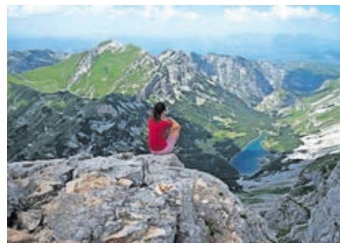
Razgled z Bobotovega kuka proti dolini Škrke in Velikemu Škrčkemu jezeru

Naslednje jutro vstaneva zgodaj, v nahrbtnike natakčiva malico ter se odpraviva proti najvišjemu črnogorskemu vršacu. Bobotov kuk je 2523 metrov visok vrh, ki skupaj z Bezime-nim vrhom in Djevojkjo tvori veliko gorsko steno, nekakšen naravni amfiteater, ki objema dolino Škrke, v kateri se zrcalita Veliko in Malo