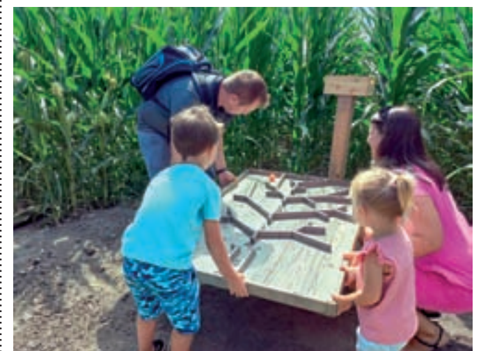
Labirint je primeren predvsem za družine in skupine, željne zabave.

Avgusta je labirint odprt vsak dan med 9. in 20. uro, vsak petek pa vabijo tudi v nočni labirint med 21. uro in polnočjo. Odprt bo vse do 31. oktobra.