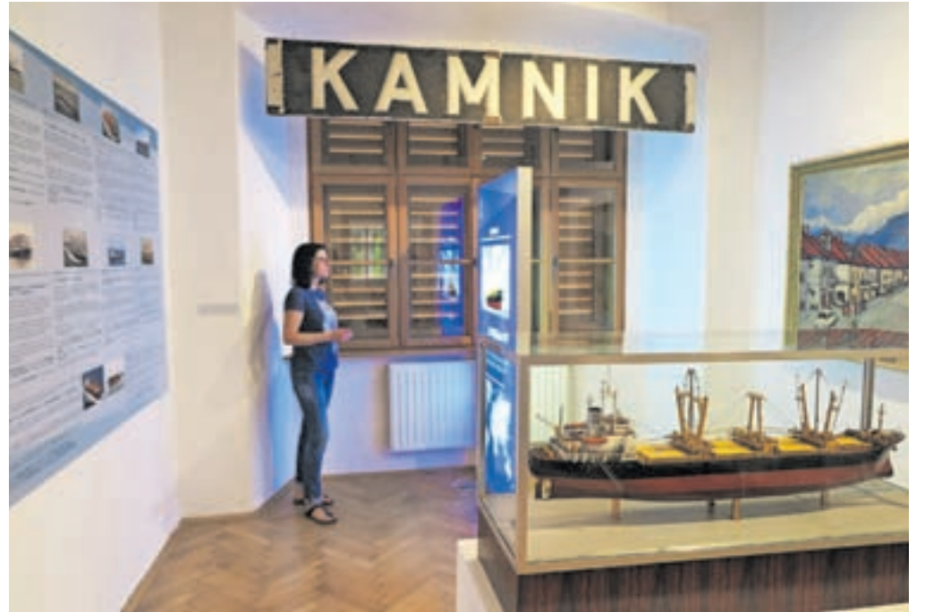
Na razstavi ima posebno mesto ladja Kamnik.

Kot izvemo na razstavi, je bila ladja Kamnik večnamenska ladja, ki je lahko prevažala razsute in generalne tovore ter največ 232 kontejnerjev. Zaposlena je