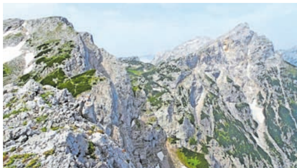
Ojstrica z Moličke peči, levo pa naslednji cilj – Velika Zelenica