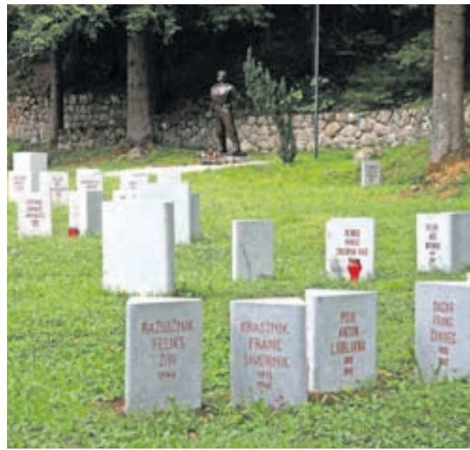
Grobišče v Dragi so začeli obnavljati že lani.

nagrobne prizme še pravilno usmerjene. Dela bodo opravljena po načrtu projektnega podjetja Ambient, ki skrbi za zapuščeno arhitekta Edvarda Ravnikarja, ki je zasnoval grobišče. Financirali jih bosta Občina Radovljica in država. V času del bo obisk grobišča otežen.