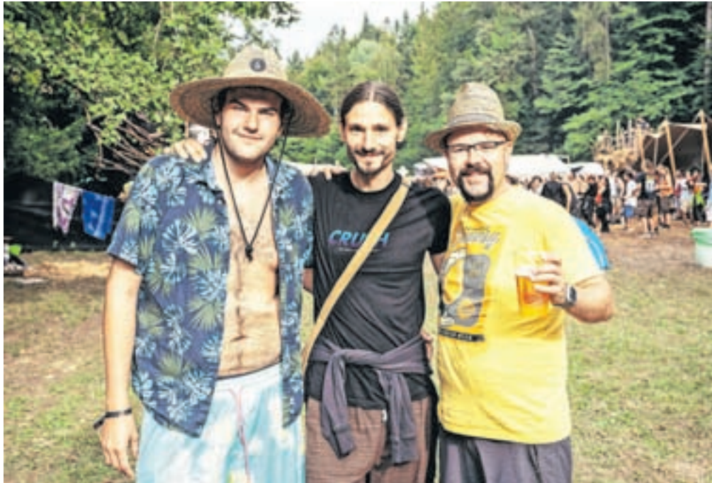
Organizatorji letos pričakujejo okrog osemsto obiskovalcev, velik del predstavljajo tudi mladi iz tujine.

Obenem domnevajo, da organizator za izvedbo prireditve ni pridobil vseh potrebnih dovoljenj in soglasij, udeleženci pa naj bi na območju kampilali na črno, ob tem pa kljub razglašeni veliki požarni ogroženosti