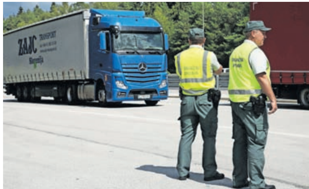
V nadzoru so poleg policistov sodelovali še Inšpektorat RS za delo in za infrastrukturo, Finančna uprava RS, cestninski nadzor DARS in izvajalec tehtanja.

Upravičenost tovrstnih nadzorov potrjujejo tudi statistični podatki. Do 31. julija 2022 so bili vozniki tovornih vozil po podatkih policije udeleženi v 1.562 prometnih nesrečah. Povzročili so jih 895 oziroma 57 odstotkov vseh nesreč, v katerih so bili udeleženi. Zaradi posledic teh nesreč je življenje izgubilo pet oseb, od tega štirje vozniki tovornih vozil, 19 oseb je bilo hudo poškodovanih, 176 oseb pa lažje poškodovanih. Vozniki tovornih vozil so 24 prometnih nesreč povzročili pod vplivom alkohola, od