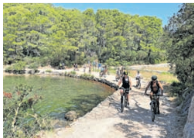
Kolesarjenje po Narodnem parku Mljet

2001. Dogodek je zares ori- ginalen. Karnevalsko sil- vestrovanje so spremljali glasbeni nastopi, ulice so se spremenile v plesišče ... To staro mesto, obdano z ob- zidjem s stolpi, smo si ogle- dali tudi iz zvonika katedra- le sv. Marka. Po odštevanju do polovice leta je ob polno- či sledil velik ognjemet. Po- časi smo se vrnili na barko.