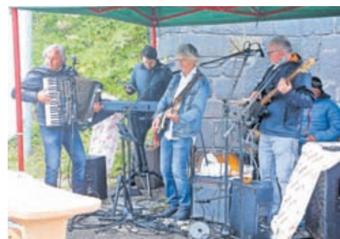
Za glasbeno popestritev EU plesa brez meja je letos poskrbel Trio Drava.

jabolčnem zavitku ... A so za hrano in pijačo, značilni tako za južno kot severno stran Karavank, na ta dan poskrbeli še drugi okoliški gostinci.