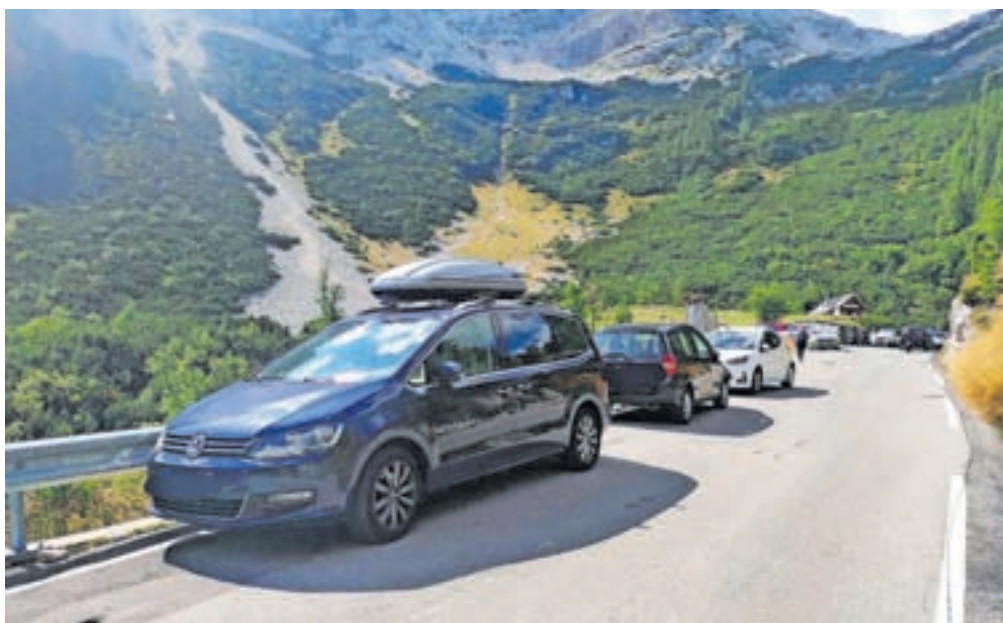
▶ 16. stran Vozila so bila parkirana kar ob cesti, policisti voznike pozivajo k odgovornosti.

Kranjska Gora – Zaradi prometnega kaosa na Vršiču so morali v nedeljo posredovati policisti, stanje pa se je po intenzivnih večurnih aktivnostih policistov normaliziralo, so sporočili s Policijske uprave Kranj. Težava so povzročala vozila, parkirana na eni in obeh straneh ceste, pa tudi velika gneča na gorskem prelazu. »Na cesti mora biti vedno dovolj prostora, da promet poteka normalno, in predvsem dovolj prostora za interventna vozila. Tega danes ni bilo.«