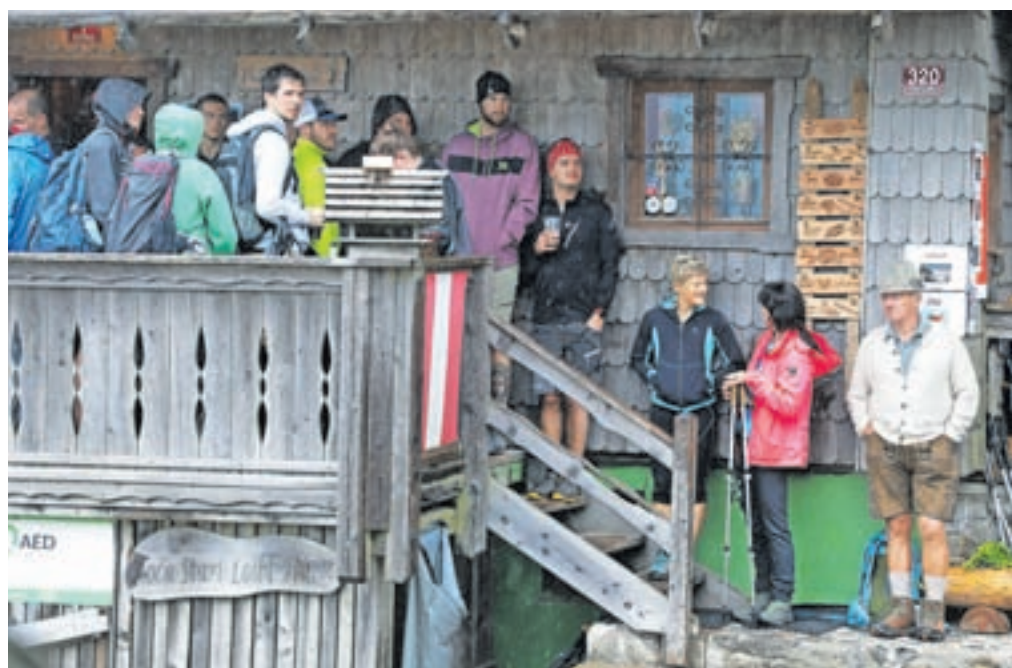
Kočja na Ljubelju, mesto srečevanj, pa naj bo v lepem ali slabem vremenu