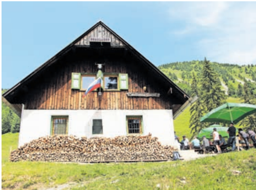
Pastirski stan bo v nekaj letih dobil novo podobo.

nekdaj so skoraj pri vsaki hiši imeli živali – če že ne goved pa vsaj drobnico, zajce in kokoši, zdaj bi lahko na prste ene roke prešteli vse, ki še imajo rejne živali. Poleg živine s Hrušice se na planini pase tudi nekaj živine iz Plavškega Rovta.