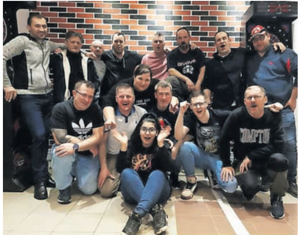
Pikado klub Devil na Jesenicah je edini na Gorenjskem.

V primerjavi z drugimi evropskimi državami, kot so Italija, Madžarska, Avstrija in Nizozemska, je Slovenija tako po številu profesionalnih igralcev, organiziranosti klubov in njihovem številu, delu z mladimi kot tudi po organizaciji turnirjev na svetovnem nivoju krepko v zaostanku. Sosednja Madžarska je na primer v letošnjem letu organizirala kar šest turnirjev svetovne serije WDF v klasičnem pikadu, medtem ko so turnirji pri nas v veliki meri organizirani le na nacionalnem nivoju. V Sloveniji je registriranih le osem klubov, ki soustvarjajo Zvezo pikado društev Slovenije z namenom, da bi v novooklicani šport pritegnili mlade in povzdignili njegov