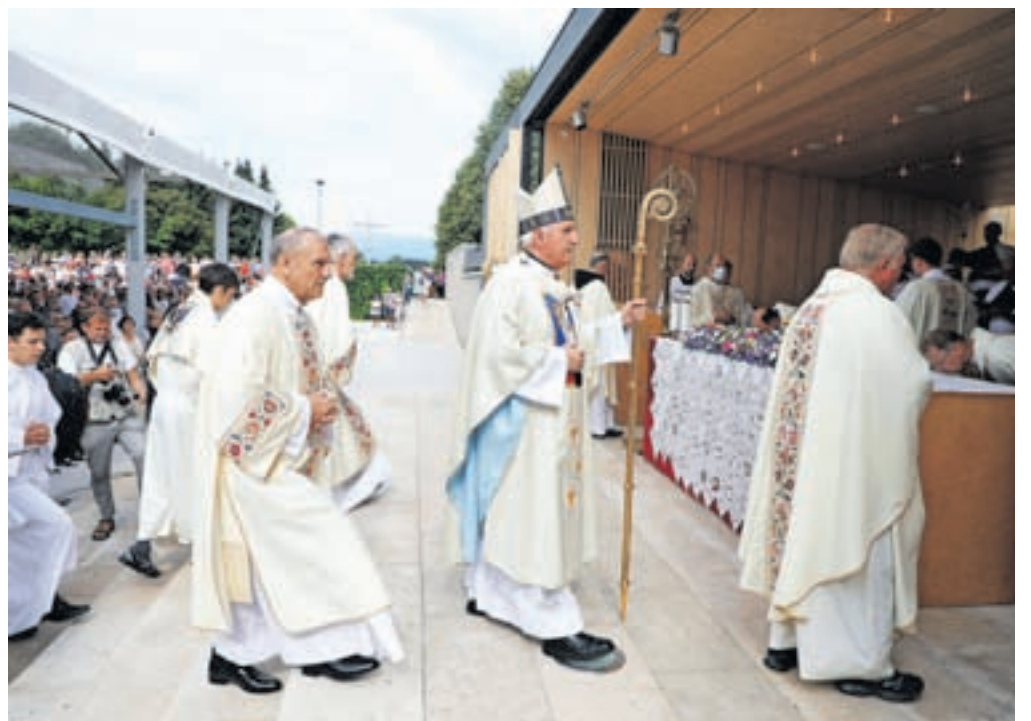
Blizu štiri tisoč romarjev se je udeležilo včerajšnje dopoldanske slovesne maše, ki jo je daroval ljubljanski nadškof metropolit msgr. Stanislav Zore.

Včeraj popoldne je bilo slovesno tudi v Lescah, ko je v čast 900. obletnice prve omembe cerkve maševal kardinal dr. Franc Rode.