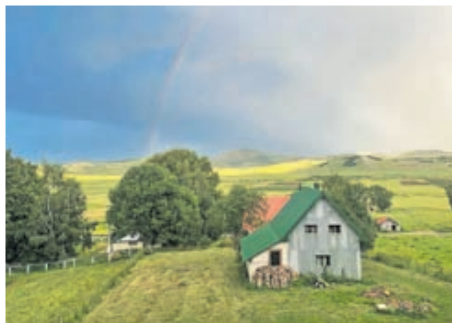
Razgled iz apartmaja v vasici Javorje, nedaleč od Žabljaka