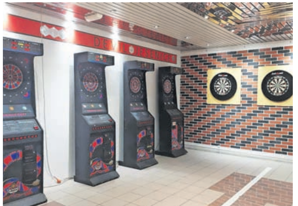
Prostori, v katerih člani jeseniškega društva vadijo in izpopolnjujejo tehniko meta.

ugled na nivo, ki ga ta uživa v Veliki Britaniji ali na Nizozemskem.