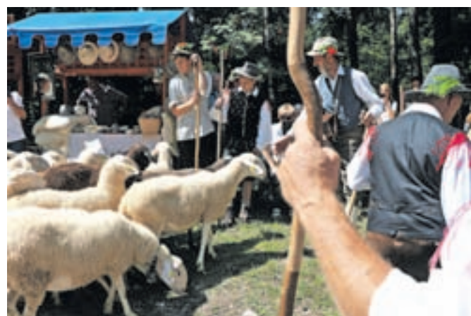
Prigon ovc v dolino