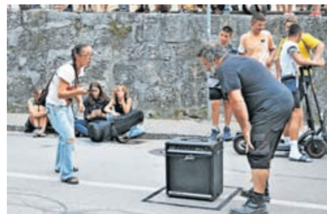
Kresničke – ženski del v »elementu« spodbujanja moškega tik pred startom

Na teku sta sodelovala tudi stara mačka Kamfesta, ekipa Kresničke. Njun trenutek je bil v stilu »žena 'dirigira' oziroma spodbuja, mož teče«. Dosegla sta sicer najslabši rezultat, a tek je z njima pridobil dodano vrednost, saj sta gledalce s svojim nastopom spravila v smeh.