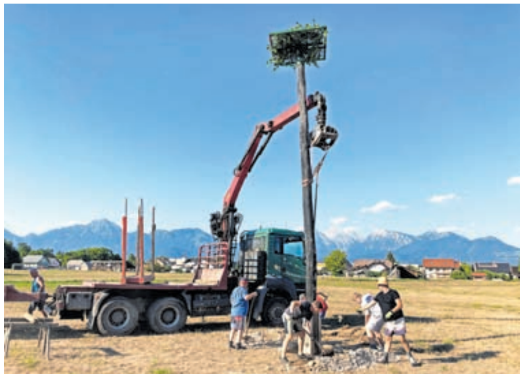
Na Bregu ob Savi so postavili drog z gnezdom za štorcklje.