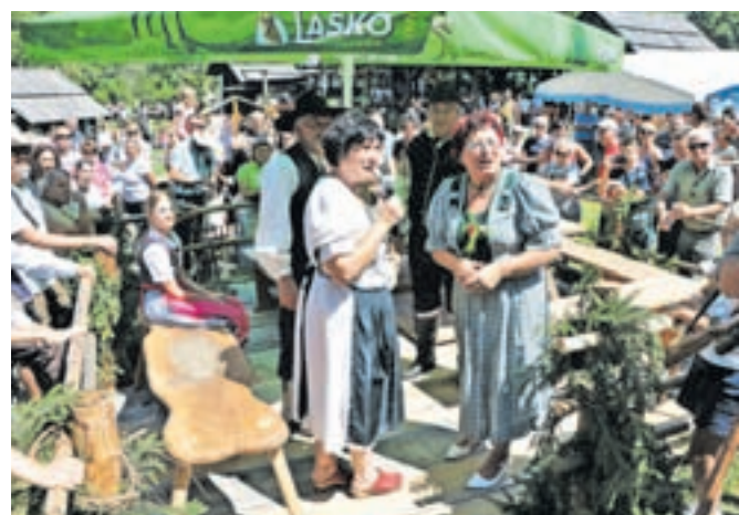
Začetek etnološke igre, ki že vrsto let spremlja Ovčarski bal. Skoznjio obiskovalci spoznajo stare običaje iz življenja na planini in prve dneve pastirjev po prihodu s planine.