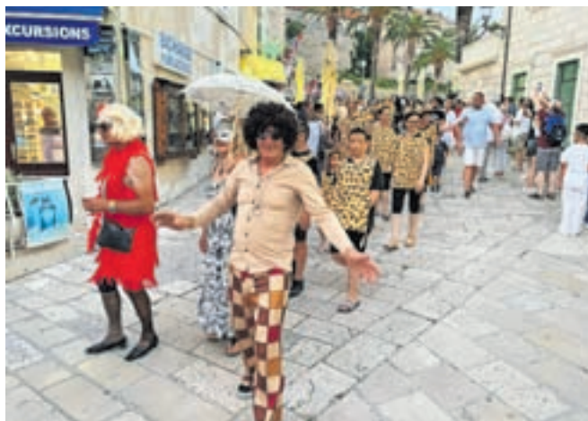
V mestu Korčula 30. junija praznujejo polovico novega leta. Ob tem poteka tudi karneval.

Zjutraj je bilo namreč zno- va treba na kolo.