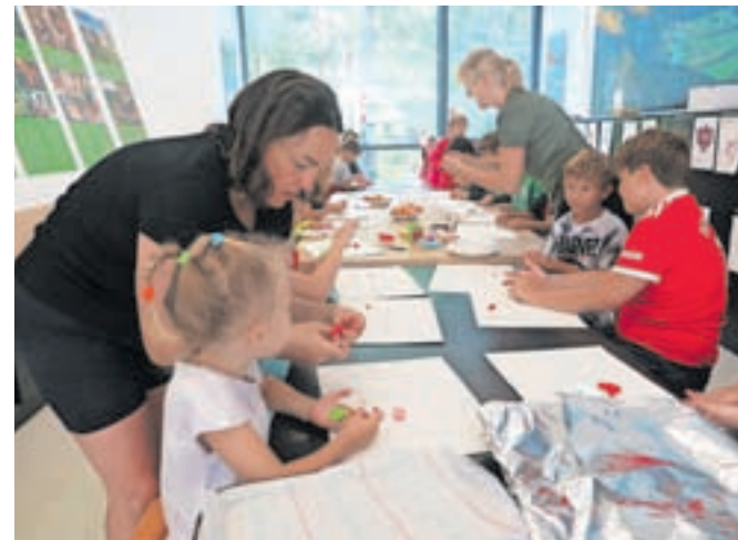
Planinske ustvarjalnice v Slovenskem planinskem muzeju v Mojstrani so bile dobro obiskane.

Vrv je zelo pomemben pripomoček pri plezanju, lahko pa je tudi pripomoček za ustvarjalne ideje in kratkočasenje. Iz različnih vrvic in vzlov so udeleženci delavnic naredili unikaten nakit. Skupaj z markacisti so se naslednji dopoldan urili v prostoročnem risanju, si naredili svoje markacijske