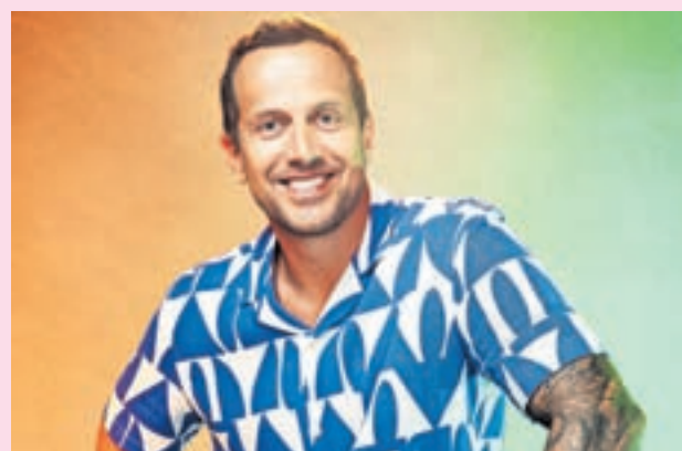
Jure Košir