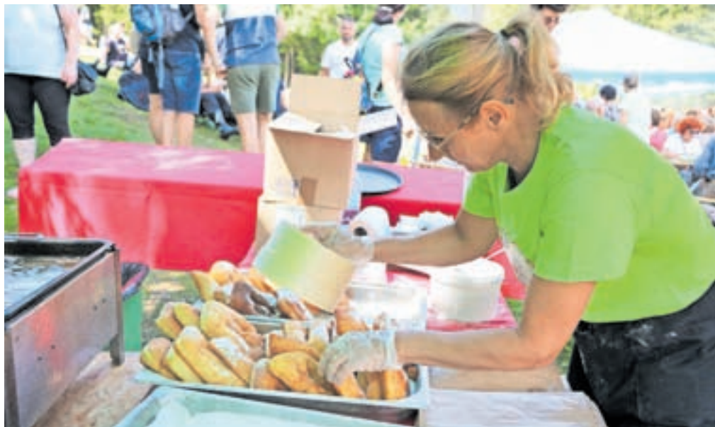
Povpraševanje po sveže ocvrtih flancatih je bilo neizmerno.

Tradicionalno naj bi Ovčarski bal sicer potekal vsako leto drugo nedeljo v avgustu, vendar je v preteklosti organizatorjem načrte prekrizal covid-19 in je prireditev odpadla. Tradicionalno – tako kot vsa leta poprej – pa so tudi tokrat obiskovalci lahko spremljali stare običaje življenja na