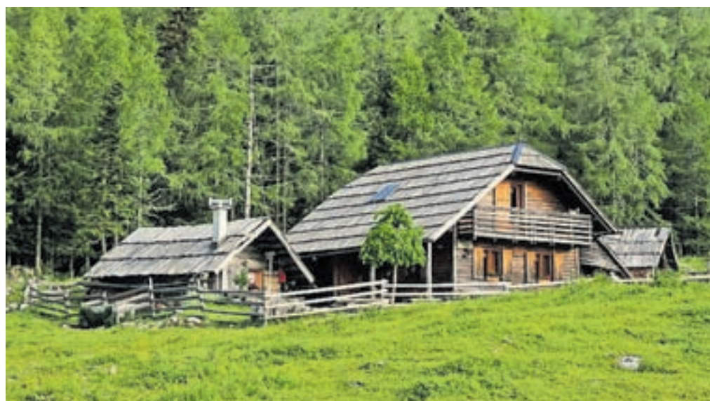
Planina Ravne

Nadmorska višina: največ 2114 m Višinska razlika: 1050 m Trajanje: 8 ur Zahtevnost: ★ ★ ★ ★