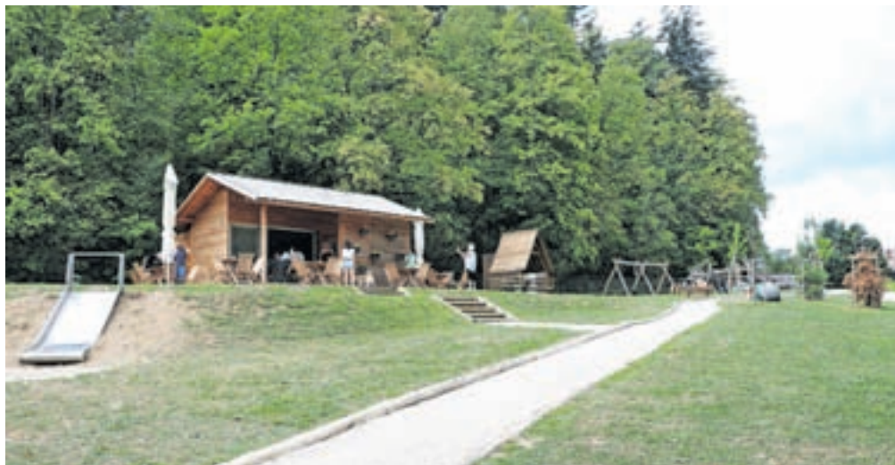
Park Bor v Preddvoru ob jezeru Črnava je izjemno obiskana turistična točka.

Jutri, v sredo, 17. avgusta, pa pripravljajo uradno odprtje parka, ki je že od