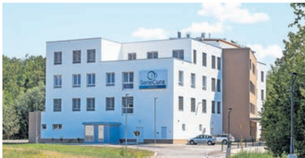
Dom starostnikov že ima uporabno dovoljenje, na odprtje pa še čaka.

Kljub razpisom, pomoči lokalne skupnosti, zavoda za zaposlovanje in izobraževalnih ustanov, so na razpisana delovna mesta prejeli