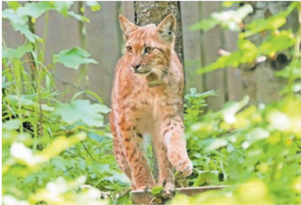
Rise, naseljene v Slovenijo, spremljajo s pomočjo ovratnic in avtomatskih kamer.

Kot je pojasnil, bodo iz posnetkov avtomatskih kamer lahko razbrali, kateri ris še ostaja na svojem teritoriju, hkrati pa bodo s pomočjo posnetkov lahko tudi izbrali primerno lokacijo za ponovni odlov. Vsem trem risom namreč želijo nedelujoče ovratnice zamenjati z delujočimi, kar bo omogočilo, da jih natančno spremljajo tudi v prihodnje.