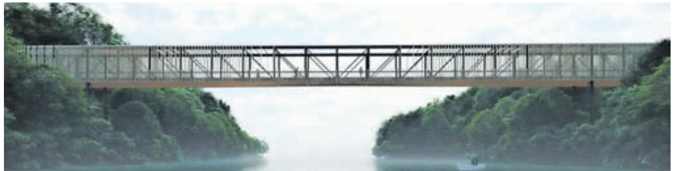
Takšen naj bi bil novi most med Jamo in Prebačevim.

projektiranje novega dvo-smernege mostu za motoriziran promet s kolesarskimi pasovi čez reko Savo, ki bo nadomestil neustreznosti most pri Planiki. V bliž-