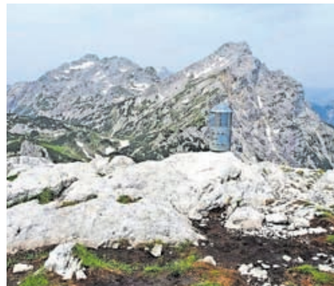
Mali »Aljažek« na Velikem vrhu

Z vrha sestopimo do sed- la z Veliko Zelenico in po