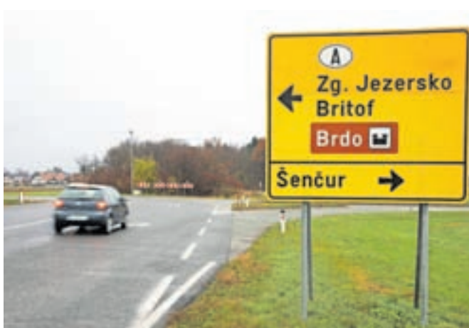
Pogodbo za gradnjo državne ceste Hotemaže–Britof naj bi podpisali še v tem mesecu.

Občina Šenčur je sredi junija prejela v podpis pogodbo med naročnikom Ministrstvom za infrastrukturo, sofinancerjema Mestno občino Kranj in Občino Šenčur ter izbranim izvajalcem