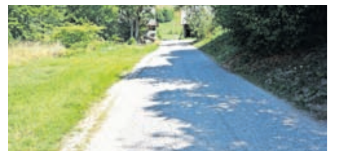
Začenja se obnova ceste na Golem Brdu med hišnimi številkami 10 in 14.

tudi asfaltna mulda in vgrajeni vtočni jaški za odvajanje meteorne vode. Pogodbena vrednost del znaša dobrih 104 tisoč evrov. »Z obnovo ceste se bo izboljšala prometna varnost na tem odseku, voznja pa bo tudi prijetnejša za vse udeležence v prometu,« so dodali na Občini Medvode. Dela bodo zaključena predvidoma do konca oktobra. Sledila bo še obnova ceste od hišne številke Golo Brdo 10 do križišča pri znamenju. V času del bo vzpostavljena delna zapora ceste, zato vse udeležence v prometu prosijo za upoštevanje prometne signalizacije in navodil izvajalca.