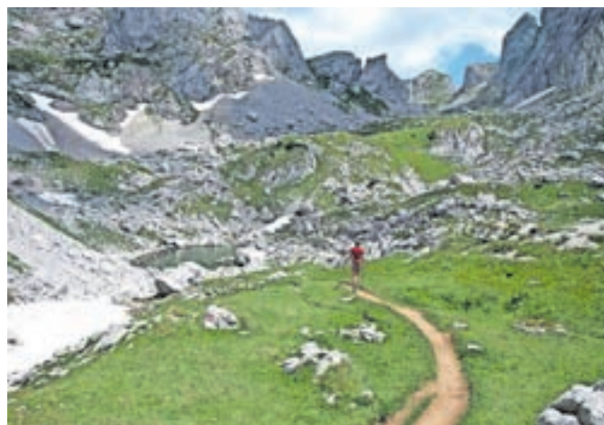
Pot, ki vodi na Bobotov kuk – čez številne alpske travnike in doline, tik pod vznožje skalnatih vrhov.

turistična past, ampak prijetno mestece, ki odraža prijaznost in gostoljubje črnogorskega naroda. Dobre tri kilometre iz mesta leži na višini 1400 metrov čudovito Črno jezero, ki na jezerski gladini odseva vrhove smrekovega gozda in skalnate masive nad njim. Okoli jezera je urejena 3,5 kilometra dolga sprehajalna pot, obsežna jezerska obala pa nudi številne samotne koticke za poležavanje, branje, plavanje in veslanje. Tudi midva sva se zleknila v gosto senco smrekovega gozda in preživela popoldan ob jezeru ter tkala načrte za prihodnje dni. (Se nadaljuje)