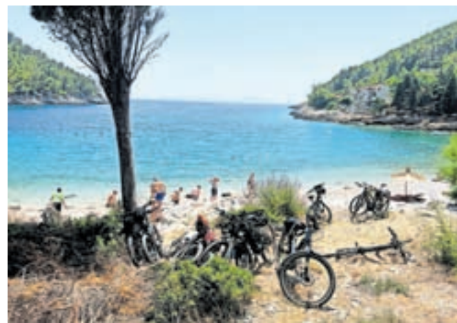
Postanek za kopanje v Pupnatski Luki, eni najlepših plaž na otoku Korčula.

se pozno popoldan z bar- ko vrnili v Lumbardo, kjer smo spali drugo noč zapo- red. Naslednji dan je bila na vrsti tretja etapa – prva izmed dveh po otoku Kor- čula, in sicer po trasi Lu- mbarda–Pupnatska Luka– Brna (53 km, okrog tisoč vi- šinskih metrov). Za kopa- nje smo se ustavili v zalivu