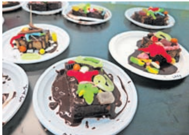
Unikatne okusne plezalne tortice