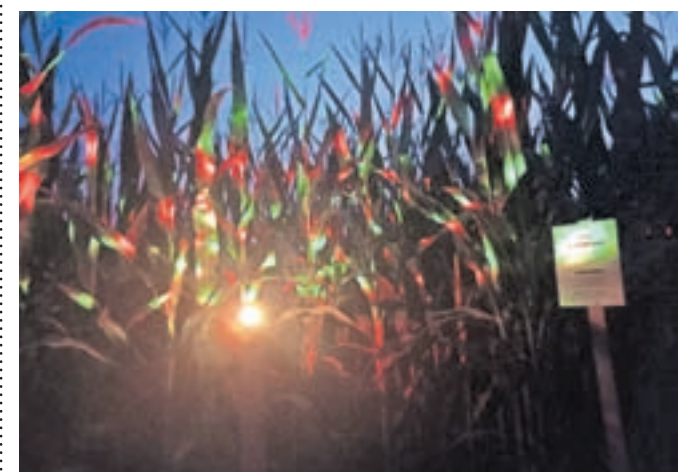
Posebno doživetje je obisk labirinta v nočnih urah.