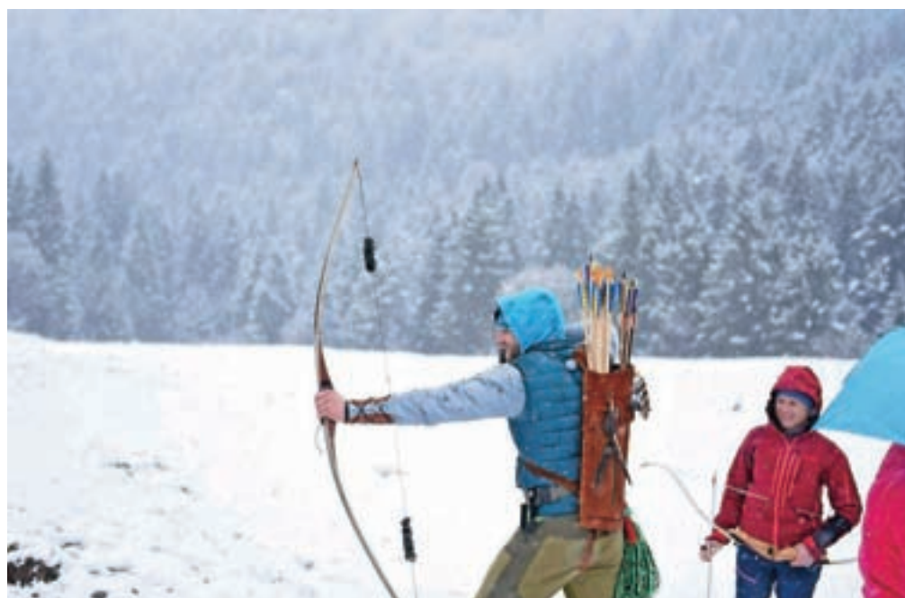
Razmere so bile v soboto tudi v Dragi povsem zimske.

petdeset prijavljenih tekmovalcev opravilo v od šestih do sedmih urah. Tekmovalci so bili razdeljeni v več kategorij, tako po starosti kot glede na vrste loka, ki so lahko