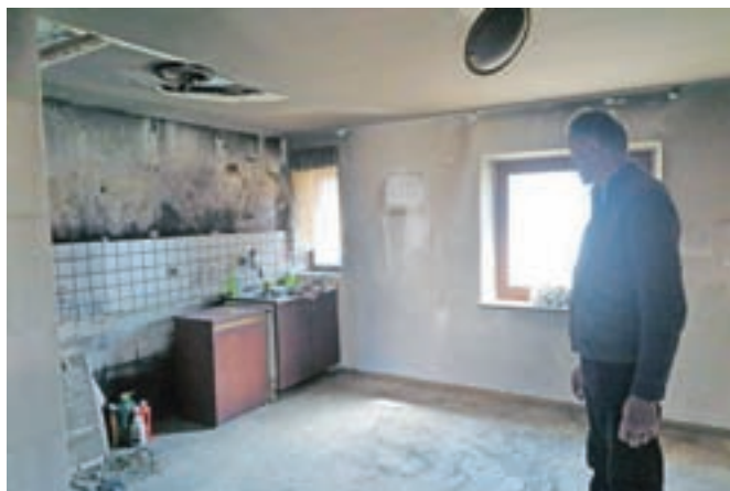
Hiša po požaru ni več primerna za bivanje.