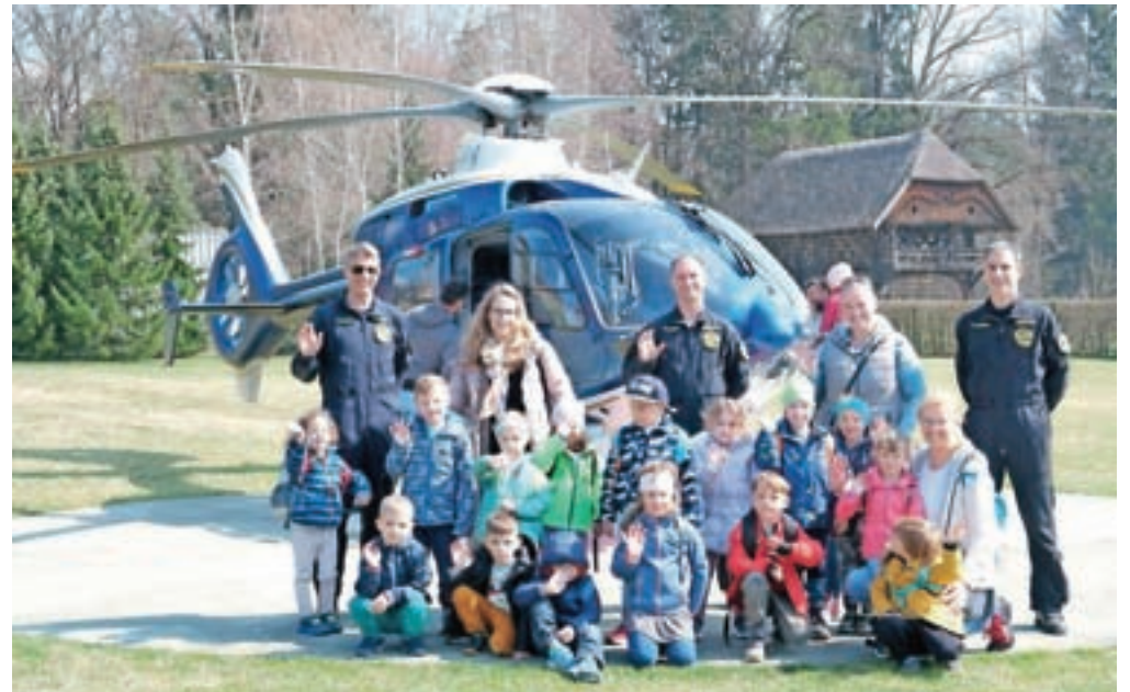
Otroci so si ogledali policijski helikopter.

Otroci iz vrtca pri Osnovni šoli Janeza Puharja Kranj – Center so občudovali helikopter. »Videli so tudi orožje, kar je zanje nevsakdanja izkušnja,« je dejala njihova