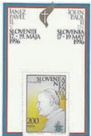
Znamka, ki jo je oblikoval Tone Seifert ob prvem papeževem obisku Slovenije (1996)

Priimek je nastal iz svetniškega imena sv. Sigfrid. To je bil angleški škof, apostol Škotske, Danske in Švedske, ki je umrl leta 1045. V latinščini svetnika imenujejo Sigefridus