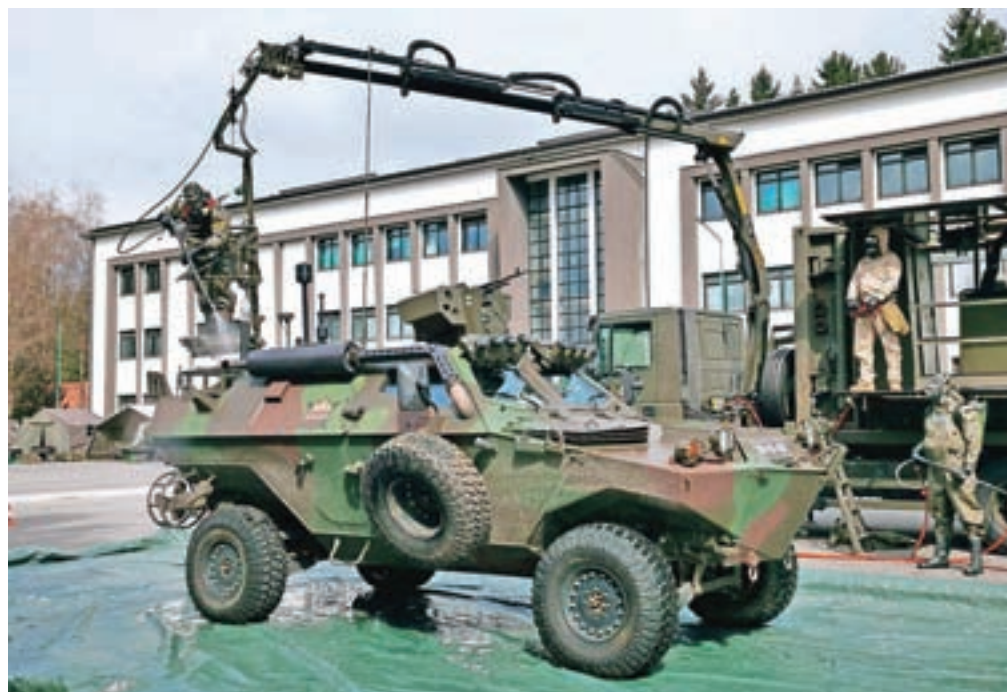
Dekontaminacija izvidniškega vozila Kobra

Bled – Muzejsko društvo Bled in Zavod za kulturo Bled organizirata do 24. maja sklop predavanj o zgodovini grofov Celjskih. O njihovi in blejski zgodovini bo predaval Miloš Klemen Mahorčič. Brezplačna predavanja bodo vsak torek v Festivalni dvorani z začetkom ob 19. uri.