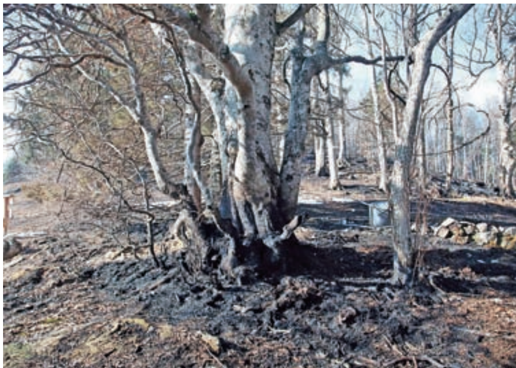
Ožgano gozdno drevje

la od 4,1 do 8,6 stopinje Celzija, količina padavin pa bi se poleti zmanjšala od 26 do 44 odstotkov. Pri gašenju požara se je tudi pokazalo, kako pomembne so gozdne ceste, ki na nedostopnih terenih omogočajo hiter dostop. »V prihodnje bo pri presojanju upravičenosti