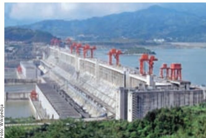
Komunistična Kitajska: njeno veličino simbolizira Jez Treh sotesk na reki Jangce, največji hidroelektrični jez na svetu.