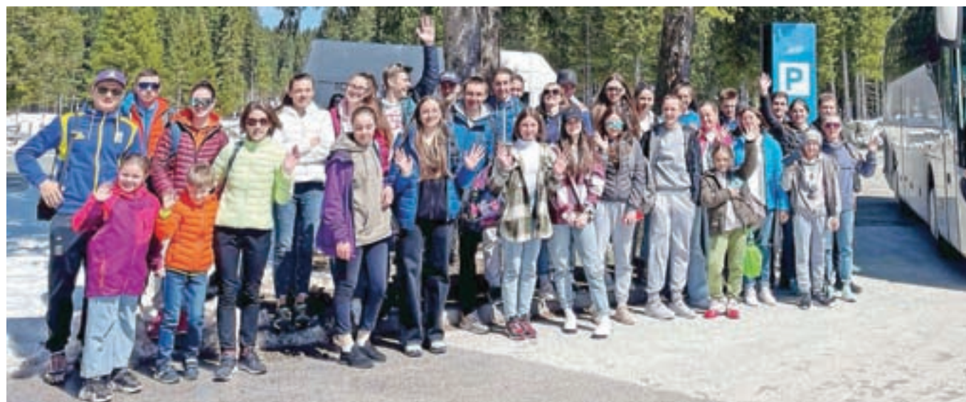
Mlade ukrajinske biatlonce so včeraj odpeljali na ogled Ljubljane.

na Pokljuko prišli štirje mladi ukrajinski biatlonci, ki se z mladinskih olimpijskih iger na Finskem niso mogli vrniti v domovino. Sledili so še drugi. »So v procesu treninga, skušamo pa jim zagotoviti tudi druge stvari, od ustreznih dovoljenj, ki jih morajo imeti za bivanje, do sredstev, ki jih bo dala država, poleg tega jih skušamo socialno vpeljati v dogajanje v Sloveniji. Jutri jih peljemo na izlet v Ljubljano, v petek na kopanje na Bled,« je v sredo povedal Farčnik in dodal, da si prizadevajo, da bi se lahko vključili tudi v izobraževalni proces. »Pogovarjamo se z Osnovno šolo Gorje, navezali bomo stike z Občino Bohinj, začeli smo se pogovarjati z Gimnazijo Franceta Prešerna v Kranju, kako bi vključili srednješolce. Večina je srednješolcev, okrog dve tretjini, nekaj