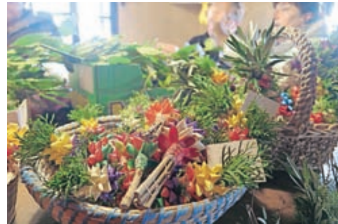
Palovške butarice so sestavljene iz zelenja in obarvanih smrekovih oblancev.

Na Slovenskem ni kraja, kjer na cvetno nedeljo ne bi nosili k blagoslovu šopov in snopov pomladanskega zelenja v spomin na palmovce, ki so jih v Jeruzalemu lomili in polagali pred prihajajočim Kristusom na oslu. Tudi na Kamniškem se običaji, ki so v zvezi s tem ohranjeni na različnih krajih občine, med seboj razlikujejo. Najbolj znane so palovške in šmarske butarice. In kako izdelamo palovško? »Delo pri izdelavi butaric ima tri zaporedne postopke. Prvi in poglavitni je priskrba zelenja in palic. Sledi priprava oblancev iz smrekovega lesa, to je oblanje, barvanje in striženje, na koncu je še vezenje. Za izdelavo potrebujemo leskove palice, bršljan, cipreso, brinje in reso. Posebno zahtevna naloga je priprava oblancev. Za oblance izberemo izredno gladko smrekovo desko brez grč z zelo gostimi letnicami, primerno suho in debeline 2,5 cm. Z zelo ostrim obličjem naoblamo tanke oblance, le pravilno nastruženi oblanci se pri