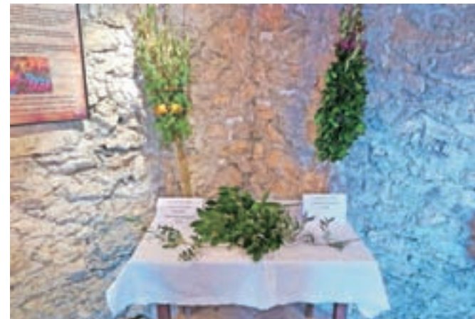
Na razstavi je bila na ogled tudi blejska beganca (levo).