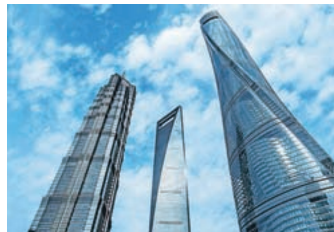
Moderna Kitajska: poslovni nebotičniki v Šanghaju, finančni prestolnici države in enem največjih kitajskih vele mest