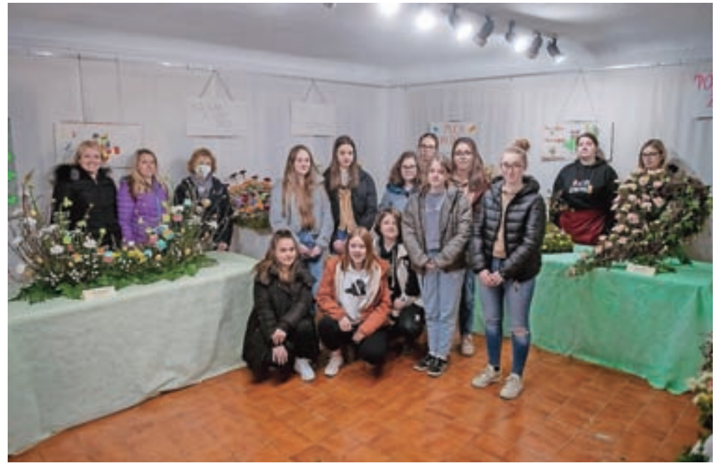
Razstava je na ogled na spletu ali v živo do vključno velikonočnega ponedeljka. Na sliki dijakinje in mentorice pri postavitvi razstave.