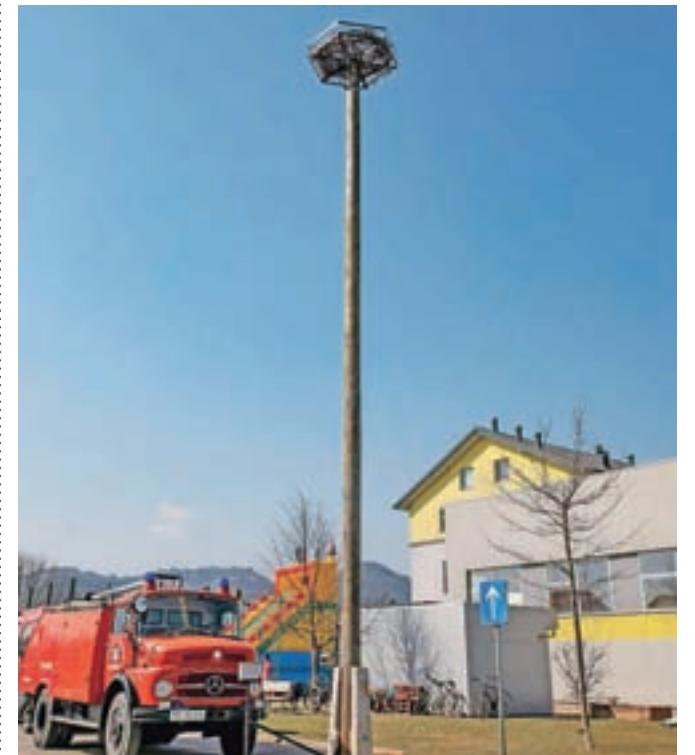
Novo gnezdo za štorcklje