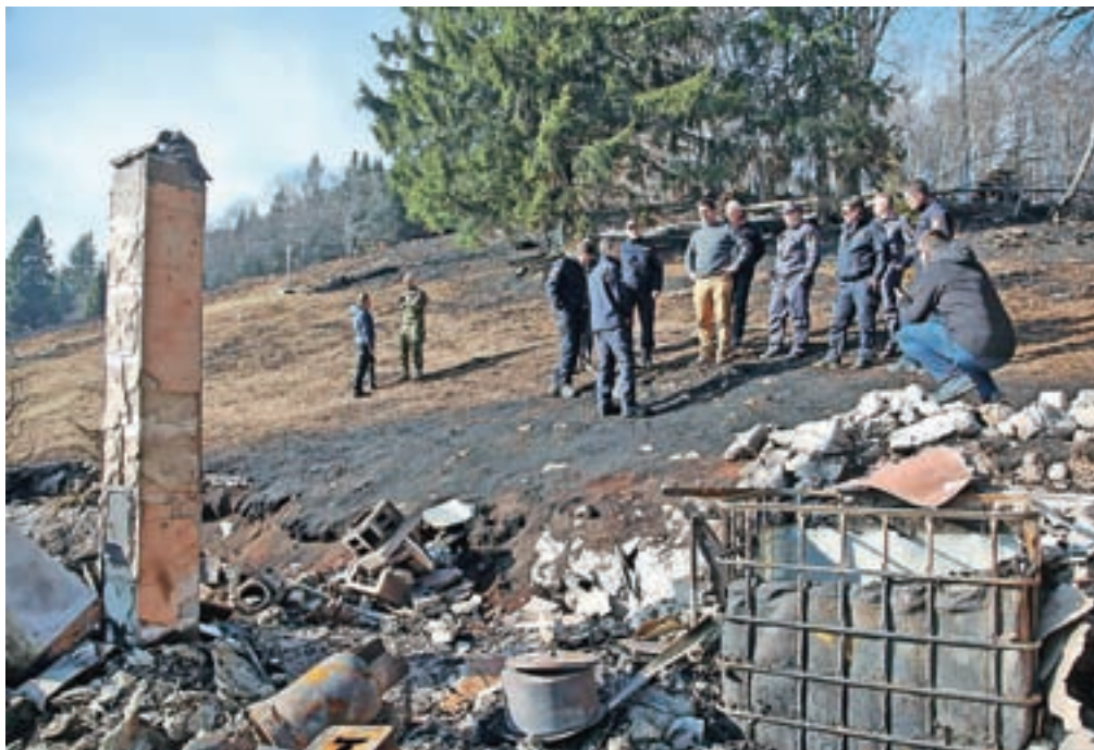
Ogled je pokazal razsežnosti požara in zahtevnost terena, s katerim so se v času požara spopadali gasilci.

Minister za obrambo je po ogledu pogorišča dal izjavo za javnost, sestal pa se je tudi s prostovoljnimi gasilci, ki so se požrtvovalno borili z ognjenimi zublji, in jim čestital. Župan Roblek se je zahvalil Vladi Republike Slovenije, da je takoj pristopila k reševanju izjemnega gozdnega požara razsežnosti, ki jih ne samo na Gorenjskem, ampak tudi širše v Sloveniji nismo vajeni. »Tako nam je na pomoč priskočil vojaški helikopter, tudi s pomočjo aktivacije državnega načrta ob tako velikih naravnih nesrečah, hrvaški Canadair, zadnji dan pa še štirje helikopterji Slovenske