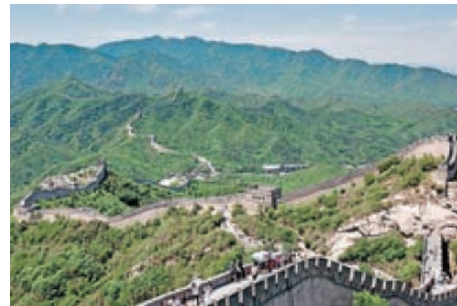
Cesarska Kitajska: njeno zaprtost pred svetom simbolizira veliki kitajski zid, zgrajen v času dinastije Ming, od 14. do 17. stoletja.