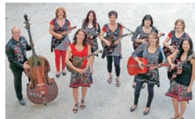
Tamburaši skupine Tamika bodo nastopili na nedeljskem koncertu v Cankarjevem domu.

V nedeljo, 10. aprila, ob 19. uri bo v Linhartovi dvorani Cankarjevega doma koncert Koroška pesem prek meja. Nastopila bosta Tamburaška skupina Tamika iz Železne Kaple in