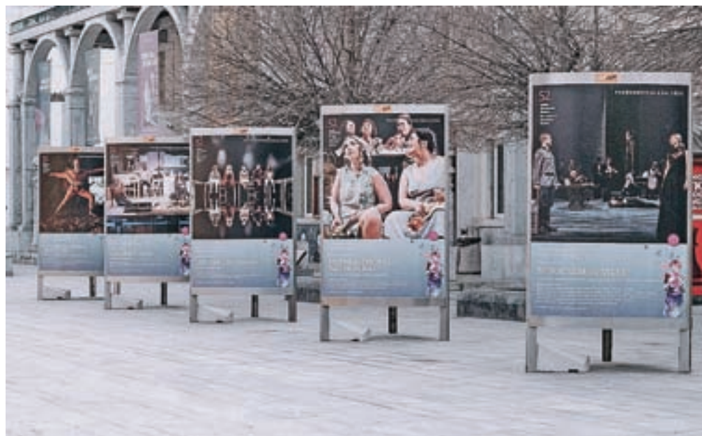
Morda bi veljalo 52. Teden slovenske drame zapisati kot enega najboljših v njegovi več kot polstoletni zgodovini.