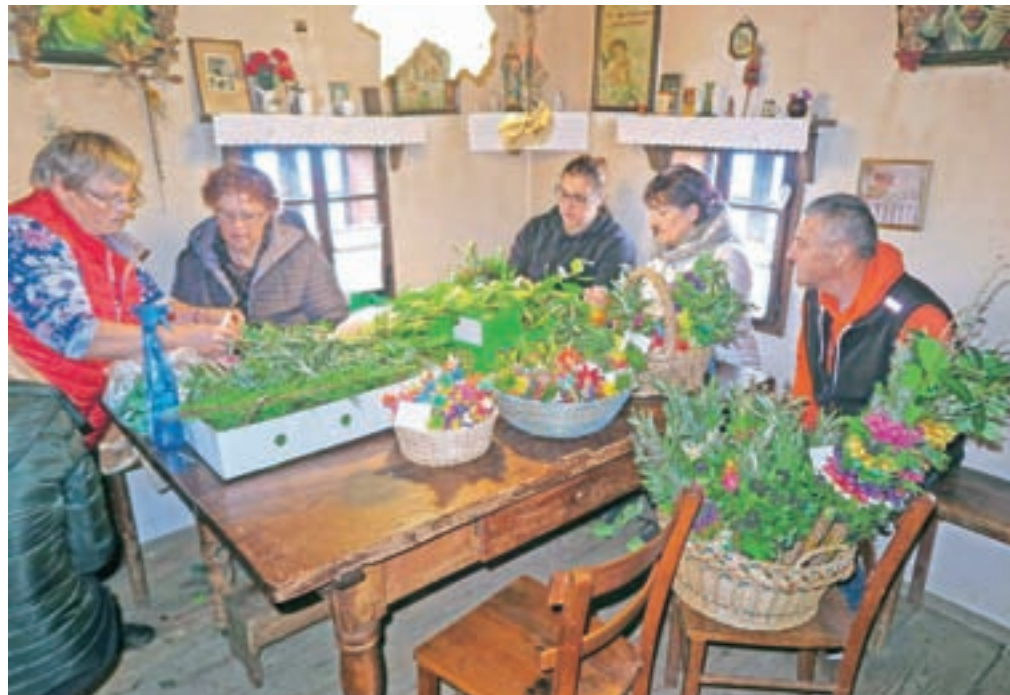
V Budnarjevi muzejski hiši so pripravili delavnico izdelovanja palovških butaric.

vezavi na butarico ne lomijo. Potem sledi barvanje. Barvamo jih s posebnimi barvami za les, lahko pa tudi z barvami za pirhe. Za barvanje oblancev uporabljamo rdečo, modro, rumeno in zeleno barvo. Barvo najprej zavremo in primerno količino oblancev potopimo vanjo, nato jih dobro premešamo in damo v gajbice, da se posušijo. Pobavane in posušene oblance razstrižemo s škarjami, na kakšno širino in dolžino, določa velikost butarice. Predno začnemo oblance vezati v butarice, jih poškopimo z vodo, da postanejo prožni. Oblance