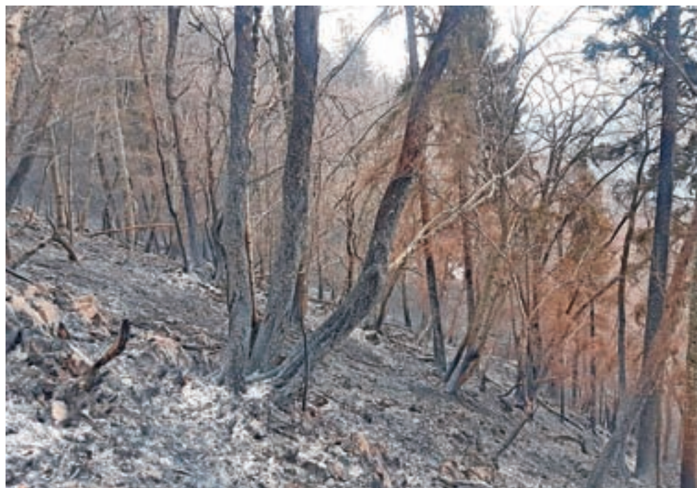
Nekatera drevesa je ogenj le oplazil, druga so močno poškodovana.