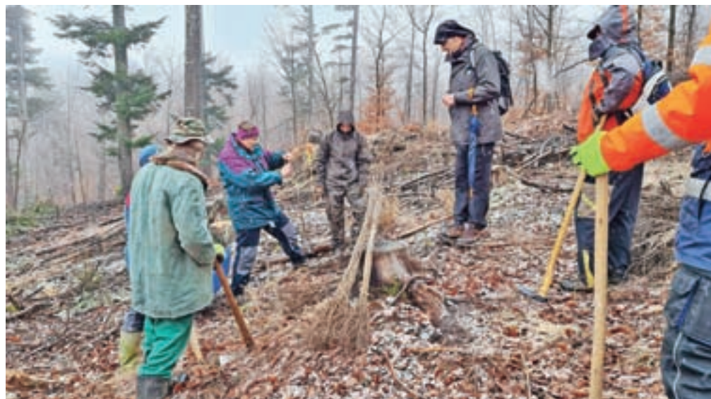
Na nekaj več kot hektar veliki parceli, ki je v lasti Občine Radovljica, so čebelarji v sodelovanju z gozdarji zasadili orehe, divje češnje, jelše, lesnike in smreke.