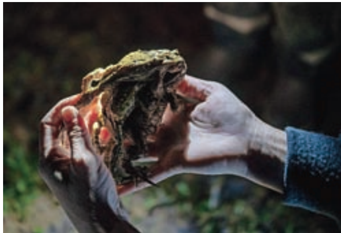
Letos so pod Joštom na njihovo »svatbo« varno pospremili vsaj 1100 žab.

Kranj – Več kot sto prostovoljcev je minuli četrtek in petek pomagalo dvoživkam pri varnem prečkanju ceste pod Joštom na njihovi poti do mrestišč. V akciji, ki jo je pod Joštom Zavod RS za varstvo narave v sodelovanju z Joštariji in Mestno občino Kranj letos pripravil tretjič zapored, so na ta način pred morebitnim povozom z avtomobilom rešili okoli 1100 žab. Z istim namenom so od srede do sobote v večernih urah tudi zaprli cesto severno od bobovskih jezerc, ki se nadaljuje skozi gozdiček mimo Brda. Tam so se žabe, naštele so jih približno 150, same sprehodile čez prazno cesto.