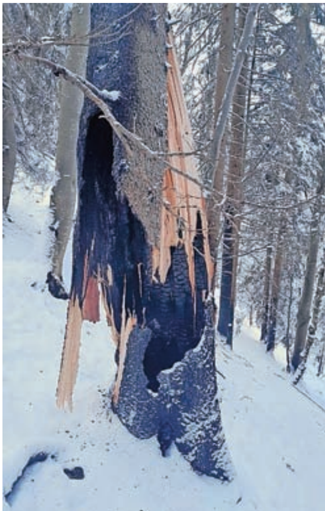
Del ožganega debla drevesa

v načrtu sanacije poškodovanega gozda natančneje ocenili obseg, vrsto in stopnjo poškodovanosti gozda ter vpliv poškodb na funkcije gozdov, določili predvidene ukrepe za izvedbo sanacije, ocenili stroške sanacije ter določili prednostne ukrepe in dinamično izvajanja del. V okviru