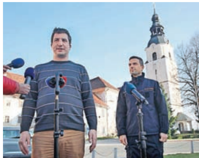
Župan Preddvora Rok Roblek in minister za obrambo Matej Tonin

Pogovor je nanesel tudi na novo letalo Spartan, ki bo v tovrstnih primerih pomenilo svojevrstno dodatno zmogljivost. Imelo bo poseben modul za gašenje požarov in bo v enem poletu lahko prineslo tudi sedem ton vode. »Verjamem, da bomo v prihodnjem letu polno operativno pripravljene za gašenje tudi s transportnim letalom,« je sklenil Tonin.