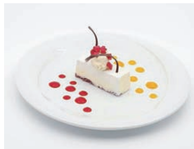
Mangova pena na rdečem žametu, cimetrov mus, kuli manganja in maline, malinov krispi

letnik 2015 iz Kleti Brda in malvazija Sinfonietta Marina letnik 2018 iz vinske kleti Pucer z Vrha iz Nove vasi nad Dragonjo.