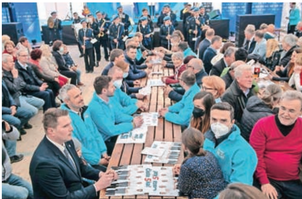
Tabora se je udeležilo vodstvo NSi skupaj z ministrsko ekipo in poslansko skupino ter kandidatki in kandidati za poslance.

Tabor je bil namenjen predvsem sproščenemu druženju, seveda pa tudi predstavitvi vseh uspehov in načrtov, ki so jih zbranim predstavili ministri stranke Jernej Vrtovec, Janez Cigler Kralj, Mark Boris Andrižanič in Jože Podgoršek na čelu s predsednikom stranke in podpredsednikom vlade mag. Matejem Toninom. »V preteklih letih se nam je marsikdo posmehoval, češ kaj pa bo ta NSi, kaj pa sploh znajo, kaj pa sploh zmorejo ... Poglejte nas danes, zaradi našega dela številni Slovenci danes živijo bolje, in to dokazano bolj. Tam, kjer je upanje in kjer je želja, tam se stvari tudi uresničijo. In v