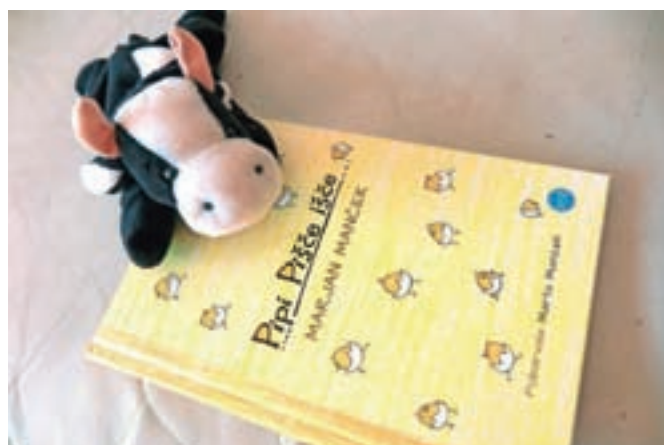
Strip za prve bralce

Trideset zabavnih, kratkih, enostavnih in preglednih stripov Pipiju je kot nalašč za prve otrokove korake v svet sedme umetnosti, pa naj strip prebirajo starši ali pa se v branju otroci poskusijo sami, kar omogoča jo velike tiskane črke.