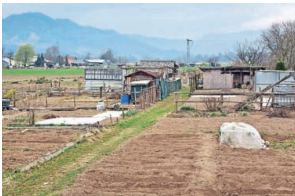
Na kmetijskih zemljiščih je dovoljena le pridelava, lop in ograj ni dovoljeno postavljati, pojasnjujejo na medobčinski inšpekciji.