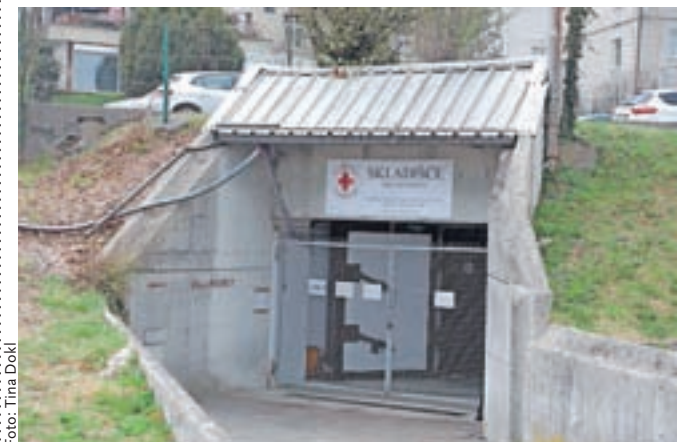
Skladišče Rdečega križa na Gregorčičevi 10 v Kranju

V MOK sicer še vedno vzpostavljajo širši nabor pomoči za primer, da bi se v Kranj oziroma v Slovenijo zateklo še več oseb z vojnih območij v Ukrajini. Na Upravni enoti Kranj so do začetka tega tedna prejeli 81 vlog Ukrajincev za začasno zaščito, v kranjske šole pa se je do zdaj vpisalo devet ukrajinskih otrok. Še naprej tudi velja poziv lokalnemu prebivalstvu in organizacijam, naj na posebni e-naslov ukrajina.sos@kranj.si sporočijo, če imajo možnost ponuditi nastanitev beguncem, če bi lahko pomagali pri prevajanju v ukrajinski jezik, ponudili psihološko pomoč ali pomagali kot prostovoljci (pri logistiki, s prevozi ...). Na poziv se je doslej odzvalo dvanajst posameznikov, ki so pripravljeni pomagati na vseh omenjenih področjih. V MOK se jim za človekoljubnost zahvaljujejo in napovedujejo, da se bodo povezali z njimi, če bodo njihovo pomoč potrebovali.