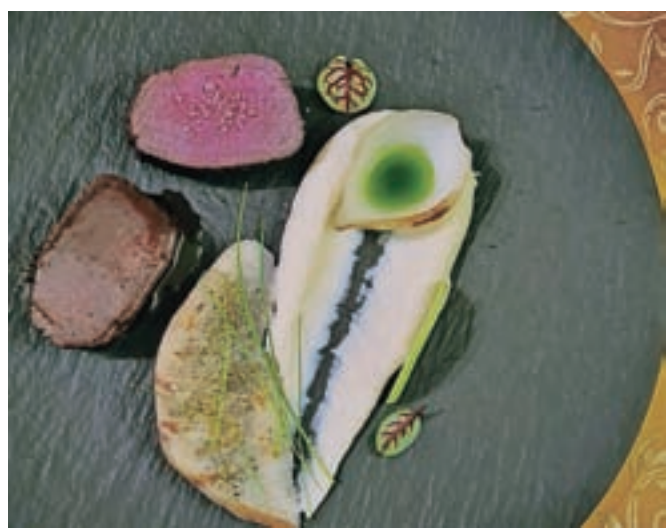
Jelen s pirejem zelene in zelenega jabolka