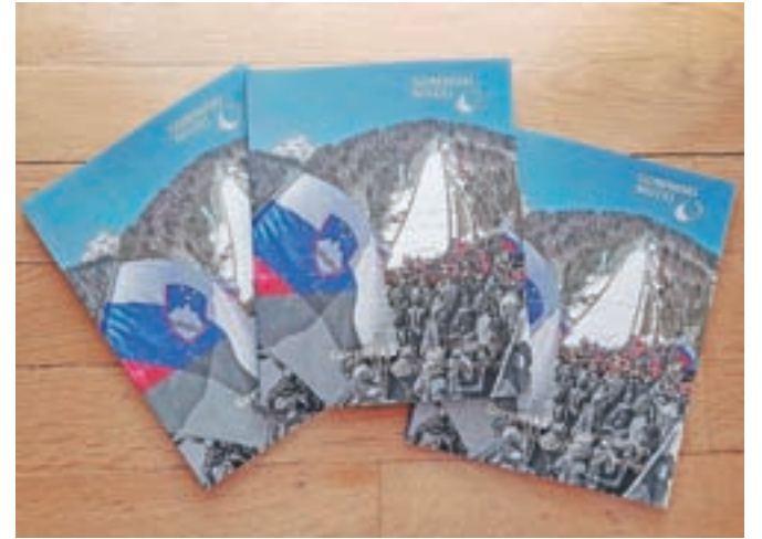
Knjiga o Gorenjski ob tridesetletnici Republike Slovenije nas vrača v čase, na katere smo morda že pozabili.

naprej Odprte strani, za tiste čase drzna politična tribuna, v okviru katerih je 21. aprila leta 1989 izšla Demokracija, prvi časopis slovenske politične opozicije. Prve tri številke so bile del Odprtih strani, četrta in obenem zadnja pod streho Gorenjskega glasa pa je izšla samostojno. Za Gorenjski glas lahko mirno zapišemo, da je bil za mno-