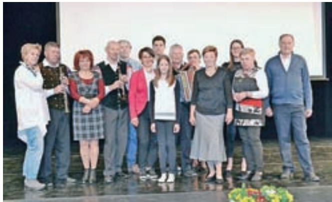
Sodelujoči na pogovornem večeru