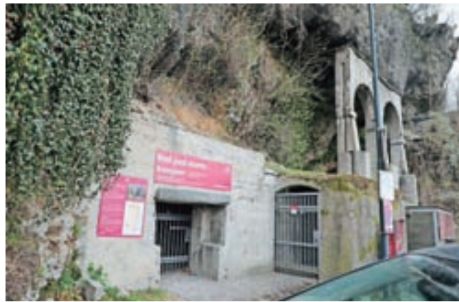
Kranjski rovi so s kapaciteto od 4500 do 5000 mest največji zaklonilnik v Kranju.

Evidenco zaklonišč na podlagi Uredbe o gradnji in vzdrževanju zaklonišč vodi občina, zato smo nekatere