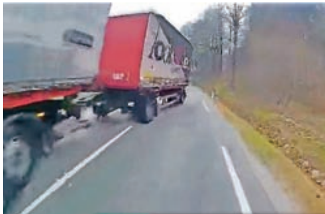
Prikolico tovornega vozila je na ovinku zaradi neprilagojene hitrosti odneslo na nasprotni vozni pas, kar je ujela tudi kamera v avtobusu.

delno izven ceste, voznik tovornega vozila pa je odpele naprej. V Ljubljani so ga izsledili policisti avtocestne policije, zoper njega pa so uvedli postopek. V nesreči ni bil nihče telesno poškodovan, so še pojasnili na Policijski upravi Kranj.