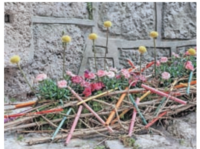
Uporabili so naravne rastlinske materiale, dodali cvetlice in dekorativne elemente.

Na velikonočno nedeljo se po dveh letih premora na grad zopet vrača velikonočna prireditev Lov na pirhe. Skritih bo več kot sto lesenih velikonočnih jajc, otroci se bodo lahko preizkusili v valicanju in sekanju pirhov, starši pa v ribanju hrena in luščenju pirhov. Aprila se bodo na gradu odvijali tudi prvi letošnji poročni obredi. »Veseli nas, da se pri nas poroča vedno več slovenskih parov, v preteklosti jih je bilo le deset odstotkov, sedaj pa jih je že polovica. V lanskem epidemiološkem letu smo imeli skupno dvanajst porok, letos imamo napovedanih že 35, od tega bodo štiri v tem mesecu,« je še povedala Ferjanova.