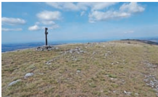
Golič je naš vmesni vrh. Po grebenu naprej gre pot na Kojnik.

Nadmorska višina: 890 m Višinska razlika: 500 m Trajanje: 4-5 ur Zahtevnost: ★★★★★