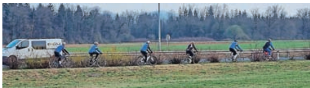
Đuro nas je popeljal po krogu, ki ga vsak dan večkrat prekolesari.