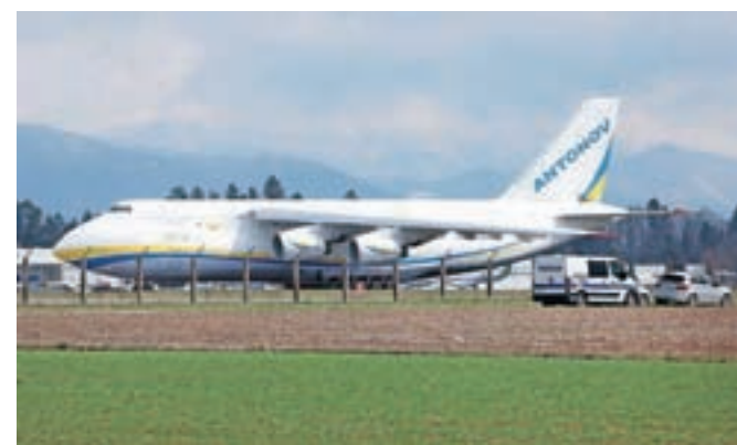
Letalo v dolžino meri 69 metrov, razpon kril pa znaša 73 metrov.

Prilogi: Zgornjesavc Cerklje pod Krvavcem