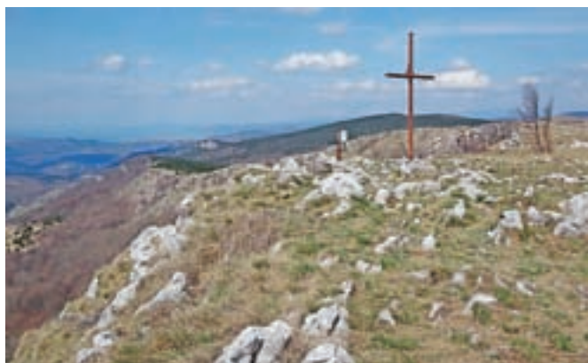
Lipnik s Kraškim robom in viaduktom Črni Kal v ozadju