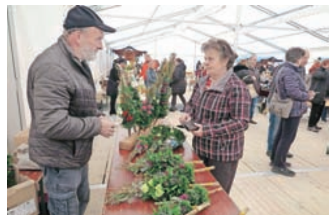
Na sejmu je bilo mogoče kupiti tudi velikonočne butarice in drugo okrasje.

Na stojnicah so se predstavili ponudniki domačih obrti in kmečkih dobrot, seveda ni manjkalo velikonočnih okraskov in butaric, obiskovalci so se lahko udeležili tudi ustvarjalnih delavnic, na katerih so ustvarjali velikonočne okraske, za veliko smeha pa je poskrbelo tudi 4. državno prvenstvo v ribanju hrena.