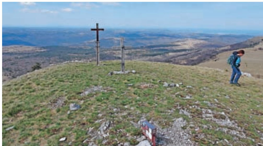
Do vrha Kavčiča pelje neoznačena pot iz vasi Rakitovec. Na vrhu sta dva križa.

58, mimo katere gremo in že smo na kolovozu, ki se pod gozdnim pobočjem zmereno dviga. Po nekaj deset metrih zagledamo leseno tablo, na kateri piše Kavčič. Usmeri se v gozdno pobočje. Steza ni označena, a dokaj dobro sledljiva. V okljukih se dvigamo po gozdnem pobočju. Ponekod je steza malce zaraščena oz. so veje dreves precej nizko razraščene. Ni ravno steza, ki bi bila množično obiskana. Pot je speljana med drevjem in grmovjem, obdaja nas nizka trava. Prečimo prvo kolovozno pot in nadaljujemo rahlo desno na drugi strani ponovno navzgor. Ponekod je pot malce strmejša, a ni hujšega naklona. Ko prečimo drugo