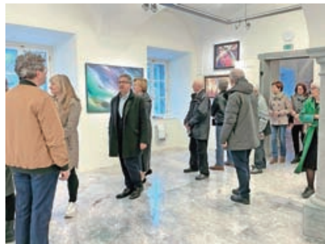
V Muzeju Žiri so minulo soboto odprli dopolnjeno stalno razstavo.