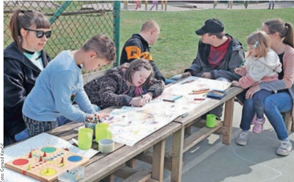
Varovanci zavoda ZRIPS in otroci iz vrtca na Orehku so skupaj preživeli zabavno dopoldne.