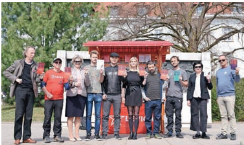
Gorenjski kandidati stranke Levice na prihajajočih državnozborskih volitvah

Med prioritetami Levice v programu Prihodnost za vse, ne le za peščico za naslednji mandat so: krepitev in zaščita javnega zdravstva, odločno ukrepanje proti podnebni in okoljski krizi, gospodarstvo po meri človeka, vlaganje v razvoj, boj proti revščini in socialni izključenosti, stanovanja za vse, vrnitev kulture v središče družbe, kakovostna in brezplačna javna vzgoja ter izobraževanje, demokratizacija na vseh ravneh