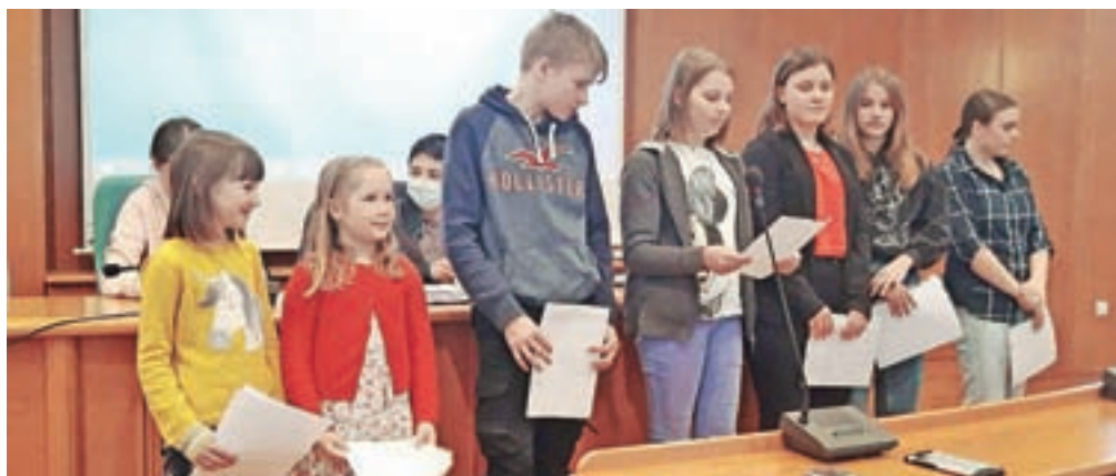
Otroški parlament v Škofji Loki