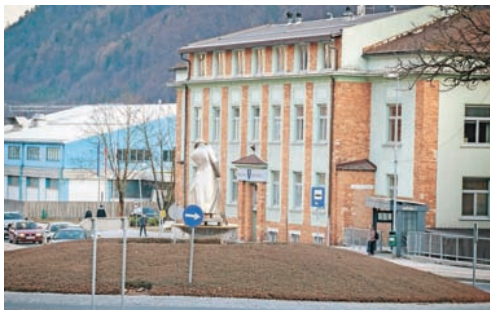
Na Občini Jesenice menijo, da bi prekinitve koncesijske pogodbe s podjetjem Enos OTE prinesla več težav kot koristi.