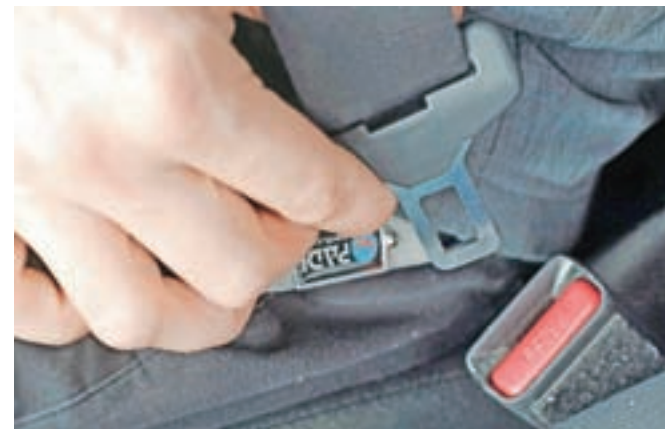
Policisti so lani ugotovili za dobrih deset tisoč več kršitev zaradi neuporabe varnostnega pasu.

Da je zavedanje voznikov motornih vozil o pomenu priprave med vožnjo še vedno premajhno, ne dokazujejo le podatki o kršitvah, temveč tudi rezultati lanskega terenskega opazovanja v enajstih mestnih občinah, so opozorili v AVP. Zgovorna pa je tudi statistika prometnih nesreč. Stopnja uporabe varnostnega pasu v letu 2021 je namreč pri umrlih voznikih osebnih avtomobilov znašala samo 56 odstotkov, kar je najmanj v zadnjem petletnem obdobju. Od 32 umrlih voznikov osebnih avtomobilov jih je 18 uporabljalo varnostni pas. Delež neuporabe varnostnega pasu pa je znašal kar 41 odstotkov. Od skupaj 139 hudo poškodovanih voznikov osebnih avtomobilov jih je 111 oz. 80 odstotkov uporabljalo varnostni pas. Stopnja uporabe je bila največja pri lažje telesno poškodovanih voznikih osebnih avtomobilov, saj je varnostni pas uporabljalo 94 odstotkov oziroma 2393 voznikov. Pri enajstih umrlih potnikih v osebnih vozilih je bila stopnja uporabe varnostnega pasu 46-odstotna (78-odstotna v letu 2020), saj pet