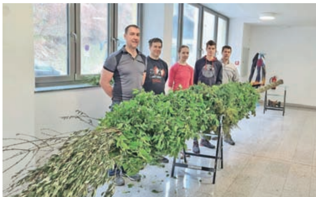
Dobrih devet metrov visoko butaro bodo postavili na trg pred cerkvijo sv. Antona.

Železniki – V Železnikih je v soboto potekal tretji Festival cvetnonedeljskih butar. Organizatorji iz Turističnega društva Železniki so bili z odzivom obiskovalcev zelo zadovoljni. V kulturnem domu so si lahko ogledali štirinajst različnih butaric, ki se v različnih delih Slovenije razlikujejo glede na sestavo in obliko pa tudi po poimenovanjih. Poleg butarice iz Železnikov, ki so jo krasile tudi čipke, so videli ljubenske potice – figuralne butare z Ljubnega ob Savinji, šmarske in palovške butarice, pušl iz Baške grape, naklansko banco, begunjsko in blejsko beganco, ljubljansko, žirovsko in poljansko butarico ... Z zanimanjem so si ogledali tudi skupino domačinov, ki je