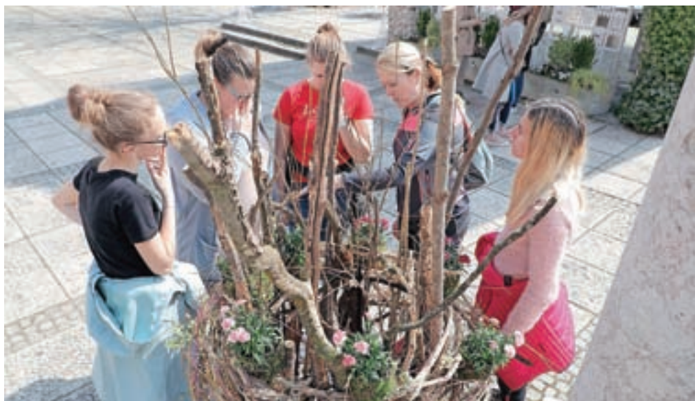
Dijaki Biotehničnega centra Naklo so Blejski grad okrasili s prostostoječimi konstrukcijami.