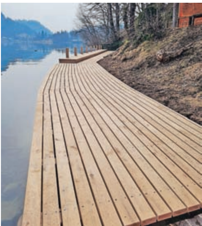
Dela v pristanišču na severni obali Blejskega otoka so zaključena.

Občina Bled je zaključila dela v pristanišču na severni obali Blejskega otoka, ki je z odlokom razglašen za kulturni spomenik državnega pomena. Vsi sodelujoči so prav zaradi najvišje stopnje varovanja dediščine pri izvedbi del postopali še s posebno stopnjo skrbnosti.