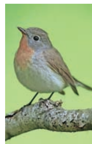
Mali muhar je ena redkih evropskih ptic, ki se vsako jesen odseli na prezimovanje v Indijo, ne pa v Afriko. V Sloveniji, kjer živi le še v nekaterih alpskih dolinah, gnezdi med 100 in 250 parov.

Prav med »gozdne specialiste« sodijo številne vrste ptic, katerih populacije so že močno zdesetkane. Za njihovo ohranjanje je nujna učinkovita in takojšnja vzpostavitev novih naravi prepuščenih gozdov, opozarjajo. V okviru projekta Varuhi naravnih gozdov zato želijo z nakupom vsaj desetih hektarjev gozda zagotoviti večji delež naravi prepuščenih gozdov. »Vanj ne bomo