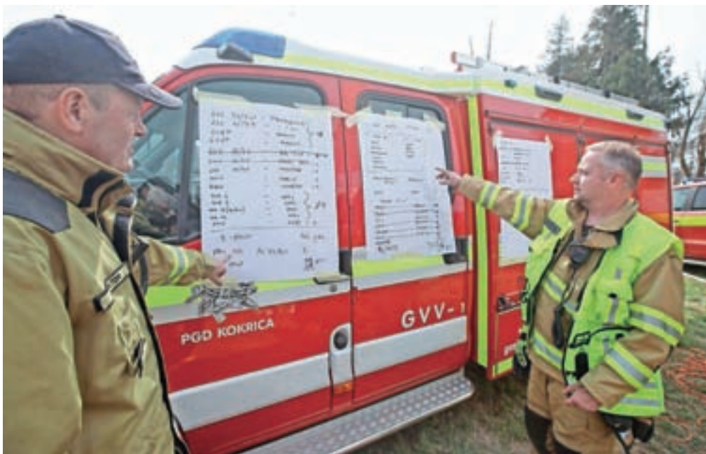
V tridnevni intervenciji je sodelovalo 1100 gasilcev iz 160 gasilskih enot.

Dostop do območja požarišča bo še nekaj časa prepovedan, tudi zaradi kriminalistične preiskave. Znova pa se bo odprla izletniška točka na Sv. Jakobu, pri čemer pa pohodnike pozivajo, naj ne zahajajo proti Potoški gori.