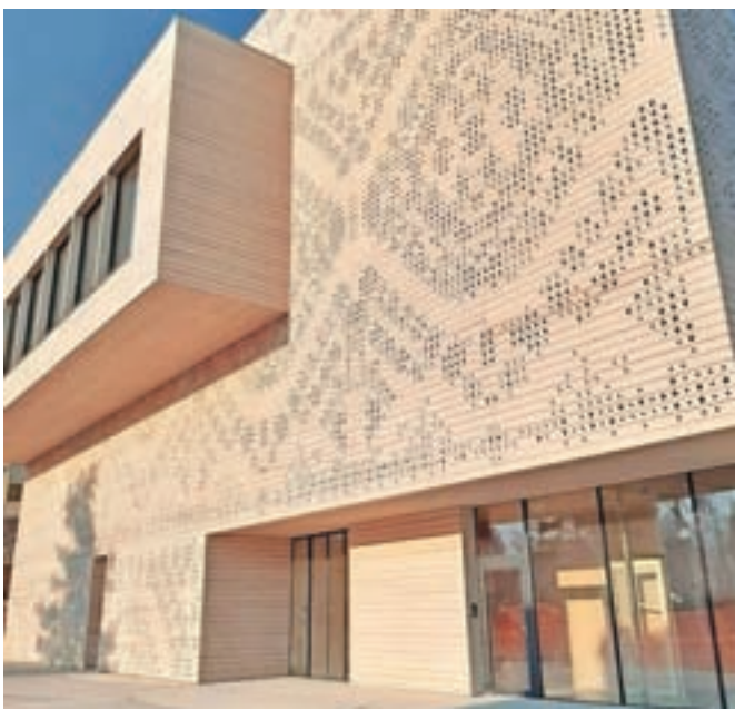
Medgeneracijski center Vezenine Bled 10. aprila odpira svoja vrata.

Ob letošnjem prazniku bodo na Bledu odprli eno največjih investicij v zgodovini Občine Bled – Medgeneracijski center Vezenine Bled, ki bo dvignil kakovost življenja domačinov na Bledu. Čudovita stavba je lep poklon nekdanji tovarni, ki je Bledu in vsej deželi v ponos stala v neposredni bližini. Še bolj kot to pa je pomembna njegova vsebina. V okolju prijaznem, skoraj v celoti lesenem poslopju bodo prepletli različne dejavnosti za občanke in občane vseh starosti, zanimanj in interesov, hkrati pa bodo ob občinskem prazniku odprli starejšim namenjena najemna stanovanja Nepremičninskega sklada Zavoda za pokojninsko in invalidsko zavarovanje. Ob prazniku bo Občina Bled podelila tudi občinska priznanja letošnjim nagrajencem, ki so vsi po vrsti mnogo svojega in sebi lastnega dali, dajejo in bodo še dajali vsej skupnosti. Prijateljsko vas vabijo na slovesnost ob občinskem prazniku in na dan odprtih vrat Medgeneracijskega centra Vezenine Bled.