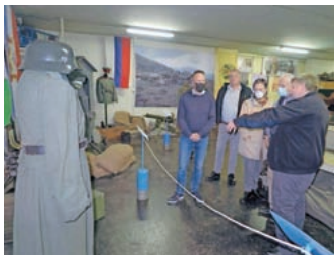
V Vojnem muzeju Kamnik je na ogled okoli tisoč predmetov, ki so tako ali drugače povezani z vojnami prejšnjega stoletja.

Na ogled je kar okoli tisoč najrazličnejših predmetov, povezanih z vojnami minulega stoletja – od orožja in vojaških uniform do dokumentov in predmetov iz nekdanje kamniške smodnišnice. »Eden bolj redkih