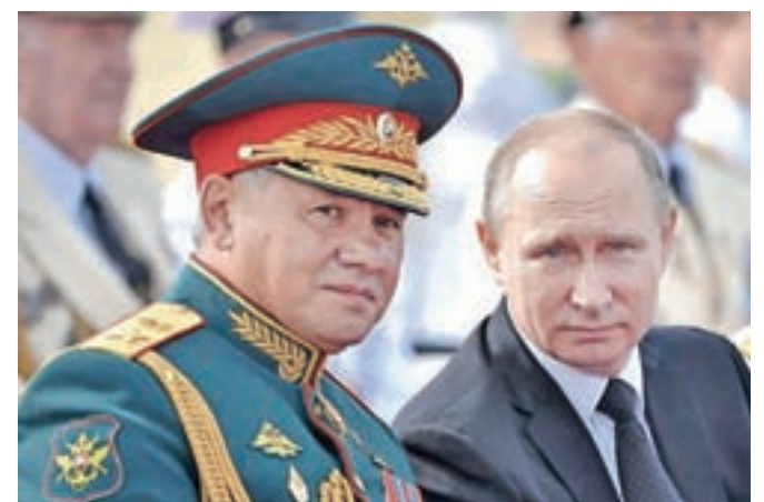
Vladimir Putin in njegov obrambni minister Sergej Šojgu sta glavna akterja napada na Ukrajino, ki pa ne poteka po njihovih načrtih.