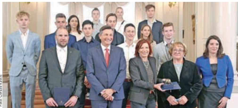
Državni panožni nordijski center Kranj, pri katerem imajo zasluge za vzgojo vrste uspešnih športnikov, si je zaslužil jabolko navdiha, ki jim ga je izročil predsednik Borut Pahor.