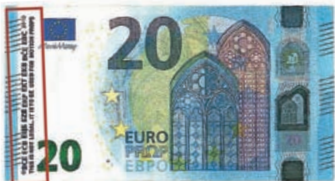
Na robu bankovca v angleščini piše, da gre za rekvizit.

not legal. It is used for motion props only.« (To ni zakonito, uporablja se samo kot rekvizit). Napis je lahko hitro spregledati, še posebej, ker je bankovec sicer videti kot pravi, poudarjajo na Policijski upravi Kranj. Zato pozivajo vse, naj preverjajo pristnost denarja.