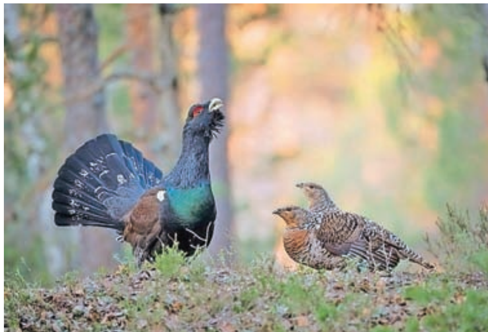
Divji petelin sodi med ogrožene živalske vrste, saj se njegova številčnost neprestano zmanjšuje. Najbolj ga ogroža vse več aktivnosti rekreacije in turizma v gozdovih.

Koliko divjih petelinov pri nas sploh še živi, so na Zavodu RS za varstvo narave v sodelovanju z lovskimi družinami na območju Kamniško-Savinjske Alpe in Grintovci ter zaposlenimi v LPN Kozorog Kamnik skušali ugotoviti v okviru posebnega projekta. Izvedli so popis rastišč, kakor imenujemo lokacije, kjer se zbirajo,