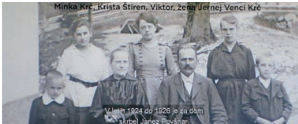
Prizor oziroma ena od fotografij, uporabljenih v filmu Češka koča in češko-slovensko planinsko sodelovanje