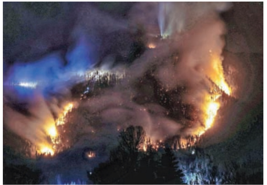
Požar se je po pobočju Potoške gore širil v dveh krakih.