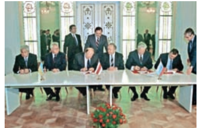
Tako so predsedniki Rusije, Belorusije in Ukrajine v neki beloruski rezidenci 8. decembra 1991 podpisali sporazum o razpustitvi Sovjetske zveze.

»Ne smemo se navaditi na vojno in nasilje. Ne smemo postati utrujeni od sprejemanja beguncev, tudi v prihodnjih mesecih.« S to izjavo nas papež Frančišek opozarja, da ob tragediji Ukrajine ne smemo otopeti, ostati moramo budni.