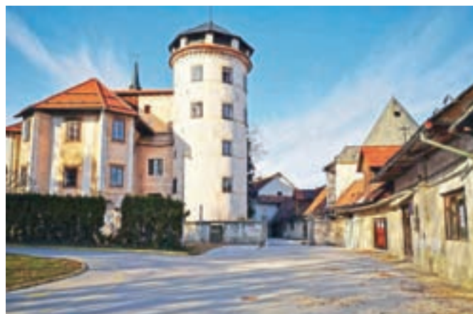
Starološki grad, ki je zadnja leta zapuščen, bo kupila Občina Škofja Loka.