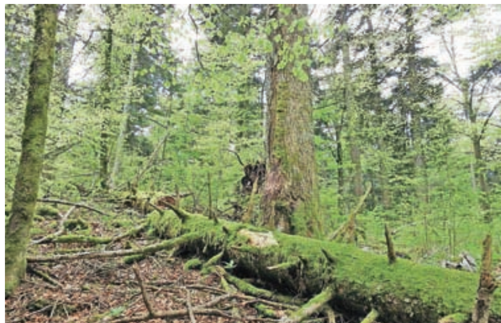
Kljub temu da se Slovenija ponaša z velikim deležem gozda, je starega, naravnega gozda zgolj en odstotek, opozarjajo na društvu za opazovanje ptic.

posegali, prepustili ga bomo naravnemu razvoju in s tem ohranjali gozdne specialiste, kot so belohrbti detel, kocinogi čuk, črna štoklja, divji petelin in mali muhar, ter številne druge gozdne organizme.«