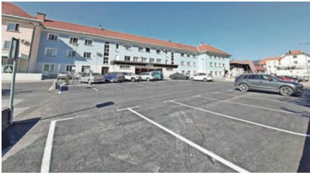
Novo parkirišče pred vhodom v dvorano DPD Svoboda

Na severozahodnem delu zdravstvene postaje so uredili sedem parkirišč, ki so namenjena izključno zaposlenim v zdravstveni postaji. Ta parkirišča so označena s talno označbo R ZP, na njih pa je parkiranje dovoljeno le z dovolilnico, ki jo je občina izdala zaposlenim v zdravstveni postaji. Prav tako so v okviru gradnje medgeneracijskega središča oziroma doma starejših