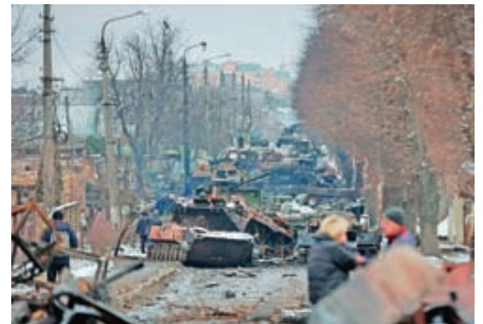
Tako so uničena ruska bojna vozila zatrpala ulico v mestu Buča v kijevski regiji, 1. marca 2022.