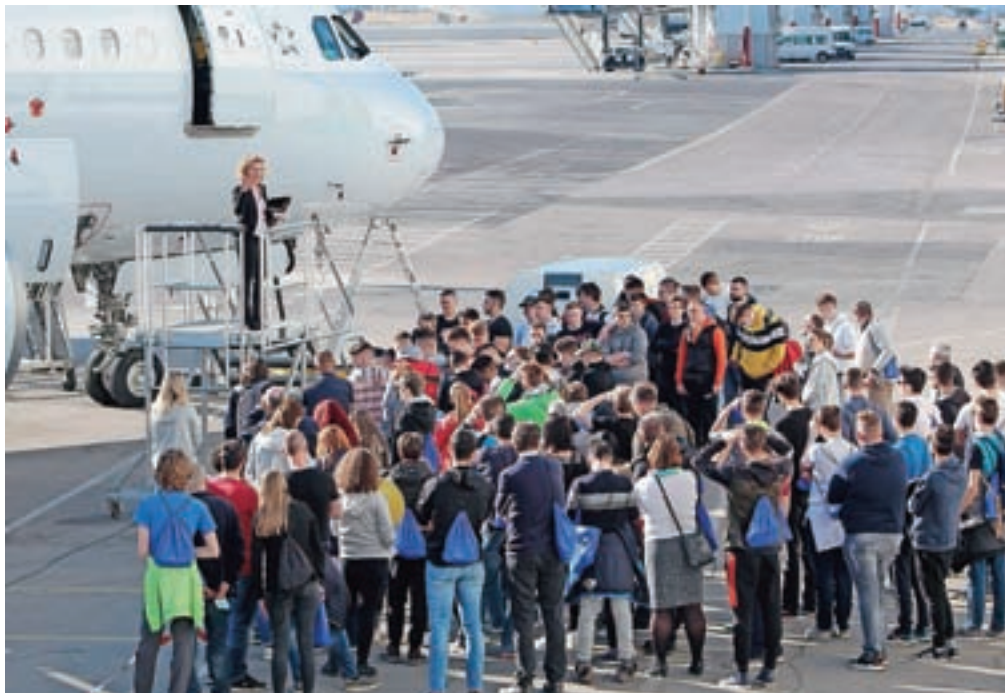
Za poklic letalskega tehnika med mladimi vlada precejšnje zanimanje.

Dogodek je ob omejitvi števila udeležencev obiskalo sto dijakov in študentov, kar je za družbo Adria Tehnika razveseljiv podatek, saj je poklic letalskega tehnika deficitaren, hkrati pa tudi zanimiv in perspektiven.