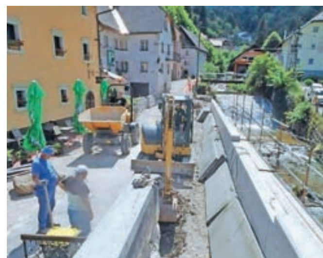
V Kropi pri gostilni Kovač so spomladi začeli obnavljati rake. Sanacija vodnih korit naj bi bila končana do jeseni.

UKO se v vodni raki še vedno vrti leseno kolo, ohranjen sistem vodnih rak z zapornicami in bajerjem pa priča o pomenu in uporabi vodne moči za proizvodnjo energije, potrebne za kovanje, še pojasnjujejo. Vrednost pogodbenih del znaša 163 tisoč evrov, od katerih bo 58 tisoč evrov prispeval Evropski kmetijski sklad v okviru projekta Arhitektura gorenjskih vasi, preostalo pa občina. V občini Radovljica bo poleg sanacije raka v Kropi v okviru projekta izdelana še tipološka študija arhitekture naselij Dobrave, Zaloše in Ovsiške.