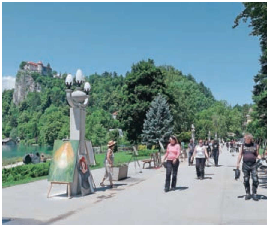
Slikarsko društvo Atelje Bled je v sodelovanju z Občino Bled in Turizmom Bled pripravilo razstavo likovnih del Promenada 2020.