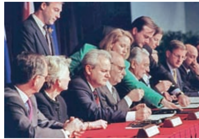
Predsedniki Slobodan Milošević, Alija Izetbegović in Franjo Tuđman podpisujejo Daytonski mirovni sporazum, Wright-Patterson Air Force Base, 21. 11. 1995