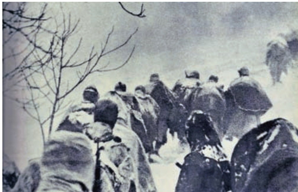
Slovenska partizanska legenda: Pohod 14. divizije nad Loko pri Zidanem Mostu, 12. februarja 1944

Avtor v predgovoru odgovori tudi na vprašanje, kako se je kljub dejstvu, da ni bil iz partizanske družine, pozneje postopoma zblížal s partizanstvom. »Do premika glede narodnoosvobodilnega boja je v moji zavesti prišlo postopoma. Najprej, ko me je starejši prijatelj, Italijan že v drugi generaciji, a z nostalgijo po slovenstvu, prosil, naj ga peljem na kak pomemben partizanski kraj. Pisal je roman o italijanski zasedbi Ljubljanske pokrajine. Šla sva na Bazo 20, kjer dotlej še nisem bil. Ko sem videl roške baratirke, ki so bile sredi nacistične Evrope središče svobode in upora in so pričale o organizacijski podjetnosti ter državotvornosti partizanov, sem prvič začutil ponos, da sem Slovenec. Rekel sem si, da bi, če bi leta 1941 imel dvajset let, šel v partizane. /.../ Dokončno sem stopil na partizansko stran po osamosvojitvi Slovenije, ko so se v devetdesetih letih prejšnjega stoletja v novorojeni državi začele pojavljati revizionistične težnje, ki so skušale visoko ovrednotiti kolaboracionizem in demonizirati partizanstvo.«