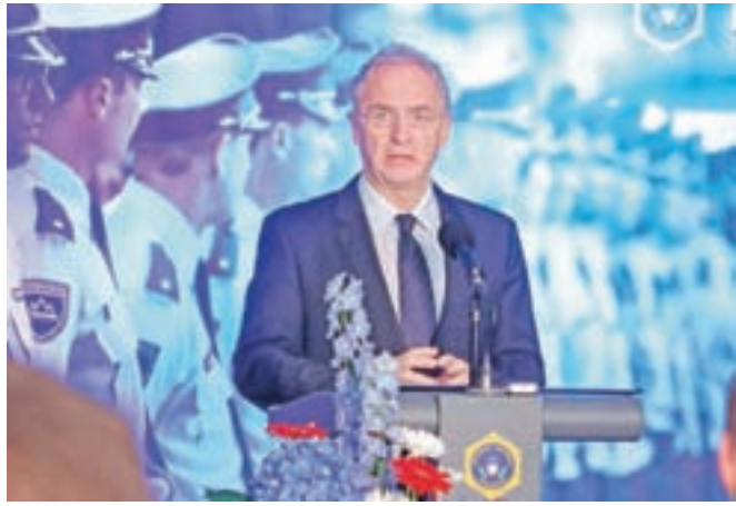
Notranji minister Aleš Hojs je prejšnji teden v Tacnu še hvalil strokovnost policije, zdaj ji očita politično motiviranost.