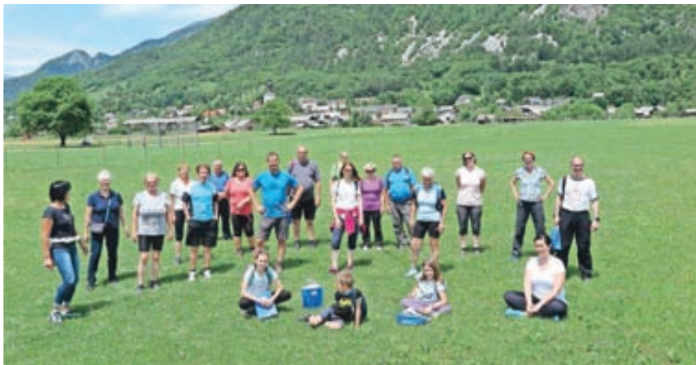
Dobro razpoloženi pohodniki po literarni poti pod Stolom

Med nami so bili tudi predstavniki partnerjev iz