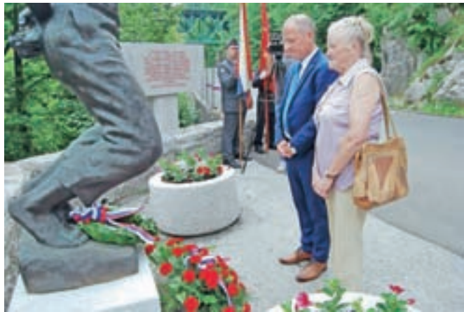
Spominska slovesnost pri spomeniku talcev v Mostah

»Kljub skromni obeležitvi spominskega dne letos naš spomin in ponos na ljudi, ki so žrtvovali največ, kar človek ima, svoje življenje, za to, da danes živimo v svobodni državi in da govorimo slovenski jezik, ne bo nič manjši,« poudarjajo v Žirovnici. Letos so sicer na spomenikih ustreljenih talcev obnovili napise in jih očistili.