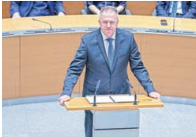
Gospodarski minister Zdravko Počivalšek ne namerava odstopiti, uživa tudi polno zaupanje predsednika vlade.