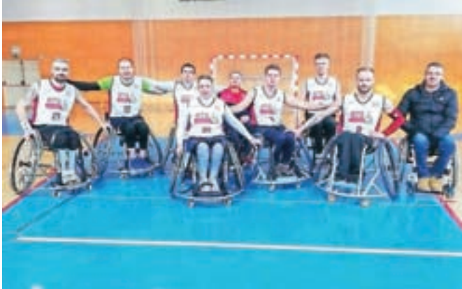
Združena ekipa gorenjskega in dolenjskega društva paraplegikov je osvojila naslov državnega prvaka v košarki na invalidskih vozičkih.

Kranj – V soboto je v športni dvorani na Vranskem v organizaciji Zveze za šport invalidov – Paralimpijski komite potekalo zaključno tekmovanje v košarki na invalidskih vozičkih. Za naslov državnega prvaka so se pomerile ekipe DP Podravja, DP Celje, DP Ljubljana in združena ekipa DP Kranj - DP Novo mesto. Ekipa DP Kranj - DP Novo mesto se je v prvi tekmi pomerila z ekipo DP Ljubljana in jo premagala z rezultatom 63 : 42, nato pa v finalu premagala še ekipo DP Celje z rezultatom 55 : 47 ter tako osvojila naslov državnih prvakov v sezoni 2019/2020.