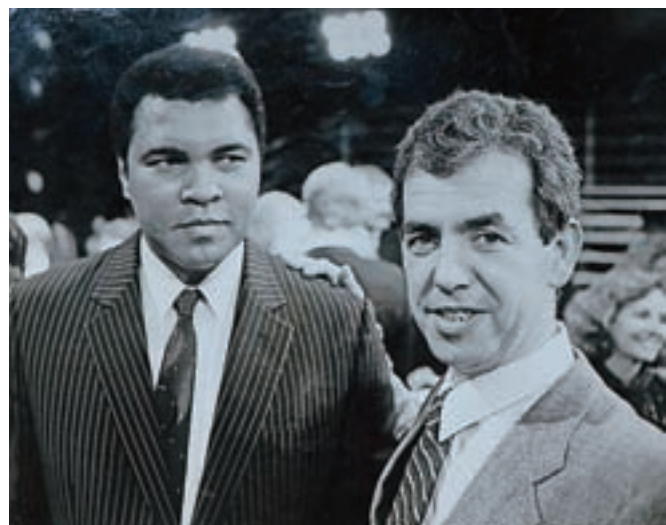
Izjemna spominska fotografija: znameniti boksar Muhammad Ali in Vinko Bogataj

Pravzaprav je padec Vinka v Ameriki tako rekoč izstrelil med zvezde. V uvodni špiči oddaje Širni svet športa so ga vrteli več kot dvajset let, in ko so posnetek umaknili, so se gledalci pritožili. Takratni Jugoslovan, ki je tekmoval v za Ameriko precej eksotičnem športu, je namreč postal ljubljenelec ameriškega občinstva.