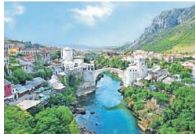
Mostar in njegov Stari most sta ena od ikon BiH. Sicer pa ta država ni le nemirna, je tudi na rdečem seznamu epidemiološko nevarnih držav.