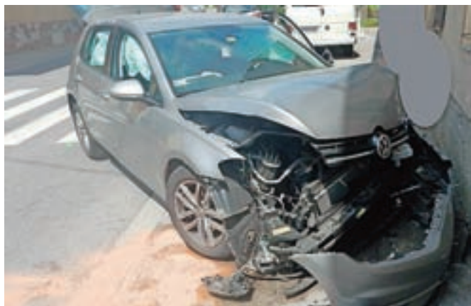
V nesreči je k sreči nastala le gmotna škoda.

Na Policijski upravi Kranj ob tem opozarjajo na negativne vplive, ki jih ima pletna vročina na voznike. V vročih dnevih se pri voznikih namreč pogosteje pojavijo utrujenost, izčrpanost, padeta tudi pozornost in zbranost. V takih primerih se raje izločite iz prometa in naredite postanek na varnem mestu, kjer boste lahko izstopili iz vozila, se pretegnili in predvsem rehidrirali telo. Pomembna je tudi pravilna uporaba klimatske naprave, dodajajo.