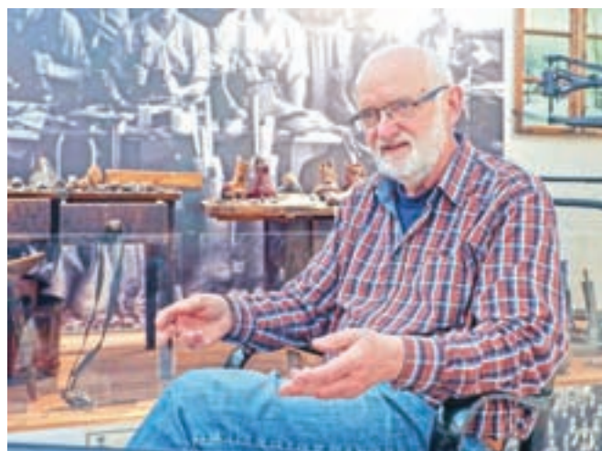
Pogovor sredi čevljarske zbirke

kom pa si spet postal Žirovec, saj vanj s sodelavci beležiš lokalno zgodovino in sedanost ter razmišljaš o žirovski prihodnosti.