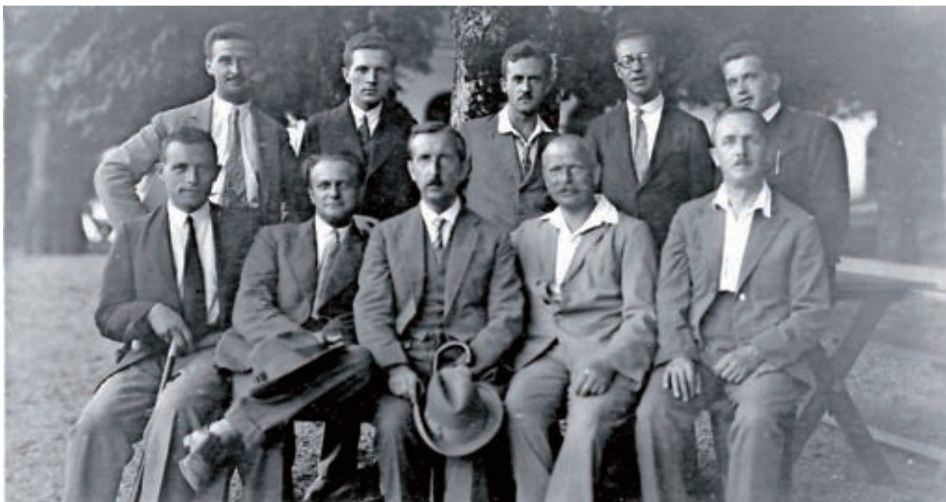
Prvo srečanje loškega profesorskega ceha na vrtu gostilne pri Balantu (zdaj je na tem mestu avtobusna postaja) leta 1930. Opis fotografije je v besedilu.