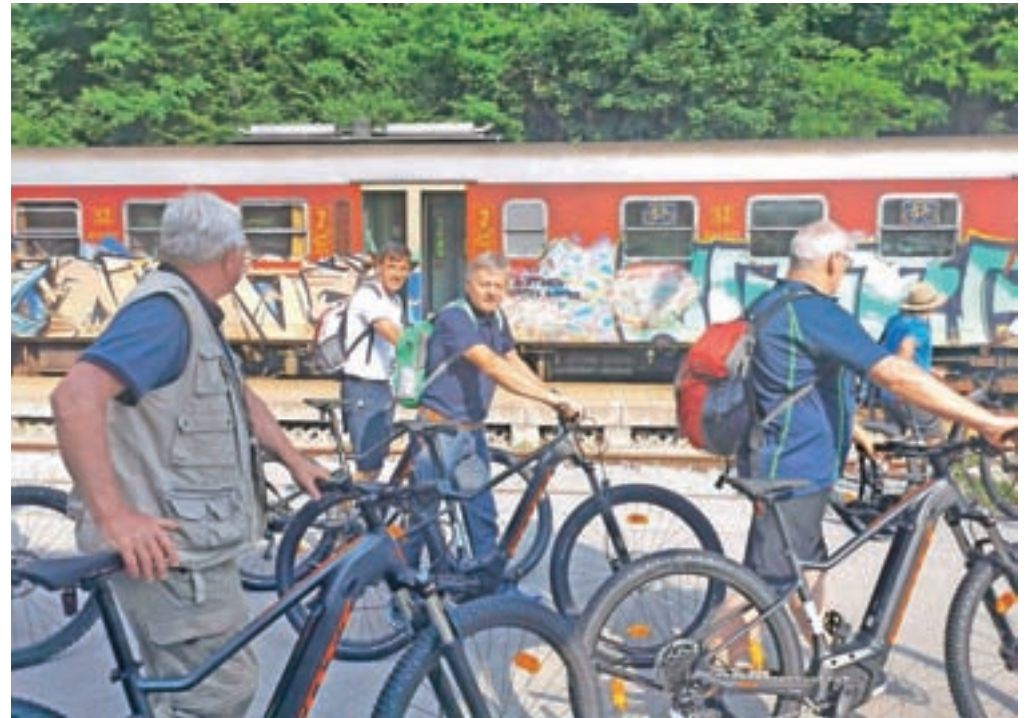
V ponedeljek zjutraj so zgornjegorenjski župani na železniški postaji Bled kolesa naložili na vlak, s katerim so se odpravili na skupni obisk Posočja.

Na izjemno pomembnost proge, ki je bila nekaj vez