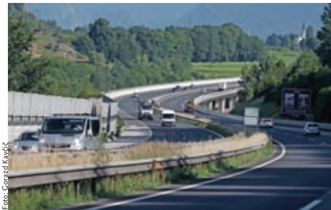
Obnovitvena dela se bodo predvidoma začela avgusta in trajala dva meseca. Na DARS-u zastojev ne pričakujejo.

Dars je sicer za obnovitvena dela izkoristil tudi obdobje epidemije covid-19, ko je bilo prometa manj. Kot so pojasnili, so v tem obdobju preplastili skupaj nekaj več kot 240 tisoč kvadratnih metrov poškodovanih asfaltnih površin avtocest, kar je 192 odstotkov več kot v primerljivem obdobju lani. Vrednost del je dosegla 7,26 milijona evrov.