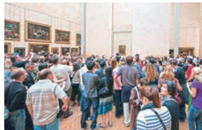
Množica obiskovalcev pred Mono Lizo, sliko Leonarda da Vincija, ki je največja atrakcija največjega muzeja na svetu; Louvre, 3. 12. 2010.