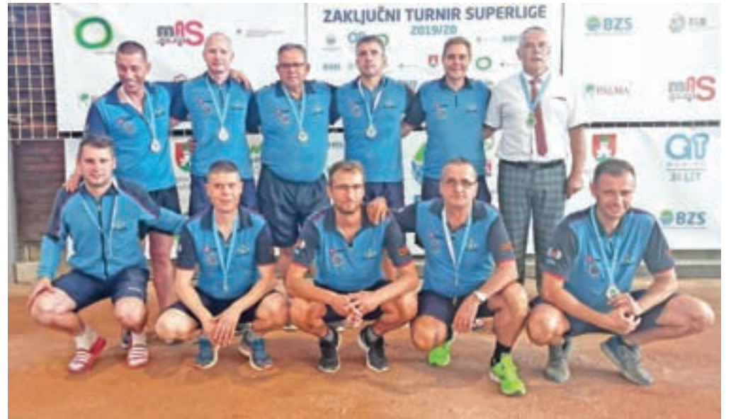
Po šestih zaporednih osvojenih naslovih državnih prvakov so se balinarji Trate letos morali sprijazniti z drugim mestom.

»Finalna tekma in celoten zaključen turnir sta bila za Trato taka kot celotna sezona – nismo igrali v polni postavi, v igri pa ni bilo pravega naboja, ni bilo prave kakovosti. Ne iščem razloga za poraz prav v tem, a dejstvo je tudi, da med epidemijo