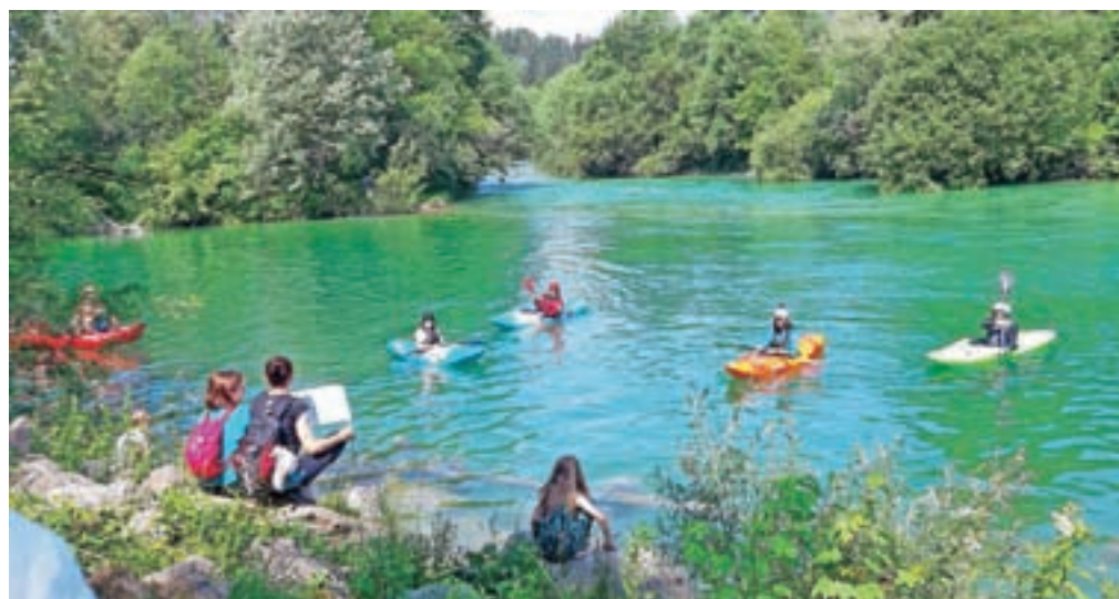
Sotočje Save Bohinjke in Save Dolinke pri Lancovem pod Radovljico

Območje sotočja sodi med ekološko pomembna območja in območja naravnih vrednot. Naravna vrednota je poleg redkega, dragocenega ali znamenitega naravnega pojava tudi drug vredni pojav, del žive ali nežive narave, naravno območje ali del naravnega območja, ekosistem, krajina ali oblikovana narava. Zato območje ni primerno za gradnjo, so prepričani v iniciativi Reši sotočje.