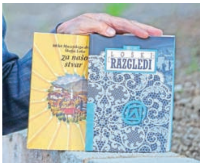
Izdajanje Loških razgledov in drugih publikacij je ena glavnih dejavnosti Muzejskega društva Škofja Loka.

Vesel sem, da poslanstvo društva uresničuje širša skupina ljudi, da delovanje ne sloni zgolj na posameznikih. Gre za skupino okrog trideset ljudi, ki delujejo v odborih in uredništvih. Ni prav, da posebej omenjam posameznike, saj vsak po svojih najboljših močeh prispeva k delovanju društva. Naše dobro delo odražajo mnenja mnogih članov, ki jih izrečejo na prireditvah ali letnih izletih društva, ki so med člani zelo priljubljeni. Res prisrčna in globoka zahvala vsem