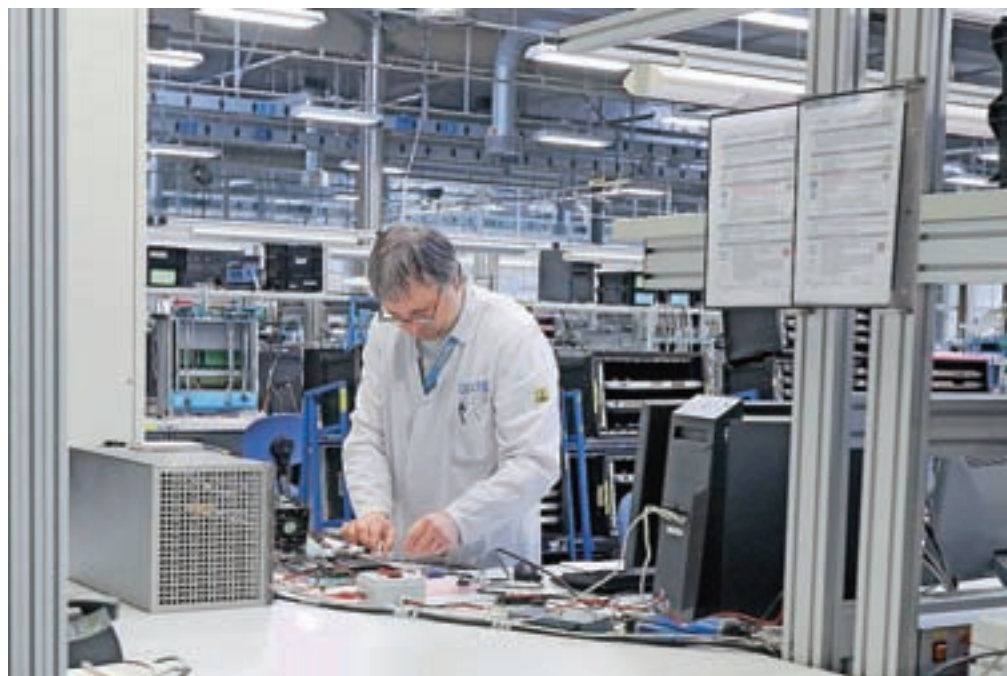
S podpisom pogodbe o prevzemu se po letu dni zaključuje iskanje strateškega partnerja skupine Iskratel, ki bo omogočil nadaljnjo rast in razvoj, pravijo v Iskratelu.