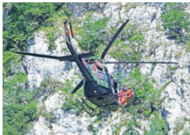
Dežurna ekipa gorskih reševalcev na Brniku je lani s helikopterjem sodelovala v 133 reševalnih akcijah.

Gorski reševalci so lani v gorah pomagali predvsem zaradi poškodb in bolezni, pa tudi zaradi pomanjkljivih informacij planincev, njihovega nepoznavanja in podcenjevanja gorskega sveta ter fizične in psihične nepriljubljenosti. Posredovali so v 604 primerih, kar je največ doslej; 528 posredovanj je bilo reševalnih, 76 pa iskalnih. Pri dobri polovici intervencij je bil prisoten zdravnik, v 255 akcijah je bilo potrebno tudi helikoptersko posredovanje. Skupno je na lanskih intervencijah sodelovalo 4.832 reševalcev oziroma povprečno osem na intervencijo.