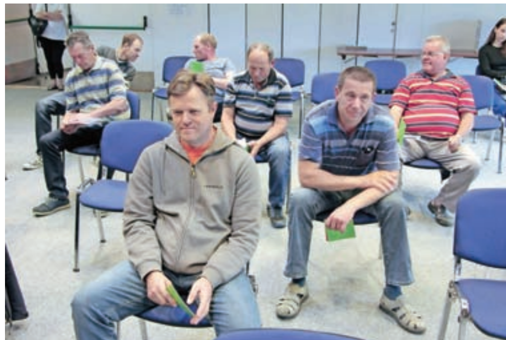
Občni zbor je bil zaradi zagotavljanja primerne razdalje med udeleženci v športni dvorani. Na sliki: skupina zadržnikov

Letos načrtujejo višje prihodke od prodaje, poslovanje z dobičkom, zmanjšanje zadolženosti, povečanje osnovnih plač, ureditev prostorov nad prodajalno Železnina v Medvodah in oddajo teh prostorov v najem, povečanje prodajnega prostora v prodajalni Dobrunje, internetno prodajo, zaključek odškodninskih postopkov s skladom kmetijskih zemljišč, komunalno ureditev parcele v Zgornjih Pirničah, izplačilo super rabata in nagrade zaposlenim ... Čeprav so se letos poslovne okoliščine zaradi epidemije covid-19 zelo spremenile, podatki za prvih pet mesecev kažejo, da je letošnje poslovanje boljše od lanskega.