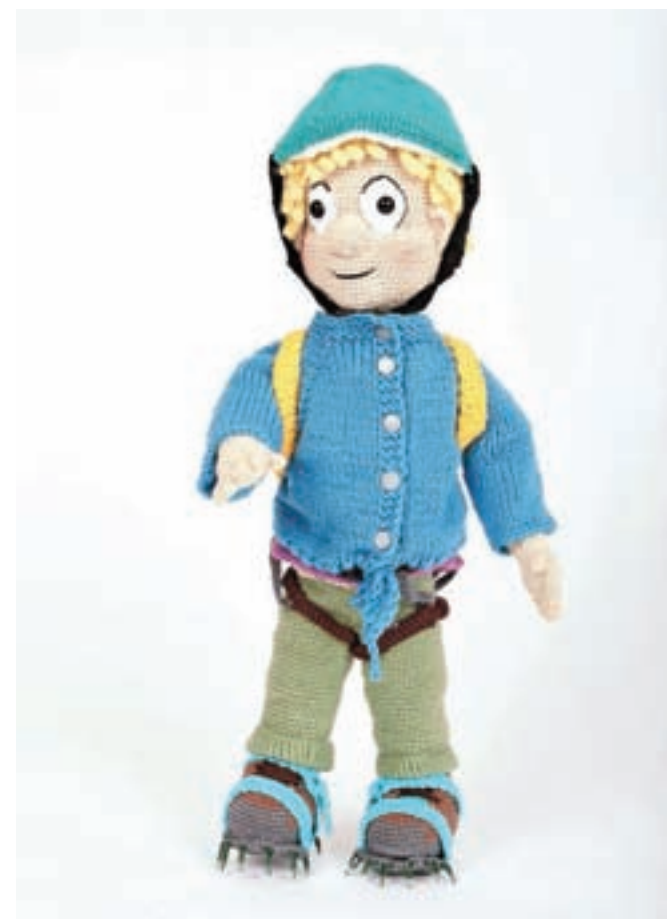
Pozdravljen vas bo Planinko, lutka, ki jo imajo za izvajanje programov za otroke od četrtega do desetega leta (vrtec in OŠ).

Na delavnicah bo z vami tudi kustosinja pedagoginja Natalija Štular, glede na koronavirus pa bodite pozorni na morebitne spremembe programa.