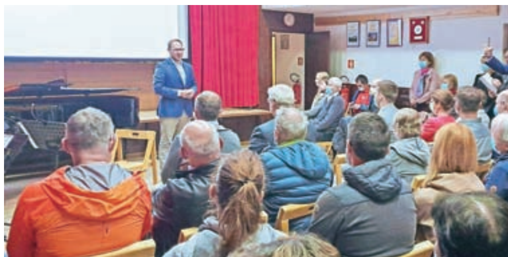
Slovesnost, na kateri je zbrane nagovoril tudi minister za infrastrukturo Jernej Vrtovec, so morali zaradi slabega vremena preseliti v kulturni dom v Stari Fužini.

obstoječe komunalne infrastrukture, javnega vodovoda ter vaške in državne ceste s cestno razsvetljavo. Zato je cesta Jereka-Jezero skozi Bohinjsko Češnjico predvidoma do 10. julija zaprta. Obvoz je urejen po Spodnji Bohinjski dolini.