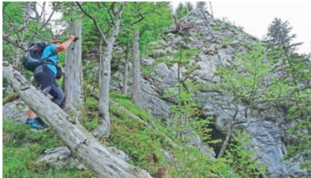
Proti vrhu Belske kope