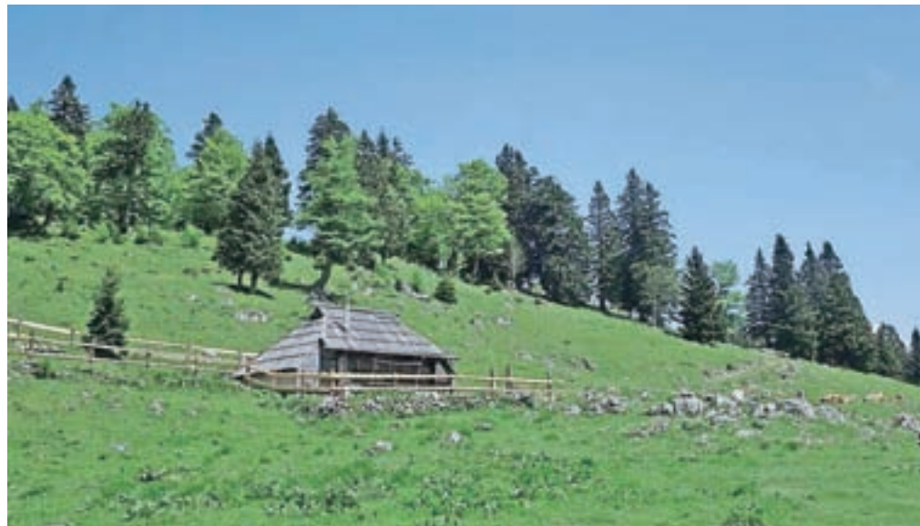
Planina Konjščica na Veliki planini

Nadmorska višina: 1308 m Višinska razlika: 1000 m Trajanje: 7 ur Zahtevnost: ★★★★★