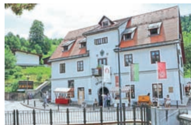
Znamenita hiša v Idriji, kjer v pritličju lahko spoznavate rudarske zgodbe, v prvem nadstropju pa si v Gostišču Barbara privoščite kosilo ali poskusite idrijske žlikrofe in njihovo čokoladno različico.

tako da ni bilo nikjer gneče. Obiskovalci so se lepo preporazporedili: eni so prišli, ko so drugi že odšli. Na različnih prireditvenih lokacijah so lahko kupili kaj lokalnega, prisluhnili Godbenemu društvu rudarjev Idrija, spoznali tehniško, kulturno in naravno dediščino z organiziranimi vodenimi ogledi. Brez idrijskih žlikrofov v Idriji ni kulinarike, na čokoladno izvedbo žlikrofov pa naletimo v Gostišču Barbara, kjer lahko poskusite tudi