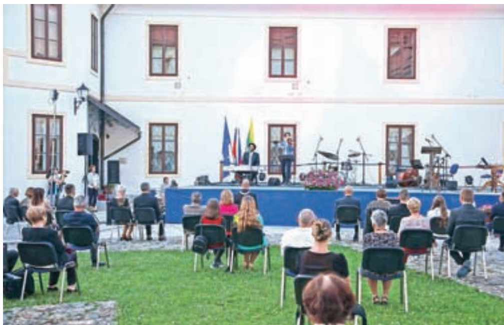
Vlada je s 25. junijem zaradi slabšanja epidemiološke slike znova zaostri ukrepe, med drugim medosebno razdaljo, kar so upoštevali udeleženci občinske prireditve v Škofji Loki v petek, 26. junija.