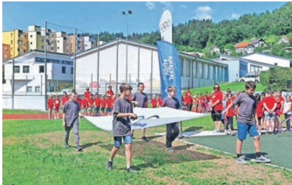
Ob olimpijskem dnevu, ki se po vsem svetu praznuje 23. junija, so se šolarji v Bistrici pomerili tudi na mini olimpijadi.