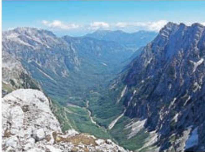
Po izboru glasovalcev je s prepričljivo prednostjo zmagala planinska pot na Triglav z Luknje čez Plemenice, ki ponuja izjemne razglede.

Po izboru glasovalcev je s prepričljivo prednostjo zmagala planinska pot na Triglav z Luknje čez Plemenice, nekdanja imenovana Bambergova pot. Na drugo in tretje mesto pa sta se uvrstili Jubilejna planinska pot z Vrščica čez Zadnje Plate na Prisojnik skozi Zadnje okno ter planinska pot Kranjska koča na Ledinah–Koroška Rinka. Zmagovalna planinska pot, ki je primerna le za izkušene planince in ponuja izjemne razglede tako na Severno triglavsko steno kot tudi na gore nad dolino Soče, bo ob ugodnih vremenskih razmerah obnovljena še pred avgustom, ko se nanjo poda največ ljubiteljev gora. Kot je povedal mag. Uroš Vidovič iz Planinskega društva Ptuj,