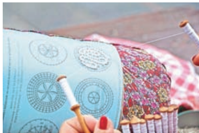
Idrijska čipka v nastajanju