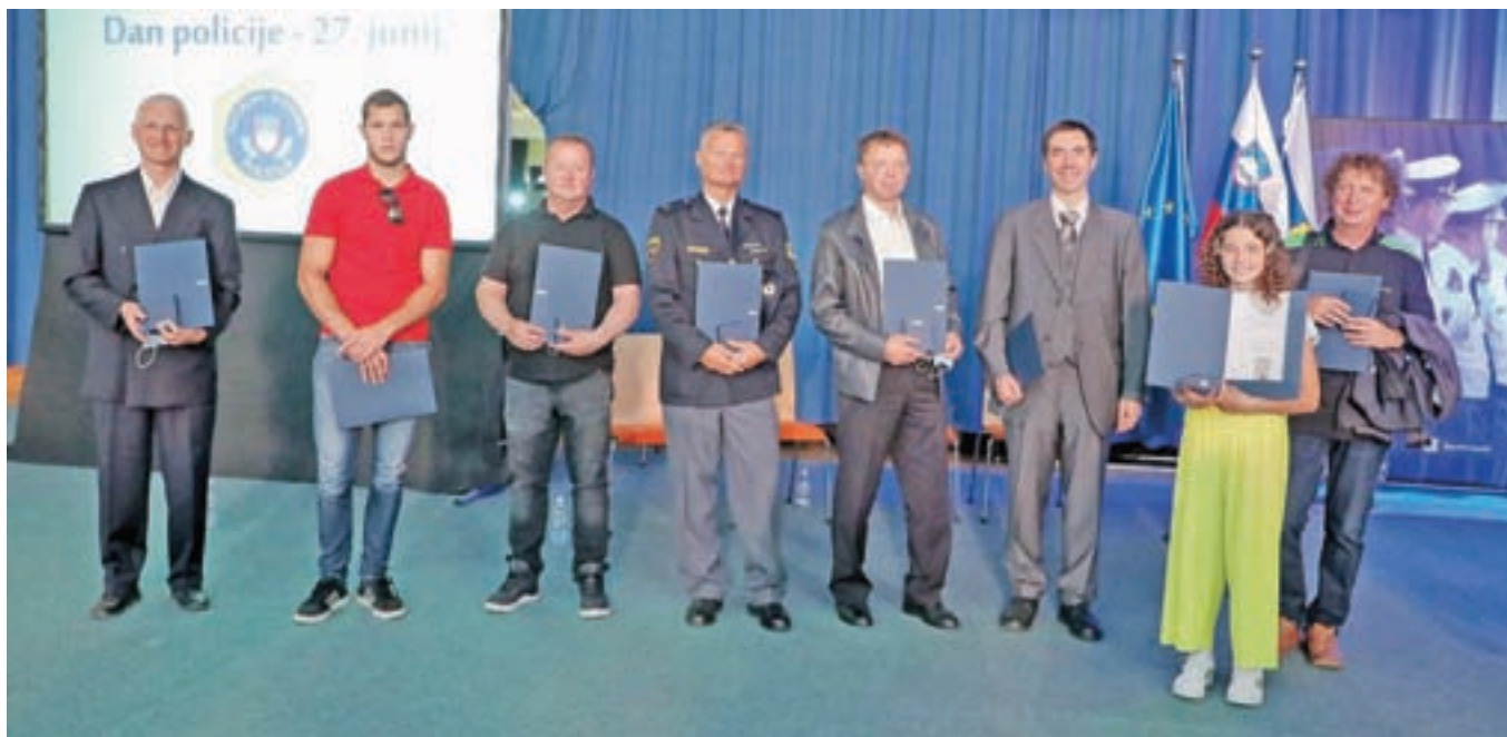
Prejemniki medalje za požrtvovalnost z območja Gorenjske, ki so preprečili tragedijo na Krvavcu.

Minister za notranje zadeve Aleš Hojs pa je policistkam in policistom dejal: »V teh mesecih, odkar sem z vami, sem spoznal vašo neizmerno iskrenost, strokovnost in požrtvovalnost za državljane Slovenije. Tudi