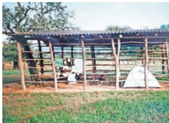
Ko te ujame nevihta, je vsaka streha dobrodošla.

V poletni vročini so obmorski kraji kolesarjem neprijazni. Sploh pred tridesetimi leti, ko še ni bilo kolesarskih stez in smo morali kolesariti v vročini med gostim prometom. Zato sem misel o kolesarjenju ob morju hitro opustil in se raje predal morskim užitek. Dva dni nisem počel prav nič, razen ležal na plaži in delal to, kar mladi fantje na plaži radi počno. Ko sem bil po nekaj dneh le utrujen od brezdeležja, sem se podal proti Trstu. Čez Trst je namreč najbližja pot do slovenskega Krasa. Čez Debeli rtič sem po lepi cesti ob morju kolesaril do Milj (Muggia) v Italiji, ki so lep ribiški kraj s slovensko dušo. Danes, ko to pišem, bi kolesarjenje po Trstu najraje kar izpustil, kajti oblastem v Trstu še danes, ko se mesta res trudijo