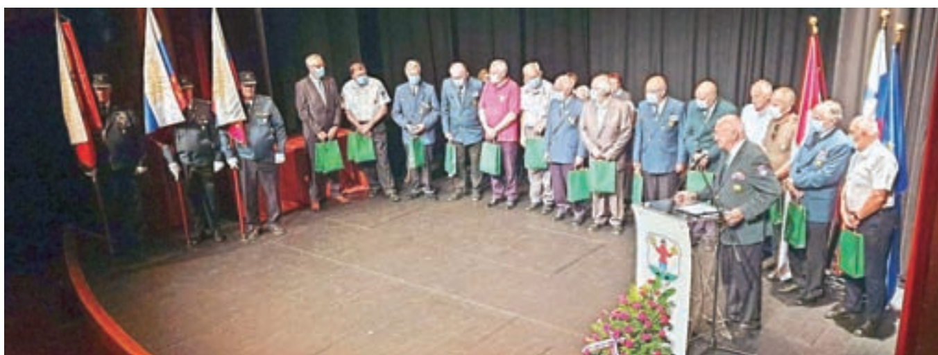
Spominske kovance so v imenu skoraj stotih prejemnikov iz vse Slovenije na slovesnosti v Radovljici prevzeli predstavniki območnih veteranskih organizacij.

veliko podatkov o ohranjenem orožju 16 občinskih štabov TO v Sloveniji, med njimi so bili štirje na Gorenjskem, in 30. razvojne skupine 27. zaščitne brigade iz Kočevske Reke. A govori predvsem o ljudeh, ki so se zavedali odgovornosti, a so tvegali. Lahko bi bilo tudi drugače,« pravi Klinarjeva in poudarja, da je nastala v sodelovanju s člani Zveze veteranov vojne za Slovenijo in Zveze policijskih veteranskih društev Sever. »Za ohranjanje izročila neposrednih udeležencev dogajanj v letu 1990 so