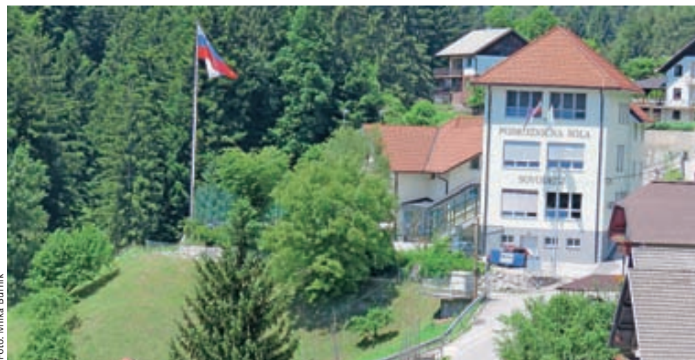
Ob zaključku obnove je na 18-metrskem drogu pred šolo zavihrala slovenska zastava.