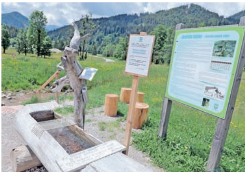
Točilno mesto jezerske slatine

dolgoročneje uredili, o čemer so se pogovarjali tudi na zadnji seji občinskega sveta. Nekateri obiskovalci pri točilnem mestu za odvezto vodo v »šparovčku« pustijo kak evro, za donacije so na Jezerskem hvaležni. V enem letu na ta način zberejo približno tisoč evrov. Donirana sredstva namenijo za redna vzdrževalna dela na vodovodu in za urejanje okolice točilnega mesta mineralne vode. Letos so še izboljšali »zimsko« točilno mesto, s čimer bo točenje vode nižje ob potoku enostavnejše in varnejše.