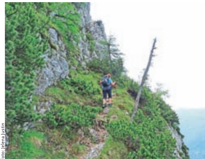
Detajl z razgledne in mestoma izpostavljene Martinj steze

Steza je lepo sledljiva in kmalu dosežemo skale. Najprej nas čaka mostiček, potem pa zavarovani del poti, ki poteka izpostavljeno čez skalno gredino. Razgled je fenomenalen, a pozornost mora biti predvsem na poti, saj je ponekod kar izpostavljena. Ko dosežemo