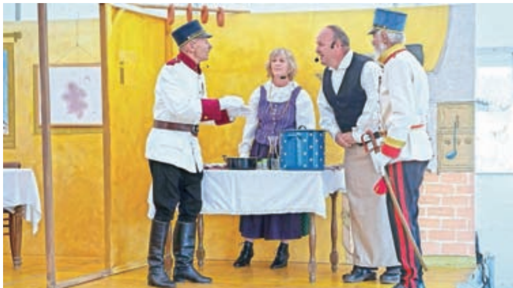
Tretja uprizoritev Cesarja in kranjske klobase v Naklem