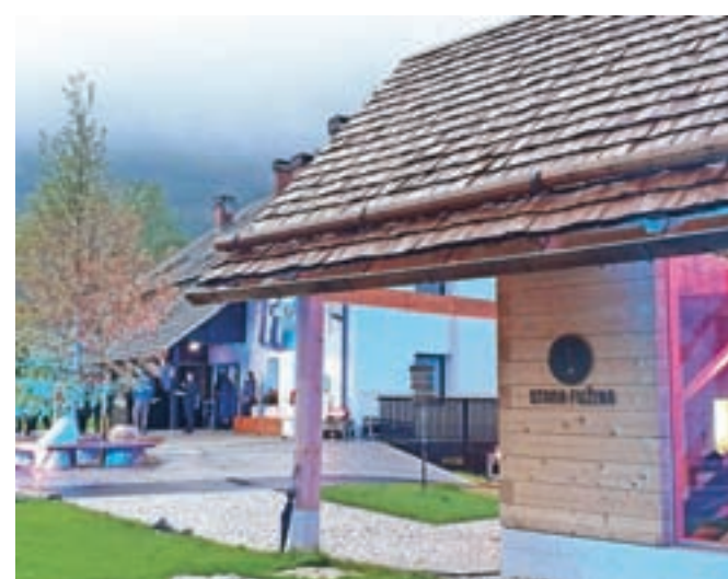
Novi turistično-informacijski center je arhitekturno zasnovan kot tipičen stan, kakršnega lahko srečamo na bohinjskih planinah. Stavba ni vzporedna s cesto, orientirana je na Triglav, tako kot stari stog na drugi strani trga.

Minister Vrtovec je izrazil zadovoljstvo nad povabilom v Bohinju, kjer tudi sicer z družino pogosto preživlja prosti čas, je povedal v nagovoru zbranim v kulturnem domu. »Bohinj je enkratni biser v tem delu Slovenije, ima številne projekte, ki jih odlično izvaja – takšen je tudi ta, ki ga zaključujemo danes. Zagotavljanje primarne infrastrukture, to so ceste, kolesarske poti, železniške povezave, pomeni, da bodo ljudje na podeželju radi živeli, da se ne bodo izseljevali in tudi da se bo povečal obisk turistov na tej edinstveni lokaciji,« je povedal minister Vrtovec in ob tem poudaril pomen bohinjske železniške proge