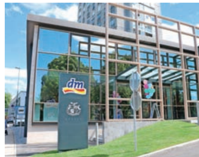
Trenutno na Gorenjskem najdemo tri prodajalne dm v Kranju (najnovejša na fotografiji), eno v Škofji Loki, dve na Jesenicah in po eno na Bledu ter v Radovljici

Kranj – Na Bleiweisovi cesti 4 v Kranju, nasproti avtobusne postaje in v neposredni bližini znamenitega nebotičnika, je nekdanja stavba dobila novo, izjemno zanimivo podobo. V njej po novem najdete prodajalno priljubljenega dm drogerie markt. Odprli so jo v začetku tedna ter ves teden razveseljevali obiskovalce s 15-odstotnim popustom ob odprtju in številnimi izdelki v okviru akcije ena plus ena gratis – kar velja še do sobote, 27. junija. Prodajalna dm na Zoisovi ulici tako ne obratuje več. Trenutno na Gorenjskem najdemo tri prodajalne dm v Kranju, eno v Škofji Loki, dve na Jesenicah in po eno na Bledu ter v Radovljici. »V novi prodajalni dm v Kranju bodo stranke našle izdelke s področja ličenja, nege telesa, dišav, prehranskih dopolnil, medicinskih pripomočkov, živil in ekološke pridelave, nege dojenčka, gospodinjstva ter prehrane za živali. Pestra je tudi ponudba izdelkov naših blagovnih znamk, kot so trend IT UP, Balea, Denkmitt, Babylove, dmBio in mnoge druge,« še povedo v podjetju dm.