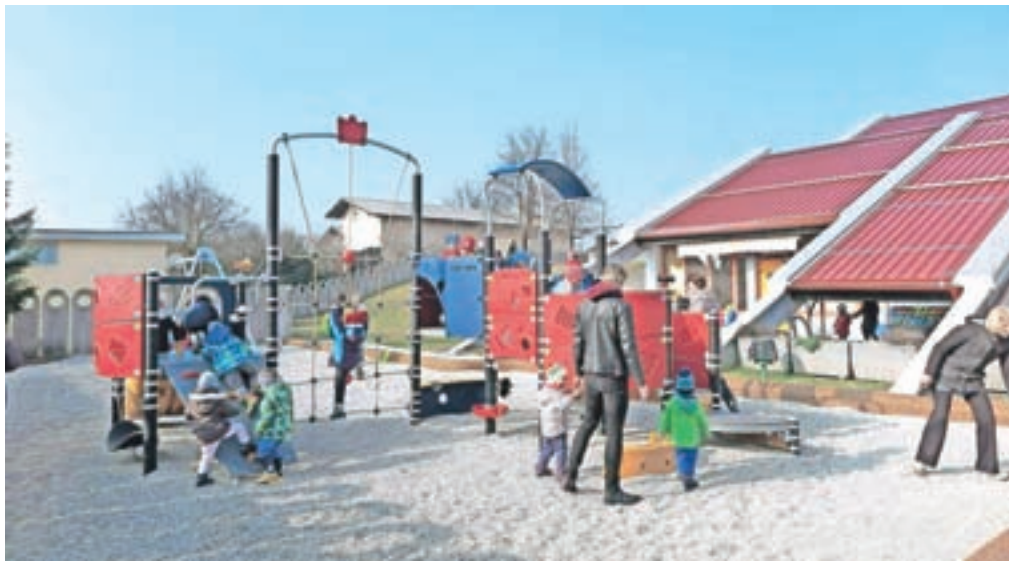
Vrtci v Kamniku bodo od septembra dražji. / Foto: Jasna Paladin (arhiv Gorenjskega glasa)

Tako kot v drugih občinah so glavni razlogi za podražitev višji stroški dela, ki predstavljajo 74 odstotkov vseh stroškov, pa tudi višji stroški materiala in storitev ter živil za otroke. Svetniki so se načelno strinjali, da je sprememba potrebna, saj je