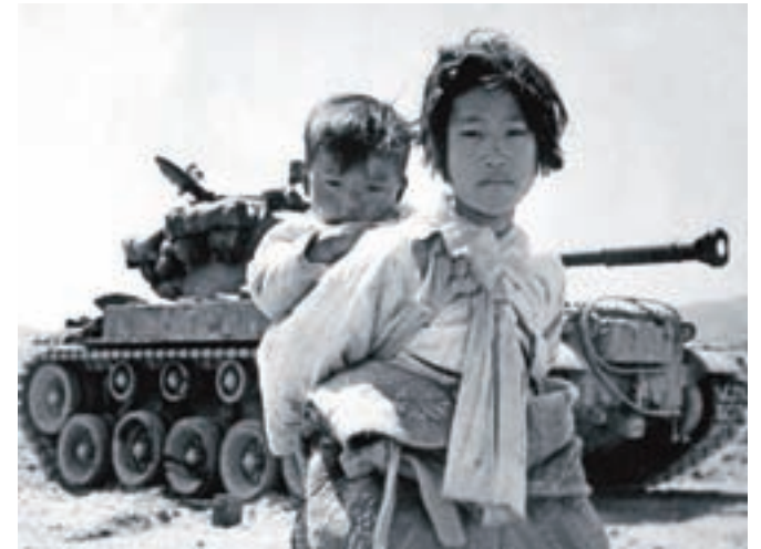
Tudi med korejsko vojno je bilo veliko beguncev. Na sliki deklica z bratcem, za njima ameriški tank M26 Pershing, 9. 6. 1951.

prosilcev za azil, dodatno pa je tu še 3,6 milijona Venezuelcev, razseljenih v tujini. Ti Venezuelci večinoma niso zaprosili za status begunca, ko so prišli v tujino. Pandemija covid-19 in s tem povezana revščina nekaterih držav pa bosta verjetno še spodbudili beg v smeri Evrope. Največ beguncev gosti Turčija, in sicer 3,6 milijona. Sledijo Kolumbija z 1,8 milijona ter Pakistan in Uganda s po 1,4 milijona beguncev. Na petem mestu je Nemčija, kjer živi 1,1 milijona beguncev. Glede na izvor je na begu največ Sircev, 6,6 milijona. Svoje domove je med drugim zapustilo še 3,7 milijona Venezuelcev in 2,7 milijona Afganistanc. Med vsemi begunci jih je po ocenah med 30 in 34 milijonov starih manj kot 18 let. Vse večje število beguncev gre pripisati tudi temu, da domovine ne iščejo možnosti, kako bi državljane privabile nazaj. Pred tridesetimi leti se je v povprečju v enem letu v domovine vrnilo po 1,5 milijona beguncev, v zadnjih letih pa v povprečju po manj kot štiristo tisoč. V Sloveniji je bilo po podatkih UNHCR konec lanskega leta samo 751 ljudi s statusom begunca, 329 ljudi pa je še čakalo na odločitev oblasti glede vlozene prošnje. (Vir: MMC RTV SLO)