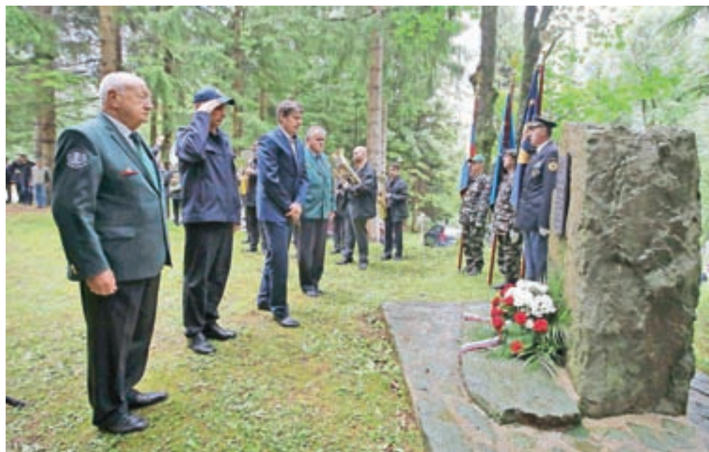
Na Gorenjskem je bilo včeraj ob državnem prazniku več spominskih slovesnosti, med drugim v Podlublju pri spominskem obeležju veteranov vojne za Slovenijo. Slavnostni govornik je bil generalmajor Ladislav Lipič.