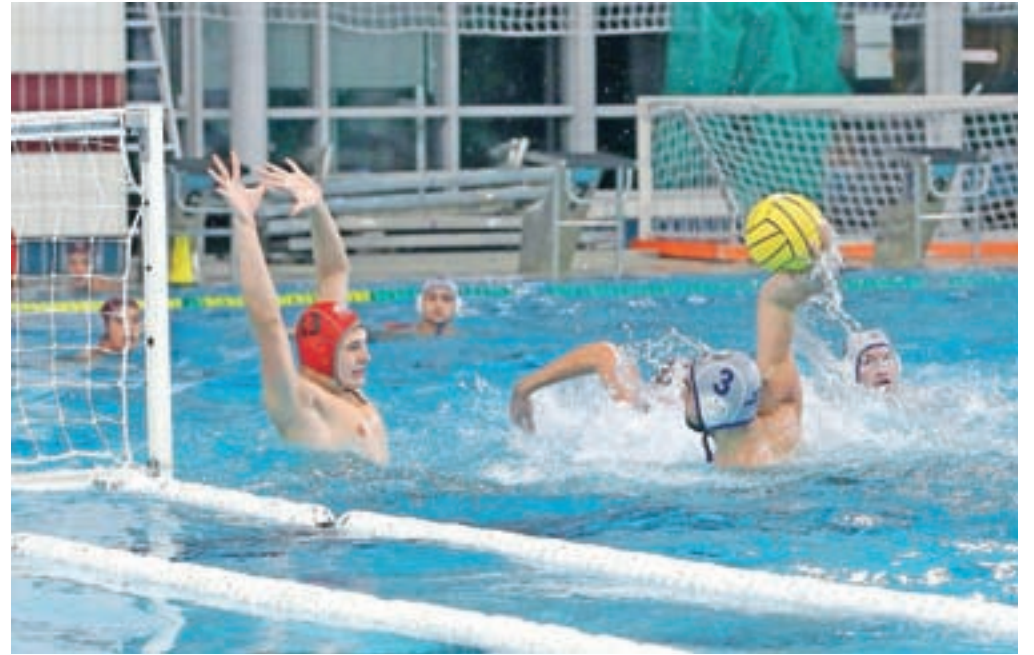
Vaterpolisti Triglava so v tej sezoni že osvojili naslov pokalnih prvakov, zdaj pa upajo, da se bodo lahko borili tudi za naslov državnih prvakov.