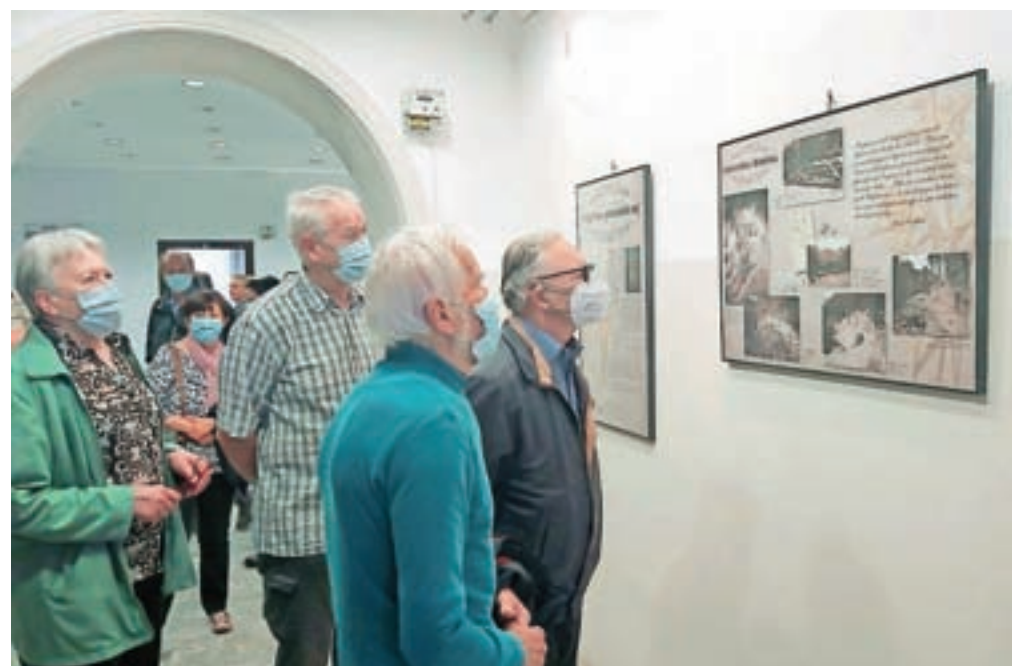
Stare fotografije so tudi tokrat požele veliko zanimanja.