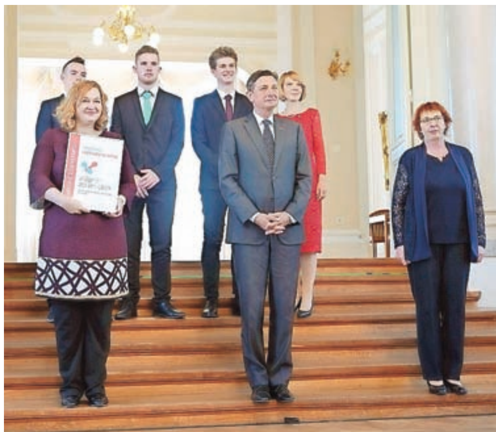
Med letošnjimi prejemniki priznanj inženirska iskra je tudi Strokovna gimnazija Šolskega centra Kranj.

Inženirska iskra je priznanje za najbolj inovativne dosežke, ki jih je v zadnjem letu prepoznala ekipa Inženirke in inženirji bomo!, so sporočili iz urada predsednika republike. »Glavni namen je osvetliti in izkazati priznanje prebojnimi ali izvirnim