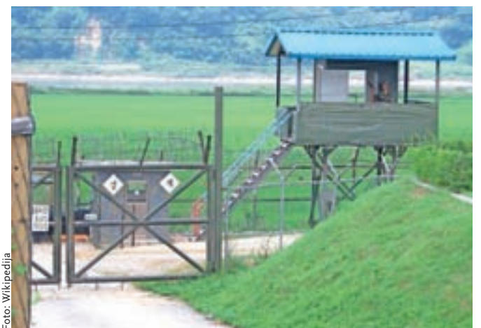
Kontrolna točka na najbolj zastraženi meji na svetu, med obema Korejama, za njo demilitarizirana in smrtna cona.