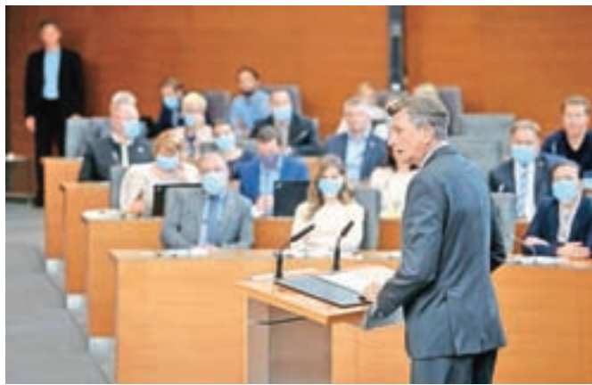
Predsednik Pahor je v svojem nagovoru v državnem zboru poslance prosil, naj ne odlašajo in naj v roku, ki ga je določilo ustavno sodišče, uveljavijo njegovo odločbo glede volilne zakonodaje.