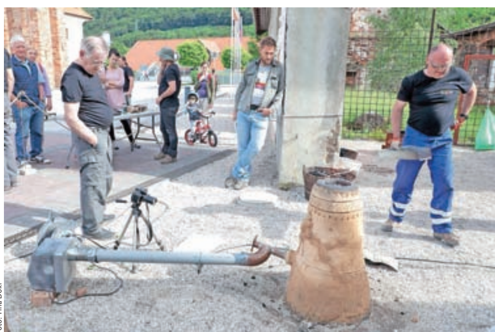
V vetrni peči so talivci iz Železnikov talili železovo rudo po postopkih, starih 2500 let.