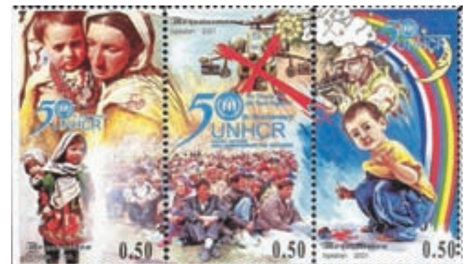
Komplet poštne znamke, ki jih je leta 2001, ob 50-letnici Visokega komisariata ZN za begunce (UNHCR), izdal Tadžikistan.