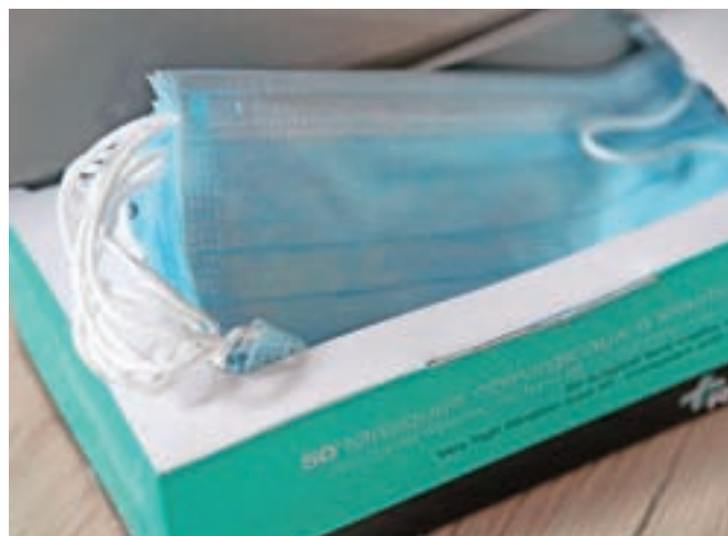
Zaradi slabšanja epidemiološke slike je vlada znova uvedla obvezno nošenje zaščitnih mask in razkuževanje rok. Samo od ponedeljka do vključno srede smo imeli v Sloveniji potrjenih 26 novih okužb.

Vlada je na sredini seji določila besedilo predloga novele zakona o interventnih ukrepih za omilitev in odpravo posledic epidemije iz