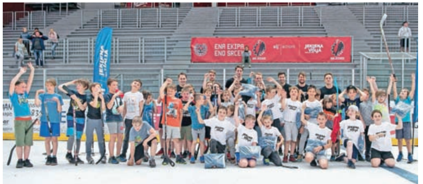
V Dvorani Podmežakla so se mladi minuli petek pomerili na hokejskem turnirju.

jim je pridružilo tudi veliko navijačev. Na koncu sta najboljši ekipi v obeh kategorijah sestavili skupno moštvo, ki se je za glavno nagrado in ime zmagovalca turnirja pomerilo z igralci ekipe SIJ Acroni Jesenice. Na koncu je jekleno hokejsko palico, ki so jo posebej za to priložnost izdelali v družbi SIJ Acroni Jesenice, dvignila ekipa mladih izzivalcev, ki je v dramatičnem obračunu do zmage prišla šele po izvajanju kazenskih strelav.