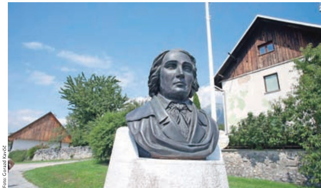
Celotno območje ob Prešernovi rojstni hiši naj bi zaživel kot Turistični center Vrba.