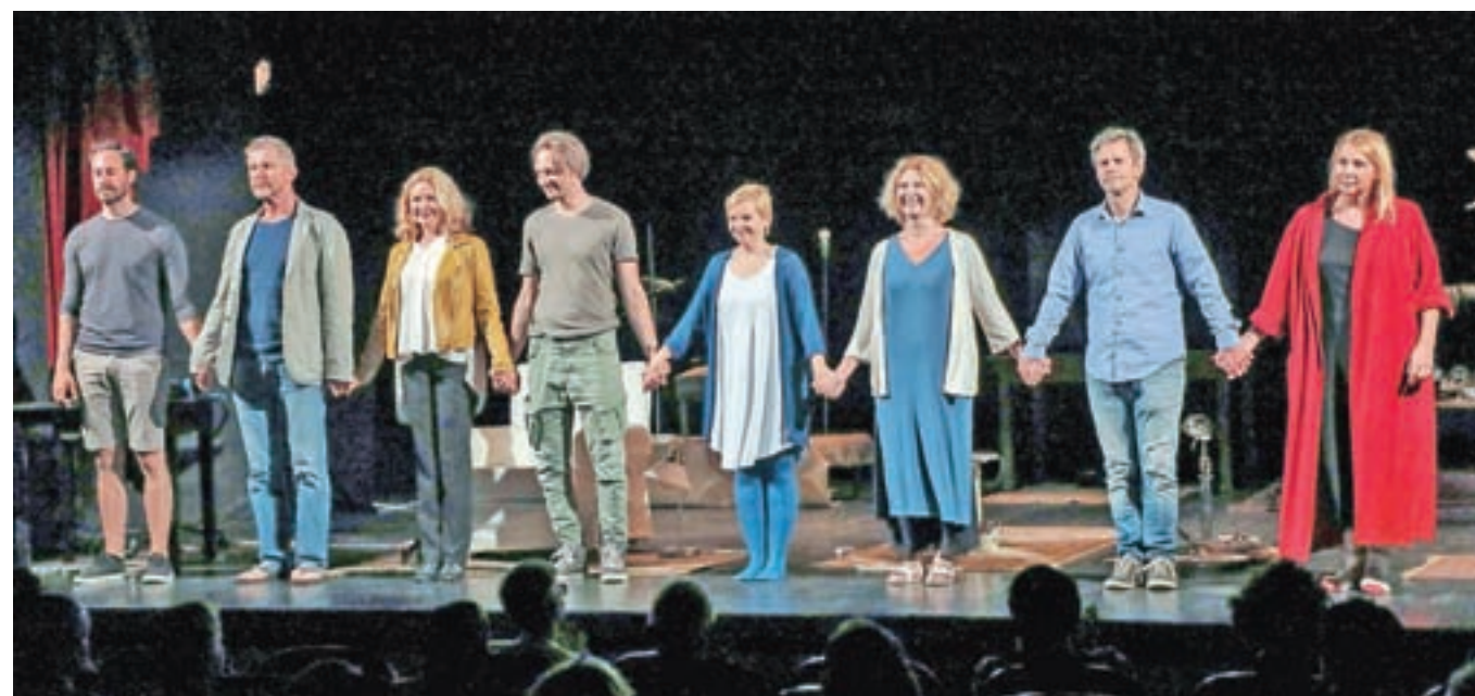
Monologi s kavča po besedilnih predlogah osmih sodobnih slovenskih dramatikov v odličnih izvedbah osmih igralcev Prešernovega gledališča so prejeli dolg aplavz.