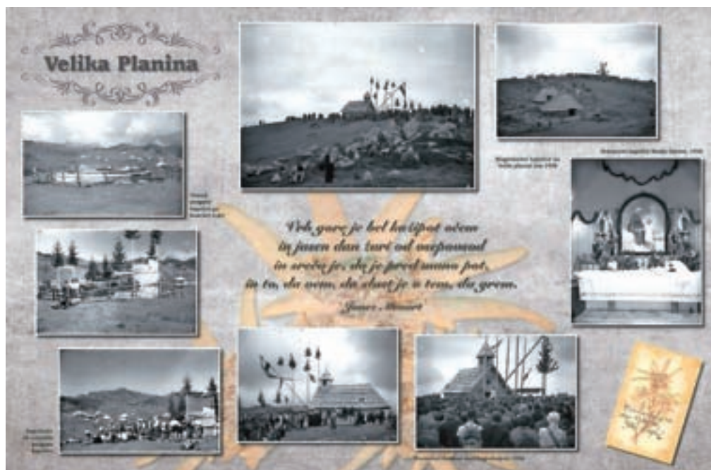
Velika planina, kot jo je v prvi polovici prejšnjega stoletja ovekovečil fotograf Peter Naglič

Razstava bo na ogled do konca avgusta v času uradnih ur Občine Kamnik.