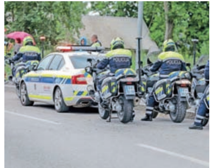
Policisti si želijo stabilnega stanja varnosti cestnega prometa ter zmanjševanja števila mrtvih in telesno poškodovanih v prometnih nesrečah. / Foto: Tina Dokl

Policisti tudi pravijo, da je njihovo delo na področju prometne varnosti