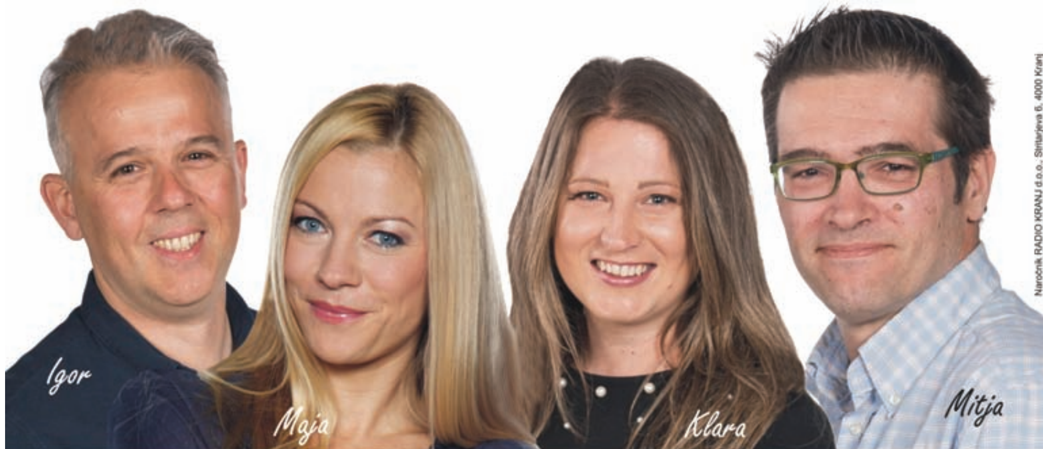
Naročnik RADIO KRANJ d.o.o., Siltarjeva 6, 4000 Kranj

Rozman bus vse svoje stranke obvešča, da zaradi epidemije novega koronavirusa in državnih uredb, ki jih je v teh izrednih pogojih treba spoštovati, začasno odpovedujejo vse turistične prevoze. Strankam se zahvaljujejo za dosedanje zaupanje in jim sporočajo, da se spet srečajo, ko bo epidemija mimo. Ostanite zdravi! www.rozmanbus.si