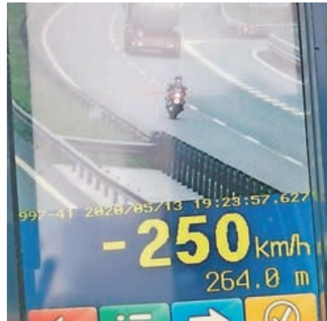
Med prehitrimi vozniki, ki so se v sredo ujeli v policijski radar, je izstopal motorist, ki je na avtocesti močno privil na plin.

»Verjamemo, da nihče od teh prehitrih voznikov tudi ni razmišljal, da na avtocesto občasno zaidejo tudi živali in v takem primeru to ne bo usodno samo za žival, ampak tudi zanje. In samo upamo lahko, da se v nesreči ne znajdejo še drugi povsem nedolžni udeleženci,« so še sporočili policisti, ki voznike prosijo, naj se izogibajo takšnim dejanjem in upoštevajo, da je voznik tisti, ki najbolj vpliva na varnost v prometu in tudi nosi največjo mero tveganja. »Kdor tega ne razume, naj uporablja javni prevoz,« so pristavili.