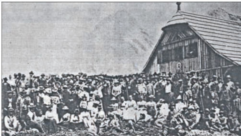
Češko kočo so odprli leta 1900.

»Iz otroštva se spomnim, da smo v Češki koči preživeli vsa poletja, s kolegi na smučarskih treningih. Takrat je bil še do konca julija sneg na Spodnjih Ravneh, avgusta pa smo hodili smučati na Zgornje Ravni. Kot najstnik pa sem že začel pomagati 'atku' pri oskrbi koče, kar me je zaznamovalo za vse življenje. Ko sem ponotranjil in 'atkov' zglede oskrbnika in njegovo delo z ljudmi, odnos do njih, kako se je znal vanje vživeti, jim pomagati in svetovati, bil njihov sogovornik in spovednik ... to ti zleze pod kožo in postane neka vrednota. Ko 'atek' zaradi boleznih ni več zmož, sva z ženo Polono leta 1997 za pet let prevzela oskrbnišvo Češke koče. To je bila zelo dobra izkušnja, ki nama je koristila tudi pozneje, da sva znala prepoznati potencial Šenkove domačije, kjer se zdaj ukvarjava s turizmom,« pove sogovornik. Za njim je oskrbo češke koče prevzela sestra Irma, za njo sva kinja Karmen, nato bratranec Tone, zdaj je oskrbnica znova Karmen. Če se malo