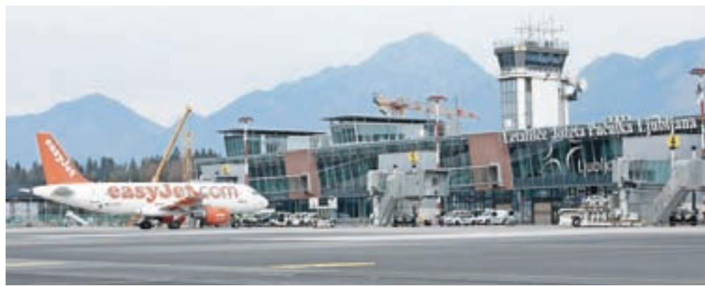
Prevozniki se bodo na letališče postopoma vračali od junija dalje.

Kot so zapisali na vladni strani, so države sprejele ukrepe, po katerih se morajo ravnati tako državljani pri vrnitvi iz tujine kot tudi tujci, ko pridejo na območje posamezne države. »Ker navedeni ukrepi sami po sebi vplivajo na opravljanje mednarodnih zračnih prevozov potnikov in se letalski operatorji še ne odločajo za njihovo opravljanje, saj s strani potnikov zaradi epidemije ni povpraševanja, ukrep prepovedi opravljanja mednarodnih zračnih prevozov