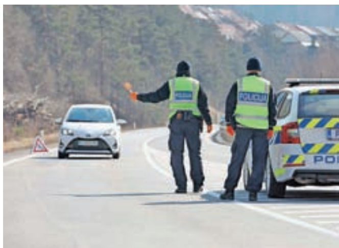
Policisti so v slabem mesecu in pol kontrole gibanja in zbiranja izvedli na več kot 142 tisoč javnih krajih.

zbiranja na javnih krajih. Izdali so 5.314 opozoril ali ukazov po zakonu o nalogah in pooblastilih policije, zdravstvenemu inšpektoratu so podali 6.670 predlogov za začetek postopka o prekršku, izrekli pa so tudi osemdeset predlogov prekrška po 22. členu zakona o javnem redu in miru, ki govori o neupoštevanju zakonitega ukrepa uradnih oseb. Kontrole so policisti izvedli na več kot 142 tisoč različnih javnih krajih.