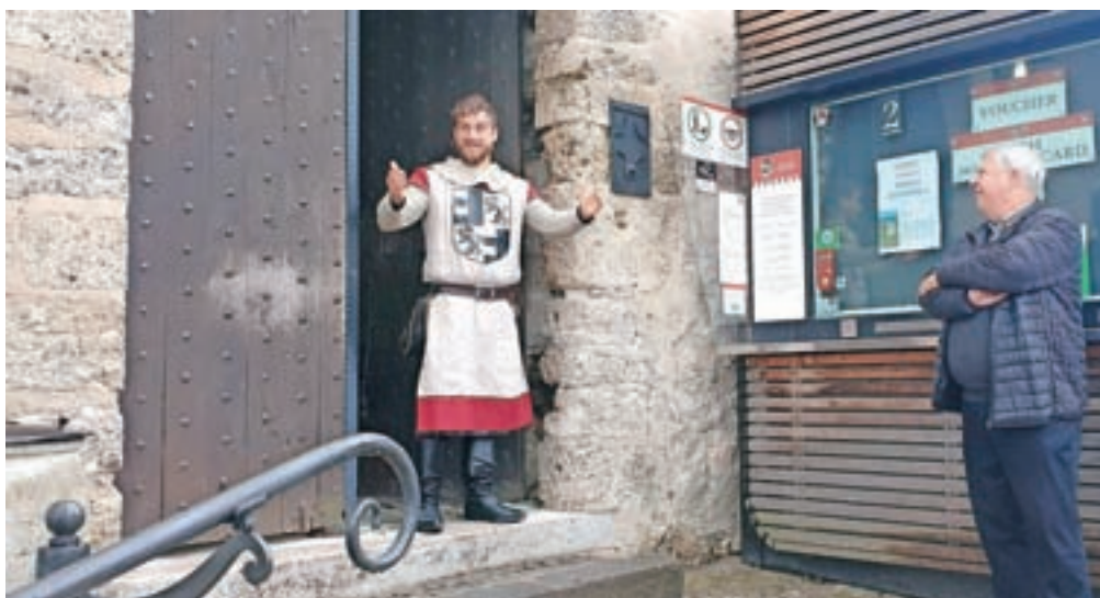
Vrata Blejskega gradu so od včeraj spet odprta.

V začetku tedna so se na blejske ulice vrnili fijakarji, od včeraj je spet odprt Blejski grad, v ponedeljek pa bodo na jezero spet zaplule pletne, ki bodo prve obiskovalce po dveh mesecih odpeljale tudi na Blejski otok. Od danes je za obiskovalce odprta tudi soteska Vintgar.