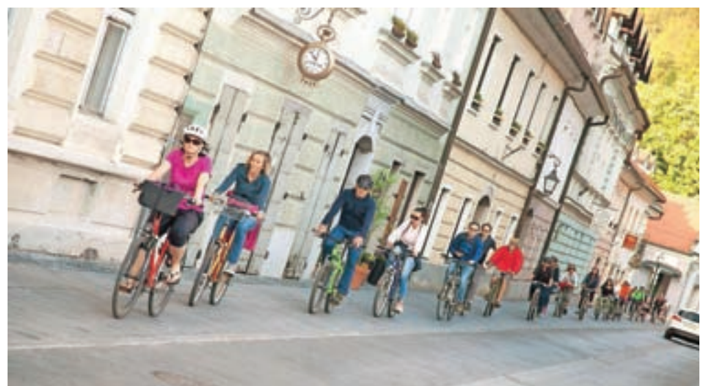
Mirno, s kroženjem po središču mesta, so kamniški kolesarji izražali nestrinjanje z vladnimi odločitvami.

Kamnik – Protesti na kolesih, ki so jih sprožili nekateri vladni ukrepi v boju proti koronavirusu, predvsem pa dogajanje okrog nakupa zaščitne opreme, so se začeli v Ljubljani, v zadnjem času pa so se razširili tudi po drugih slovenskih mestih. Tako so že dva petka zapored kolesarji krožili tudi po središču Kamnika. Minuli petek, ko naj bi po ocenah policije v prestolnici protestiralo okoli 5500 ljudi, po nekaterih ocenah pa še dvakrat toliko, se je na Glavnem trgu zbralo kakšnih trideset Kamničanov in s kroženjem od Glavnega trga po Tomšičevi in Maistrovi ulici izražali svoje nestrinjanje. Protest je potekal mirno, večinoma