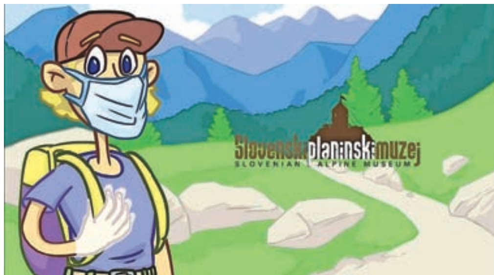
Planinko v času koronavirusa / Planinski muzej Slovenije

pom in obilico raznovrstnih dogodkov, letos seveda prilagojenih ukrepom zoper širjenje koronavirusa. Letos bo torej večji poudarek tudi na virtualnem obeležju #IMD2020. V ICOM Slovenija namreč menijo, da je poslanstvo muzejev, da se odzivajo na družbena dogajanja in da to poslanstvo slovenski muzeji tudi na inovativne načine uresničujejo, zato bodo javnosti predstavili svoje projekte in dobre prakse, ki se nanašajo na enakost, raznolikost in inkluzivnost ranljivih skupin. Muzeji in galerije bodo predstavljeni v posebni virtualni knjižici, ki bo v ponedeljek objavljena na spletni strani ICOM Slovenija ter deljena na družbenih omrežjih vseh sodelujočih. Vsak muzej bo svoj projekt predstavil tudi v okviru