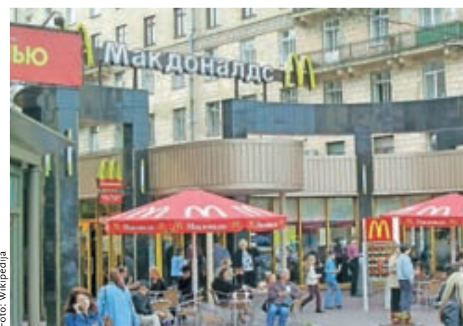
Družba McDonald's je sama po sebi simbol globalizacije. Na sliki restavracija te družbe v Sankt Peterburgu, Rusija.