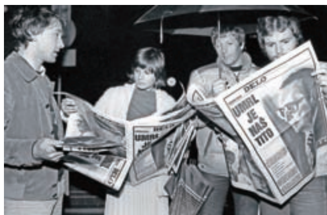
Posebna izdaja časopisa Delo; Ljubljana, 5. maj 1980

Že v prvih mesecih leta 1980 so jugoslovanski in