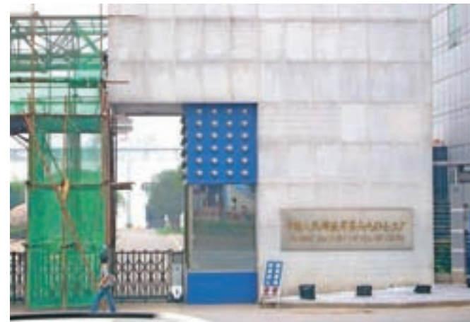
Strogo zavarovani vhod v vojaško tovarno št. 6907 v Wuhanu, ki sodi pod komando Kitajske ljudske armade. Kaj v njej proizvajajo, se seveda ne ve.