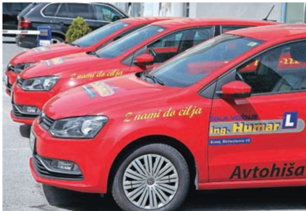
Po približno dveh mesecih se v ponedeljek, 18. maja, znova odpirajo avtošole. Obenem je vlada do 30. junija podaljšala veljavnost voznških dovoljenj, ki zaradi dosedanje prepovedi potečejo od 18. marca do 17. maja. Slika je simbolna.

In kako do zobozdravnika? Kot je pojasnil dr. Pavlovič,