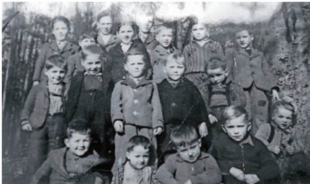
Mošnjejski otroci v izgnanstvu v Nemčiji

Mošnjani so se bali, da bodo vse postrelili, če ne vseh, vsaj moške. Na koncu so se odločili, da vas izpraznijo in požgejo nekaj hiš, devet družin, katerih sinovi, 16 jih je bilo skupaj, so bili prisilno mobilizirani v nemško vojsko, pa je moralo v 48 urah zapustiti domove in oditi – kamorkoli. Dne 15. aprila so nato Nemci požgali osem stanovanjskih hiš in 13 gospodarskih poslopij.