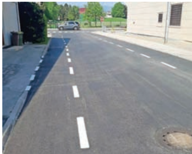
Močno poškodovano vozišče na Ulici XXXI. divizije so obnovili.

Kranj – V okviru rednega vzdrževanja cest so na kranjski občini poskrbeli za obnovo močno poškodovanega vozišča na Ulici XXXI. divizije. Asphalt je bil namreč uničen, v času deževja so zaradi posledic nastajale velike luže, tudi do deset centimetrov pa so bili dvignjeni pokrovi jaškov. Na tej lokaciji je sicer potrebna obnova večine komunalnih vodov in to bodo v okviru prihodnjih proračunov v kranjski občini tudi izvedli. Ker je bila obnova vozišča zares nujna, pa niso čakali na celostno urejanje ceste oziroma sredstva zanj, pač pa so težavo za nekaj let premostili v okviru rednega vzdrževanja cest.