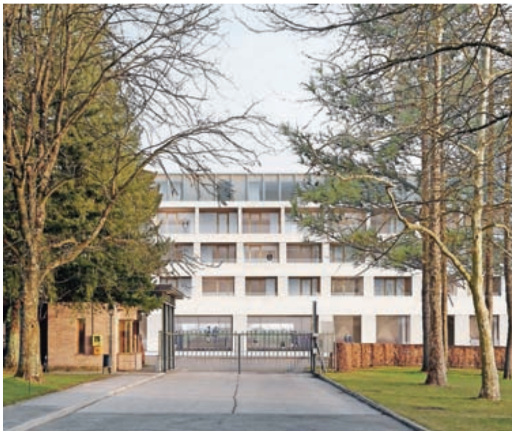
Hotel na Brdu naj bi po prvotnih načrtih temeljito prenovili, zdaj pa je jasno, da bo prenova potekala le v manjšem obsegu.

Na nov razpis je prispele šest ponudb, njihove vrednosti pa so se skupaj z