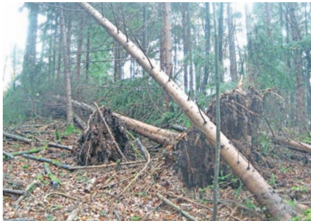
V gozdovih med Kranjem in Brnikom je veter poškodoval okoli petdeset tisoč kubičnih metrov drevja.

Cena hlodovine je močno padla, pri kubičnem metru tudi za dvajset evrov in več, odvoz lesa pa po krajšem zastoju pred velikonočnimi prazniki spet poteka normalno.