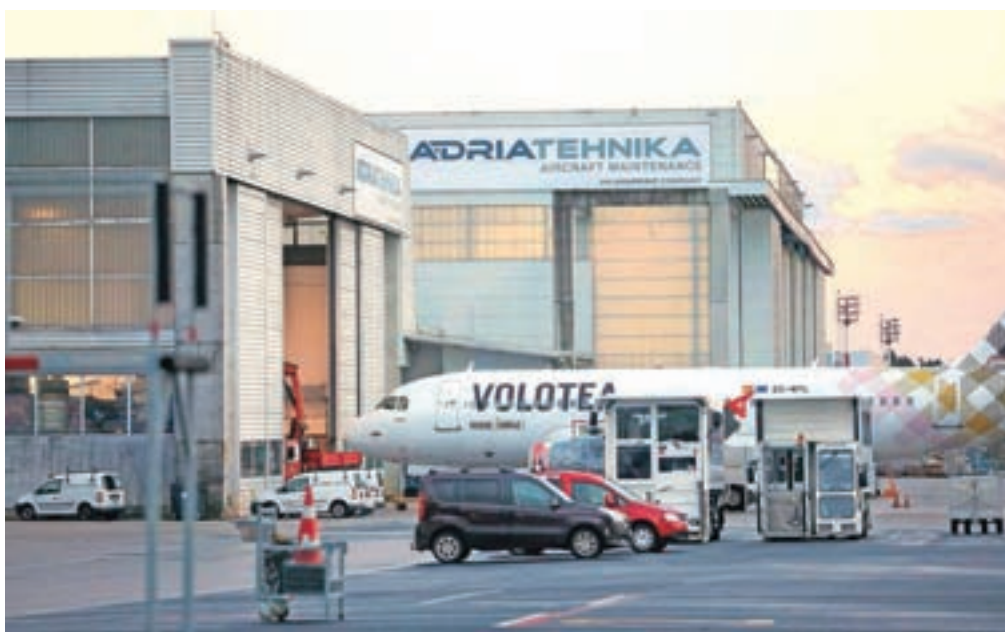
Adria Tehnika posluje neprekinjeno tudi med epidemijo covid-19.

»Tudi naša družba se kot druga podjetja srečuje z okoliščinami ter posledicami epidemije. Dnevno se skušamo optimalno prilagoditi in komunicirati z dobavitelji