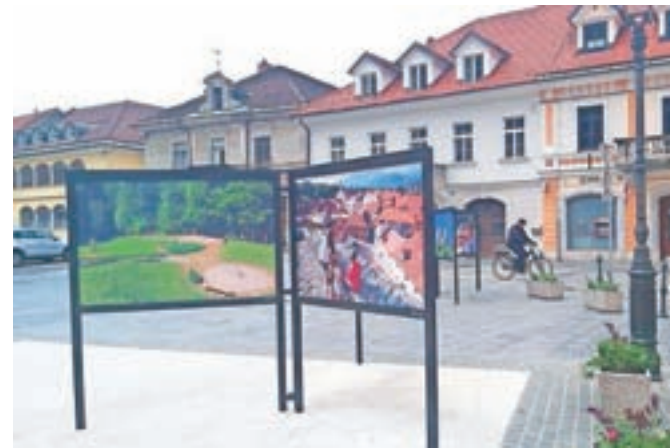
Kamniške turistične znamenitosti so te dni na ogled na razstavi.

Kamnik – Sodelavci Zavoda za turizem, šport in kulturo Kamnik so te dni na Glavnem trgu v središču mesta postavili razstavo živobarvnih fotografij s podobami kamniškega turizma – Velike planine, Arboretuma, Term Snovik, Mekinjskega samostana, doline Kamniške Bistrice, kamniških gora in mnogih drugih. Z razstavo želijo poživiti dogajanje v središču mesta, kjer zaradi epidemije še vedno ni dogodkov, hkrati pa obiskovalce navdušiti za turistične destinacije v občini, ki so že ali pa v prihodnjih dneh bodo znova dostopne.