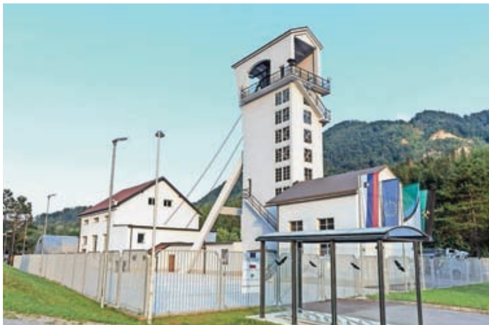
Pred Rudarskim muzejem Zagorje / Rudarski muzej Zagorje

V Podzemlju Pece obiskovalce na zanimiv način seznanijo z dolgoletno tradicijo rudarjenja in predelovalno industrijo, ki se je tu posledično razvila. V rudnik se lahko popeljejo s pravim rudarskim vlakom, gorskim kolesom ali