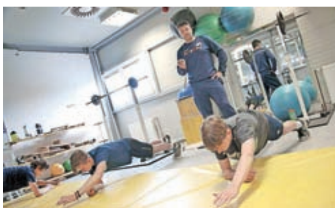
Hokejisti Triglava so se po dveh mesecih ta teden spet zbrali na skupnih treningih.

Kranj – Tako kot za večino športnikov so bili zadnji tedni zaradi epidemije covid-19 precej drugačni tudi za hokejiste kranjskega Triglava, ki so si obetali, da bodo sezono zaključili z novimi uspehi, ostali pa so brez tekmovanj in skupnih treningov. »Glede na to, da smo bili v zaključnem delu tekmovanj, je za nas prekinitev marca pomenila nekakšen šok. S tremi selekcijami smo se namreč prek četrtfinalnih obračunov uvrstili v polfinale in imeli smo res visoka pričakovanja. Člani so namreč v četrtfinalu mednarodne lige (IHL) premagali Celjane, mladinci, ki so prav tako tekmovali v IHL in so tekme šteje tudi za državno prvenstvo, so v polfinalu premagali Olimpijo, selekcija do 13 let pa se je v polfinale uvrstila z zmago nad Bledom. Žal nam s prekinitvijo tekmovanj ni bilo