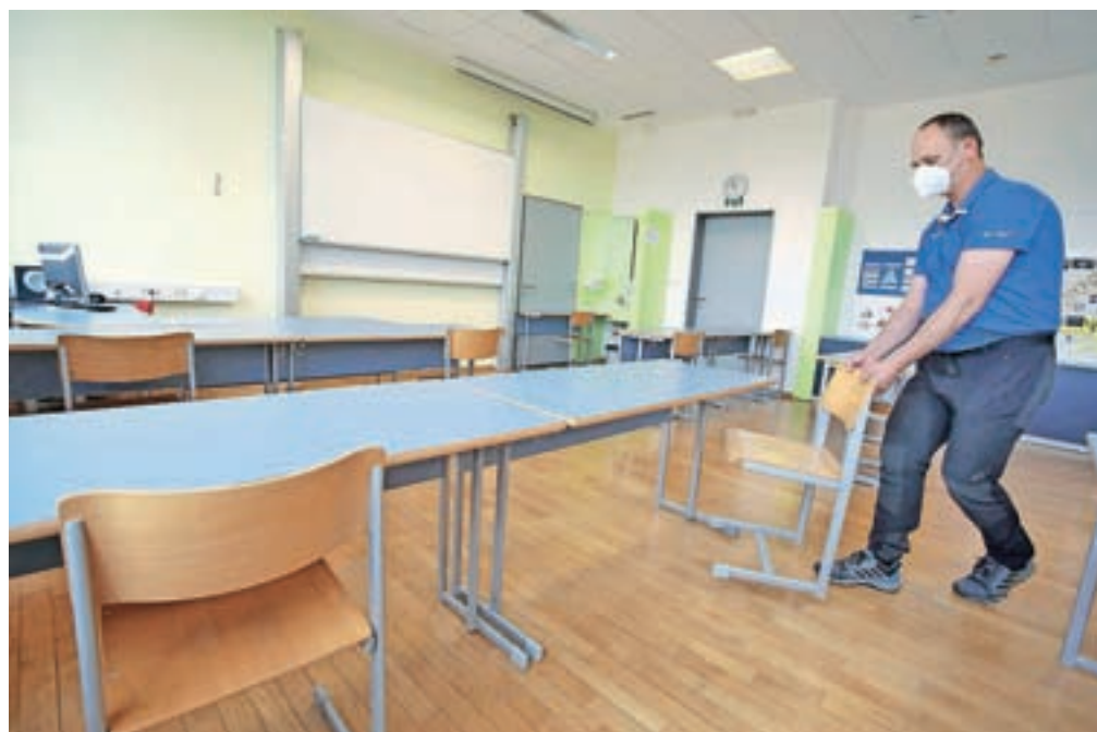
V ponedeljek se bodo v šolske klopi vrnilo tudi dijaki zaključnih letnikov. Na odprtje šole se že pripravljajo tudi v Gimnaziji Franceta Prešerna Kranj.