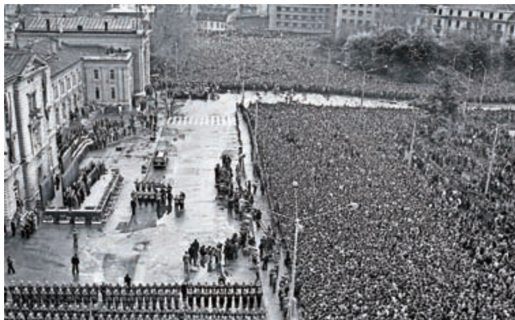
Pogled na dogajanje in nepregledno množico ljudi pred glavno železniško postajo v Beogradu po prihodu Modrega vlaka; Beograd, Srbija, 5. maj 1980

meseca pred Titovo smrtjo, ko se je bolnikovo stanje kritično poslabšalo. V muzeju hranijo tudi njegovo posmrtno masko, ki ji je na razstavi namenjeno posebno mesto, posebna pa je tudi njena zgodba. Razstava bo na ogled do 28. junija