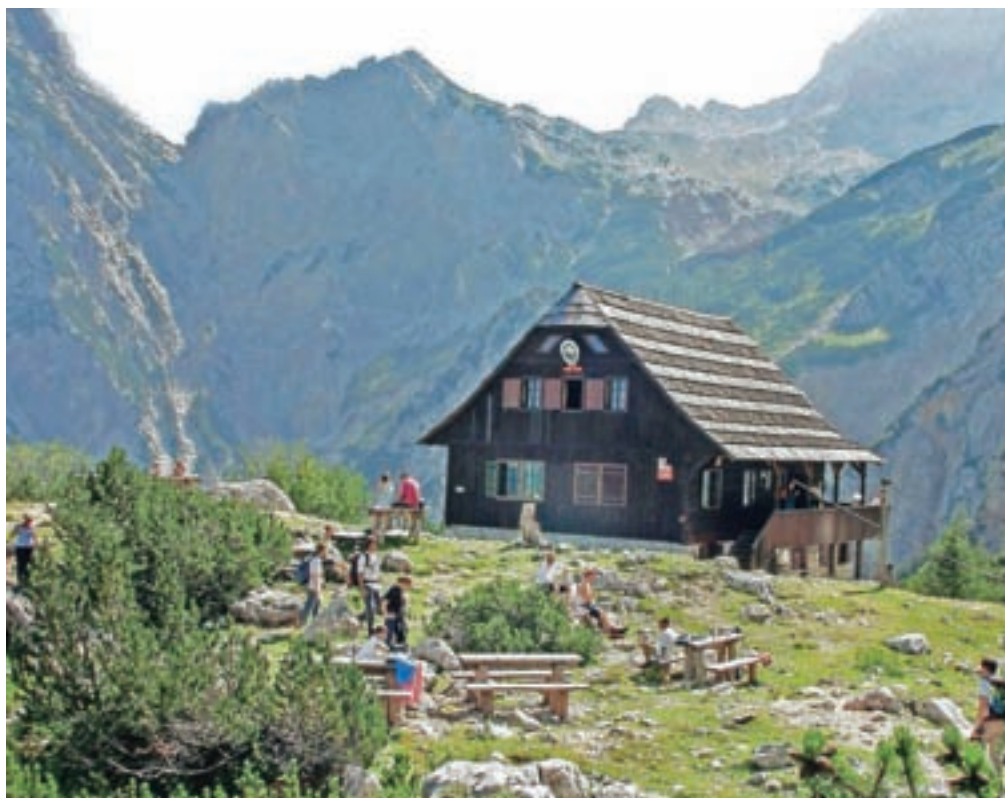
Podoba Češke koče že vrsto let ostaja enaka.

pošalimo, je v Češki koči že desetletja oskrbnik kateri od Karničarjev. Gre za družino, zaljubljeno v gore, aktivno pri domačem planinskem društvu, zato se temu ne gre čuditi.