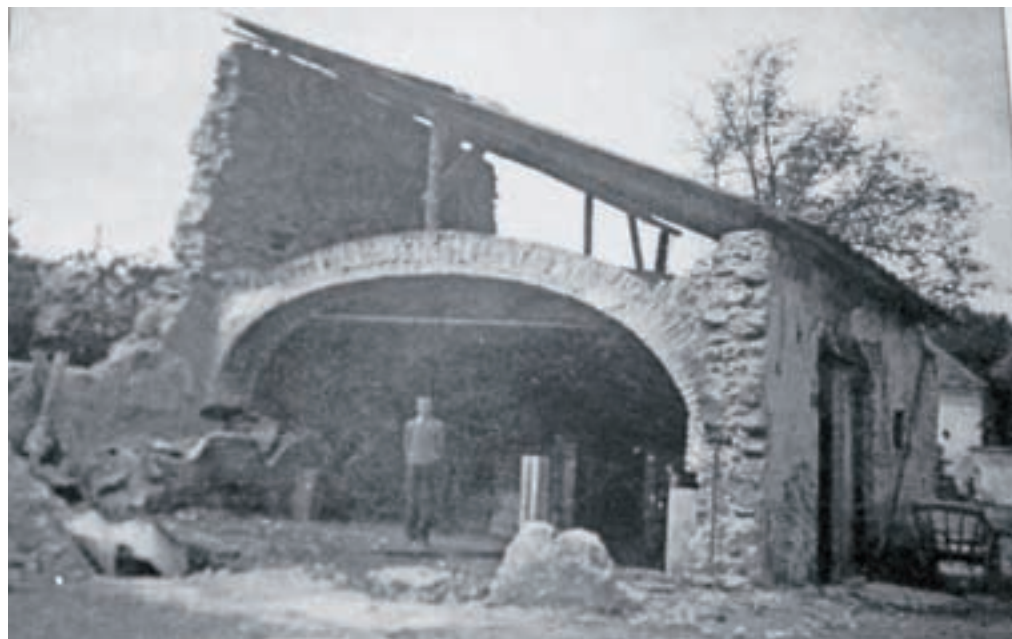
Leta 1944 požgane Mošnje

Izgnanci iz Mošenj so bili internirani v dve taborišči na Bavarsko, na pretežno kmetijsko področje, okoli šestdeset kilometrov južno od Münchna. Po koncu vojne, maja 1945, se je iz Nemčije vrnilo vseh 29 družin. »Ena starejša ženska je umrla, rodil pa se je en fantek, tako da smo se vrnili v istem številu, kot smo odšli,« še navaja Pristov. Danes je živih še 27 nekdanjih izgnancev.