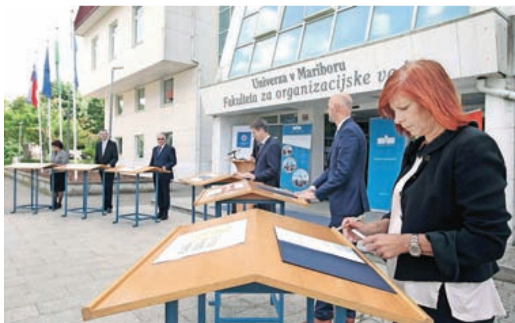
Včeraj so na Zlatem polju podpisali pogodbo za projekt celovite energetske sanacije petih izobraževalnih ustanov.

Včeraj so na Zlatem polju partnerji slovesno podpisali pogodbo o javno-zasebnem partnerstvu za projekt celovite energetske sanacije izobraževalnih ustanov na tej lokaciji.