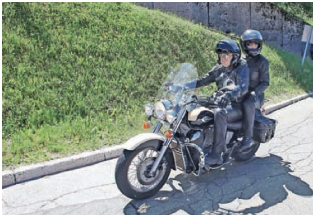
Nesreče motoristov so najpogostejše ob koncih tedna in v popoldanskih urah, kar je povezano z življenjskim slogom motoristov – vožnja z motornim kolesom je prej hobi kot nuja, ugotavljajo na agenciji za varnost prometa.

Motoristi že spadajo med ranljivejše skupine udeležencev, saj so zaradi značilnosti motorja slabše vidni in opazni, pogosto vozijo prehitro oziroma jih drugi vozniki spregledajo ali odvzamejo prednost. V zimskih mesecih tudi nekoliko upade sposobnost obvladovanja motorja, zato se je treba na vožnjo z motorjem temeljito pripraviti, predvsem pa počakati na varne cestne razmere, opozarjajo na AVP. Vožnja z motociklom je