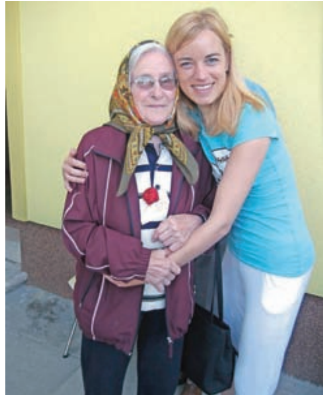
Še bolj kot po številkah želi Karitas ostati prepoznavna po prijaznem in odprtem odnosu do ljudi, srčnosti in spoštovanju človekovega dostojanstva.

»V slovenskem prostoru je danes Karitas prepoznavna