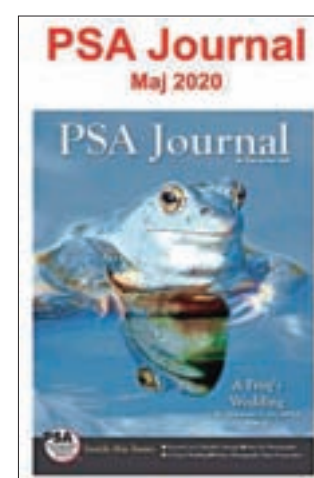
Na naslovnici je plavček iz okolice Veržeja.