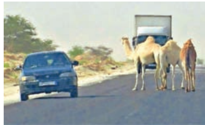
Kamele so običajne sopotnice cest v severovzhodni Afriki.

Reli pa ima tudi dobrodelno noto. Tako so v vasi Dindéfelo na jugu Senegala imeli poseben sprejem, na katerem so denar, ki so ga zaslužili s prodajo pijače, namenili gradnji vodovoda. »Organizator je tudi sicer imel poseben račun za ta dobrodel-