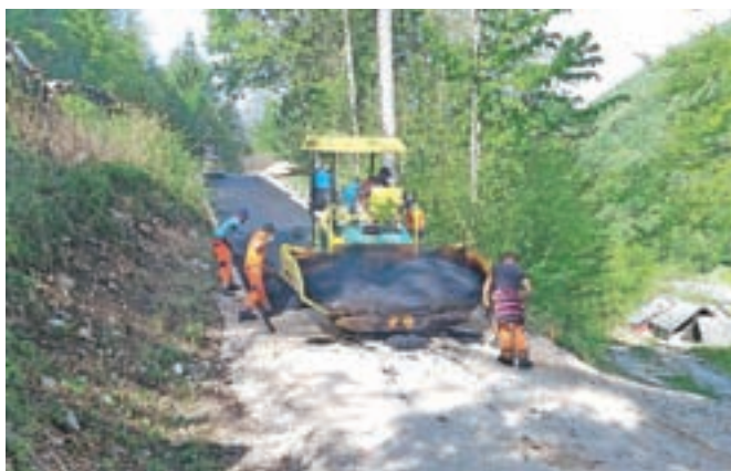
Asfaltiranje ceste Žaga–Podstudenc

Kamnik – V Šmarci je v polnem teku semaforizacija križišča pri nekdanji trgovini Tuš, s katero bodo omilili dosedanje zastoje ob priključevanju na državno cesto. »Z novo rešitvijo bomo pripomogli tudi k večji prometni varnosti, saj se bo poleg semaforizacije preuredila še cestna razsvetljava, dogradila se bo površina za pešce, obnovil se bo vodovod in uredil priključek lokalne ceste na državno. Za investicijo je bila z Direkcijo RS za infrastrukturo sklenjena sofinancerska pogodba. Decembra lani smo z izbranim izvajalcem podpisali gradbeno pogodbo, v aprilu pa smo začeli delati. Dela se bodo predvidoma zaključila konec maja, v tem času pa sta vzpostavljeni delni zapori regionalne in občinske ceste,« so nam naložbo predstavili na občini.