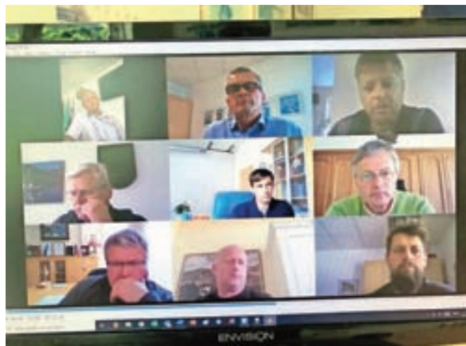
Župani so tokrat sestankovali virtualno.