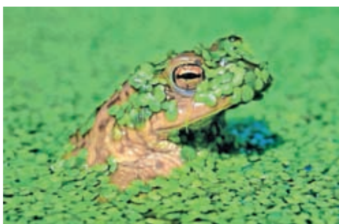
Fotografija krastače, za katero je Čufar prejel več kot petdeset nagrad

Čufar je po osvojenih nagradah eden najuspešnejših slovenskih fotografov. Lani je osvojil rekordnih 211 nagrad, večinoma v tujini, kot prvi slovenski fotograf je pri mednarodni fotografski organizaciji pridobil naziv Excellence FIAP diamant 3, že sedem let zapored nagrade osvaja na vseh kontinentih ... »Dobra slika je super, a dobri ljudje, ki sem jih spoznal ob fotografiranju, so pa še veliko več.«