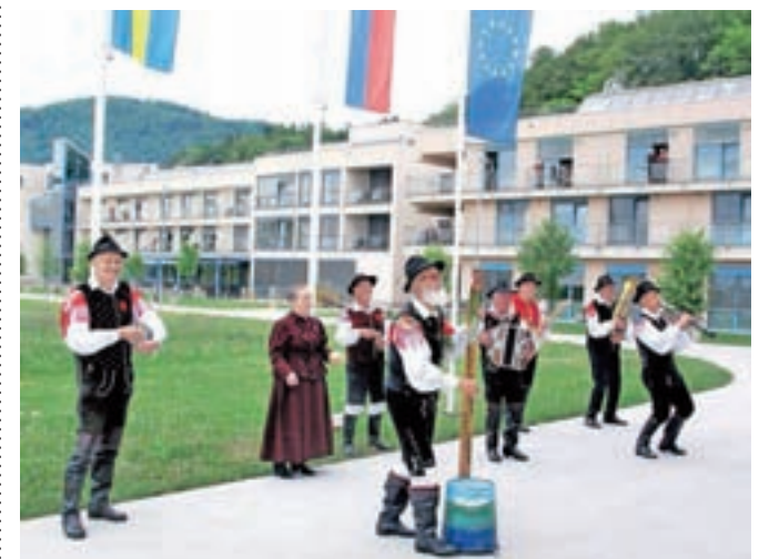
Cerkljanski gavnarji so popestrili dan stanovalcem doma starejših v Šmartnem pri Cerkljah.