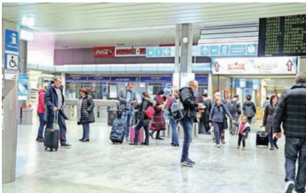
Takšni prizori gneče so na letališčih že dober mesec in pol precejšnja redkost.

Da morajo prevozniki v primeru odpovedi ponuditi nadomestno vozovnico ali povrniti denar, menijo tudi na Zvezi potrošnikov: