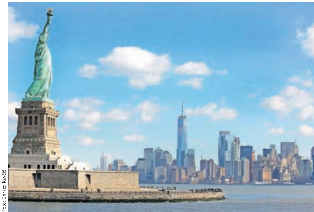
Organizatorji potovanj bi po predlogu vlade potrošnikom namesto vračila denarja lahko izdali vrednotnice, ki bi jih bilo mogoče unovčiti v štiriindvajsetih mesecih od izdaje.

Po prepričanju ZPS je nesprejemljivo, da bi se finančna kriza turističnih agencij reševala na plečih potrošnikov, ki so že s krizo finančno prizadeti. Ob tem opozarjajo, da za določene skupine potrošnikov vrednotnice sploh niso rešitev. Med njimi je rizična skupina