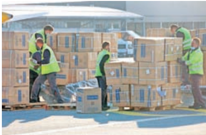
Zahtevo za odreditev parlamentarne komisije, ki bi preiskovala nabavo zaščitne opreme, sta v torek vložili tako koalicijska kot opozicijska.