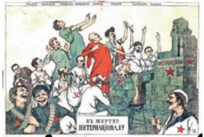
Beloruski antikomunistični propagandni plakat iz let 1918–1919, na katerem Lenin in njegovi boljševiki žrtvujejo Rusijo Marxu in Internacionali