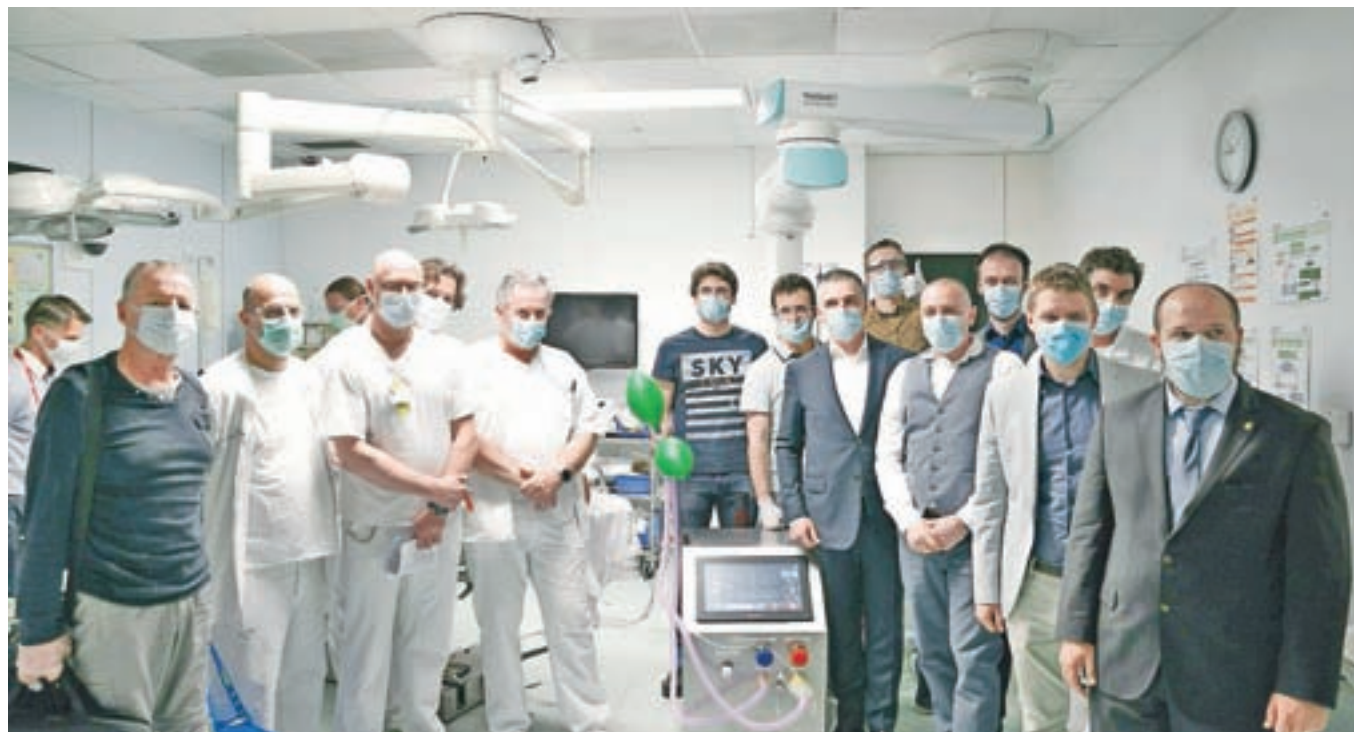
S predstavitvijo prototipa na UKC Ljubljana so končali prvo fazo razvoja.