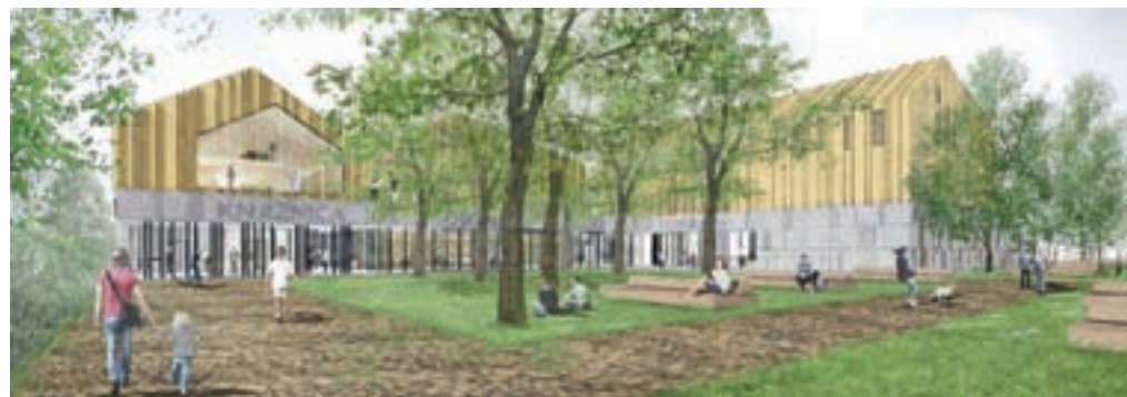
Kopitarjev center, kot so ga zasnovali v podjetju Dekleva Gregorič arhitekti.

Za občino, ki v letošnjem proračunu načrtuje 4,9 milijona evrov prihodkov, projekt, katerega skupno vrednost ocenjujejo na 15 milijonov, predstavlja precejšen finančni zalogaj. Za načrte in različno dokumentacijo so doslej namenili slab milijon evrov, za letos imajo v načrtu razvojnih programov proračuna predvidenih še 260 tisočakov, za prihodnje leto pa dodatnih 13 milijonov evrov. Kot rečeno, pa si del sredstev obeatajo tudi od zasebnega partnerja.