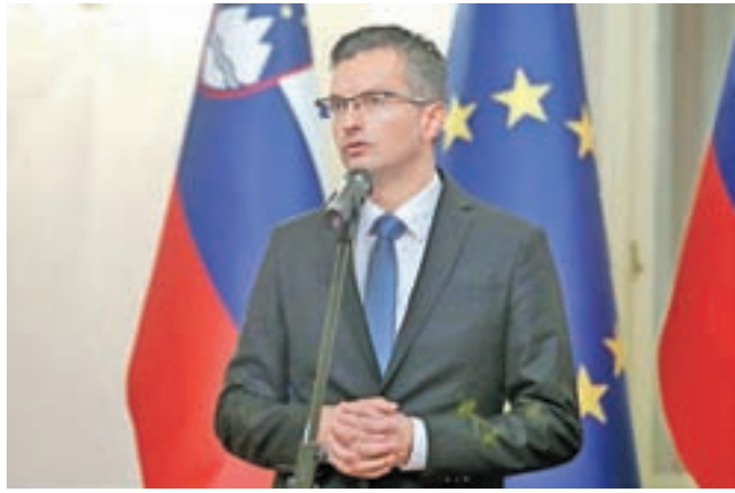
V poročilu o stanju in nabavah opreme za boj proti epidemiji covid-19 vlada nekdanjemu premierju Marjanu Šarcu očita, da je ignoriral opozorila o pomanjkanju zaščitne opreme.