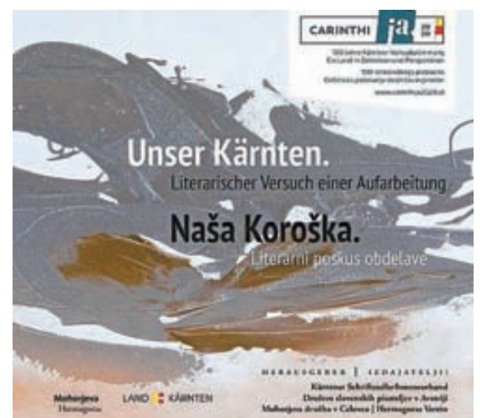
Naslovnica dvojezične antologije Naša Koroška/Unser Kärnten je pregled literarnega in likovnega ustvarjanja v deželi.