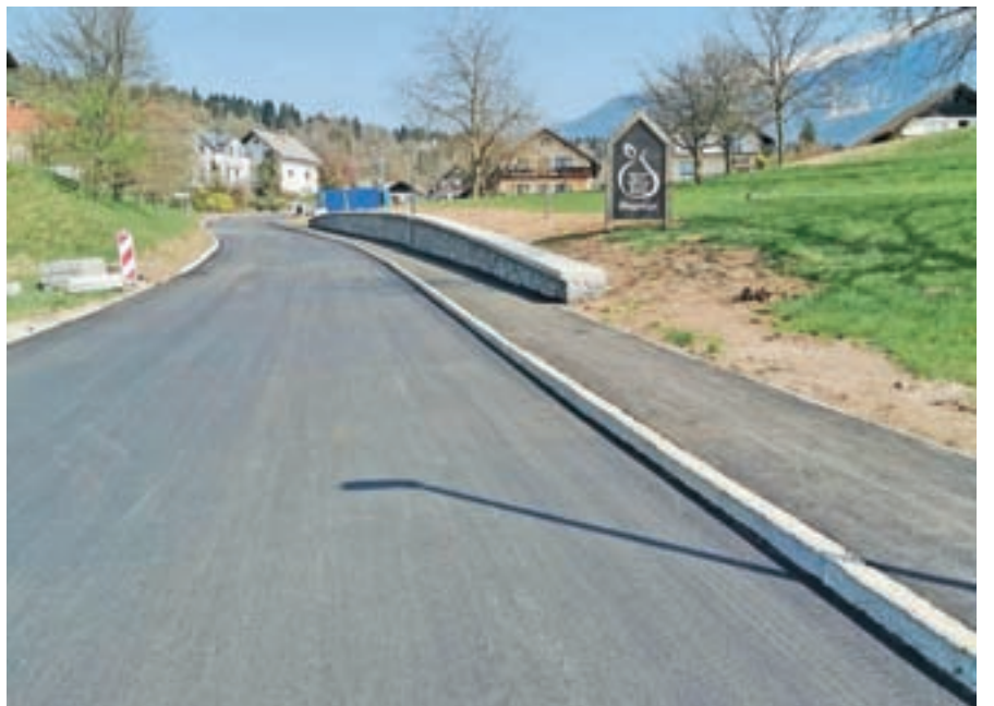
V Zasipu so obnovili komunalno infrastrukturo ter uredili pločnik in cesto.

Poleg Občine Bled sta pri tej investiciji sodelovala tudi Elektro Gorenjska in Telekom, ki sta v cestno telo položila svojo komunalno infrastrukturo. Dela se v teh dneh zaključujejo, celotna vrednost investicije znaša 220.000 evrov z DDV. Ob tem se Občina Bled še enkrat zahvaljuje vsem občanom in občankam ob trasi izgradnje ter občanom ob obvozih za razumevanje in potrpežljivost.