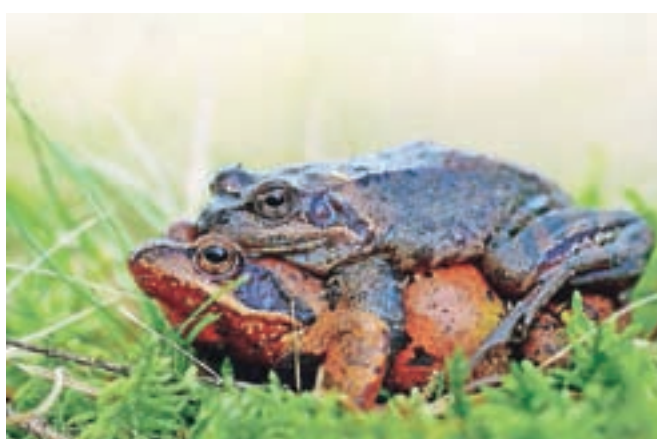
Sekulji, ki ju je fotografiral ob nekdanjem mokrišču pri silosih v Dolenji vasi