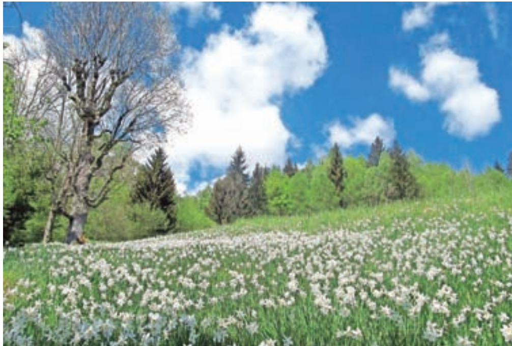
Travniki v Plavškem Rovtu so posuti z narcisami.

pa tako domačini kot Turističnoinformacijski center Jesenice obiskovalce prosijo, da hodijo ob robu travnikov in po poteh in naj ne trgajo cvetic, ki so zaščitene in jih ni dovoljeno zavestno uničevati, trgati ter rezati. Da bi ohranili to znamenitost, ki v maju vsako leto