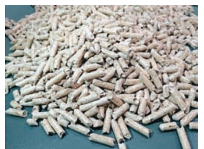
Pri nakupu lesnih peletov ne sme biti odločilna le cena, temveč njihova kakovost.

pravilna vlažnost surovine, ki mora biti med osem in devet odstotna, kar zahteva tudi standard. Za proizvodnjo kakovostnih peletov uporabljajo manj kakovosten ali celo odpadni les, predvsem žagovino in čiste sekance. »Pomembno je, da je les na žagarskem obratu olupljen, torej brez lubja, korenin, zemlje in peska, kar povzroča že prej omenjene težave. Uporabljeni les mora biti tudi primerno osušen in uležan, da dobi enotno strukturo,« pojasnjuje Šinkovec. Po sušenju žagovine sledi mletje do preseka največ 1,5 milimetra in nadalje peletiranje, kjer valji vtiskajo suho žagovino v matrico. »Zaradi velikega trenja v fazi peletiranja se molekule lignina razprejo, v nadaljnjem postopku pa vroči peleti potujejo v hladilnik, kjer se omenjene molekule lignina spet zaklenejo,