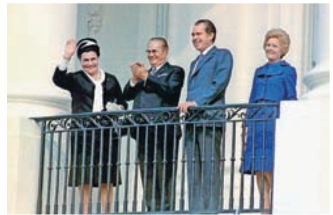
Predsednika Josip Broz Tito in Richard Nixon s soprogama v Beli hiši, 1971