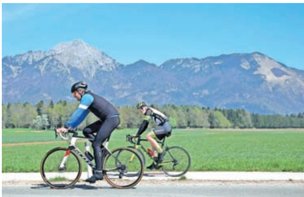
Kolesarjenju po matični občini se pridružujeta po novem tudi golf in joga ter še nekateri drugi športi, kot so tenis, badminton, balinanje.