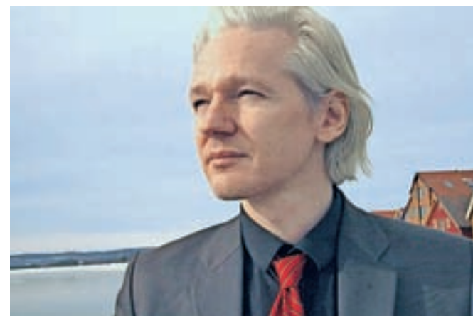
Julian Assange leta 2010, ko je bil še pravi lepotec. Desetletje pregona ga je postaralo, zdaj ga v zaporu ogroža še novi virus.