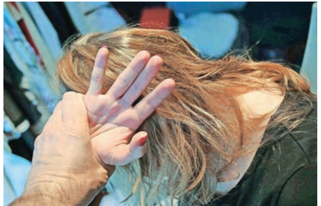
Povečan stres v teh časih prispeva tudi k porastu družinskega nasilja, katerega žrtve so najpogosteje ženske, otroci in starostniki.