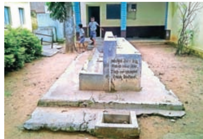
Umivanje rok z milom je velika civilizacijska pridobitev. Na sliki je korito za umivanje rok pred neko šolo v Indiji (okrožje Mysore, Karnataka).