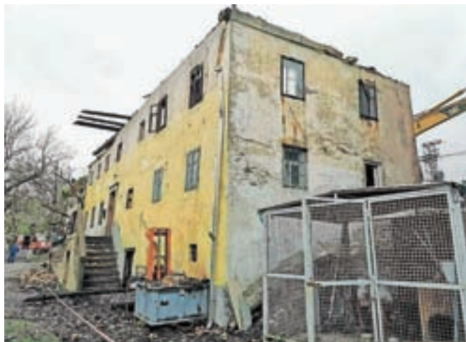
V torkovem požaru je v celoti zgorela starejša stanovanjska hiša.

V torek ob pol sedmih zjutraj je prišlo še do tlejnjega žaganja v silosu na Hotavljah. Gasilci s Hotavelj in Trebije so požar pogasili, na kraju pa so ostali domači gasilci, ki so žaganje prekopali in ohladili z vodo.