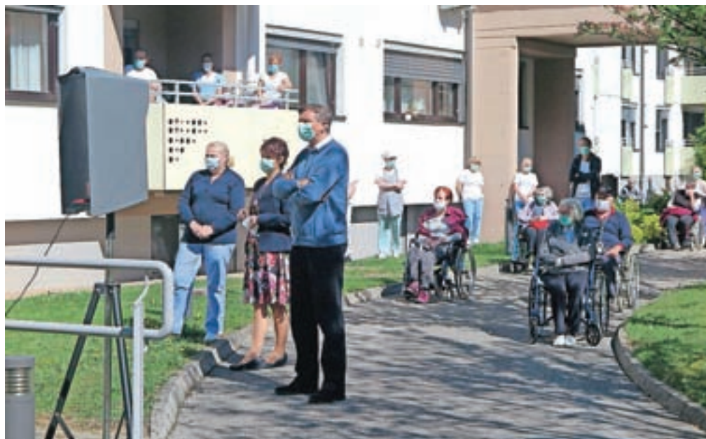
Predsednik države Borut Pahor je včeraj obiskal Dom starejših občanov Kamnik.

»Iskreno vam čestitam, da se vam je v vsem tem času uspelo izogniti okužbi, zato vodstvu doma ter vsemu osebju izrekam veliko spoštovanje. Želim si, da bi moj obisk razumeli kot izraz splošne spodbude, upanja in odgovornosti ter spoznanja, da