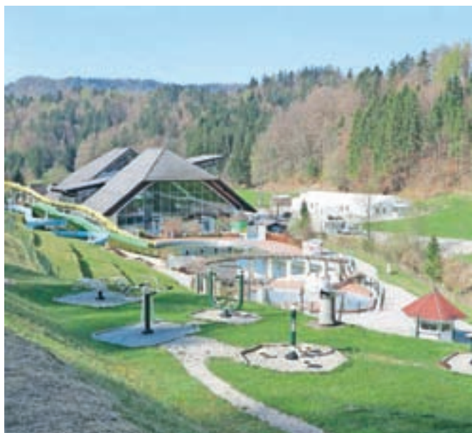
Terme Snovik so zaradi epidemije covid-19 zaprte že mesec dni; na prve goste upajo v začetku poletja.

Čas, ko so apartmaje in terme morali zapreti, bodo izkoristili za vzdrževalna dela. Urejajo tudi zelenjavni vrt in obdelujejo sadovnjak, vzdrževalna dela bodo izvedli tudi na bazenskem kompleksu in toboganih. Po načrtih pa poteka tudi gradnja večnamenske dvorane, ki naj bi bila končana do začeta poletne sezone.