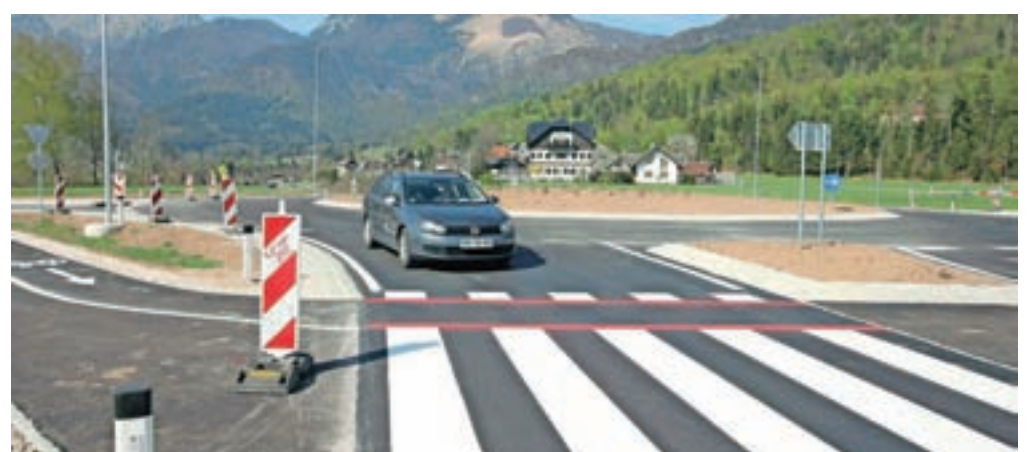
Krožno krožišče v Tupaličah je že skoraj dokončano.

obale jezera Črnava, ki je zdaj v naši lasti, za kar pričakujemo tudi evropska sredstva. Ukvarjamo se s pridobivanjem zemljišč za pločnik na relaciji Preddvor–Zgornja Bela in za kolesarsko povezavo Preddvor–Kranj,« navaja Roblek in med pomembnimi projekti navede tudi namakalni sistem za kmetijska zemljišča Preddvor – jug, ki ga načrtujejo skupaj s sosednjo Občino Šenčur. Ukvarjajo pa se tudi s tem, kako rešiti prostorsko stisko v vrtcu in šoli v Preddvoru in kako v ta sklop umestiti športno dvorano.