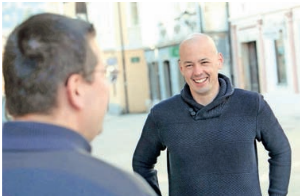
Škofjeloški župan Tine Radinja v pomenku z vodjo Civilne zaščite v občini Nikolajem Kržišnikom

Ob vsaki objavi novic na videu in ob vsakem javljanju je največ vprašanj o novostih, ki so bile sprejete tisti dan na državni ali občinski ravni. Z dodatnimi pojasnili