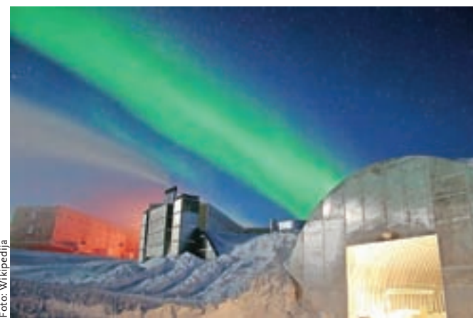
Neokužena ameriška raziskovalna postaja Amundsen-Scott ob polni luni v dolgi antarktični noči. Postaja je na levi, v sredini je elektrarna in desno mehanična delavnica.