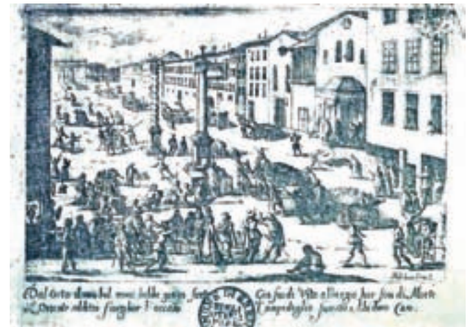
Piazza San Babila v Milanu med epidemijo kuge leta 1630, naslikal Melchiorre Gherardini