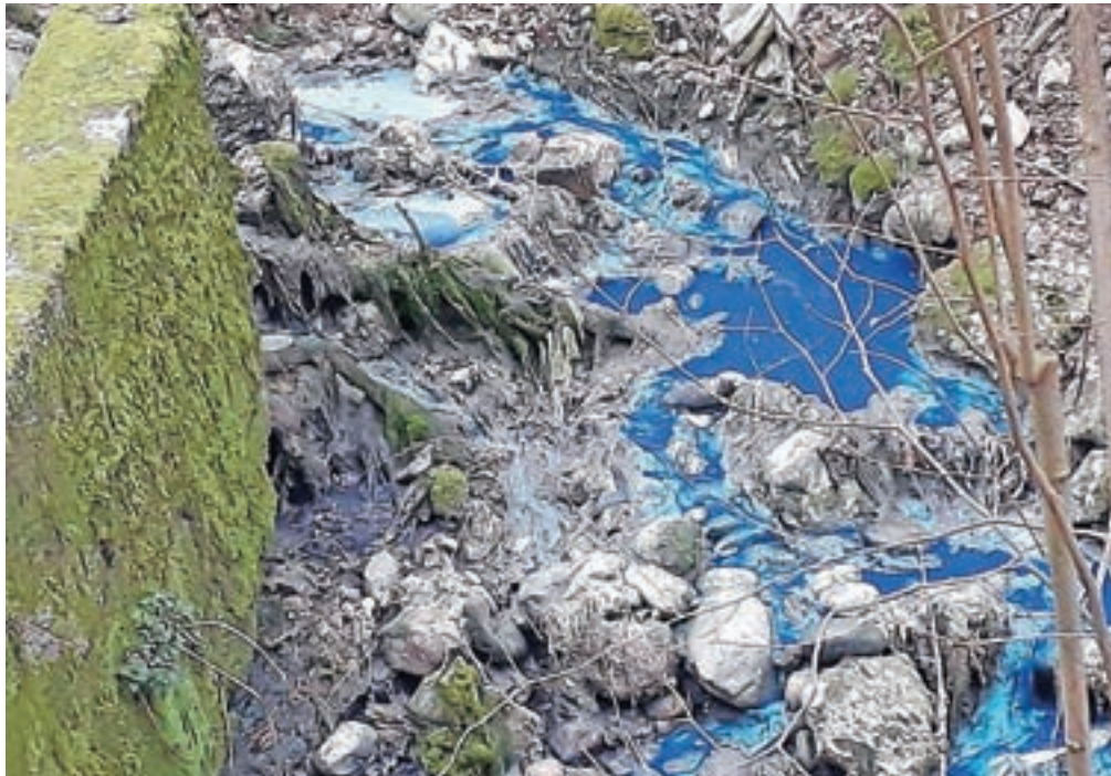
Nenavadno modra voda, ki je v soboto v Hrastju približno eno uro iztekala naravnost v reko Savo

Na inšpektoratu so razložili, da mora vsak, ki opazi, izve, povzroči ali ga neposredno ogrozi naravna ali druga nesreča oziroma drug pojav ali dogodek, pomemben za varstvo pred naravnimi in drugimi nesrečami, po zakonu o tem takoj obvestiti