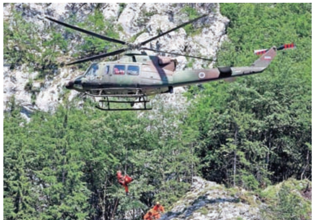
Truplo tujega planinca so v dolino prepeljali z vojaškim helikopterjem.

»V zadnjih nekaj dneh je to druga huda gorska nesreča na Gorenjskem, ko so morali posredovati gorski reševalci, helikopter in policija. Minuli konec tedna je čez zaledenel slap nad Jezerskim padel alpinist in se hudo poškodoval, v sredo pa je umrl še planinec na Triglavu,« poročajo policisti in