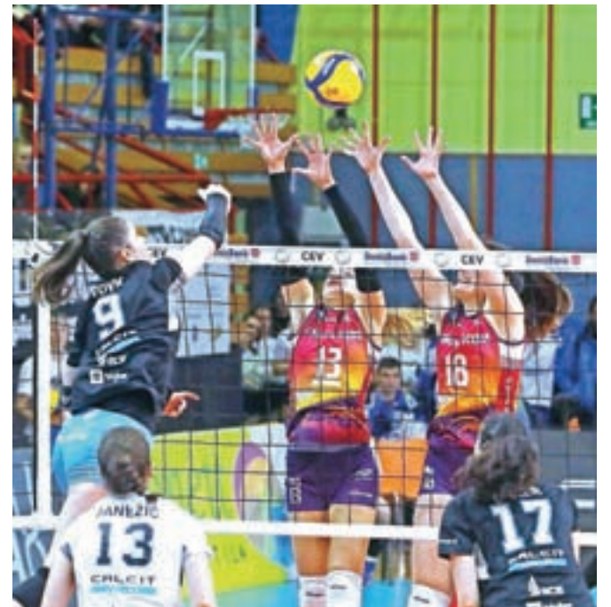
Odbojkarice kamniškega Calcita Volleyja (v ospredju) so v sezoni osvojile dve lovoriki. Slavile so v državnem prvenstvu in v srednjeevropski ligi. Proti največjim tekmicam iz Maribora pa so izgubile v finalu pokala (na sliki).

Calcitovke so v rednem delu zabeležile dvanajst zmag in le dva poraza, v modri skupini pa so ostale celo nepremagane. V četrtfinalu bi se morale pomeriti s krimovkami. Na začetku februarja so v slovenskem