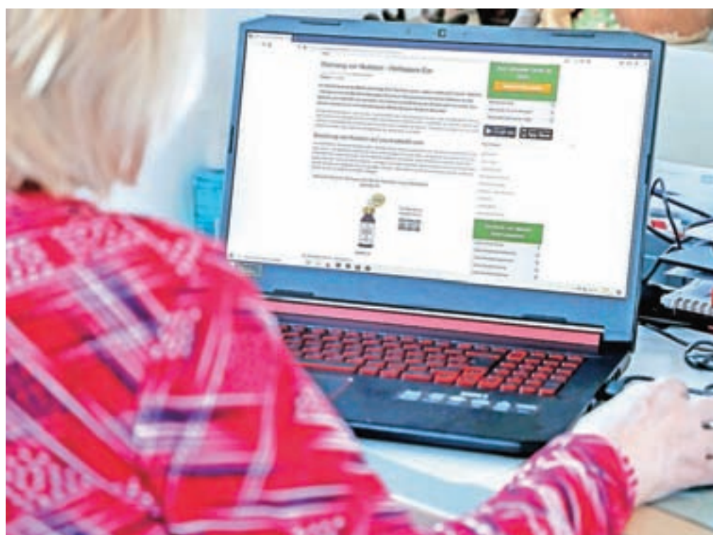
Tudi Watchlist Internet svari pred »čudežnimi« kapljicami za uho.