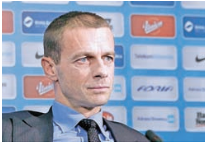
Predsednik Uefe Aleksander Čeferin je za donacijo zaščitnih mask poklical ustanovitelja spletnega trgovskega velikana Alibaba Jacka Maja.