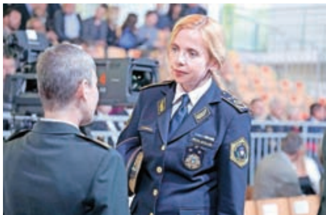
Nova vlada je že na ustanovni seji razrešila generalno direktorico policije Tatjano Bobnar in načelnico Generalštaba Slovenske vojske Alenko Ermenc.