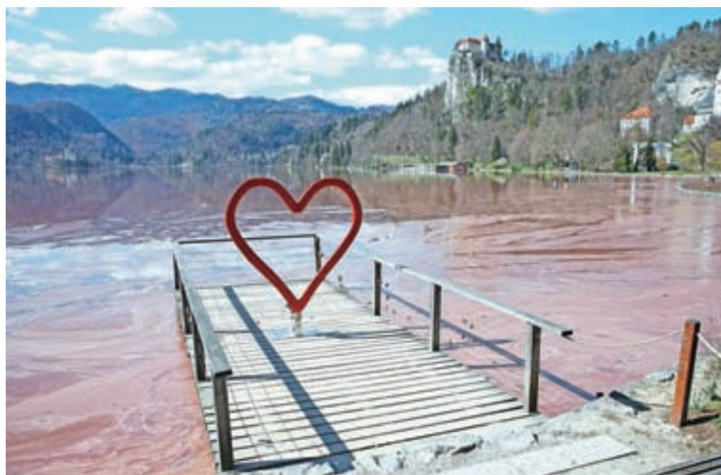
Blejsko jezero se je zaradi razrasta cianobakterij obarvalo rdeče.

Z javnim pismom je Občina Bled opozorila na izredno slabo stanje jezera. Kljub izrednim razmeram, ki ta čas vladajo v Sloveniji, so prepričani, da jezero potrebuje urgentno pomoč države.