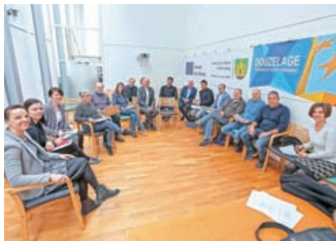
Organizacijski odbor za pripravo glavnega srečanja v projektu Mlajši za starejše v Škofji Loki se je sestel v začetku marca.

V okviru projekta je predvideno tudi glavno srečanje in istočasno potek generalne skupščine združenja Douzelage v Škofji Loki od 7. do 10. maja. »Priprave nadaljujemo in bo dokončna odločitev znana 15. aprila, ko bo tudi sporočena udeležencem in vsem organizatorjem. Glede na potek dogodkov bo najbrž