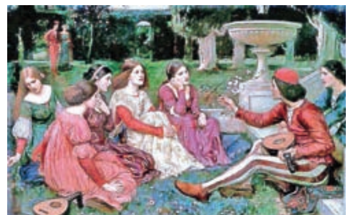
Osebe, ki si v Boccacciovem Dekameronu pripovedujejo pikantne zgodbe, so begunci pred kugo, pa se imajo prav lepo ... Naslikal J. W. Waterhouse, 1916.