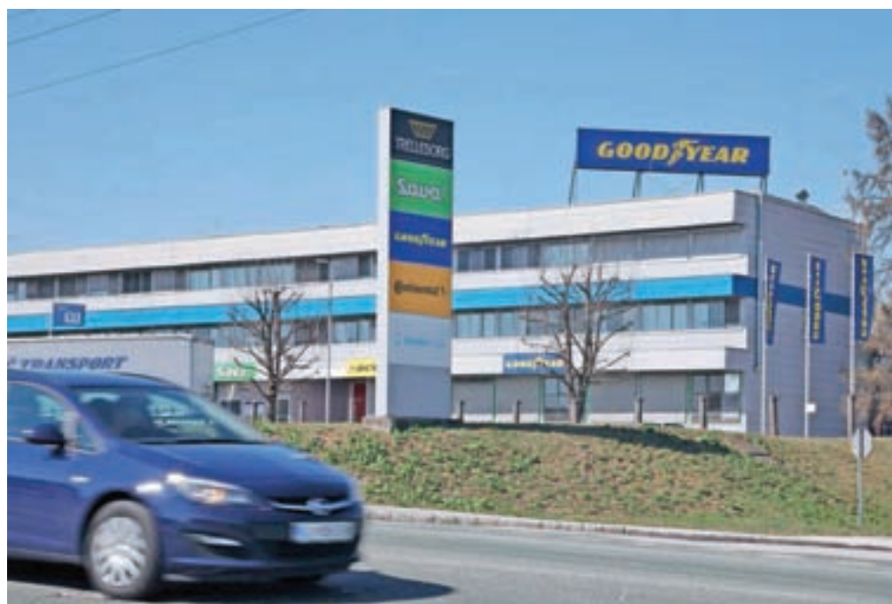
Po Elanu in Alpini proizvodnja zaradi epidemije novega koronavirusa začasno zaustavlja tudi Goodyear Dunlop Sava Tires (na sliki).