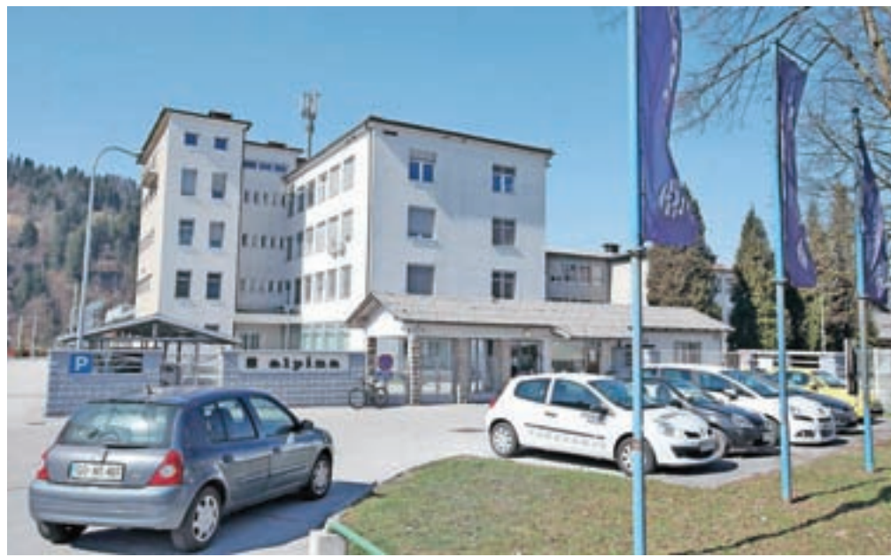
V žirovski Alpini so vrata zaprli za teden dni, v ponedeljek naj bi proizvodnjo nadaljevali v okrnjeni zasedbi.

Proizvodnja razmeroma normalno poteka tudi v družbah znotraj Skupine SIJ, torej tudi v jeseniškem Acroniju. »Proizvodnja v Evropi še vedno deluje in tudi mi imamo vse pogoje, da lahko delamo. Imamo obveznosti do kupcev, ki jih ne moremo prekiniti brez pogodbenih kazni, s katerimi bi lahko ogrozili obstoj podjetja. Ukrepi zaustavitve bi bil smiselni, če bi bil sprejet na nivoju Evropske unije in bi veljal za vsa podjetja in za vse ljudi sočasno. V primeru samostojne odločitve o zaprtju pa bi se izpostavili tveganju za trajno prekinitve poslovanja zaradi izgube kupcev in zaupanja s trga,« so razložili v SIJ-u. Naročil imajo sicer še dovolj, tudi iz Italije, so pojasnili. V Skupini SIJ torej večjih odstopanj v poslovanju še ne beležijo, pričakujejo pa povečanje tveganja za