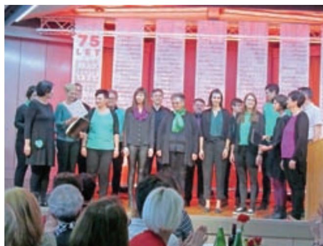
Pevska skupina Akzent med nastopom na »domačem« odru v Ledincih