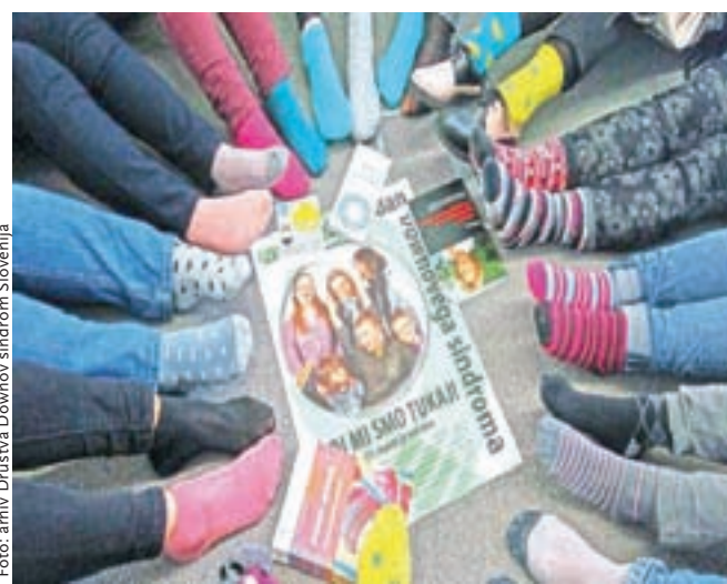
Razpoznavni znak svetovnega dneva Downovega sindroma so pisane kratke nogavice, ki opozarjajo na raznolikost ljudi.

Dotaknila se je tudi programa Učenje za življenje in delo, katerega avtorica je in ki se izvaja v šolah s prilagojenim programom ter zajema odrasle od 18. do 26. leta starosti. »To je program, ki temelji na izobraževanju odraslih in iz tega izhaja spoštovanje vseh načel in vrednot, ki veljajo v izobraževanju odraslih, to je zagotavljanje njihovih pravic do samouresničevanja in kakovosti življenja. Te pravice pa odrasla oseba z DS doseže samo z nadaljnjim izobraževanjem, saj si s tem poveča znanja, spretnosti, kompetence, informiranost, ki ji omogoča