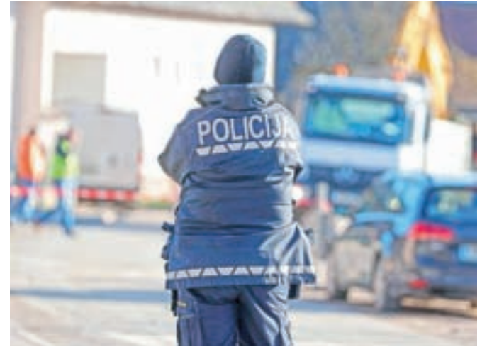
Gorenjski policisti so v zadnje pol meseca obravnavali 560 interventnih dogodkov.

predpise s področja varstva živali, ukrepali proti hujšim kršiteljem prometnih pravil, reševali težave z zaparkiranjem interventnih poti itd. S klici so obremenjeni tudi gorenjski policisti. Na območju Policijske uprave Kranj za klice v sili, na primer za obveščanje o kršitvah javnega reda in miru, o prometnih nesrečah, kaznivih dejanjih, torej takrat, ko ljudje nujno potrebujejo pomoč policistov. Policijske enote po državi od 4. marca, ko je bila v Sloveniji potrjena prva okužba s koronavirusom, prejema izjemno veliko klicev državljanov, telefoni pa zvonijo praktično vseskozi. Samo od 10. marca so na številki 113 prevzeli 10.711 klicev zaradi različnih razlogov. Policijske enote so obravnavale 3271 interventnih dogodkov, od tega 118 nujnih interventnih dogodkov s področja prometa, javne varnosti in kriminalitete. Obravnavali so gorske nesreče, iskali pogrešane osebe, izvajali