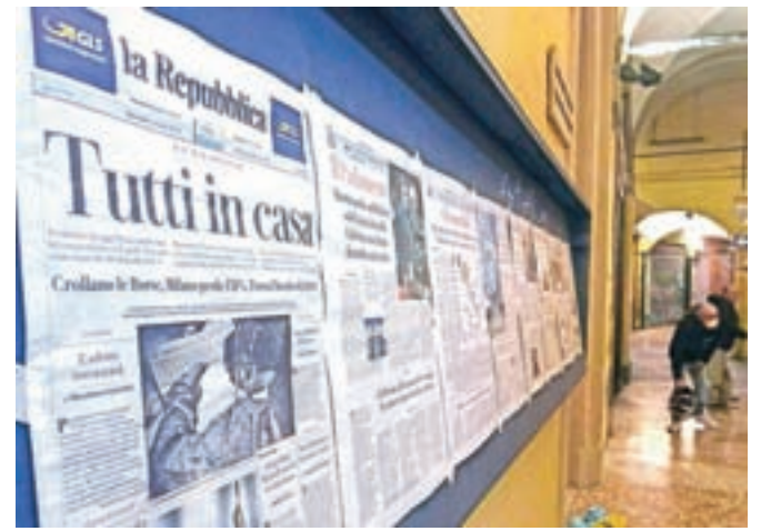
Stenski časopis v Bologni, 10. 3. 2020, na njem časnik La Repubblica z naslovnico, ki poziva: »Tutti in casa«, Ostanite doma

Kuga je odmevala tudi v književnosti. Dekameron, slovita zbirka novel, ki jo je Giovanni Boccaccio napisal med letoma 1348 in 1353, se namreč dogaja v okolici Firenc ravno za časa tiste kuge. V sodobnejši književnosti pa je najbolj znan roman Alberta Camusa, ki ima tudi kužni naslov: Kuga (1947). Predlog: »samoizolacijo« si popestrimo z branjem navedenih knjig.