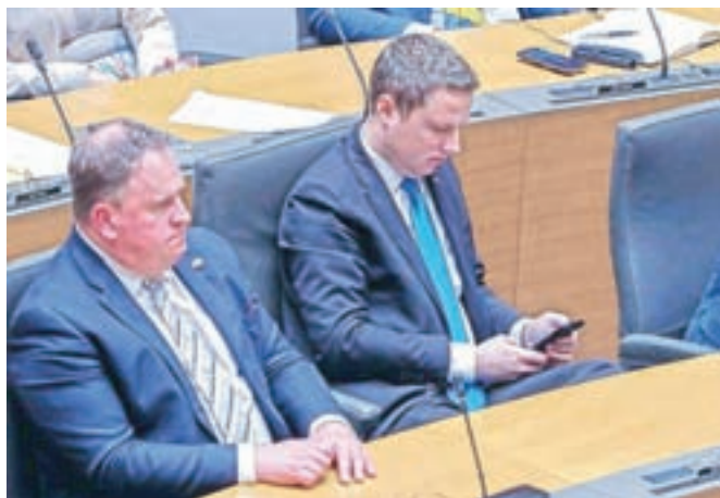
Žan Mahnič je postal državni sekretar v kabinetu predsednika vlade.