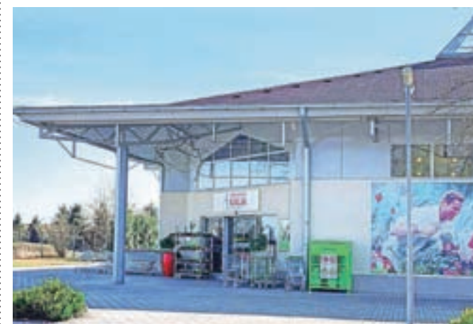
Vrtni center na Zlatem polju v Kranju

Podjetje Villager je izdelovalec vrtnega in električnega orodja Villager s sedežem v Ljubljani in je del kra-