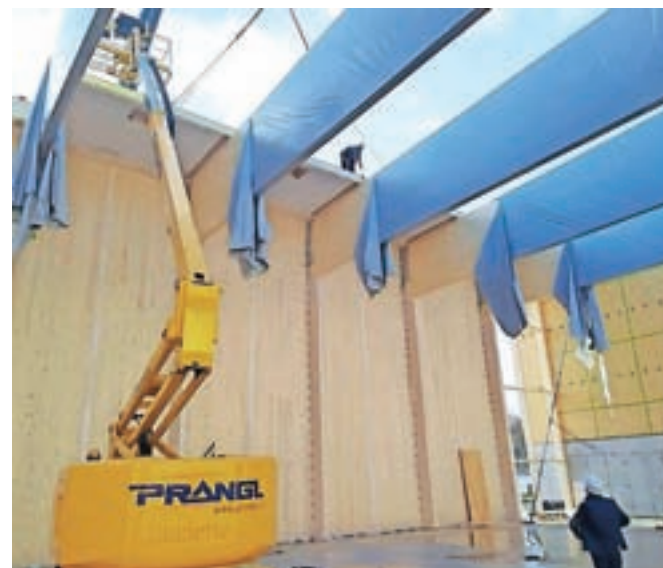
V Mengšu so pokrili dvorano, ki bo dokončana prihodnje leto.

izzivov, zapreti so morali del športnega parka in območja ob kulturnem domu ter demontirati avtobusno postajo ob občinski stavbi, a na koncu so nosilce uspešno dostavili v Mengeš in tudi namestili. Decembra so nadaljevali z nameščanjem prefabriciranih montažnih elementov in zastekli fasadne stene. Objekt je tako pred novim letom pokrit in zaprt, dela pa se bodo v prihodnjih mesecih preselila v notranjost.