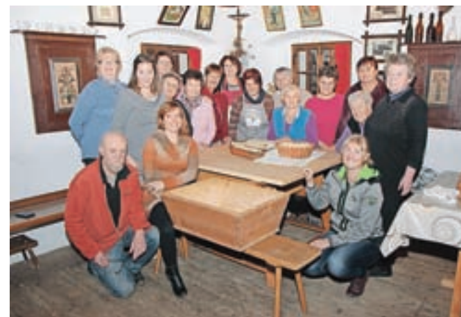
Z zadnje delavnice v Liznjekovi domačiji