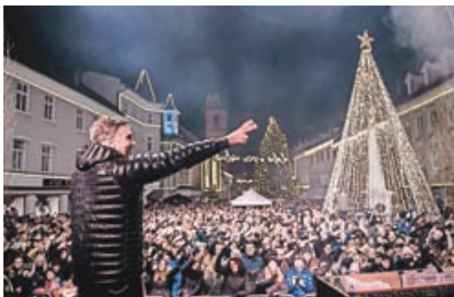
Na letošnjem Županovem koncertu je množice na Glavni trg privabil Jan Plestenjak.