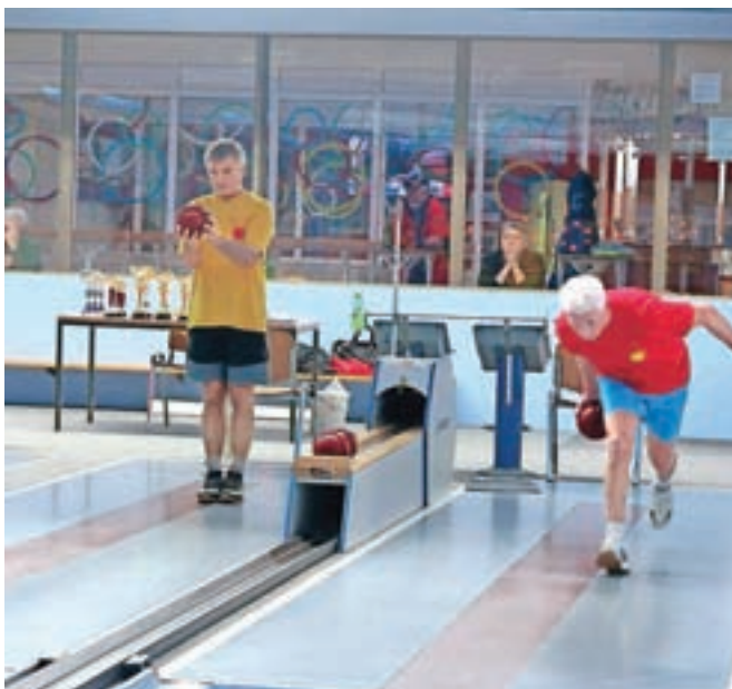
Na škofjeloškem kegljišču so se pomerili tako registrirani tekmovalci kot rekreativni kegljači.

Letošnji 22. Pokal Loka se je začel prvi torek v decembru, potekal pa je ob torkih, četrkih in sobotah. »Praktično vsi v klubu od začetka novembra delamo za prireditev, saj je treba pripraviti vse potrebno za nemoteno tekmovanje, sojenje, pripravo srečelova in prodajo