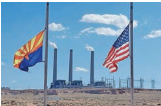
Elektrarna v puščavi na zemlji Indijancev plemena Navajo, ki prodaja elektriko v več sto kilometrov oddaljeni Las Vegas

Na sever Arizone do še ene naravne znamenitosti, kanjona Antelope, ki leži v bližini mesta Page na zemlji indijanskega plemena Navajo, se iz motela odpravimo zgodaj zjutraj, saj je pred nami še tri ure vožnje. Na vstopni postaji