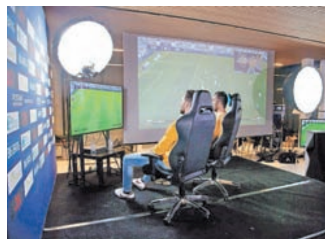
Igranje računalniških športnih iger tudi pri nas postaja vse bolj priljubljeno.

projekt odločili vstopiti, ker e-šport, kot imenujejo igranje športnih računalniških iger, postaja vedno bolj priljubljen in so ga priznali tudi v mednarodnih nogometnih zvezah UEFA in FIFA. Kot pravijo, je tudi v Sloveniji igralcev iger vse več, beležili naj bi celo desetodstotno rast. Podobno tudi v Big Bangu svojo priložnost vidijo v e-športu. »Tudi v Sloveniji je e-šport izredno razširjen.