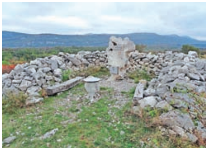
Veliki Gradež je po novem lepo označen.

Kuka. Lahko sledimo kolovozu ali pa zagrizemo direktno v breg. In glej ga zlomka. Vršno pobočje je zložno, na sredi pa stoji razpotje z ličnim smerokazom. Več kot očitno je pot idealna tudi za gorske kolesarje. Na vrhu Kuka je križ z vpisno skrinjico. S Kuka nadaljujemo še naprej proti jugovzhodu. Prečimo pašno ogrado. Ja,