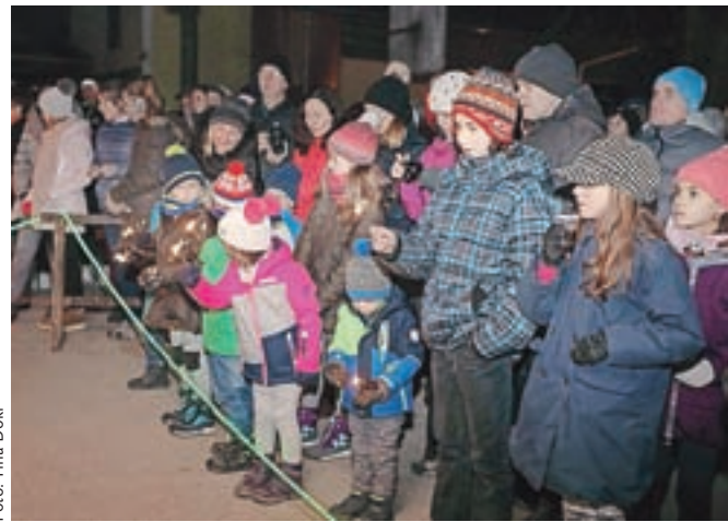
Tudi otroci so v veselim novoletnem pričakovanju.

Tour se bo jutri nadaljeval v Toblachu s preizkušnjo v prostem koraku.