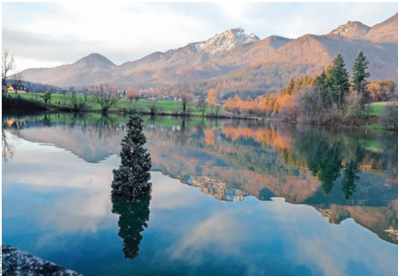
Polni pričakovanj vstopamo v novo leto 2020, ki je prestopno in z zanimivo okroglimi številčkami. Srečno v letu 2020.

svobodnih volitev po drugi svetovni vojni, na katerih je zmagala koalicija Demos, ki je po edinstvenem soglasju na decembrskem plebiscitu leto kasneje izpeljala osamosvojitve Slovenije. Po treh desetletjih je čas za razmislek o (ne)zadovoljstvu z državo Slovenijo in s politiki, ki že dolgo ne dosegajo več takšne podpore, kot so jo imeli Pučnik, Bučar, Oman ... Naši športniki, umetniki in znanstveniki z izjemnimi dosežki navdušujejo ljudi, doma in na tujem. Zakaj politiki tega ne zmorejo? Naj v dobro vseh uredijo vsaj zdravstvo, o katerem že vsi vemo, kaj je narobe, premakne pa se ne. Naj bo leto 2020 vsaj na tem področju leto novih začetkov.