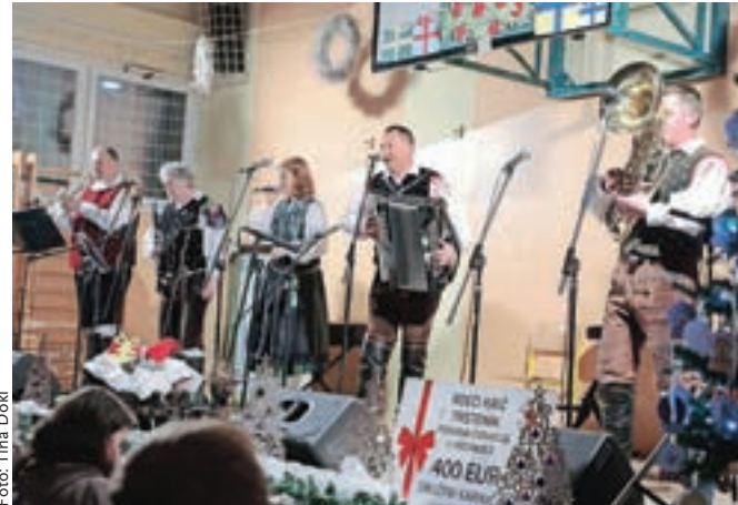
Ansambel Wankmiller je prišel na Trstenik iz Vuzenice.