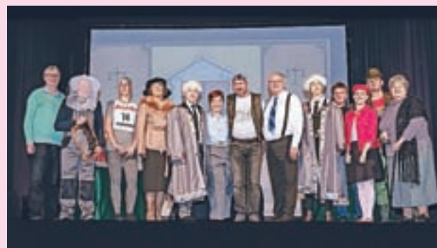
Gledališka skupina Smeh