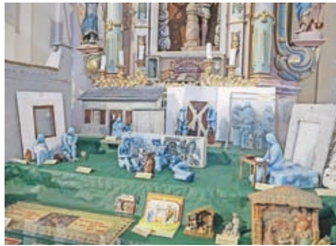
Jaslice je za razstavo posodilo trideset jasličarjev iz vse Slovenije.

Odprtje razstave je pospremil kulturni program z božično vsebino, ki so ga oblikovali domačini. Vsako leto pripravijo tudi zaigrano božičnico, Robi Malovrh pa za to priložnost napiše pesem, tokrat z naslovom Moderni božič, priča smo bili tudi prihodu skavta s prižgano betlehemsko lučko. Jaslice, ki jih je blagoslovil župnik Jože Stržaj, si bo mogoče ogledati še 1. januarja eno uro pred sveto mašo ob 15. uri ter 2., 4. in 5. januarja od 14. do 16. ure.