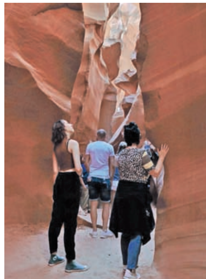
Neskončni čudeži narave v kanjonu Antelope

V kanjon se spustimo po strmih stopnicah le z dovoljenimi fotoaparati in plastenkami pijače, saj so prehodi na kanjonskem dnu ponekod precej ozki. Naš indijanski vodič, prijeten možak po imenu Roc, je povedal, da kadar voda zalije kanjon, nekaj časa po njem ni moč hoditi. Ko ta odteče, ga spet pripravijo za obiskovalce. Izkušnja hoje po kanjonu je podobna raziskovanju kraških jam, ponekod komaj prileže skozi, v večjem prostoru zaduhaš in občuduješ čudovite barve in oblike od vode zlizanih skal. Roc nam pokaže obliko skale, podobne glavi leva, pa tiste, ki spominja na medveda, in odprtino, ki nam – slikana pod določenim kotom – ponudi podobo morskega konjička. Vodič ga zna poimenovati v desetih jezikih. Ljudem pomaga nastaviti telefone, da bodo lahko posneli boljše