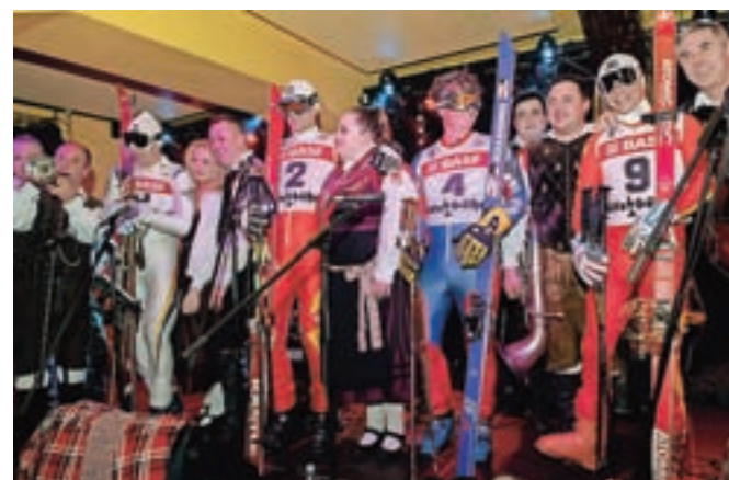
Športno-narodnozabavna kombinacija: moči so združili Cik cak retro band in Veseli Begunjčani.