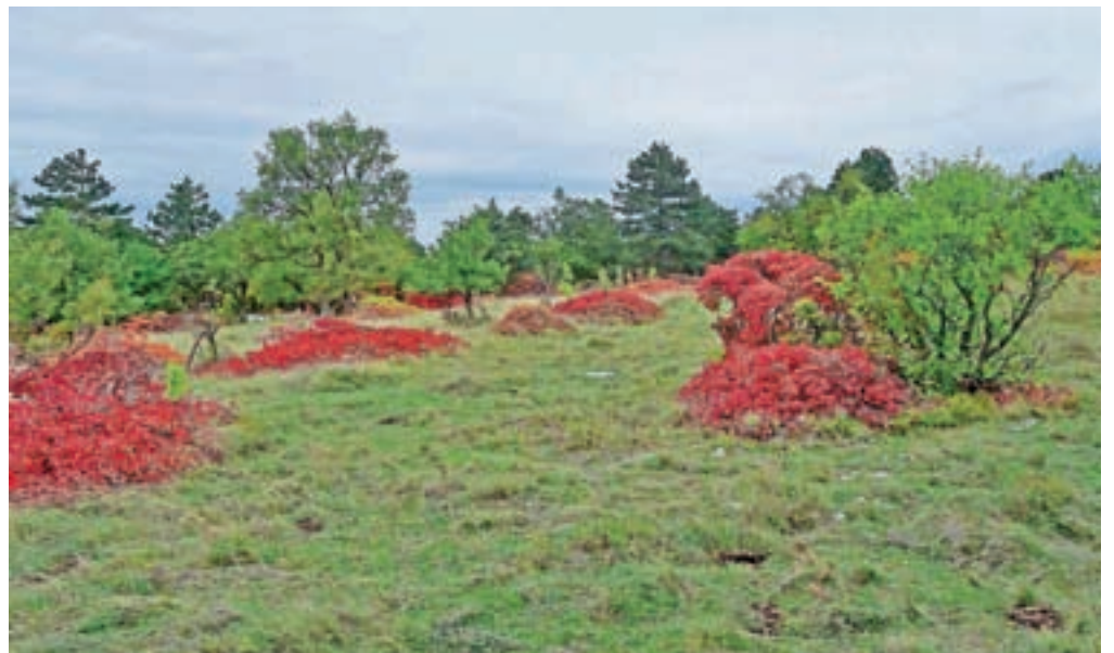
Barvita jesen 2019 je bila na grebenu Lačna–Veliki Gradež.