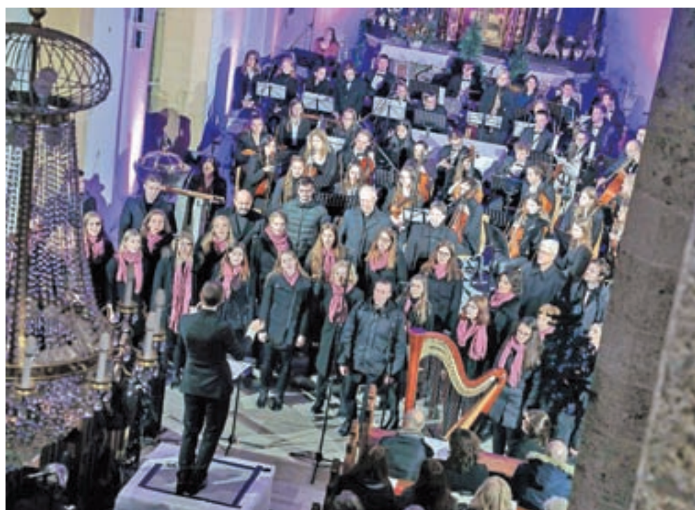
Gost koncerta je bil prenovljeni APZ France Prešeren.