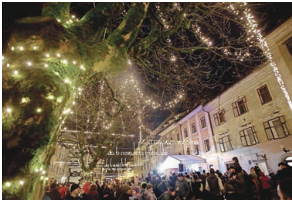
V Škofji Loki bodo novo leto pričakali na Mestnem trgu.

Otroci si bodo že ob 15. uri na odru Jezerske promenade lahko ogledali pravljico v izvedbi KPD Josip Lavtižar Kranjska Gora. Obiskal jih