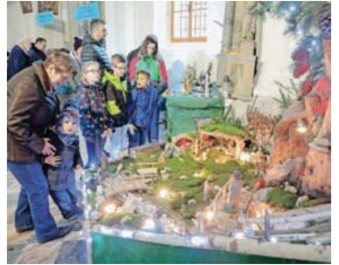
V podružnični cerkvi pri Svetem križu v Srednji vasi je na ogled več kot petdeset edinstvenih jaslic.