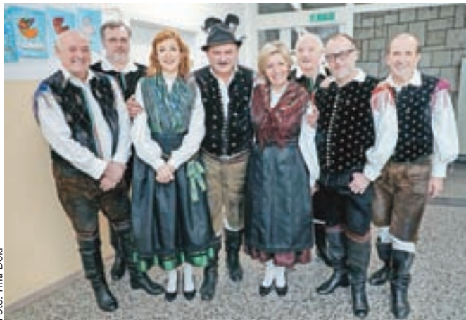
Hišni ansambel Avsenik na Trsteniku vselej navduši.

Prireditve je sklenil večno mladi in med trsteniškim občinstvom zelo priljubljen Hišni ansambel Avsenik, ki je v delu svojega nastopa združil moči s Smrtnikovimi fanti, ob legendarni Na Golici pa z vsemi nastopajočimi in seveda z navdušenim občinstvom.