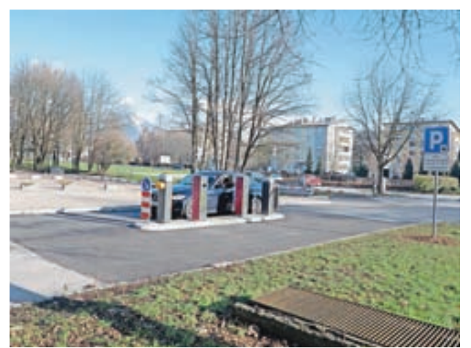
Pri kranjskem zdravstvenem domu naj bi z novimi parkirišči razrešili stisko s parkiranjem.

Kot so pojasnili na kranjski občini, gre za začasno parkirišče, ki bo v rabi do začetka izgradnje drugega objekta na lokaciji, zato so se odločili, da parkirišča ne