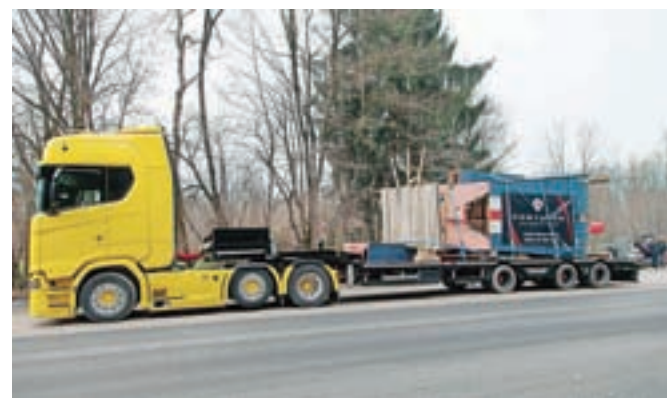
Takole je potekala selitev selskega Kipa svobode.

Leseno skulpturo, ki je pred meseci polnila novice največjih svetovnih medijev, so v petek preselili pred občinsko stavbo v Moravčah.