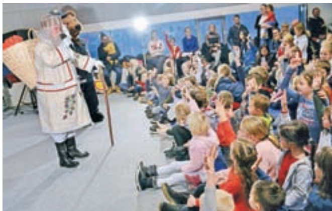
Dedek Mraz je medvoškimi otrokom prinesel darila, ki so jih kupili s pomočjo medvoških podjetnikov.

Dogodek je potekal osmič, in sicer v Športni dvorani Medvode, nanj pa so povabljeni prav vsi medvoški otroci. Začel se je z gledališko predstavo Žogica Marogica, ki so jo zaigrale vzgojiteljice Vrtca Medvode, nadaljeval pa z obiskom Dedka