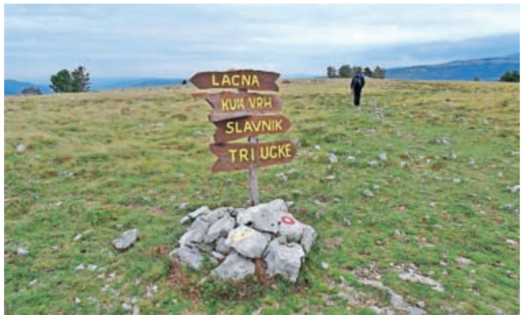
Ličen smerokaz tik pred vrhom Kuka

Z Lačne nadaljujemo proti Kuku. Sledimo markacijam ob kamniti ograji, ki nas pripeljejo do kolovoza, ki smo ga prej zapustili. Od tod dalje lahko preprosto sledimo kolovozu, lahko pa gremo bolj po robu, z razgledom na Komare doline. Ko sledimo kolovozu, dosežemo neizrazit, a razgleden Vrh križa. Kolovoz preide v pas borovega gozdička. Z nekaj sreče opazimo na jasi manjšega možica, ki označuje nemarkirano pot na bližnji Krog. Vmes opazimo tudi zanimive table, na katerih je narisana goba. Table označujejo eno od učnih poti, ki so jih pripravili v Gobarsko-mikološkem društvu slovenske Istre. S kroga nadaljujemo naprej proti Kuku, ki ga že vidimo v daljavi, in slej ko prej spet dosežemo kolovoz. Gozd preide v vse bolj odprt teren, na gola pobočja