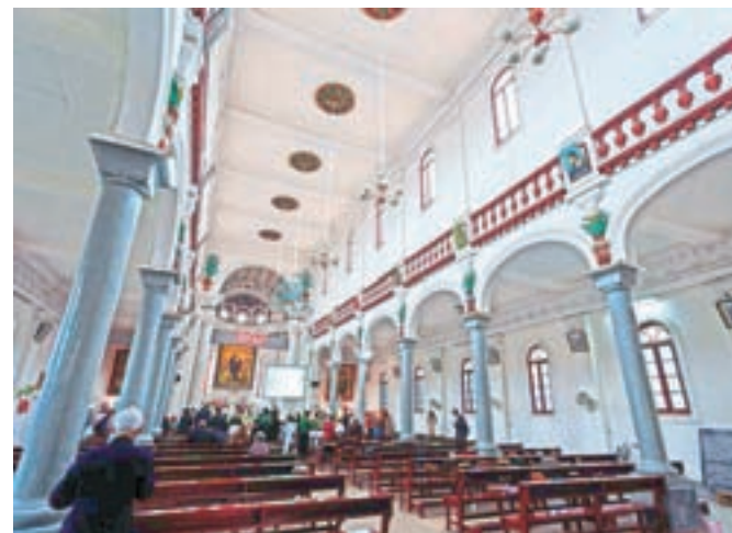
Katoliška cerkev na Kitajskem, v mestu Jingzhou