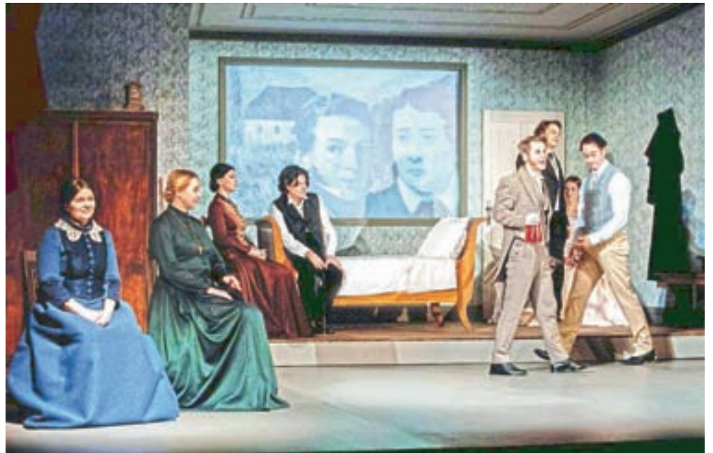
S pomočjo njegovih žensk in prijateljev v slabih dveh urah spoznamo nekoliko drugačnega Prešerna.

kdo in kakšen je bil človek, ki smo ga Slovenci postavili za pesnika vseh pesnikov. Že v uvodni sceni se namreč na odru pojavijo tako rekoč vsi liki, s katerimi se bomo srečevali v predstavi: oba Prešerna, mlajši in starejši, njegova prijatelja Andrej Smole in Matija Čop ter ženske iz njegovega življenja – ob Juliji Primic še njegova mati Mina, sestri Katra in Lenka, mati njegovih otrok Ana Jelovšek ter njuna hči Ernestina Jelovšek. Prav slednja nam ob svoji sicer idealizirani podobi očeta največkrat govori o nekem drugačnem Prešernu.