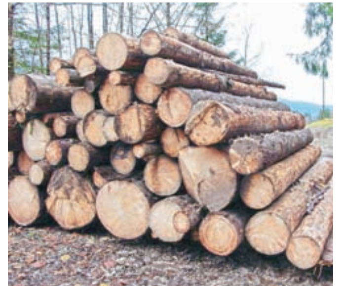
Lubadarke so manj vredne od zdravega, kakovostnega lesa.