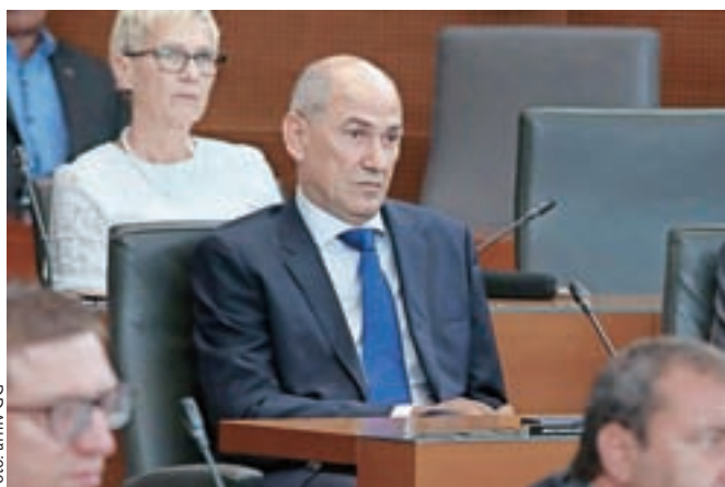
Odškodninsko tožbo Janeza Janše zoper državo, tožilko in štiri sodnike bo obravnavalo celjsko okrožno sodišče.