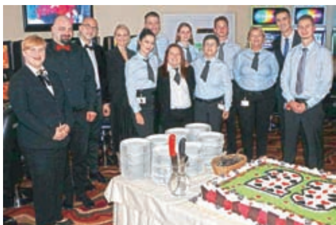
Brez rojstnodnevne torte seveda ni šlo