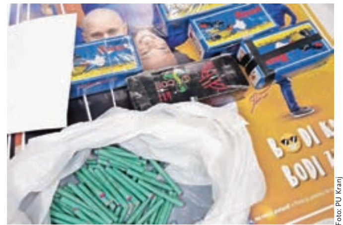
Gorenjski policisti so zasegli 452 kosov piratk in kober.

Kdor se ne more upreti uporabi dovoljenih pirotehničnih izdelkov, naj kupuje