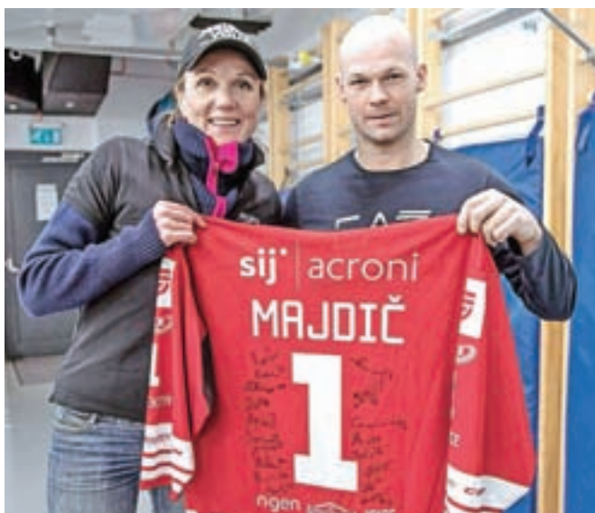
Jeseniški hokejisti so Petri Majdič podarili dres z njenim priimkom in s svojimi podpisi.

Da bi se v derbi podali motivirani in samozavestni, pa je železarje štiri dni pred derbijem na treningu obiskala Petra Majdič, nekdanja vrhunska smučarska tekačica in dobitnica bronaste olimpijske kolajne v izrednih razmerah (s štirim polomljenimi rebri), danes pa ambasadorka jeklene volje Skupine SIJ. Petra je s hokejisti delila nasvete, kako