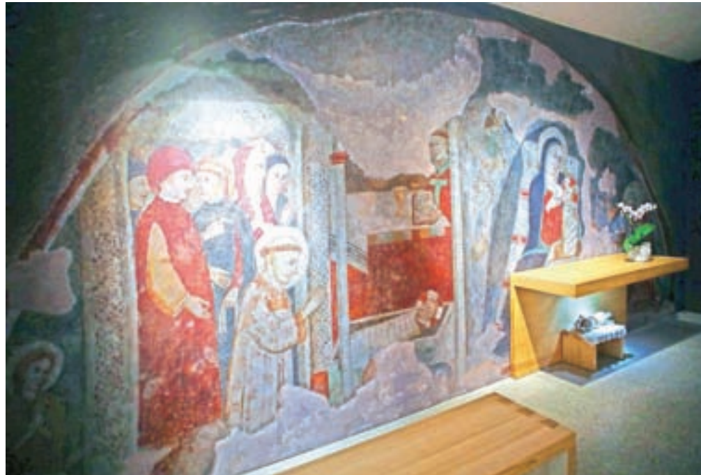
Freska prvih jaslic, ki jih je nekaj dni pred božičem leta 1223 v italijanskem mestu Greccio v Umbriji postavil ustanovitelj Frančiškovega reda Frančišek iz Assisija.

Od decembra leta 2016 naprej je Muzej jaslic prostorsko in vsebinsko večji in bogatejši. Zaseda kar deset prostorov, skozi katere pelje obiskovalca svetloba zvezde, tako kot je pred dobrimi dvesto leti tri modre pripeljala v Betlehem k novorojenemu Jezusu. Obiskovalec zve med hojo po muzeju o jaslicah, ki so najizvirnejši in najbolj ljudski način obudite božičnega dogodka, praktično vse. Kaj so prave jaslice, kaj pomenijo posamezne figure in prizori,