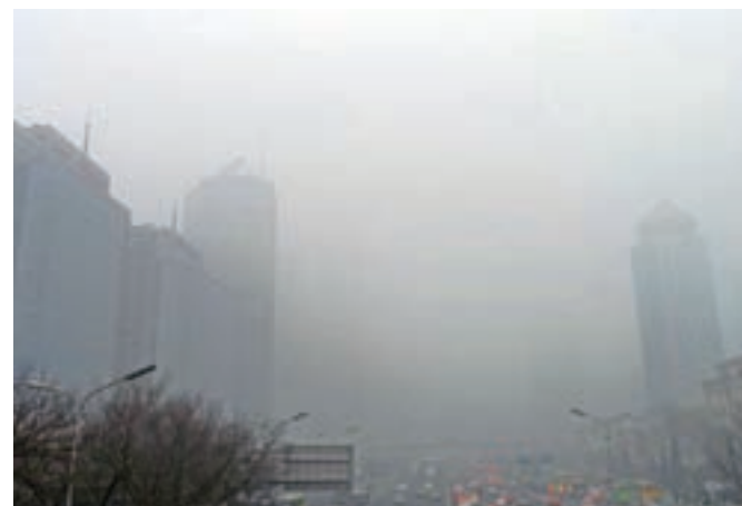
Nereligiozno vzdušje na Kitajskem: smog v Pekingu, 28. 2. 2013