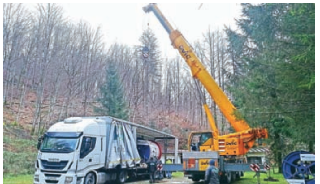
Novo nosilno vrv za nihalko so v ponedeljek v zgodnjih jutranjih urah dostavili iz Avstrije.

V ponedeljek zgodaj zjutraj so iz Avstrije k spodnji postaji nihalko v Kamniški Bistrici že pripeljali dva kolata vrvi, težkih po 20 ton. »Dela glede menjave vrvi so v polnem teku. Pri tem se nam je že uspelo dogovoriti z ustreznimi izvajalci za posamezna dela, ki jih v družbi ne moremo sami izvesti. Poiskati smo morali prevoznika vrvi, ponudnika za dvigalo in za vitle (enega spodaj in drugega zgoraj), najeti smo morali kamione, pripraviti smo morali traso, nosilne elemente za dvigalo ... Ko to storimo, moramo med drugim sneti kabine, pripeljati ustrezne vitle na planino, sidrirati staro vrv in jo pripraviti na odstranitev. Ko bomo staro vrv spustili, bomo začeli vpenjanje nove