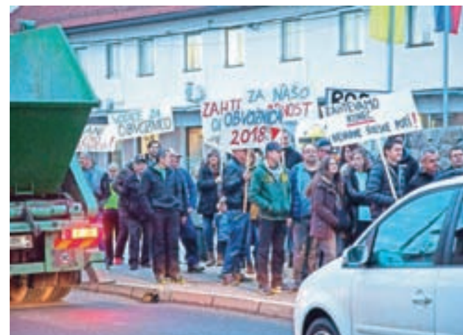
Takole so protestniki opozarjali na nevzdržne prometne razmere.

še vedno čakajo Agencijo RS za okolje, od katere pričakujejo odgovor, ali je potrebna ponovna presoja vplivov na okolje. V Vodichah seveda menijo, da to ni potrebno in bo Dars lahko vložil dokumentacijo za izdajo gradbenega dovoljenja, gradnja pa bi se v tem primeru lahko začela v prihodnjem letu. V nasprotnem primeru bi se težko pričakovana investicija, za katero so sredstva že zagotovljena, lahko zavlekla še za naslednji dve leti, so prepričani v Vodichah.