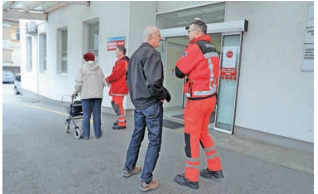
V ZD Škofja Loka imajo od srede odprt samo en vhod v stavbo zdravstvenega doma, kjer poteka triaža. Njihovi zaposleni vsakega obiskovalca oziroma bolnika povprašajo, ali ima simptome ošpic in ali je bil morebiti v stiku z obolelim za ošpicami.