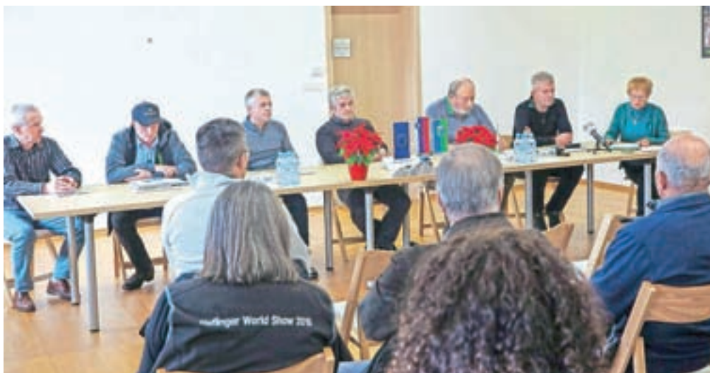
Na okrogli mizi so opozorili na porast števila divjih zveri na območjih, kjer jih prej ni bilo.