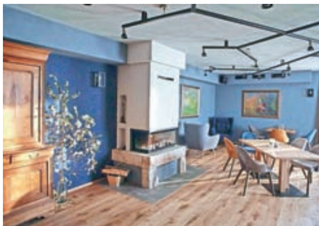
Moderno zasnovani prostori imajo tudi pridih domačnosti.

ne manjka, nato pa sledi velika »luknja« do zimskih počitnic v Sloveniji. Pozimi gostijo zlasti Hrvate in Slovence, ki jih poleti skorajda ni. Gostje pri Tolcu povprečno prespijo štiri noči. »Povprečje nižaje enodnevni gosti, predvsem udeleženci timbidingov.«