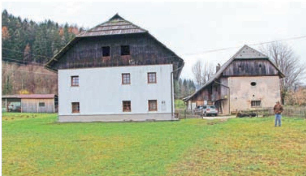
Hlebanjeva domačija, po domače se reče Pr' Tarmanu

set do dvajsetkrat. »Prehod je nepregleden, bojimo se, da bo prišlo do nesreče. Poleti je na kolesarski stezi zelo veliko kolesarjev, nekateri se peljejo tudi zelo hitro,« pravi Branko in dodaja, da je občini in ministrstvu že dal predloge za rešitev problema. »Za nas bi bila najboljša rešitev, da bi mi dobili prednost pred kolesarji. Vsekakor pa bi morali na tem odseku omejiti njihovo hitrost.«