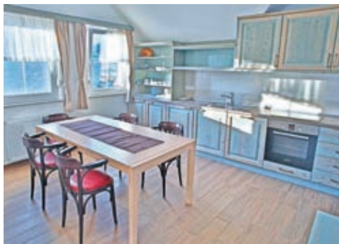
V poletni sezoni so Tolčeve sobe tri mesece povsem zasedene. Prevladujejo tuji turisti, ki si želijo iti iz vrveža na vas.

Pintar je še poudaril, da se gostišče Tolc, v katerem so poleg sob tudi apartmaji, dopolnjuje s kapacitetami v Macesu in tudi na Soriški planini, saj ciljajo na drug segment gostov. »Vsak novi apartma je v turizmu plus.«