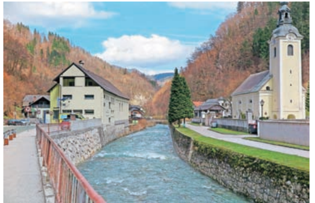
Okoljevarstveno soglasje za prvo fazo protipoplavniških ukrepov in obvoznico v Železnikih naj bi bilo ponovno izdano marca prihodnje leto.