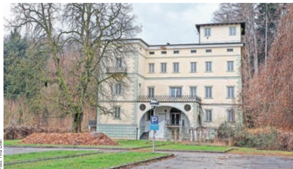
Grad Podvin, po drugi svetovni vojni hotel s protokolarnim statusom, že dolgo propada. V zadnjih desetletjih je propadlo že nekaj načrtov oživitve. Tokrat investitorji želijo skupaj z obnovo starega dvorca uresničiti tudi gradnjo apartmajev kot del podvinskega kompleksa.

Planica bo ta konec tedna znova gostila tekme svetovnega pokala v teku na smučeh.