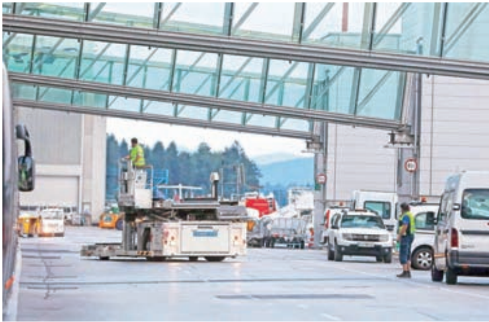
Nagrado za poslovno leto bodo zaposlenim kljub izpadu prihodkov zaradi stečaja Adrie Airways izplačali tudi v letališki družbi Fraport Slovenija, bo pa ta nižja kot lani.

V ljubljanskem farmaceutu Lek, ki ima tovarno tudi v Mengšu, so božičnico že izplačali sredi decembra, znašala pa je 1350 evrov bruto (lani je znašala 1330 evrov). Prejeli so jo vsi, poleg redno zaposlenih tudi zaposleni prek agencije. Poleg božičnice zaposleni prejmejo tudi izplačilo za uspešnost, ki se obračunava glede na dejanski prispevek zaposlenega in uspešnost družbe in ga bodo izplačali v začetku prihodnjega leta.