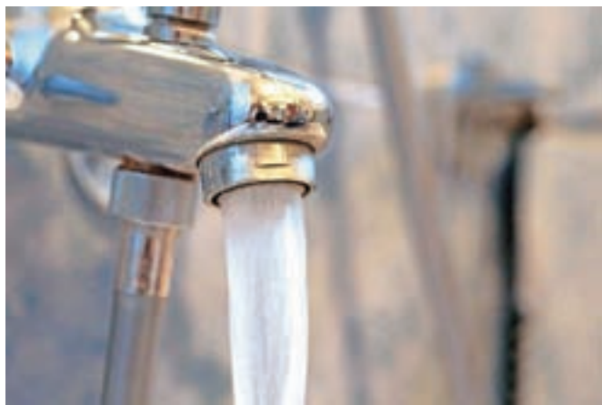
Po onkološkem inštitutu morajo zaradi pojava legionele vse vodovodne cevi zamenjati tudi na ljubljanski psihiatrični kliniki.