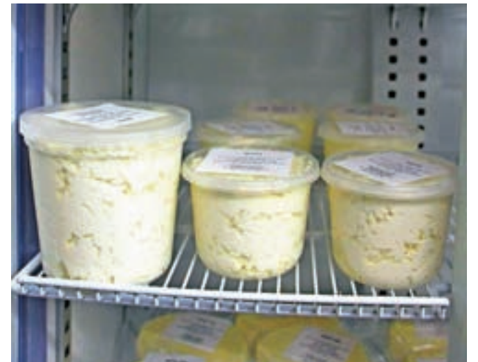
Na kmetiji večino mleka predelajo v mlečne izdelke.