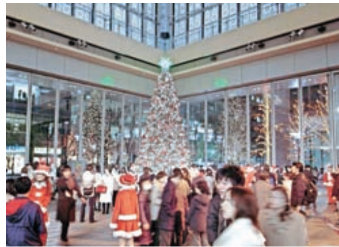
Božično vzdušje na Daljnem vzhodu: fotografirano na Japonskem, okrasje izdelano na Kitajskem