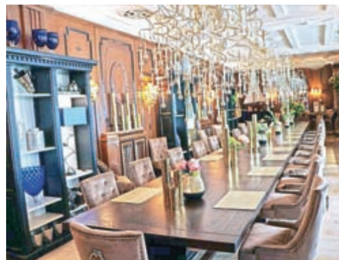
V prvem nadstropju kavarne Maldaner je precej posebna dvorana z rahlo dekadentnim pridihom, ki gosti različna slavlja, med njimi največ porok.