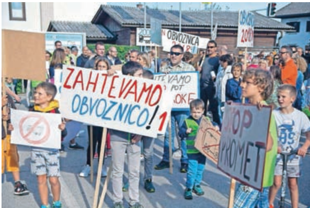
Na protestu so se zbrali številni krajani, ki so na težave opozorili tudi s transparenti.