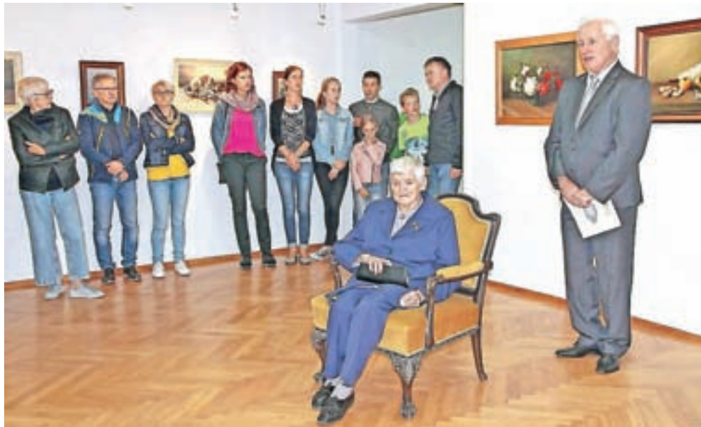
V galeriji DPD Svoboda je na ogled razstava njegovih del.

je beseda diletant povezana tudi z nekom, ki površno oziroma nestrokovno opravlja svoje delo,« je razkrila svoje pomisleke glede tega poimenovanja. Za ustvarjanje akademsko neizobraženih, a likovno samopolnomočenih avtorjev sta zato po njenem ustreznejša izraza ustvarjalci naivne umetnosti ali samorastniki.