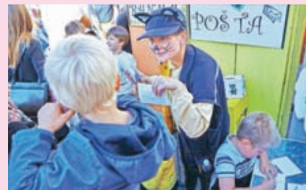
V Mačjem mestu imajo tudi mačjo pošto.