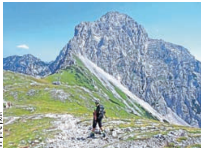
Sestop na Kamniško sedlo, zadaj pa mogočna Planjava