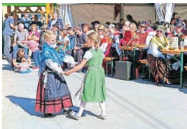
Na Koroški Beli na veselico pride velik del vasi, zabavajo se mladi in stari, mnogi tudi v narodnih nošah.