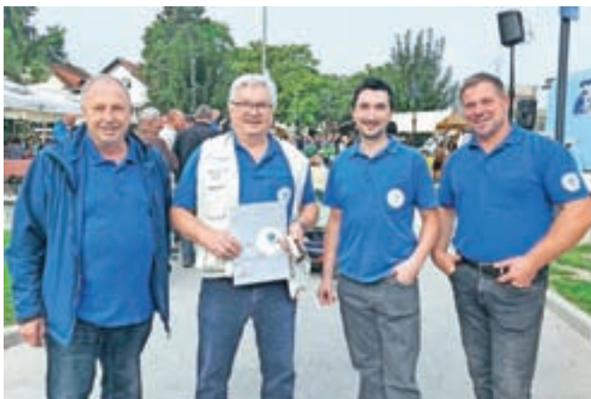
Sejmarji so se predstavili tudi v Domžalah.