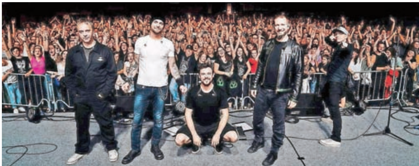
Nomadi svetlobe: Siddharta na odru Športne dvorane v Šenčurju