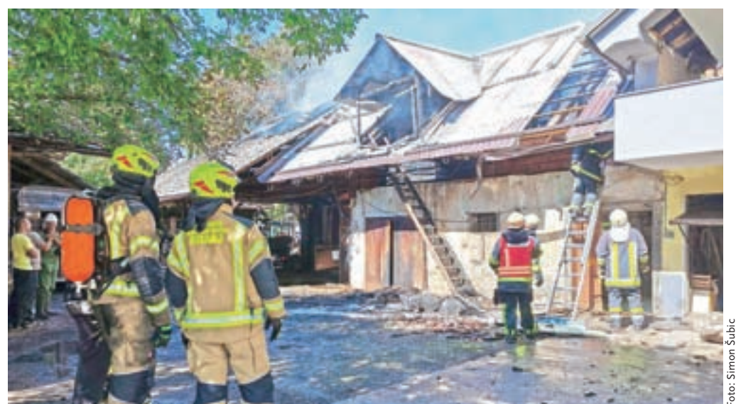
Gospodarsko poslopije je zgorelo v celoti, bližnjo hišo so gasilci obvarovali pred najhujšim.