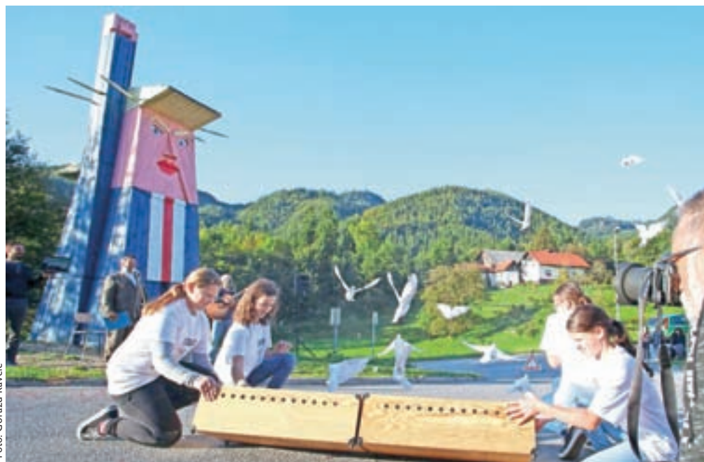
Kip svobode na Selih spominja na ameriškega predsednika, skladno z idejo pa so ustvarjalci njegovo odprtje pospremili z izpustom belih golobov, simbolom miru.