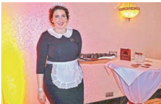
Tudi simpatično osebje je del zanimivega vzdušja priljubljene kavarne v Wiesbadnu.