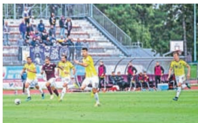
Nogometaši Triglava so doma izgubili proti prvakom iz Maribora.

Ljubljana – Naši odbojkarji so na tekmi osmine finala EuroVolleyja s 3 : 1 prvič na uradnih srečanjih premagali Bolgarijo in si tako priborili nastop v včerajšnjem četrtfinalu, kjer so se pomerili z Rusijo. Tekma se do zaključka naše redakcije še ni končala.