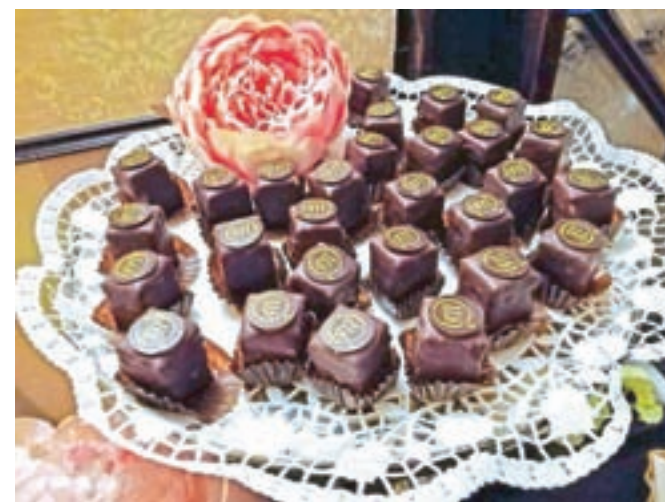
Prepoznavni čokoladni pralineji – recept zanje je malodane že družinska skrivnost.