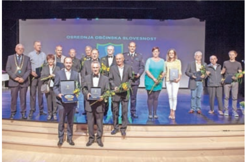
Letošnji občinski nagrajenci