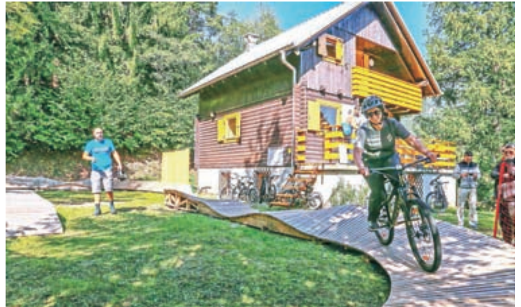
Prenovljeni Kurirski dom je postal Gorskokolesarski učni center Pristava.

Namen projekta Alpe Adria Karavanke je, da Karavanke postanejo regija petzvezdičnih doživetij, s poudarkom na pohodništvu, gorskem kolesarjenju in zimskih aktivnostih. Želijo privabiti večje število obiskovalcev, dolgoročno pa zagotoviti nova delovna mesta v turizmu.