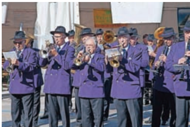
Mengeška Godba letos praznuje 135 let delovanja.