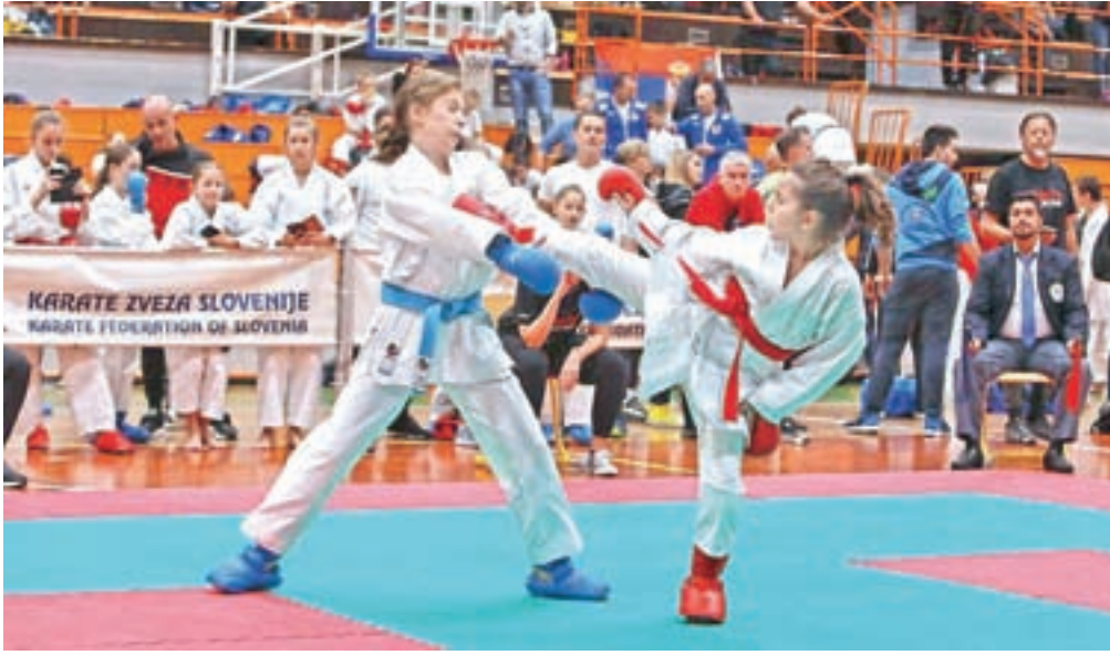
Na tekmi so nastopili karateisti in karateistke vseh generacij in prikazali zanimive obračune.

Izkazali so se tudi gostitelji iz Karate kluba Shotokan Kranj, ki so osvojili dve zlati, štiri srebrne in pet bronastih odličij, pa tudi člani Karate kluba Kranj, ki so osvojili dve zlati, tri srebrne in sedem bronastih kolajn. Med gorenjskimi ekipami so