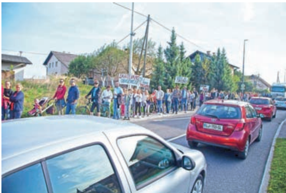
Občani so opozarjali na nevzdržne razmere na cesti skozi Vodice.