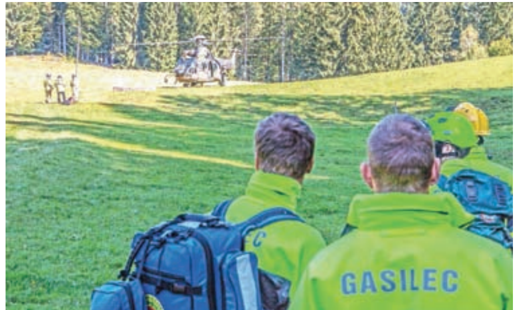
Vaja je največ pomanjkljivosti pokazala pri sodelovanju letalskih sil, zlasti pri koordinaciji helikopterjev ter na področju preiskave nesreč in identifikacije mrtvih na obeh straneh državne meje.

»V Sloveniji in Avstriji takšne skupne vaje še ni bilo. V celotni vaji, ki je potekala od 6. do 17. ure, je na terenu sodelovalo več kot 250 ljudi. Celovita analiza vaje bo pripravljena čez mesec dni, že med samo vajo pa so se razkrijele nekatere pomanjkljivosti. Največ na področju sodelovanja letalskih sil, zlasti pri koordinaciji helikopterjev, in pa na področju preiskave nesreč in identifikacije mrtvih, kjer sicer obstaja nekaj