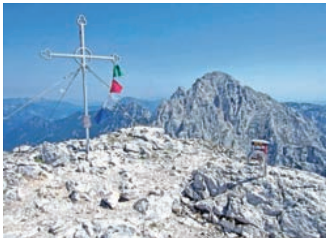
Vrh Brane, hišne gore Kamniškega sedla

Nadmorska višina: 2253 m Višinska razlika: 1320 m Trajanje: 7 ur Zahtevnost: ★★★★★