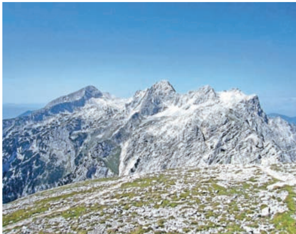
Pogled z Brane na Grintovec z Dolgimi stenami, na Skuto, na Rinke

do Doma na Okrešlju. Od doma nadaljujemo v smeri Kamniškega in Savinjskega sedla. Na prvem razpotju, ko pridemo do prostranega travnika, zavijemo ostro levo proti Kamniškemu sedlu. Pot se najprej zmerno vzpenja skozi gozd, se nato skoraj povsem položi in preči do melišča, preko katerega se povzpne v okljukih. Ko pridemo pod steno, je pred nami zavarovan del poti, kjer priporočam uporabo čelade, saj je ta del izpostavljen padajočemu kamenju. Višje dosežemo poličko, po kateri se povzpne do travnatih pobočij Kamniškega sedla. Zavijemo desno in nadaljujemo v smeri proti Brani. Sledi zmeren vzpon po vse bolj kamnitem pobočju in melišče, ki ga prehodimo v