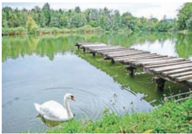
Ribe, ki so jih ujeli v okviru ribolovnih dnevov v Krokodilnici in Ledvički, so prenesli v sosednjo Čukovo jamo (na sliki).

V ta namen so s podporo Mestne občine Kranj in ministrstva za okolje in prostor kot ustanovitelja naravnega rezervata izvedli tri ribolovne dneve, pri čemer so jim strokovno pomagali člani Ribiške družine Kranj. »Na žalost je bil odziv pod pričakovani in tudi vsi, ki so se prijavi, niso prišli. Morda smo naredili premalo promocije, a ker je bilo prvič, smo bili previdni, da ne bi prišlo preveč ribičev, nazadnje pa jih je bilo bolj malo. A ne glede na to smo dobili vtis o stanju rib v Krokodilnici z ribiškega vidika, povezali smo se lastniki, ribiči in