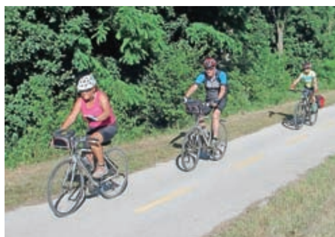
Kadar kolesarimo v skupini, se razvrstimo eden po eden in imamo primerno varnostno razdaljo.

Pri profesionalnih kolesarjih sta red in disciplina osnova za dobro delovanje skupine. Šef ekipe daje iz avtomobila jasna navodila, ki jih morajo kolesarji brezkompromisno upoštevati. Vsi kolesarji delajo za enega – tistega, ki ga določijo šefi že pred tekmovanjem in je glavni v skupini. Preostali mu pomagajo; nosijo mu pijačo in hrano, ga v skupini varujejo pred padcem, če je v krizi, ga v zavetrju pripeljejo naprej. Nemalokrat se zgodi, da mora kolesar, čeprav močan in dobro razpoložen, da bi lahko zmagal na etapi, svoje želje potlačiti, ker ima drugačna navodila. Poleg točno določenih nalog je za dobro delovanje v skupini pomembno tudi prijateljstvo. V ekipi se morata ustvariti pozitivno vzdušje in medsebojno zaupanje, ki