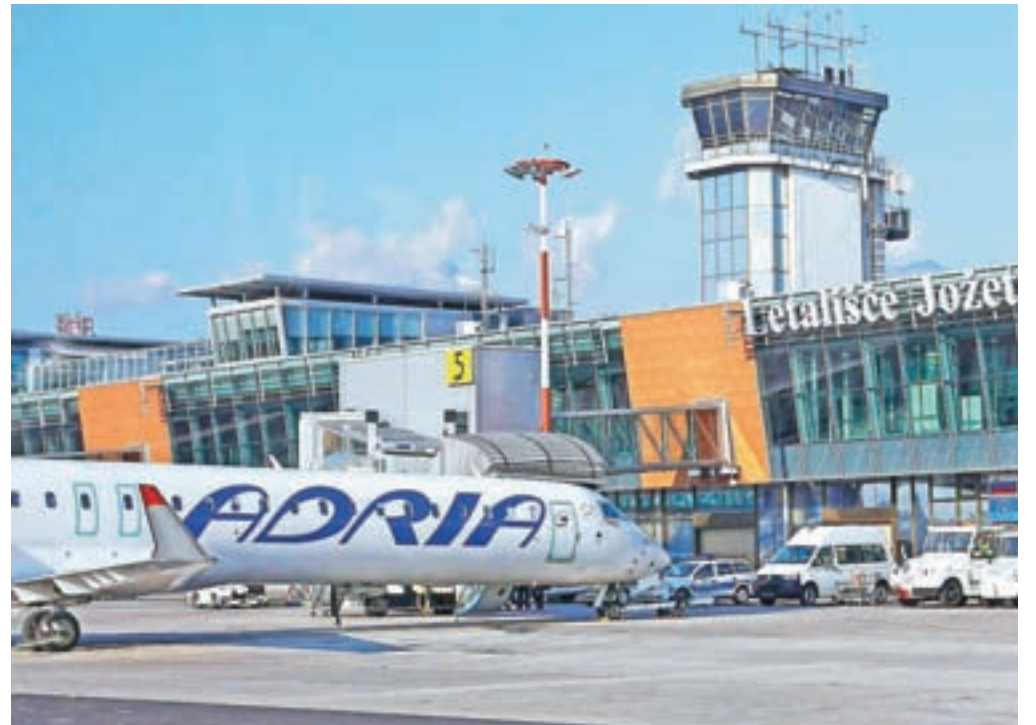
► 4. stran Težave Adrie Airways se poglobljajo

Vodstvo podjetja intenzivno išče izhod iz težav, medtem pa na ministrstvu za infrastrukturo pripravljajo rešitve ob morebitnem stečaju podjetja, ki je od leta 2016 v lasti nemškega sklada 4K Invest. »Ministrstvo za infrastrukturo nima vzvodov za pomoč Adrii Airways, naša ključna skrb v tem trenutku je, da je zagotovljena maksimalna varnost njenih letalskih operacij,« pravijo na ministrstvu.