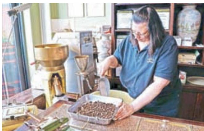
Pražarna kave v središču mesta kvalitetne kavne izdelke ponuja že več kot sedemdeset let.