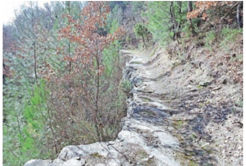
Zanimiva pot nas vodi po zaledju Obale.

katerem se ponovno začnemo vzpenjati. Na tem delu je tudi lep razgled na dolino Dragonje in Piranski zaliv. Hodimo mimo nekaj urejenih hiš, mimo istrskih polj, kjer rastejo kaktusi. Sledimo kolovozu v desno, nato pa nas markacija na skali usmeri, tik pred izrazitim ovinkom, desno, na ožjo planinsko pot. Nekaj časa prečimo skoraj po ravnem v desno, nato pa dosežemo bolj kamnit svet, pravzaprav kar ozko kamnito pot, na koncu katere se pot strmeje povzpne. Nadaljujemo naravnost in že smo spet pod daljnovidom, kjer se nam z desne pridruži pot iz Krkavč, ki jo tudi vidimo v ozadju. Rjava smerna tabla nas usmeri levo proti Sv. Petru. Pot se zmerno vzpenja