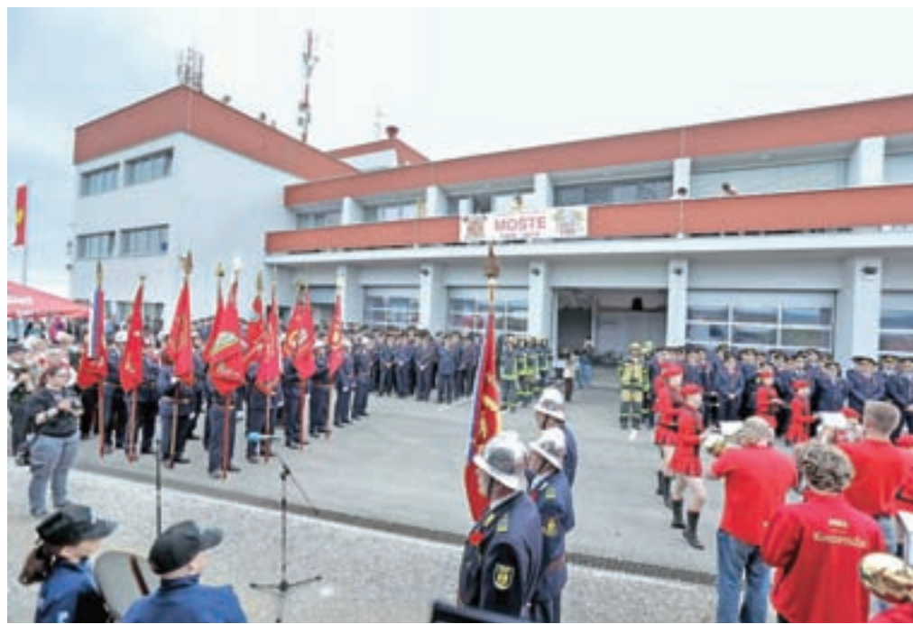
Prostovoljno gasilsko društvo Moste je ob praznovanju devdesetletnice delovanja slavnostno odprlo novi gasilski dom v Mostah.

Moste – Bilo je 2. februarja leta 1929, ko so domačini iz Most ustanovili prostovoljno gasilsko društvo in s tem lokalni skupnosti zagotovili hitro in strokovno pomoč ob naravnih in drugih nesrečah. Že ustanovni člani so se lotili projekta izgradnje prvega gasilskega doma v Mostah – doma, ki je po tolikih letih postal premajhen, saj so domači prostovoljni gasilci samo v zadnjih dvajsetih letih intervenirali ob številnih večjih požarih, kot je bil leta 2009 v podjetju Niko Transport v Mostah in letos na Publikusovi deponiji. Pred desetimi leti so dobili novo avtocisterno, dve leti zatem pa nov kombi. Leta 2017 so položili temeljni kamen za nov gasilski dom, ki so ga ob praznovanju devdesetletnice slavnostno odprli. »Tako kot se je ustanovna generacija pred devdesetimi leti lotila projekta, za katerega so številni menili, da je nemogoč, smo se tudi mi, njihovi nasledniki, danes lotili izgradnje novega gasilskega doma. Od položitve temeljnega kamna do vselitve je minilo le pičlo leto in vloženih