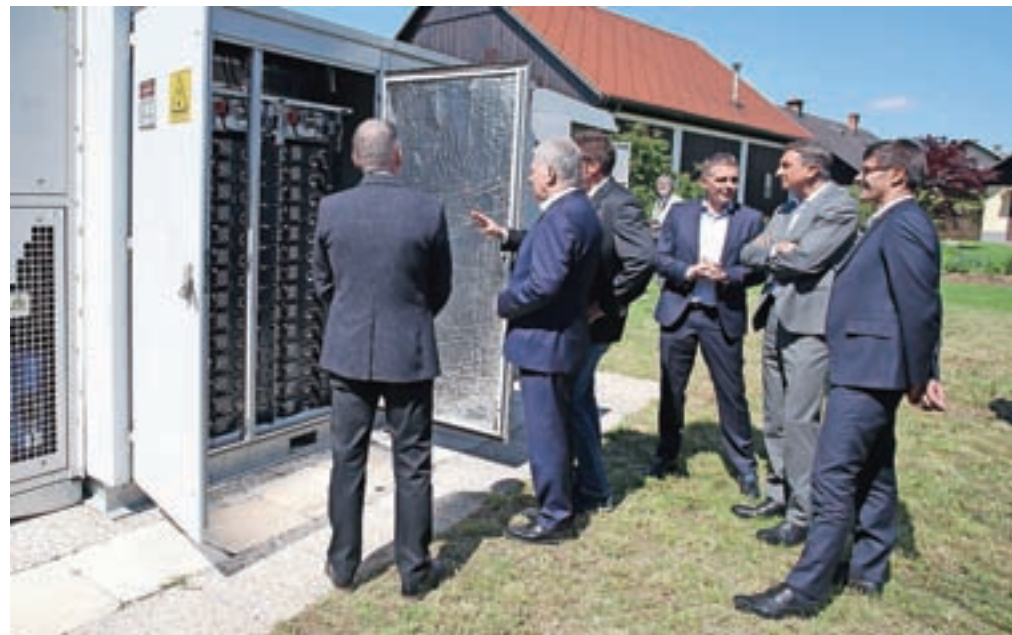
Predsednika na Suhi, kjer v sodelovanju s finskimi partnerji in v okviru evropskega razvojnega projekta Story poteka testiranje najsodobnejših tehnologij s področja shranjevanja električne energije.

Ob koncu pa sta v Planici slovesno odkrila klop prijateljstva med obema državama. Klop je postavljena v dolini skakalnic in bo tako spominjala tudi na številne uspehe, ki so jih finski tekmovalci dosegli pri nas. Klop v Planici je že šestnajsta klop prijateljstva, ki jih predsednik Borut Pahor s svojimi gosti odkrije ob uradnih obiskih predsednikov v Sloveniji in v trajen spomin na obisk in na dobre, prijateljske odnose med državama in ljudmi.