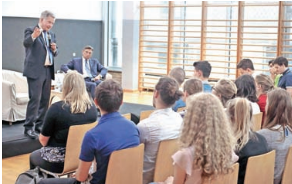
Predsednika Finske in Slovenije z dijaki Gimnazije Kranj

Predsednika sta obiskala tudi Gorenjsko: že prvi dan Gimnazijo Kranj, kjer so bile tema pogovorov s tamkajšnjimi dijaki podnebne spremembe. Letos bo v Helsinkih, pod častnim pokroviteljstvom finskega predsednika, namreč potekal Svetovni podnebni vrh za mlade, ki se ga bo udeležila tudi slovenska delegacija. V Sloveniji je nastala iniciativa o posvajanju dreves,