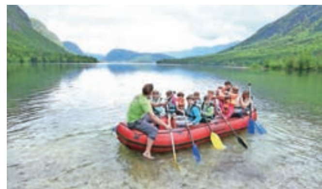
Otroci so poleg pravljic spoznali tudi aktivno preživljanje prostega časa.