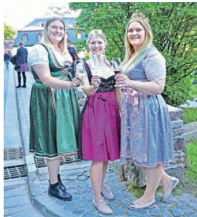
Vinskih kraljic v Nemčiji ni nikoli preveč.