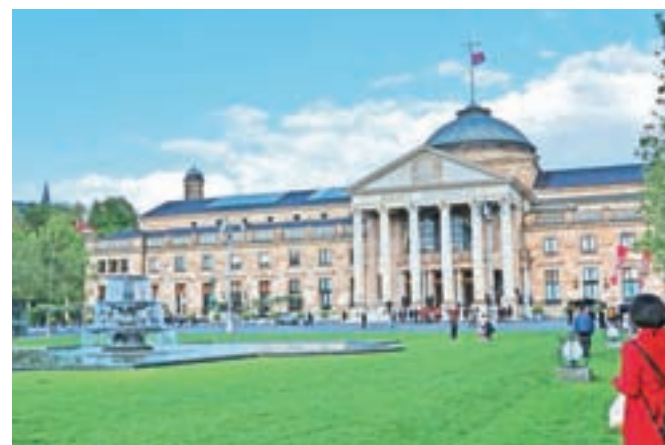
Prostor, kjer v Wiesbadnu gostijo posebne dogodke: Kurhaus Wiesbaden