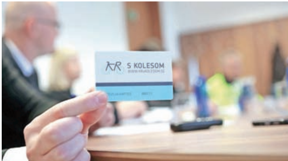
Kranjski sistem KRskOLESOM je največji elektrificiran sistem v državi, cena letne naročnine pa je petdeset evrov.

V Bohinju je za izposojno na voljo 26 koles za odrasle in štiri otroška kolesa, ki si jih lahko izposodite na eni od štirih izposojevalnih točk, ravno tako pa jih lahko po zaključeni uporabi pustite na katerikoli točki. Točke, kjer so kolesa na voljo, so Železniška postaja Bohinjska Bistrica, TIC Bohinj v Ribčevem Lazu, Center TNP Bohinjka v Stari Fužini in agencija Hike and Bike v Bohinjski Bistrici. Cena dnevnega najema kolesa je 16 evrov, v ceno pa