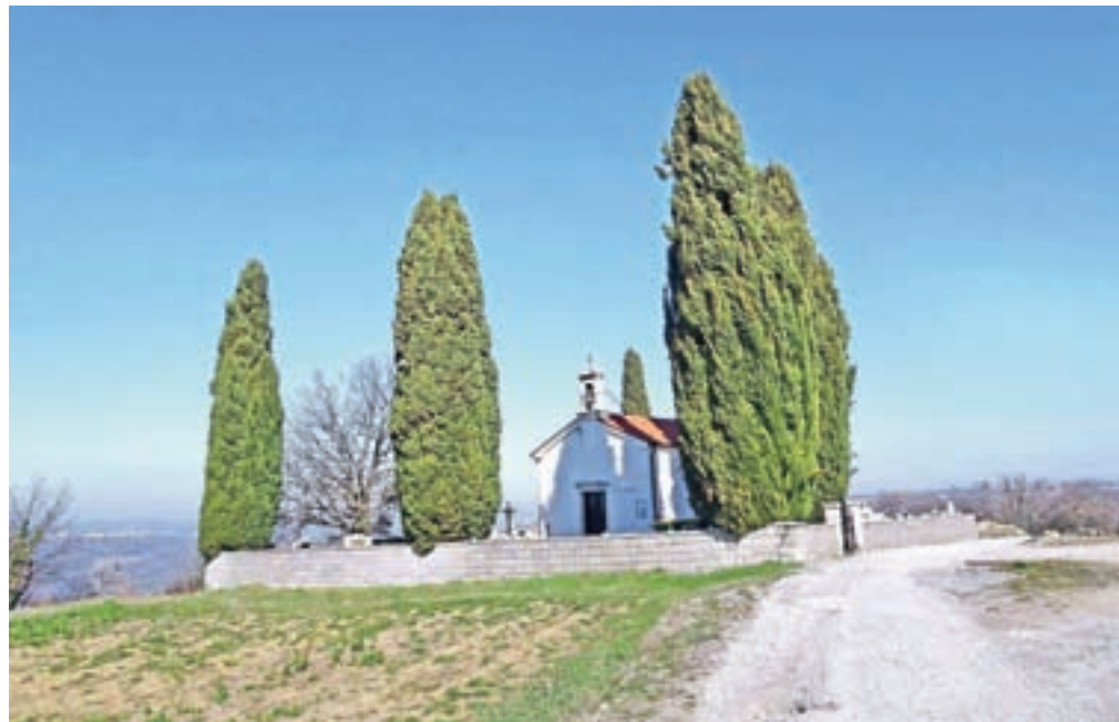
Cerkev Svetega duha

Nadmorska višina: 253 m Višinska razlika: 275 m Trajanje: 3 ure Zahtevnost: ★★★★★