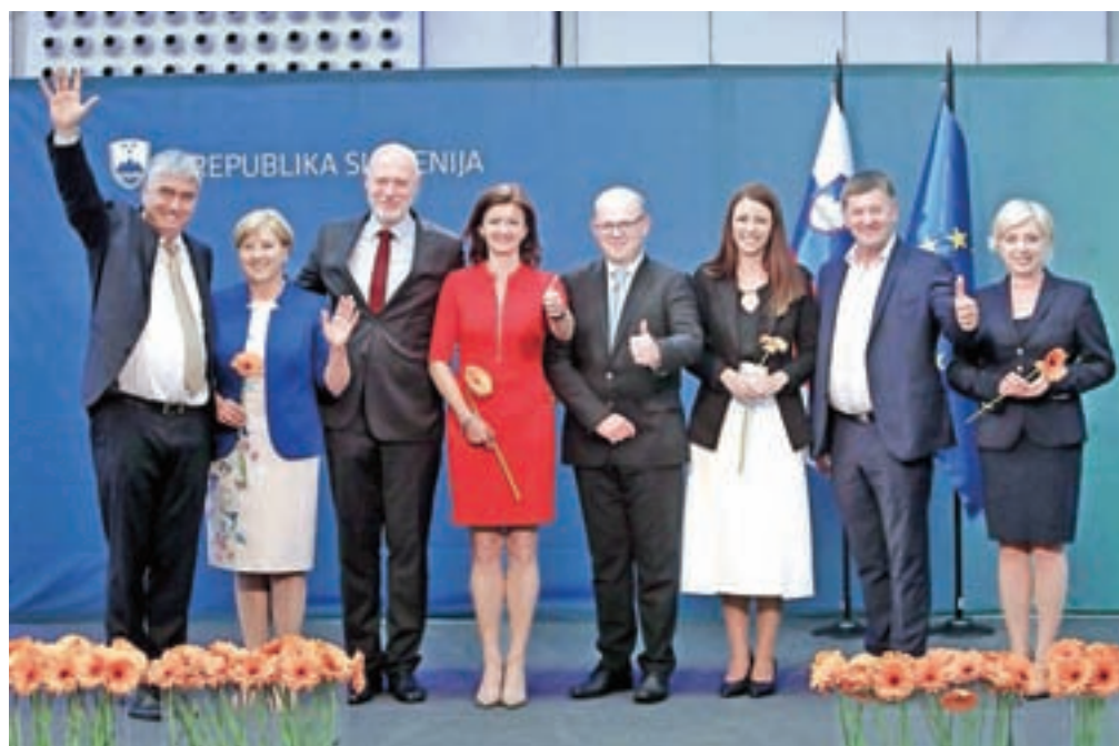
Zmagovita osmerica (od leve): Milan Zver, Ljudmila Novak, Milan Brglez, Tanja Fajon, Klemen Grošelj, Irena Joveva, Franc Bogovič in Romana Tomc