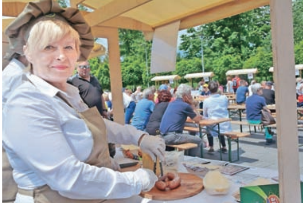
Na Festivalu kranjske klobase se je predstavilo trinajst certificiranih proizvajalcev.

Gre za dogodek, ki ni povezan z ocenjevanjem kranjskih klobas, ki je vrsto let potekalo v Hiši kulinarike Jezeršek v Sori. Ocenjevanja ni več, je pa zato festival. »Gre za nov dogodek, postavljen na nove temelje. Letos je na prostem, kakor bi moralo biti že lani, a zaradi slabega vremena to ni bilo mogoče. Nad odzivom smo zelo zadovoljni. Kranjska klobasa je ljudem všeč in radi jo jedo v vseh letnih časih. Predstavlja se 13 od 14 certificiranih proizvajalcev kranjske klobase, poleg tega imamo še sladko stojnico Gostilne Legastja in posebno