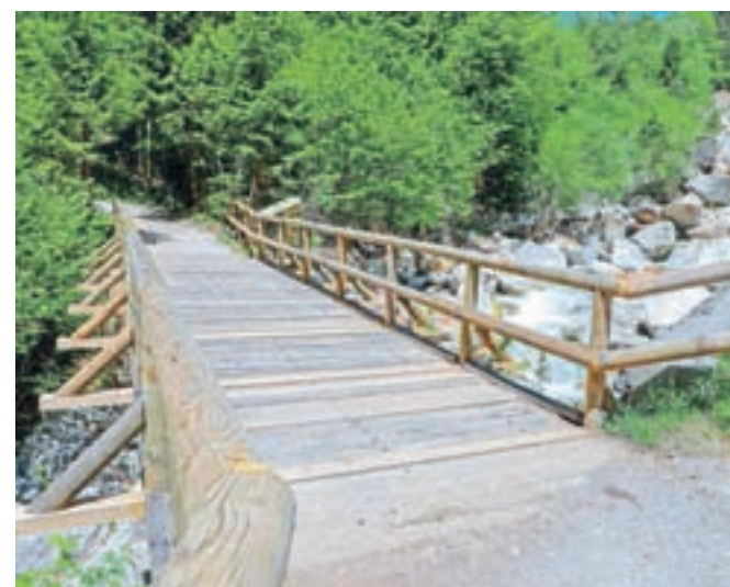
Že popravljen Bencetov most

dela treba čim prej začeti. Predvsem pa upa, da je stroka vse pregledala in pripravila temeljite projekte sanacije, ki bodo uredili in izboljšali stanje na celotni infrastrukturi v Dovžanovi soteski – od cest in vodotokov