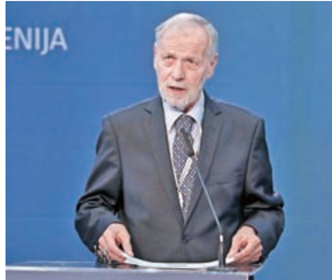
V nedeljo je delne volilne izide razglasil predsednik Državne volilne komisije Anton Gašper Frantar.

Gorenjski volivci so tudi nekoliko drugače porazdelili svojo naklonjenost. Tudi v volilni enoti Kranj I je sicer zmagala lista SDS in SLS s 26,28 odstotka volilnih glasov, na drugo mesto pa se ni uvrstila stranka SD tako kot na državni ravni, temveč LMŠ, ki so ji volivci dali 20,18 odstotka glasov. Tretjevrščeni stranki SD so namenili 14,38 odstotka glasov, NSi pa 12,62 odstotka, torej več kot na ravni države. Tako je bilo domala v vseh enajstih volilnih okrajih