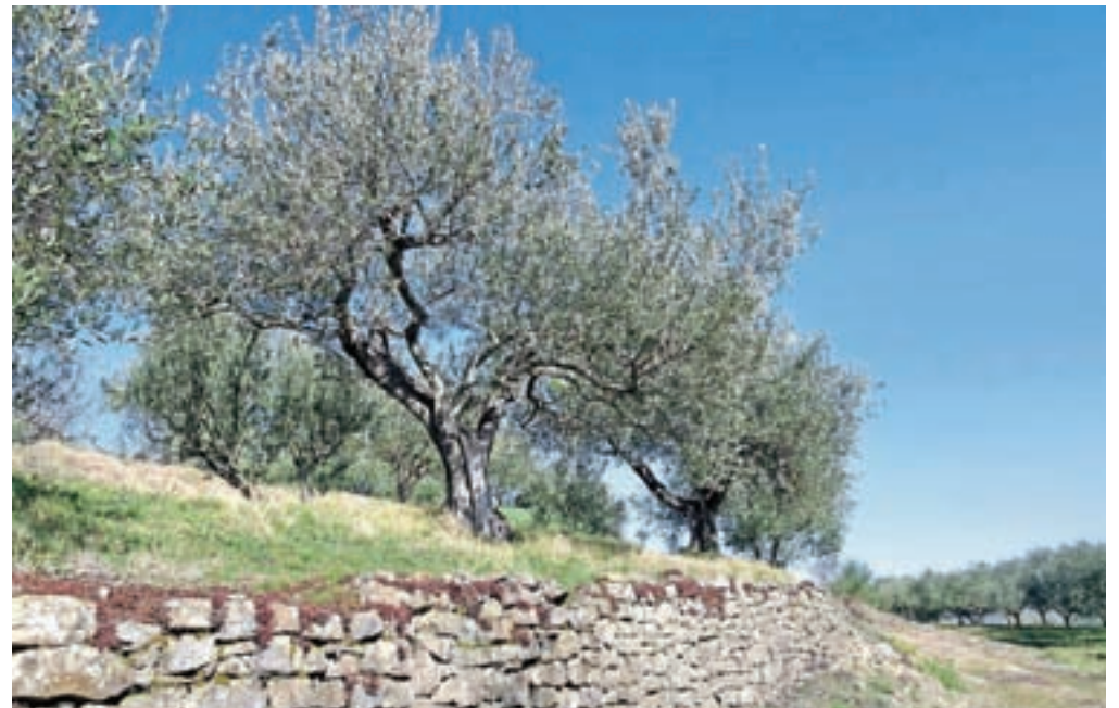
Velik del poti poteka med oljčnimi nasadi.