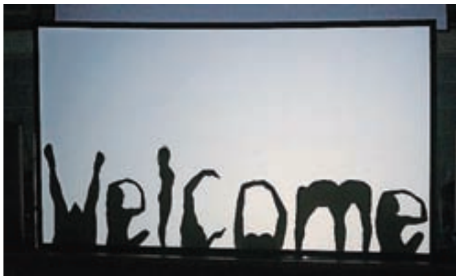
Pozdrav gledališča senc