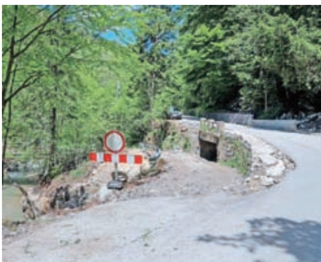
Dobrega pol leta po ujmi

Šele ko bo sanacijski načrt potrjen na vladi, bo občina lahko začela z deli na enajstih prioritarnih odsekih. »Smo pa rahlo zaskrbljeni, ker se lahko zgodi, da nam bo procedura na koncu namenila premalo časa za sanacijo, s katero moramo zaključiti do 25. novembra letos, če želimo počrpati sofinancirana državna sredstva,« je opozoril župan.