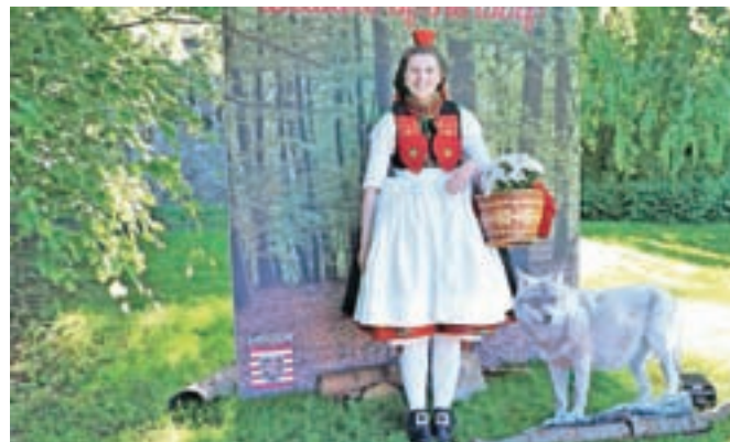
Točka za selfieje: Rdeča kapica