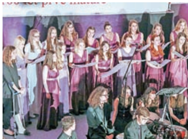
Danes se na Slovenskem trgu obeta zanimiv večer ob ognju s Carmen manet.