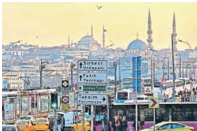
Ko se sonce začne spuščati nad mesto ...

A na koncu sončni zahod, sproščeni ribiči, pogled na trumo turistov, vonj začimb, turške kave in okusni bureki, turške sladice, sladke baklave ... odtehtajo tudi poporodne težave novega letališča.