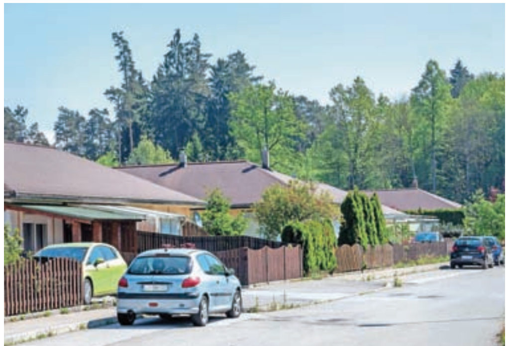
▶ 7. stran Stanovanci Zbiljskega gaja si želijo, da bi bilo naselje končno urejeno.