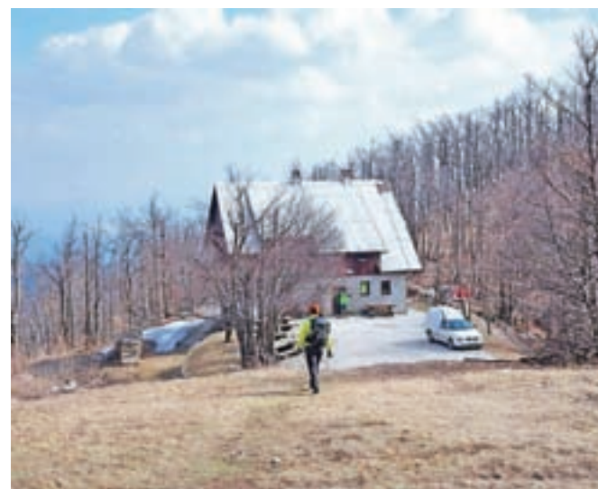
Pirnatova kočica pod Javornikom / Foto: Jelena Justin

Od kočice sestopimo v smeri Črnega Vrha. Zgornji del sestopa poteka po kolovozu, nato pa markirana pot zapusti kolovoz in se strmo spusti skozi gozd. Na koncu