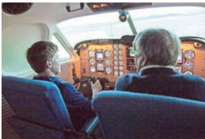
Mladi so se lahko preizkusili tudi na simulatorju letenja.