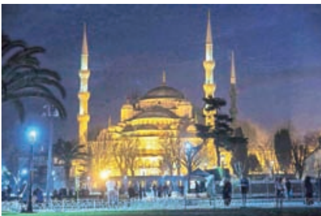
Nočno razsvetljena Modra mošeja