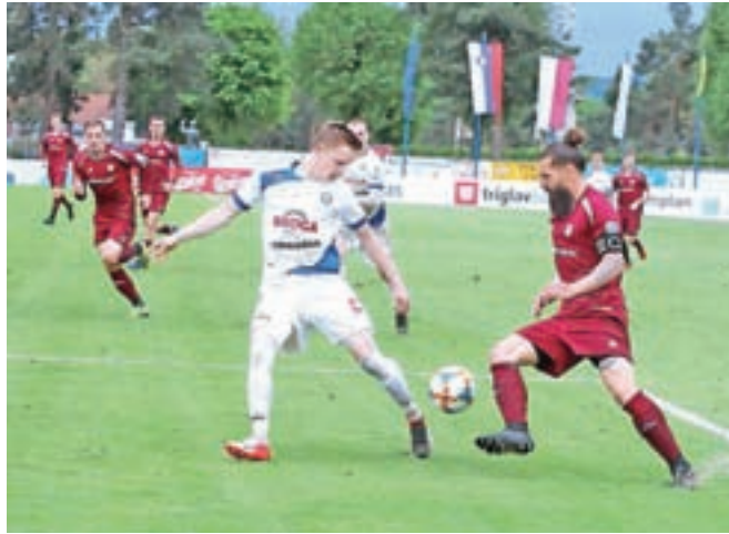
V Kranju so igralci Triglava moral priznati premoč nogometašev Celja.

Nogometaši v drugi SNL so igrali tekme 27. kroga. Ekipi Nafta 1903 in Rolteka Dob sta se razšli z delitvijo točk, bilo je 0 : 0. V Športnem parku Radomlje so nogometaši Kalcerja Radomlje z 2 : 1 premagali Brežice Terme Čatež. Vodi AŠK Bravo s