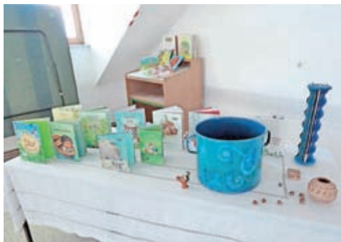
Zgodbe jim je približala s pomočjo številnih »zakladov«.