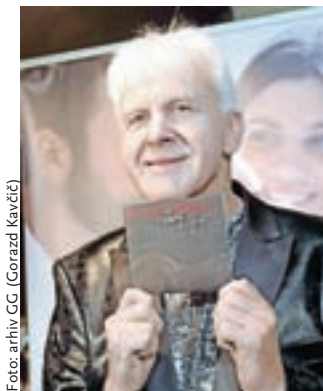
Legendarni Andrej Šifrer prihaja v Tržič.

Prvi koncert Glasbenih večerov bo v petek, 17. maja, ko bo ob 20. uri nastopil Andrej Šifrer. Pevec in znani kantavtor beleži že več kot štirideset let delovanja v slovenskem glasbenem prostoru. Glasbenik je v karieri prodal že več kot pol milijona plošč in se je s svojim dolgim spiskom – zdaj že zimzelenih uspešnic – uvrstil na seznam tistih, ki jih radi