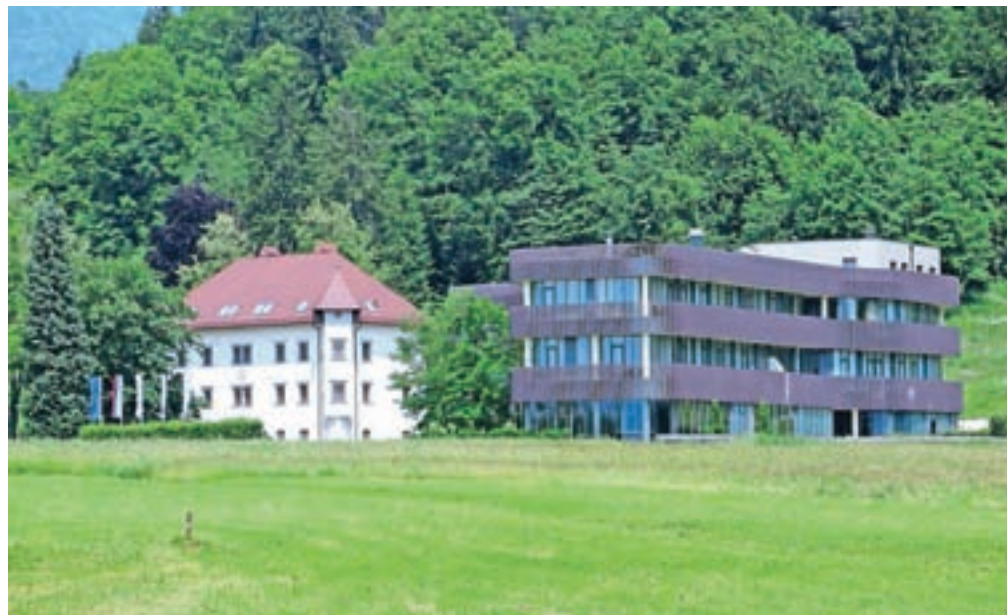
Ljubljanski kriminalisti so zaradi spornih poslov v primeru stečaja družbe Predence in njenega dvorca Lambergh v Dvorski vasi podali več kazenskih ovadb.