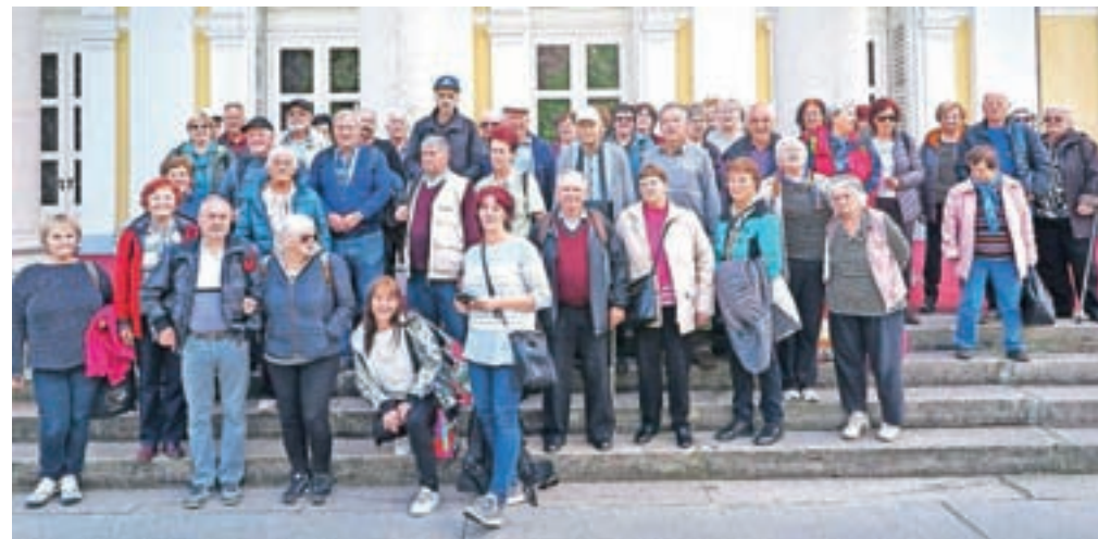
Pred vhodom v kristalno dvorano