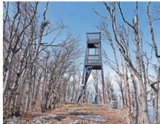
Razgledni stolp na vrhu Javornika, na okoliških drevesih pa so še vedno vidne – in še dolgo bodo – posledice žleda, ki je Slovenijo prizadel leta 2014.

gozda spet dosežemo kolovoz oz. cesto, ki ji nato sledimo vse do središča Črnega Vrha, kjer nas zvesto čaka jekleni konjiček. Naj opozorim, da so na celotni poti še vedno videti posledice