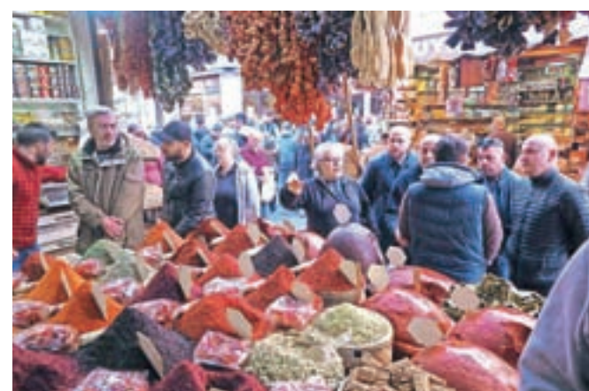
Barve bazarja se nežno mešajo z vonjem začimb in glasnostjo prodajalcev, ki si želijo zaslužka.

Na spletu so sicer objavljene vozni redi avtobusov, ki vozijo do ene od glavnih postaj metroja ali do končne postaje, kamor želite. Vendar ne vozijo 24 ur na dan, tako da se prej pozanimajte o posameznem voznem redu in ali so plačljivi le v domači valuti ali potrebujete Istanbulkart – kartico, na kateri je naložen denar in jo uporabljate v primeru vožnje z javnimi prevoznimi sredstvi po Carigradu. Med spletnimi komentatorji