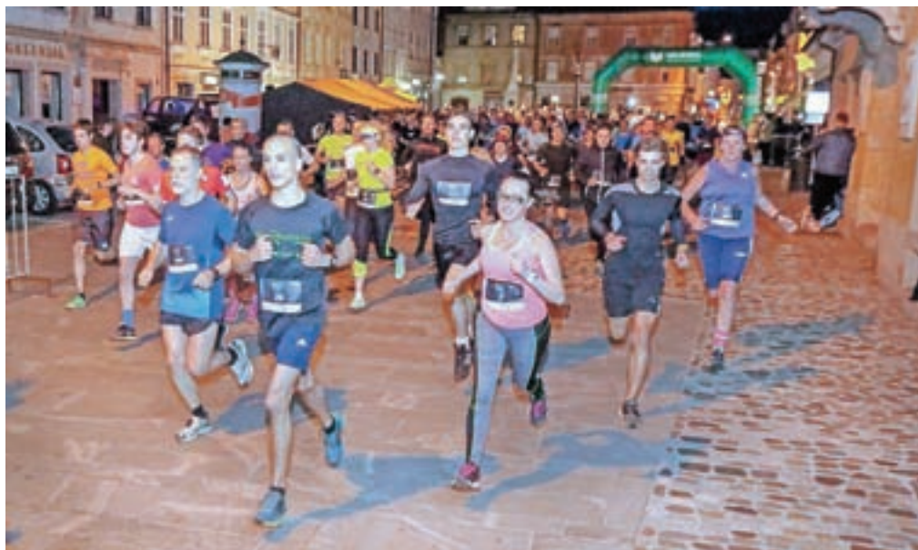
Na Nočnem teku po ulicah Kranja je teklo okrog sto petdeset tekačev.

je bila na koncu za sekundo hitrejša od dve leti mlajše Mirjam. »Prvič sva na tem teku in presenečeni sva, da sva bili najhitrejši. Za naju je to res zanimivo doživetje,« sta dejali gorski tekačici in atletinji, članici TK Šmarnogorska naveza. Tretja je bila Mihaela Kogovšek Pečečnik (22:38).