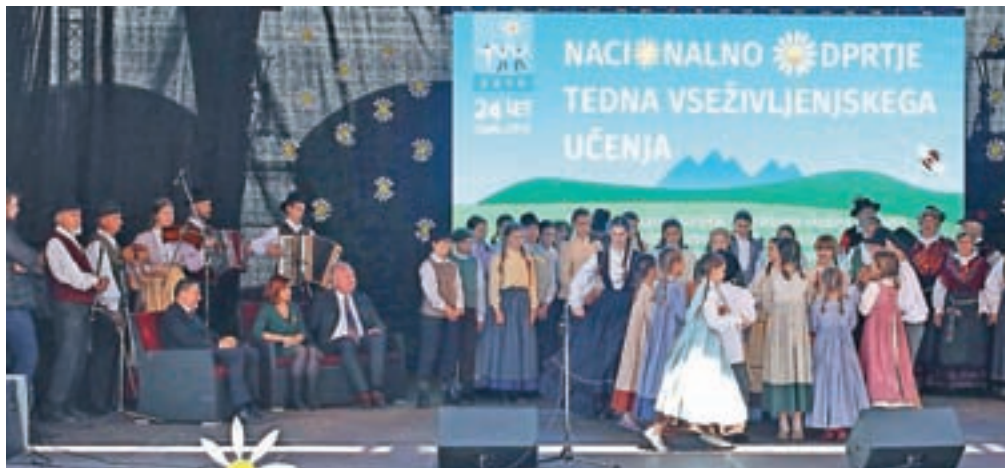
Nacionalno odprtje Tedna vseživljenjskega učenja je bilo v petek v Letnem gledališču Khislstein.