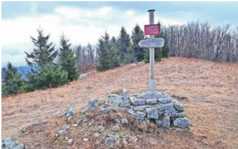
Neporaščen Čelkov vrh / Foto: Jelena Justin

Nadmorska višina: 1240 m Višinska razlika: 750 m Trajanje: 5 ur Zahtevnost: ★★★★★