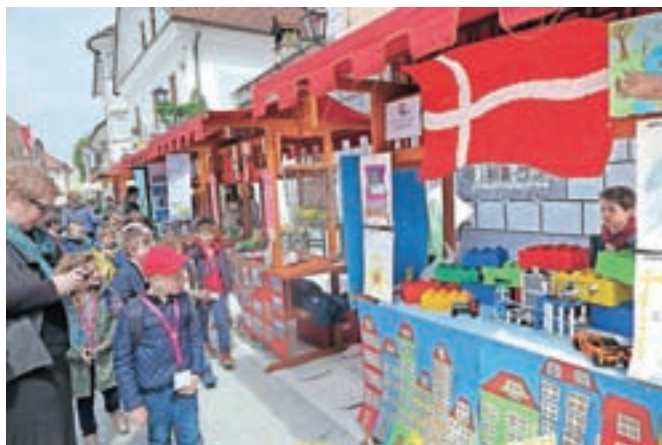
Linhartov trg je bil v sredo v znamenju Evrope.

navadami in posebnosti izbranih evropskih držav. Pri pripravi projekta so šole sodelovale z veleposlaništvimi, starši, občani in svojimi partnerskimi šolami v Evropi. Danes pa je Linhartov trg Evropa v malem. Mladi so predstavili zgodovino držav članic Evropske unije, njihove geografske in etnične značilnosti, kulturo, običaje, narodne noše, glasbo in kulinariko.«