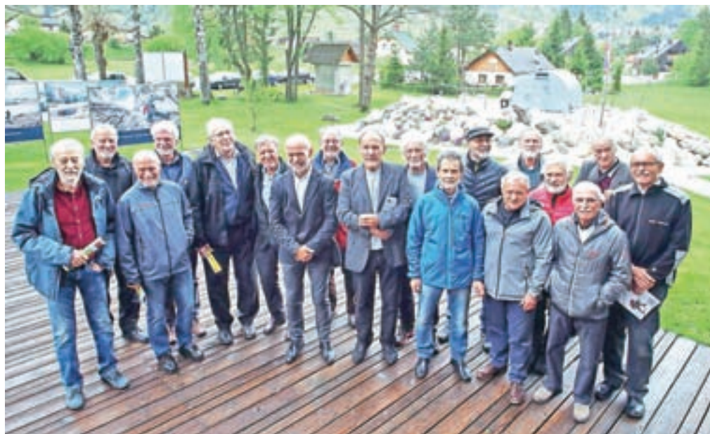
Člani odprave Everest 1979 štirideset let kasneje

Deset članov odprave ni več živih, preostali pa so se v Slovenskem planinskem muzeju začeli zbirati že ob 13. uri. Topli stiski rok, iskreni pozdravi in obujanje spominov med njimi so bili le uvod v slovesnost, ki se je začela s predvajanjem izvirnega zvočnega posnetka – pogovora med Nejcem Zaplotnikom ob prihodu na vrh in Tonetom Škarjo v baznem taboru, iz katerega je razvidno navdušenje celotne odprave, pa tudi nekaj skrbi pred sestopom, ki je alpinista še čakal. »To je bila zmaga vseh in takih zmag nam v sedanjosti najbolj manjka,« so si bili na