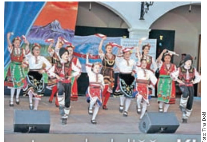
Otroška skupina Gaytanche Dimitrovgrad iz Bolgarije

in otroška folklorna skupina MKD Sv. Ciril in Metod iz Kranja so prikazali venček Ronenka in venček makedonskih plesov. Istrski ples je uprizorila Folklorna skupina Obalnega društva Sožitje; z odrsko postavitevijo Sijaj, sijaj sončece je nastopila otroška folklorna skupina Avrikelj, otroška folklorna skupina KUD