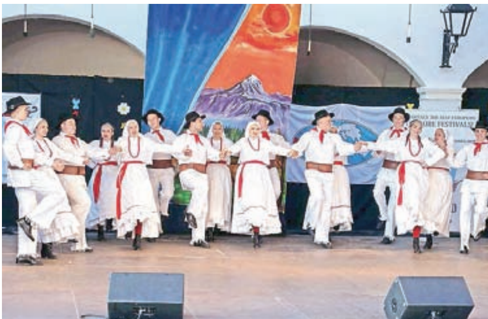
Mladinska folklorna skupina Iskraemeco Kranj

V dvodnevem programu, v petek so nastopili v Letnem gledališču Khislstein,