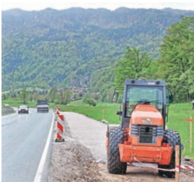
Gradbena dela so pri urejanju kolesarske povezave Bled-Bohinj začeli na odseku od Mačkovca do Bohinjske Bele.

Občina Bled je v preteklosti naročila novelacijo projektne dokumentacije in zagotovila zemljišča za gradnjo, tako blejska kot bohinjska občina sta dobili tudi