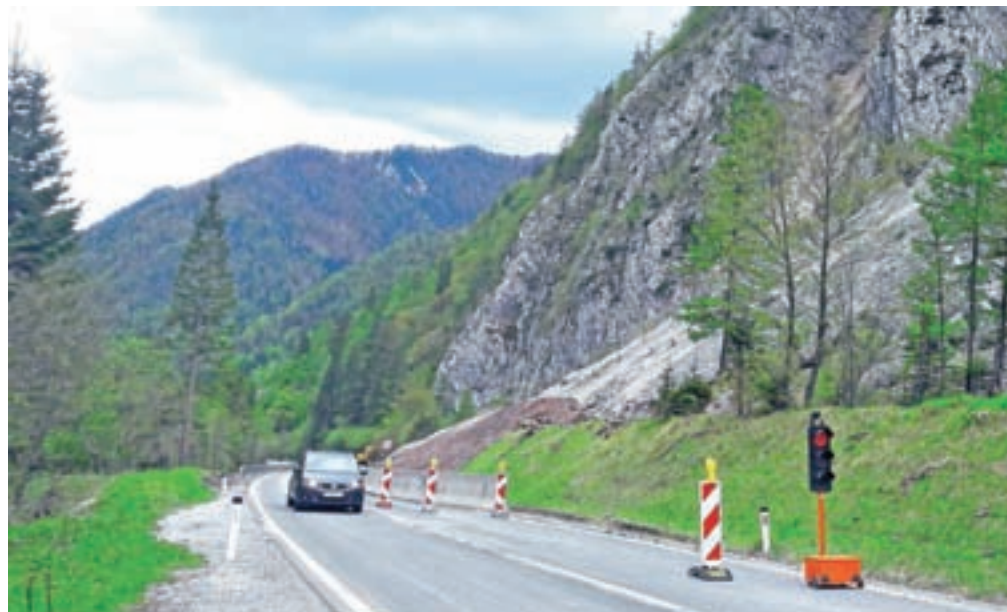
Cesta na Ljubelj je po aprilskem zaprtju zaradi podora od petka zvečer spet odprta, promet pa poteka izmenično enosmerno in je urejen s semaforjema.

»Promet sedaj izmenično poteka po prometnem pasu za smer proti Ljubelju, drugi