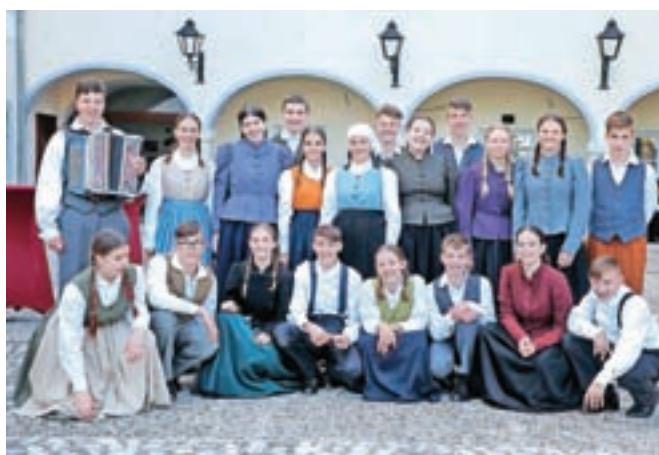
Otroška folklorna skupina KUD Oton Župančič Artiče