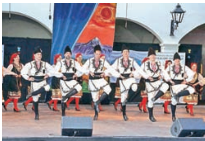
Folklorna skupina Transilvania iz Romunije

V spremljevalnem programu festivala so že v četrtek na Osnovni šoli Predoslje glasbeniki KD FS Iskraemeco Kranj in Štefan Arh iz Glasbene šole Bučar otrokom predstavili glasbo slovenskih pokrajin. Učenci od tretjega do devetega razreda so napisali pesmi na temo kulturna dediščina, kaj jim kultura pomeni, ter jih v petek predstavili v dvorani Kulturnega društva Predoslje.