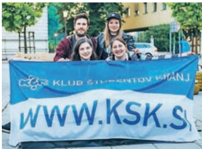
Četrto stoletje Teden mladih: marljivi organizatorji, aktivisti Kluba študentov Kranj

odru Bazena sklenili skupini S.A.R.S. ter Noair – vse do nedeljskih jutranjih sončnih žarkov.