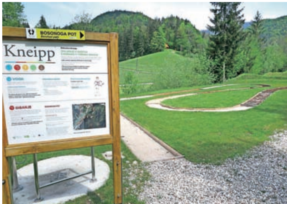
Krajša bosonoga pot je sestavljena iz desetih različnih naravnih podlag.