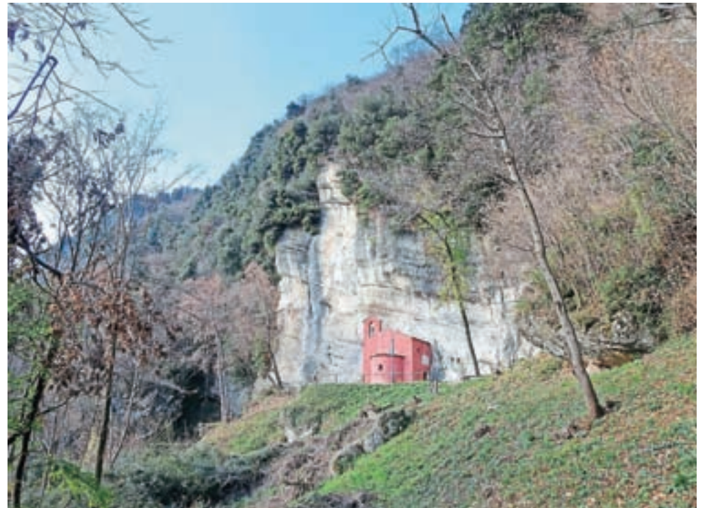
Cerkev svetega Mihaela leži pod previsno skalo, kjer potekajo številne športnoplezalne smeri.

vzpona je približno 400 višinskih metrov. Pot je speljana lepo med borovci in skalami, skozi gozd. Ko je strmega dela konec, smo na sedlu La Forchia, 847 n. m. Na sedlu opazimo dve poti, levo in desno. Izberemo levo pot, ki nas višje pripelje do krajšega travnatega pobočja, po katerem se strmo povzpemo do vrha Monte Brancota, 1015 n. m. Odpre se nam lep pogled na vse strani neba. Po grebenu nadaljujemo naprej. Čaka nas krajši sestop do še enega sedla, nato pa zagrizemo v strmino, ki se konča na vrhu drugega vrha - Monte Palantarinsa, 1049 n. m. Na vrhu je celo vpisna skrinjica in ogromen možic. Po grebenu nadaljujemo naprej do tretjega vrha, ki se imenuje Tre Corni, 1048 n. m. Grebena pot je ponekod malce