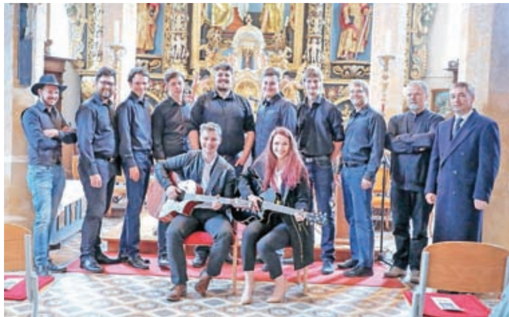
Nastopajoči ob odprtju na koncertu konec aprila v cerkvi Marijinega oznanjenja v Crngrobu.

Mengeš – Člani Likovnega društva Mengeš vabijo na jutrišnje odprte likovne razstave Svetlo-temno, ki bo ob 18. uri v predverju Kulturnega doma Mengeš. Razstava bo na ogled do 10. junija.