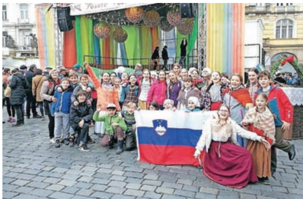
Nastop na mednarodnem festivalu je mladim plesalcem odlično uspel.