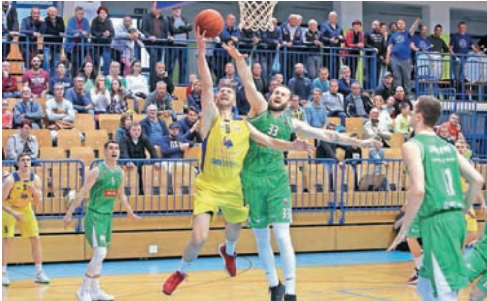
Košarkarji Gorenjske gradbene družbe Šenčur (v rumenih dresih) so pred domačimi navijači premagali ljubljansko Petrol Olimpijo, ki brani naslov.