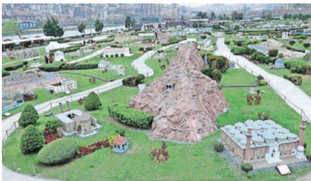
Turčija v malem se razprostira na prostem.

Miniaturk združuje bogato arhitekturno dediščino civilizacije, ki je vladala in pustila svoj pečat tu: vse od antičnih časov do Rimljanov, Bizantinov, seldžuškega in osmanskega