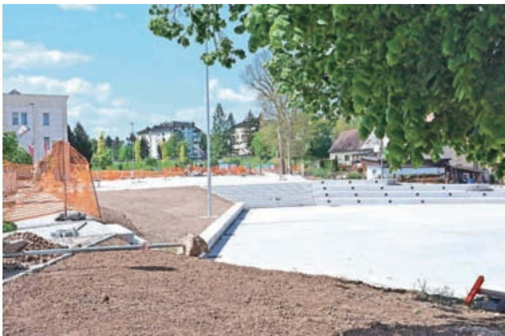
Center Medvod bo dobil precej drugačno podobo. Gradijo tržnico, park in večnamensko ploščad.

Novogradnja bo namenjena osrednjim dejavnostim ter zadrževanju na javnem prostoru. Na osrednjem delu območja bo urejen pokrit tržni prostor z manjšim gostinskim lokalom z letnim vrtom in javnimi sanitarijami. Na večnamenski ploščadi bodo občasno tudi javne prireditve, pozimi pa bodo tam postavili montažno drsališče. Projekt obsega tudi mestni park z zelenimi površinami. Nove pridobitve, še posebej tržnica, bodo zagotovo prispevale k oživitvi centra Medvod. Še pred njenim odprtjem bo določena ureditev tržnice, vzdrževanje in upravljanje. Medvoški občinski svetniki so na seji konec marca sprejeli osnutek Odloka o ureditvi javne tržnice