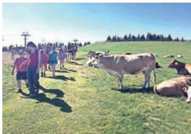
Na taboru je velik poudarek na aktivnostih v naravi.