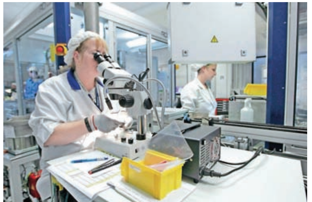
Letošnji regres, ki ga bodo zaposleni prejeli najkasneje do konca junija, v višini do povprečne bruto plače ne bo obdavčen s prispevki in dohodnino.