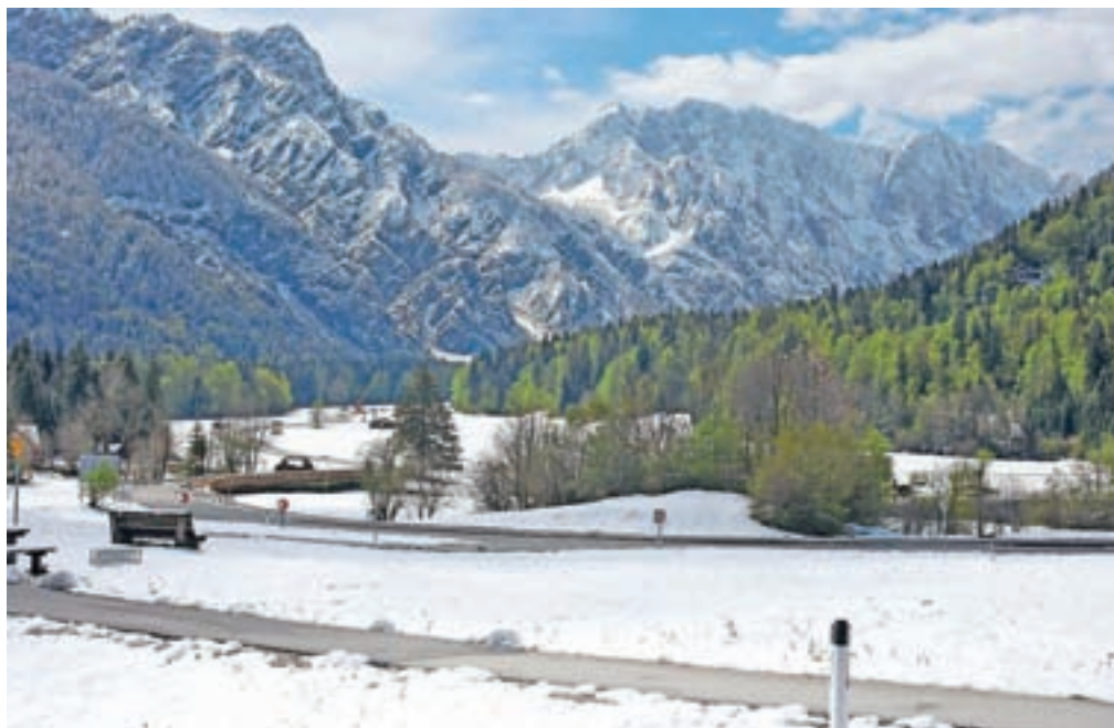
Pogled iz Rateč proti Planici v ponedeljek, 6. maja 2019

Praznično majsko nedeljo je marsikje po Gorenjskem pobelil sneg, v Planini pod Golico ga je zapadlo 32 centimetrov, v Ratečah 15. Snežilo je ponekod še včeraj, za danes zjutraj je bila napovedana slana.