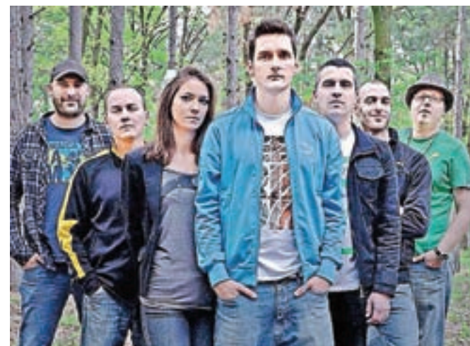
Teden mladih bosta v soboto, 18. maja, na odru Bazena sklenili zasedbi S.A.R.S. (na sliki) ter Noair .

Poleg koncertov pa Teden mladih ponuja številne ostale dogodke in aktivnosti: zvrstili se bodo nočni tek po kranjskih ulicah, ponytлон, impro-večer, modna revija, potopisni večer, družabne igre, filmske projekcije, ulično gledališče, razstave mladih umetniških ustvarjalcev ... (celoten program festivala je na spletni strani https://www.tm19.si/ ). Pred nami je torej res najdaljši teden v letu.