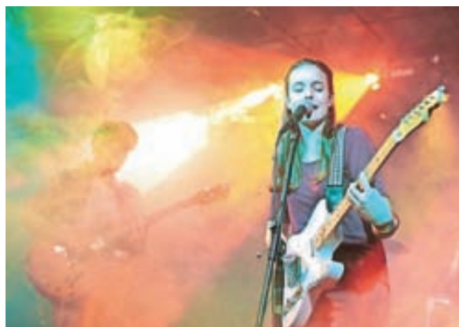
Že prvi večer Tedna mladih bo v Klubaru nastopila zasedba Koala Voice .

M ladinski festival, ki vsako leto znova poživlja kranjsko mestno jedro, organizirajo marljivi članice in člani Kluba študentov Kranj. Teden mladih – edini teden v letu, ki ima devet dni – bo letos napolnil že četrto stletja, v vseh teh letih pa je iz dogodka z nekaj stojnicami in manjšimi koncerti zrasel v velik slovenski mladinski festival, ki v gorenjsko prestolnico privabi na tisoče mladih od blizu in daleč. Tudi tokrat ponuja pestro paleto aktivnosti: zvrstili se bodo zanimivi športni,