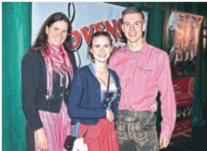
Med občinstvom smo srečali skupinico iz Neuburga.