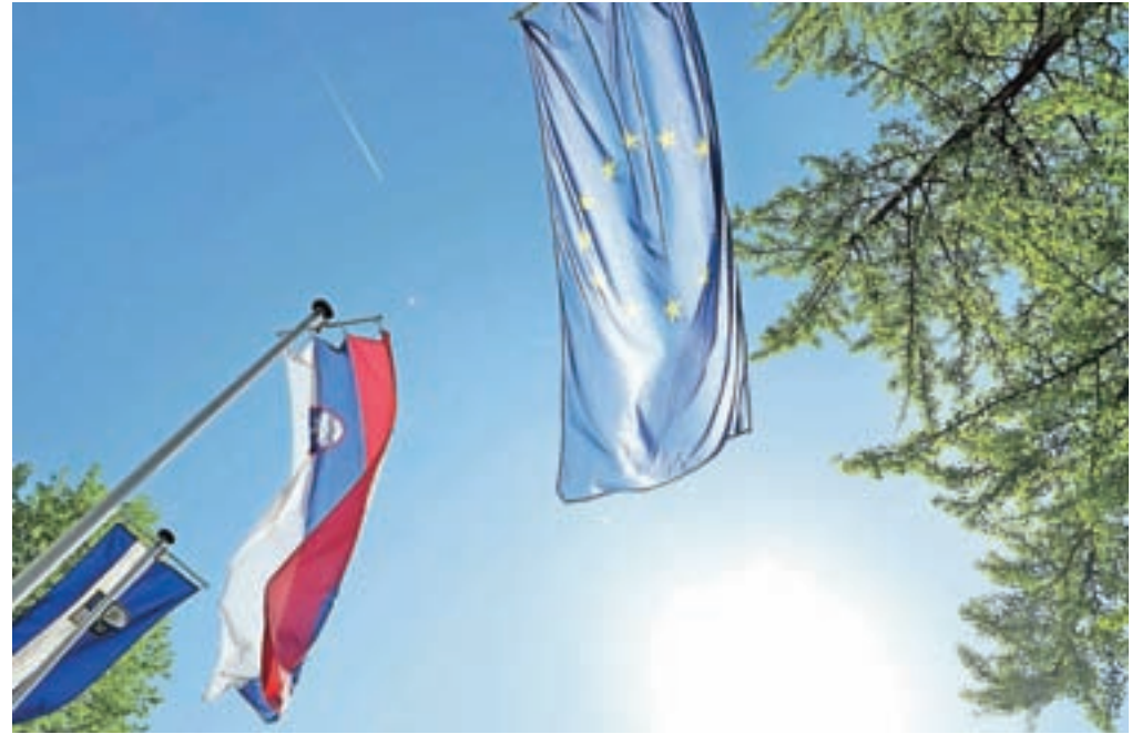
Slovenija je članica EU od 1. maja 2004.

Sicer pa primerjave med članicami evropske družine kažejo, da je Slovenija na veliko področjih nadpovprečna, celo vodilna. Med vsemi državami EU ima Slovenija na primer največji delež diplomantk na področju naravoslovja, tehnologije, inženirstva in matematike,