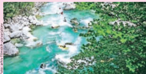
Boj za neokrnjeno naravo: Nepoškodovane

Škofja Loka – V četrtek, 9. maja, bo ob 20. uri v Kinu Sora projekcija filma Nepoškodovane. Film prikazuje zgodbe o strastnih lokalnih aktivistih, ki v vsakodnevnem življenju bijejo boj za čiste, divje in nezajezene reke na Balkanskem polotoku, saj z več kot 2700 načrtovanimi jezovi korupcija in pohlep kruto posegata v zadnje koščke evropske divjine. Filmu bo sledil pogovor z ustvarjalci.