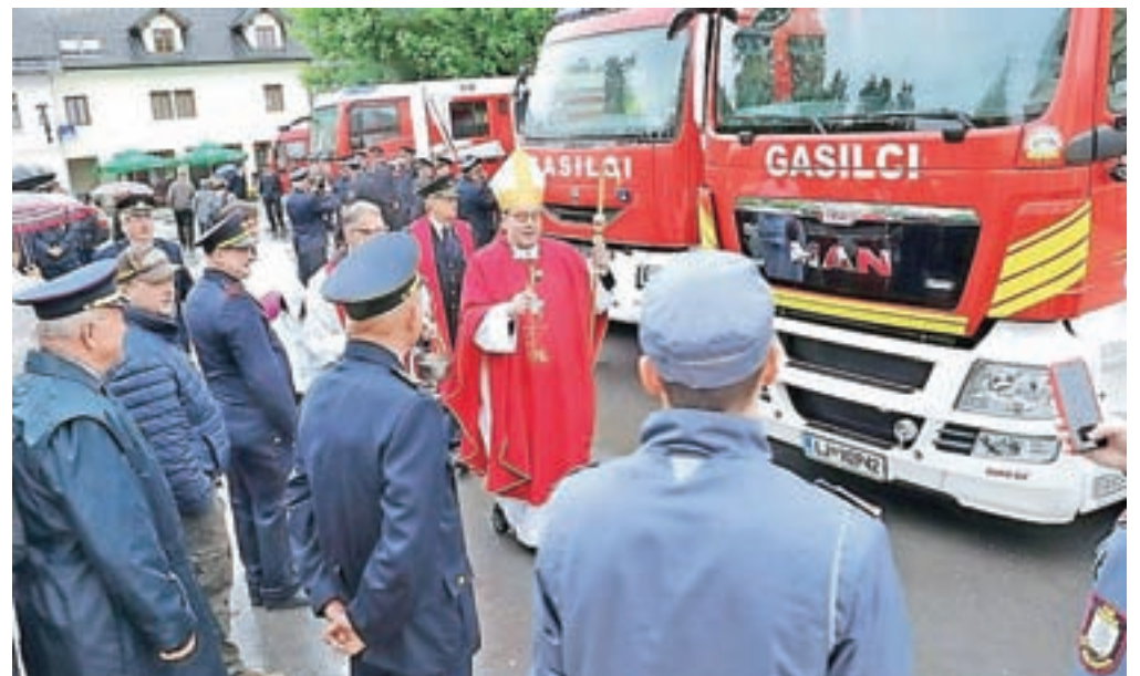
Mariborski nadškof Alojzij Cvikl blagoslovlja gasilska vozila.

Po maši je mariborski nadškof blagoslovil gasilce in njihova pred baziliko razporejena vozila.