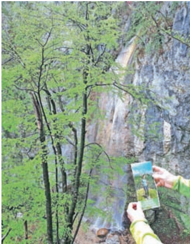
Slap z zanimivim imenom Hudič babo pere nad dolino Završnice je vključen v novi zemljevid.

Pot do slapu je ena od šestnajstih pohodniških in gorskokolesarskih poti v občini Žirovnica, ki so vključene v novi zemljevid, ki so ga nedavno izdali na Zavodu za