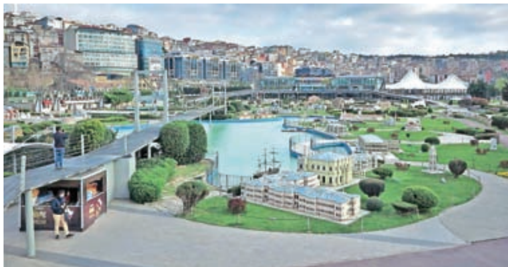
V Miniaturku se lahko obiskovalci sprehodijo tudi čez most.

cesarstva do danes. Odprli so ga leta 2003, v njem pa si lahko ogledamo 134 modelov, od tega 61 iz Carigrada, šestdeset iz Anatolije in 13 iz osmanskega ozemlja zunaj Turčije. Predstavljeni modeli iz zadnjega sklopa so bili skrbno izbrani glede na njihovo vlogo v takratnem času in prepoznavnost. Vidimo lahko pomanjšani znameniti most iz Mostarja ali pa občudujemo pristrčne in edinstvene pomanjšane Pamukkale. V parku naletimo tudi na pomanjšani