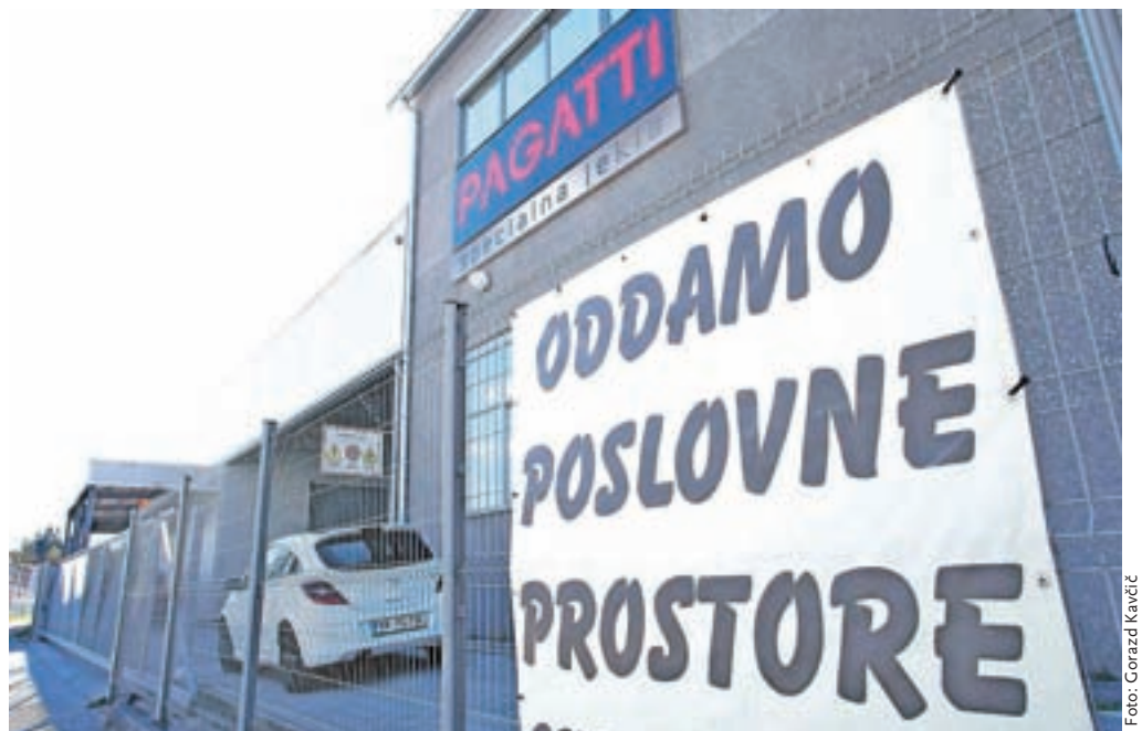
Najemni trg poslovnih površin se je lani dodatno ohlajal tudi v Kranju in Šenčurju.

Za najem pisarn je bilo lani po podatkih Gursa sklenjenih 2785 pogodb (predlani 3583), od tega je bilo 1861 novih pogodb in 924 aneksov (podaljšanj). Za lokale je bilo skupno sklenjenih 1048 pogodb (1515 v letu 2017); novih pogodb je bilo 787, aneksov k obstoječim pogodbam pa 261. Upadanje števila sklenjenih najemov je za lokale izrazitejše kot za pisarne in se je tudi prej začelo, saj se je večina nezasedenih trgovskih in storitvenih lokalov