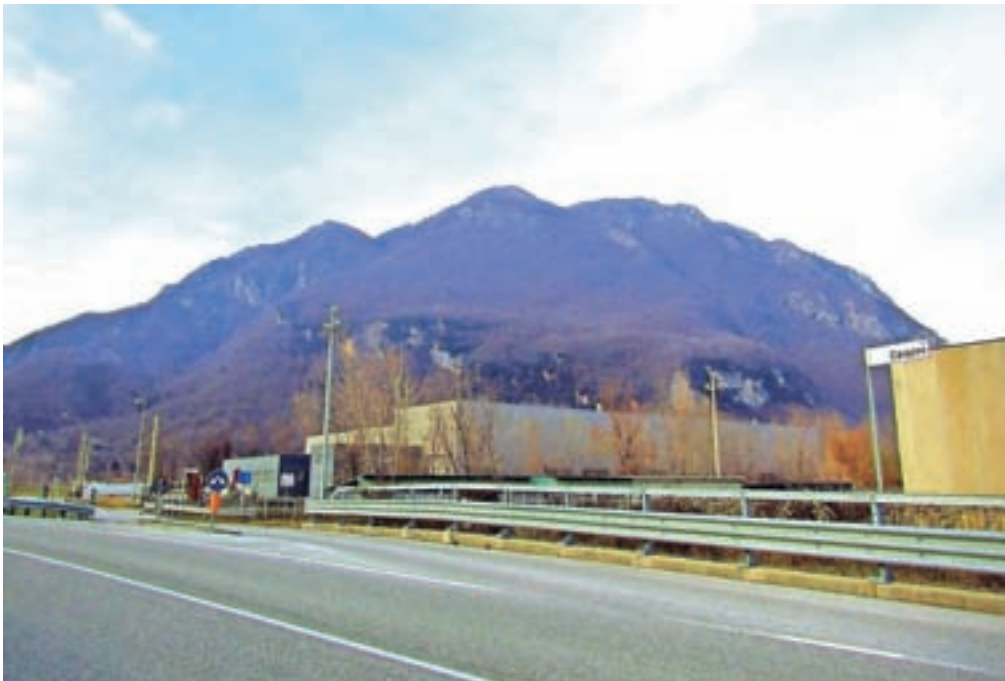
Trojček, ki ga bomo obiskali, kot se vidi z glavne ceste