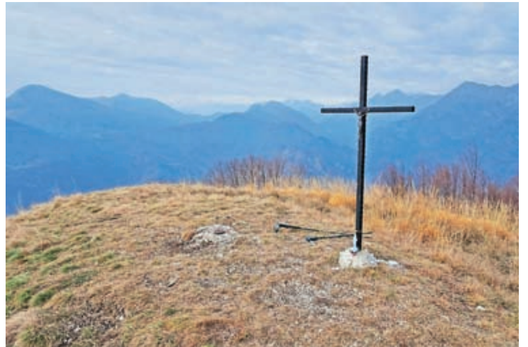
Vrh Monte Brancot