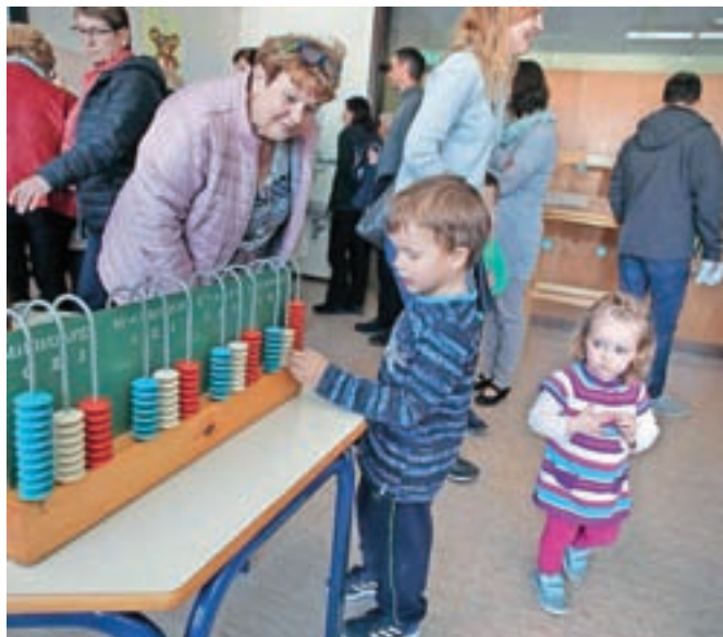
Obiskovalci so si z zanimanjem ogledali razstavo starih šolskih predmetov.

Prireditev, ki so jo na čudovito sobotno dopoldne pripravili pred šolo, so z nastopi obogatili učenci. Obiskovalce so nato povabili še v šolske prostore, kjer so si ogledali, kaj vse so raziskovali in ustvarjali v okviru šolskega zgodovinskega društva, ustanovljenega ob jubileju šole. Pripravili so razstavo starih šolskih predmetov, fotografij in dokumentov ter izdelkov učencev, ogledati pa si je bilo možno tudi bukvarnico s starimi šolskimi knjigami.