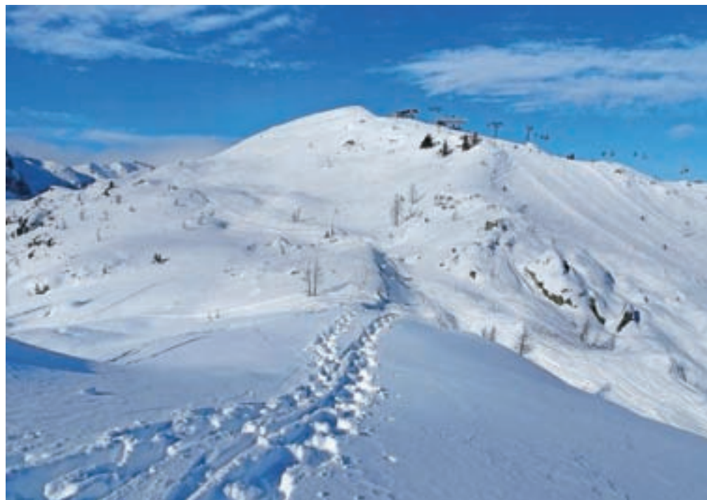
Monte Madrizze, če jo pogledamo iz smeri Cime Madrizze

smo nad kočo, sledimo dolini v desno, visoko nad sabo pa vidimo zgornjo postajo žičnice, ki s severne strani pripelje na naš vrh. Če je snega manj, bomo celo videli tablo, ki nas usmeri desno. Če pa table ne vidimo, pa sledimo dolinici v desno, ki teče pred nami, in na enem od dreves bomo zagledali markacije. Vzpenjamo se v smeri markacij. Pot vzpona je povsem logična. Strmina narašča, potem pa pot zavije v levo, rahlo preči pobočje in nas pripelje na prostrano pobočje. Žičnica je že precej bližje. Sledimo vzponu v desno in po vsej verjetnosti bomo dosegli še eno od poti turnih smučarjev. Zavijemo levo in prečimo pobočje. Dosežemo smerokaz za planino Winkel, ki je daleč pod nami. Ko