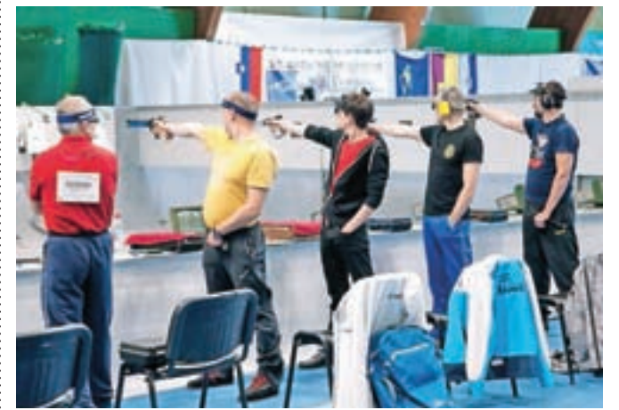
Več kot sedemsto tekmovalcev se je udeležilo državnega prvenstva v Mengšu.

Ekipno so državni prvaki v streljanju z zračno puško postali člani SD Trzin, ženska članska ekipa SD Lotrič Železniki pa je v streljanju z zračno pištolo osvojila tretje mesto.