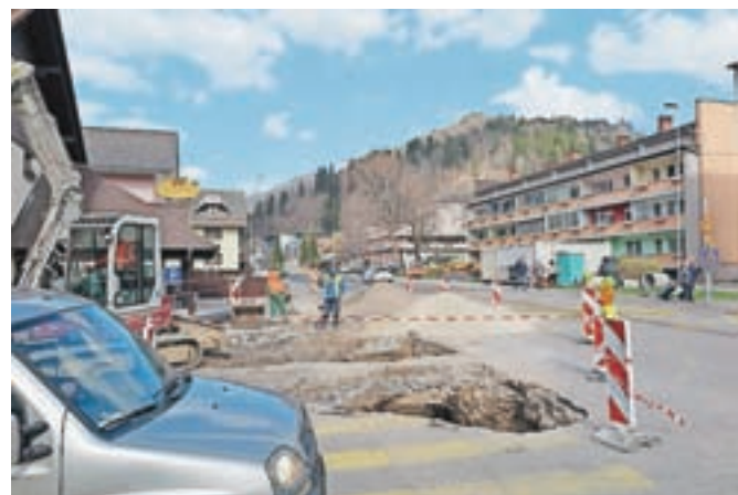
Dela na odseku državne ceste R2 skozi Jesenice (od zdravstvenega doma do bolnišnice) se vendarle nadaljujejo.

Jesenice – Obnova glave ceste skozi Jesenice, ki je nekaj mesecev stala zaradi zapletov s pridobivanjem zemljišč, se vendarle nadaljuje. Prejšnji teden so delavci začeli urejati uvoz do slaščičarne Metuljček, čaka pa jih še ureditev mostu čez potok Jesenica. Zaradi zapletov je rok za dokončanje del podaljšan do 31. avgusta letos (prvotno bi dela morala zaključena že do sredine lanskega leta). Pogodbena vrednost vseh del znaša 1,4 milijona evrov, gre za državni projekt, Občina Jesenice pa sodeluje s sofinanciranjem v višini pol milijona evrov. Na Občini Jesenice so zadovoljni, da se dela nadaljujejo, občane pa prosijo, naj upoštevajo prometno signalizacijo na tem območju, ki jo bodo izvajalci sproti prilagajali poteku del. Dolej je država že obnovila odseka Hrušica–Splošna bolnišnica Jesenice in Restavracija Turist–Petrol na Koroški Beli. Zgrajeno je tudi novo krožišče na Hrušici.