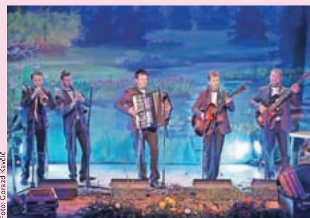
Kvintet Dori razveseljuje že skoraj četrto stoletje.