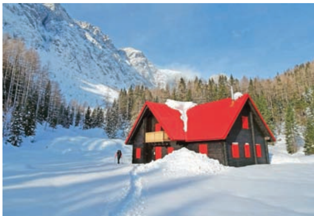
Hišica iz pravljice, Baita Winkel na višini 1470 n. m.

Nadmorska višina: 1818 m Višinska razlika: 550 m Trajanje: 4 ure Zahtevnost: ★★★★★