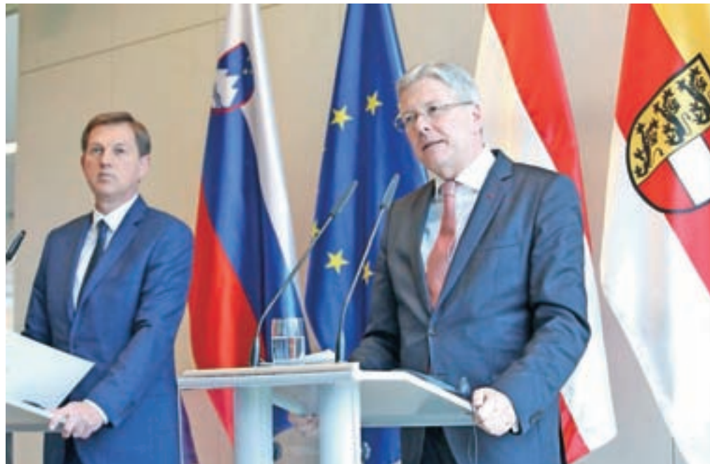
Dr. Miro Cerar (levo) in dr. Peter Kaiser na konferenci za novinarje po seji skupnega odbora. S koroškim deželnim glavarjem je prišlo na Brdo še pet članov deželne vlade, kar potrjuje, da daje Koroška sodelovanju s Slovenijo velik pomen.

Oba sta na konferenci za novinarje po koncu zasedanja izražala zadovoljstvo nad sodelovanjem med sosedama, ki je na nekaterih področjih vzorno, na primer pri varovanju pred naravnimi in drugimi nesrečami, kjer načrtujejo še letos veliko skupno vajo, pri izobraževanju, čezmejnih projektih, pri turizmu, energetiki in športu. Tu je slovenska stran izjemno hvaležna Koroški, ki je podprla našo kandidacijo za organizacijo svetovnega prvenstva v nordijskih disciplinah leta 2023 v Planici. Nekateri skupni projekti presega sodelovanje med Koroško in Slovenijo, ampak imajo širše evropske razsežnosti, zlasti pri prometni politiki in skrbi za karavanški železniški in cestni predor. Leta 2026, ko bo dvocevni karavanški