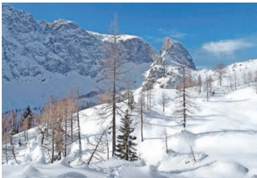
Konjski špik in Torre Winkel. Sneženo kraljestvo.