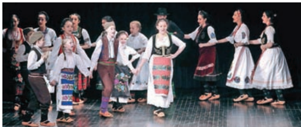
Otroška in mladinska skupina KPŠHD Vuk Karadžić Radovljica