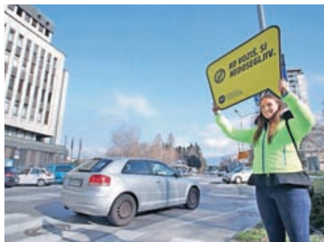
Akcija je neposredna in konkretna ter sledi jasnemu cilju: voznike aktivno ozaveščati, predvsem pa nemudoma vplivati na njihovo vedenje v prometu, so razložili v agenciji za varnost prometa.

AVP ugotavlja, da je med vozniki vse obsežnejša uporaba mobilnih telefonov, ki poslabšuje njihov reakcijski čas za kar polovico. »Mobilni telefoni so zaradi pogoste uporabe vse večji motilci pozornosti za varno udeležbo v prometu. In to ne velja le za voznike vozil, temveč tudi za pešce in kolesarje,« opozarjajo na AVP in dodajajo, da telefoniranje na voznika učinkuje enako, kot bi imel v krvi 0,8 promila alkohola, med pisanjem