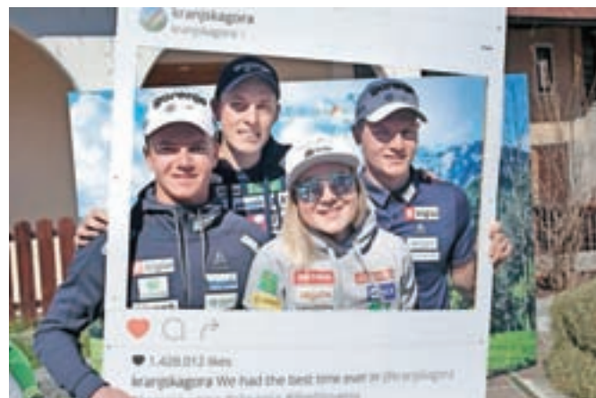
Pred domačimi navijači se je predstavil Team Kranjska Gora.