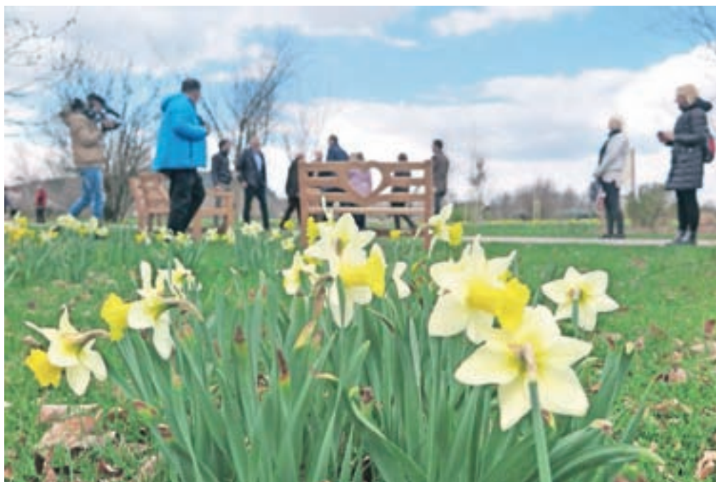
V Arboretumu bo to pomlad zacvetelo tudi skoraj pol milijona narcis.

Poleg večjega števila narcis so letošnja novost tudi cvetlične iluzije, ki so jih pripravili z Muzejem iluzij