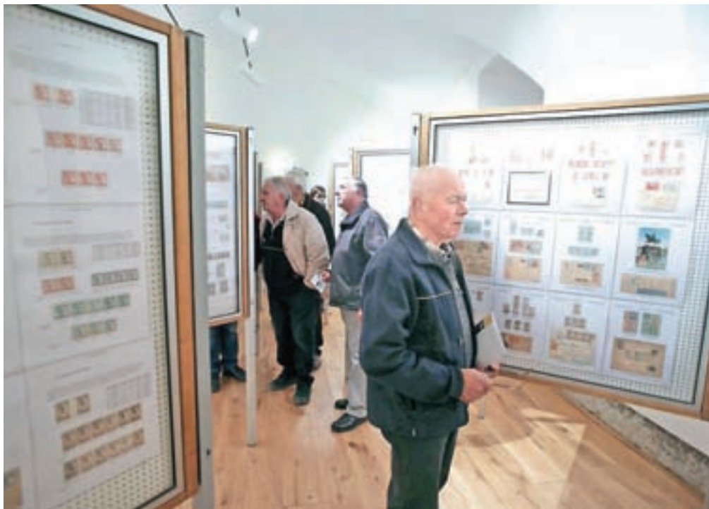
V prostorih mekinjskega samostana je bilo na ogled več dragocenih zbirk znamk, tudi prve slovenske znamke Verigarji.