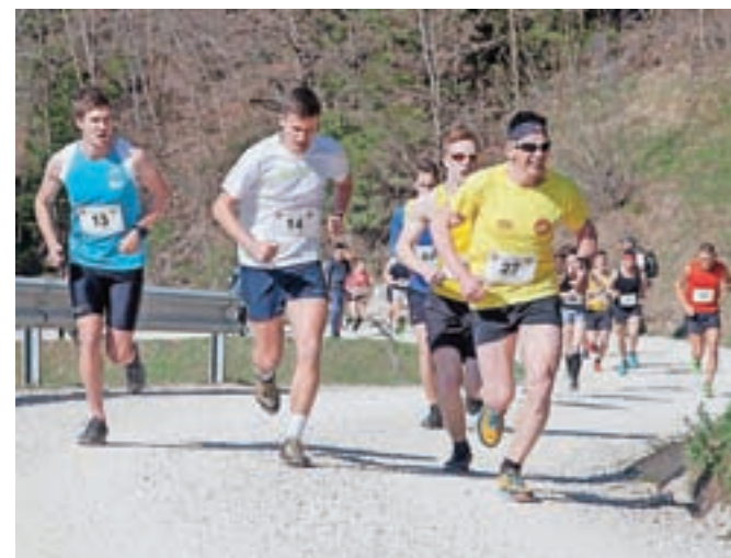
K Sv. Primožu je teklo več kot sto tekačev.

S Tekom k Sv. Primožu se je tako začel Tekski pokal Občine Kamnik, hkrati pa je bila to tudi prva tekma za Pokal Slovenije v gorskih tekih za otroške in mladinske kategorije.