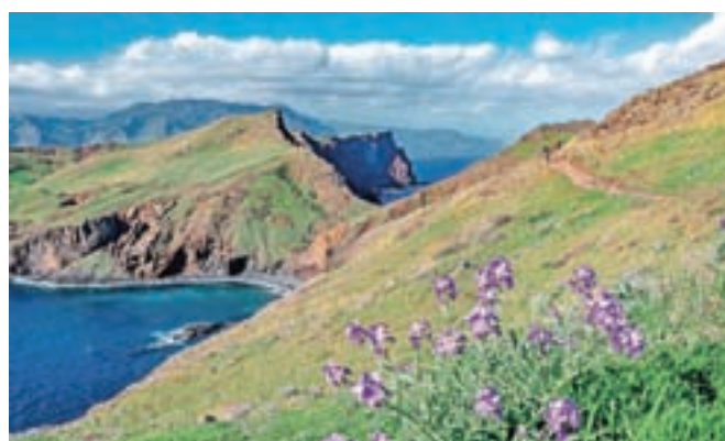
Razgledi, ki jemljejo dih

eno smer kljub vsemu preho-diš dobrih pet kilometrov in narediš 700 »višincev«.