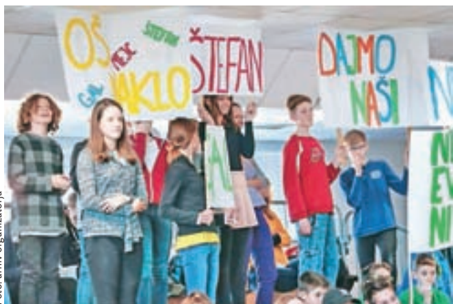
Navijači OŠ Naklo so spodbujali svoje sošolce in prijatelje.