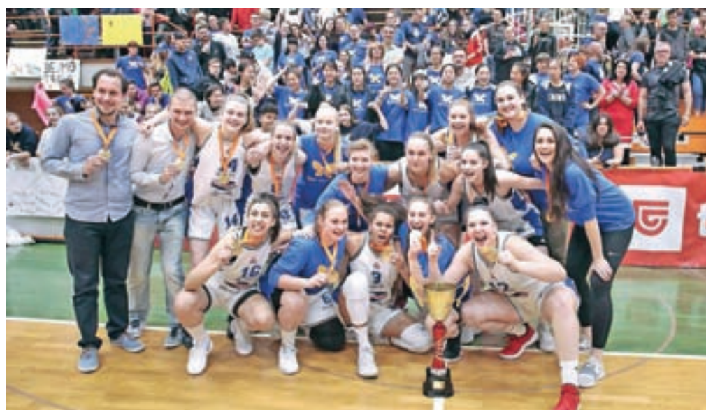
Košarkarice Triglava so mladinske državne prvakinje.

Kranj – V Košarkarskem klubu Triglav so bili organizatorji zaključnega turnirja v košarki za mladinke. Na petkovih polfinalnih tekmah je najprej domača ekipa Triglava kar z 80 : 44 premagala Konjice, ekipa Cinkarne Celje pa je bila z 68 : 40 boljša od Aksona Ilirije. Tako sta se na nedeljski tekmi za tretje mesto pomerili ekipi Konjic in Aksona Ilirije, zmagala pa je ekipa Aksona Ilirije. Najbolj napet in zanimiv je bil finalni obračun med mlado ekipo Triglavovih košarkaric in ekipo Cinkarne Celje. Na krilih glasnih navijačev so na koncu slavile domačinke, ki so Celjanke ugnale z rezultatom 57 : 54. »Mislim, da je to vrhunec mladinske