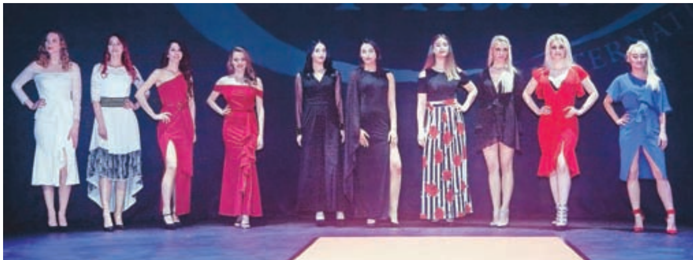
Na letošnjem lepotnem izboru Miss Alpe Adria se je predstavilo deset deklet iz vse Slovenije.