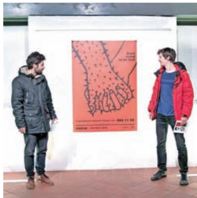
Na razstavi si lahko ogledamo zelo raznolike oblikovalske rešitve za plakate, povezane s problematiko nasilja nad ženskami.