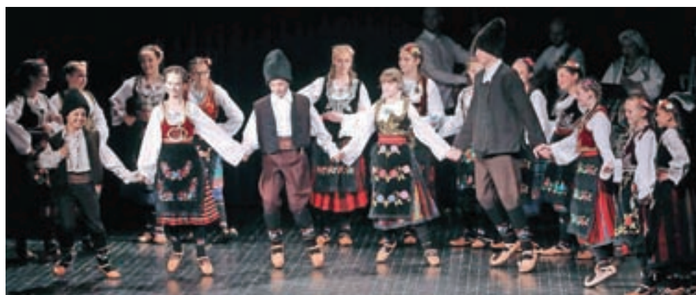
Mladinska folklorna skupina KD Brdo Kranj

in kulture. Pri nas skorajda ni regije, kjer ne bi delovalo vsaj eno manjšinsko društvo. Njihovo kulturno udejstvovanje v lokalnem okolju je izrednega pomena, ne samo za manjšine, temveč tudi za lokalno prebivalstvo. Skozi njihove pestre aktivnosti lokalno prebivalstvo spoznava različnost kultur,