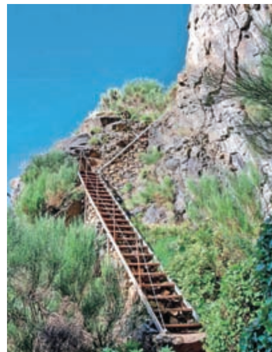
Premaganje »višincev« je videti nekako takole ...