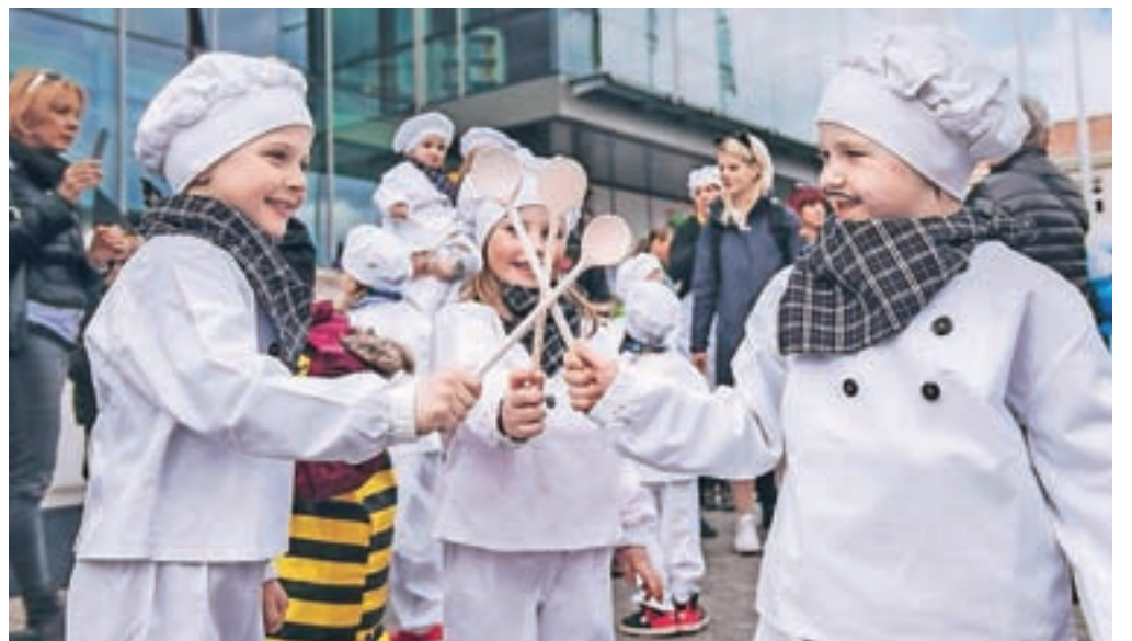
Na kranjskih ulicah je bilo letos veliko najmlajših, ki so popestrili tudi mednarodno pustno povorko.

SVET ZAVODA OSNOVNE ŠOLE DAVORINA JENKA CERKLJE NA GORENJSKEM na podlagi sklepa, sprejetega na 14. seji dne 19. 2. 2019, razpisuje delovno mesto