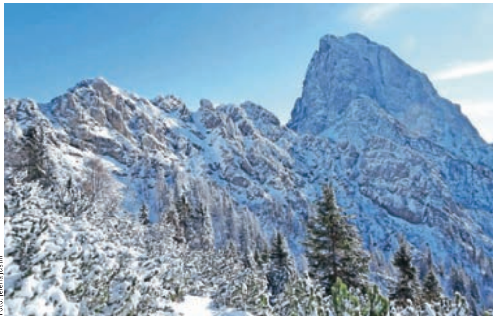
Divja, čudovita, nezadržno privlačna stena Monte Sernia nas spremlja večino poti.

Nadmorska višina: 1806 m Višinska razlika: 1005 m Trajanje: 5 ur Zahtevnost: ★★★★★