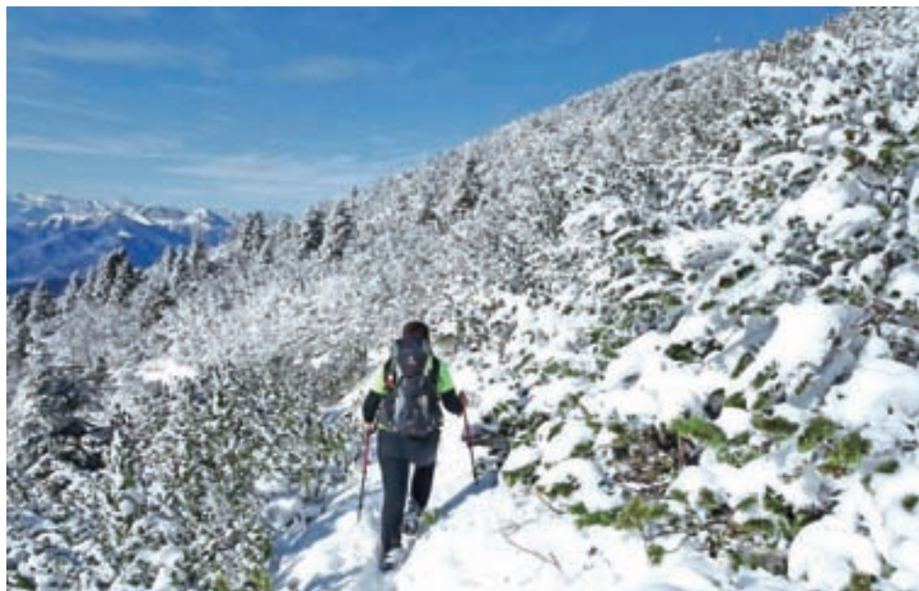
Na vrhu Crete di Mezzodi plapolata zastava. Še nekaj minut skozi gosto ruševje.