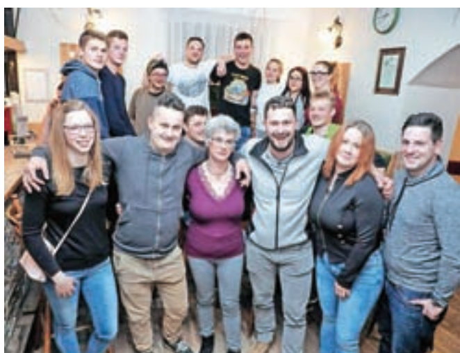
V baru Francon je bilo v petek zvečer živahno.