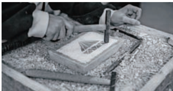
Tudi iz kamna so nastali zanimivi izdelki.