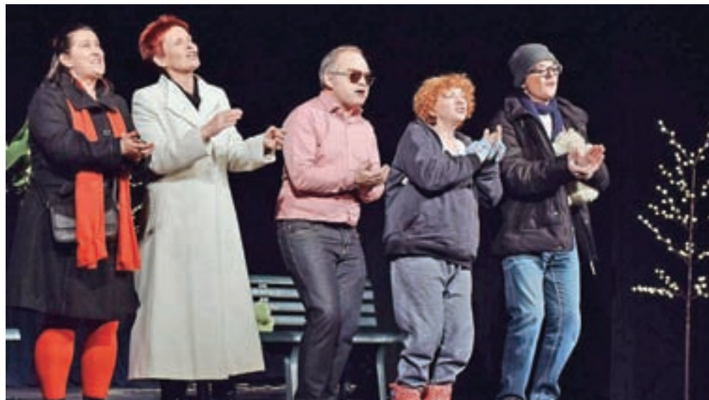
Igralski ansambel Gledališča slepih in slabovidnih Nasmeh je s predstavo Zmenki navdušil občinstvo na Breznici.

Aleš Berger je Zmenke napisal po trenutkih vznemirjenosti in malodušja, ko se v glavi plete marsikatera zanimiva ideja. Do uredništvu pa je dolga pot in