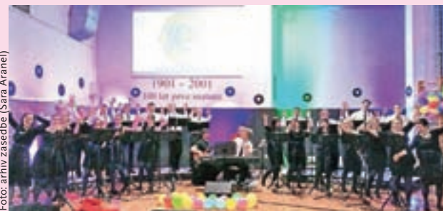
Vrtiljak popevk, tokrat v Gimnaziji Kranj