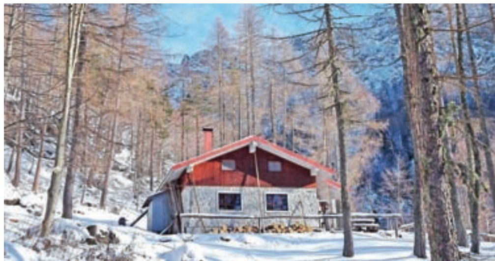
Kočica Monte Sernio je sicer neoskrbovana, a notri je možno prespati pa tudi kaj skuhati. Lepo urejeno.

spodnjem delu je pot širši, tlakovani kolovoz, ki daje slutiti, da bomo hodili po nekakšni mulatjeri. V zmernem vzponu se vzpenjamo skozi bukov gozd. Pretiranega vzpona ni čutiti, saj so okljuki elegantno speljani. Sledi del prečne poti, ki se komaj kaj dviga. Hodimo visoko nad globeljo, skozi katero pelje pot št. 455. Sledi krajši vzpon, ko dosežemo križišče oz. stičišče s potjo 455, ki pripelje iz Prà di Lunge oz. Illegia. Nadaljujemo naprej po poti 416, ki nas v naslednjih dvajsetih minutah pripelje do kočice Monte Sernio, urejenega, a neoskrbovanega zavetišča, ki je odprto. Nadaljujemo naprej mimo znamenja in pot se začne v okljukih strmeje vzpenjati. Naredimo nekaj lepih