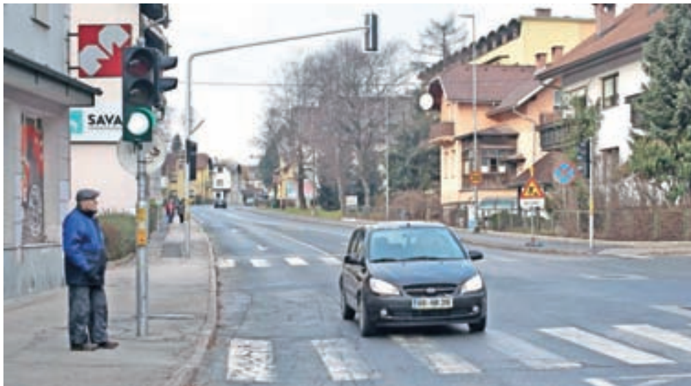
Skoraj sto stavb ob glavni cesti skozi Jesenice je preobremenjenih s hrupom, katerega glavni vir je cestni promet.

S hrupom je preobremenjena tudi Splošna bolnišnica Jesenice, ob kateri naj bi postavili dve protihrupni ograji.