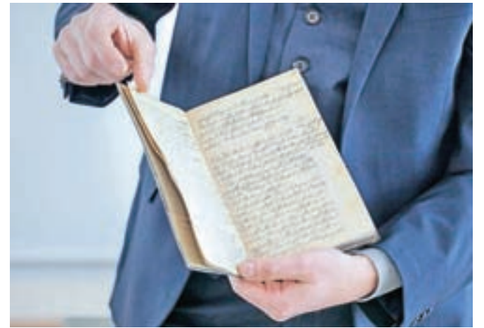
Kopija prvega Riklijevega dnevnika