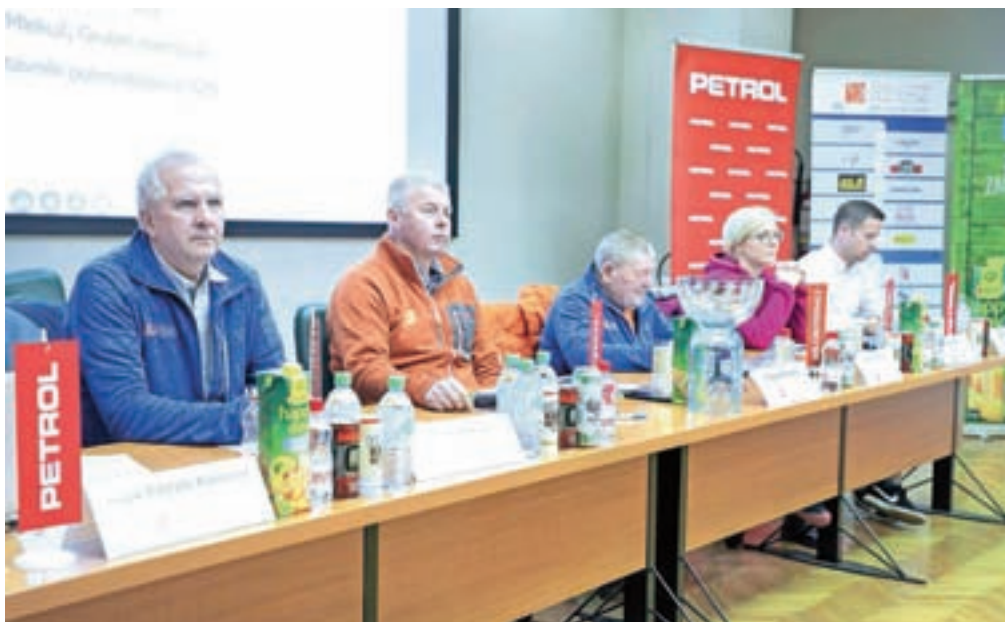
Organizatorji 58. Pokala Vitranc so v petek sporočili, da so na letošnji vrhunec zime v Kranjski Gori dobro pripravljene.

Kot so na petkovi predstavitvi v prostorih Petrola, enega izmed sponzorjev,