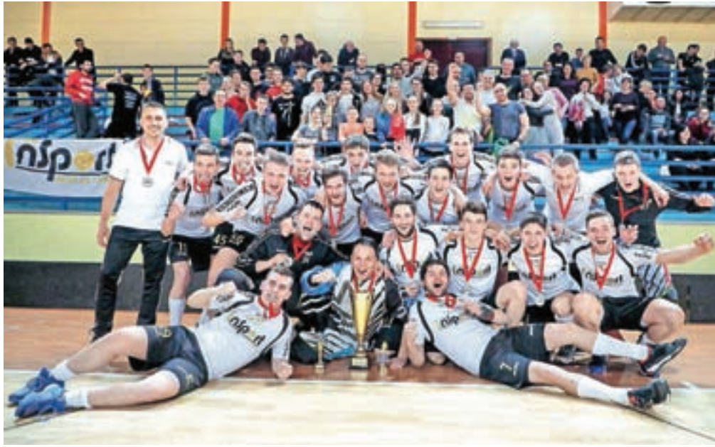
Insport se je skupaj z navijači veselil naslova prvakov mednarodne floorball lige.

Za veselje gostov so igralci VSV iz Beljaka poskrbeli s hitrim vodstvom, domačinom pa v prvem delu srečanja ni uspelo premagati odličnega gostujočega vratarja. So pa zato boljše in predvsem učinkovitejšo igro prikazali v nadaljevanju tekme, ko so