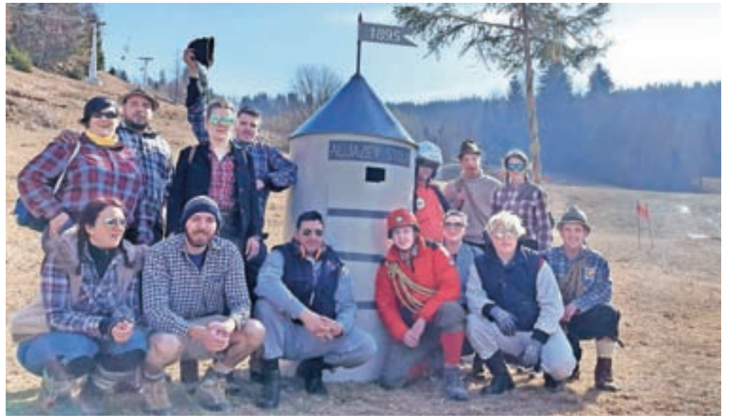
Skupinska maska z Aljaževim stolpom z Dovjega je na Smuku za trofejo svinjska glava zmagala med skupinskimi maskami.

Pustne prireditve so ob koncu tedna potekale še v številnih drugih gorenjskih krajih.