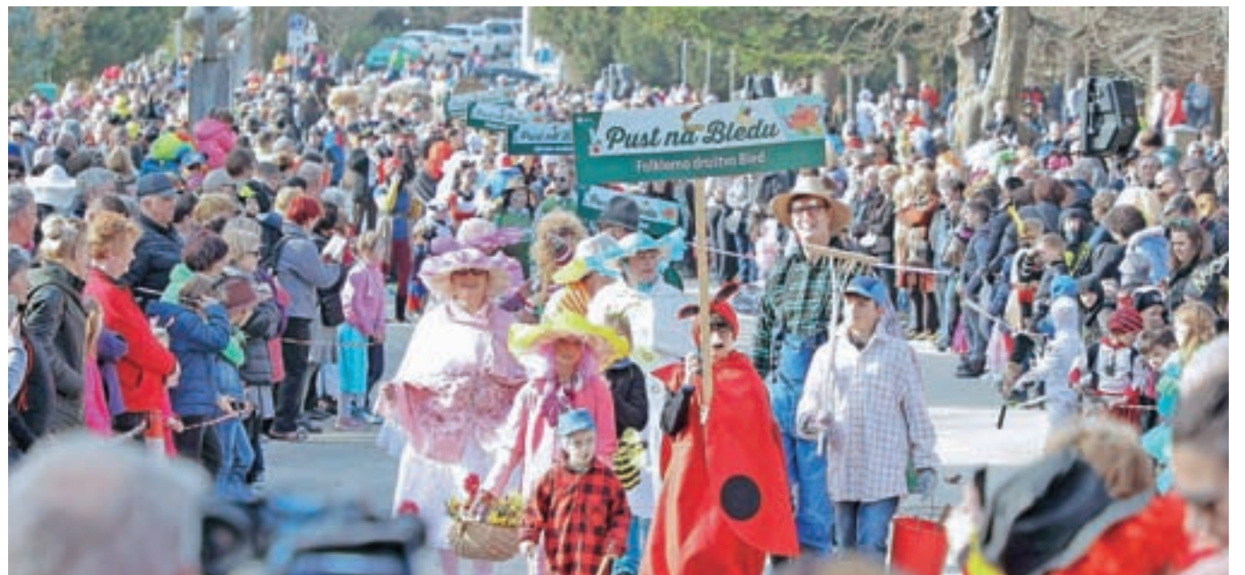
Na pustni povorki na Bledu je sodelovalo 19 lokalnih društev, ki so svoje skupinske maske pripravili na temo Blejski lokalni izbor.

SVET ZAVODA OŠ DAVORINA JENKA CERKLJE NA GORENJSKEM