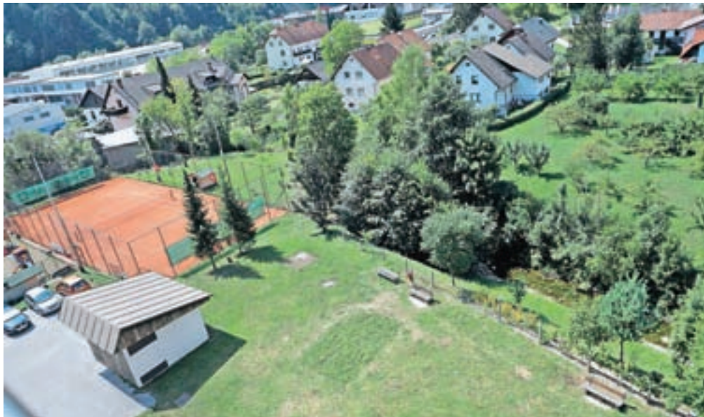
Gradnja Doma Železniki je načrtovana na mestu zdajšnjega teniškega igrišča