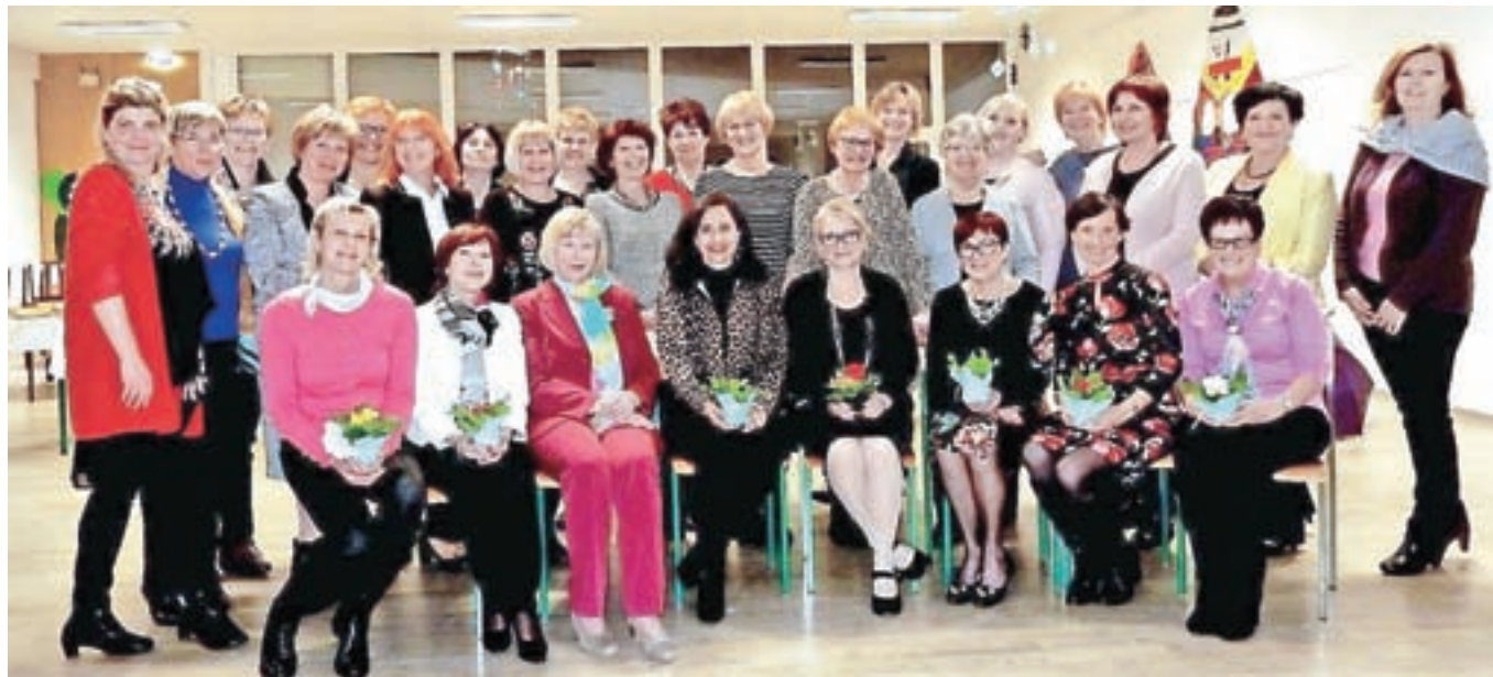
Gorenjske tajnice so se letos zbrale na skupščini v Železnikih.

Članice Kluba tajnic Gorenjske so se ob koncu februarja zbrale v Osnovni šoli v Železnikih na skupščini kluba. Velik poudarek dajejo izobraževanju in druženju.