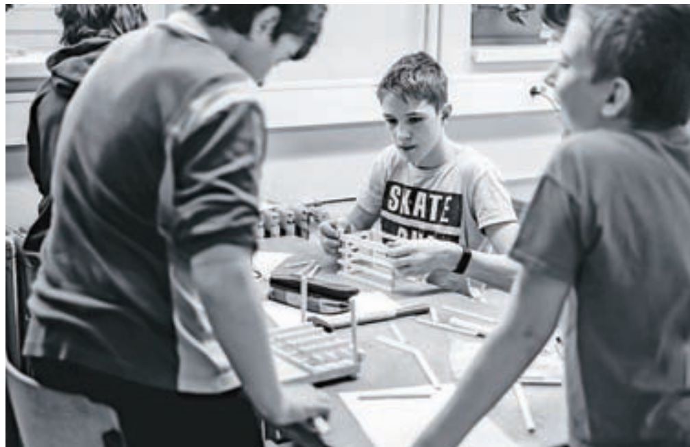
Učenci so na delavnicah ustvarjali z lesom.