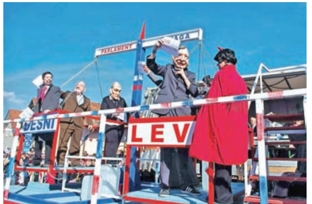
Godlarji se vedno dotaknejo najbolj perečih političnih tem in ni nenavadno, da so se tokrat obregnili ob ukraden »poslanski« sendvič.