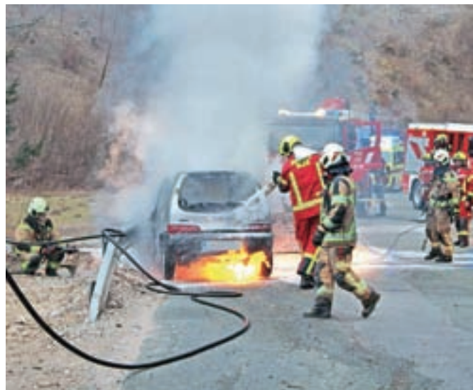
Voznik je zapeljal s cestišča in trčili v ograjo, nato pa je vozilo zagorelo.

Kočna – V petek popoldan je voznik na Kočni z osebnim avtomobilom zaradi nepravilne strani vožnje in alkohola (0,44 mg/l) zapeljal s ceste in povzročil prometno nesrečo z materialno škodo. Ko je bil voznik že zunaj vozila, saj mu je pomagal naključni mimoidoči, je vozilo zagorelo. Gasilci GARS Jesenice in PGD Bled so kraj nesreče prometno in požarno zavarovali, odklopili akumulator, goreče vozilo pogasili, vozilo odstranili s cestišča, posuli razlite tekočine, očistili cestišče ter nudili pomoč policistom pri razsvetljavi kraja ter reševalcem NMP Bled pri oskrbi poškodovanega voznika.