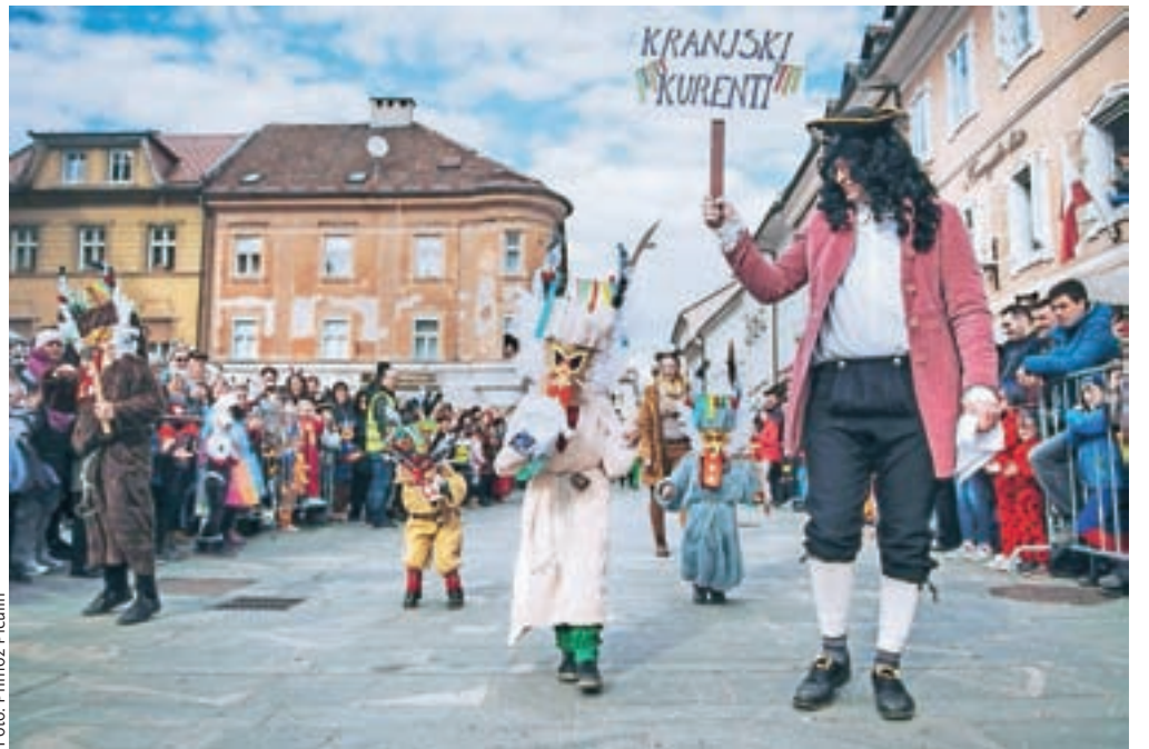
Poleg kurentov s štajerskega konca so na pustni povorki nastopili tudi kranjski kurenti.