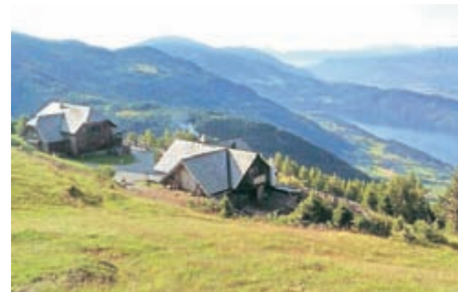
Planšarija Alexanderhutte s pogledom na Miljsko jezero.

»Iz Tromeje gre pešpot v Kranjsko Goro, čez Vršič do izvira reke Soče in ob reki Soči po poti soške fronte. »Reka Soča je zame še vedno tista edinstvena, ki kroji celotno Alpe Adria Trail. Naj bo povsod še tako lepo, tu je zagotovo najlepše,« je prepričljiva Jelka Snedic. Naprej po poti na Ko-