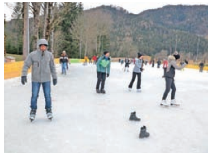
Užitki za jezerski ledeni ploskvi. Drsalke si lahko izposodite v bližnjem gostišču.

Sicer pa se ob koncih tedna v lepem in hladnem vremenu na Jezersko zgrnejo tudi drsalci. Na zaledeneli ploskvi umetnega drsališča je mogoče tudi igrati hokej, kar po besedah Aleša Petka pogosto izkoristijo domačini, lahko pa se napovedo tudi hokejisti iz doline. Priljubljeno pa je tudi kegljanje na ledu, kar so ravno ta teden predstavili jezerskim turističnim delavcem. Zamrznjeno je tudi