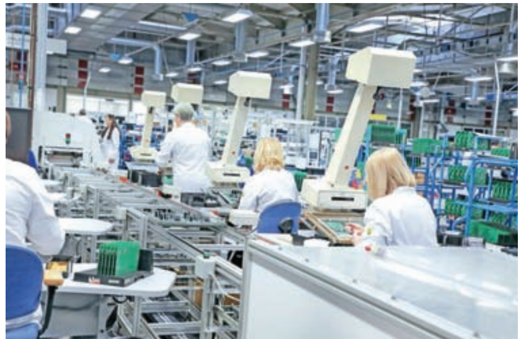
Največ povpraševanja je po delavcih v proizvodnji, strojnikih, kovinarjih ... (Fotografija je simbolična.)