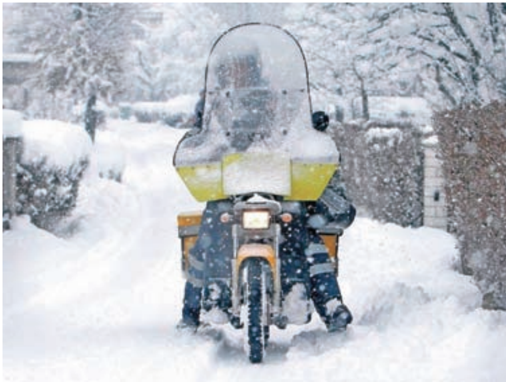
Zaradi preobremenjenosti in vremenskih razmer je po navedbah sindikatov na bolniškem dopustu vselej okoli tristo poštarjev, pozimi tudi do petsto.