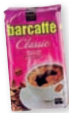
kava Barcaffe, 250 g