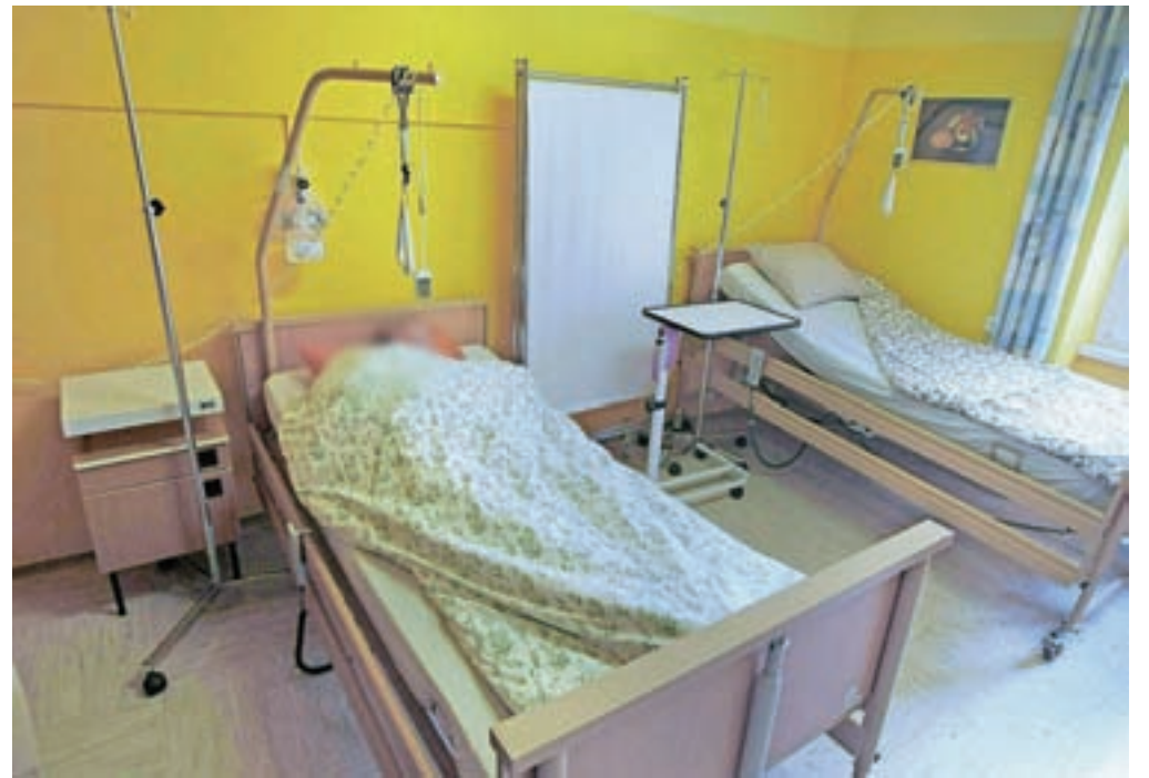
Zahtevno zdravljenje in rehabilitacija terjata dolgotrajne bolniške odsotnosti, primanjkljaj prihodkov, neredko tudi omejitve pri delu, težave pri najemanju posojil in zavarovanjih, lahko tudi socialno izolacijo ... (Slika je simbolična.)

Glavni vzrok za odsotnosti z dela zaradi bolezni predstavljajo bolezni mišično-kostnega sistema in