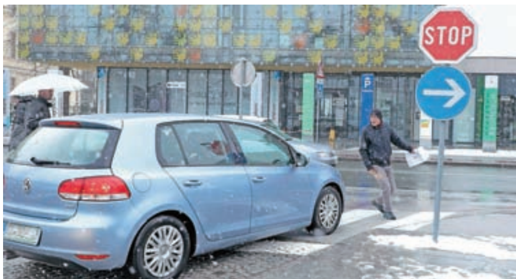
Pešci naj poleg prometnih pravil upoštevajo še dejstvo, da nimajo absolutne prednosti, opozarjajo policisti.

Krajše nadzore pešcev so nadaljevali še v ponedeljek popoldan. Na Jesenicah so dva pešca obravnavali zaradi nepravilne hoje po