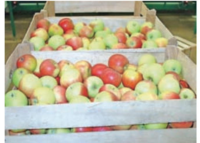
Projekt Od pridelka do izdelka se osredotoča tudi na sadjarstvo, to je na pridelavo in predelavo sadja.

Kot navajajo v Kmetijsko gozdarskem zavodu Kranj, je glavni namen projekta spodbuditi in usposobiti ciljne skupine za pridelavo in predelavo sadja in žit na Gorenjskem. V prvi fazi, ki se je začela lani oktobra in se bo končala marca letos, bodo udeležence seznanili s podjetniškimi vsebinami in teoretičnimi znanji pridelovanja sadja v travniških