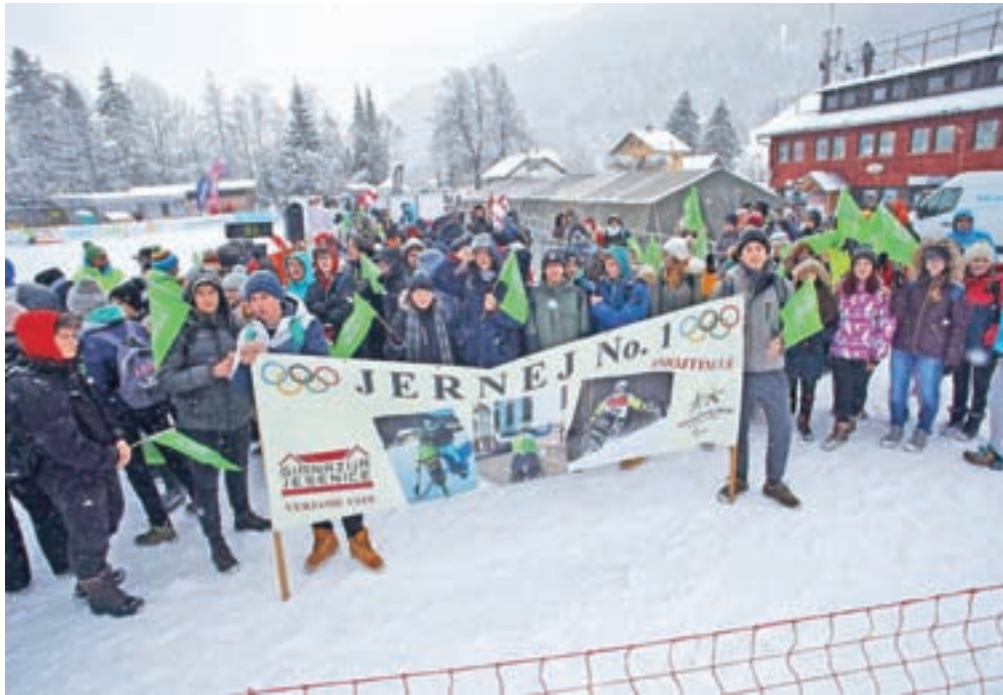
Navijači z Gimnazije Jesenice

domačimi navijači na strmini v Podkorenu, na kateri opravi veliko treninga. To je bilo zanj prvo svetovno prvenstvo. V ponedeljek je v veleslalomu osvojil 17. mesto, v sredo je bil v slalomu deseti, kar je njegova najboljša uvrstitev na velikih tekmovanjih. Lani je na paraolimpijskih igrah v slalomu osvojil 12. mesto. »Na tekmi v veleslalomu sem dobro opravil s prvo progo, v drugo pa sem bil malce zadržan. Poškodba rame me ni ovirala. Na slalomski tekmi pa smo imeli pravo snežno kuliso, kar nas ni zmotilo, pa tudi proga je bila vrhunsko