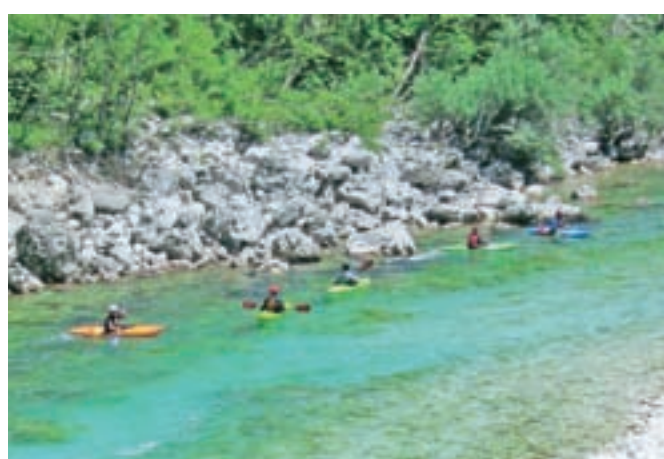
Smaragdna reka Soča

lovrat je ogleda vreden vojaški muzej na prostem, kot še priporoči ... Pravzaprav bi »naša pohodnica« Alpe Adria Trail priporočila za poročno potovanje, vsaj sama bi tako izbrala, če bi le lahko čas zavrtila nazaj. »Poti so zveste in zmeraj počakajo pohodnike. Zato Alpe Adria Trail priporočam iz srca in sem prepričana, da ljubiteljev lepe narave ne bo razočarala.«