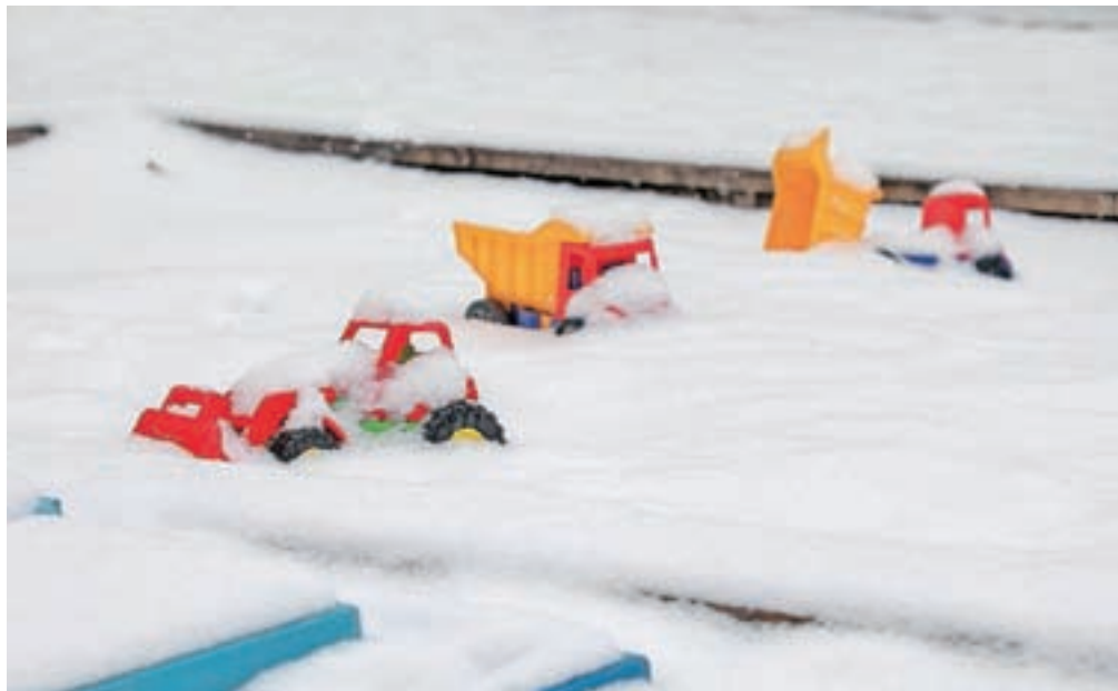
Vsi smo odgovorni za dobrobit otrok in njihovo zaščito!

učinkovito zaščito otrok moramo vse strokovne službe imeti znanje ter med seboj sodelovati in delovati enotno in usklajeno. Vsi smo torej odgovorni za dobrobit otrok in njihovo zaščito.«