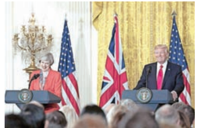
Premierka Theresa May in predsednik Donald Trump med tiskovno konferenco v Beli hiši, 27. 1. 2017. Takrat sta bila oba videti še kar zadovoljna...