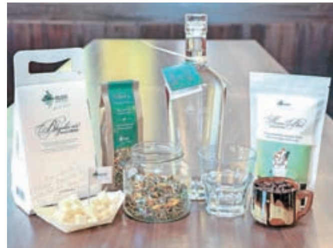
Pod blagovno znamko Izbrano z Bleda ta čas predstavljajo štiri izdelke.

V sklopu lastne blagovne znamke Izbrano z Bleda so ledino orali s poltrdim sirom, narejenem iz pastiriziranega kravjega mleka z 22 družinskih kmetij, povezanih v zadrugo Bled. Pod posebno Kavobled je mogoče najti izbor kavnih zrn vrhunske kakovosti, praženih srednje temno. Zrna so sicer iz Brazilije, saj kava v Sloveniji ne uspeva, a jo v lokalnem okolju pražijo, meljejo in pakirajo. Sedanja ponudba izdelkov pod