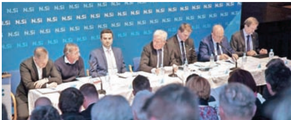
Člani Kluba županov in svetnikov stranke NSi so se tokrat srečali v Kamniku.