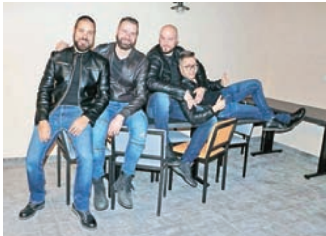
Kvatropirci v stari ...

Pevčevi koncerti so znani po njegovem razpoznavnem glasu, nalezljivi energiji in čustvih, ki jih izmenjuje s publiko. Sicer repertoarja v sklopu turneje načeloma ne menja, a za Slovenijo je naredil izjemo in bo ta nekoliko drugačen kot v drugih državah. Na odru pa bomo seveda slišali tako njegove starejše kot tudi aktualne hite.