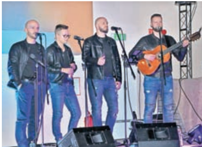
... in novi zasedbi – na sobotnem odru v Bobi baru