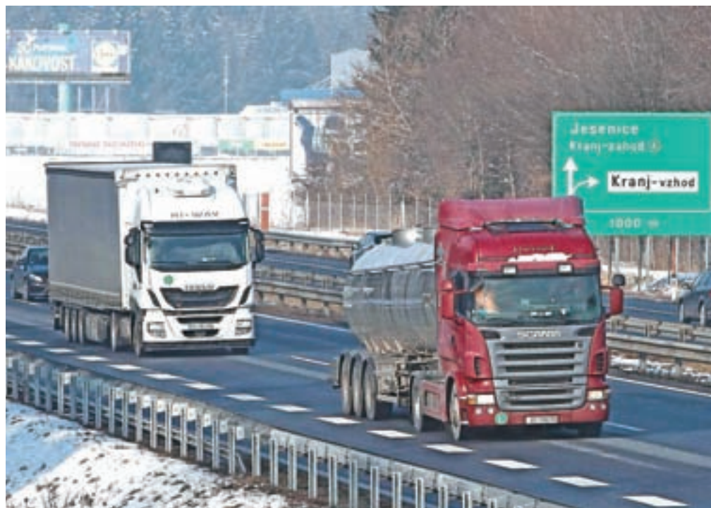
V primeru trdega brexita bi bil zaradi ponovne uvedbe mejne kontrole in carinskih pregledov med storitvami najbolj ogrožen slovenski transportni sektor, ki pri britanskih naročnikih ustvari okoli 40 milijonov evrov letnega prometa.

Po podatkih Analitike GZS je Združeno kraljestvo za Slovenijo 13. najpomembnejše izvozno gospodarstvo, kamor smo po njihovih ocenah lani izvozili za 825 milijonov evrov blaga in storitev (2,1 odstotka vsega izvoza), vsaj še enkrat toliko slovenskega izvoza pa v Združenem kraljestvu konča posredno prek izvoza polproizvodov v druge zahodne države. Po podatkih Britansko-slovenske gospodarske zbornice je trgovinska menjava med Slovenijo in Veliko Britanijo v letu 2017 presegla 1,35 milijarde evrov. Slovenska podjetja na britanski trg izvozijo največ električnih strojev in opreme (20 odstotkov), pohištva, posteljnine,