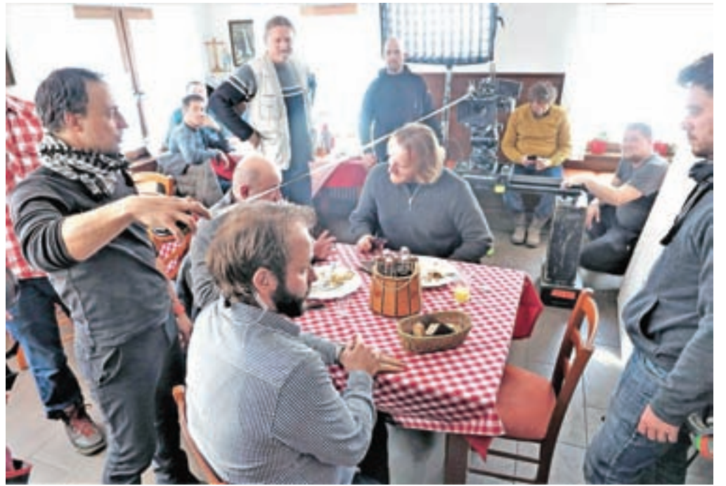
Temeljite priprave scene in igralcev, preden je padla filmska klapa za kader v Gostilni Mihovc

Sceno posnamejo večkrat z različnih zornih kotov, kamera je vsakič osredotočena na drug lik, kar bomo videli v drugi epizodi