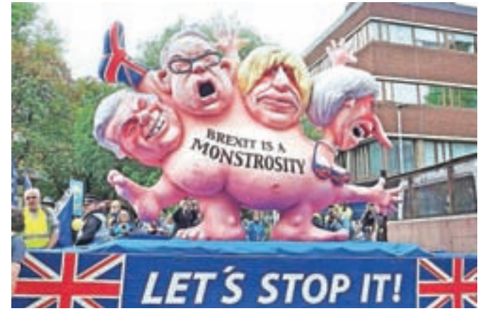
»Brexit je pošast, ustavimo jo!« Napis na protestu zoper brexit v Manchesteru, 1. 10. 2017. Desna glava pošasti je glava Therese May.

Brexit je bolj britanski kot evropski problem. Kako pa razložiti vse hujše nezadovoljstvo ljudi v evropskih državah? Protesti so kljub zimi vse bolj izraziti. Množice protestirajo v Franciji, na Madžarskem, v Grčiji, Srbiji ... Skupnega imenovalca ni, razlogov je več. Najbolj prepoznaven pa je ta, da nekateri sloji živijo vse slabše, zlasti nižji in nižji srednji. Razlogi so torej v železcu, izražajo pa se s srcem in glavo ...