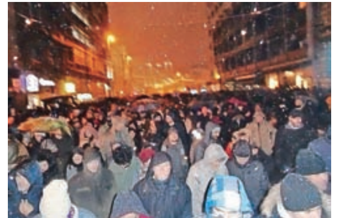
Ne, ti ljudje v Beogradu 15. 12. 2018 ne čakajo na novo leto; protestirajo proti srbskemu predsedniku Vučiću, pod katerim mnogi živijo vse slabše...