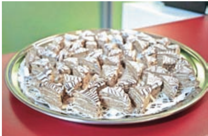
Zadnje čase namesto izraza torta pogosto zasledimo oznako rezina ali rezine esterhazy.

džarske tradicije: od slovitih tort doboš in esterhazy do prefinjenega drobnega peciva. Posebna pozornost je v knjigi namenjena močnatim jedem, ki so v spletu zgodovinskih in kulturnih dejavnikov edinstvene in tipične prav za Srednjo Evropo. Valentina Smej Novak