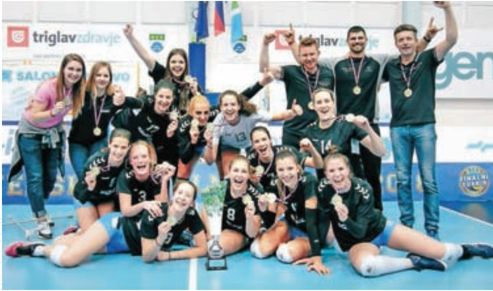
Odbojkarice Calcita Volleya so zmagovale Pokala Slovenije za sezono 2018/2019.

V moškem finalu sta se pomerili ekipi ljubljanskega ACH Volleya in kamniškega Calcita Volleya. Slednji so tokrat morali priznati premoč Ljubljančanom. Izgubili so z 0 : 3 (-21, -19, -22) in ostajajo pri treh pokalnih lovorikah. ACH Volley je prišel do enajste, hkrati so ubranili tudi lanskoletni naslov.