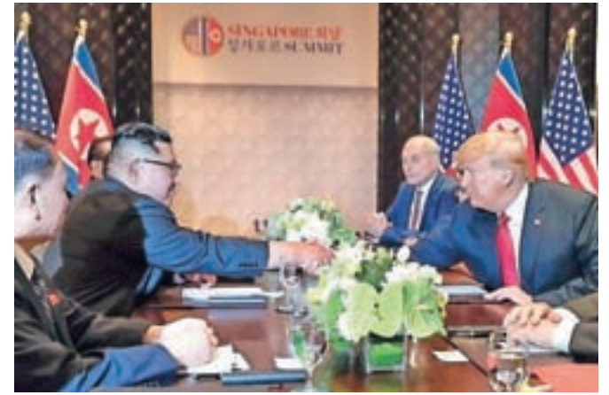
Kim Džong Un in Donald Trump v Singapurju 12. junija 2018; srečanje voditeljev Severne Koreje in ZDA obeta premik v reševanju korejskega problema.

V letu 2018 se je torej zgodilo marsikaj novega in izjemnega, a hkrati nič takega, kar bi usodno spremenilo življenja večine od sedmih milijard Zemljanov. Tretja svetovna vojna še ni izbruhnila, čeprav jo nekateri vztrajno podžigajo. Zaželimo si še mnogo za nas vsaj tako dobrih let, kot je bilo to, in privoščimo več miru in blaginje tudi tistim, ki ju nimajo.