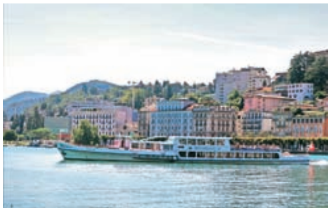
Mesto Lugano si lahko ogledaš tudi z jezera.