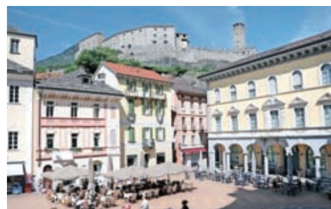
Bellinzona je znana po gradovih, mogočni Castelgrande na hribu je viden praktično od povsod v mestu.