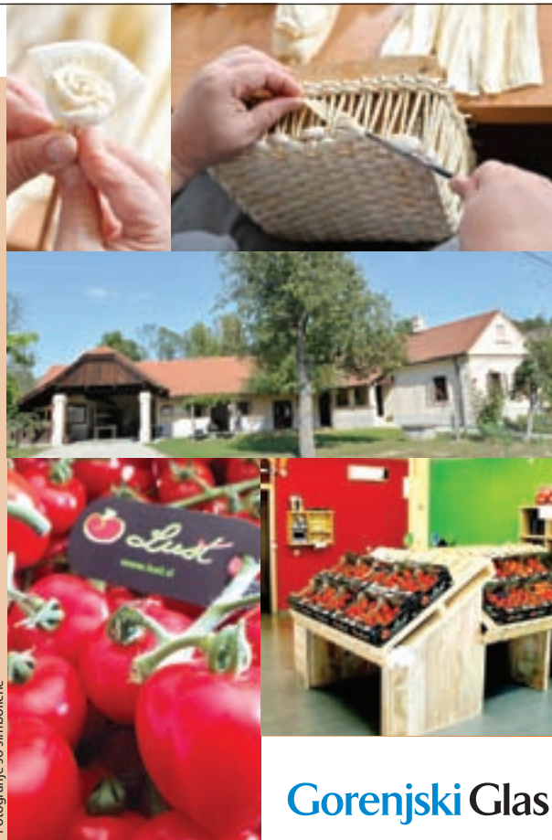
Fotografije so simbolične

Za objave, ki prispejo kasneje kot dva delovna dneva pred odhodom, zaračunamo potne stroške.