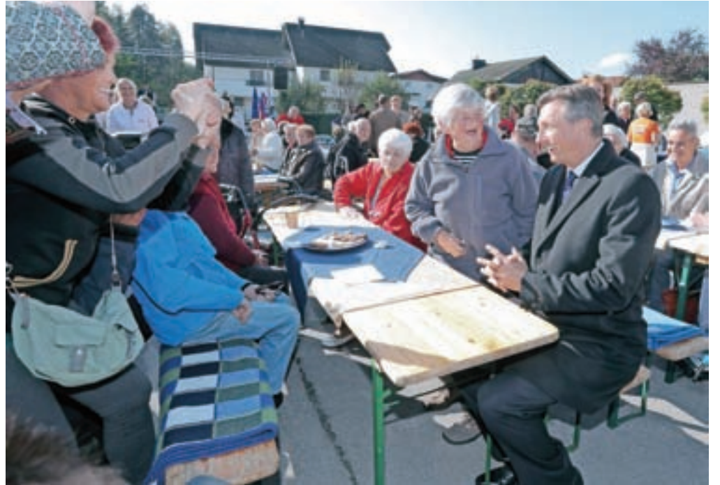
V DEOS Centru starejših Medvode so se razveselili obiska predsednika Republike Slovenije Boruta Pahorja.

Slavnostni govornik je bil predsednik Republike Slovenije Borut Pahor. Osrednji del svojega govora je namenil starejšim: »Življenjska starost se podaljšuje, kar je čudovito, saj smo si za to ves čas prizadevali in si bomo tudi še naprej. Opažam, da je prišlo v naši kolektivni zavesti do spoznanja, da je sijajno in čudovito, če skrbimo za mlade ljudi – in da to mora ostati tako tudi naprej, je pa enako pomembno in odgovorno za inkluzivno, vključujočo družbo, da poskrbimo tudi za starejše prebivalke in prebivalce. Mislim, da se stvari premikajo na bolje. Letos obeležujemo sedemdeseto obletnico od podpisa deklaracije o človekovih pravicah. Ena izmed pravic zadeva tudi pravico starejših do varne starosti, pri čemer je treba varno starost razumeti ne samo kot skrb za starejšega človeka, ki je nekoliko bolj fizično obnemogel, ampak tudi kot skrb za starejšega človeka, ki ima veliko modrosti in