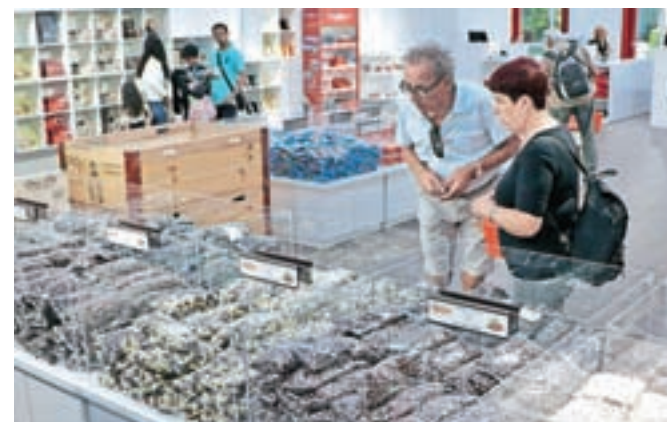
Glasove izletnike je v čokoladnici Alprose še najbolj zanimala prodajalna.