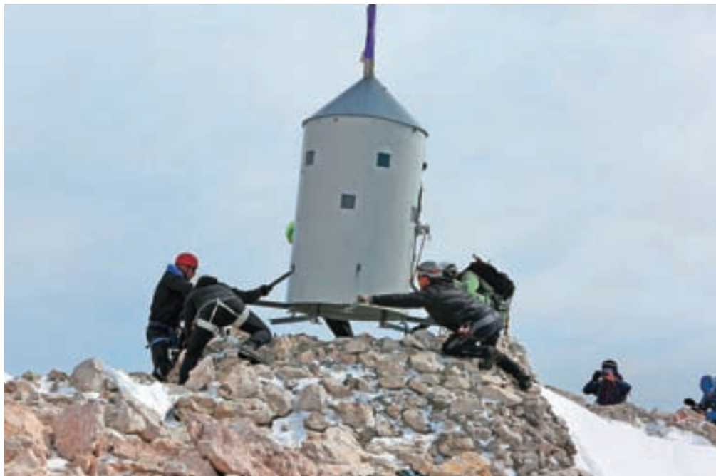
V sredo skoraj točno opoldne je bil Aljažev stolp spet doma.

Kot nam je povedal Frantar, se stolp najbolj poškoduje pozimi, ko je zasut s snegom in ga planinci poškodujejo s