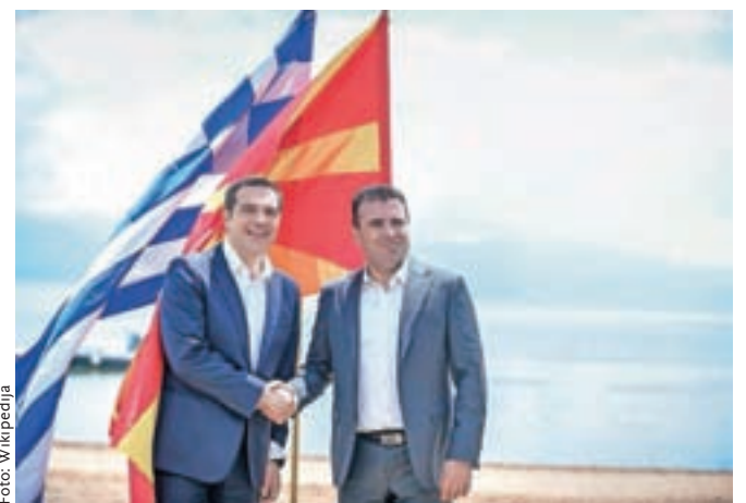
Grški premier Aleksis Cipras (levo) in njegov makedonski kolega Zoran Zaev po podpisu sporazuma, da bo Makedonija odslej Severna Makedonija, Prespa, 17. 6. 2018.