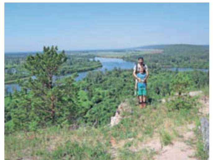
Zelena in neskončna Sibirija