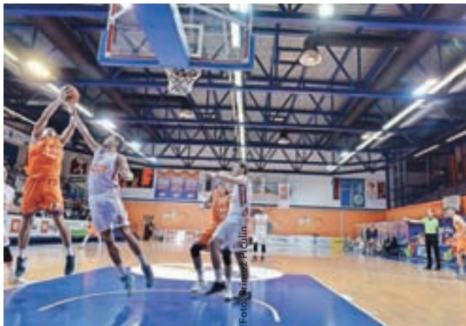
Košarkarji ekipe Helios Suns so v domači dvorani slavili prvo zmago v ligi ABA 2, saj so ugnali moštvo Vršca.