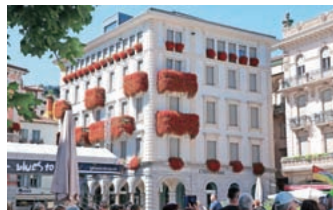
Ko se sprehodiš po Luganu, te lahko v določenem letnem času pričakajo tudi takšni cvetlični prizori.

Pređen nas je pozdravil z nedeljskim soncem obsijani Lugano, smo se posladkali v čokoladnici Alprose. Tu so pred kratkim odprli tudi manjši muzej čokolade. Izletnike pa je najbolj zanimal