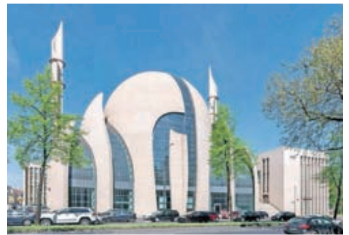
Turška osrednja mošeja v Kölnu je največja v Nemčiji in ena največjih v Evropi.