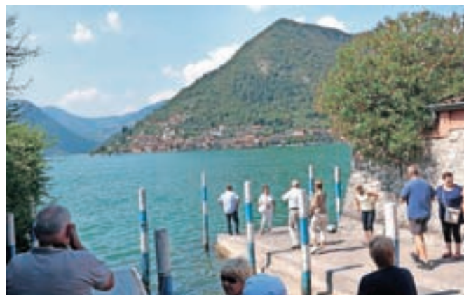
Sulzano – mesto, kjer se je začel plavajoči pomol