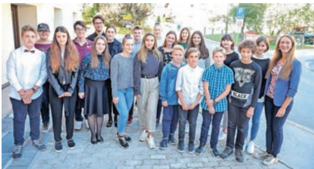
Številni mladi avtorji so se letos v ljubezenskih pismih spraševali o smiselnosti svojega obstoja v svetu; v svetu, kjer vse tako hiti in beži.