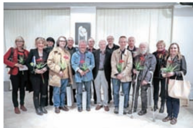
V družbi nekaterih nagajenih avtorjev festivala