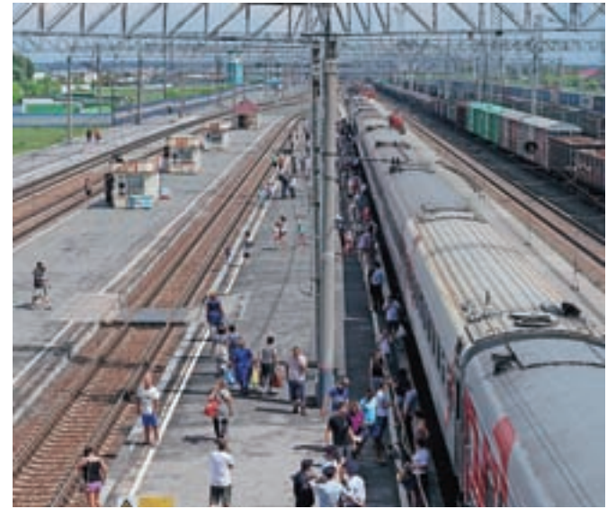
Tipična postaja na transsibirski železnici