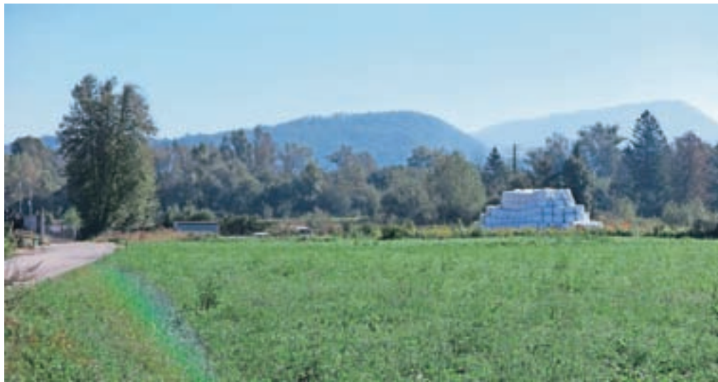
Pretekli teden se je na zemljišču v Študi nahajala še približno polovica vseh bal, napoljenih z odpadno embalažo.

termičnih objektov v tujini se odstranitev bal žal ne izvaja po prvotno zastavljenem terminskem planu. Družba Publikus je v skladu z možnostmi pri prevzemnikih začela odvažati balirane lahke frakcije odpadkov iz Štude 9. avgusta, žal pa nam dogovorjenega odvoza vseh količin ni uspelo realizirati. Seveda so se aktivnosti v zvezi z iskanjem prevzemnika za lahko frakcijo nadaljevale na dnevnom nivoju. Z drugim (trenutnim) prevzemnikom se nam je tako uspelo dogovoriti za dinamiko odvažanja odpadkov v manjšem obsegu – približno tri kontingente na teden. Do vključno današnjega dne (1. oktober, op. p.) je bilo tako odpeljanih 239,9 tone lahke frakcije, kar predstavlja slabo polovico skladiščenega materiala. Če bo trenutni dogovor vzdržal, ocenjujemo, da bodo vse bale iz lokacije odstranjene v roku enega meseca,« nam je pojasnila.