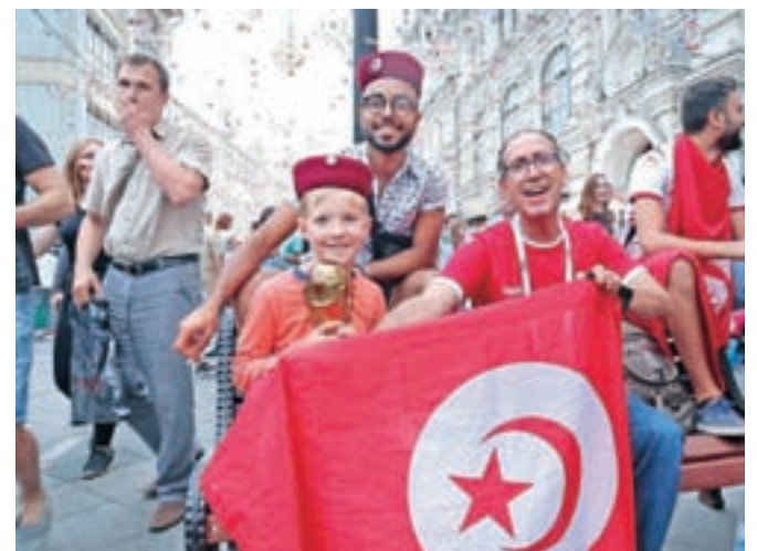
Nogometna navijaška mrzlica v Moskvi