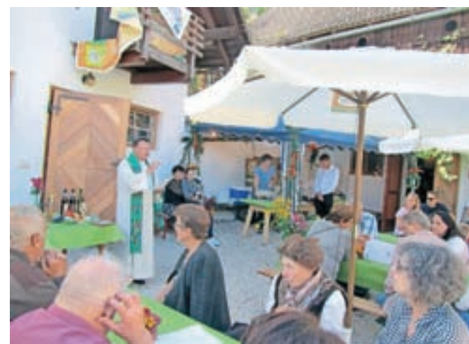
Vinski praznik z zahvalo za dobro letino pri Hrenovih v Žitari vasi

Na 1080 metrov visoko ležeči Bleščeči planini nad Šentjakobom, na Komnici pod Jepo ali Kepo, kjer je nekdanje stalo Kopankovo gospodarsko poslopje, od leta 1968 naprej stoji postojanka Slovenskega planinskega društva iz Celovca. To je edina slovenska planinska postojanka na Koroškem. Jubilej koč, kjer je cilj vsakoletnega pohoda k Arihovi peči, so proslavili sredi septembra. Koča je bila odprta 17. novembra leta 1968, zaradi visokega snega pa predana namenu prihodnje leto.