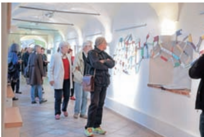
Karavana obiskovalcev po galerijah v starem delu mesta