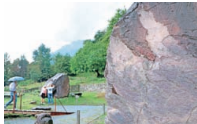
Dolina Camonica slovi po risbah, ki so jih tamkajšnji prebivalci v prazgodovini na različne načine vrezovali oziroma vklesali na gladke skalne površine.