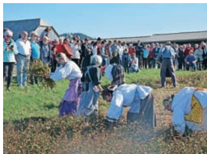
Predstavili so ajdo od žetve do likofa.

V okolici toplarja ekološke kmetije Pr' Črnet so se obiskovalci na poti z ajdo ustavili pri petih postajah, od prve, ki