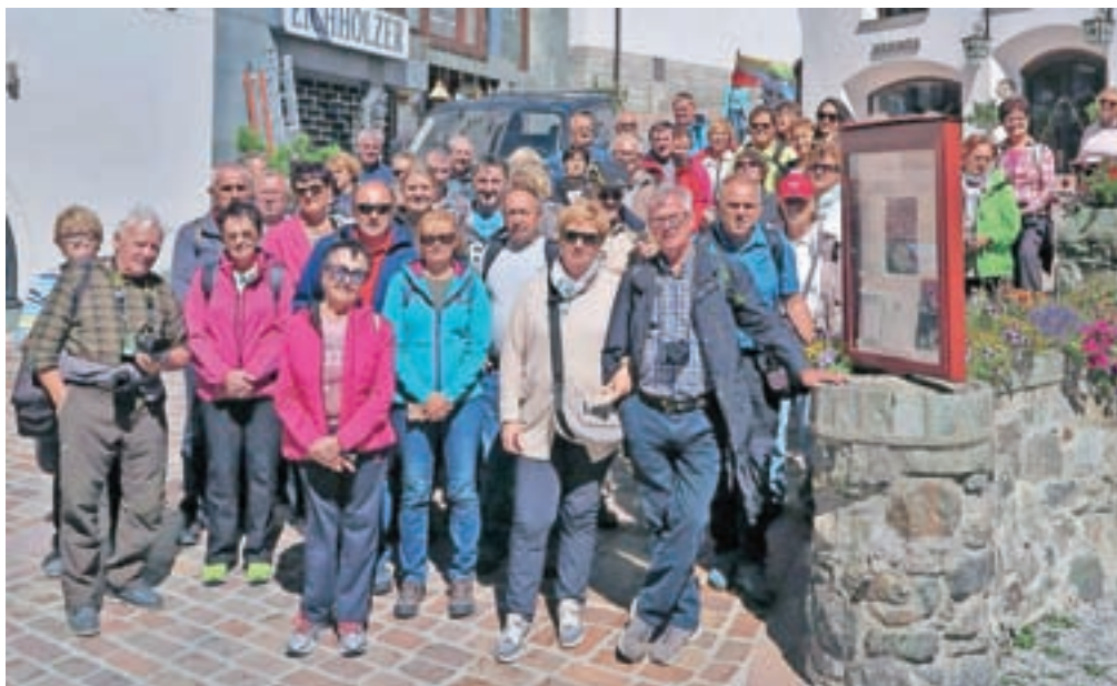
Druga skupina je imela več sreče z vremenom v St. Moritzu.

Tisti, ki smo se prvi dan odpeljali proti Benetkam, Veroni, mimo Gardskega jezera do Brescie, kjer smo zapustili avtocesto, smo pravzaprav popotovanje začeli ob slikovitem jezeru Iseo ali Sebinu, šestem največjem italijanskem jezeru. Nekaj smo izvedeli tudi o Montisoli, največjem evropskem jezerskem otoku na njem; samo jezero predstavlja stičišče alpskega severa in mediteranskega juga. Blaga klima je omogočala naselitev ljudstev že v prazgodovini, na kar kažejo številni ostanki gradov, cerkva, samostanov, meščanskih vil in palač. Vasica Iseo je izjemno slikovita. Potem smo se odpeljali do mesteca Sulzano. Izvedeli smo tudi za zanimiv, poseben, skoraj umetniški projekt izpred dveh let, ki je trajal ali bil razstavljen dobra dva tedna: plavajoči, pontonski pomol Sulzano – Monte Isola. Sledila je vožnja ob jezeru in po dolini