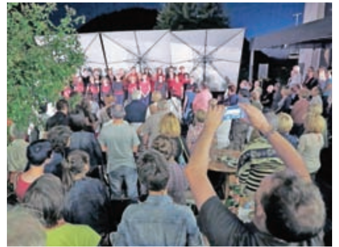
Pobuda o kandidaturi za EPK prihaja iz Layerjeve hiše, ki je v zadnjih letih postala eno pomembnejših kulturnih središč v Kranju.

Pobudniki menijo, da je število deležnikov na področju kulture in s tem organizacijska struktura v mestu dovolj močna, da bi zmogla izpeljati obsežen in zahteven projekt. Pozitivno razmišljanje velja tudi glede kulturne infrastrukture. »Organizacijska kultura je močna, s pravimi mehanizmi pa si želimo produkcijske moči še povečati, vključiti v programsko in izvedbeno ekipo še več profesionalcev. Kranj se že danes lahko pohvali z zavidljivo prenovljeno javno kulturno infrastrukturo. Celostni razvoj občine in regije pa predvideva tudi širitev in povezovanje vsebin z infrastrukturo v zaledju. Pri projektu je pomembno povezovanje kulture, narave in turizma,