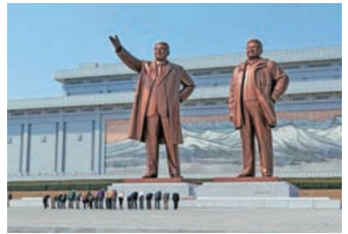
Spomenika voditeljema Kim Il Sungu in Kim Džong Ilu v Pjongjangu. Njun naslednik Kim Džong Un bi ju rad presegel, a mu gre bolj počasi.