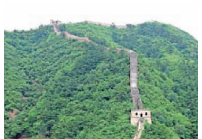
Kitajski zid