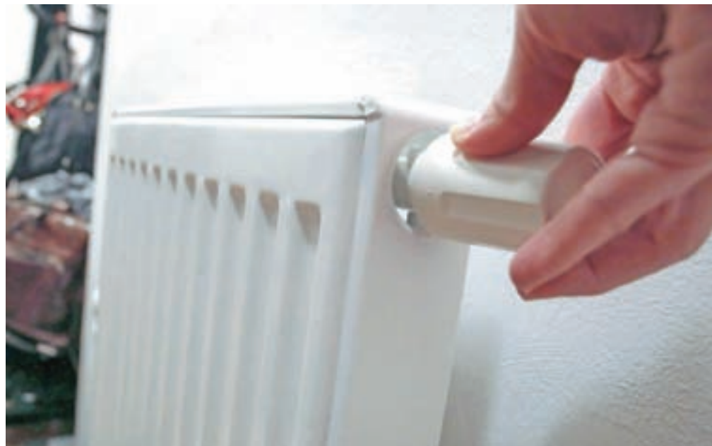
Zaradi nizkih temperatur je vsak dan odprtih več radiatorjev.

Na Jesenicah se je ogrevalna sezona začela 1. oktobra, kjer so to želeli (večinoma v