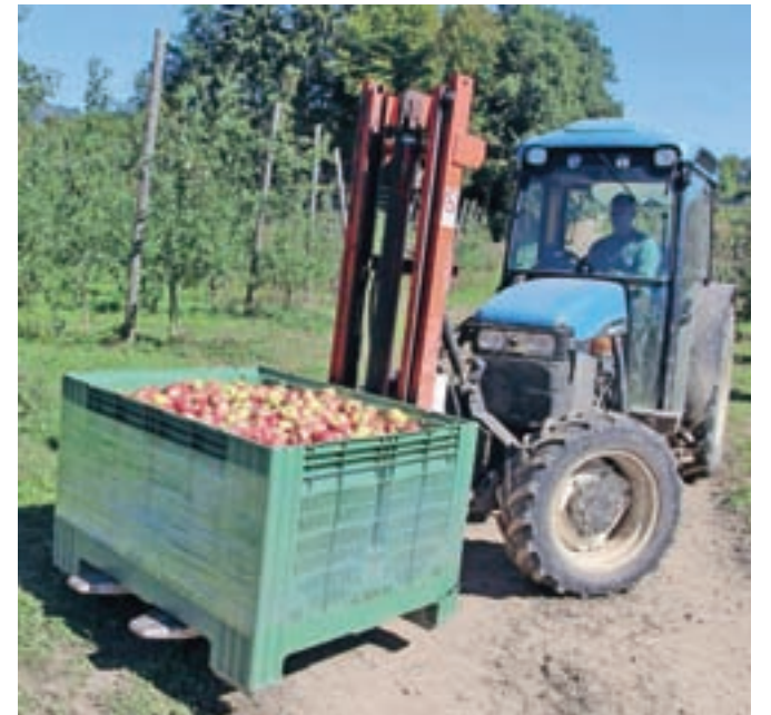
V sadovnjaku Resje so doslej obrali približno tretjino jabolk.

»Na to vpliva predvsem velika ponudba jabolk slabše kakovosti, ki jih sadjarji in trgovci želijo čim prej prodati. Cene so že padle približno za desetino, kilogram jabolk je možno dobiti na trgu pod ceno en evro za kilogram. Cene so odvisne od vrste pridelave (ekološko pridelana so dražja) pa tudi od sorte. V nasadu