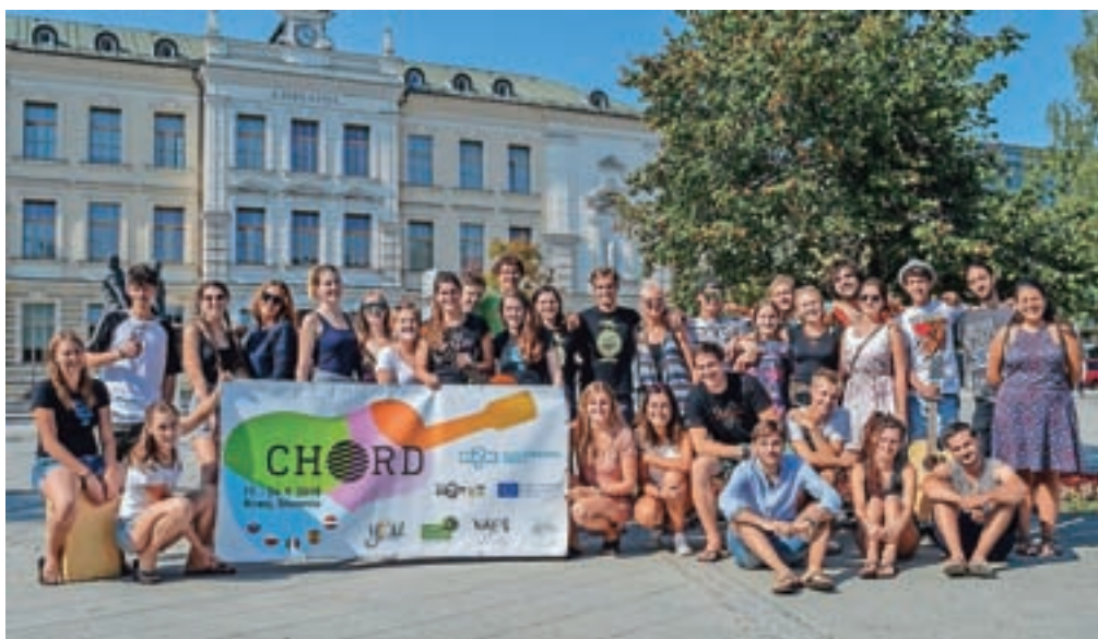
Mladi iz petih držav so se pet dni družili v Kranju.

Drugo polovico tedna so preživel v Kranju, kjer so bili nastanjeni v hostlu