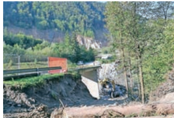
Delavci so se najprej lotili obnove večjega mostu.

Država je začela prenavljati dva mostova preko Črne, zaradi česar bo obvoz po začasni cesti na Črnivec veljal še prvo polovico prihodnjega leta.