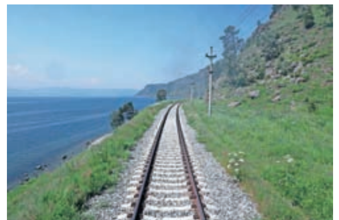
Prostrano Bajkalsko jezero od blizu