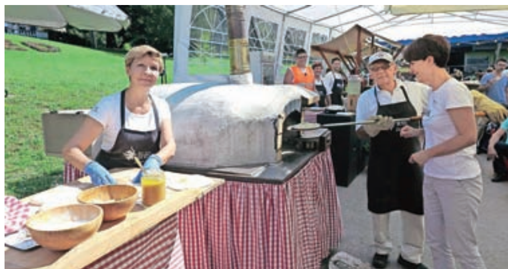
Člani TD Bled so v pravi krušni peči pripravljali staro gorenjsko jed posmoduljo.