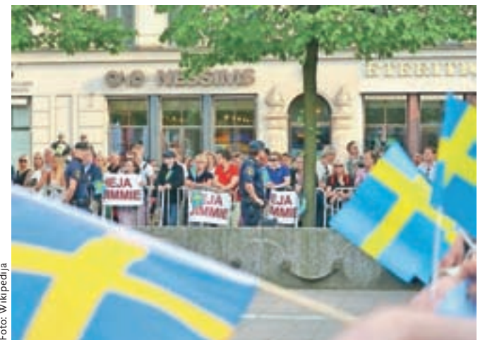
Simpatizerji Švedskih demokratov ('Sverigedemokraterna') demonstrirajo v Stockholmu med evropskimi volitvami 2015. Na EU-volitvah maja 2019 bodo gotovo še glasnejši.