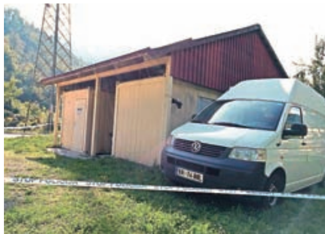
Truplo brezdomca so v bivalnem zabojniku jeseniškega zavetišča za brezdomce našli v nedeljo zjutraj.

pred preiskovalnega sodnika, ki je zanje odredil pripor,« je pojasnil Donoša.