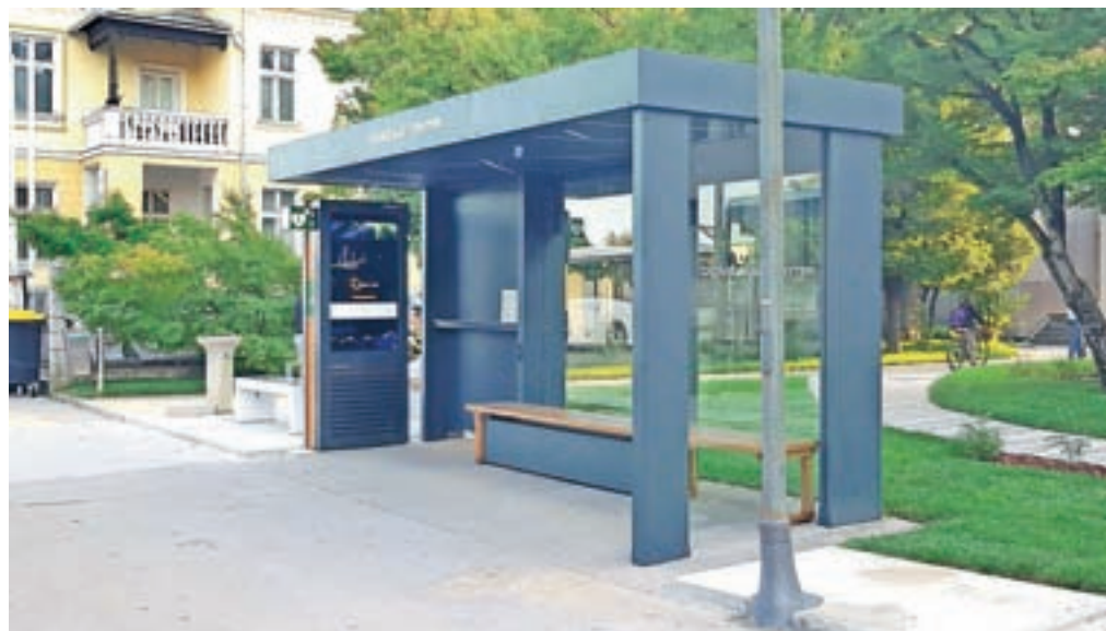
Solarno avtobusno postajališče v Domžalah

lahko napolnijo mobilni telefon, in to z USB-kablom ali na brezžičnem polnilcu, na ekranu izvedo, kdaj bo pripeljal naslednji avtobus, objavljena so lahko različna obvestila, reklame, prek platforme Google open AI pa bodo obiskovalci lahko našli denimo picerijo ali lekarno v radiju enega kilometra ... V sklopu postajališča je na voljo tudi defibrilator na kodo. Energijo pridobivajo prek panelov na strehi postajališča, ki delujejo tudi na difuzno svetlobo, torej tudi v primeru oblačnosti. Je pa v Domžalah sistem hibridni, tako bi v primeru, da bi energije v akumulatorju zmanjkalo, sistem začel črpati energijo