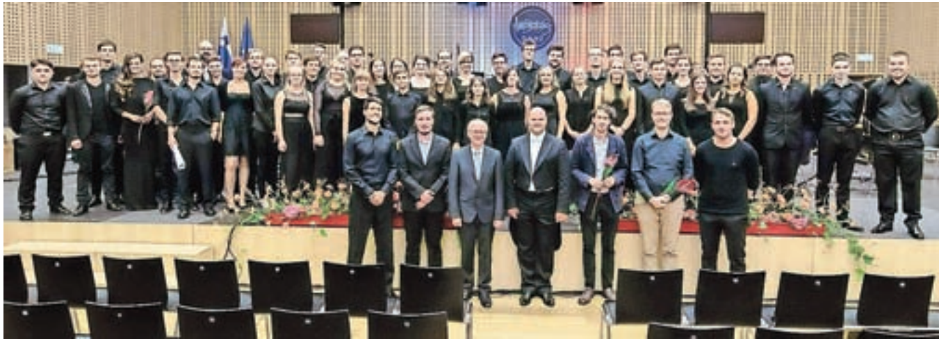
Kr' Bis Band s solisti in skladatelji, s katerimi smo v nedeljo zvečer vsi bili Avseniki.

Skoraj šestdesetčlanski orkester je v nedeljo v veliki dvorani Kongresnega centra Brdo pričakala polna dvorana. Z eno mislijo in pričakovanjem – poslušati dobro glasbo. Namreč,