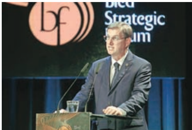
Zdaj že nekdanji predsednik vlade Miro Cerar je na Bledu poudaril, da Evropo čakajo številne pomembne odločitve, ki bodo znova poudarile pravo moč EU.