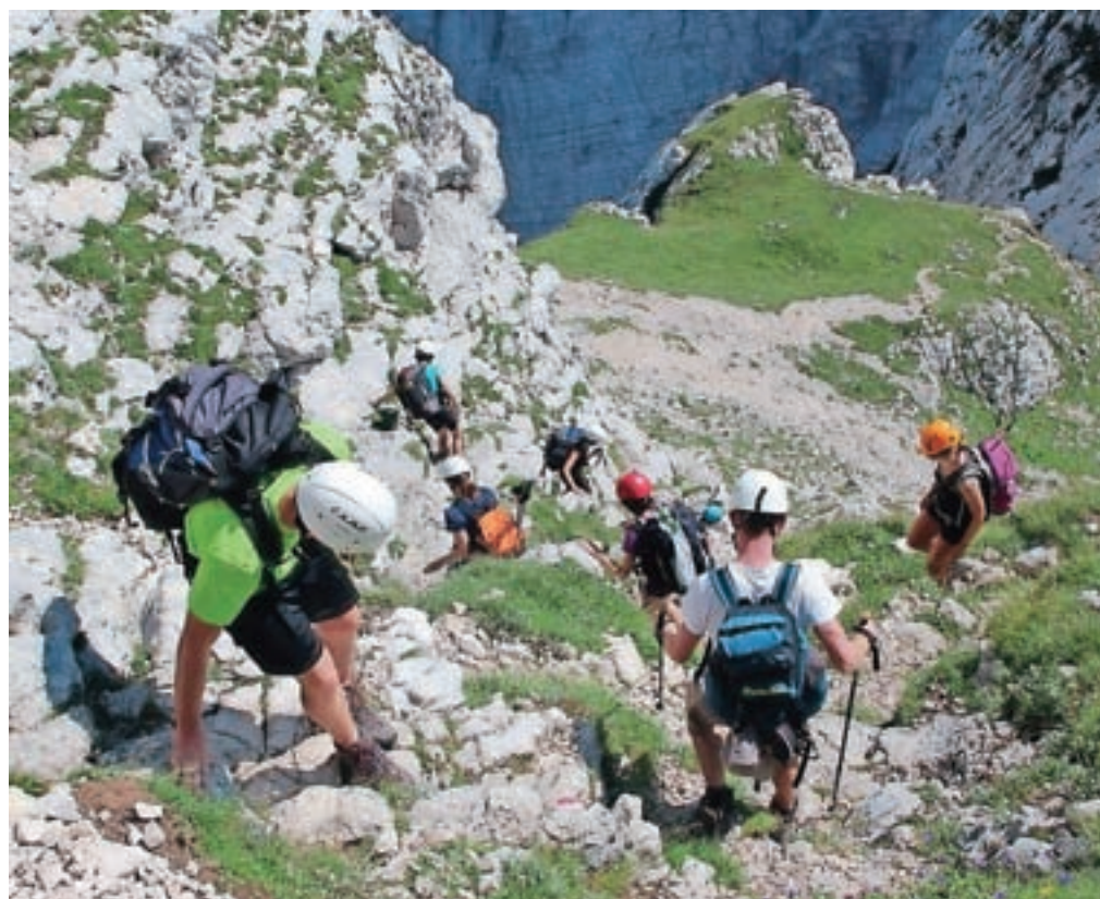
Opremljenost gornikov je vedno boljša, vendar pa je obremenitev gora, zlasti Triglava, že prevelika, ugotavlja Rozman.

Poleg intervencij so gorski reševalci opravili še vrsto drugih aktivnosti, od tradicionalne čistilne akcije na Triglavu do spremstev na tekmah in prireditvah v visokogorju. »Kar pomeni, da smo kar precej obremenjeni, če v račun vzamemo, da je treba še v službo in tudi za družino je treba najti nekaj časa. Sedaj je vsaj naš status zakonsko urejen, tako da nekaj nadomestil vseeno dobimo. Bistveno je, da reševalec nekaj od tega ima. Intervencije so skoncentrirane na obdobja, pride do sočasnih intervencij, podpora mora biti s tal, ena poklicna ekipa na primer tega ne bi zmogla ... Če se sistem prostovoljstva, kot ga imamo, nekoč sesuje, bodo težave. Do tega pa lahko pride zelo hitro.«