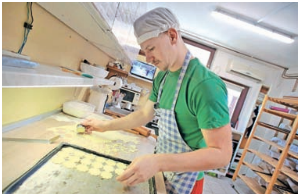
Za peko na mesec porabijo približno tona in pol moke.

K še večji prepoznavnosti njihove kmetije je zdaj prispeval še naziv mladega gospodarja leta. »Za tekmovanje so me prijavi v Društvu podeželskih žena Blegoš in sprva niti nisem želel sodelovati, a se je izkazalo, da je bila zelo zanimiva izkušnja, spoznal sem ogromno novih ljudi.« Na podlagi vnaprej predpisanega gradiva, ki so ga morali preštudirati, so preverili njihovo znanje o čebelarstvu, žganjekuhi in poljedelstvu, sledile so še praktične naloge, kot je prepoznavanje semen. V finalu pa so se morali izkazati pri stepanju beljakov, ribanju zelja in polnjenju antistresnih žogic, ki jih sicer izdeluje lanskeletna nosilka naziva mlada kmetica leta, je raz-