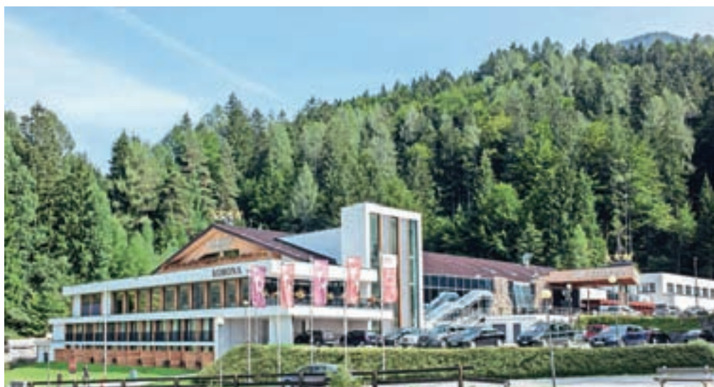
Prenovljeno Korono bodo odprli konec meseca.

prihaja iz Italije, prvi odzivi pa so izjemno dobri. Naš cilj je okrepiti tržni položaj Korone kot položaj alpskega igralniško-zabavišnega centra v povezavi s Špikom kot alpskim resortom. Obetamo si prodor še globlje na avstrijski trg, ki je glede kvalitete produkta zelo zahteven.«