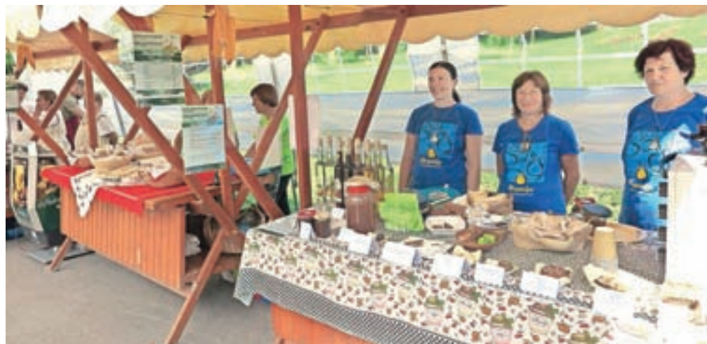
S svojimi dobrotami so se predstavile še druge blejske vasi, med njimi z jedmi iz tepke TD Zasip.

popেকে v peči. Ker je bilo testo zelo tanko, se je lahko hitro posmodilo. Od tod tudi ime posmodulja, je pojasnil Kerčmar. V društvu so jo minuli konec tedna pripravljali z olivnim oljem s česnom in polnomastnim ribanim sirom ter je bila tudi tokrat prava uspešnica med obiskovalci. »Na posamezni prireditvi jih spečemo od tristo do štiristo, pa tudi petsto smo jih že,« je Kerčmar zadovoljen, da se je ta stara jed tako dobro prijela.