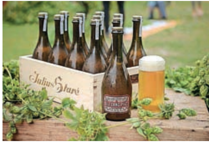
Posebna polnitev piva mengeških mikropivovarjev z namensko izdelano embalažo: steklenice, etikete, zaboji, kozarci

Najpomembnejši eksponat, povezan s pivovarno, pa so zagotovo polne steklenice vsaj sto let starega piva, ki je še nedolgo tega veljalo za najstarejše v celinski Evropi.