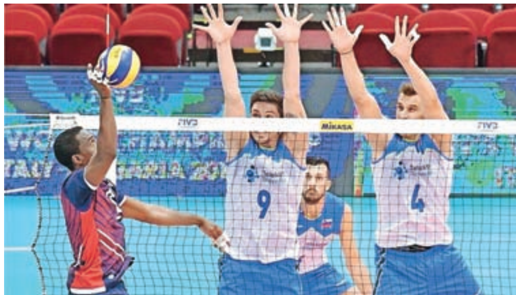
Moška članska odbojcarska reprezentanca prvič nastopa na svetovnem prvenstvu. Na uvodni tekmi so bili boljši od Dominikanske republike.

Poleg Slovenije, Dominikanske republike in Japonske so v skupini A še gostiteljica Italija, Belgija in Argentina.