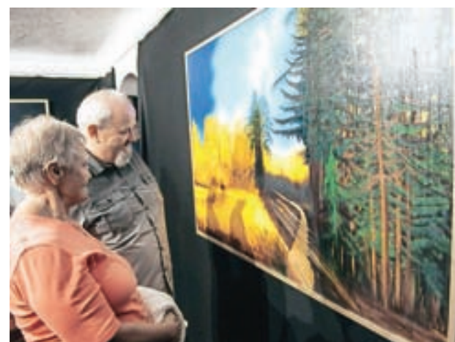
Ob ogledu razstave. Razstavljene slike prikazujejo okoliško naravo, in sicer idealizirano in prikazano v najlepši luči ... a to je le polovica resnice.

Bandelj je zajel motive v krogu okrog Dupelj, vanje ujel trenutke dneva, ko je izrazito poudarjena svetloba. Želel je skozi pokrajino pokazati, kako smo bogati s koruznimi in pšeničnimi polji, urejenimi potmi, pogledi na naravo, na hribe v vseh letnih časih. »Izročilo pravi, da Duplje varuje sv. Primož na Jamniku, zato sem upodobil tudi motiv te cerkve. Če ne bi bilo strele, ko sem slikal, bi še mislil, da je cerkev kar v nebo postavljena, tak prizor se je odvrtel,« je pojasnil. Sožitje z naravo razume kot trenutek miru in svobode in prav to želi z načinom postavitve razstave, ki jo pospremi zvoki iz narave, doseči pri obiskovalcih. Formati slik so veliki, ker je lahko le na ta način poustvaril idiliko. V drugi razstavni sobi galerije je naslikal štirinajst rastlin, ki v teh krajih izginevajo iz narave. Skozi oči slikarja je opozoril na odnos do okolja, kar je še