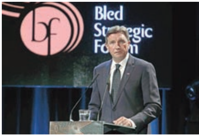
Predsednik republike Borut Pahor je na Blejskem strateškem forumu ugotavljal, da je EU v zastoju zaradi deficita vizije nadaljnje poglobitve povezave.