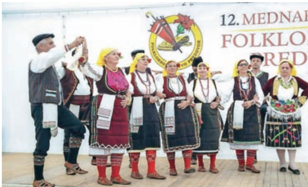
Makedonsko kulturno društvo Ilinden z Jesenic

ljudski običaj ofiranje v okolici Kranja. V njihov splet sta vključena plesa ta potrkana in mazurka. Po folklornem delu je sledila zabava z ansamblom Lunca.