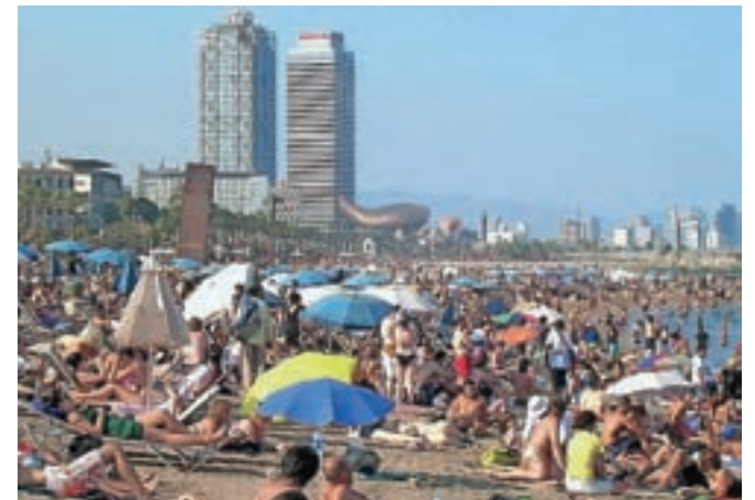
Današnji masovni turizem: turisti na plažah Barcelone, fotografirani julija 2007