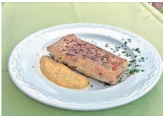
Zmagovalni krožnik 16. Postrvijade: zavitek s postrvjo in rižoto iz ajde in pire ter zelenjavno omako