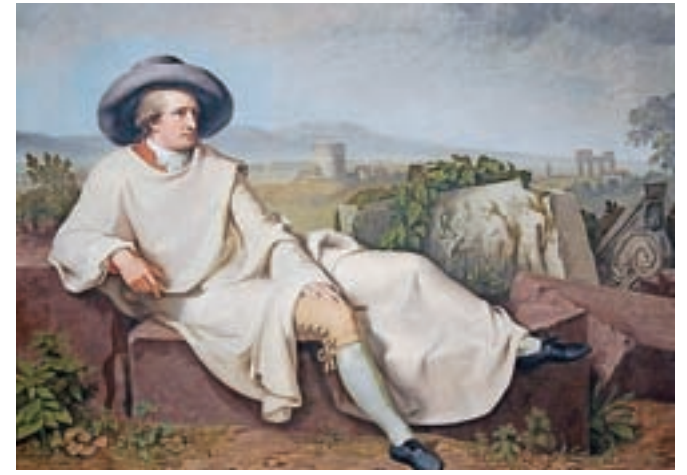
Veliki Goethe kot turist individualist. Na znameniti Tischbeinovi sliki iz leta 1787 občuduje rimsko Campagno.

Kar je begunec in turistom skupno, je to, da so oboji migranti. »Migrant je oseba, ki zapusti svojo državo, da bi živela v drugi, zaradi dela, študija, družinskih in drugih razlogov.« (Amnesty Slovenija) Recimo, da so turisti prostovoljni migranti.