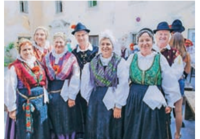
Folklorna skupina Društva upokojencev Naklo