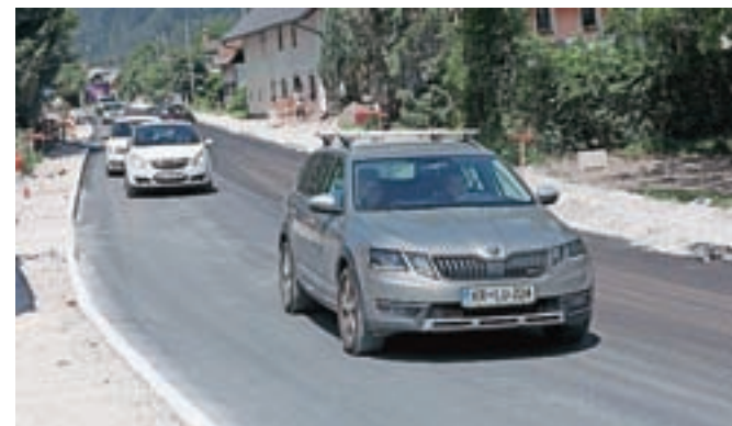
Del ceste skozi Gozd - Martuljek je že preplasten z grobim asfaltom.

Gozd - Martuljek – Prejšnji teden so na grobo preplastili prvi odsek državne ceste skozi Gozd - Martuljek. Po prvih napovedih naj bi bila sicer obsežna obnovitvena dela, pri katerih s sofinanciranjem pločnika in komunalne infrastrukture sodeluje tudi Občina Kranjska Gora, končana že do glavne turistične sezone, a se bodo, kot kaže, zavlekla. Izvajalec je namreč državo, ki je glavni investitor, zaprosil za dvomesečno podaljšanje roka izvedbe. V Kranjski Gori upajo, da bo do začetka glavne poletne sezone vendarle vsaj na grobo asfaltiran celotni odsek skozi kraj.