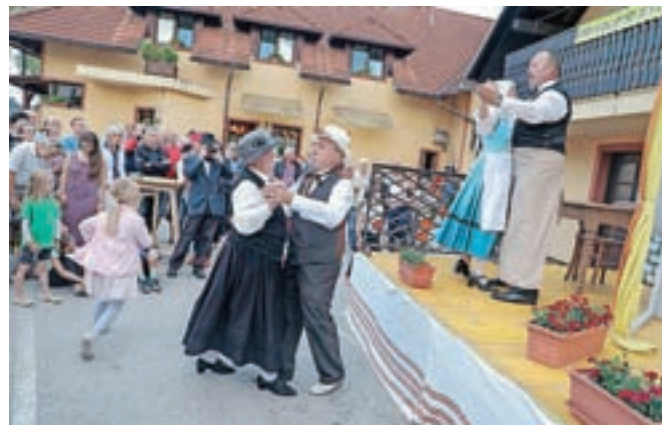
Po uspelem cesarjevem obisku so z veseljem zaplesali in kranjsko klobaso ponudili tudi obiskovalcem.