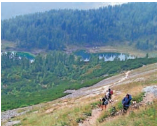
Pohodniki nad Dvojnim jezerom

Stara Fužina – Konec junija se je izteklo glasovanje v akciji Naj planinska pot. Planinke in planinci so zmagovalni poti, krožni poti Planina Blato–Planina pri Jezeru–Planina Dedno polje–Vrata pod Zelnarico–Prehodavci–Dvojno jezero–Štapce–Ovčarija–Planina pri Jezeru–Planina Blato namerili skoraj dvakrat toliko glasov kot drugouvrščeni poti, ki vodi med naslednjimi točkami: Aljažev dom v Vratih–Bovški Gamsovec–Stenar–Aljažev dom v Vratih. Na tretje mesto pa se je uvrstila planinska pot Soriška planina–Ratitovec.