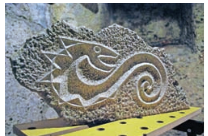
Kronogram z zmajem