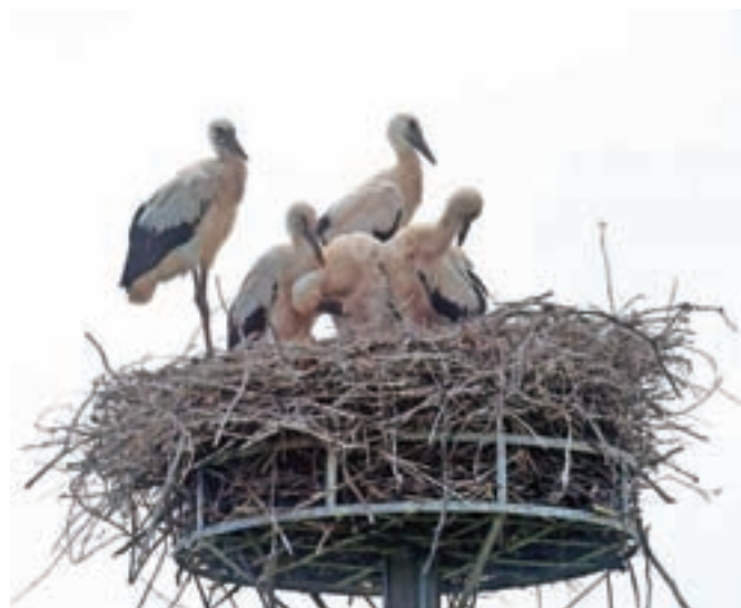
Pet mladičev v gnezdu, ki pa se že učijo leteti.

zjutraj hoditi po dvorišču in mimogrede s kljunom zgrabi kakšno vejico iz spletenih butar, ki ji pride prav za gnezdo. Še vedno prinašata tudi slamo za gnezdo,« sta povedala Planinčeva, ki predvidevata, da bodo štorklje na dolgo pot v južne toplejše kraje poleteli po 15. avgustu.