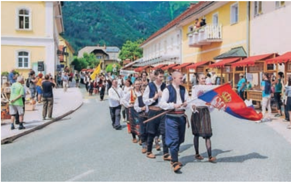
Povorka skupin na Mednarodnem folklornem festivalu v Preddvoru vedno privabi gledalce v središče kraja.

Hkrati na Petrov sm'n Folklorno društvo Preddvor organizira Mednarodni