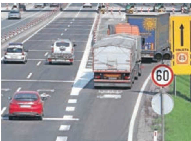
Po slovenskih avtocestah že deset let vozimo z vinjetami.

Kranj – Prvega julija je minilo deset let, odkar na slovenskih avtocestah velja vinjetni sistem za vozila, katerih največja dovoljena masa ne presega 3500 kilogramov. Prihodek od prodanih vinjet je do konca leta 2008 znašal približno šestdeset milijonov evrov, leto kasneje, ko so uporabniki prvič lahko kupili celoletno vinjeto, pa se je zvišal na 108 milijonov evrov. Prihodki od prodaje so naraščali tudi v naslednjih letih in so lani znašali dobrih 180 milijonov evrov. V desetih letih je Dars z njimi zaslužil več kot 1,3 milijarde evrov, ki jih je namenil za nadgradnjo slovenskega avtocestnega omrežja. Dars, ki sicer upravlja nekaj manj kot 620 kilometrov avtocest