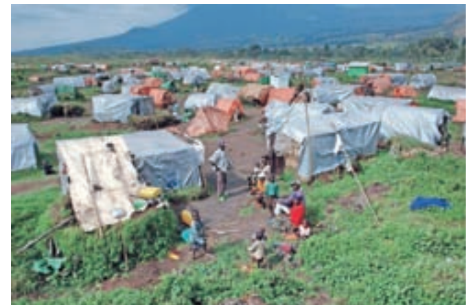
To ni turistični kamp. To je begunsko naselje Kibumba v DR Kongo, na meji z Ruando, fotografirano maja 2008.