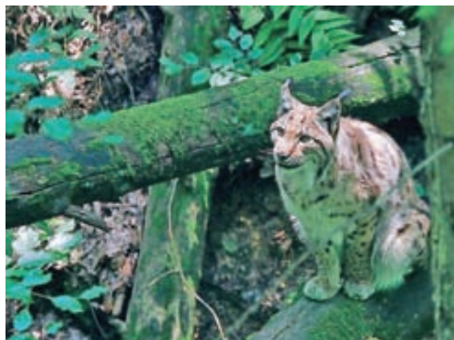
V Sloveniji po trenutnih ocenah živi od deset do dvajset risov.

ostal še kakšen osebek. Imamo kar nekaj podatkov o opažanjih, a trenutno nam še ni uspelo pridobiti genetskega materiala, ki bi ta opažanja tudi potrdil. Izjema je povoz risa iz leta 2014, ki je bil zabeležen v Lovski družini Nomenj - Gorjuše,« so pojasnili v projektni skupini. Predvidevajo, da bodo prve rise v Slovenijo doselili v prihodnjem letu, a je to odvisno od poteka odlovov,