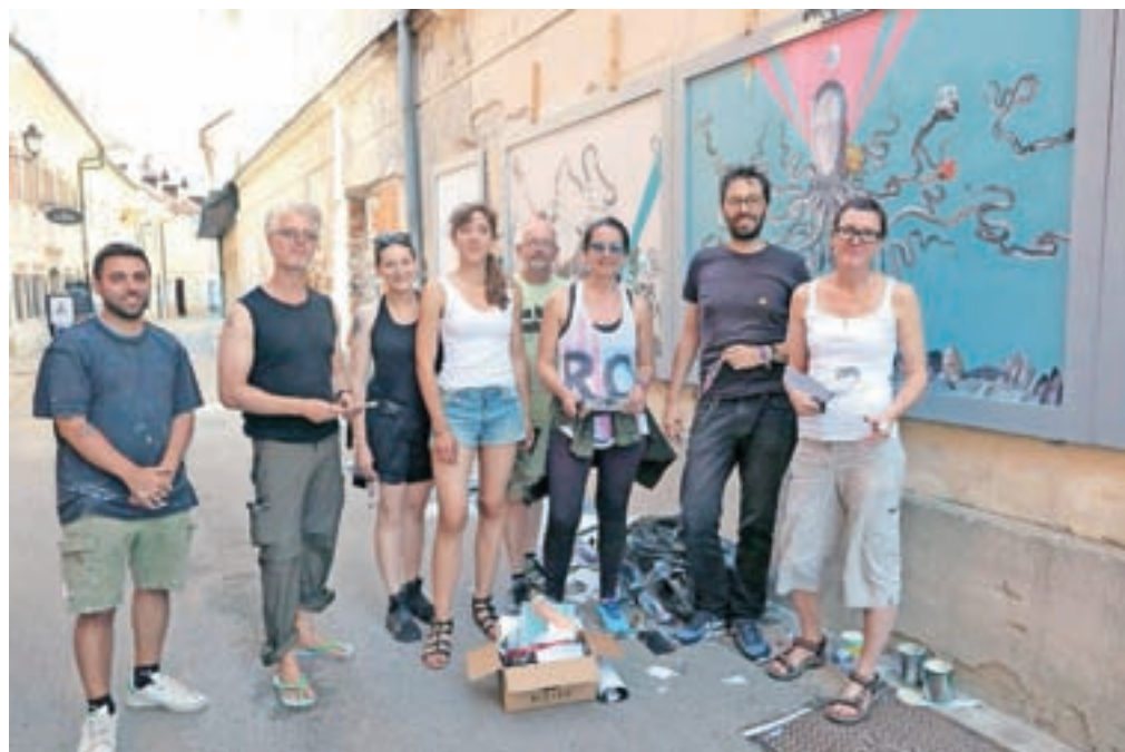
Umetniki, ki so teden dni gostovali v rezidenci Layerjeve hiše, so v Mergentalerjevi ulični galeriji združili moči v kolažu Chaosfera.

S celotnim projektom Kaos kolaž želijo popularizirati tudi med odraslimi, ne zgolj nečem, ob čemer bi se likovnosti in spretnosti učili otroci. Na festivalu so namreč v preteklem tednu že potekale delavnice kolaža, ki so jih vodili v rezidenci gostujoči tuji umetniki, domači se bodo zvrstili v juliju, pripravljajo pa tudi vodenje po kulturni četrti oziroma po vseh razstaviščih, kjer se bomo do sredine avgusta lahko srečevali s kolažem.