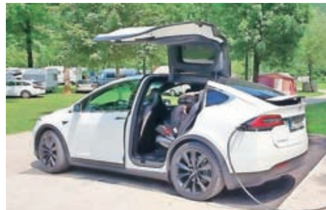
Polnilnica v Kampu Danica

»Tako si z najemom električnega vozila naši gostje kampa lahko privoščijo raziskovanje na tih, hiter in ekološki način,« je povedala. Ker pa niso dovolj samo električna vozila, so poskrbeli tudi za polnjenje, in sicer kar s Teslovo električno polnilnico, polnjenje električnih vozil za goste kampa pa je brezplačno. Kot je še dodal predsednik Turističnega društva Bohinj Boštjan Mencinger, s tem želijo privabiti nov segment gostov, ki so jim na voljo tudi številne javne polnilnice po Bohinju, tako sta dve nameščeni v Bohinjski Bistrici pri Domu Joža Azmana in dve v Ribčevem Lazu.