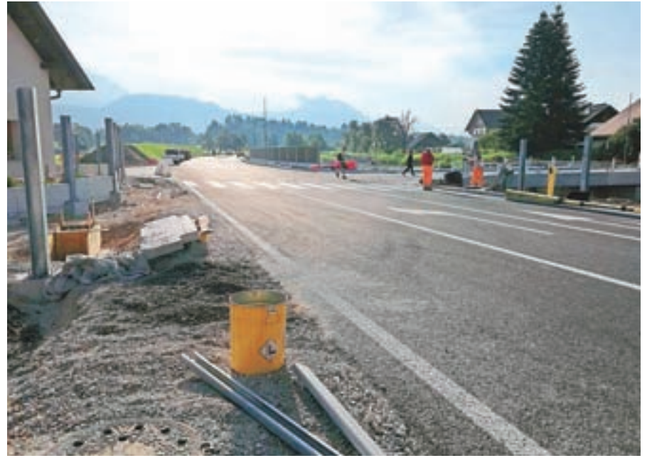
Še zadnja dela na Buču, kjer je med drugim tudi novo križišče.

Na novo so zgradili štiri mostove in dva prepusta, tri kilometre mešanih površin za pešce in kolesarje, nizko- in srednjenapetostno elektroenergetsko javno infrastrukturo, fekalno in meteorno kanalizacijo, javno razsvetljava, telekomunikacijske vode ter skoraj obnovili kilometer magistralnega vodovoda. Uradno odprtje ceste bo predvidoma 9. septembra, ko bodo dejansko zaključena