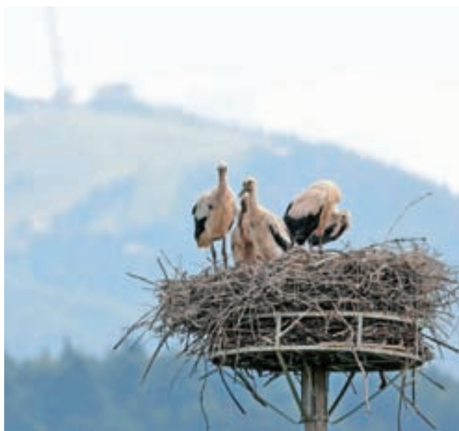
Planinčeva vsako leto občudujeta štorklje, pa še lep pogled proti Krvavcu je z njune domačije.

štorklji sta to kmalu zaznali. A zaznali sta tudi, da bosta v tem okolju dobili dovolj hrane. Tu gnezdijo prav vsako leto, doslej sta štorklji imeli po dva, največ tri mladiče, letos pa jih je kar pet, in temu se Planinčeva ne moreta nadejati. »Videti morate tudi, kako skrbita za mladiče; z razprtimi perutmi dela senco mladičem, prinaša hrano in vodo, s katero mladiče