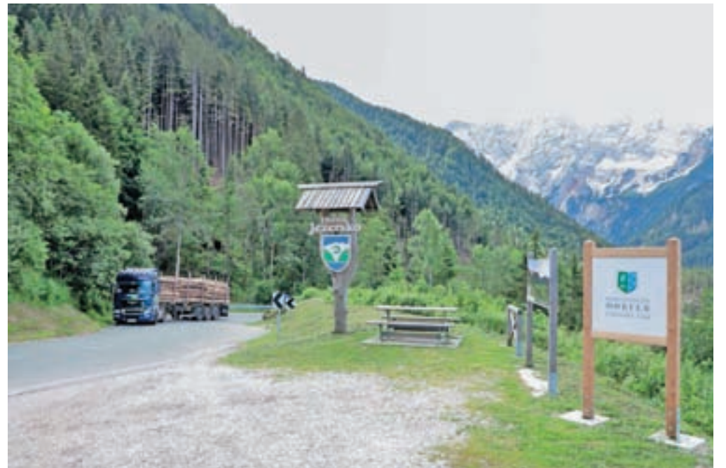
Na Jezerskem občani s 147 podpisi zahtevajo referendum o odloku, ki predvideva spremembo meje (slika z Jezerskega je simbolična).

Zahtevo utemeljujejo z dejstvom, da so meje občine Jezersko povzete po mejah nekdanje, predvojne občine in so kot take nespremenjene že stoletja. Pobuda navedena že več let izvaja pritisk, da postane mejna regija.