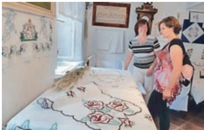
V Špendalovi hiši si je bilo možno ogledati razstavo Vezenine iz babičine bale.