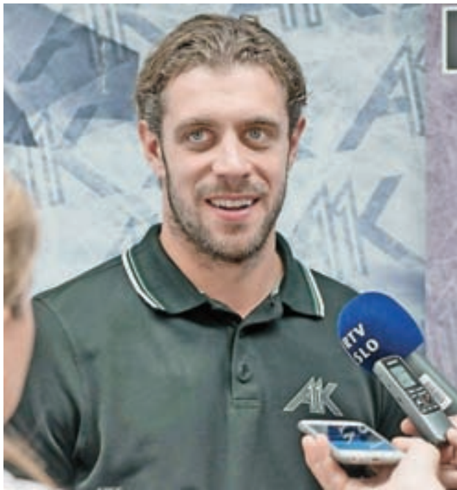
Anže Kopitar razmišlja tudi že o novi sezoni, v kateri si želi z Los Angeles Kings priti v končnici dlje kot letos.

»Moja sezona je bila res super. Najboljša po številkah in tudi moja igra je bila najboljša v teh 12 letih. Uvrstili smo se v končnico, kjer pa smo se odboja za Stanleyjev pokal poslovlili že po prvem krogu. Izpad je bil zagotovo prehiter. Obrambe ne moremo kriviti, ker smo v štirih tekmah prejeli le sedem zadetkov. Enostavno nam ni steklo v napadu. Oni so imeli tudi malo sreče oziroma mi malo smole. Predvsem z igralcem več nam ni šlo, nismo dali zadetka. Razlika ni bila takšna, kot kaže rezultat. Lahko bi se obrnilo tudi drugače. Vegas me je prijetno presenetil. Nisem mislil, da lahko tako daleč pridejo.«