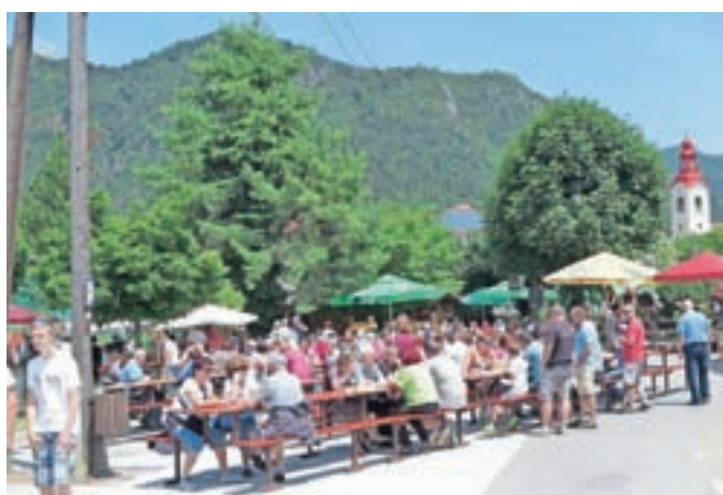
Sejensko dogajanje bodo zaokrožile stojnice z dobrotami in izdelki domače obrti.

Dogajanje je zaključilo popoldansko druženje s Hišnim ansamblom Avsenik.