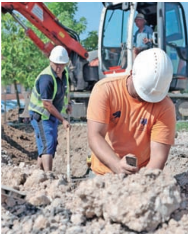
Tujci se pri nas največ zaposlujejo kot zidarji, varilci, vozniki, natakariji ...

Čeprav na Gorenjskem doslej ni bilo večjega povpraševanja po hrvaških delavcih, pa to še ne pomeni, da podjetja ne zaposlujejo tujih delavcev, saj zavod za zaposlovanje delodajalcem ne more zagotoviti dovolj »domačih« delavcev. Gorenjsko gospodarstvo ima tako že