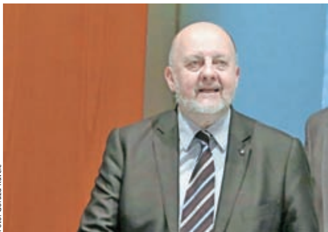
Predsednik SNS-a Zmago Jelinčič je ta teden zatrjeval, da ni bil izključen iz Sveta Evrope in o tem ni dobil obvestila.