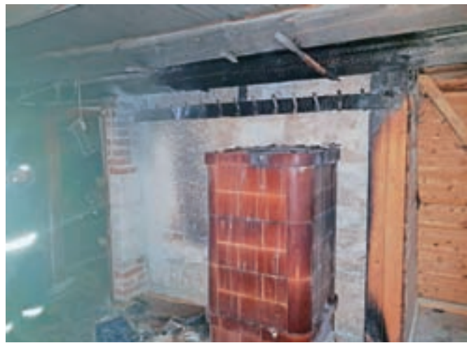
Zagorelo je pri peči.