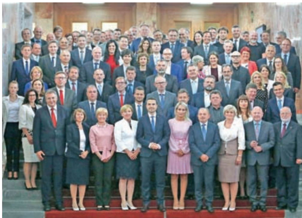
► 2. stran Poslanci novoizvoljenega državnega zbora po konstitutivni seji

Naloga prve seje je bila tudi izbira predsednika državnega zbora. Na to funkcijo so z osemdesetimi glasovi izvolili Mateja Tonina (NSi), kar pomeni, da so mu podpora namenile vse stranke razen Levice. Njegovo kandidaturo je vložilo pet levosredinskih strank (LMŠ, SMC, SD, DESUS, SAB) in NSi s prvopodpisanim Marjanom Šarcem. Pred tem je bilo v razpravi več imen, med njimi Miro Cerar (SMC) in dosedanji predsednik Milan Brglez (SMC).