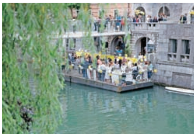
Glasba iz Makalonce je odmevala tudi na drugo stran Ljubljane.