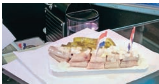
Slanikov file danes razrežejo na manjše grizljaje in bogato obložijo s kislimi kumaricami in na kocke narezano čebulo.