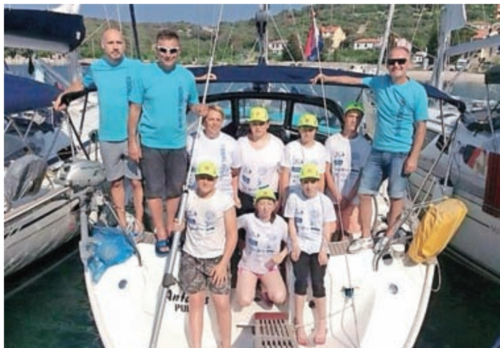
Učenke in učenci OŠ Jela Janežiča so raziskovali naravne bisere Kvarnerja.

Štiridnevna izkušnja skupnega bivanja in jadrnja, daleč stran od televizijskih ter računalniških ekranov, kjer ni manjkalo dobre volje in smeha, je vsem udeležencem pustila globok pečat in jih tudi osebnostno obogatila: jadrnje je bila velika šola sodelovanja, učenja sprejemanja drug drugega, medsebojne tolerantnosti, nudenja pomoči pri vsakdanjih opravilih ter iskanja mnogih pozitivnih področij pri vsakem od udeležencev.