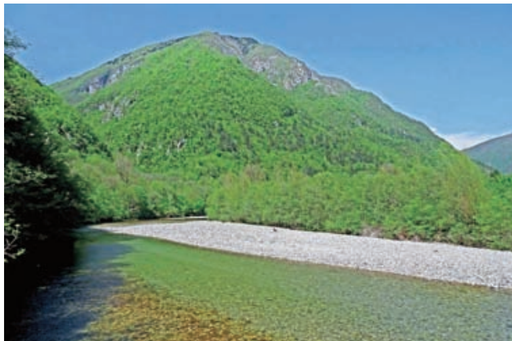
Monte Mia v popoldanskem soncu in kristalno čista Nadiža

Z vrha se vrnemo do planine, kjer pa gremo mimo zavetišča in po drugi poti spustimo v smeri sedla Nad Pradolom in Štupice. Sestop najprej poteka po cesti, ki pa se konča in nas usmeri na stezo skozi gozd. Spust je v zgornjem delu še zmerno strm, nato pa strmina narasča. Hodimo po listju in