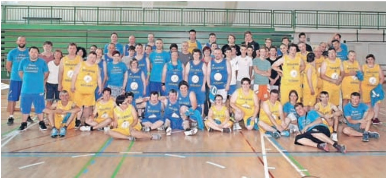
Zbrani na sredini prireditvi so vsak koš pospremili s kriki in nepopisnim veseljem.