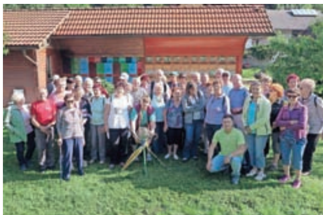
Naša skupina izletnikov pred čebelnjakom Koklovih v Potočah

»poklice« opravljajo čebele v svojih 45 dneh življenja, in nam zaupal, na kakšni višini troti oplodijo matico. Na kratko smo spoznali razvoj čebelarstva skozi zgodovino, pokazali so nam nekaj zaščitnih oblačil. Potem smo si ogledali še, kako je