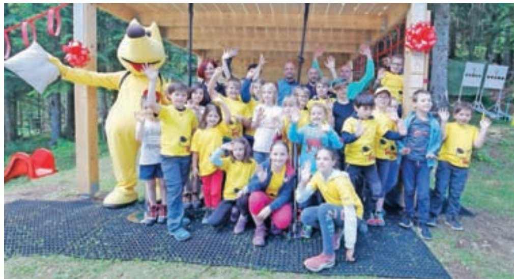
Pri Domu pod Storžičem so v soboto navdušeno pozdravili novo gozdno igralnico.

Z unikatno igralnico je bil tako vstop v deveto sezono priljubljene vseslovenske akcije Očistimo naše gore res igriv in družinski obarvan. In prav druženje in povezovanje različnih generacij je glavni namen večnamenske gozdne igralnice, ki je odprta 24 ur na dan in dostopna vsem.