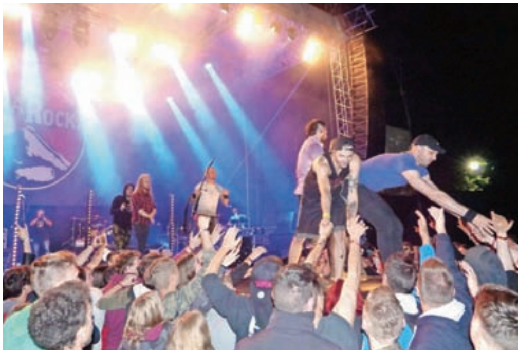
Skupina Avven med občinstvom festivala