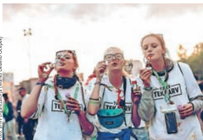
Tušev tek v barvah je bil letos četrtri in je bil ponovno dobrodolen. Pri tem teku čas ne igra posebne vloge.