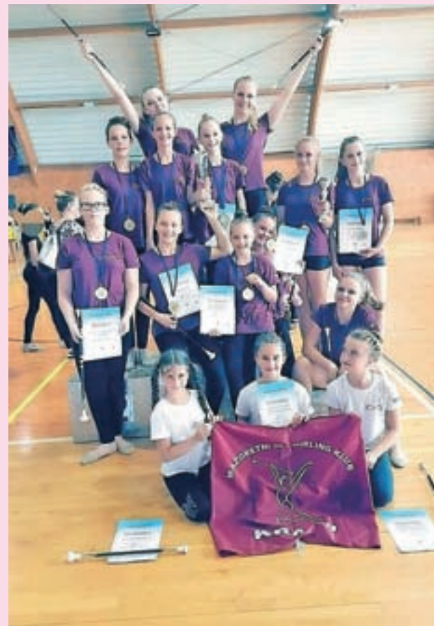
Dekleta so blestela tudi na Norminem pokalu. / Foto: arhiv kluba

Kranj – Članice Mažoretnega in twirling kluba Kranj so izjemno zaključile letošnjo tekmovalno sezono. Tudi to leto je bilo za vse polno dogodivščin, novih izzivov, vestnega treninga, nastopov in zmag. Skupno so dekleta preplesala 478 ur, opravila 15 nastopov po Gorenjskem ter osvajala odličja na štirih tekmovanjih. Udeležila so se državnega prvenstva za kategorijo dance twirl, finala državnega prvenstva MTZS za disciplino twirling baton, mednarodnega tekmovanja v twirlingu v Samoborju ter 5. Norminega pokala v Novi Gorici. Priplesala so si sedem zlatih medalj, sedem srebrnih in devet bronastih odličij ter pokal za najboljšo koreografijo in umetniški vtis. Pred kratkim so uspešno nastopila na zaključni prireditvi Pozdrav poletju, ki je potekala na Gimnaziji Franceta Prešerna v Kranju, na kateri so se predstavile vse članice kluba. Z raznolikim ter odlično izpeljanim programom so dekleta dokazala, da so zelo napredovala na vseh področjih: gimnastika, ples, elementi s palico. Kot je dejala njihova mentorica Ingrid Čemas, se dekleta zadnji dve leti bolj usmerjajo v disciplino twirling, kar se je izkazalo za zelo dobro odločitev, kar že kažejo tudi odlični rezultati na tekmovanjih.