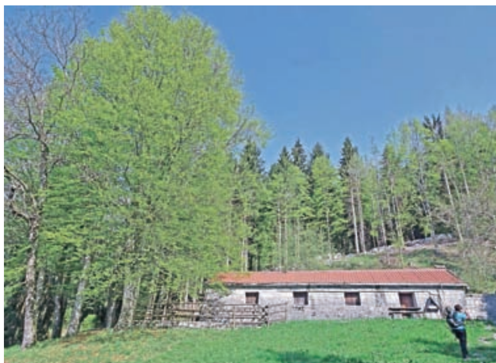
Na planini Mia; do vrha nas loči še približno 30 minut.

med skalami. Sestop je resnično strm, ponekod tudi malce neprijeten, saj je pot v senci in je precej vlažno in spolzko. Previdno. Ko stopimo na pot, ki pelje skozi pragozdno dolino (Valle di Pradolino), zavijemo levo. Pot