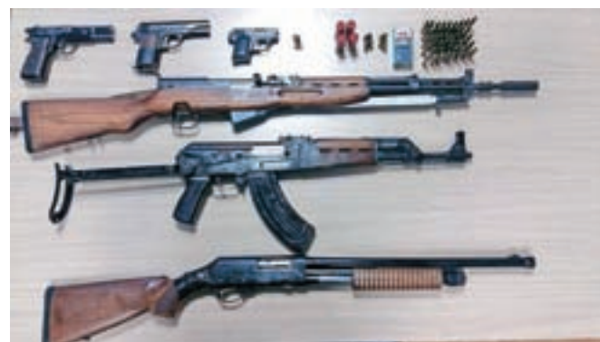
V hišnih preiskav so zasegli 21 pištol, dva revolverja, dve plinske pištole, puške, več kot tri tisoč nabojev, 45 detonatorjev, 48 dimnih vložkov, 19 topovskih udarov ...

V preiskavi je bil med drugimi identificiran 62-letni hrvaški državljani, ki je skrbel za transport orožja iz Hrvaške v Slovenijo prek t. i. zelečne meje, ki so ga potem prevzemali slovenski osumljenci. Najpomembnejši uspeh policistov pa je bila identifikacija 49-letnega bosanskega državljanca s stalnim