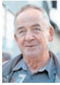
Vid Mali, Visoko:

»S praznovanjem Slovenci sporočamo, da smo na domovino navezani. Četudi večkrat potarnamo, lepo živimo in kot skupnost napredujemo. Ključno je, da imamo svoj jezik in kulturo.«