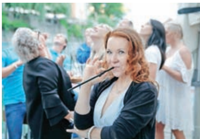
Pozibavanja v ritmih nove sladke avanture se je udeležila tudi Regina.