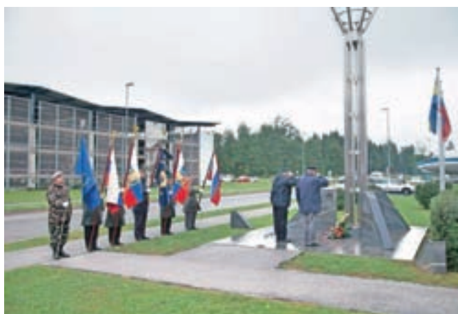
Polaganje cvetja ob pomnik na brniškem letališču leta 1991