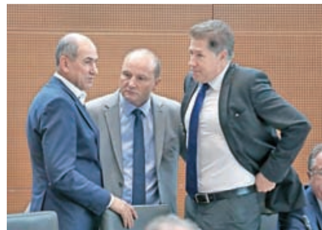
... ali relativni zmagovalec volitev Janez Janša?