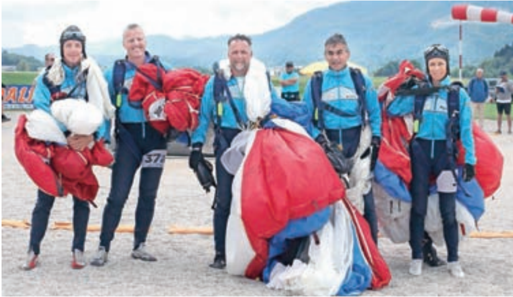
Naši padalci so se na domači tekmi dobro odrezali.