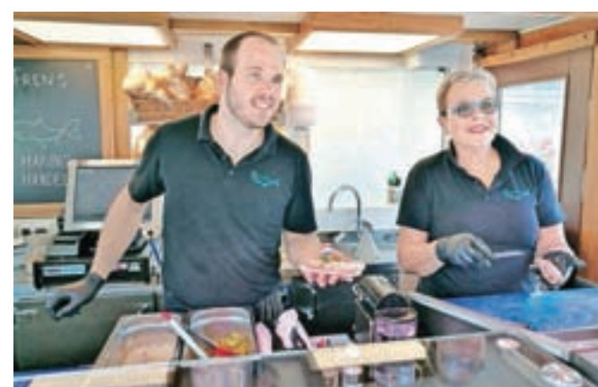
Jasper in Liesel Frens

nekoliko »prijaznejše«. Slanikov file namreč razrežejo na manjše grizljaje in bogato obložijo s kislimi kumaricami in na kocke narezano čebulo. Treba je priznati, da gre riba tako veliko lažje po grlu, saj priloge kar malce zakrijejo ne samo okus, ampak tudi vonj po surovi ribi. Vsekakor je okus surove ribe zelo zanimiv, če je tudi dobra, pa je verjetno stvar posameznika. O okusih se ne razpravlja, to so vedeli že stari Rimljani.