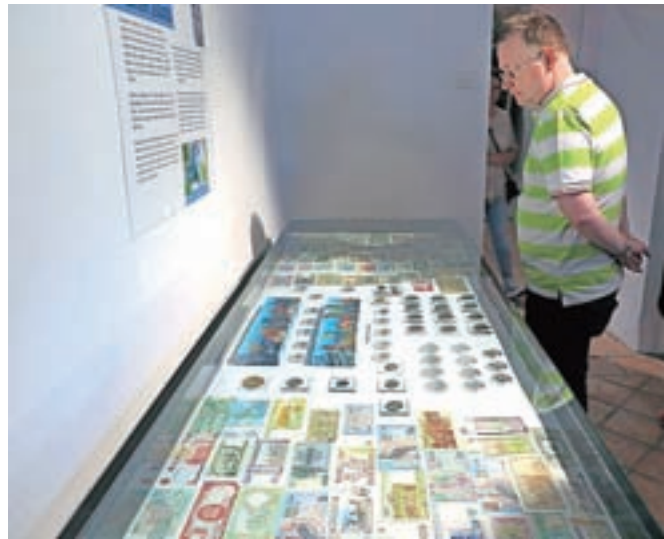
Razstava kovancev in bankovcev z motivi živali in rastlin je izjemno slikovita.

V Stebriščni dvorani Mestne hiše je na ogled zanimiva razstava z naslovom Flora in favna na denarju.