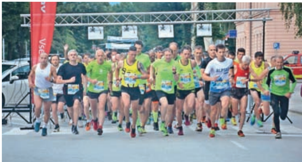
Več kot sto tekačev se je podalo na deset kilometrov dolgo progo.