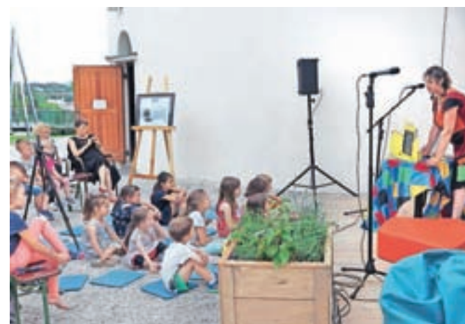
Pred otroškim stolpom Pungert so se otroci lahko potopili v pisan svet pravljic.