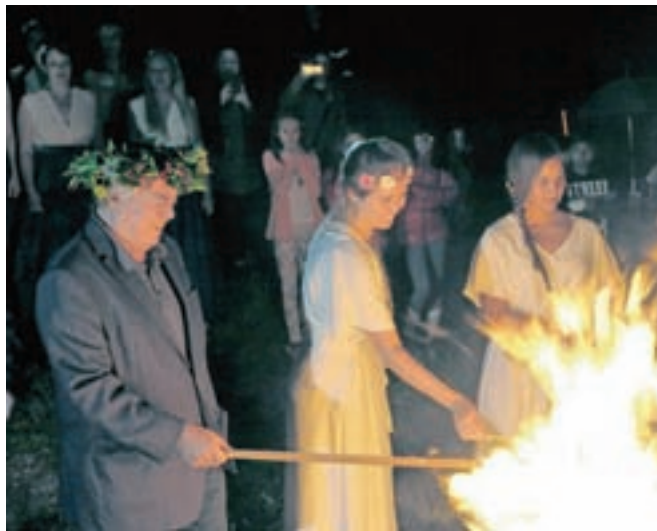
Drago Jančar, ovenčan z lovorovim vencem, je letos osvetlil kresni večer.