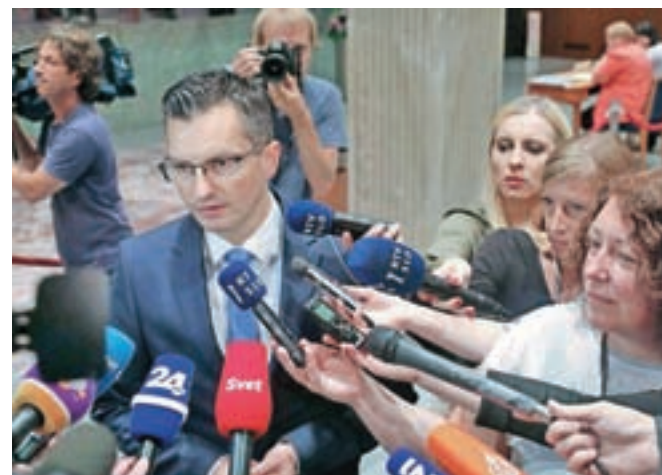
Kdo bo sestavil novo vlado: Marjan Šarec...

Sicer pa pogovori o morebitnih koalicijah potekajo že od volilne nedelje naprej: SDS se dogovarja v precejšnji tajnosti, Šarec pa z bolj odprtimi kartami in pred očmi javnosti.