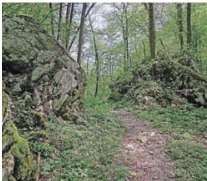
Pragozd v dolini Pradolino

Nadmorska višina: 1236 m Višinska razlika: 1100 m Trajanje: 5 ur in 30 minut Zahtevnost: ★★★★★