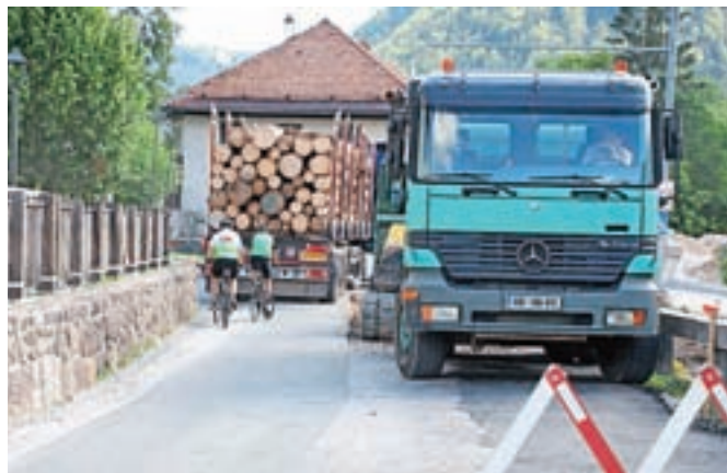
Tesno srečanje na gradbišču na Jezerskem

Jezerko – Na Jezerskem, kjer so v teh dneh pospešeno potekala dela pri rekonstrukciji državne ceste, smo doživeli pravcati prometni zastoj. Ob tesnem srečevanju dveh težko naloženih tovornjakov sta morala voznika uporabiti vso spretnost, da sta zvozila brez prask. Tudi kolesarja in gradbeni delavci so si oddahnili, ko sta se orjaka mimo gradbišča varno odpeljala vsak v svojo smer. Tistim, ki takšna srečanja doživljajo večkrat, je v veliko tolažbo, da se bodo dela kmalu zaključila.