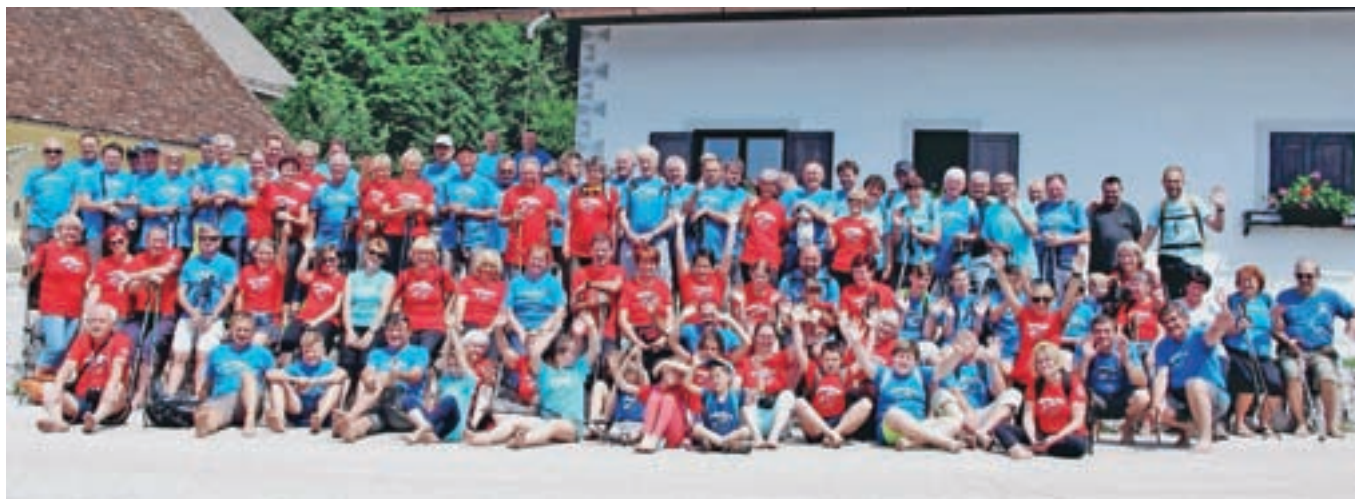
Letošnjega pohoda bosonogih se je udeležilo točno sto pohodnikov.

Vse več ljudi torej upošteva star pregovor, ki pravi: Ko pride Sveti Jur (23. aprila), se vržejo čevlje za dur. Med pohodniki smo tudi slišali, da si na takšen način odpravijo znojenje nog in zmasirajo podplate in da gre pri tem za pristen stik z naravo.