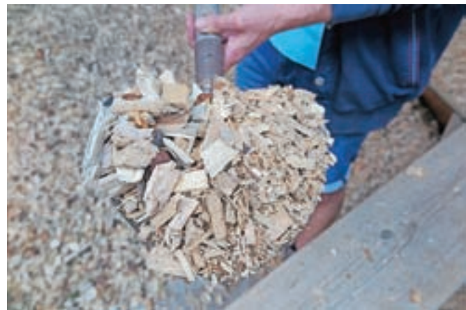
Desno so sekanci manjših in večjih kosov ter žagovina, ki jih v Sorici uspešno uplinjajo, levo pa sekanci, kakršne potrebuje večina drugih naprav.

poskuša opravičevati absolutno prenizke denarne odpravnine v višini 0,15 evra na delnico – in drugimi pravnimi manevri očitno zavlačuje sodne postopke ter se z vsemi sredstvi skuša izogniti odgovornosti do razlaščenih/iztisnitvenih delničarjev oz. plačilu denarne odpravnine, ki bi odražala dejansko vrednost odvzetih delnic in družbe Adria Airways, d. d.« Razsodba AA International Aviation Holdingu, sicer odvisni družbi luksemburškega sklada 4K Invest, nalaga tudi plačilo stroškov poravnalnega odbora v višini pet tisoč evrov, po mnenju VZMD pa se je z razsodbo ustavil tudi »vrtljak pritožb«, ki jih je vlagala družba.