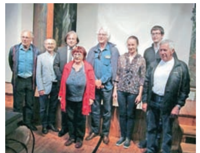
Predstavniki kulturnih društev iz občine Medvode in Slovenskega prosvetnega društva Borovlje

Borovelj prihodnje leto povabili v Medvode. Med rojake v Kanalski dolini v Italiji in na Koroškem pa je pretekli teden vodila pot tudi pevke in pevce mešanega pevskega zbora Peter Lipar, ki deluje pri Društvu upokojencev Kranj. Postaje njihove »zamejske« rajže so bile Višarje, Ukve in Ovčja vas v Kanalski