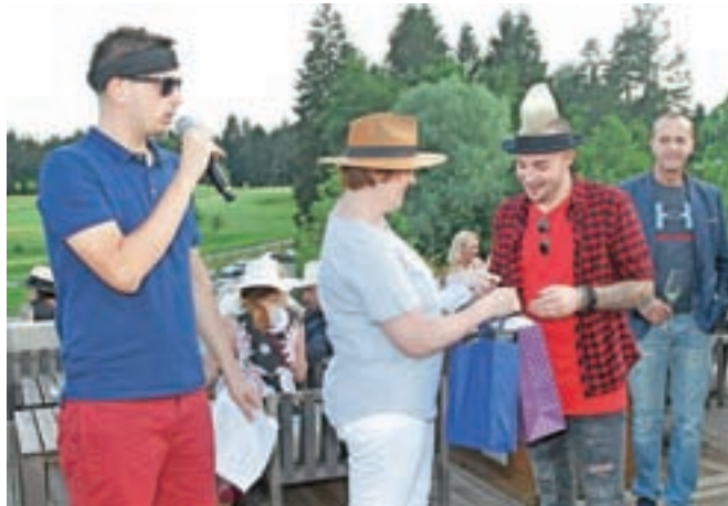
Trkaj je dogodek povezoval, Dejan pa se je domislil zanimive kombinacije za tokratni klobuk.