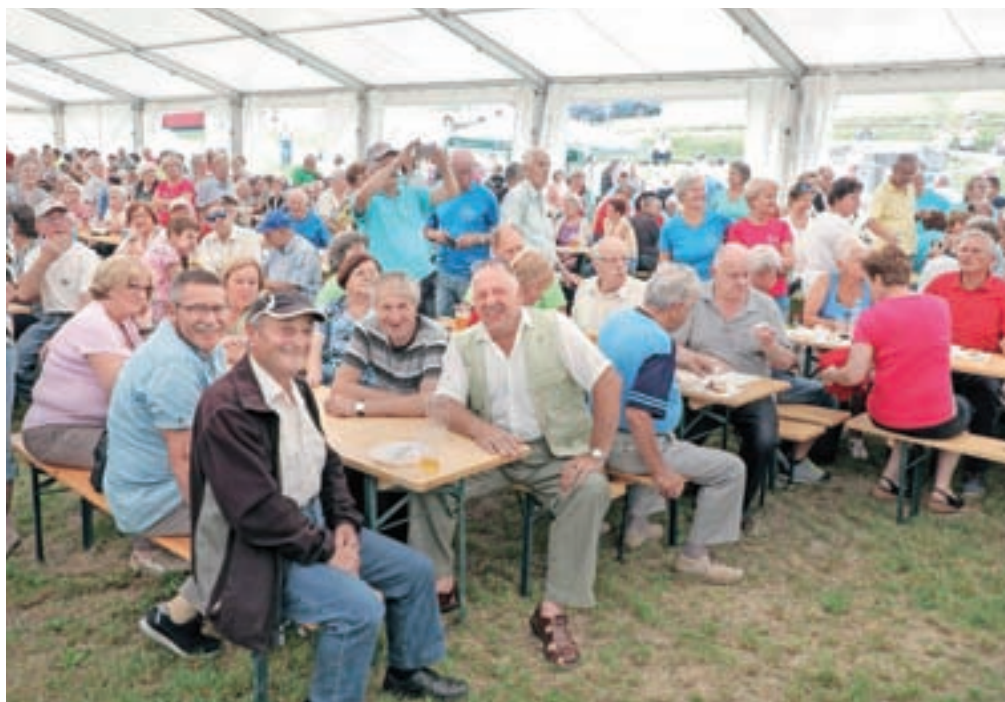
Na srečanju gorenjskih upokojencev se je zbralo več kot dva tisoč udeležencev.