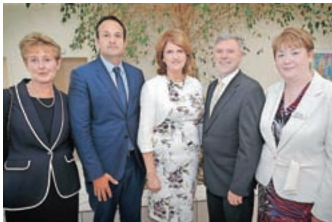
Leo Varadkar (drugi z leve), ko je bil še irski minister za zdravstvo, ob odprtju nove urgence v Connolly Hospital, Blanchardstown, julija 2014.