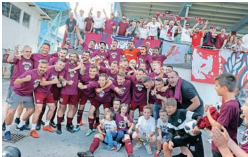
Nogometaši Triglava so se skupaj z navijači veselili še druge zmage v dodatnih kvalifikacijah in obstanka v prvi slovenski nogometni ligi.