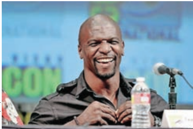
Terry Crews (1968), nekdanji igralec ameriškega nogometa (NFL), ki je postal filmski igralec in aktivist gibanja MeToo.