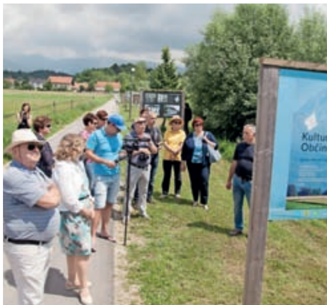
Nova razstava na prostem razširja zavest o pomembnosti ohranjanja kulturne dediščine.

Pester pregled komenske kulturne dediščine zaznamuje fotografije Franca Steleta ter dokumentacije Medobčinskega muzeja Kamnik, ki