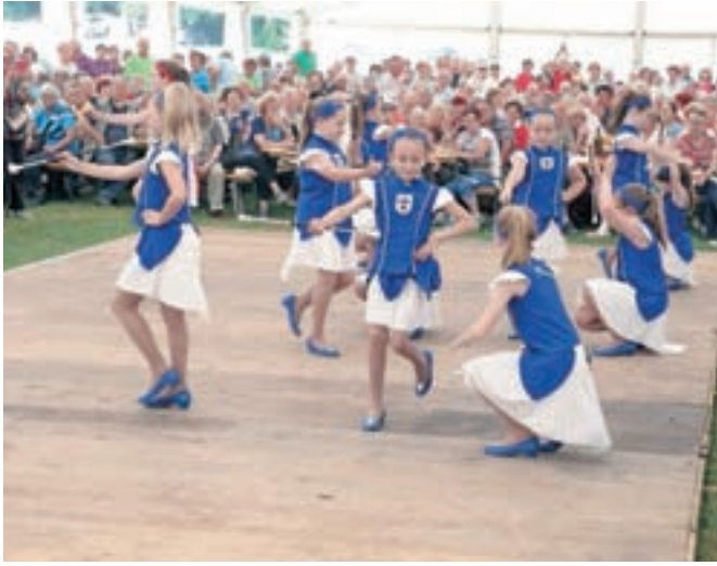
Za medgeneracijsko, zabavno in kulturno druženje so poskrbele tudi mlade moravške mažoretke.

A ne politiki in številnim težavam, srečanje je bilo v prvi vrsti namenjeno druženju, ki ga – kot so poudarili – upokojencem primanjkuje. Poleg tople malice in pestrega kulturnega programa pa so organizatorji poskrbeli tudi za brezžično internetno povezavo, da so lahko upokojenci – in ni jih bilo malo – utrinke z druženja in tudi kakšne 'selfije' sproti objavljali na družabnih omrežjih.