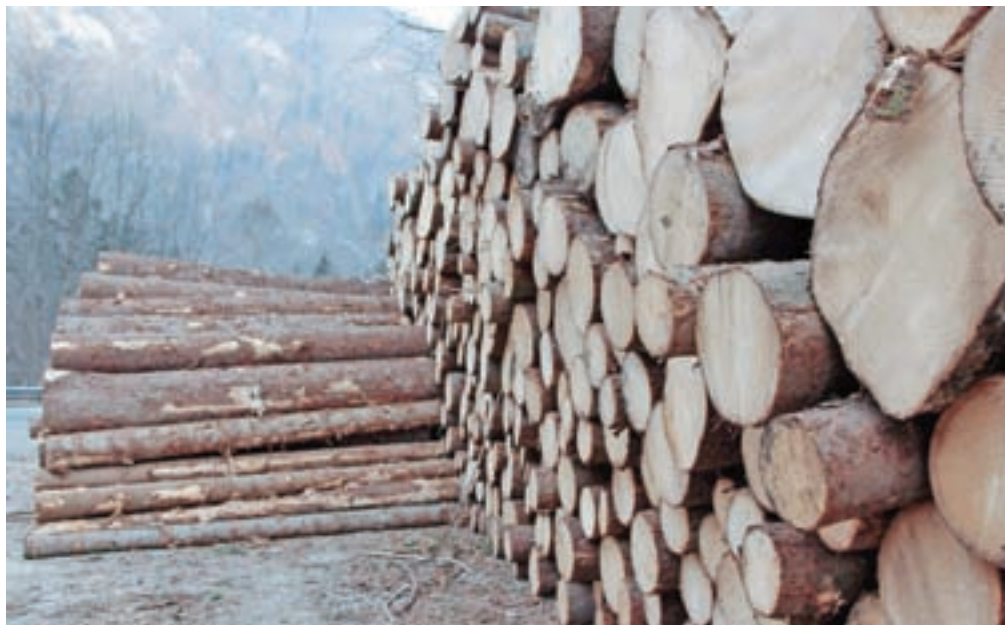
V Slolesu opozarjajo, da je trenutno žagarskega lesa dovolj, vendar le na račun večjega poseka zaradi čezmerne razmnožitve lubadarja in vetroloma.

Poleg podpisnikov memorandumu so naložbo podprli tudi politiki. Miro Cerar, predsednik vlade, ki opravlja tekoče posle, je dejal, da moramo izkoristiti svoje gozdove, pri tem pa spodbujati tako tuje investitorje kot domače žagarje, da bodo s posodobitvami in razvojem postajali vedno bolj konkurenčni. Minister za gospodarski razvoj in tehnologijo Zdravko Počivalšek je ugotavljal, da v Sloveniji izvozimo preveč surovin z nizko dodano vrednostjo in jo uvažamo v obliki polizdelkov z višjo dodano vrednostjo. »Boli nas, ko v strategijah razvoja velikih žag v sosednjih državah beremo, da imajo v bližini surovino iz Slovenije. Kolonije izvažajo surovine, mi pa to ne želimo biti,« je dejal minister za kmetijstvo, gozdarstvo in prehrano Dejan Židan in poudaril, da vsi