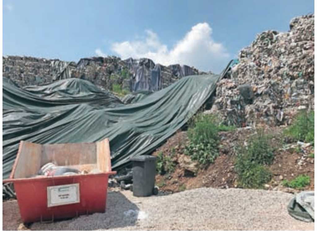
Zbirni center v Suhadolah je še vedno zasičen z odpadki.