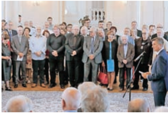
Predsednik republike Borut Pahor je v predsedniški palači pripravil sprejem ob 30. obletnici ustanovitve Odbora za varstvo človekovih pravic.