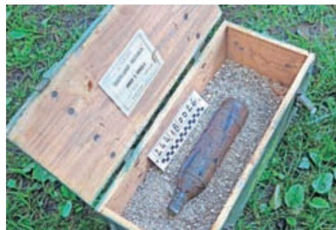
Najdena topovska granata v Blejskem jezuru izvira iz prve svetovne vojne.

najdenih ubojnih sredstev, ki izvirajo iz vojnega delovanja. Čeprav je bila granata najdena že v soboto, so z njeno odstranitvijo raje počakali do torkovega jutra. »Glede na to, da je bila najdba konec tedna, ko je bilo na Bledu polno turistov, in da sredstvo v vodi neposredno ni nikogar ogrozilo, smo se odločili, da z njeno odstranitvijo počakamo do današnjega jutra, da nismo motili vsakdanjega utripa Bleda. Smo pa na podlagi narejene fotografije iz baze podatkov že takoj pridobili ustrezne informacije in danes se je tudi potrdilo, da je najdeno sredstvo prav tisto, ki smo ga pričakovali – francoska topovska šrapnel granata, ki izvira iz prve svetovne vojne,« je razložil Boh. Najdena granata je bila nepoškodovana in varna za prevoz, zato so jo pripadniki državne enote za NUS odpeljali v začasno skladišče, kjer bo do