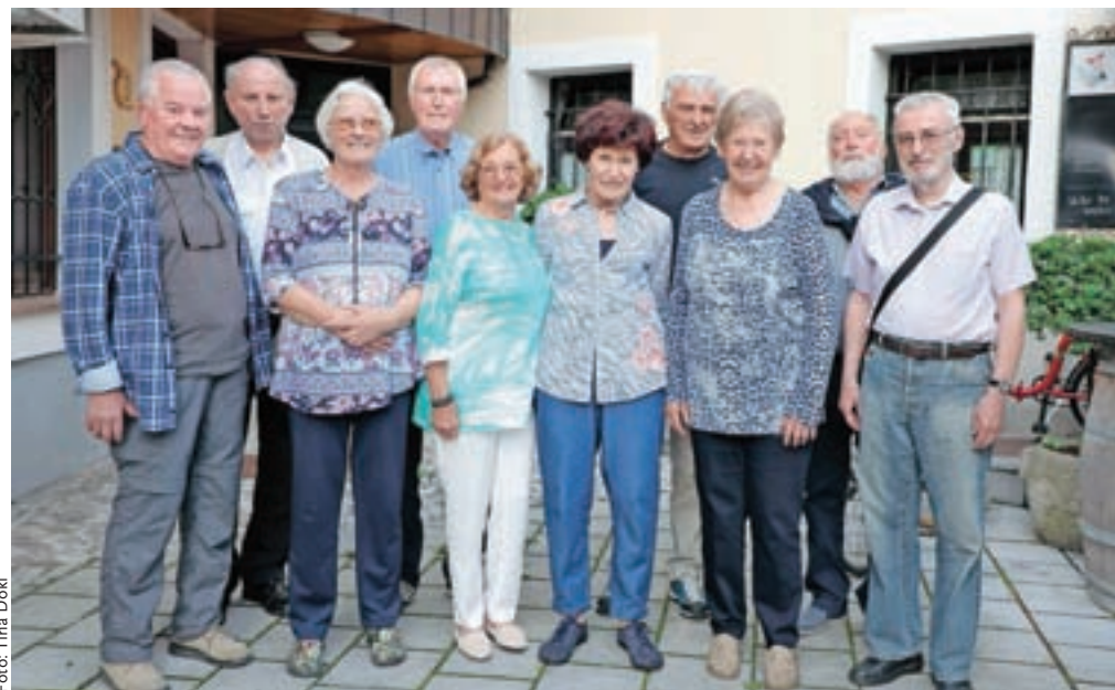
Ne družijo jih samo spomini na gimnazijska leta, ampak pravo prijateljstvo, ki traja in traja ...