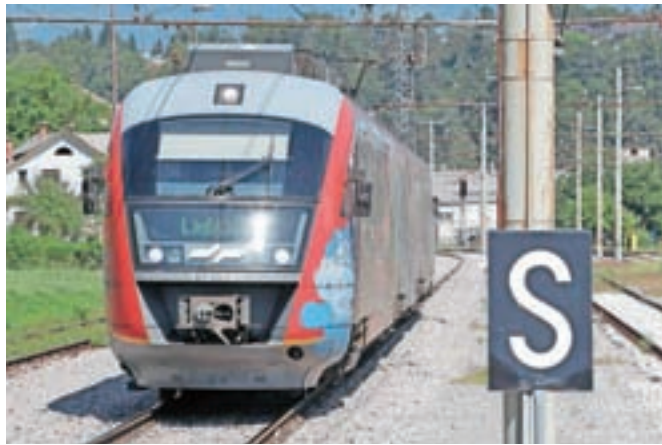
Računsko sodišče je ugotovilo, da poslovanje Slovenskih železnic na področju medsebojnega poslovanja družb v skupini ni bilo učinkovito.