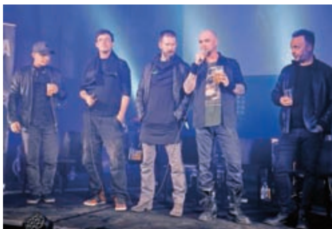
Skupina Siddharta je napovedala koncertno turnejo, v Kranju bodo nastopili prvega decembra.