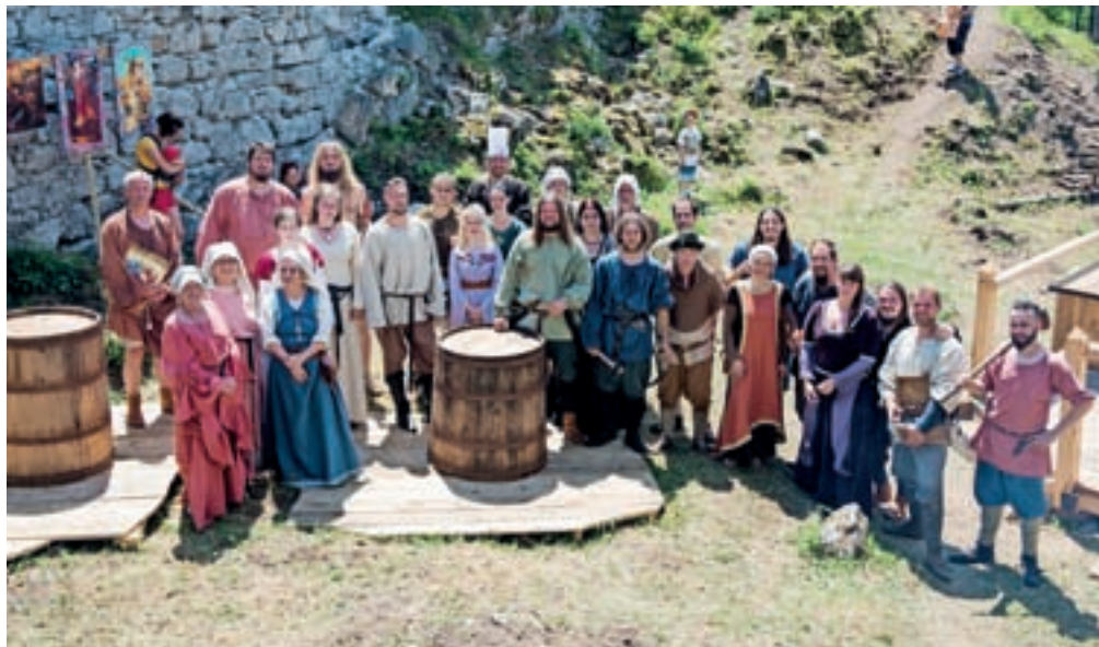
Srednjeveška idila na Hudem gradu s člani društva Ampus in Krajevno skupnostjo Bistrica

Na samem dogodku so se obiskovalci seznanili z zgodovino Hudega gradu in vstopili v pravo srednjeveško idilo z na novo ambientalno urejeno okolico ruševin. Sprehodili so se čez srednjeveško sejmišče, se preizkusili v srednjeveških igrah in lokostrelstvu, si ogledali mučilne naprave in orožje, naredili svoj kovanec, poskusili srednjeveško jed in oblekli prava grajska oblačila. Društvo Ampus je prav v namen Gutenbergških dnevov ustanovilo