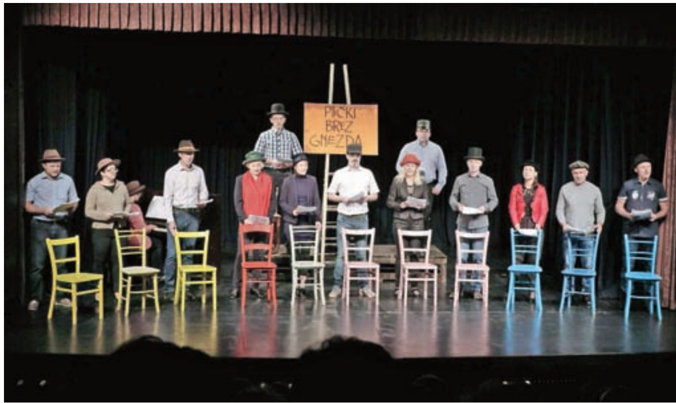
Poljanski »ptički brez gnezda« so na odru ponovili brezčasno zgodbo. Prvič so jo zaigrali, ko so bili še otroci.