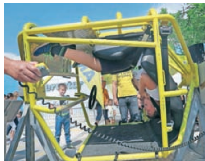
Med najbolj obleganimi simulatorji je bil zagotovo prevračalnik.

organizirali že dvanajstič, je bila osrednja tema varnost kolesarjev in pešcev ter varnost v prometu na splošno. Obiskovalcem so prikazali delovanje in opremo vseh služb, ki aktivno pomagajo ali pri urejanju prometa ali pri reševanju v prometnih nesrečah, torej od policije do gasilcev in reševalcev. Policisti so tako predstavili policijsko opremo in vozila ter kako ukrepajo v prometni nesreči, podobno predstavitve so imeli tudi kranjski poklicni gasilci in reševalci iz službe Nujne medicinske pomoči Kranj. Veliko zanimanja so med otroki poželi tudi prevračalnik, simulator vožnje motorja A-kategorije in otroški poligon v organizaciji kranjske poslovne