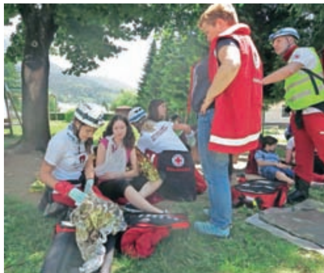
Gorenjske ekipe prve pomoči so po oceni ocenjevalcev v Križah prikazale dobro usposobljenost.