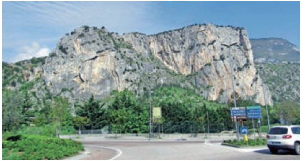
Pogled na Colodri, preko katerega poteka naša ferata.