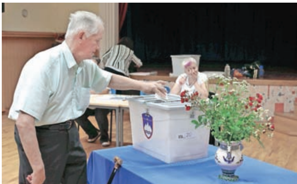
Na Gorenjskem se je volitev udeležilo nekaj manj kot 54 odstotkov volivk in volivcev, fotografija je z volišča v Šmarci.

Tudi stranka Alenke Bratušek ostaja v državnem zboru, o oblikovanju vlade pa je dejala: »Želim, da Slovenija po teh volitvah dobi dobro, izkušeno, odločno vlado, ki bo skrbela za prioritete, kot so zdravstveni sistem, upokojenci in mladi. Verjamem, da bo prihodnost takšna, da bodo Slovenci zadovoljni, in da je socialno-liberalna smer edina prava za Slovenijo.« Njena stranka bo v vladi, ki bo sledila vrednotam, med katerimi so prve človekove pravice in kjer bosta v koalicijski pogodbi kot prioriteta zapisani skrb za upokojence in za izboljšanje razmer v zdravstvu. »Ne znam pa si predstavljati, da bi vlado vodila stranka, ki niti za svojo stranko ne zna zakonito najeti posojila,« je zaključila Bratuškova.