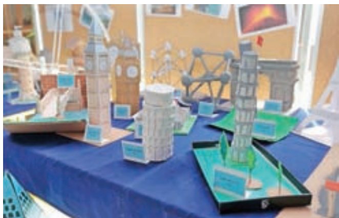
Učenci so se zares potrudili.