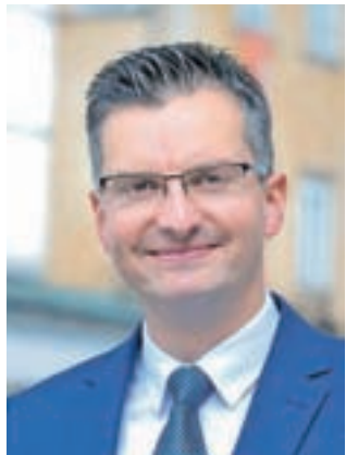
Marjan Šarec / Foto: Tina Dokl