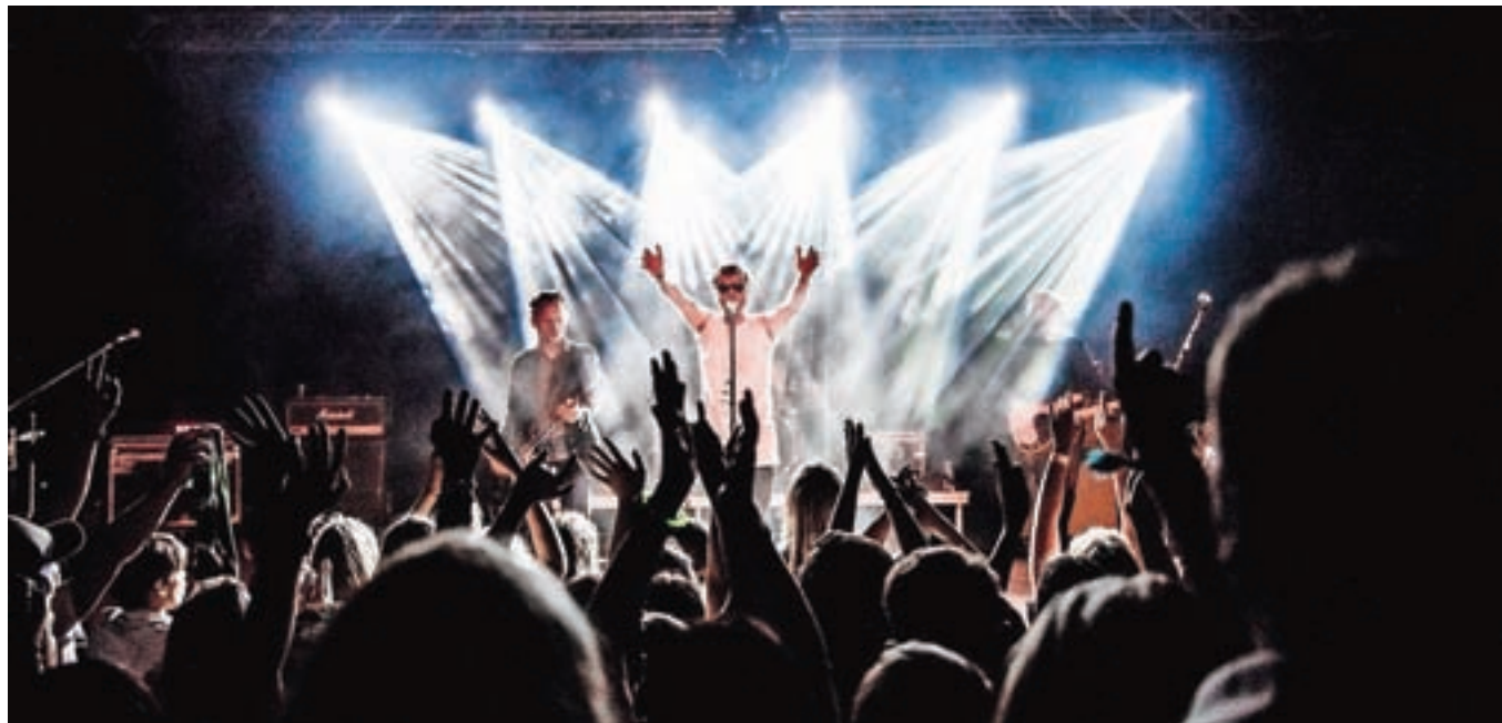
Od vročih plamenov do ledu s severa: Big Foot Mama na odru Khisla

V petek je na odru Letnega gledališča Khislstein nastopila zasedba Big Foot Mama, ki je poleg znanih uspešnic predstavila povsem svež album Plameni v rajju. Khisl bo v poletnih mesecih gostil še nekaj zanimivih koncertnih dogodkov.