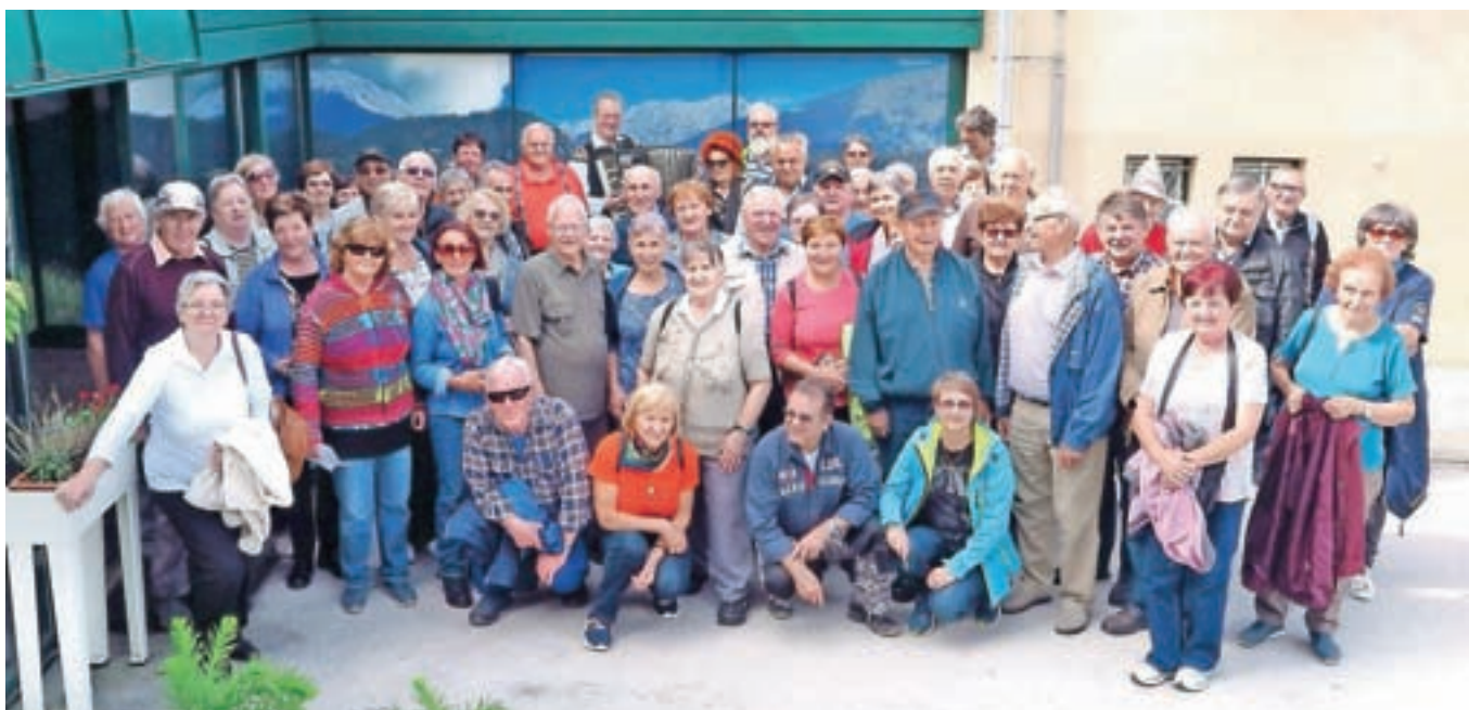
Izletniki pred Avsenikovim muzejem v Begunjah