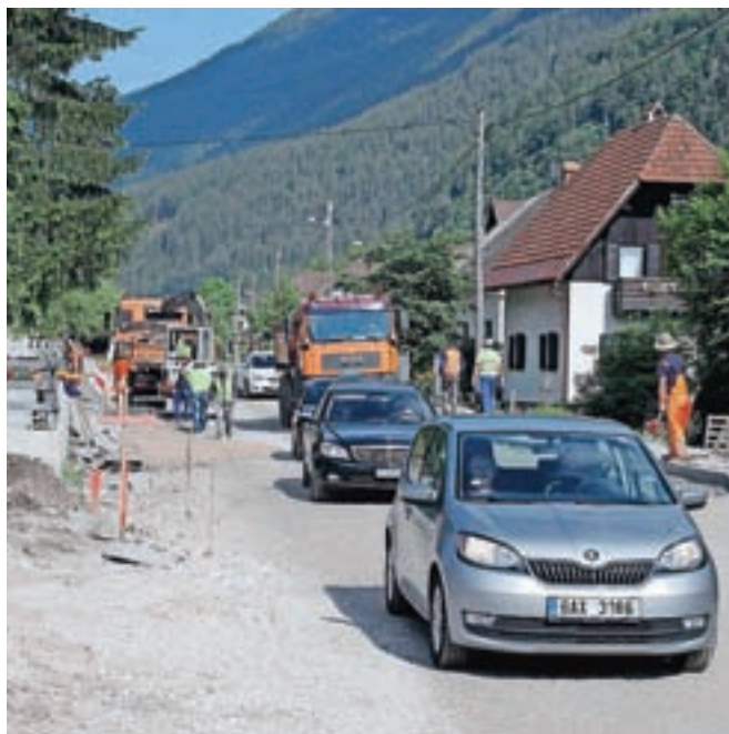
Dodatne prometne težave ob navalu obiskovalcev v Zgornejsavsko dolino povzročata tudi sicer težko pričakovana rekonstrukcija ceste skozi Gozd - Martuljek.

Kot je še povedal, bo dodatno parkirišče urejeno v Jasni, kjer pa bo treba plačevati