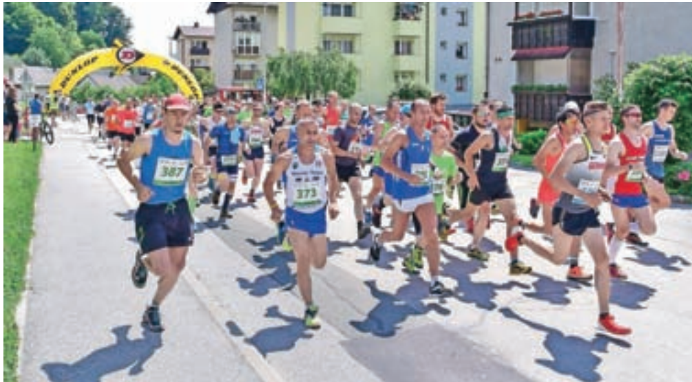
Tekači v mlajših veteranskih kategorijah in na odprti tekmi za vse so startali v Železnikih.