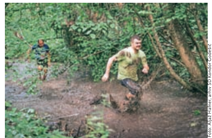
Kondorjev let: nora zabava ob teku čez ovire

Godešič – Le še štirje dnevi ločijo organizatorje in udeležence od drugega Kondorjevega leta, teka s preprekami na Godešiču. Na petkilometrski progi bo 34 bolj ali manj zahtevnih preprek, ki jih bodo tekmovalci premagovali v tri- do petčlanskih ekipah. Dogodek, na katerega so prijave še vedno mogoče, se bo začel z Mini Kondorjevim letom za otroke do devetega leta in od desetega do 15. leta; zanje je prijava brezplačna. Registracija se bo začela ob 11. uri, start bo ob 12. uri. Od 13. ure dalje bo Kondorjev let, od 19. ure pa večerna zabava in koncerti.