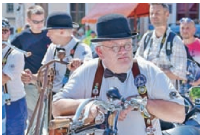
Starodobni kolesarji so se podali na dvajset kilometrov dolgo povorko.

starih »gvantih« in s kolesi, starejšimi od petdeset let, prevoziti dvajset kilometrov. Povorka se je vila od škofjeloškega mestnega trga do Trga pod gradom, kjer so pozdravili paraplegike in tetraplegike, prek Kamnitnika, okoliških vasi in nazaj. Starodobnike je spremljal ansambel Suha špaga, ki je s svojim petjem naznanjal prihod kolesarjev, in kot pravi Brane, so skupaj z njimi naredili pravi kraval.