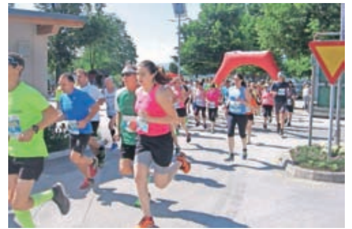
Brezjanski tek je potekal v peti izvedbi.

Naslednja tekma za serijo Gorenjska, moj planet bo Radovljiška 10-ka 22. junija z začetkom ob 20. uri.