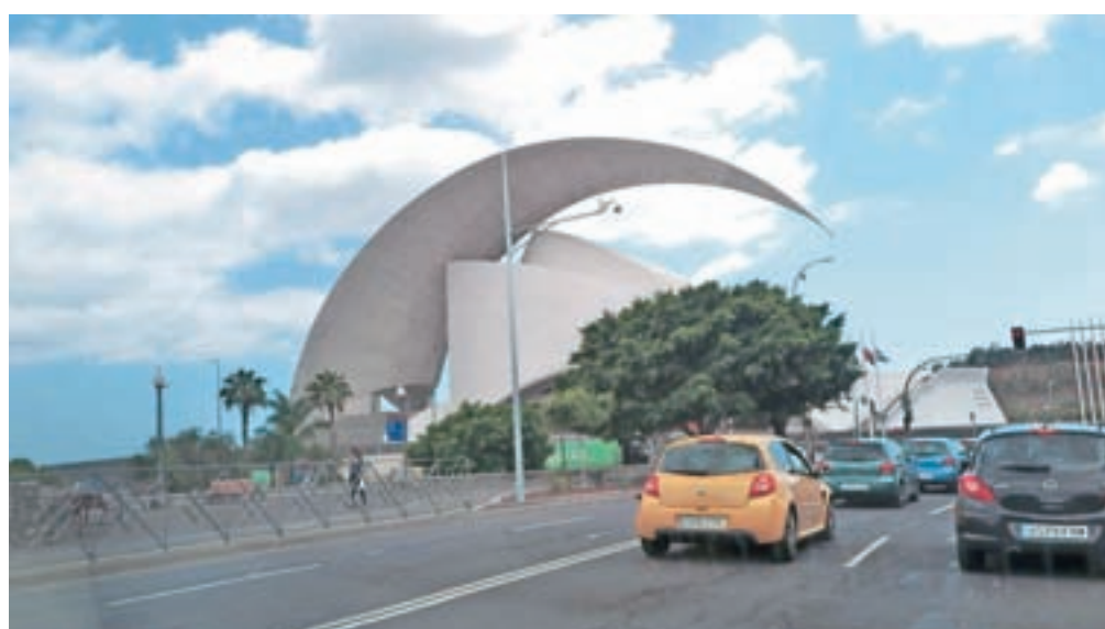
Stavba avditorija v glavnem mestu spominja na sydneyjsko opero.

sta sever in zahod otoka bolj zelena in bogatejša z vegetacijo. Po vsem otoku videvaš plantaže banan, ki jih gojijo v rastlinjakih, z vseh strani, tudi z vrha, zaščitenih pred morebitnimi škodljivimi vplivi. Ob obisku prodajaln s sadjem vidiš, da je skoraj vse pridelano doma. Cene so zmerne, podobne našim. Tudi v restavracijah, kamor te med sprehodom po promenadi ves čas vabijo vsiljivi »animatorji«, lahko ješ za malo denarja. Za osem evrov si že dobil okusno večerjo,