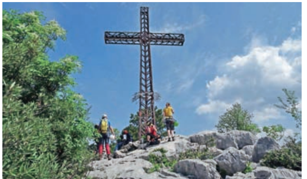
Colodri ima na vrhu križ.

kako si bomo narisali dan. V tej ferati bo naš dan absolutno lep! Sledi tehnično najzahtevnejši del, ki poteka po skobah. Za varovanje je na levi strani jeklenica. Ko smo na vrhu najzahtevnejšega dela, izstopimo iz ferate in na desni strani zagledamo križ, ki označuje vrh Colodri. Po tipičnem kraškem svetu se sprehodimo do vrha. Z vrha sestopimo po poti 431 v dolino Laghel. Pot poteka vsake toliko časa strmo navzdol, skozi gozd,