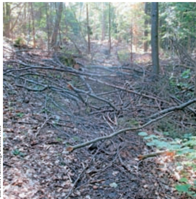
Takole je bil videti del planinske poti še pred kratkim, zdaj je pot sanirana, »podrte« markacije pa na novo označene.

»Zavod za gozdove Slovenije (Zavod) usmerja gospodarjenje z gozdovi v skladu