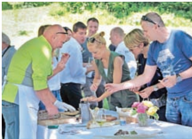
Matjažev salame so pritegnile številne okuševalce.