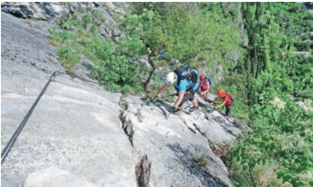
Prve gladke plošče, kjer je zahtevnost B. / Foto: Jelena Justin

Dostopa je približno 15 minut. Pred vstopom v ferato se opremimo s popolno feratarsko opremo. Kljub temu da pot ni zahtevna, je pa izredno obiskana, moramo poskrbeti za lastno varnost. Vstop v ferato poteka po gredi v desno, ocena A. Sledi del z oceno A/B, ko se obrnemo v levo. Pred nami bo gladka plošča, preko katere nas vodijo skobe, ocena B. Potem sledimo še naprej v levo. Menjavata se zahtevnosti A in B. Preden pridemo pod najtežji del, ki nosi oznako B/C, na levi strani zagledamo kip roke s slikarsko paleto. Zakaj je tam, nimam pojma, verjetno pa nosi sporočilo, da se moramo sami odločiti,