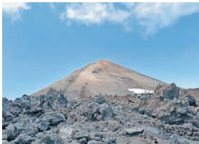
Vrh otoka je ognjenik Teide na 3700 metrih nadmorske višine.

temperature, ob koncu aprila so bile že kar poletne, tja do 26 stopinj. Vsako jutro sva se zaskrbljena ozirala proti zahodu otoka, kjer se je zadrževala oblačnost, dokler nisva v naslednjih dneh, ko sva obiskala tudi te predele otočka, doumela, da se na višini okoli tisoč metrov zaradi vplivov z Atlantika pogosto zadržuje oblačna zavesa. Zahvaljujoč temu