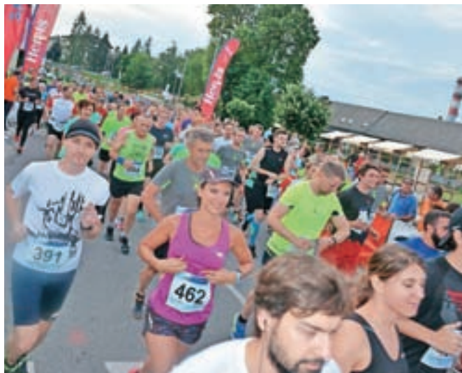
Tekači so tekli na pet ali deset kilometrov.

Festival se je zaključil v nedeljo s teniškim rekreativnim turnirjem in kolesarskim vzponom na Katarino, ki je bil letos namenjen rekreaciji za vse starostne skupine in ni bil tekmovalnega značaja. Proti cilju so se udeleženci podali tako s cestnimi kot z gorskimi kolesi po petih različnih trasah.