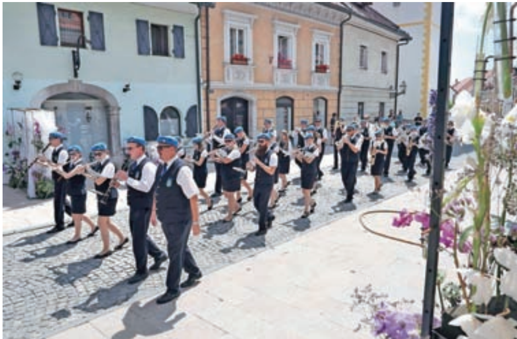
Godba je pomemben del Kamnika že sto sedemdeset let.