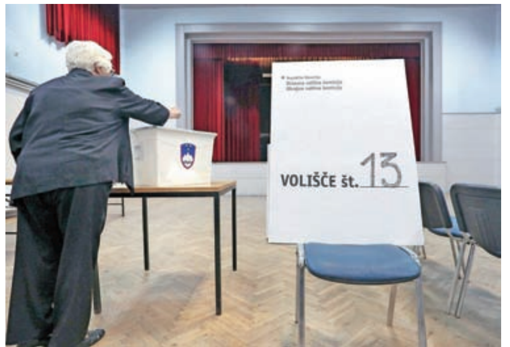
Referendum zaradi prenizke udeležbe za pobudnike tudi drugič ni bil uspešen / Foto: Gorazd Kavčič