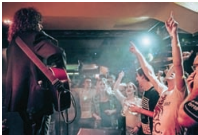
Večni Adi Smolar je vedno dobrodošel na festivalu. Tudi tokrat je navdušil v Klubaru, prostoru, kjer je pred mnogimi leti posnel svoj prvi album.

Minuli teden se je na Gorenjskem rodilo 36 novorojenčkov. V Kranju je na svet prišlo 10 dečkov in 8 deklic. Najtežja in najlažja sta bili deklici – prvi je tehtnica pokazala 4130, drugi pa 2585 gramov. Na Jesenicah se je rodilo 9 dečkov in 9 deklic. Najtežja je bila deklica, ki je tehtala 4100 gramov, najlažji pa je tehtnica pokazala 2790 gramov.