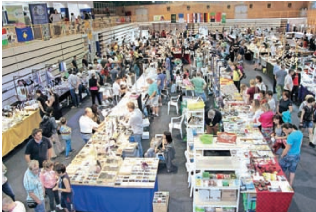
Na 46. Mednarodnih dnevih mineralov, fosilov in okolja je bilo 94 razstavljalcev iz 17 držav.