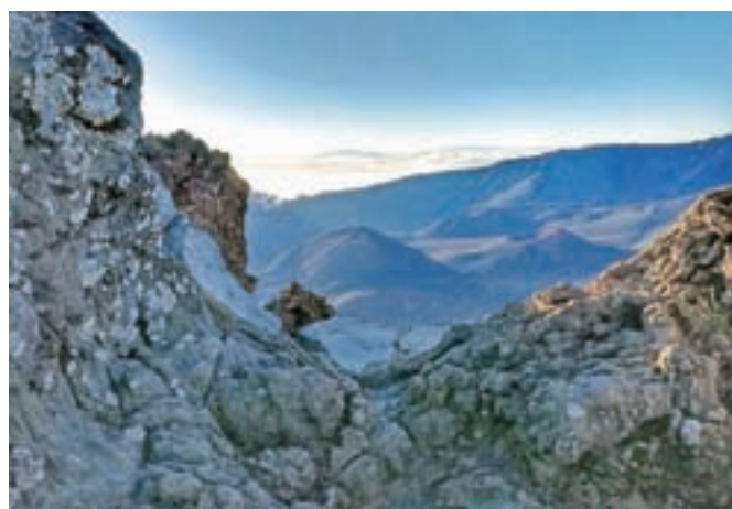
Sončni vzhod na vrhu ugaslega vulkana Haleakala (3055 n. m.) na otoku Maui

naravnano, a obiskovalec dobi vsaj občutek, kakšni so polinezijski plesi. »Pa da rahlo začutiš, kaj pomeni ta njihov aloha način življenja, kot oni to poimenujejo. Aloha namreč ni le pozdrav, dejansko predstavlja način življenja. Pri nas to pozna morda Siciljanci. Pa Dalmatinci, ki živijo tako, da se za stvari ne vznemirjajo, umirjeno. Čeprav je tudi na havajskih otokih to različno.