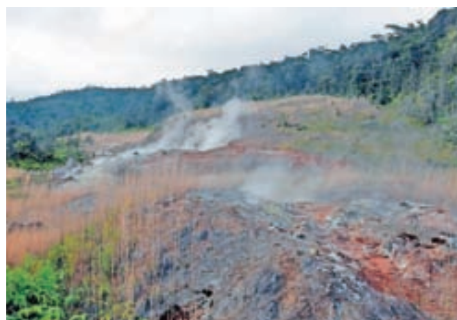
Vrelci pare in žvepla v vulkanskem narodnem parku na Big Islandu