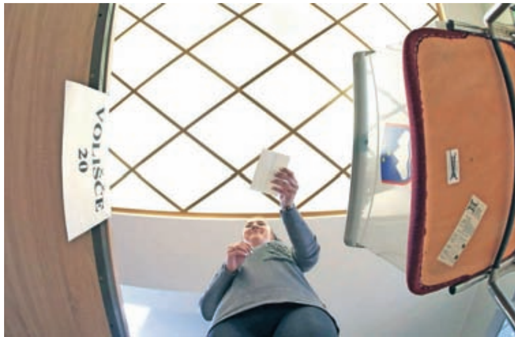
Na Gorenjskem se je referenduma udeležilo 15,60 odstotka volilnih upravičencev, v volilnem okraju Radovljica I, od koder je naša fotografija, pa 17,43 odstotka.