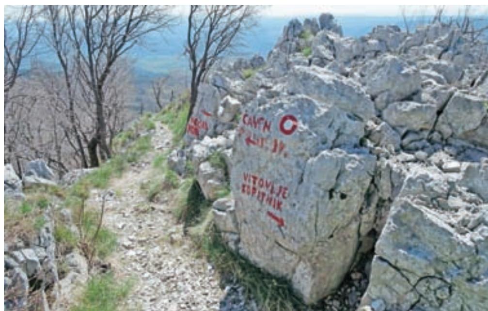
Razgledni pomol Sekulak