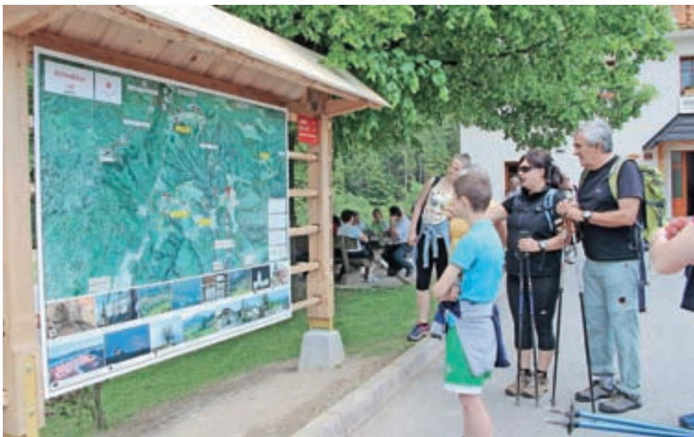
Informacijska panoramska tabla stoji tudi v Nemiljah pri gostilni Na Razpokah.