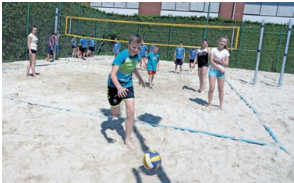
Učenci so se družili tudi ob igranju odbojke na mivki.