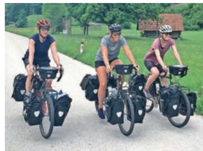
Športnice olimpijke so kolesarile tudi po Gorenjski.

Kotsopovedala dekleta, pot ni sama sebi namen, temveč s projektom skozi šport oza-veščajo in spodbujajo dekleta k razvijanju sposobnosti za vodstvene položaje, za kar tudi zbirajo sredstva v okviru fundacije Forward. Slovenija z Bledom in Bohinjem je bila predvsem izbor veslačice Emme Twigg, ki je leta 2011 na SP na Bledu osvojila bron, v Bohinju pa štiri leta opravljala priprave pred velikimi tekmovanji. Ravno zato je Veslaška zveza Slovenije pristopila k podpori projekta, katere nosilec je sicer Klub slovenskih olimpijcev Olimpijskega komiteja Slovenije. Častni pokrovitelj projekta je predsednik Mednarodnega olimpijskega komiteja Thomas Bach.