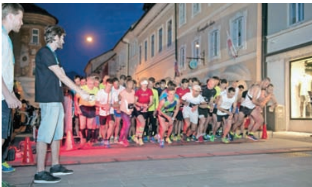
Teklo je skoraj sto sedemdeset tekačic in tekačev.

»Letos nisem najbolje pripravljen, saj imam še druge obveznosti, a sem rekel, da če gre tek že mimo bloka, v katerem živim, se ga moram udeležiti. Počasi se vračam in današnja zmaga mi kar nekaj pomeni. To je