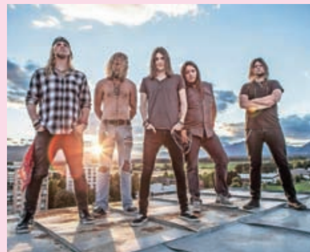
Glasbeno ogledalo družbi skozi hitre rokove ritme: Tomcat

Kranj – V petek, 25. maja, bo ob 20. uri v atriju Down Towna nastopila udarna hard rokova zasedba Tomcat. Lani so izdali odlični album Somethings Coming On Wrong, s katerega je tudi singel Carnium, za katero so posneli tudi videospot. Za popestritev rokovega večera bodo poskrbeli tudi Charlie Butter Fly s premiernim nastopom v gorenjski prestolnici.