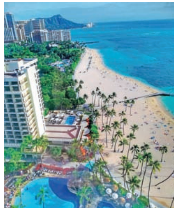
Slavna plaža Waikiki in v ozadju ugasli ognjenik Diamond Head

Še najmanj sem to zaznal na Oahuju, najbolj na Big Islandu. Tam so bili ljudje res prijazni. Če je nastal problem, so ga rešili v nekaj minutah. Na Mauiju sem ga tudi doživel: gospod, pri katerem sem najel avto, je imel rojstni dan ravno na dan mojega prevzema in mi je rezervacijo za