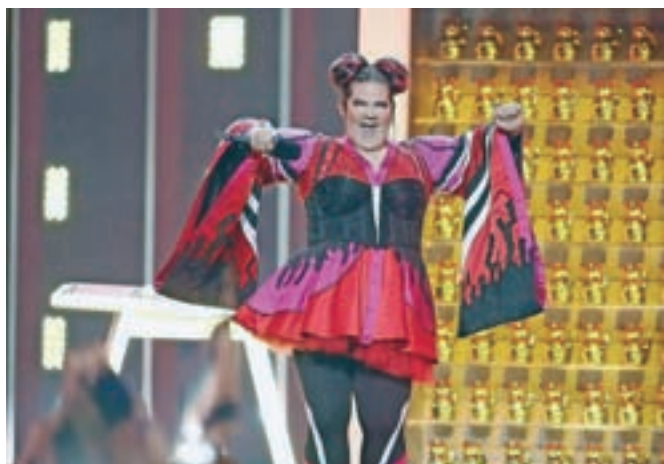
Zmagovalka 63. Pesmi Evrovizije je postala predstavnica Izraela, Netta.