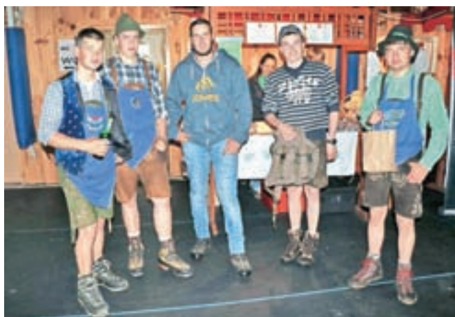
Družba mladih ljubiteljev narodno-zabavne glasbe iz avstrijske Štajerske