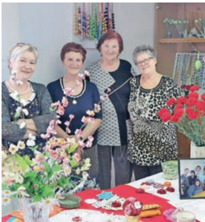
V prostorih Društva upokojencev Žabnica so članice skupine Zanka konec minulega tedna pripravile prvo razstavo ročnih del.

»V upravnem odboru našega društva sem dala pobudo, da bi imeli tudi skupino za ročna dela. Že od malega sem si namreč želela postaviti učiteljica ročnega dela, kar pa mi ni bilo dano. Vendar je ljubezen do tega ostala in v društvu smo začele najprej