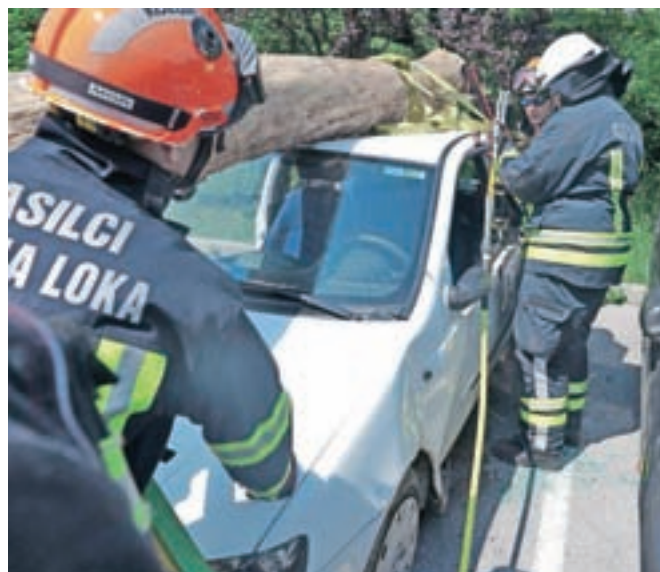
Reševanje ujetih iz avtomobila, na katerega je padlo težko drevo.

Inštruktorji iz Gasilske brigade Ljubljana in Gasilsko reševalne službe Kranj – nekateri od njih so tudi člani škofjeloških gasilskih društev – so na usposabljanju predstavili opremo in načine reševanja v šestih različnih situacijah. Gasilci so se tako usposabljali v preboju skozi betonsko ploščo, v reševanju osebe iz vozila, na katerega je padlo veliko breme (npr. drevo), v reševanju oseb iz jaška in z višine, v stabilizaciji objekta ob porušitvi in klasičnem reševanju za stutih izpod ruševin.