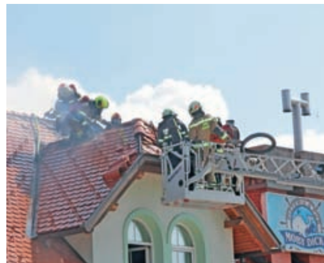
Radovljiški gasilci so si pri gašenju požara ostrešja picerije Moby Dick na Črnicu pomagali tudi z avtolestvijo, ki so jo pripeljali njihovi kolegi z Jesenic.

Gorenjski policisti so dva požara obravnavali tudi v nedeljo. Okoli poldneva je zagorela kuhinjska napa v stanovanju na Slovenskem Javorniku. Požar so poklicni gasilci z Jesenic in prostovoljni gasilci s Koroške Bele pogasili, odstranili pogoreli material, odklopili elektriko in prostor prezračili. Ob 13.15 pa je požar izbruhnil tudi v kleti stanovanjskega objekta na Bregu ob Kokri v občini Preddvor. Posredovali so kranjski poklicni gasilci in prostovoljni gasilci iz Preddvora, ki so požar pogasili, iznesli zgorle ostanke, objekt pregledali s termovizijsko kamero in ga prezračili, dvema osebama, ki sta se nadihali dima, pa so po navodilih reševalcev nujne medicinske pomoči nudili prvo pomoč s kisikom.