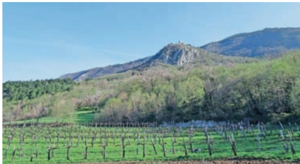
Vitovska cerkev Marijinega vnebovzjetja s taborskim obzidjem

Vrh ponudi čudovit razgled na bližnji Kucelj in malce oddaljeni Veliki Modrasovec,