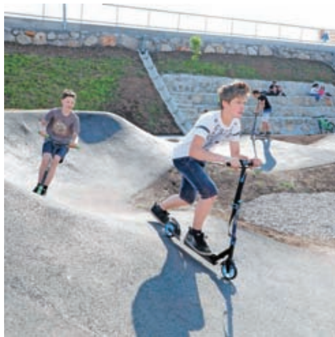
Prvi obiskovalci mladinskega športnega parka