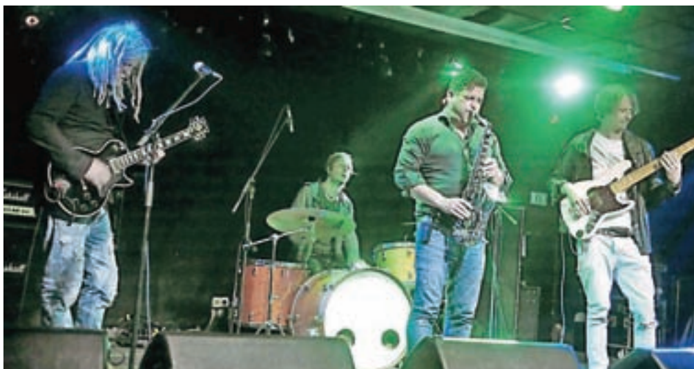
Full Moon Kolektiv, zasedba vrhunskih jazz funky soul glasbenikov, je naelektrila festivalsko občinstvo v Trainu.

V uvodu so tako temperaturo dvigovali trubači Čaga Boys, ki so publiko lepo ogreli za trapersko noč v Klubaru s člani Guapo ganga. V soboto je Klubar obiskal zimzelni Adi Smolar, medtem ko se je na Trainu odvijala t. i. Čorba glasbene inovativnosti z zasedbami Bowrain, Full