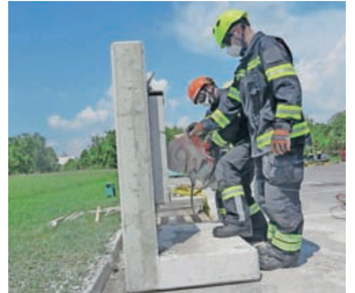
Pri reševanju iz porušenih objektov morajo gasilci pogosto prebiti tudi betonske stene ali plošče.