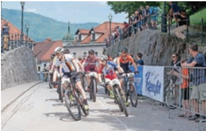
Start in cilj sta bila v središču Kamnika, večina proge pa je potekala po tehnično zahtevni trasi v okoliških gozdovih.

Vrhunec dvodnevnega tekmovanja je predstavljalo svetovno vojaško prvenstvo,