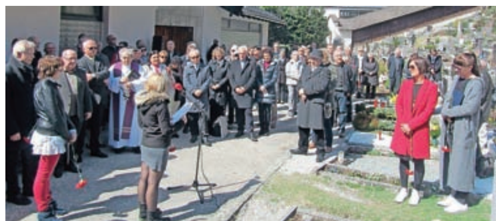
Spominska svečanost v čast žrtvam nacizma na pokopališču v Železni Kapli