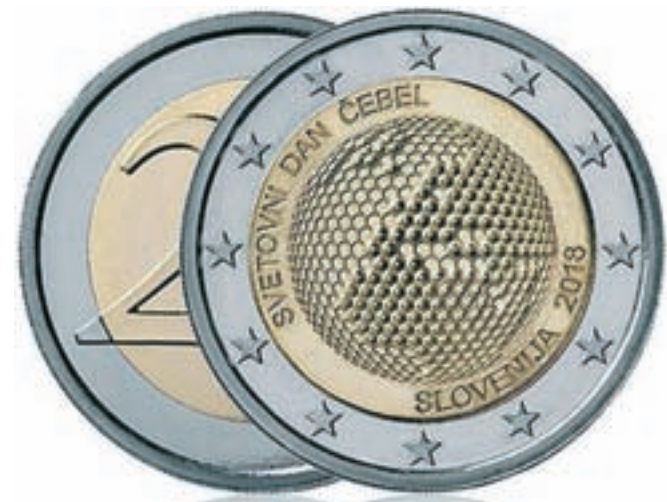
Motiv spominskega kovanca