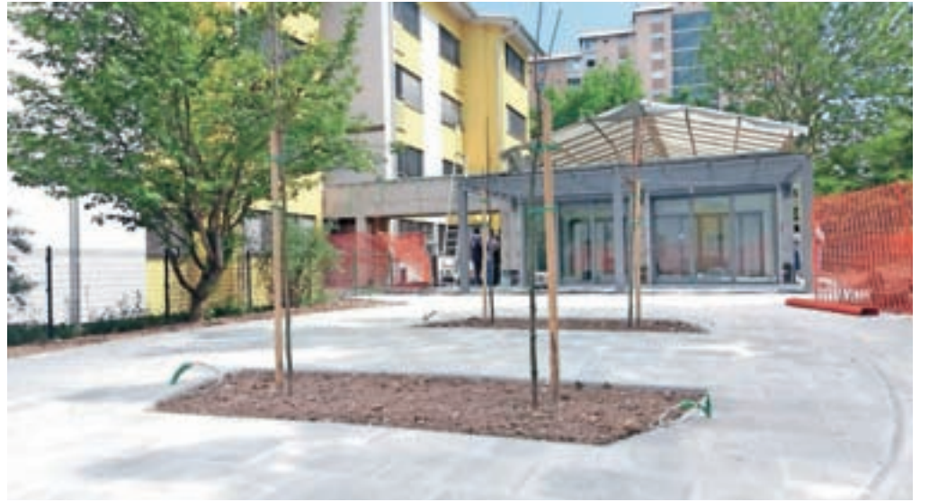
V Domu upokojencev Kranj naj bi gradnjo dveh zimskih vrtov in ureditev parkov zaključili do konca junija.

Kranj – Glede na število starejših od 65 let Dom upokojencev Kranj s kapaciteto 214 stanovalcev pokriva komaj 1,9 odstotka vseh potreb, kar ni niti polovica glede na usmeritve državnega Nacionalnega programa socialnega varstva do leta 2020 s ciljem zagotovitve mest za 4,8 odstotka starejših od 65 let. Zato bi bila izgradnja še enega doma več kot nujna. Dom upokojencev Kranj je edini dom starejših občanov v Mestni občini Kranj, v dom pa poleg občanov Kranja sprejemajo še občane Šenčurja, ker občina nima svojega doma. A dom je že zdavnaj premajhen za pokrivanje vse večjih potreb. Poleg institucionalnega varstva izvajajo še pomoč na domu, trenutno 208 uporabnikom v obeh občinah. A tudi to ne zadostuje za zadovoljitev potreb po pomoči starejšim. Najhujše stiske rešujejo z začasnimi namestitvami do treh mesecev – po tem je veliko povpraševanje, saj se na sedmih mestih vse leto zamenja od sto do 110 stanovalcev. Z začasno namestitvijo, ki traja lahko največ tri mesece, rešujejo najhujše stiske ob odpustih iz bolnic, pomagajo svojcem v času dopustov. Tudi po dnevnem varstvu, ki traja od ponedeljka do sobote od 6.30 do 17. ure, in kjer lahko sprejmejo dvajset uporabnikov hkrati, je povpraševanje vse večje, pravi direktorica Doma upokojencev Kranj mag. Zvonka Hočevnar.