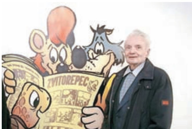
Z Zvitorepcem, Lakotnikom in s Trdonjo, glavnimi junaki stripov Mikija Mustra, ki je v ponedeljek umrl, so odraščale številne generacije.