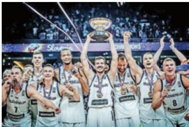
Slovenskim košarkarjem, ki so lani postali evropski prvaki, so po več kot pol leta vendarle izplačali denarne nagrade.