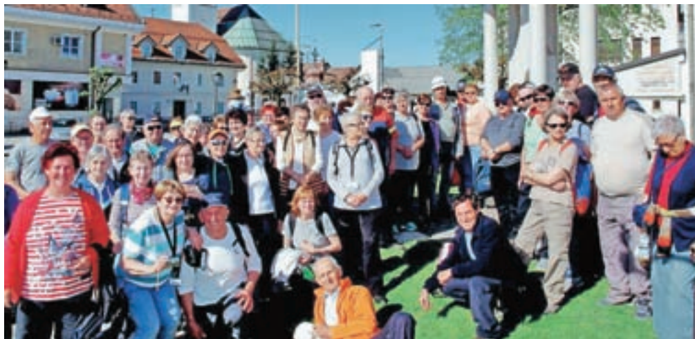
Skupinska slika pred spomenikom Mariji Tereziji v središču Šenčurja