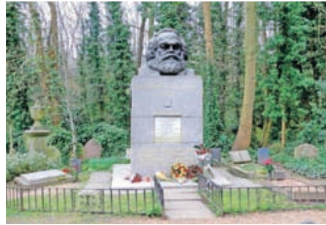
Nagrobni spomenik Karlu Marxu na pokopališču East Highgate Cemetery v Londonu

»Novinarka Daphne Caruana Galizia je preiskovala korupcijo znotraj vlade na Malti. Znajdemo se v položaju, ko novinarji opravljajo delo države, policije. To je zelo nevarno. Novinarji niso le priče sumljivim zgodbam, ampak te zgodbe razkrivajo, to pa ogroža vlado. Primer Daphne Caruana Galizia kaže, da novinarji pri svojem delu niso zaščiteni.« To je izjavila Jennifer Clement, predsednica Mednarodnega združenja Pen ob svetovnem dnevu svobode medijev (3. maj).