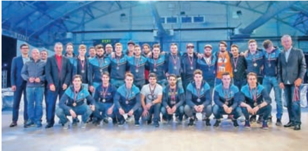
Članska ekipa hokejistov Triglava je na slavnostni akademiji prejela bronaste medalje za tretje mesto na letošnjem državnem prvenstvu.