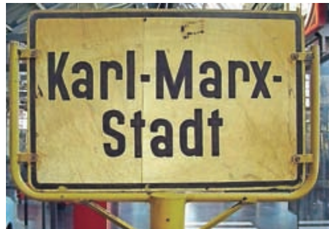
Mesto Chemnitz so v času Nemške demokratične republike (DDR) preimenovali v Karl-Marx-Stadt. Zdaj je spet Chemnitz, mestna tabla pa je v muzeju.