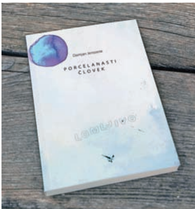
Knjiga Porcelanasti človek je bila izbrana za najboljšo samozaložniško knjigo v letu 2016.

Tudi zato, da bi družba bolj spoznala motnje avtističnega spektra, je nastala knjiga Porcelanasti človek. Izšla je leta 2016, ko je dobila tudi priznanje za najboljšo samozaložniško knjigo leta. Uvrščena je bila tudi na portal Dobra knjiga. Avtor je imel nekaj predstavitev, nazadnje nedavno ob svetovnem dnevu zavedanja o avtizmu v Občinski knjižnici Jesenice. Želi si, da bi roman dobil tudi prevod v katerega do svetovnih jezikov. Predvsem pa si želi, da bi se – tudi s pomočjo knjig, kakršna je njegova – avtistično prenehala obnašati celotna družba. Ali kot je zapisal: »Kaj pa, če je avtizem vendarle nalezljiv? Kaj pa če res obstaja družbeni avtizem? Ali avtizem kar tako, in general? Ali pa je to stanje duha, ki je vendarle specifično za to majhnost?«