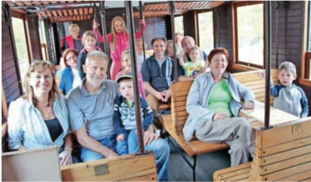
Prvo srečanje je bilo v torek na temo Cesarjeva nova oblačila.