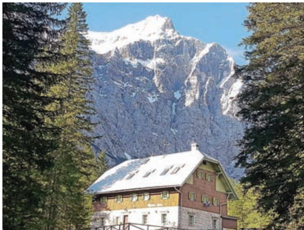
Aljažev dom v Vratih je izjemno priljubljena izletniška točka in izhodišče za obisk okoliških gora.

»Ceste ne bomo zapirali, ampak bomo obiskovalce usmerili na parkirišča v Mojstrani in okolici ter jih nato z javnim prevozom odpeljali do izhodiščnih točk za obisk Vrat. V ta namen bo v Mojstrani dodatno urejenih okoli 250 začasnih parkirnih