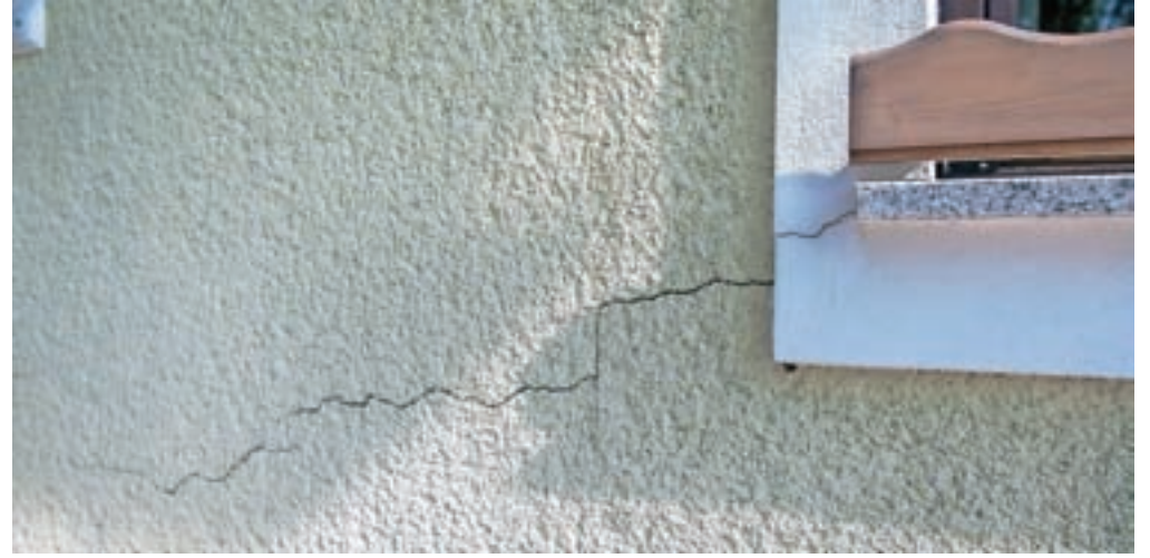
Na hišah je vse več razpok.

»Že več let smo na objektih in škarpah opazili razpoke, najhujše pa so nastale lani po 27. aprilu, ko je bilo zelo veliko dežja. Takrat se je pobočje zelo premaknilo,« je razložil domačin Stane Jelenc. Nato pokaže kriva garažna vrata, ki se sploh niso več dala odpreti, zato so jih morali žagati. Pa razpoke na hiši, gospodarskem posloplju in škarpah.