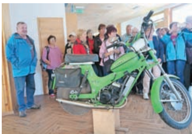
Motor, s katerim žagajo drva, je prava atrakcija; zaslovel je s filmom, ki si ga je ogledalo že več kot 20 milijonov ljudi.