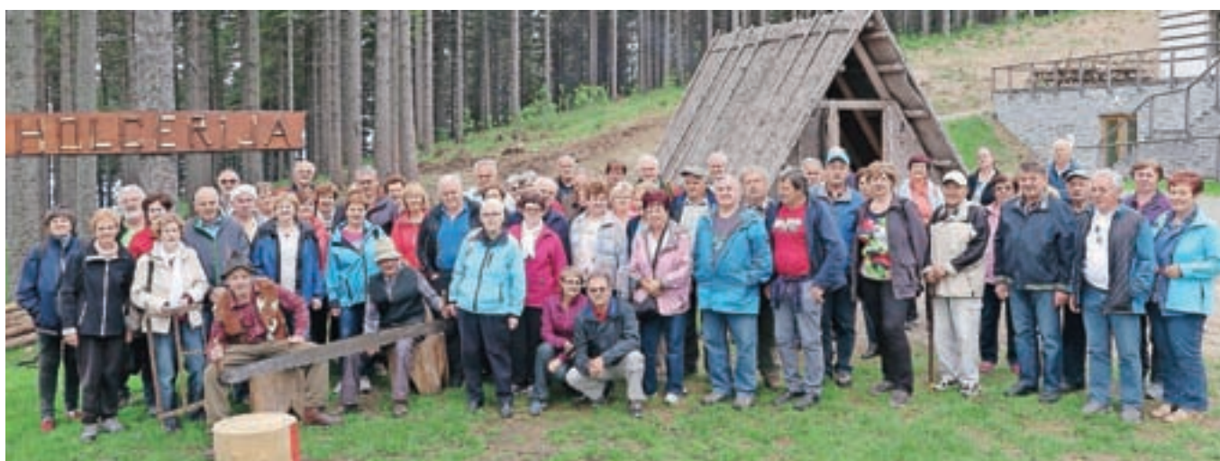
Naši gostje med »holcerijo« na Kopah