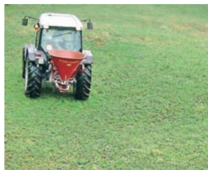
Država zaradi zaščite naravnega okolja in zdravja ljudi zmanjšuje uporabo fitofarmaceutskih sredstev.

Vlada je že pred več kot petimi leti sprejela nacionalni akcijski program za doseganje trajnostne rabe FFS za obdobje do leta 2022, s katerim se je zavzela za zmanjšanje porabe FFS in tveganj, ki jih FFS predstavljajo za zdravje ljudi in živali. Vlada ocenjuje, da je v zadnjih desetletjih prišlo v kmetijski