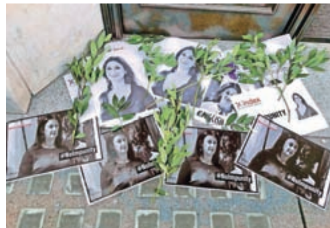
Malteška novinarka Daphne Caruana Galizia je svoj novinarski pogum plačala z življenjem.