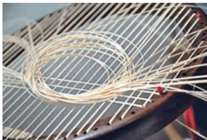
Sedežna mreža v začetni fazi izdelave ...