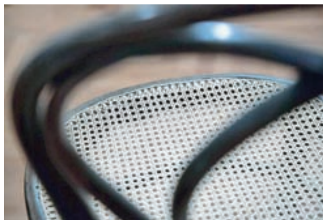
... in končano ročno pleteno sedalo.