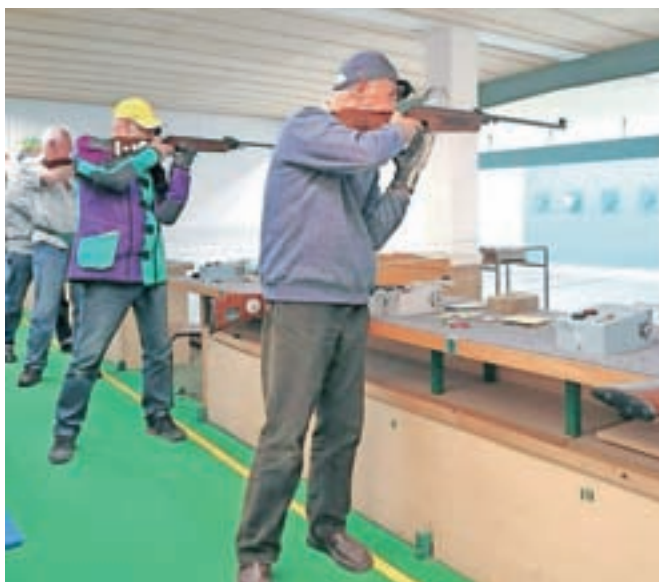
V moški konkurenci je na strelišču v nekdanji škofjeloški vojašnici tekmovalo 34 strelcev.