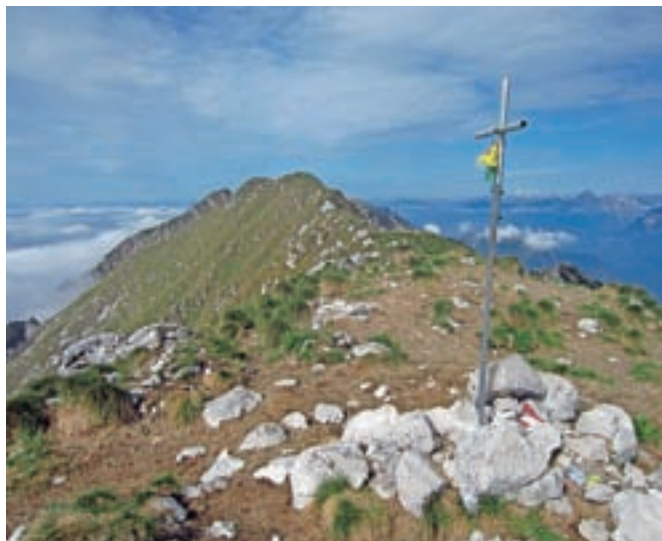
Vrh Zajavorja se nadaljuje v greben Muscev. / Foto: Jelena Justin

teče po njegovi desni, nekaj časa pa po levi strani. Ko dosežemo gozd, je najbolje, da se držimo rdeče-rumenih črt, ki označujejo katastrsko mejo. Dosegli bomo planino Nizki vrh. Na planini se obrnemo levo in smo na makadamski cesti, po kateri se v eni uri vrnemo nazaj