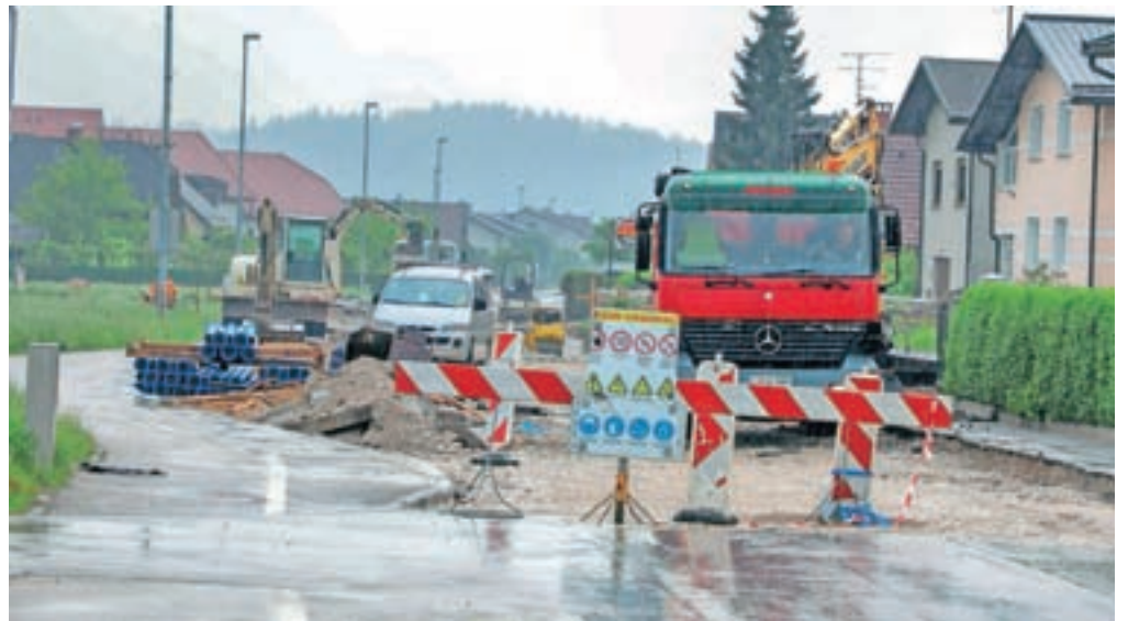
V teku je tretja faza prenove Bukovčeve ceste na Viru, zaradi česar bo zapora veljala do 17. julija.

Do sredine julija med 7. in 17. uro bo polovična in občasna popolna zapora prometa vzpostavljena tudi na Bukovčevi ulici na Viru, kjer občina izvaja zadnjo od treh predvidenih faz popolne rekonstrukcije, in sicer na 520-metrskem odseku od Parmove ulice do križišča s papirnico Količevo. V času izvajanja del je omogočen dostop stanovalcem do njihovih domov in dostop v primeru intervencije, za drug promet pa je urejen obvoz. »Glavni namen rekonstrukcije je umiritev