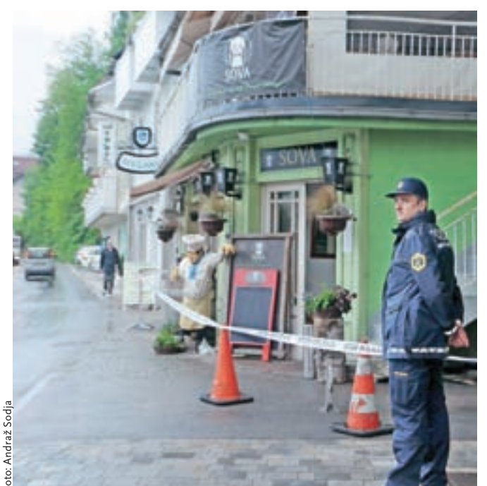
Policisti so ob ogledu kraja požara ugotovili, da je najprej zagorela ena od naprav v kuhinji restavracije Sova, ogenj pa se je po prezračevalnem sistemu razširil na streho.

Po informacijah policistov je zagorela kuhinjska naprava, ogenj pa se je po prezračevalnem sistemu razširil na del ostrežja. »V požaru nihče ni bil poškodovan, ogenj pa je v manjši meri poškodoval samo ta objekt. Promet na kraju dogodka je bil zaradi intervencije dlje časa oviran,« je še dodal Bojan Kos s Policijske uprave Kranj. Kmalu po začetku intervencije so policisti promet preusmerili preko zahodne ceste okoli Blejskega jezera, kjer je zaradi avtobusov in tovornih vozil kmalu prišlo do zastojev na ožjih odsekih, nastale pa so tudi dolge kolone, tako v smeri Bohinja kot tudi skozi središče Bleda.