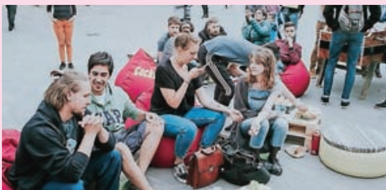
Teden mladih bo ponudil tudi prostor za sproščen oddih in družabne igre, Hengalnico na Slovenskem trgu.

Sklepni koncert festivala bo potekal 24. junija na Škofjeloškem gradu z legendarno zasedbo Laibach, ki je v loški regiji že navdušila.