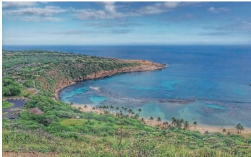
Zaliv in plaža Hanuma, kjer so posneli film Modri Havaji z Elvisom Presleyjem v glavni vlogi.