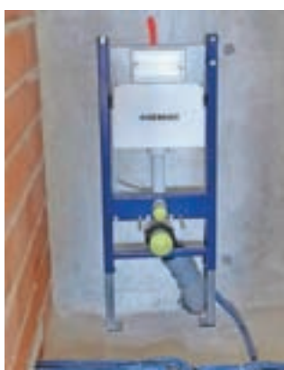
Tatovi so gasilec odnesli že montirane podometne kotličke.

Moste – Člani Prostovoljnega gasilskega društva Moste, osrednje gasilske enote v občini Komenda, že od lanskega septembra gradijo nov dom, ki jih bo predvidoma stal okoli 650 tisoč evrov. O poteku gradnje svoje člane in druge krajanje redno obveščajo na svoji spletni strani, z zadnjo, včerajšnjo objavo pa so žal sporočili slabo novico: »Danes zjutraj smo bili ob pregledu objekta šokirani nad prizorom, ki nas je po vikendu pričakal. Za zdaj neznan storilec so odnesli že nameščene podometne kotličke Geberit Duo-Fix. Odtujenih je bilo 10 kosov kotličkov. Od tega 8 kotličkov višine 112 centimetrov, dva pa z nižano višino 92 centimetrov. Pri kraji je bilo narejeno tudi veliko škode na strojnih inštalacijah.«