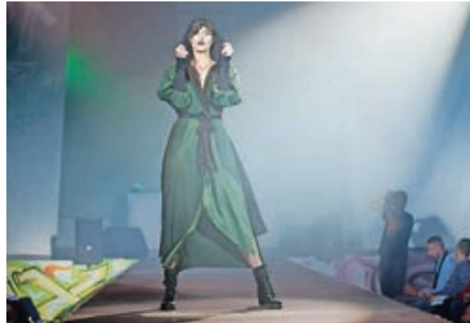
Oblučila iz Leine kolekcije so malo bolj glamurozna, a kljub temu uporabna ob različnih priložnostih.