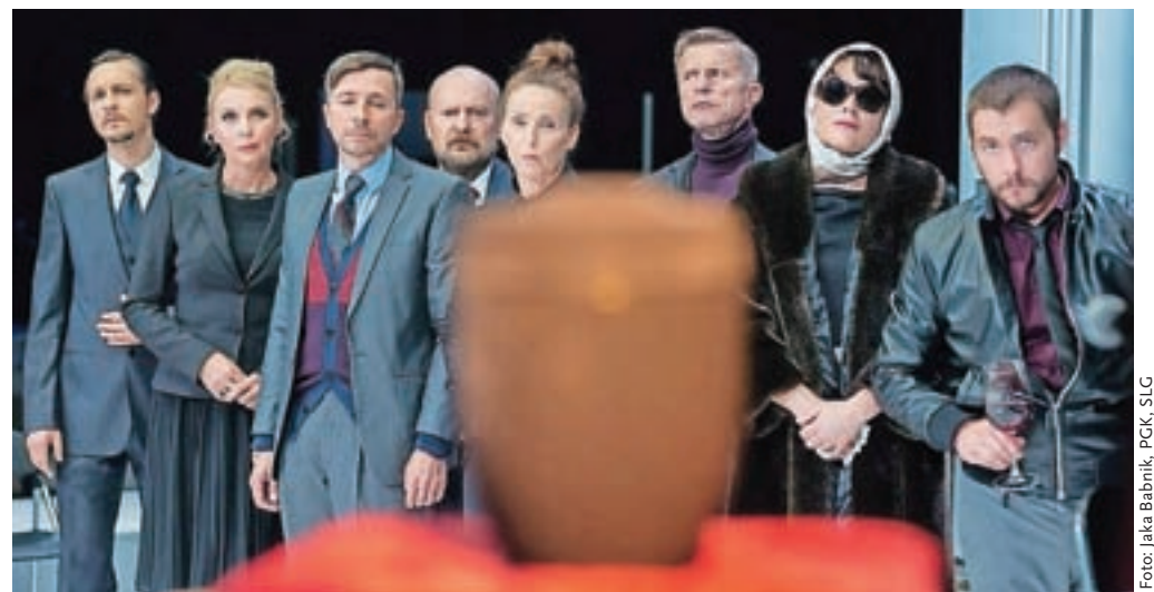
Komedija Žalujoča družina je pogosto uprizarjana predstava Prešernovega gledališča.