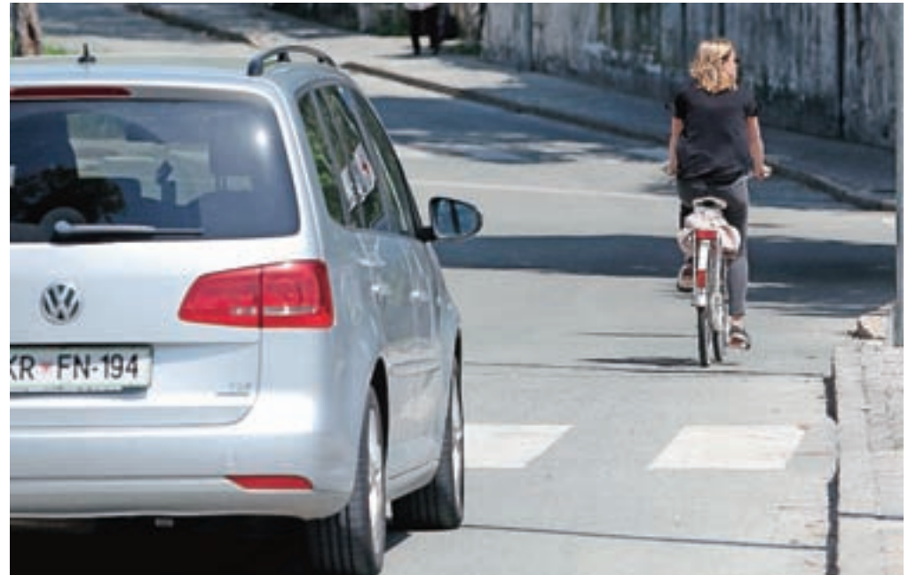
Kolesarji so bili letos zelo pogosto žrtve voznikov, ki so jim na cesti odvzeli prednost, ogroženi pa so bili tudi zaradi neustrezne hitrosti, strani in smeri vožnje ter nevarnega prehitavanja voznikov motornih vozil (slika je simbolična).

Policisti ugotavljajo, da so kolesarji približno polovico teh nesreč povzročili sami, preostale pa drugi udeleženci v prometu. Kolesarji so bili letos zelo pogosto žrtve voznikov, ki so jim na cesti odvzeli prednost, ogroženi pa so bili tudi zaradi neustrezne hitrosti, strani in smeri vožnje ter nevarnega prehitavanja voznikov motornih vozil. Na Srednji Beli se je tako sredi aprila ponesrečila kolesarka, ki je padla med izogibanjem nasproti vozečemu osebnemu avtomobilu, v Žireh je pred kratkim neznan voznik med prehitavanjem po krmilu oplazil kolesarko, v Begunjah pa je voznik med spremembo smeri vožnje zapeljal pred kolesarico in povzročil nesrečo.