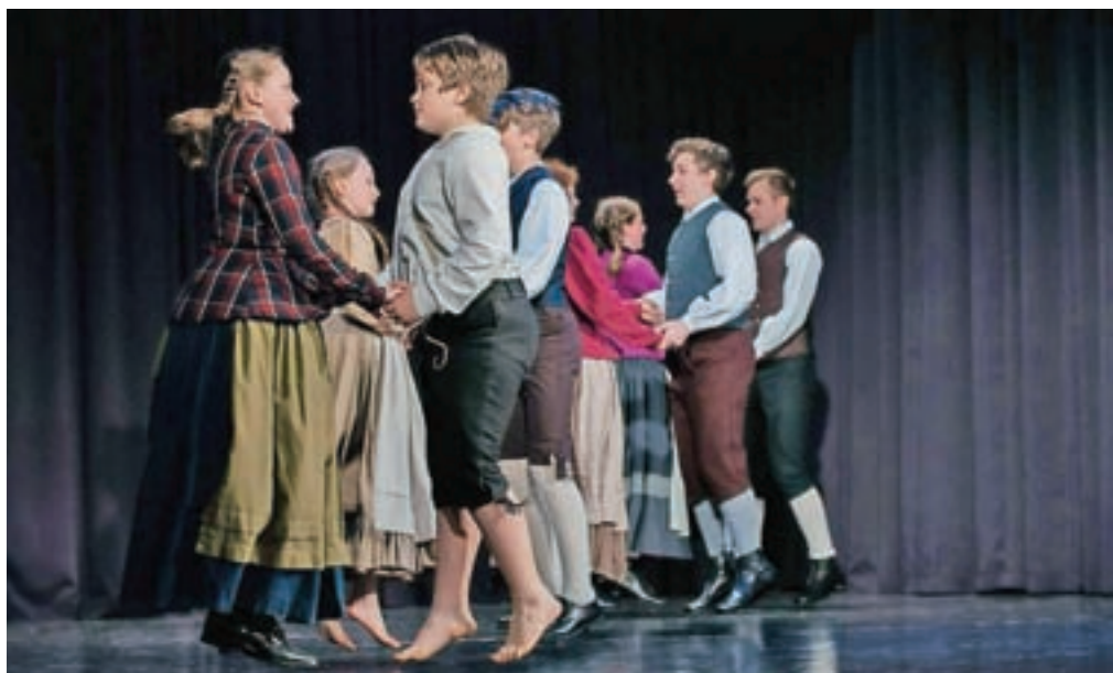
Takole usklajena je bila OFS Breznica.