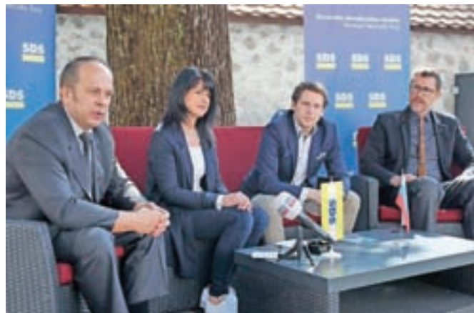
Kandidati SDS, ki v prvi volilni enoti zastopajo južni del Gorenjske

Po besedah Branka Grimsa se je za kandidaturo odločil, ker verjame, da