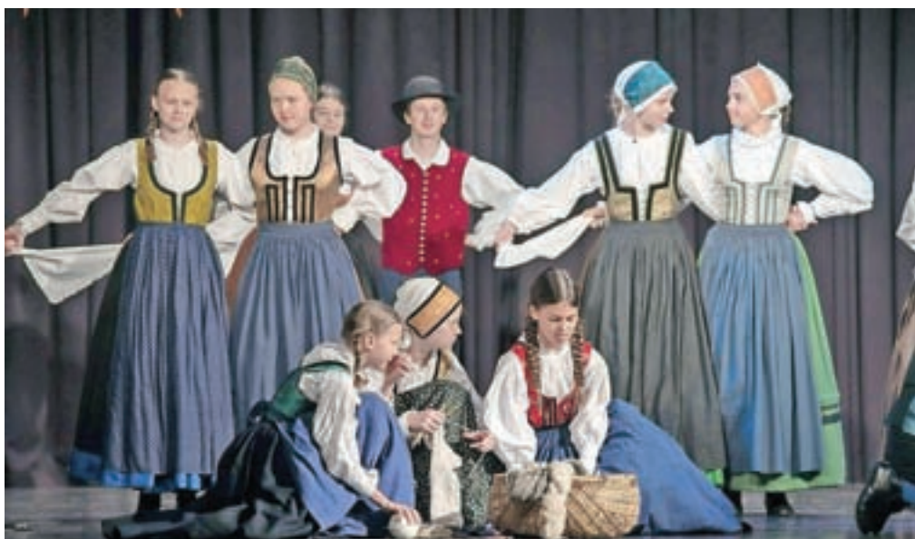
Starejša OFS Karavanke se je z odrsko postavitevijo Štumf s ta uscane gase vrnila v čas trziškega nogavičarstva.