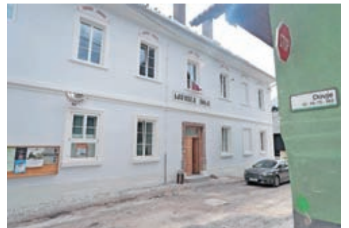
Občina je v nekdanji šoli na Dovjem uredila tri stanovanja.

Občina Kranjska Gora v teh dneh na Dovjem zaključuje obnovo stavbe stare šole, v kateri so uredili tri neprofitna stanovanja.