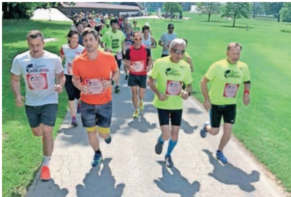
V Sloveniji so organizirano tekli na treh lokacijah. Največ tekačev je bilo na Brdu pri Kranju.

Prek aplikacije Wings for Life World Run se je bilo mogoče kjerkoli pridružiti globalnemu gibanju, med tekom pa je udeležence zasledovalo virtualno vozilo. Organizirano je bilo v Sloveniji z aplikacijo mogoče teči na treh lokacijah, tudi na Brdu pri Kranju. Prav