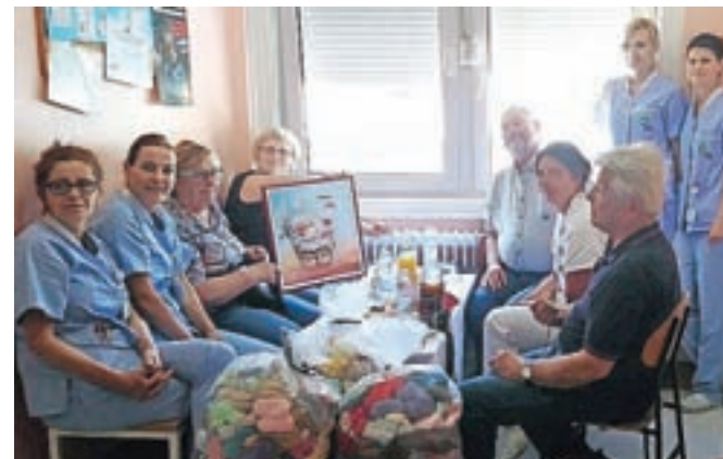
Babice z dežele so prinesle copatke za novorojenčke.