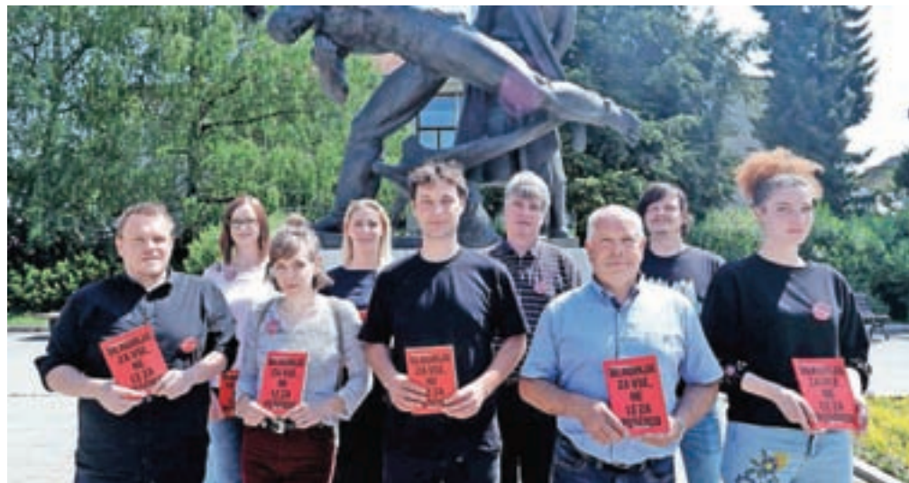
Kandidati Levica v prvi volilni enoti