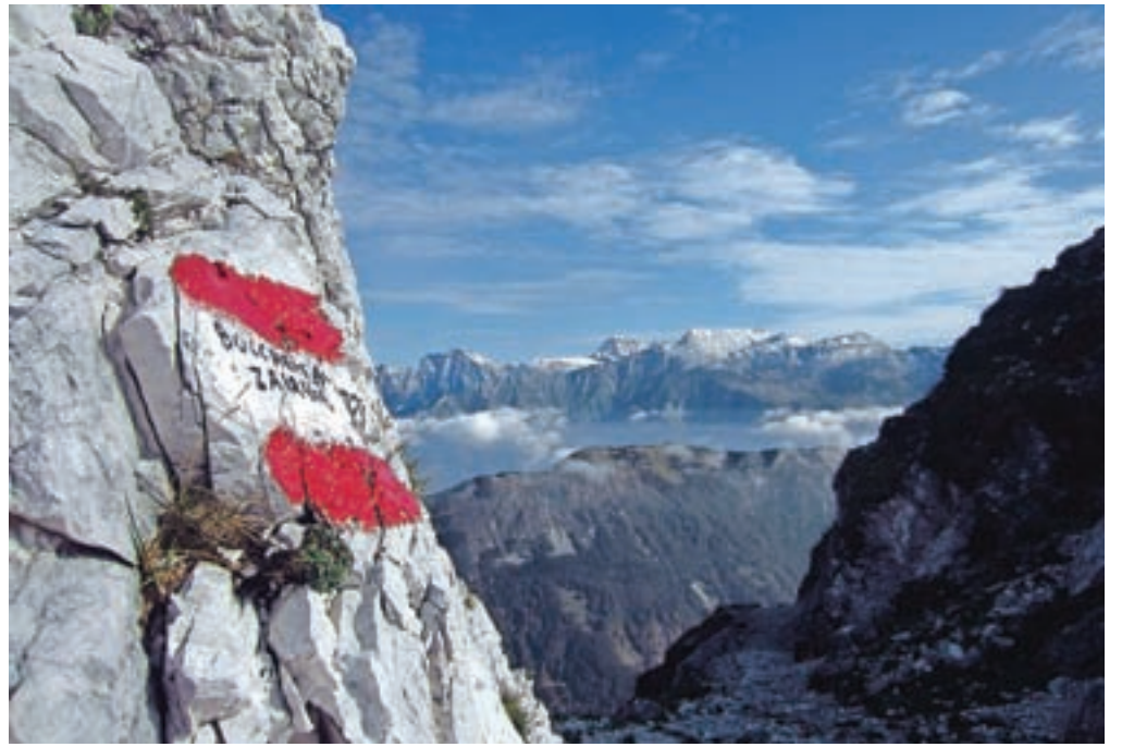
Na sedlu Bocchetta Zaiavor, zadaj greben Žrd, Montaž in Strma peč

Z vrha se lahko po poti vzpona spustimo nazaj do avta, ampak jaz predlagam, da si pot malce podaljšamo in zašpilimo klobaso. Sestopimo nazaj na sedlo in s sedla nadaljujemo po desnem grebenu, ki pa ni markiran, zato potrebujemo nekaj občutka za orientacijo. Vzpon na prvi vrh je strm, trave so neprijetne in nevarne za zdrs. Na prvem vrhu se držimo levega grebena, strmo sestopimo v rahlo neprijetno grapo in nadaljujemo. Pot, ponekod težje vidna, se drži grebena. Najtežje mesto je treba skoraj preplezati in se potem na drugi strani z nekaj plezalnimi vložki vrniti nazaj na greben. Greben je zahteven in terja izkušenega gornika s smislom za orientacijo, trdnim korakom in brez strahu pred izpostavljenostjo. Nekaj časa