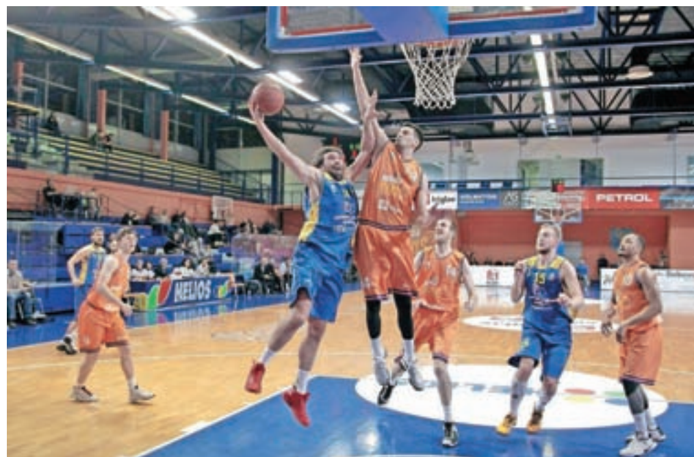
Košarkarji Helios Suns in Šenčurja Gorenjske gradbene družbe so v letošnjem državnem prvenstvu osvojili peto oziroma šesto mesto. Na fotografiji so na eni izmed medsebojnih tekem.