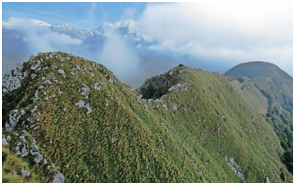
Grebena vzhodno od Zajavorja, ki ga na opisani turi prehodimo