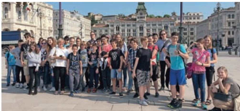
Nadarjeni učenci OŠ Simona Jenka Kranj so si ogledali tudi Trst z okolico.