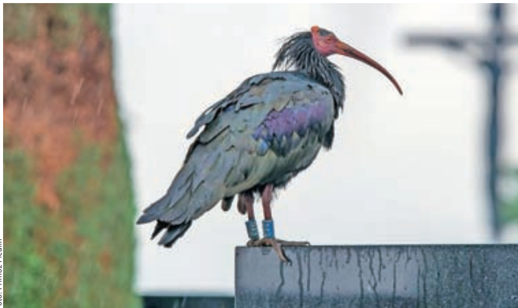
Klavžarji, vzrejeni v sklopu evropskega projekta, so označeni z obročki na nogah, na hrbtu pa imajo GPS-oddajnik, s katerim lahko zelo natančno sledijo njihovim premikom.

Svetovna zveza za varstvo narave je to ptičjo vrsto leta 1994 razglasila za kritično ogroženo. »Danes v Evropi lahko naštejemo nekaj populacij na območju Turčije, Španije in Avstrije, ki pa so vse odvisne od pomoči človeka, saj gre za populacije, vzrejene v vzrejnih centrih ob pomoči živalskih vrtov. Te populacije danes štejejo približno dva tisoč osebkov,« je pojasnila Zagorškova. V naravi popolnoma brez pomoči človeka gnezdi le še na atlantski obali Maroka. »Populacija šteje okoli 150 ptic, v Siriji pa so se obdržali še poslednji ostanke, od tri do pet parov vzhodne populacije, ki je nekoč bivala tudi pri nas,« je še povedala.