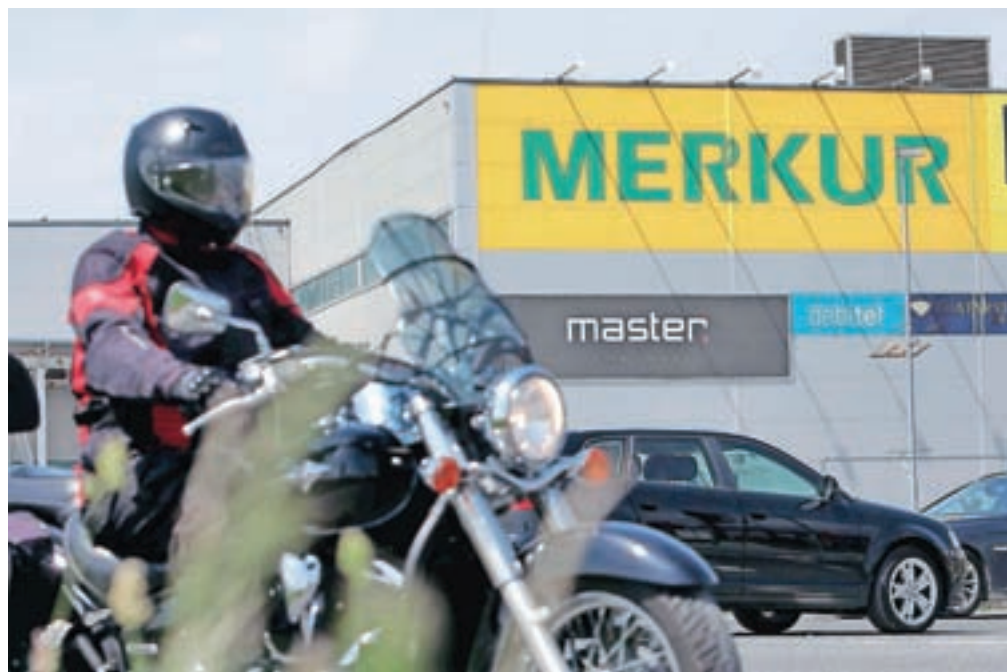
Navadni upniki, ki so v stečaju Merkurja prijavili slabih 355 milijonov terjatev, bodo s prvo splošno razdelitvijo stečajne mase poplačani 6,5-odstotno.

V še neunovčeno stečajno maso sodi stoo odstotni delež Big Banga, ki so ga sicer prejšnji mesec prodali za 18,6 milijona evrov, a se prodajni postopek še ni končal. Prav tako je že prodano zemljišče v Kopru, vendar je bila naknadno vložena pritožba, 11,7 milijona evrov od prodaje delnic Perutnine Ptuj pa je do odločitve v pravnem sporu deponiranih pri notarju. V stečajni masi so še zemljišče v Lescah, stanovanja v Kranju ter apartmaji v Bovcu in Ankaranu.