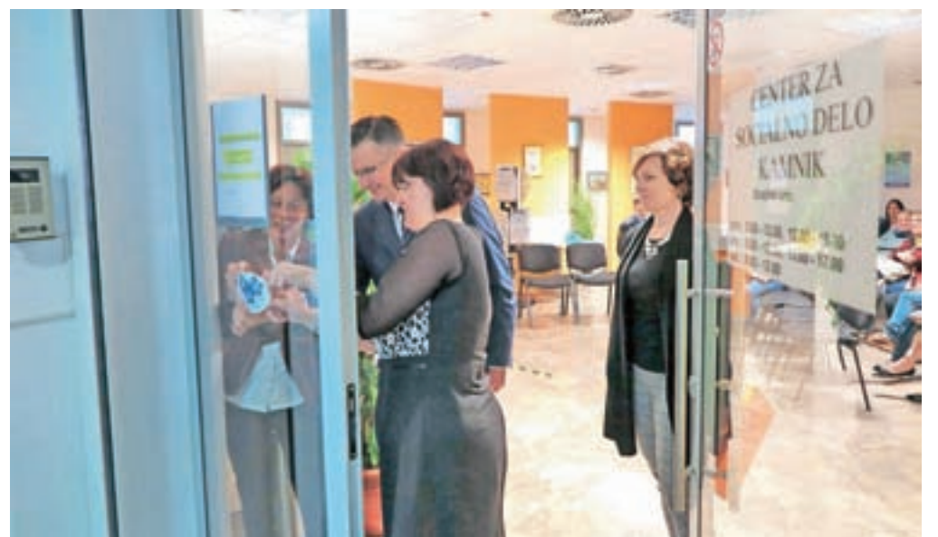
Demenci prijazno točko na vratih Centra za socialno delo Kamnik označujejo tri spominčice.