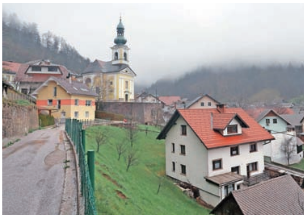
Koroški Beli grozi več kot dvajset plazov in podorov.