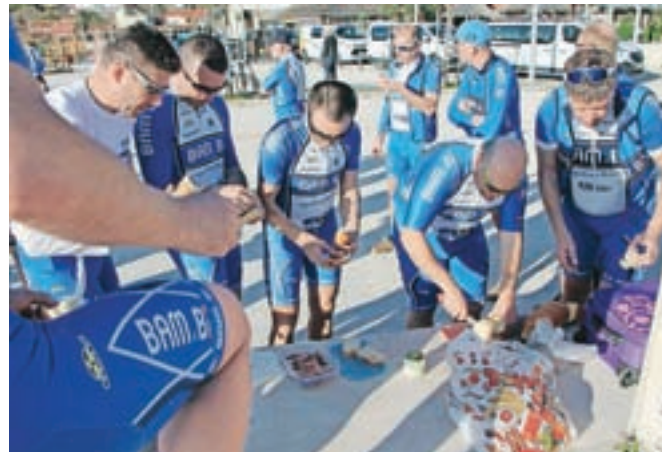
Ob zaključku dnevnih etap se je vedno prilegel kos kruha z domačo zaseko in salamo.