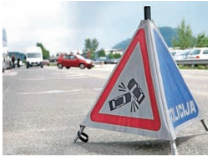
V prometnih nesrečah se huje poškoduje vsak tretji udeležen motorist, je pokazala zadnja anketa med motoristi.

Iz odgovorov motoristov, ki so odgovarjali na anketo, je tudi razvidno, da še vedno tretjina motoristov servisira motorno kolo izven registriranih servisnih delavnic. Več kot polovica motoristov