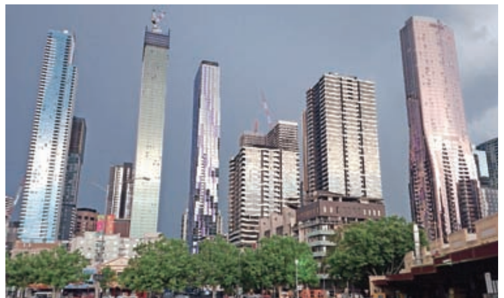
Melbourne se zelo hitro razvija. Nebotičniki na sliki so zrasli v zadnjih treh letih.