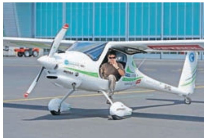
Matevž Lenarčič bo na štiridesetdnevni okoljski misiji zbiral podatke o onesnaženosti zraka v Aziji.