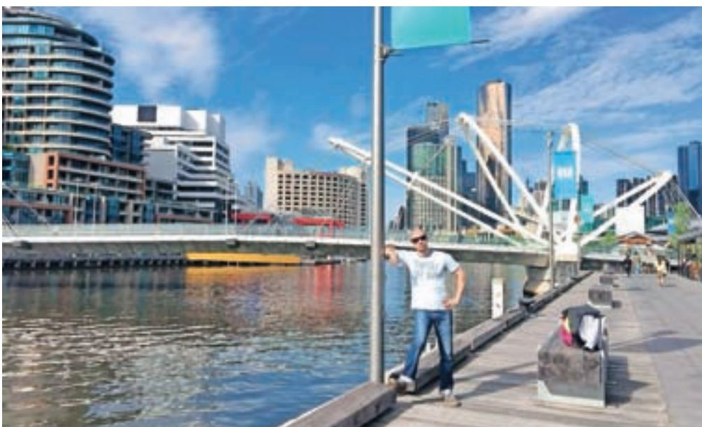
Pristanišče v Melbourneju

»Vsekakor ne! Avstralija ni država, kjer bi si ustvaril družino in se ustalil. Po šestih letih se je še vedno nisem navadil. Za zdaj nameravam še malo potovati, to poletje načrtujem odhod v Kanado. V Slovenijo se bom zagotovo še vrnil, tam se počutim doma. Težko pa rečem, kje se bom ustalil.«