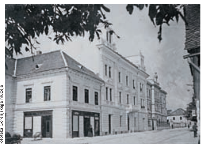
Današnja Koroška cesta v Kranju na začetku 20. stoletja

Fototeka je v osnovi namenjena interni uporabi naših strokovnih delavcev za raziskovalno, razstavno, pedagoško in publicistično dejavnost, na voljo pa je tudi zunanjim uporabnikom. Ti se za ogled dragocenega fotografskega gradiva najavijo vnaprej, v primeru izposoje gradiva pa z uporabnikom sklenemo