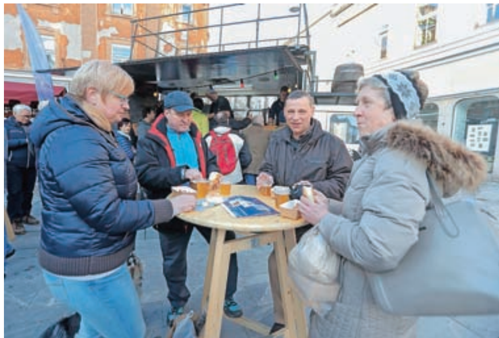
Ob lepem vremenu je ob torkih, sredah in četrčkih staro mestno jedro Kranja že oživelo, s Srečnimi petki pa naj bi več obiskovalcev privabili v mesto tudi po nakupih.

Obema dobro sprejetima projektoma so se pred kratkim odločili dodati tako imenovane Srede brez evra, ko ponujajo brezplačni napitek za obiskovalce v mestnih kavnarnah, lokalih, barih in gostilnah. Brezplačni vrednostni kupon si namreč obiskovalci mestnega jedra lahko zagotovijo ob torkih in četrčkih na stojnicah mestne uprave. V akcijo se je takoj vključilo šest lokalov, ki ponujajo skupaj več kot dvajset različnih izdelkov.