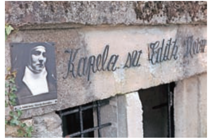
Na robu starega mestnega jedra Radovljice so stari bunker iz druge svetovne vojne preuredili v kapelo, posvečeno filozofinji in svetnici Edith Stein.