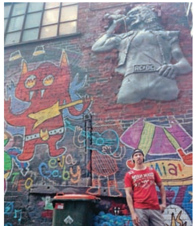
Veliko ozkih ulic po Melbourneju je porisanih.

Jaz osebno jem vsaj dvakrat na teden v japonski restavraciji, občasno grem v turško restavracijo.«