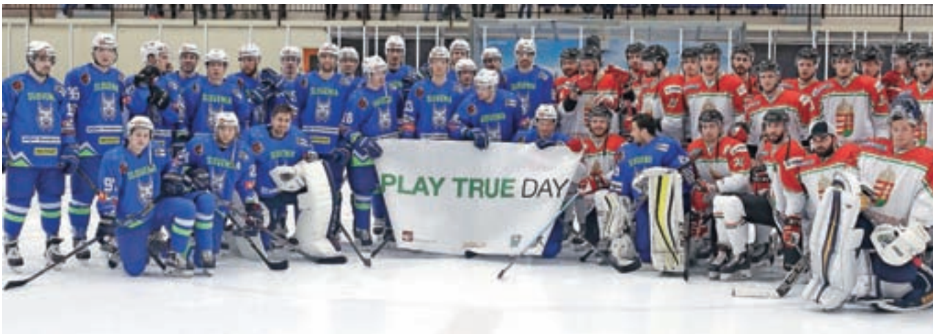
Hokejska zveza Slovenije in Slovenska antidoping organizacija sta ob podpori Madžarske antidoping organizacije in Mednarodne hokejske zveze pripravili preventivni program ob tako imenovanem Dnevu čistega športa, ki je spremljal sredino prijateljsko tekmo naše članske hokejske reprezentance proti izbrani vrsti Madžarske.

Sicer pa zadnji test našo reprezentanco pred svetovnim prvenstvom čaka 19. aprila, ko se bo na Dunaju na prijateljski tekmi pomerila z ekipo Avstrije.