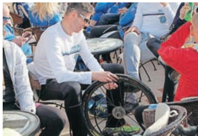
Tudi to je del BAM.Bi-jevega Dalmacija toura. Včasih je počenih zračnic manj, včasih več ...