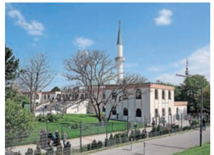
Mošeja in islamski center na Dunaju