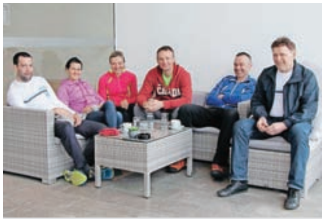
Dnevi so se začeli z jutranjo kavico, nasmehom in razpravo, kam bo vodila tokratna etapa.

Zadnji dan Toura se je zaključil v osrčju Like po skupno več kot šeststo prevoženih kilometrih. Dogaňanje so letos nadgradili še z dvema dalmatinskima »feštama«, klapskim večerom, za zadnje plesne korake pa je poskrbel trio v kraju Perušić na turizmu Albatros, kjer smo se od letošnje kolesarske Dalmacije tudi poslovili.