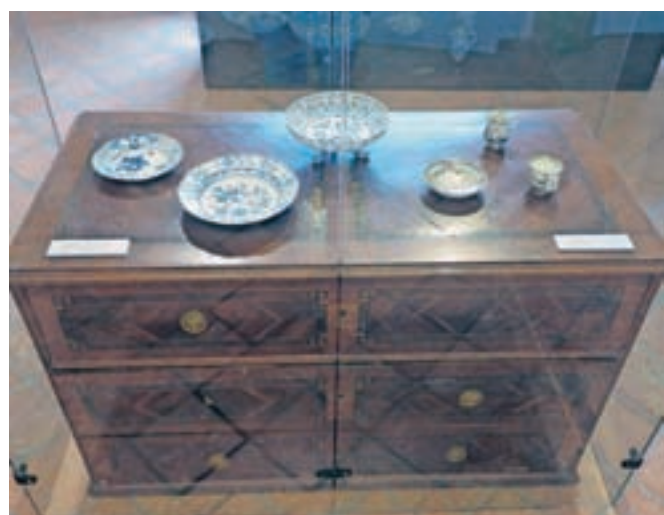
Predalnik z gradu Turn, ki ga hranijo v Gorenjskem muzeju