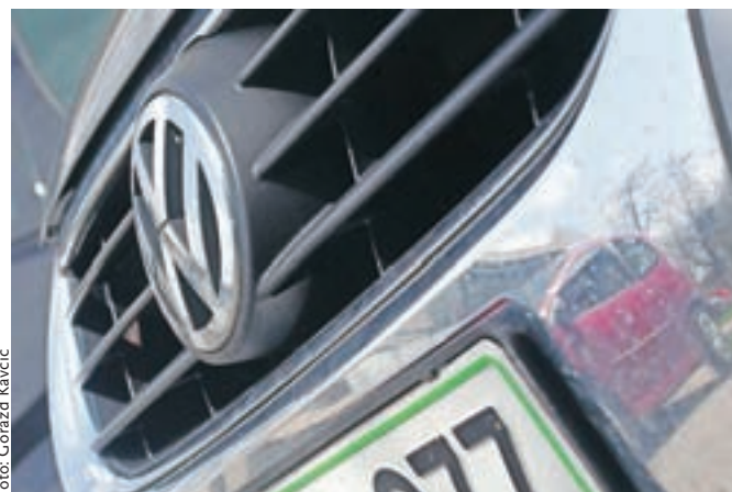
K skupinski tožbi proti Volkswagnu zaradi prirejanja podatkov o izpuhjih je pristopilo 6024 Slovencev.