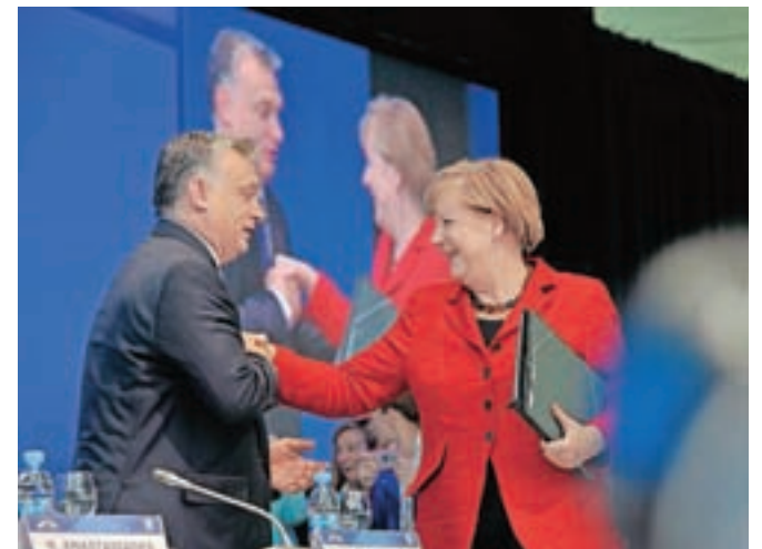
Viktor Orban in Angela Merkel na kongresu Evropske ljudske stranke (EPP) v Madridu, 21. 10. 2015