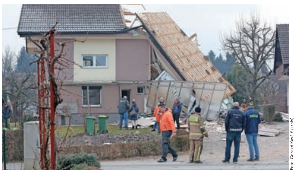
V januarski eksploziji se je zrušila polovica stanovanjske hiše Ivane in Suzane Šenk.

Silovita eksplozija je v hiši na Dolenčevi poti na Mlaki pri Kranju odjeknila 30. januarja nekaj pred 8. uro zjutraj. Eksplozijo je bilo slišati nekaj kilometrov daleč, zaradi nje se je zrušila polovica