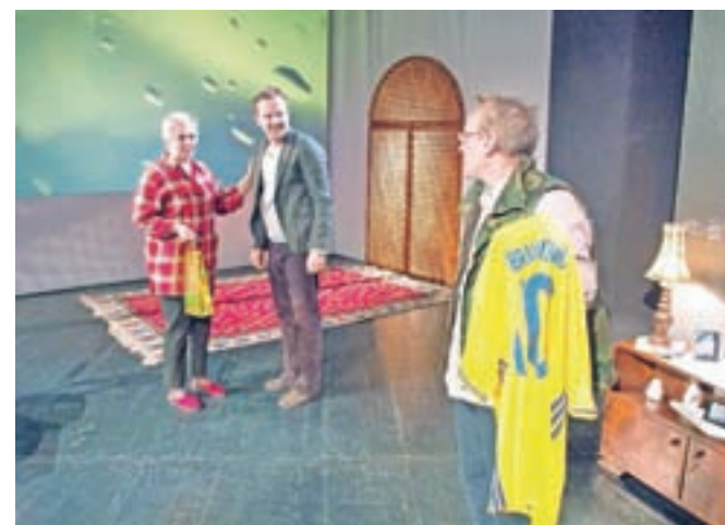
Zrno soli je zgodba o ljudeh iz dveh med seboj tesno povezanih držav – Slovenije ter Bosne in Hercegovine.

Dogodki polpretekle zgodovine so se pomenljivo