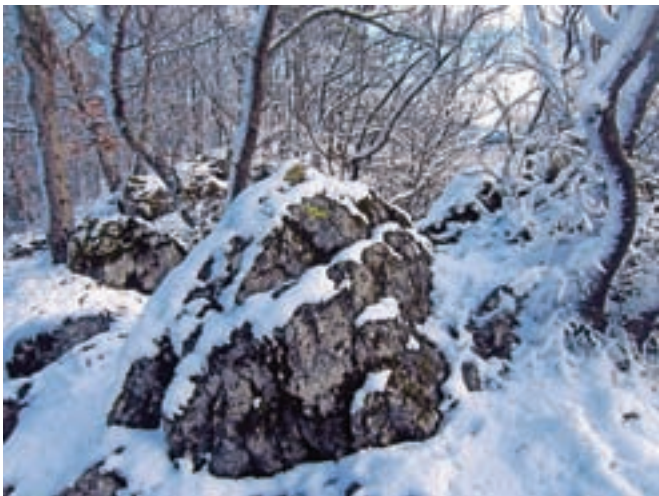
Vrh Tabora je skrit v gozdu.

nas ob kapelici čaka jekleni konjiček. Ampak to nam bo vzelo vsega skupaj približno 10 minut.