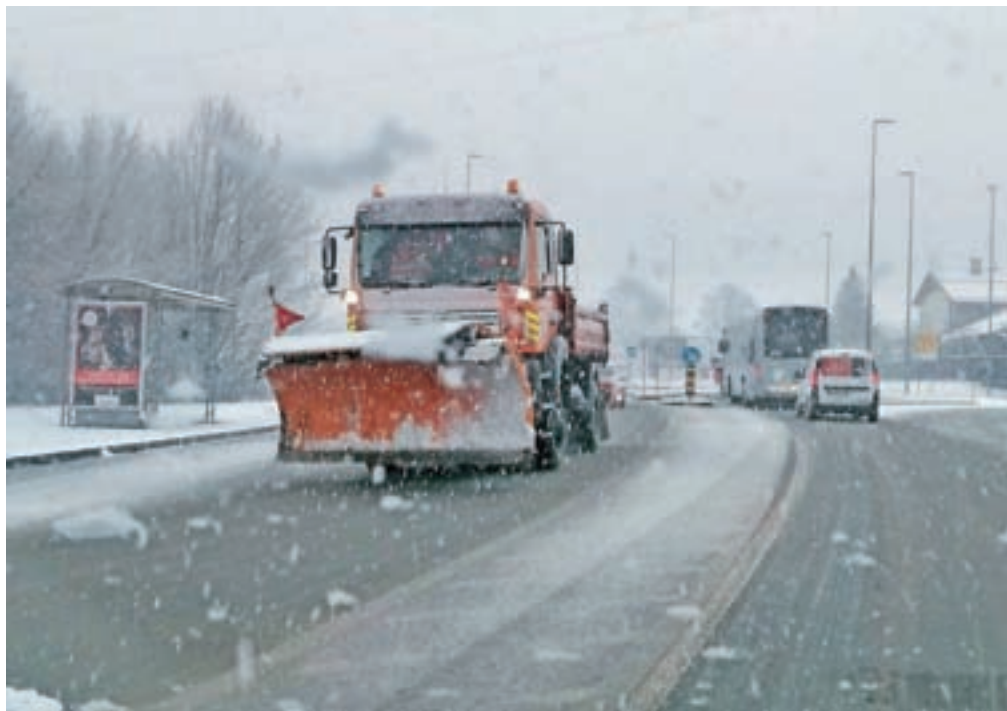
Stroški zimske službe so v zadnji zimi narasli, zato bodo občine morale zagotoviti dodatna proračunska sredstva.