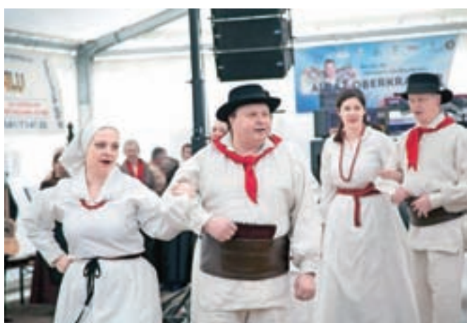
Člani Folklorne skupine Sava Kranj