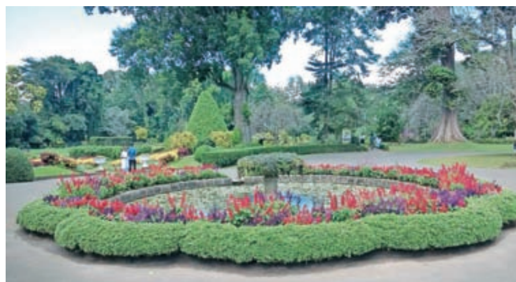
Botanični vrt v Kandiju

Tik preden smo se za nekaj dni odpravili še na Maldive, smo si ogledali želvjo farmo, kjer domačini skrbno bdijo