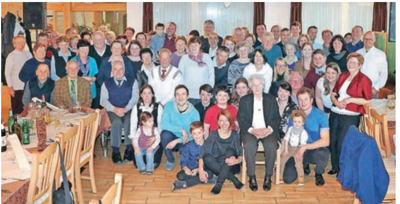
Dobre volje in nasmejanih obrazov na Ivankinem praznovanju ob devetdesetem rojstnem dnevu ni manjkalo.

So pa Ivanki pred rojstnim dnevom na dom oziroma pred dom dostavili jubilejno rožo, ki priča o tem, da je v hiši slavljenka; in kljub temu da ni ravno najbolj navdušena nad presenečenji, jih je za devetdeseti rojstni dan doživela kar nekaj. Presenečenje je bil tudi obisk Gorenjskega glasa.