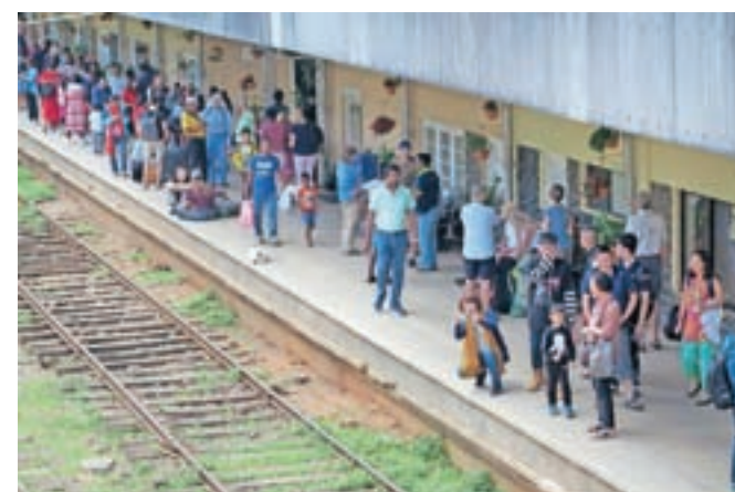
Ljudje čakajo na vlak ...