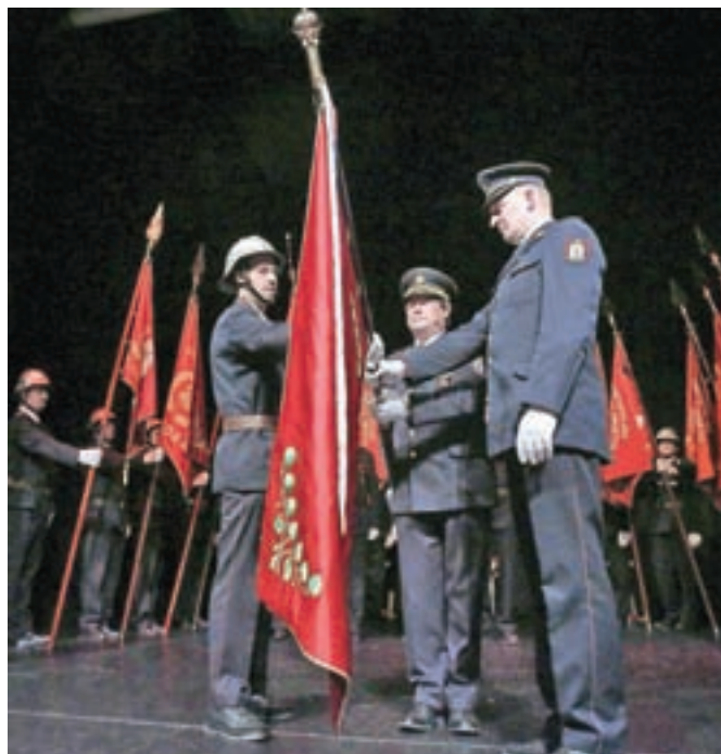
Na slovesnosti ob okroglem jubileju so gasilci razvili nov prapor Gasilske zveze Radovljica.