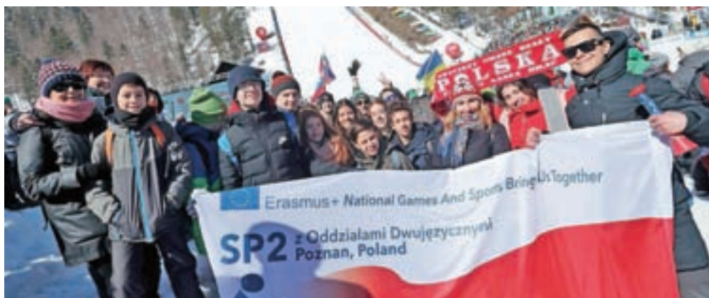
Posebno doživetje je bil obisk Planice.

Za prvo srečanje so vsi sodelujoči oblikovali svoje logotipe in maskote, ki so jih v sredo predstavili v »dnevni sobi« Gimnazije Kranj. V maskotah so združili različne športe in značilnosti vseh sodelujočih držav. Romuni pa so svojo maskoto celo sami izdelali in jo prinesli na predstavitev.