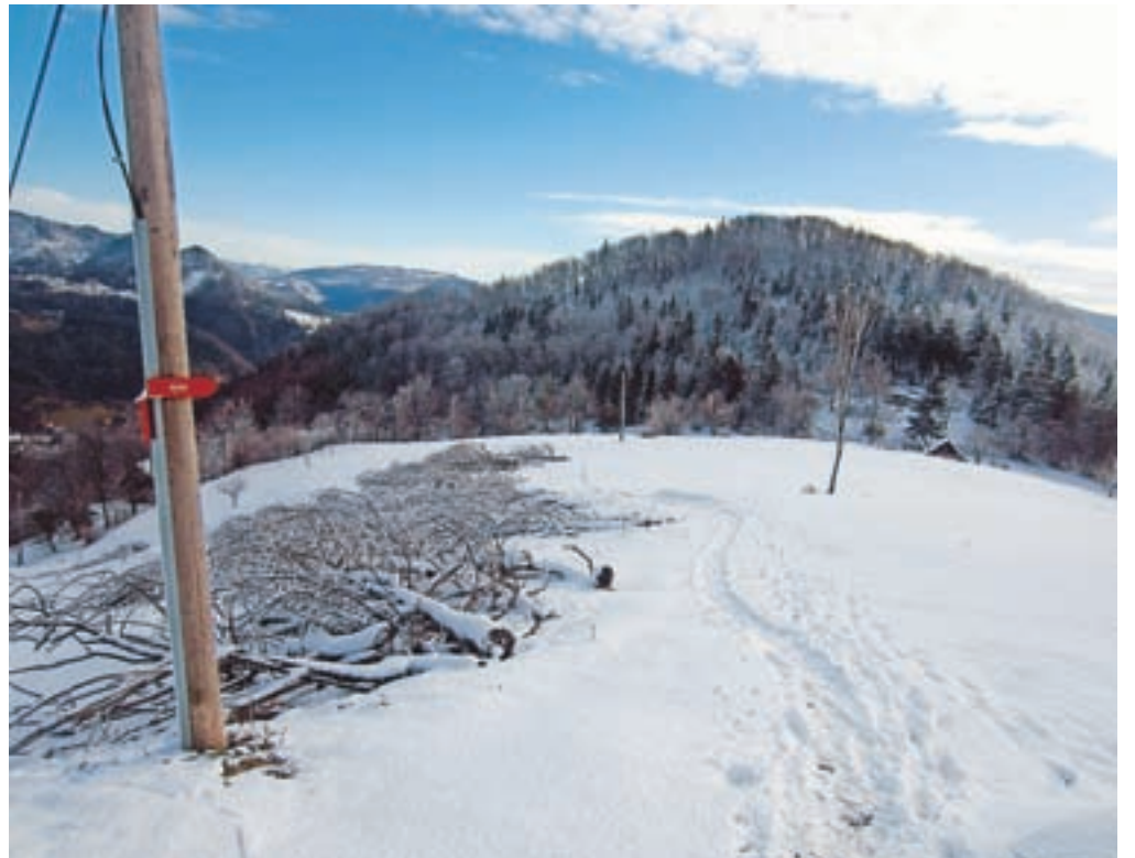
Odcep proti Kleku; hrib, ki ga vidimo, pa je Tabor.

Z vrha se spustimo proti vasi Klek po t. i. Minkini ali Gasilski poti. Možnost je tudi, da se po Darčkovi poti spustimo do skromne votlinice, ki jo ima Tabor. Čaka nas dokaj strm sestop, ki je v mokrem nevaren za zdrs, po gozdnem kolovozu. Vas Klek dosežemo nad vasjo, se mimo ene od hiš spustimo do asfaltirane ceste in po njej nadaljujemo do gostinskega lokala, ob katerem se strmo začne vzpenjati neoznačena stezica na Klek. V nekaj minutah strmega vzpona dosežemo Klek, kjer ni razgleda, je pa oddajnik za mobilni signal. Mimo stolpa po grebenu nadaljujemo proti Klečki, kjer sta na vrhu klopca in vpisna knjiga. S Klečke se po ozkem pomolu začnemo strmo spuščati proti Trbovljam. Potrebne je nekaj previdnosti, saj je pot ponekod malce izpostavljena. Ko pridemo do širše izravnave, se pot obrne ostro desno in nas v nekaj okljukih pripelje nad prve hiše v Trbovljah. Pri hišah dosežemo asfaltirano cesto, po kateri se vrnemo nazaj na glavno cesto, ki pelje skozi Trbovlje. Pa zdaj? Hja, žal se moramo po glavni cesti vrniti do izhodišča v Gornje Trbovlje, kjer