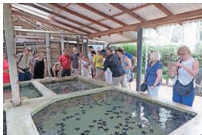
Obisk želvje farme

poškodovala človeška roka in so sedaj tu našle svoj dom. (Nadaljevanje prihodnjič)