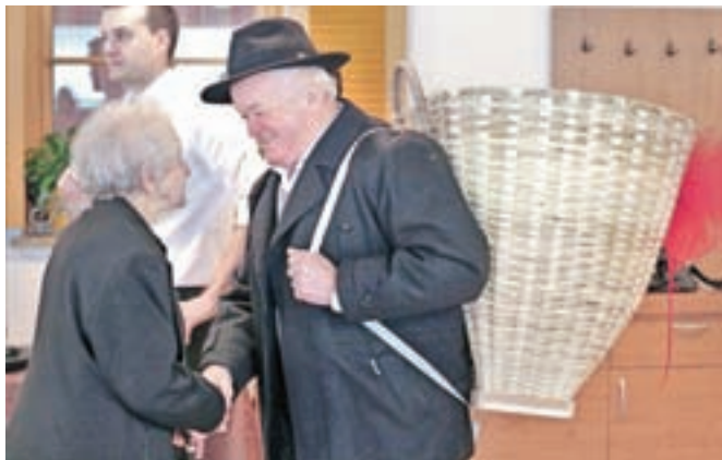
Slavljenki so čestitali, poskrbeli pa so tudi za izvirna darila: tako je dobila čisto pravi, pleteni koš.