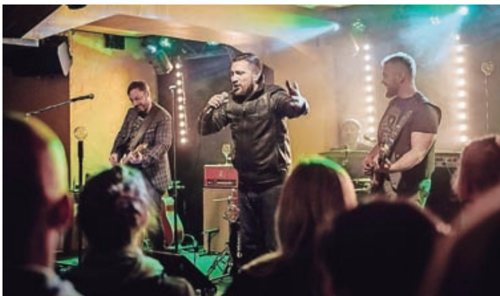
Nudi so po dolgem času koncertirali v Kranju.

Kranjska skupina Nude že dolgo ni obiskala, njihov zadnji koncert na Gorenjskem je