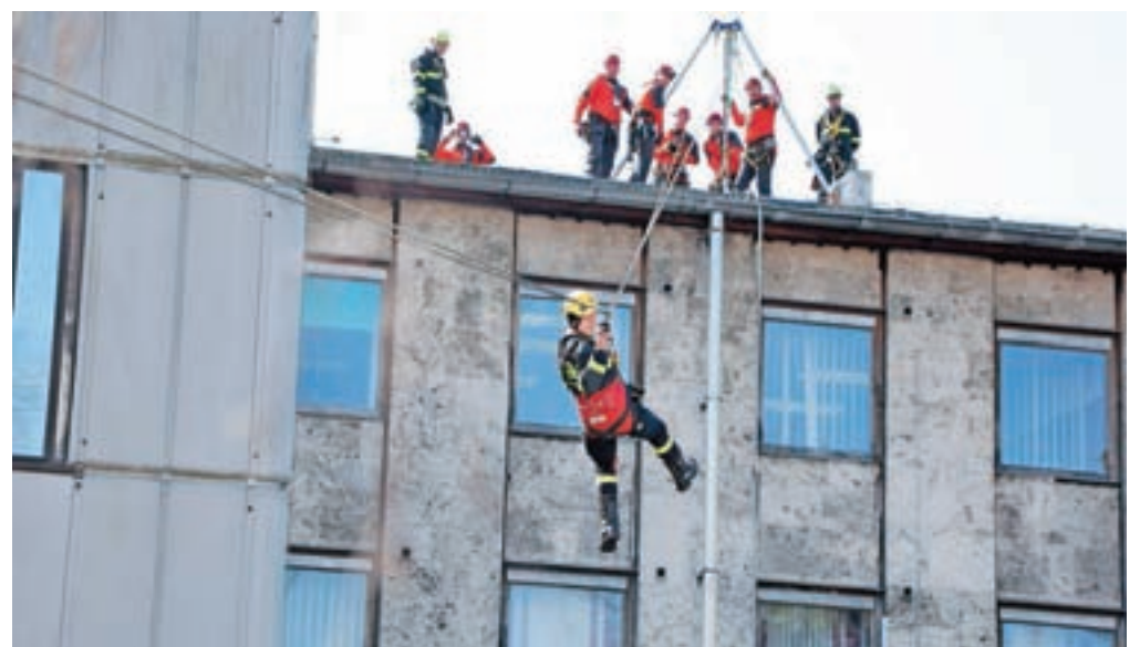
Udeleženci projekta DIRECT so izvedli praktičen prikaz vaje iz višjih nadstropij kranjske občine in s strehe s pomočjo vrvene tehnike.

»Bili smo na nekaj deloviščih v kamnolomu pri Besnici, delali smo na območju