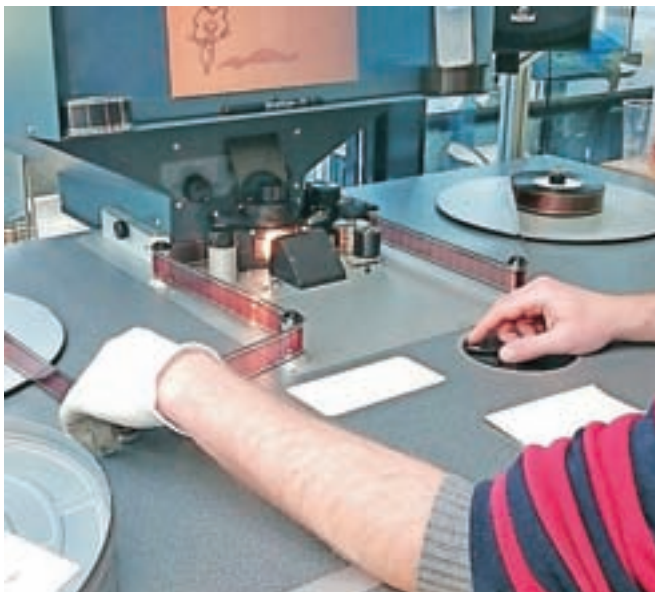
Delovanje v arhivskem oddelku

Celotno zbirko filmskih kolutov je gospa Mitić hranila tudi po soprogovi smrti, čeprav ni imela priložnosti, da bi si jih ogledala. Njun projektor za 8-milimetrske filme se je pokvaril, žal pa ni bilo nikogar, ki bi ga znal popraviti. Čeprav filmov ni mogla predvajati, jih ni hotela zavreči, temveč jih je hranila več kot trideset let, dokler jih ni predala v arhiv Slovenske kinoteke. Zgodba o filmih zakoncev Mitić je podobna zgodbam mnogih, saj je bila tedaj oprema za snemanje filmov