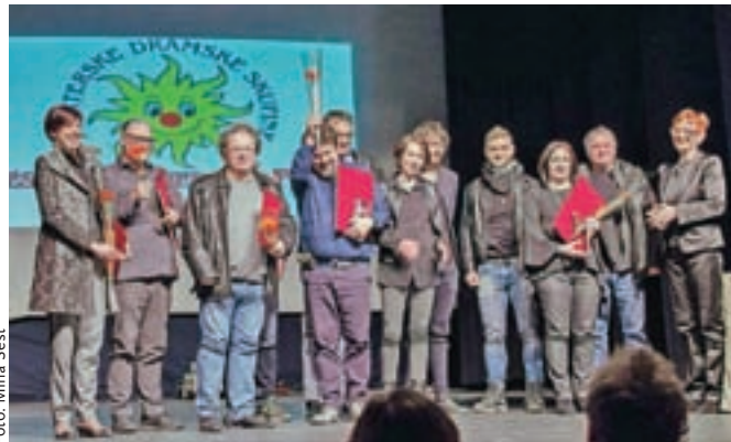
Nagrajenci na letošnjem Festivalu komedije Pekre

Večino nagrad štirinajstega festivala komedije v Pekrah odnesli na Jesenice in v Reteče.