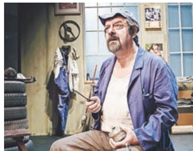
Komedija Petelinji zajtrk v koprodukciji Gledališča Toneta Čufarja in Šentjakobskega gledališča je že letošnja uspešnica.