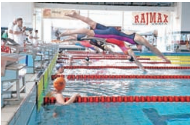
Na plavalnem mitingu Pingvinček v Kranju je nastopilo več kot petsto plavalcev.