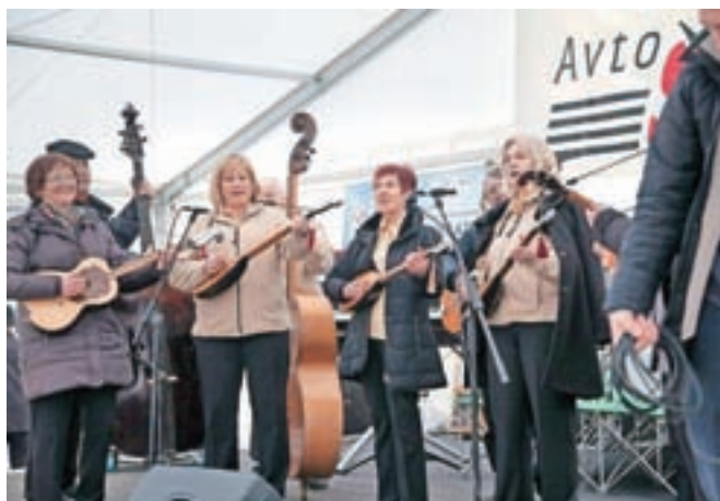
V soboto so v Komendi nastopili tudi tamburaši skupine Bisernica iz Reteč.