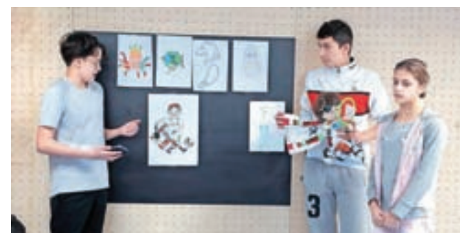
V sredo so v šoli predstavili svoje maskote.