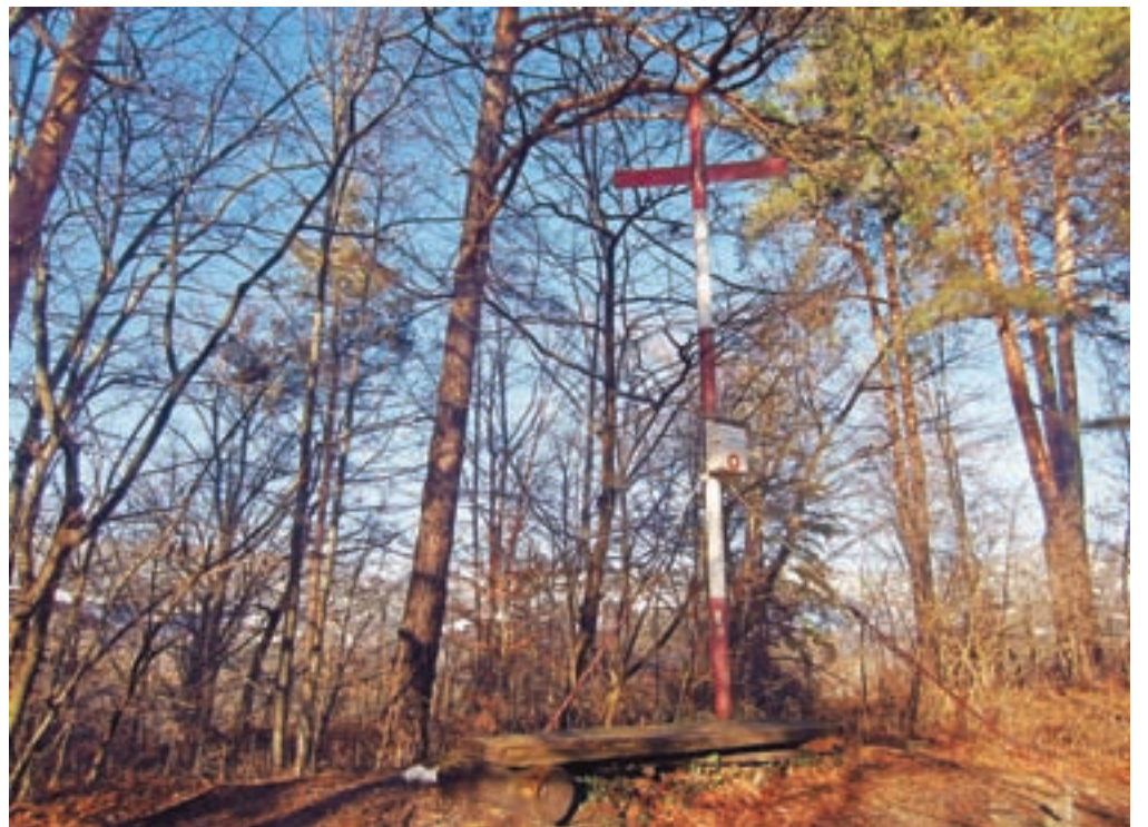
Iz enega letnega časa v drugega. Klečka je bila videti povsem jesenska.