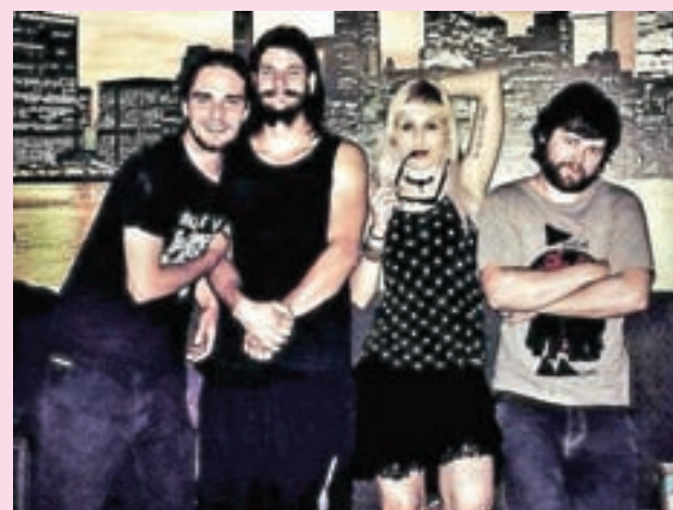
Energija devetdesetih: Lipstick Stain