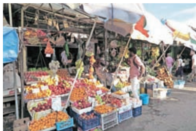
Živahna tržnica v Kandiju