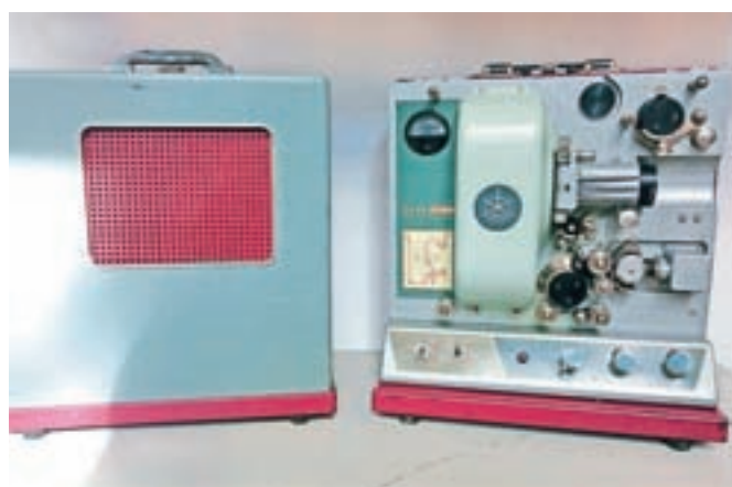
Projektor za filmske kolute oziroma »osmičke«

Slovenska kinoteka aktivno širi zavest o pomenu in vrednosti domačega filma, hkrati pa želijo osvetliti njegovo zgodovino na Slovenskem. S pozivom Zgodbe iz omare apelirajo na vse lastnike filmskih zbirk in nosilce zgodb o ustvarjanju domačih filmov, naj filme in filmsko tehnologijo predajo v hrambo njihovega arhiva, kjer jih bodo konservirali, dokumentirali, identificirali, digitalizirali in omogočili dostop do njih v raziskovalne namene. S tem bodo omogočili tudi prihodnjim generacijam vpogled v preteklost filmske tehnologije.