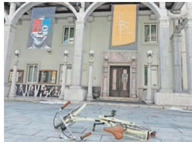
Teater je življenje in vanj vodijo vse poti.

Zbibova se je v poslanici dotaknila aktualne situacije v svetu, ki je vse prej, kot optimistična. »Danes je hitrost informacije bolj pomembna kot znanje, slogani so bolj dragoceni kot besede in