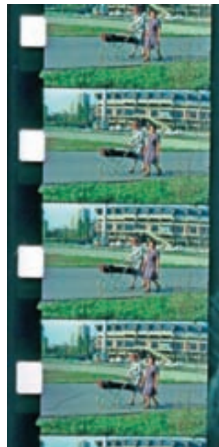
Osemmilimetrski trakovi so prepuščeni nemilosti časa.

prevlado digitalnih medijev izgublja, vedno težje pa so dostopni tudi projektorji za filmske kolute oziroma »osmičke«, s čimer izginjajo analogni filmski zapisi zgodovine našega vsakdanjika.