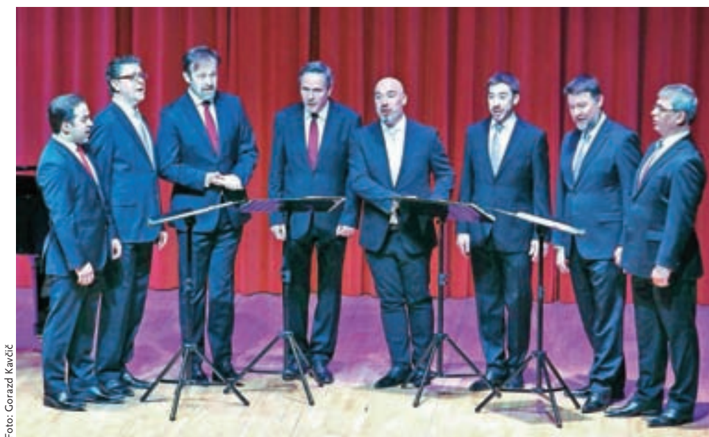
Tradicija vrhunske kakovosti: Slovenski oktet na odru blejske Festivalne dvorane

Repertoar okteta je izjemno širok in raznolik, saj ga oblikujejo skladbe od renesanse do ljudskih pesmi vseh narodov, od klasicizma in romantike do skladb sodobnikov. Mnogo jih je bilo napisanih ali prirejanih prav zanj. Posebno skrb seveda namenja slovenski pesmi, tako ljudski kot