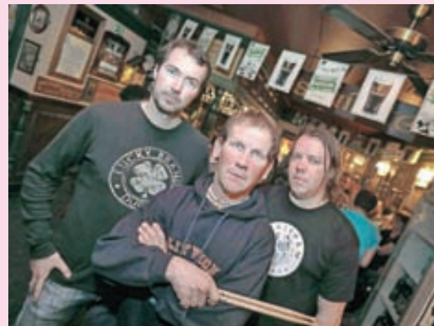
Tradicionalni odmerek rokenrola ob irskem prazniku: Kose v Irish Pubu

Kranj – Ob praznovanju dneva sv. Patrika so se tudi po Gorenjskem vrstili koncertni večeri živahne tradicionalne irske glasbe pa tudi polnokrvnega rokenrola ter ostale živahne glasbe. V dneh okrog 17. marca, irskega praznika veselja in radosti, ki je že davno prestopil meje svoje države, se – snežnim razmeram navkljub – ulice in trgi prelevijo v čudovite zelene odtenke, mize so, kot se spodobijo, obložene s tradicionalnimi jedmi in zdravilnimi napitki, od vsepovsod pa odmevajo ritmi in melodije irske glasbe. Med ambasadorje keltske dobre volje prav gotovo lahko prištejemo mnoge domače glasbene zasedbe, ki so v teh dneh marsikje skrbele za povišan utrip. Tako je v kranjskem Irish Pubu že tradicionalno nastopila zasedba Kose, ki je v vseh teh letih z rednimi nastopi postala že zaščitni bend lokala. Skupina Kose, katere člani imajo za seboj več kot dve desetletji glasbenega ustvarjanja, je tako z zimzelenimi rokovskimi uspešnicami ponovno poskrbela za odlično vzdušje, ki ga člani obljublajo tudi v prihodnje.