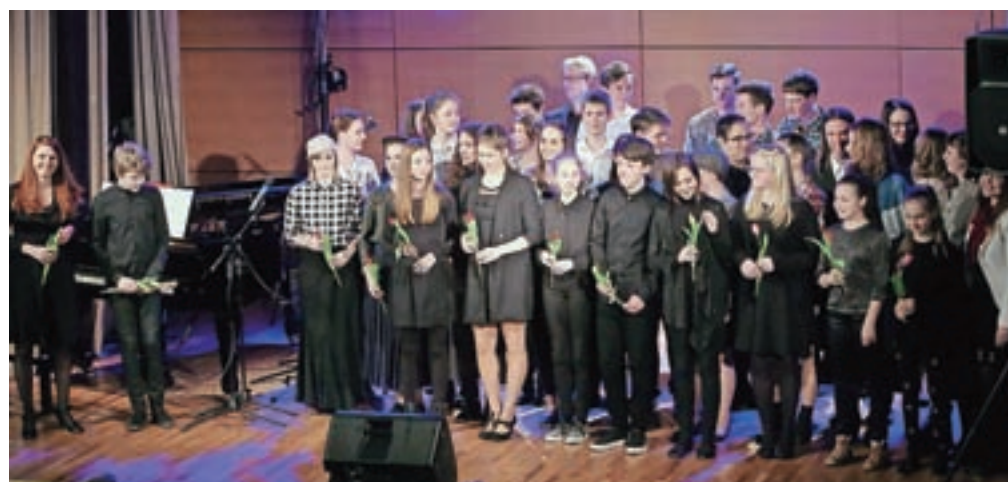
Učenci solopetja in njihovi sošolci instrumentalisti so navdušili s skladbami iz znanih muzikalov.

»Seveda sem med pripravo koncerta večkrat razmišljala o tem, kakšen bo odziv publike. Njihovi aplavzi na koncertu so mi dali vedeti, da ljudje cenijo, če je v nastop vložena veliko trdega dela in truda vseh nastopajočih. Če vemo, da gre za pevce, med katerimi imajo le redki izkušnje z odrom in mikrofonom, mnogi so prvič kot solisti stali na odru pred približno dvesto poslušalci, je bil tokrat nas uspeh še toliko večji. Za piko na i so na pobudo Lions kluba Brnik tokrat dodali še dobrodelno noto. Izkupiček od vstopnin, slabih 1500 evrov, bodo namenili za potrebe učencev Glasbene šole Kranj, del pa bodo namenili invalidni osebi iz Kranja.