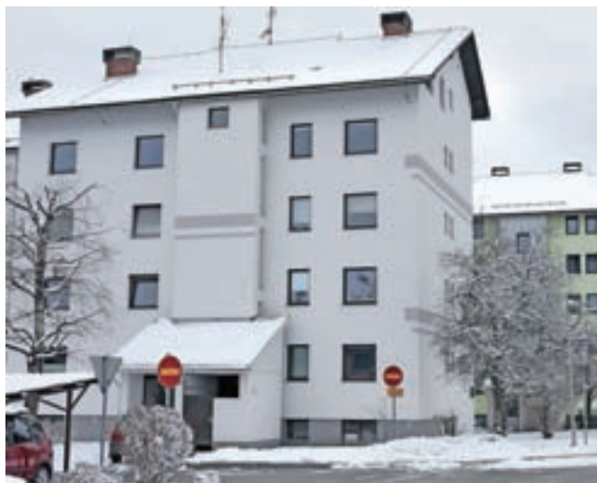
V Sloveniji je okoli 450 tisoč etažnih lastnikov, njihovo združenje pa že vrsto let zahteva boljšo zakonsko ureditev področja upravljanja stavb.

Na Zbornici za poslovanje z nepremičninami