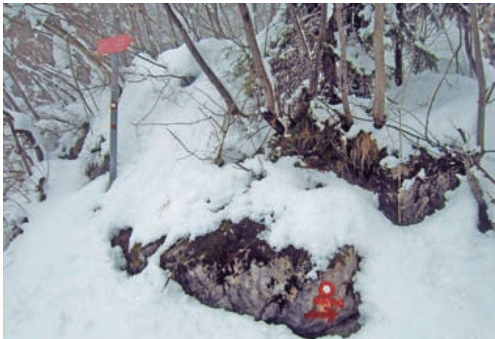
Smerokaz do kočice na Kavcu

Nadmorska višina: 1107 m Višinska razlika: 490 m Trajanje: 4 ure Zahtevnost: ★★★★★