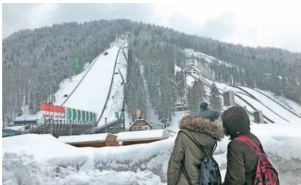
Planica bo skakalce in gledalce letos pričakala v pravi zimski podobi. Takole je bilo pod Poncami včeraj.

Planica bo ta konec tedna gostila finale svetovnega pokala v smučarskih skokih. V četrtek bodo na letalnici kvalifikacije, v petek in nedeljo posamični tekmi, v soboto pa ekipna.