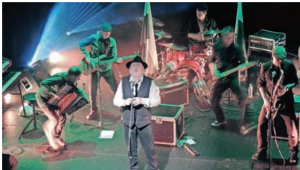
Glasbena avantura, oplemenitena s pristnim knapovskim humorjem: skupina Orlek v radovljiški Linhartovi dvorani

L egendarna zasavska zasedba Orlek, ki uspešno muzicira po odrih širom naše dežele že več kot četrt stoletja, se je z največjimi hiti in novoizkopanimi skladbami podala na svežo glasbeno avanturo, oplemeniteno z edinstvenim knapovskim humorjem. Svojemu knap-rollu s primesmi džeza, funka, popa in narodno-zabavne glasbe so pridali pripovedi in anekdote iz