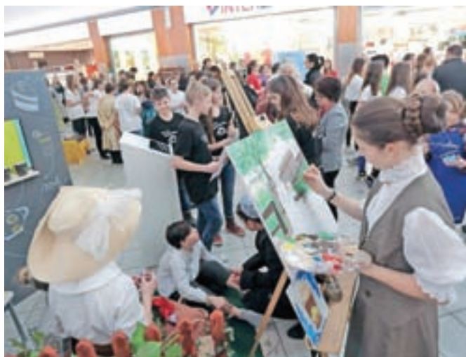
Turistični podmladek OŠ Naklo je povabil v Kavarno in likovni salon Kofetarica.