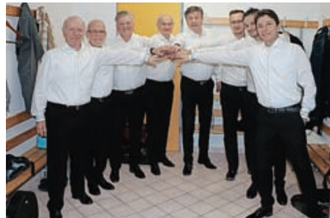
Dobro razpoloženje v garderobi – Prifarski muzikanti