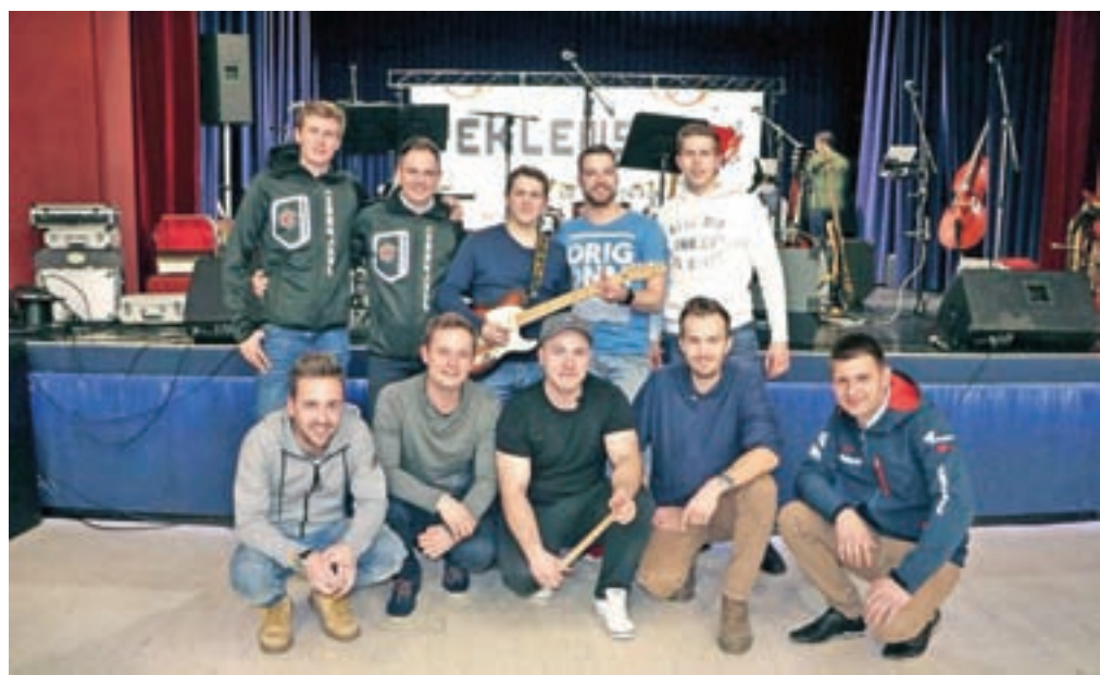
Peklenski muzikantje in Fantje izpod Lisce