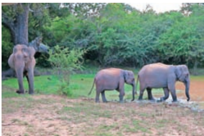
Slone smo videli v sirotišnici, z nekaj sreče pa smo jih srečali tudi v narodnem parku Yala.