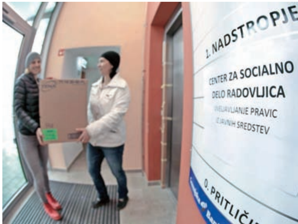
Vhod v nove prostore radovljiškega centra za socialno delo je na zadnji strani stavbe, nasproti avtobusne postaje.

V enoti na Kopališki ulici, v stari stavbi, v kateri je tudi uprava radovljiških vrtcev, pa so nudili pomoč posameznikom in družinam, kar pomeni, pojasnjuje Jakšičeva, da se tam ukvarjajo z rejništvom, posvojitvami, delom z mladostniki s težavami v odraščanju, nasiljem v družini, urejanjem preživnin, varstvom in zaščito otrok, skrbništvom, urejanjem stikov, svetovanjem v razveznih postopkih ...,