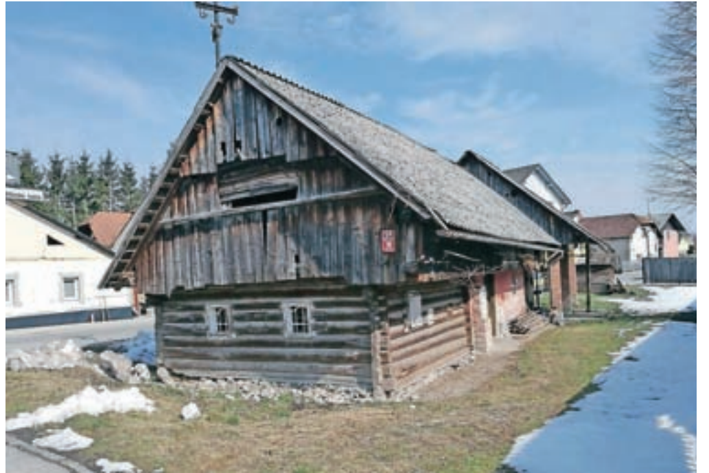
Kofutnikova domačija v Srednjih Jaršah je v slabem stanju, a ima Občina Domžale, ki je njena lastnica, z njo še velike načrte.