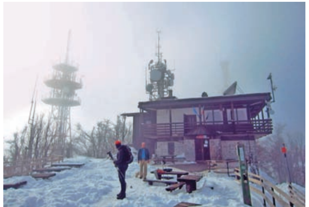
Vrh Krima s planinskim domom