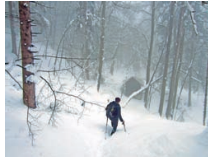
Lovska kočica v Plehanovem laz / Foto: Jelena Justin

Krim je čudovit razglednik; le ob pravem vremenu ga moramo obiskati. Pogled proti severu je pogled na Ljubljansko kotlino z Ljubljanskim