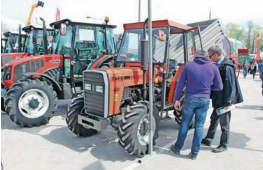
Na sejmih v Komendi je že po tradiciji vedno velika ponudba traktorjev in druge kmetijske mehanizacije.

Za uvod v sejem bosta v petek dopoldne v organizaciji sejma, Kmetijsko gozdarskega zavoda Ljubljana, ministrstva za kmetijstvo, gozdarstvo in prehrano