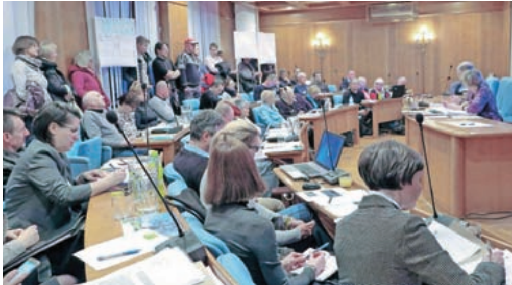
Obravnavo prostorskega načrta za severno obvoznico je spremljalo kakih trideset članov civilne iniciative, ki nasprotujejo tej cesti.