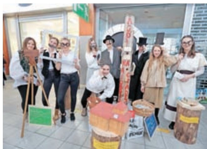
V Bohinj vabijo na interaktivno doživetje dediščine ...