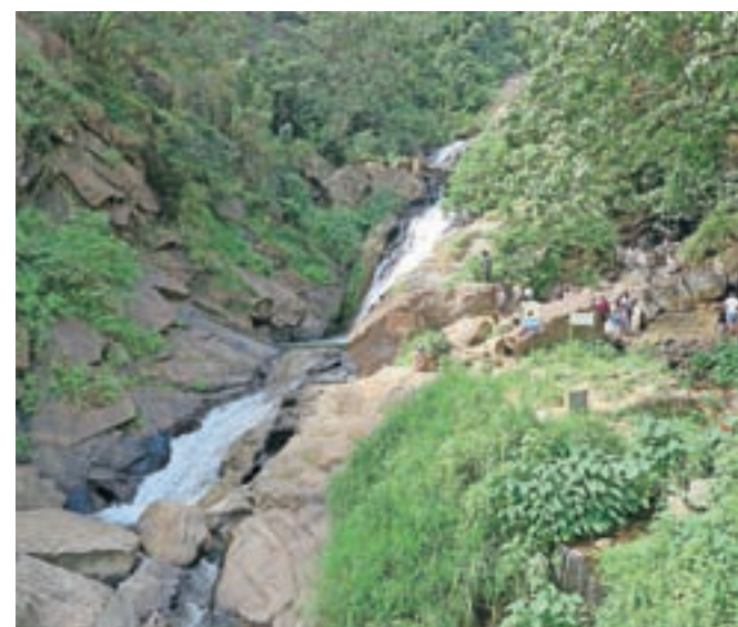
Šrilanka je polna tovrstnih prizorov: slap Rawana