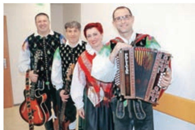
Ansambel Zarja prihaja iz Loma pod Storžičem.