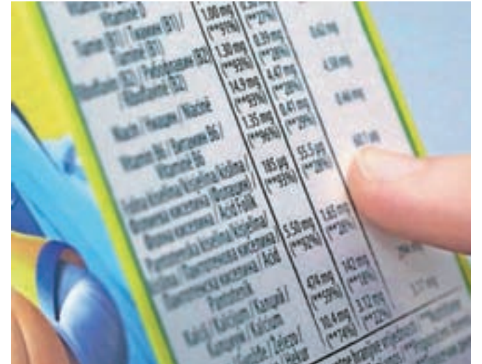
Na predpakiranih izdelkih preverite seznam sestavin in hranilno tabelo.

Posebej je poudarila problem odvečnega sladkorja v žitnih kosmičih za otroke. S seboj je imela prikupno škatlo kosmičev, v katerih pa je bila kar tretjina sladkorja. »Štiriletnik, ki poje sto gramov takih kosmičev, od tega je 33 gramov sladkorja, je že za deset odstotkov presegel dnevno dozo varnega vnosa sladkorja,« je razložila. Že leta 1999 so s svetovno potrošniško organizacijo začeli kampanjo za manj sladkorja v žitnih kosmičih za otroke. Stanje se izboljšuje, saj se je povprečna vsebnost sladkorja v vzorcih na slovenskem trgu v petnajstih letih zmanjšala s 35 na 20 gramov v stotih gramih izdelka. Pokazala je tudi primer priljubljenega kečapa, ki naj bi vseboval zgolj naravni sladkor iz paradižnika, ima pa zato dodano sladilo, ki ni primerno za tri, štiri leta stare otroke.