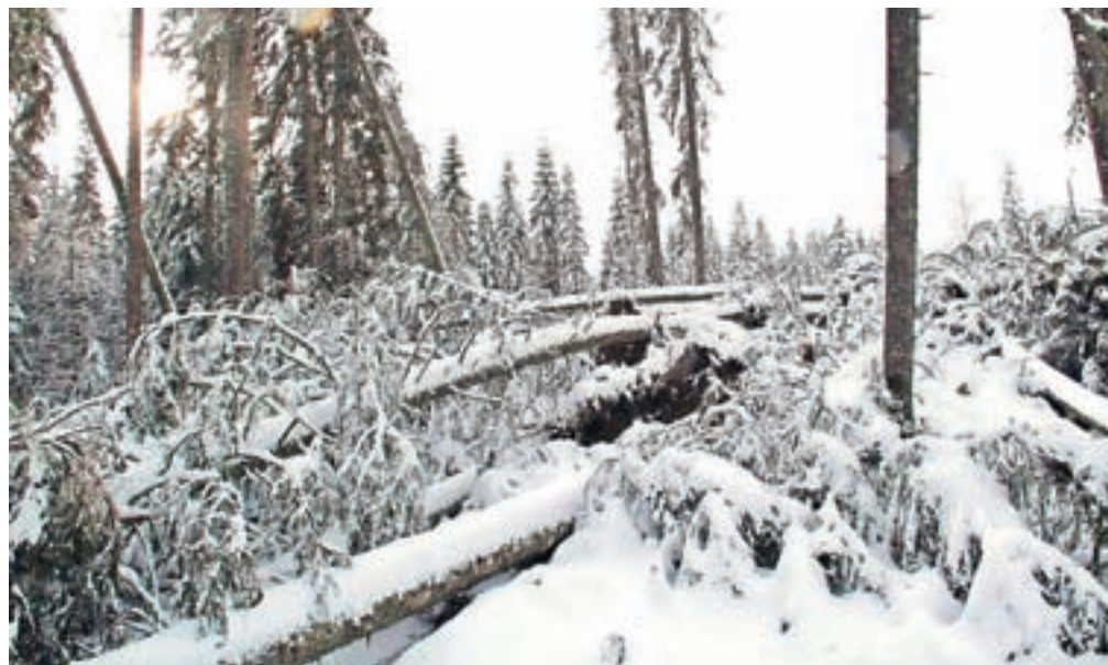
Visoka snežna odeja marsikje onemogoča posek in spravilo v decembrskem vetroloemu poškodovanega drevja.

Na blejskem gozdnogospodarskem območju je vetrolom poškodoval 65 tisoč kubičnih metrov drevja. Poškodovano drevje je razpršeno po celotnem