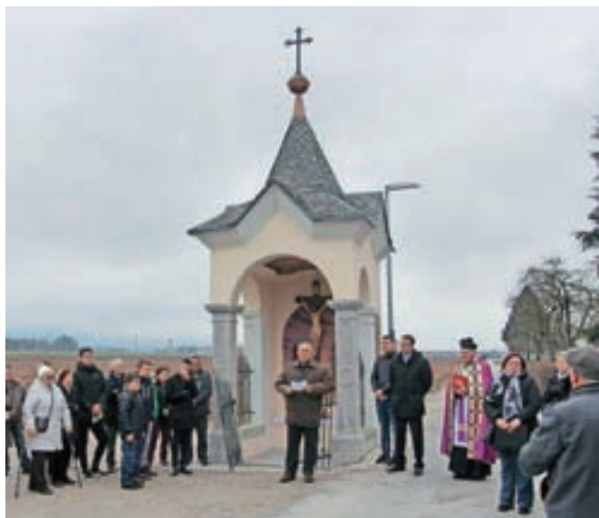
Kapelico, ki je vpisana v register kulturne dediščine kot sakralna stavbna dediščina, so rešili nadaljnega propadanja.