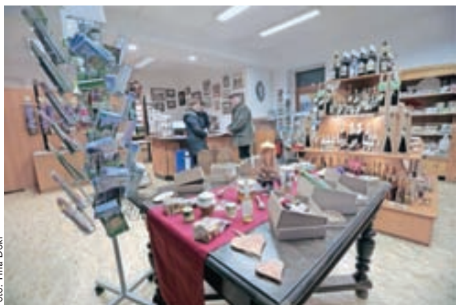
Turistično društvo se je preselilo v Thalerjevo hišo.