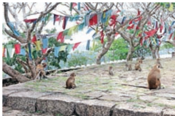
Opice privabljajo poglede turistov, a je treba biti kar previden.