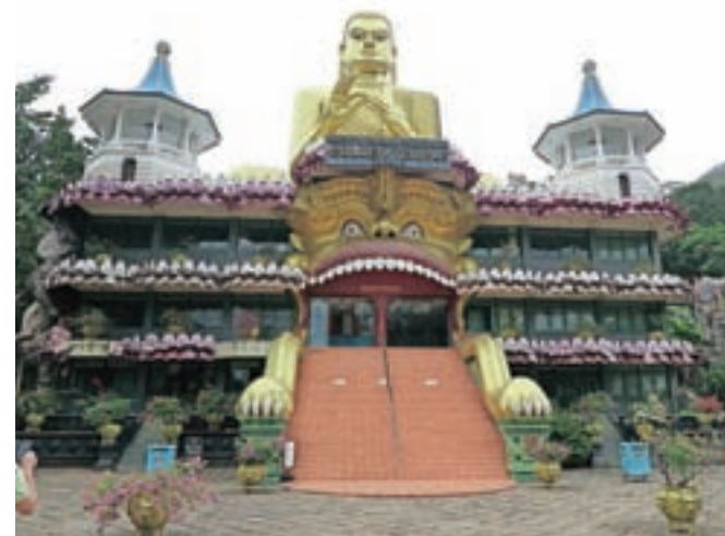
Zlati Budov kip v Dambulli ob enem izmed izhodišč za vzpon do jamskih templjev