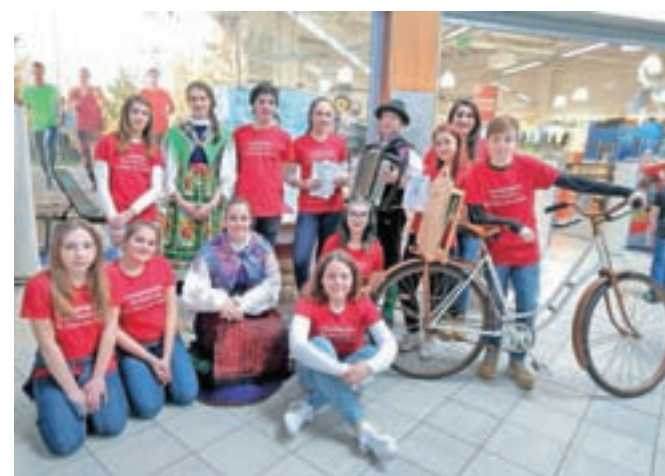
... v Rateče pa s kamišibajem ad žoka da krapa.