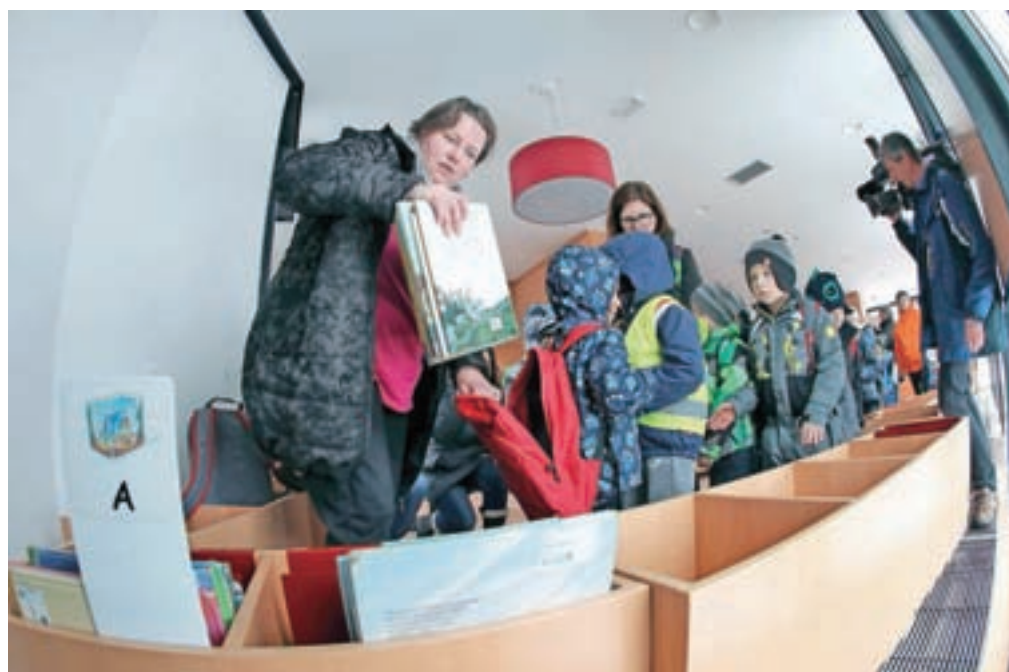
Otroci iz vrta in obeh osnovnih šol so v spremstvu vzgojiteljic in učiteljic v nahrbtnike zložili slikanice, jih odnesli do Vurnikovega trga in tam zložili na nove police.

izposojati knjig. Zato so knjižničarji bralcem omogočili podaljšan rok izposoje; vse gradivo, ki so si ga bralci izposodili po 12. februarju, bodo lahko brez zamudnine v novo knjižnico na Vurnikovem trgu vrnili najkasneje 7. maja. Med selitvijo si bodo bralci knjige in drugo gradivo lahko nemoteno izposojali v Knjižnici Lesce, ki bo odprta vse dni v tednu razen nedelj, in sicer od ponedeljka do četrтка med 14. in 19. uro, ob petkih med 9. in 14. uro in ob sobotah med 8. in 12. uro.