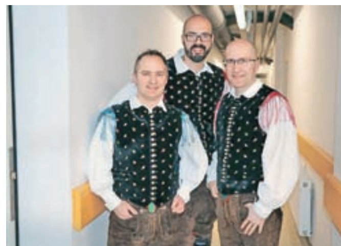
Ansambel Storžič je pred kratkim izdal zgoščenko.