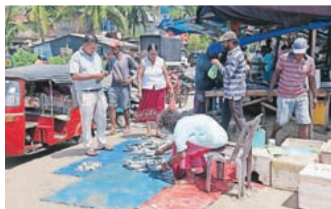
Galle: ribja tržnica – iz morja prodajalca za glavno cesto in neposredno na mizo

Čeprav je bilo popotovanje po Šrilanki podobno tistemu iz preteklosti, je bilo popolnoma drugačno. V tem času, odkar sem jo videla prvič, se je ogromno spremenilo. Že samo letališče v Kolombu je sedaj najmanj trikrat večje od tistega, ki ga imam v spominu. O majhni stavbi ni več ne duha ne sluha. Tudi moderniziralo se je. In to zelo.