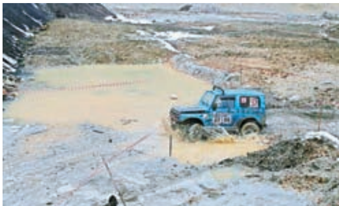
Vozniki serijskih terenskih vozil so lahko preizkusili vozniške spretnosti in lastnosti vozil.

Radovljica – V gramoznici Graben pri Radovljici se že 11 let srečujejo ljubitelji terenskih vozil in ekstremne vožnje, kakršne bolj poznamo iz ZDA. Da pa navdušenec nad tem športom tudi pri nas ne manjka, je pokazala odlična udeležba tako voznikov kot gledalcev na nedeljskem tekmovanju, ki si ga je kljub mokrim in blatnim razmeram ogledalo več kot pet tisoč gledalcev. Tekmovanje poteka v dveh disciplinah. Hitrostne preizkušnje se lahko udeležijo amaterski vozniki serijskih