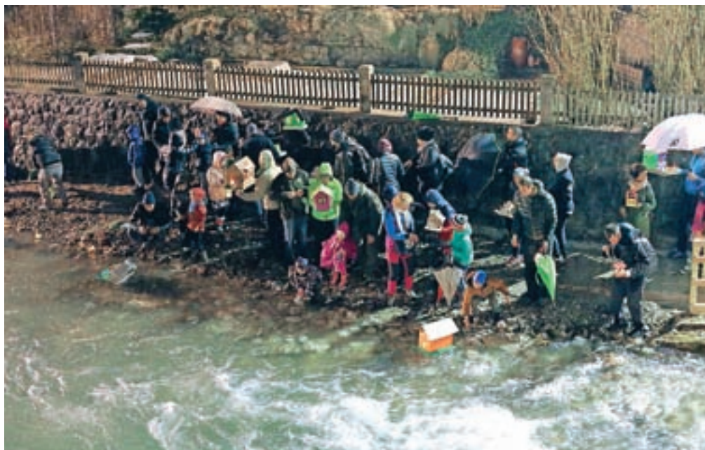
Gregorčke so spustili po Tržiški Bistrici, ki je zaradi deževja kazala svojo moč.

Tudi bajerje nekdanje spodnje fužine v Kropi in umezne kanale v Kamni Gorici so na predvečer sv. Gregorja preplavile makete iz papirja, lesa in stiropora, v katerih je plamenela svečka. Barčice so izdelali otroci v šoli, vrtcu in doma s starši. V teh