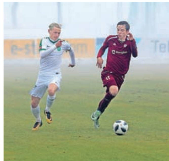
Tekmo v Kranju je zaznamovala tudi slaba vidljivost. V boju za zadetek so bili uspešnejši Ljubljančani (v svetlejših dresih).

nogometaši Domžal, ki so na svoji prvi domači tekmi v tem letu gostili Gorico, proti kateri so vknjižili zaslužno zmago s 3 : 0. Zadetke za rumene so dosegli Amedej Vetrh, Lovro Bizjak in Zeni Husmani, ki so tako poskrbeli za šesto zaporedno slavo Domžal. Te so na lestvici na tretjem mestu. Tekme 23. kroga bodo že danes in jutri. Derbi bo danes v Mariboru, kamor odhajajo Domžale, nogometaši Triglava pa bodo jutri gostovali v Celju.