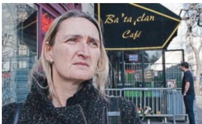
Prizor iz filma Maje Weiss My way 50 – med iskanjem in najdenim svetom

Pri letošnjem programu FDF gre za iskanje točke povezovanja – to naj bi bili liki, večji od življenja, ter kritičen ali nostalgичno-melanholičen odnos do preteklosti. Simon Popek, vodja filmskega programa Cankarjevega doma, pravi: »Svet je lahko tudi lep, samo televizijska poročila je treba odklopiti