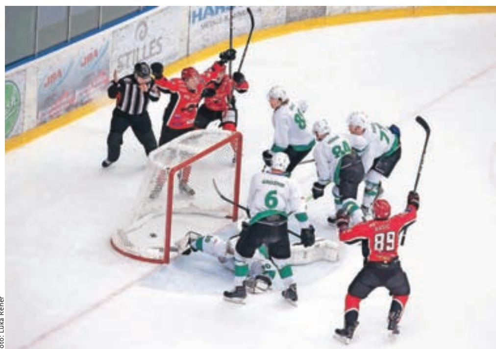
Sobotno tekmo na Jesenicah si je ogledalo 3100 gledalcev, domači so mrežo Olimpije zatresli kar petkrat in si danes v Tivoliju že lahko zagotovijo polfinale v Alpski hokejski ligi.

Škofja Loka – Rokometaši so v prvi NLB leasing ligi začeli s tekmami nadaljevanja. V ligi za prvaka igrajo tudi Škofjeločani. Ekipa Urbanscape Loka bo tekmo prvega kroga odigrala jutri v gosteh pri Celju Pivovarni Laško.