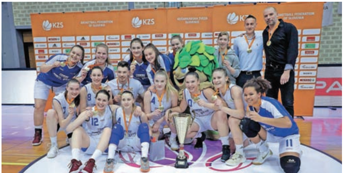
Košarkarice Triglava so se veselile pokalnega naslova.