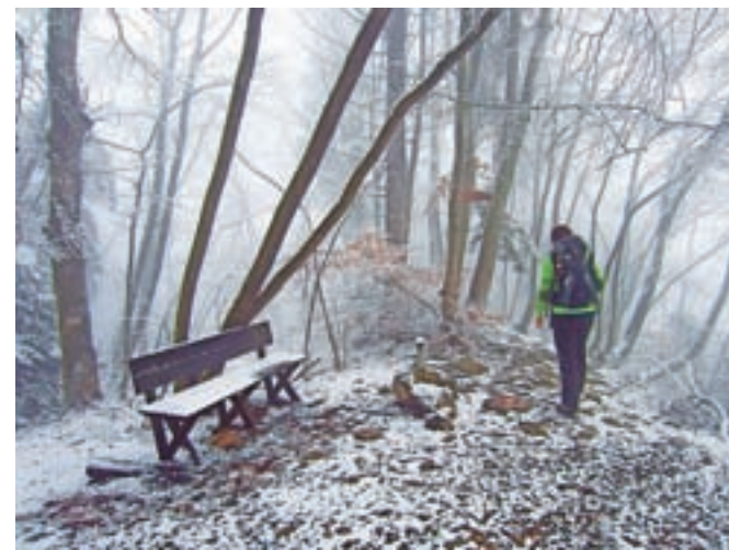
Klop za počitek na Ciclju

Nadaljujemo naravnost in dosežemo nerazgledni, v gozdu skriti vrh Ciclja, 836 m. Po grebenu nadaljujemo proti vzhodu, ko dosežemo kolovoz, se steza začne strmo spuščati. Trenutno je na poti nekaj podrtega drevja. Z desne se nam priključi pot iz Križevniške vasi, mi pa še kar nadaljujemo proti vzhodu. Ko se steza položi, se nam z desne priključi še pot iz Velike vasi, koder se bomo vračali. Ko dosežemo razgledni travnik, pred seboj zagledamo travnato pobočje, na vrhu katerega je cerkev sv. Miklavža. Tretji žig na svoji današnji poti bomo dobili pri zadnji hiši na koncu vasi, ki jo ves čas vidimo. Do križišča, kjer se nam je priključila pot iz Velike vasi,