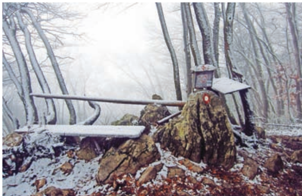
Vrh Murovice je skrit v gozdu, a ob lepem vremenu ponudi tudi nekaj razgleda.

Nadmorska višina: maks. 836 m Višinska razlika: 900 m Trajanje: 5 ur Zahtevnost: ★★★★★