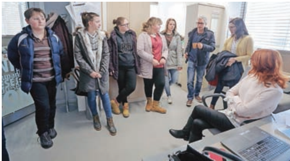
Na Gorenjskem glasu smo pretekli četrtek gostili pet mladih novinarjev Osnovne šole Prežihovega Voranca Jesenice.