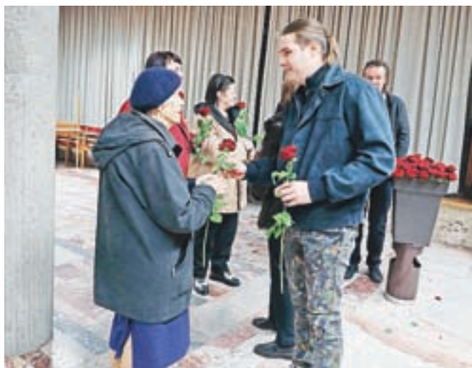
Ker je dogodek sovpadal z dnevom žena, so bile prisotne tudi rdeče vrtnice.