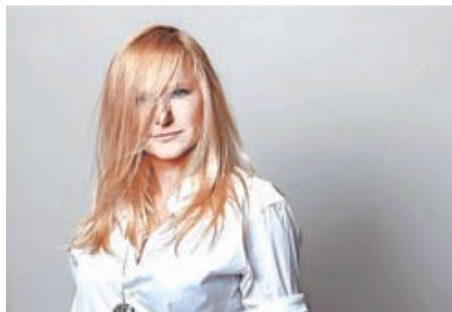
Priljubljena pevka Nuša Derenda praznuje dvajsetletnico samostojne kariere.