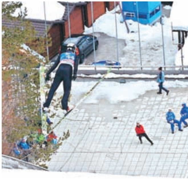
Tudi veterani so prikazali lepe in dolge skoke.

naredil nekaj skokov, skupaj s tem tekmovanjem jih bom imel okrog 25. Ni dovolj, a se zanašamo na staro kilometrino. Je pa nekako dovolj, da odskačeš varno. Skoki so seveda primerni za veterane, številni so bili v celoti v slovenskih proizvodih – od smučič in vezi do čevljev in dresov. Nekateri želijo imeti najboljšo opremo. »Norvežani, Finci, tudi Švede veliko trenirajo, po večkrat tedensko. So skoraj kot profesionalci. So gospodje v zrelih letih, v drugi puberteti, ki se začnejo spet ukvarjati z otroškimi sanjami. Enkrat do dvakrat letno pridejo v Slovenijo tudi na priprave, tako da smo dobri prijatelji,«