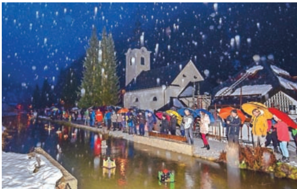
Na prireditvi Luč v vodo v Železnikih je lilo kot iz škafe, a so kljub temu našli okoli sto petdeset gregorčkov.

krajih se na začetku novembra za štiri mesece sonce poslovi in v različne predele se vrača od 17. januarja do 15. marca. Njegov prihod oznanijo tako, da vržejo v vodo luč. Luč je bila nekdanj stara cokla, pehar ali sito, v katere so dali žaganje in oblance, prelili s smrekovo smolo ter zažgali. Ko luč ugasne, simbolično svetloba premaga