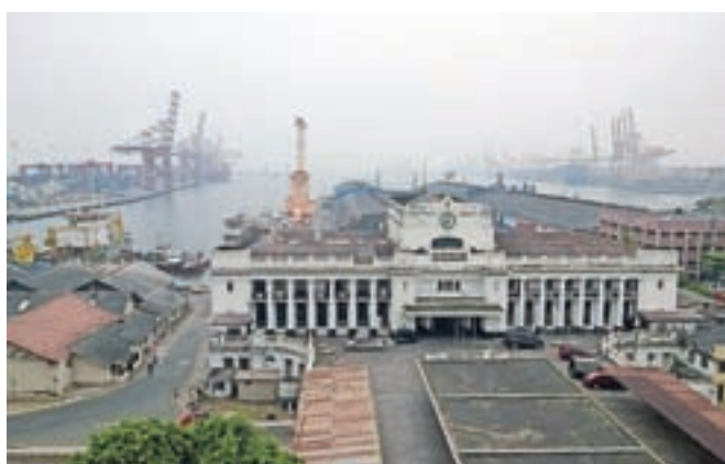
Pogled iz jedilnice Grand Oriental Hotela na pristanišče v Kolombu

Razgled na pristanišče je bil najlepši iz jedilnice in res nekaj posebnega, hrana odlična – sicer kot zame povsod, saj obožujem šrilanške okuse in me lahko že samo pečena čičerika s