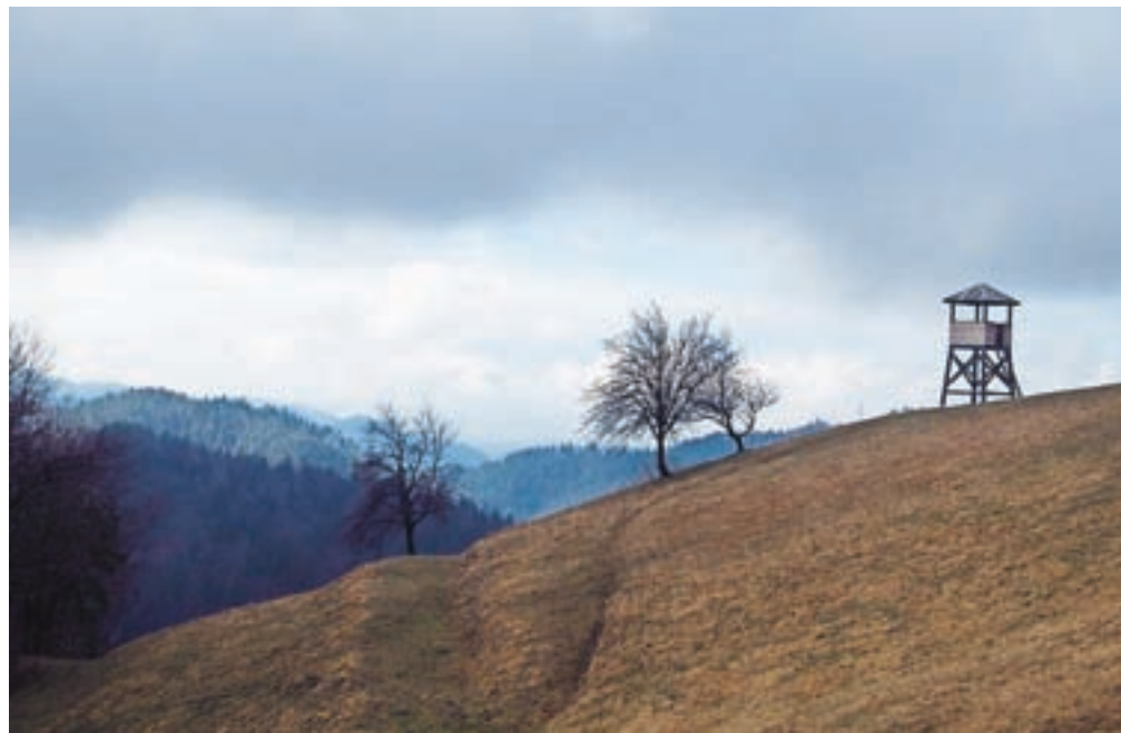
Meseca januarja na poti do Križevniške vasi ni bilo o snegu ne duha ne sluha.