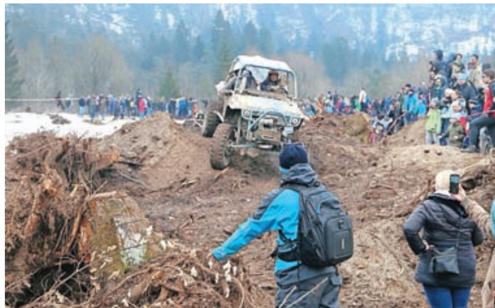
Težavna preizkušnja je namenjena posebej prilagojenim terenskim vozilom.

lastnosti avtomobilov. Posebna kategorija je težavna preizkušnja, ta je namenjena voznikom posebej