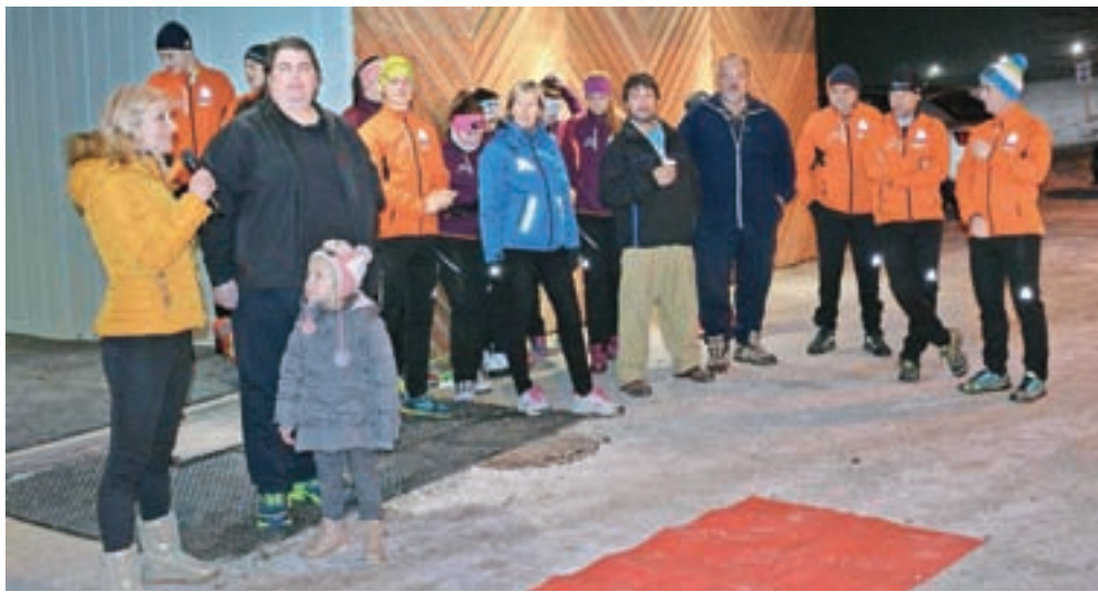
Novo sezono so letos začeli z uradnim odprtjem prenovljene infrastrukture.