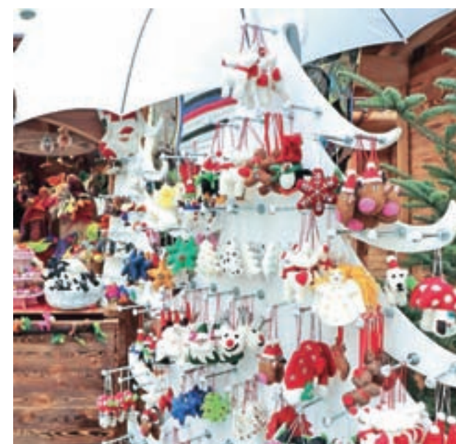
Če želite novoletno jelko okrasiti s simpatičnimi in pisanimi okraski iz filca, potem vam ponudba take salzburske božične stojnice pride še kako prav.