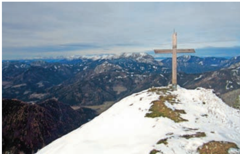
Goli vrh z grebenom Košute v ozadju / Foto: Jelena Justin

sprehodimo do mejnega kamna številka 18, bomo pa videli tudi ljubko leseno hišico na robu planine. Prečimo planino, in ko dosežemo gozd, strmina ne popusti. Tukaj ni večjih okljukov, temveč gre pot kar direktno navzgor. Morda naj že tukaj opozorim na previdnost pri sestopu. Pot namreč poteka med drevesnimi koreninami, ki so zelo gosto ena zraven druge. Če se bomo odpravili po dežju, ali če bodo korenine vlažne, bo previdnost še toliko bolj nujna, saj na njih kaj hitro lahko zdrsne. No, trenutno so razmere povsem drugačne, saj je pot več kot lepo, pravljíčno zasnežena. Tik pod vrhom nam bodo družbo delali borovci. Ko dosežemo konec gozda, smo praktično