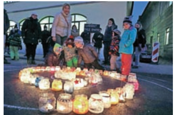
Glavni trg je osvetlil tudi labirint iz svečk.

Središče Kamnika je bilo v znamenju že osmega noveoletnega otroškega bazarja Vrtca Antona Medveda Kamnik.