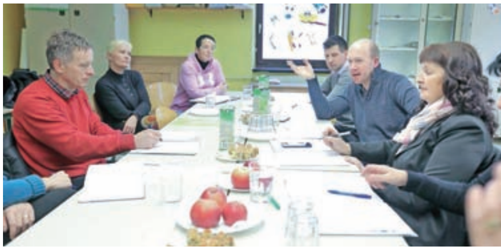
Pomenek z mojstrom Štefelinom v Podružnični šoli Bukovica

V okviru projekta Lokalna hrana v šole pa se da vendarle veliko narediti: da se uskladi ta ponudba in povpraševanje po lokalni hrani, da so uravnoteženi šolski obroki, pri čemer sodelujejo vrhunski strokovnjaki, da se