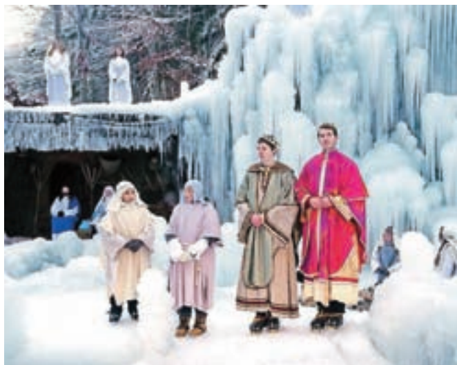
Letos je zgodba predstave v ledu zgodovinsko obarvana – prinaša izročilo evropske marijanske pobožnosti.