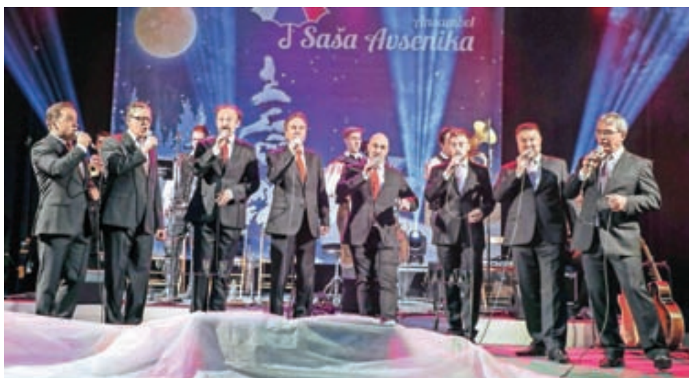
Slovenski oktet

in ohranja spomin na velika narodno-zabavna glasbe, brata Slavka in Vilka, ki sta za mlad ansambel napisala nove skladbe in priredila nekatere starejše Avsenikove. Na koncertu Zimska pravljica sta zasedbi poleg samostojnih