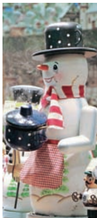
Na stojnicah ne manjkajo božički, ogromno pa je tudi lesenih vojačkov, lahko bi jim rekli kar »hrestači«, in pa nasmejanih snežakov vseh velikosti in pojav.