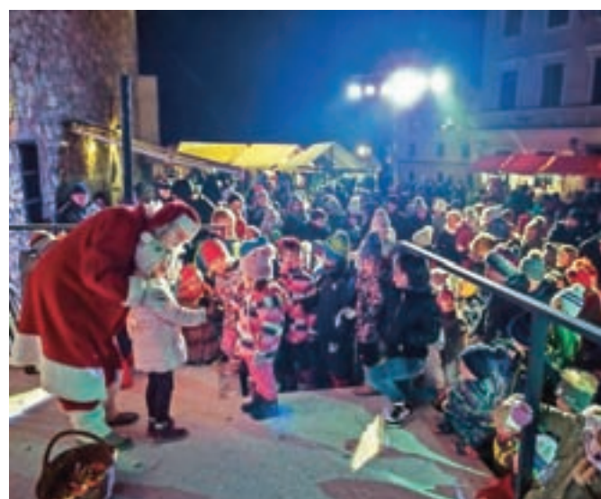
Božični LUFT je prvič potekal na novi lokaciji.