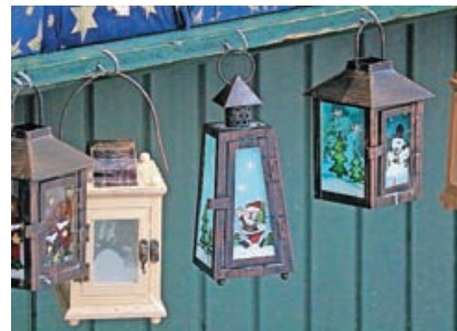
Različne lanterne, okrašene tudi z božičnimi motivi