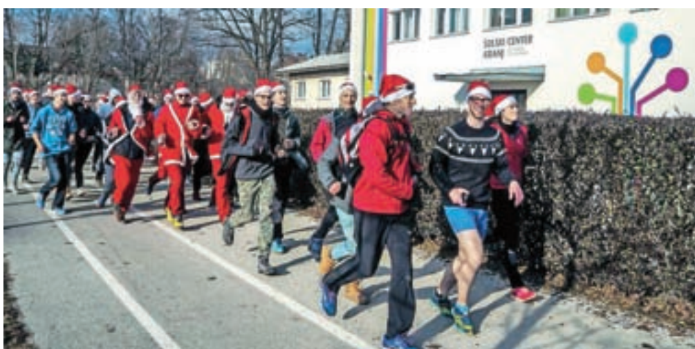
Letos že tretjega Božičkovega teka se je udeležilo 62 urnih tekačev in tekačic.