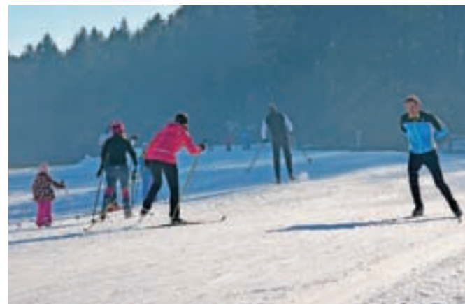
Proga je urejena v dolžini slabih šeststo metrov in je primerna tudi za začetnike. Dobro je bila obiskana tudi za božič (na sliki).

Medvode. Ko bodo temperature to omogočale, bodo nadaljevali z izdelavo umetnega snega, progo podaljševali, za najmlajše pripravili sankališče ter otroška igrala na tako imenovanih jasliah, ki pomagajo pri učenju prvih korakov teka na smučeh. »Trudimo se, da sneg, ki ga že imamo, čim bolj obdržimo tudi v dneh, ko so temperature znova nekoliko višje. Januarja večjih odjug običajno ni in progo bomo podaljšali do okrog dveh kilometrov,« je pojasnil Klemen Svolfšak, vodja vzdrževanja iz NŠD Medvode, in dodal, da se trudijo, da bi bilo dogajanje tudi v letošnji zimi čim pestrejše. V prvi vrsti se bodo posvetili rekreativcem. Med tistimi, ki smo jih že prvi dan opazili na progi,