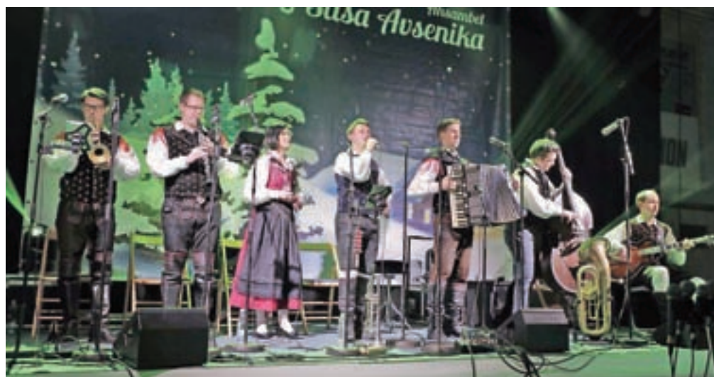
Ansambl Saša Avsenika

Slovenski oktet že več kot šest desetletij neguje tradicijo vrhunske izvedbe slovenske narodne pesmi, repertoar okteta pa je izjemno širok in raznolik. Velja za najbolj reprezentativen slovenski moški vokalni komorni ansambel, ki se je predstavil na domala vseh pomembnejših domačih in mednarodnih koncertnih odrih. Ansambel Saša Avsenika pa nadaljuje tradicijo Avsenikove glasbe