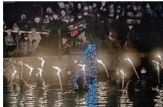
Na dno jezera Črnava so potopili božično drevesce.