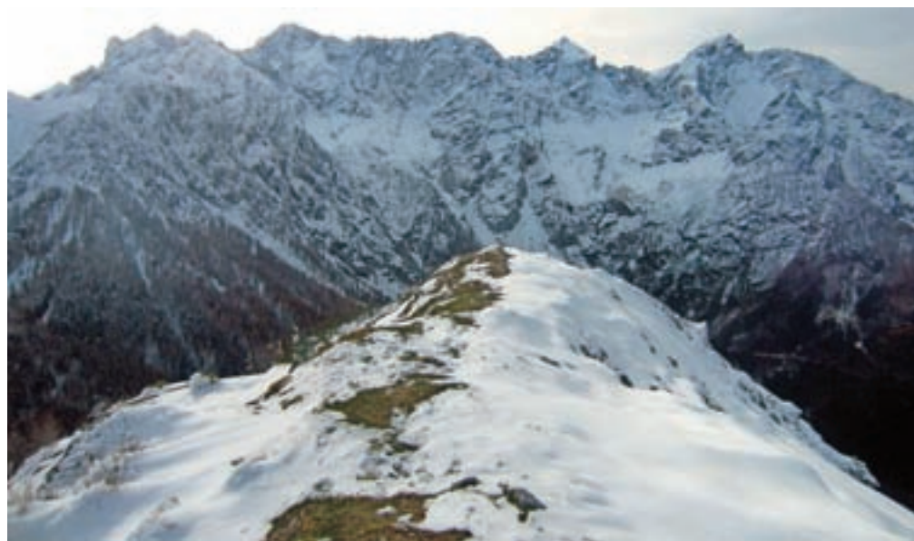
Z vrha se odpre razgled na severno ostenje Grintovcev.