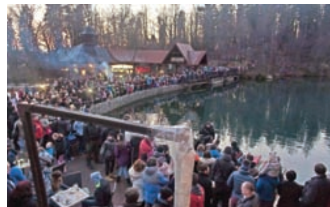
Božičnega dogodka v Preddvoru se je udeležila množica obiskovalcev.

njeni smrti je papež posvetil nov zvon in ga poslal na blejski otok. Kdor s tem zvonom pozvoni in svojo željo sporoči usmiljeni »gospe z jezera«, se mu želja izpolni.