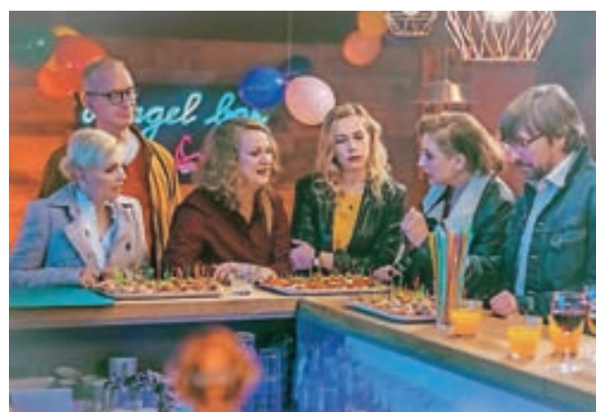
Mamam ni nikoli dolgčas.