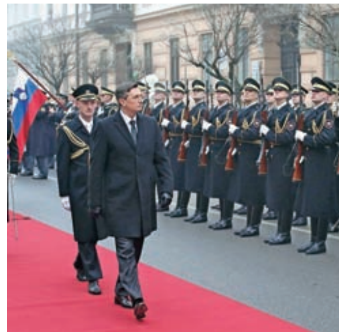
Začetek novega predsedniškega mandata s pregledom častne čete