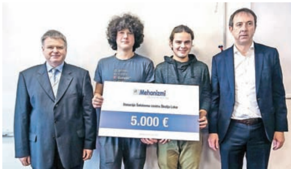
Z donacijo v višini pet tisoč evrov so v podjetju Iskra Mehanizmi podprli nakup orodjarskega rezkalnega stroja v Šolskem centru Škofja Loka.