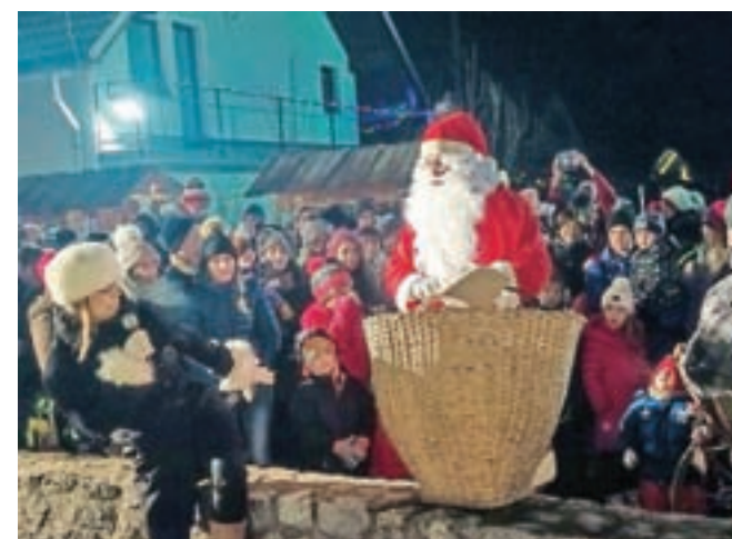
... Božiček se je še prej ustavil v Žiganji vasi. Povsod pa je otroke obdaril, ker so bili prav vsi celo leto zelo pridni.