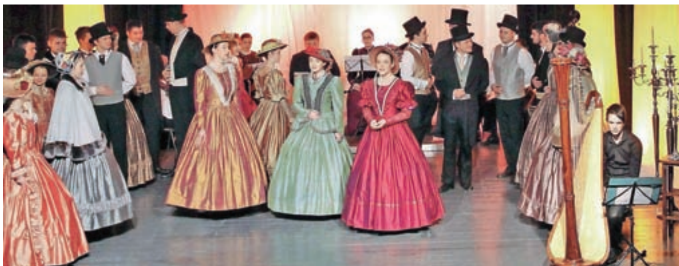
Eleganca, prefinjena diskretnost, zapeljivi pogledi, očarljivi nasmehi, lahkoten ples, ubrano petje in prijetno druženje ob živi glasbi so publiko na Grajskem plesu popeljali v pretekla časa.