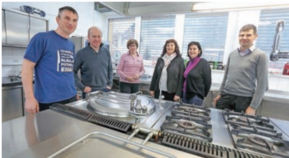
V kuhinji Osnovne šole Železniki

krožnikov. Vso hrano moramo po banjicah po šoli znesti v učilnice, v jedilnici je samo skupina, ki ima malico po telovadbi. Uporabnejši bodo njegovi predlogi za kosila, ki jih je okoli tristo. Pogrešam še nekaj: že nekaj let naročam sadje za shemo šolskega sadja, a ne morem v domačem okolju dobiti zadostnih količin. Domači pridelovalec bi lahko ob dobri letini ponudil svoj pridelek, ob slabši letini pa bi ga zagotovil od drugje, npr. iz Štajerske, saj je Slovenija dovolj majhna, da tudi širši okoliš lahko štejemo za lokalno.«