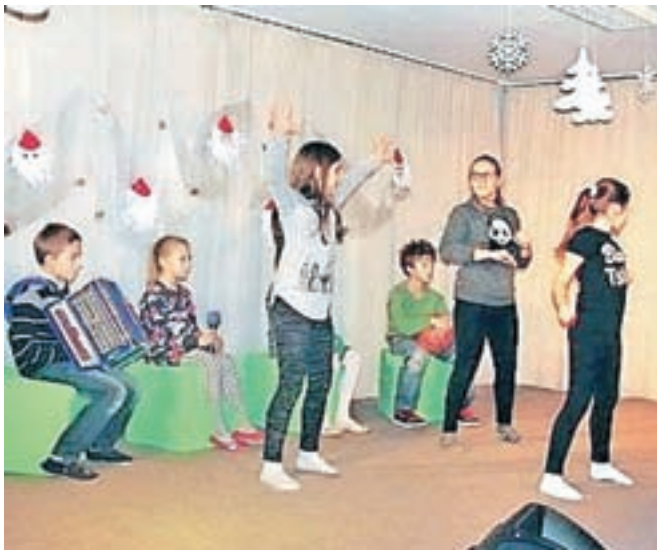
Na prireditvi so nastopili učenci Osnovne šole Orehek.