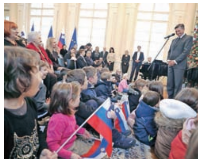
Ob dnevu odprtih vrat je v predsedniški palači Borut Pahor nagovoril tudi »najmlajše državljančke«.