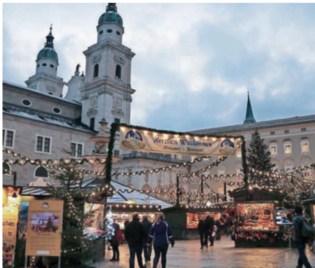
Že ob mraku božične stojnice s svojimi lučmi in lučkami še dodatno vabijo obiskovalce.

Avstrijski Salzburg spada med tista mesta, ki v pričakovanju božiča obiskovalce očarajo. Božični sejem Christkindelmarkt, pisana in pestra ponudba božičnih stojnic, pravljичno okrašeno mesto, božična glasba, vroča čokolada in seveda kuhano vino, ki ogreje tudi najbolj prezeble. Slab teden dni pred letošnjim božičem smo ga obiskali tudi izletniki Gorenjskega glasa.