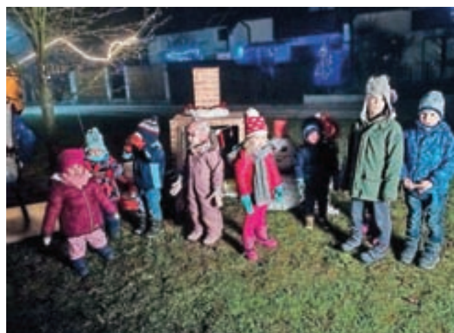
Najmlajši iz Zariške ulice na Drulovki so Božička zelo težko pričakovali ...