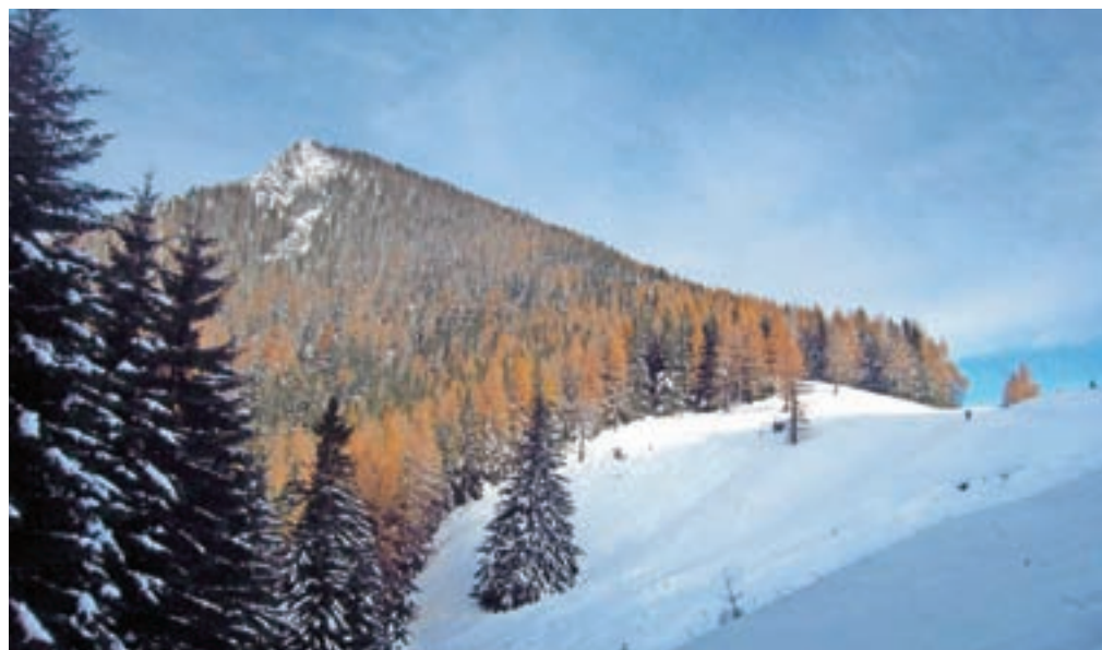
Pogled na Goli vrh z roba Jenkove planine

Nadmorska višina: 1787 m Višinska razlika: 800 m Trajanje: 4 ure Zahtevnost: ★★★★★