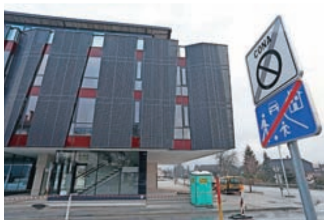
Glavna dela na stavbi nove knjižnice v Radovljici so zaključena, a treba bo kupiti še parkirna mesta v garažni hiši.