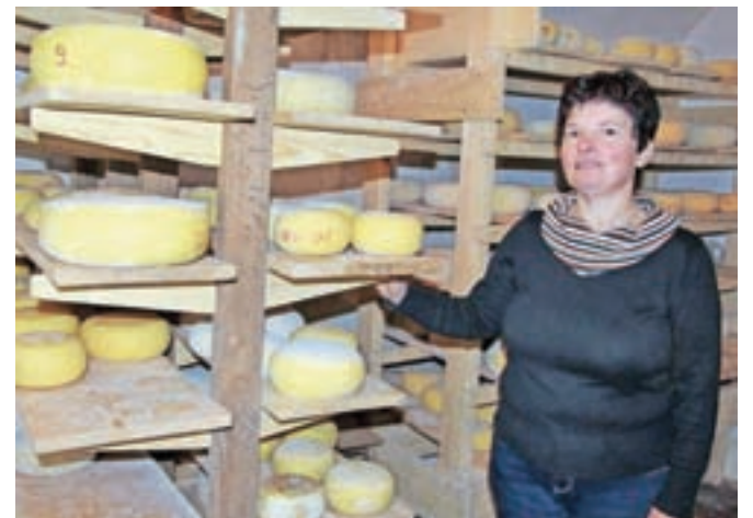
Glavna sirarka Danica v zorilnici sira

metrov gozdnega drevja. A še preden so veliko večino poškodovanega drevja pospravili, že se jim je odprla nova »fronta« – boj z lubadarjem, ki se je v poškodovanih in oslabilih gozdovih pretirano namnožil in je doslej napadel že okrog tisoč kubičnih metrov smreke. »V gozdu vse delamo sami, tako lahko tudi hitreje ukrepamo. Če bi najemali izvajalce,