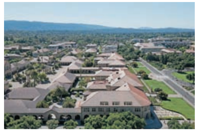
Tudi to je ameriško podeželje: campus univerze Stanford v Silicijevi dolini, leglo globalnega razvoja.