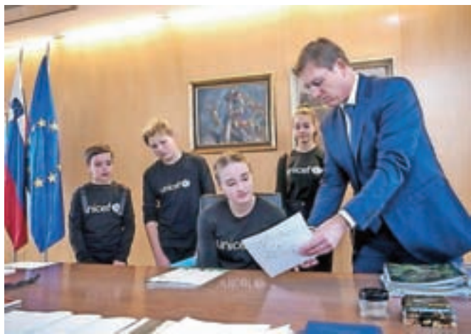
Na svetovni dan otroka so tudi otroci v Sloveniji simbolično prevzeli vodenje države.