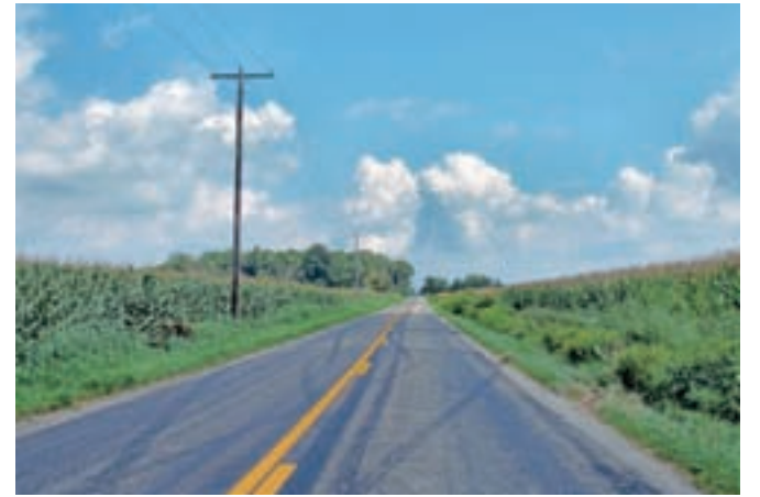
Cesta na ameriškem podeželju, Marshall County, Indiana. V kakšno prihodnost vodi?