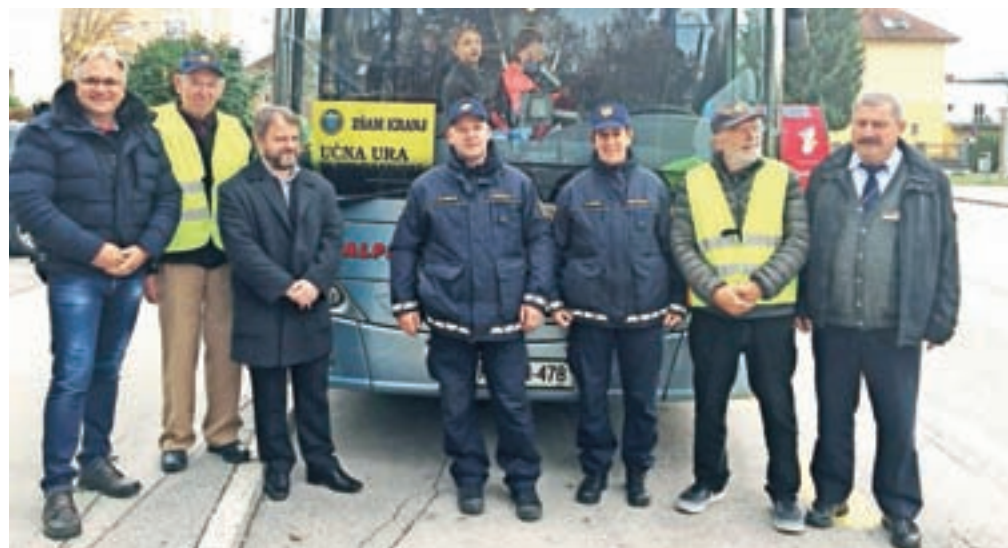
Vsi predavatelji z veseljem sodelujejo na avtobusni učni uri.

»Sodelovanje in zanimanje za promet s strani