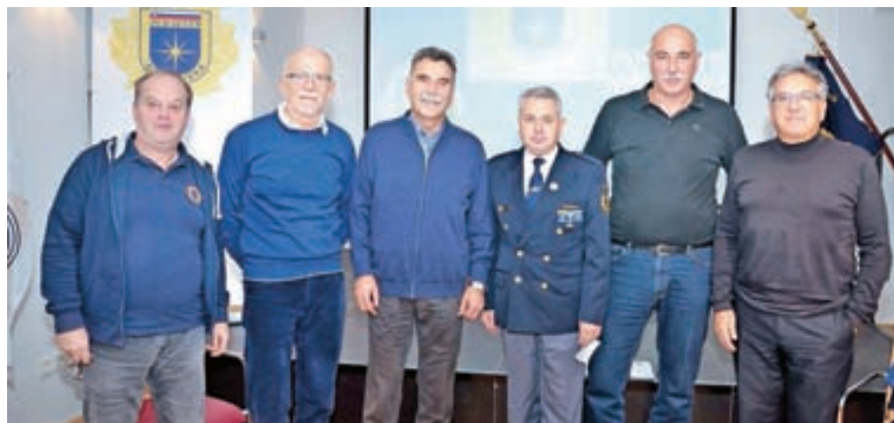
Udeleženci okrogle mize o vlogi kriminalistične službe v času osamosvojitve

vojno. Okroglo mizo, ki se je zaradi zanimive tematike zavlekla prek predvidenih časovnih okvirov, je povezovalce sklenil s hudo mušnim, a hkrati stvarnim pozivom nastopajočim, da o delovanju kriminalistične službe UNZ Kranj v tistem usodnem in zgodovinskem času poskušajo napisati knjigo ter tako zanamcem zapustijo tudi verodostojen sekundarni zgodovinski vir.