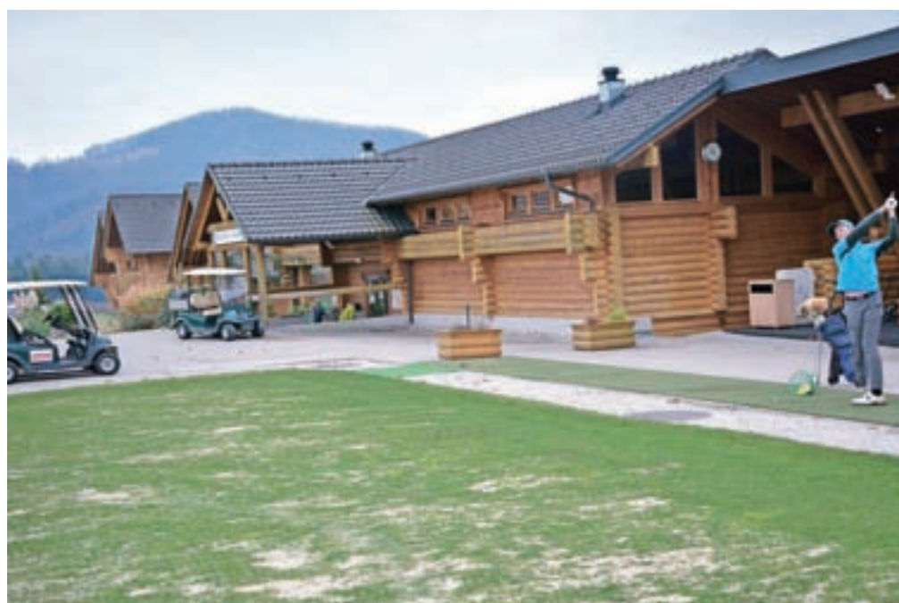
V Sberbank banki pravijo, da bo golfsko igrišče v Smledniku nemoteno delovalo in nudilo vsem uporabnikom igrišča storitve na najvišjem nivoju.