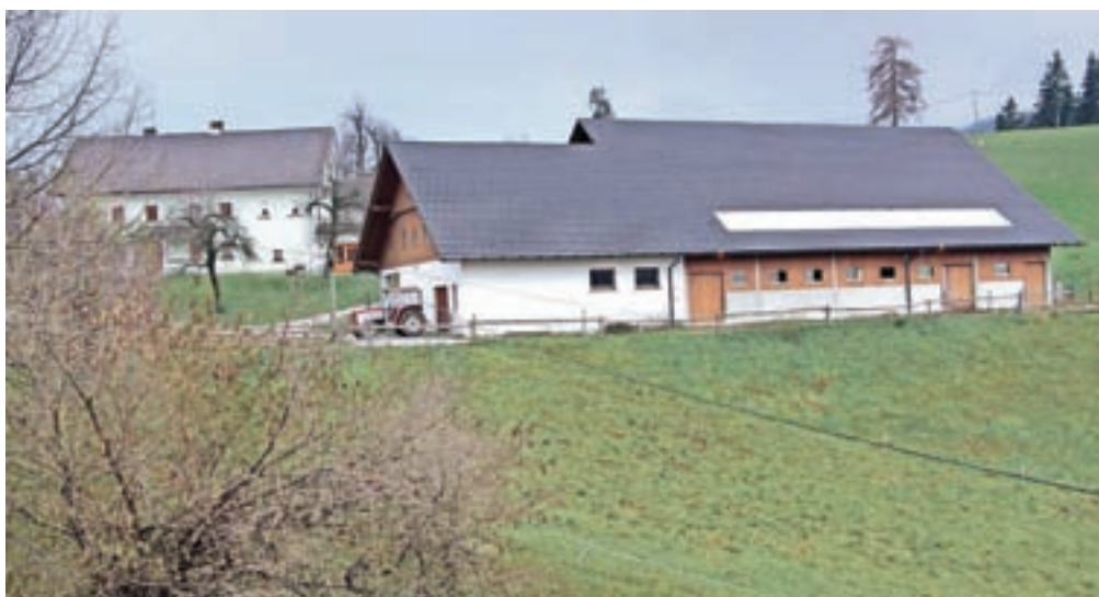
Domačija Leskovc, v ospredju novi hlev