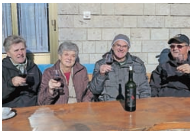
Čeprav brije burja, teran ogreje telo in dušo. / Foto: Grega Flajnik