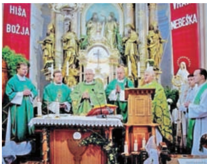
Obnovljen stranski oltar je blagoslovil ljubljanski nadškof in metropolit Stanislav Zore.