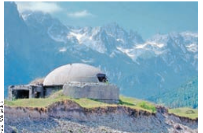
Pod komunizmom je bilo v Albaniji zgrajenih 175.000 bunkerjev proti zunanemu sovražniku. Obrambe pred krvnim maščevanjem med Albanci samimi pa še niso našli.