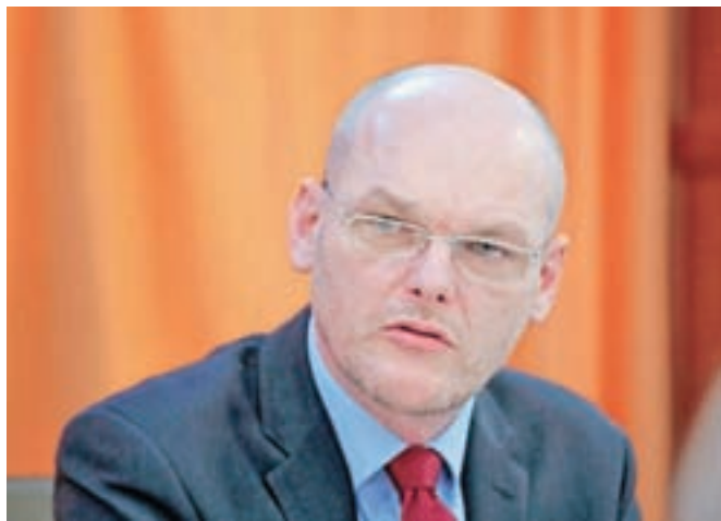
Goran Klemenčič po neuspelem poskusu interpelacije ostaja pravosodni minister.