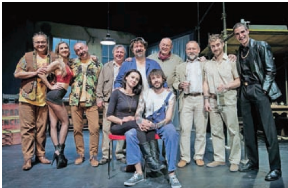
Moči v predstavi sta združili ekipe Gledališča Toneta Čufarja Jesenice in Šentjakobskega gledališča Ljubljana.

zu, lastniku avtomehanične delavnice. Med njima se počasi vzpostavi prijateljstvo, polno mojstrovih modrosti