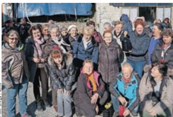
Naše Muce Copatarice so tudi z moško pomočjo spletle že več kot deset tisoč parov copatk za novorojenčke.