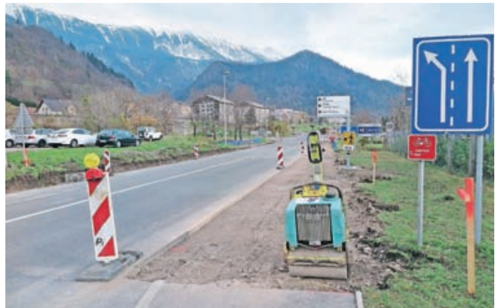
Obnova odseka ceste od Turista do Petrola naj bi bila zaključena že do konca meseca.

prihodnji teden se bo začela rekonstrukcija mostu čez potok Jesenica. V času izvedbe je na območju del predvidena polovična zapora ceste, popolna zapora po trenutnem načrtu ni predvidena,« so pojasnili na Občini Jesenice. Rok za izvedbo tega odseka je po pogodbi o sofinanciranju sicer junij 2018, vendar na občini predvidevajo, da se bo zaradi kasnejšega začetka del ta rok nekoliko podaljšal.