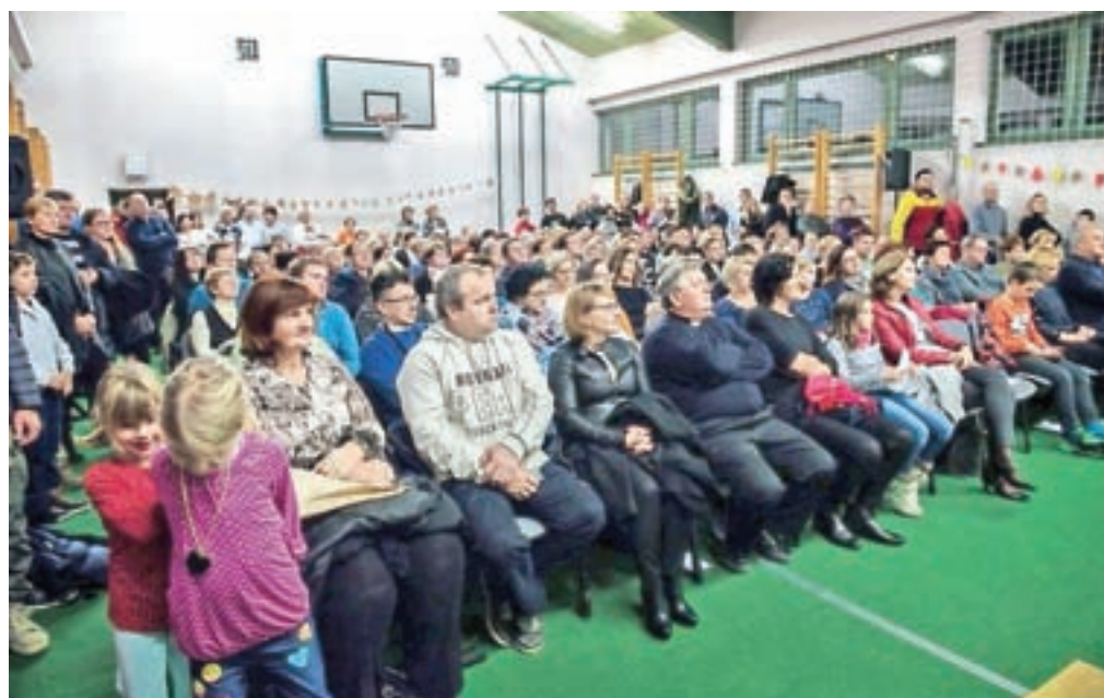
V Podružnični šoli Trstenik so v torek pripravili slovesnost ob dvajsetletnici ponovnega odprtja šole.