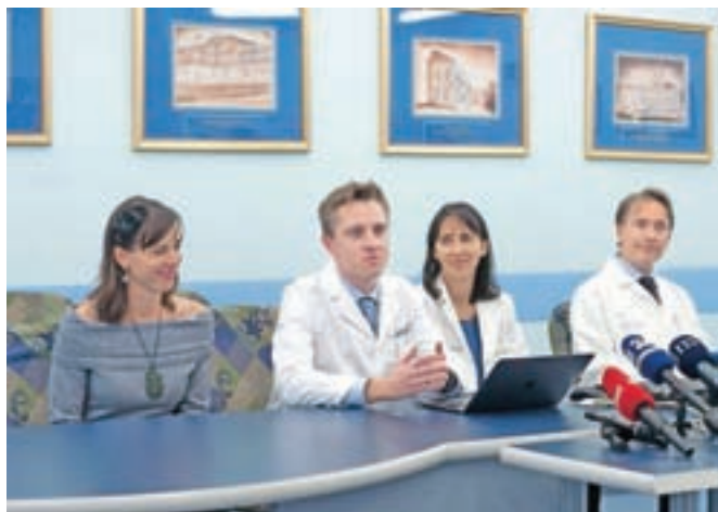
Na ljubljanskem kliničnem centru so predstavili odkritje novega gena za prezgodnje staranje.