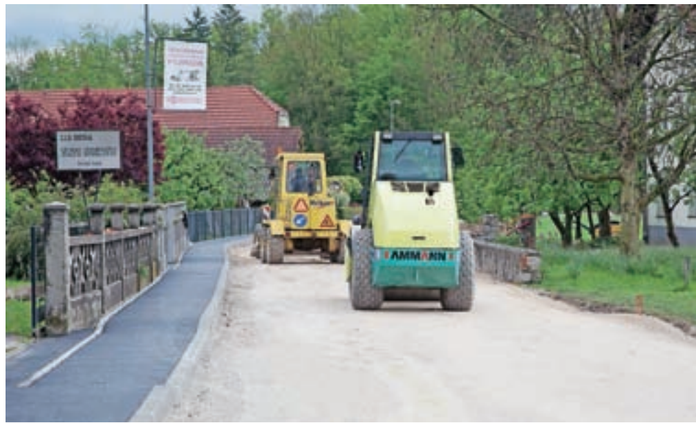
Spomladi so bila dela v občini še v polnem razmahu.

»Prav tako je zaključena sočasna obnova vodovoda in preostale komunalne infrastrukture, ki je potekala ob trasi kanalizacije. Za sočasno izvedbo kableske kanalizacije so bili na nekaterih odsekih tras zainteresirani tudi investitorji optičnega omrežja in TK-omrežja, v manjšem obsegu je