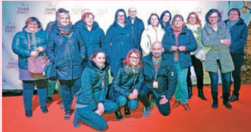
Glasovcem se je pred vhodom v rove pridružil tudi del organizatorske ekipe.

Razlog za zadovoljstvo imajo te dni tudi na Zavodu za turizem in kulturo Kranj, kjer so nadvse uspešno spravili pod streho že 10. Vinsko pot. V kranjskih rovih so v dveh koncih tedna gostili rekordno število razstavljalcev – kar šestdeset – pa tudi obiskovalcev. Našteli so jih več kot 4500, med zadnjimi pa smo se na Vinsko pot odpravili tudi nekateri sodelavci Gorenjskega glasa.