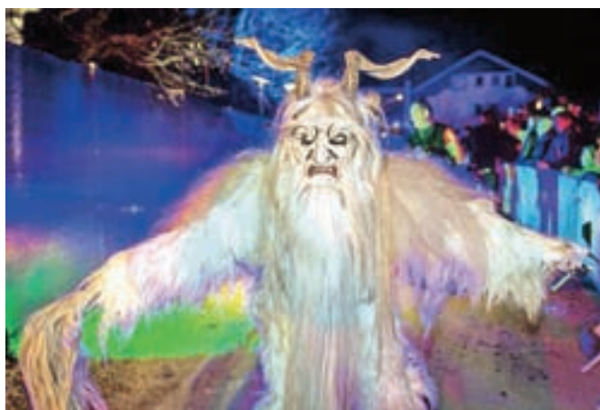
Vas je kaj strah?

rekordno število držav, iz katerih prihajajo parkeljni. Kaj si želimo lepšega kot to, da prireditve še naprej raste. To nam daje upanje in energijo za naslednje Noči parkeljnov. Po ocenah je letos prišlo šest tisoč obiskovalcev. Mislim, da je to najbolj obiskana tovrstna prireditve na svetu. Nikjer, kjer smo bili, ni toliko ljudi. Predstavlja se 27 skupin, vseh nastopajočih pa je več kot štiristo. Parkeljni so iz