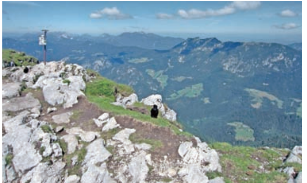
Razgled z vrha Raduhe proti Olševi