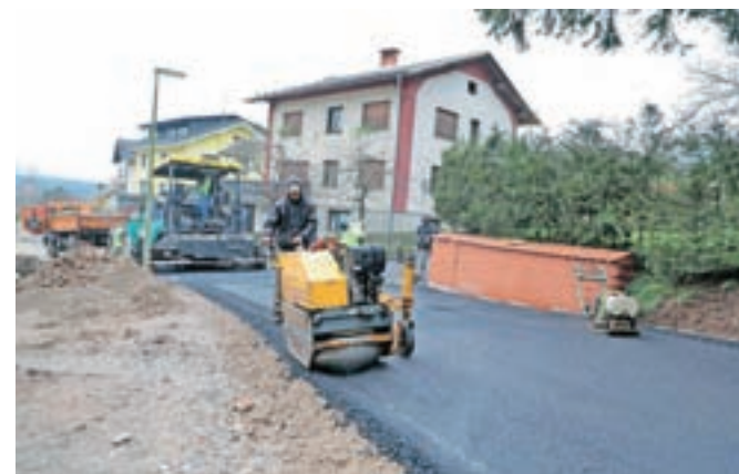
Z asfaltiranjem ceste proti Možjanci so končali drugo fazo gradnje kanalizacije v Tupaličah.