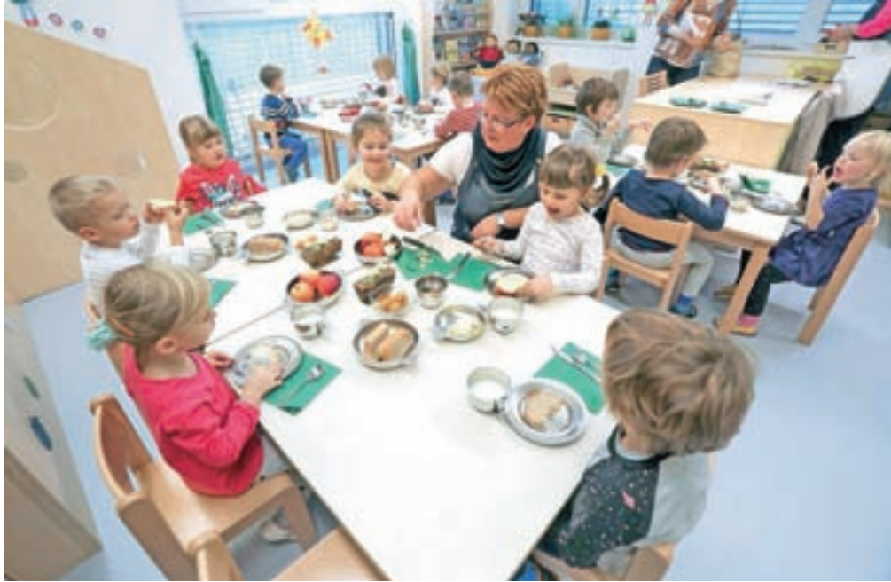
Tradicionalni slovenski zajtrk v vrtcu v Čirčah pri Kranju

Po podatkih kmetijskega ministrstva so se slovenskemu zajtrku pridružili vsi vzgojno-izobraževalni zavodi v Sloveniji, kar pomeni okoli 260 tisoč otrok. Zajtrk, ki je prvič potekal leta 2007 na pobudo ČZS,