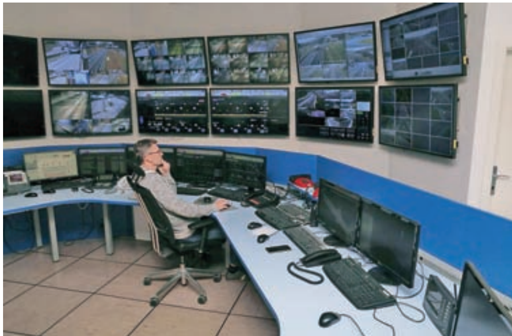
Operaterji pravijo, da je predor Karavanke (pokriva ga več kot dvajset kamer in nadzorni sistem) po prenovi ventilacije in nadzornih sistemov bistveno varnejši.