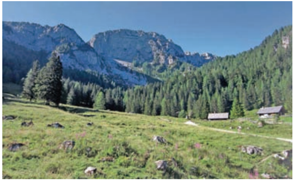
Pogled na Raduho od Bukovnika

pripelje do kočice GRZS, kjer zavijemo bolj proti levi. Prej široka pot zdaj postane ozka steza, ki se začne vse strmeje vzpenjati. Kmalu dosežemo križišče, kjer levo zavija zahtevna pot proti Durcam, mi pa zavijemo desno na zelo zahtevno pot proti Raduhi. Pot se najprej zmereno vzpenja skozi gozd, nato pa zavije v levo in preči strma pobočja pod Malo Raduho. Na tem mestu bi opozorila, da je pot polna zemlje, kamenja in korenin, zato je precej nevarna za zdrs. Ponekod si moramo za napredovanje pomagati tudi z rokami. Ko se pred nami pokažejo strme skale, pot zavije ostro levo. Če ne že prej, si na tem mestu nadenemo čelado, saj vstopamo v strmi, divji, skalni svet Raduhe. V spodnjem delu še ni jeklenic, ki pa jih kmalu dosežemo. Pot je dobro zavarovana in nas pelje po levem delu strme grape. Sledi tisti najbolj strm del vzpona, ki je odlično zavarovan. Severna stena Raduhe je resnično mogočna. Malce višje prečimo zagrščeno grapo, nato pa ponovno sledijo jeklenice in klini proti vrhu. Ko izstopimo iz zavarovane plezalne smeri, se še nekaj višinskih metrov strmo vzpenjamo po grebenu, ko se priključimo poti, ki na Raduho pripelje od Koče na Loki. Do vrha nas loči še nekaj minutk.