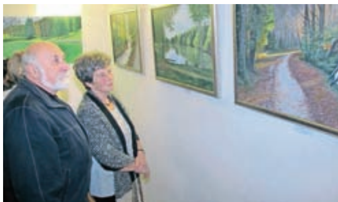
Razstava je deležna številnih pohval.