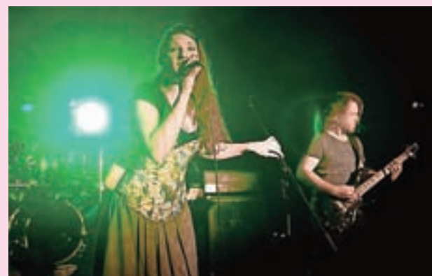
Sibirski veter je z odra Kluba Jedro odgnala – ali privabila – tudi zasedba Zaria.