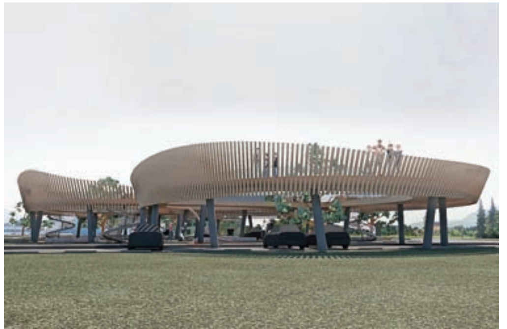
Garažni objekt, ki bi stal na zemljišču ob krožišču na avtocestnem izvozu za Lesce oziroma Bled, bi imel na vrhu tudi razledno ploščad.