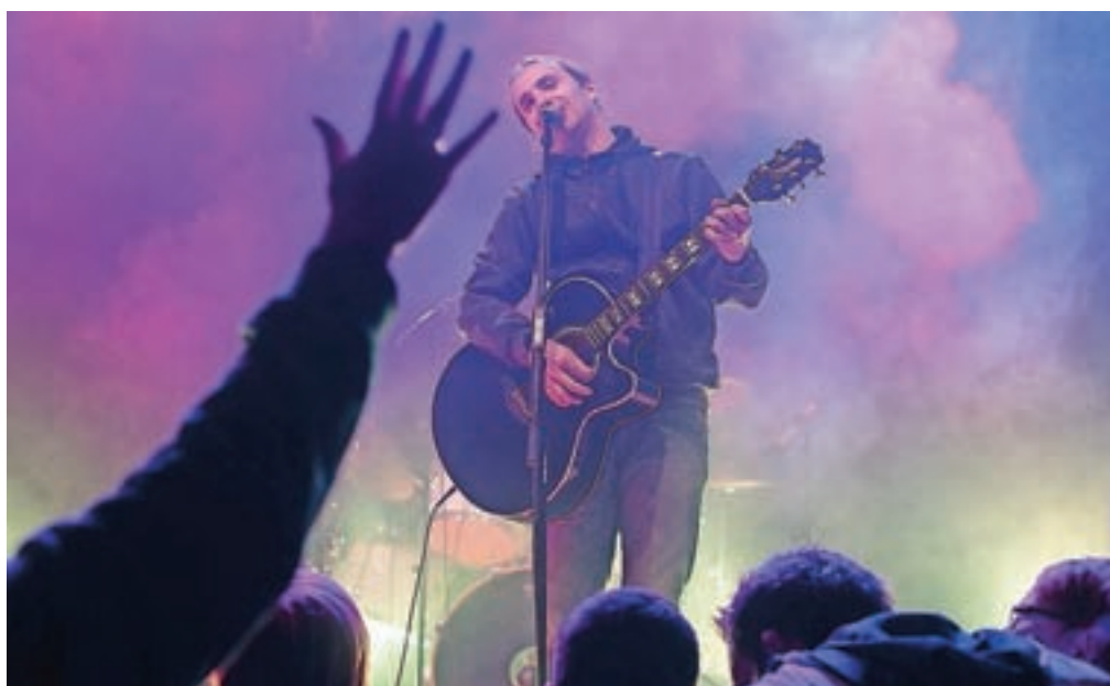
Na Primskovem tradicionalno nastopijo tudi Joške v'n. / Foto: arhiv GG (Matic Zorman)

Gas ter OF – Over Forty, obetajo pa se tudi mnoga presečenja. Dosedanji koncerti so se izkazali za pravo uspešnico, saj se vsako leto dogodka udeleži več kot tisoč petsto ljubiteljev dobrega žura in druženja s prijatelji vseh generacij. Veliko ljudi se srečuje po dolgih časih, tako se pleše, prepeva in družijo do jutranjih ur.