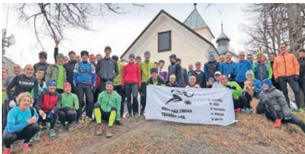
Skupinska fotografija na Svetem Joštu z delom udeležencev drugega kroga

se je pod Svetim Joštom zbralo devetdeset udeležencev, teden prej na odprtju sezone na Kališču celo več kot sto. Zmagovalca sta bila