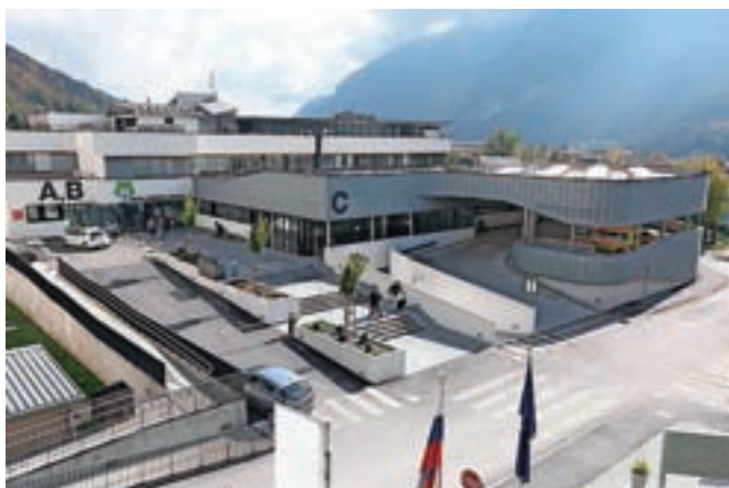
V Splošni bolnišnici Jesenice bodo s »finančno injekcijo« pokrili del preteklih izgub.

kumulativne izgube, ki je na dan 31. 12. 2016 znašala 3,9 milijona evrov. Zapadle obveznosti do dobaviteljev na dan 20. 11. 2017 sicer znašajo 3,3 milijona evrov. »Poleg zmanjšanja zapadlih obveznosti se bodo zmanjšale tudi naše obveznosti iz naslova zamudnih obrestí, ki so v zadnjih letih na letni ravni znašale tudi do 50 tisoč evrov,« je povedal Poklukar. Poleg finančne injekcije v obliki prejetih sredstev pa zakon predvideva tudi odpis terjatev iz naslova združevanja amortizacije v višini 2,5 milijona evrov.