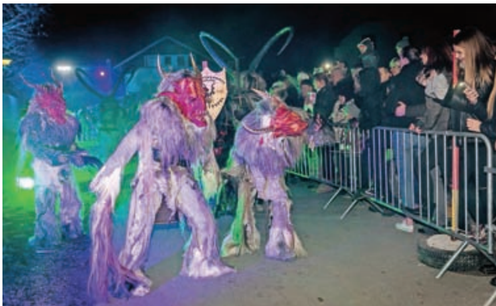
Letos se je predstavilo sedemindvajset skupin parkeljnov iz petih držav.

»Letos je leto rekordov. Rekordno je število obiskovalcev in nastopajočih,