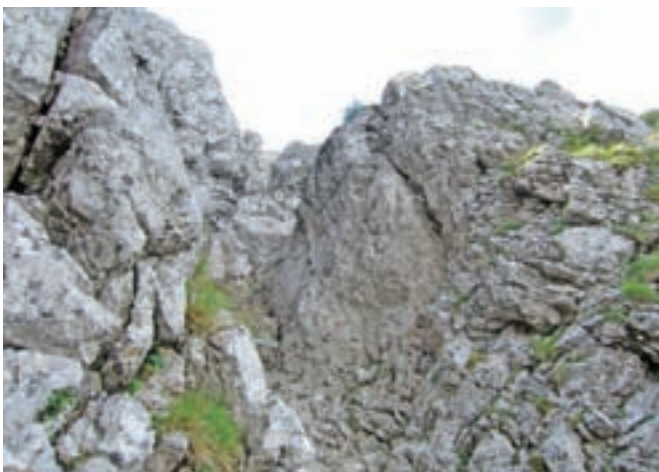
Divja severna stena Raduhe / Foto: Jelena Justin

Če bomo ujeli lepo vreme, bomo imeli na vrhu resnično fenomenalen razgled. Na severni strani se bomo pozdravili z našima starima znankama Olševo in Peco; na jugu so Rogatec in Lepenatka, Menina planina itd. Veličasten je pogled proti zahodu; pogled na Robanov kot, na koncu katerega stoji pregrada v obliki Ojstrice, za njo Planjava, Turska gora,