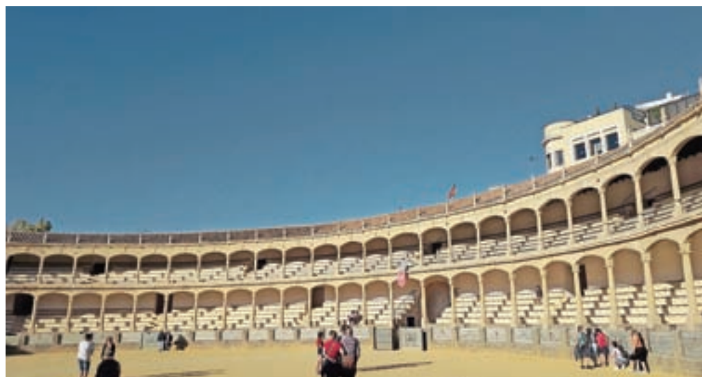
Osrednje mesto v Rondi pripada bikoborbam. Arena še vedno služi svojemu osnovnemu namenu, na voljo pa je tudi za turistične namene. V sklopu arene deluje še manjši muzej.

tisočletno muslimansko vladavino nad južno Španijo, pa je Ronda v Španiji in v svetu znana tudi kot kraj, kjer stoji najstarejša bikoborska arena na svetu – zagotovo je tudi ena od najbolj slikovitih. Prvo bikoborbo so v areni, kjer še vedno prirejajo bikoborbe, organizirali daljnega leta 1785 in arena še danes služi osnovnemu namenu.