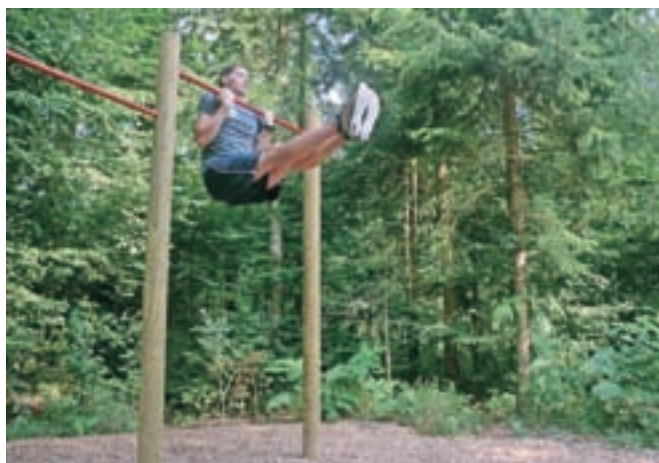
Osnovna vaja so zgibi. Položaj rok je v podprijemu, kar je lažje, ali nadprijemu.