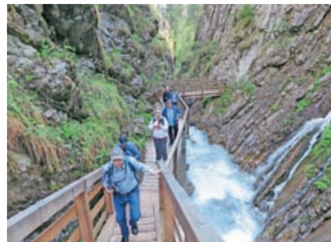
Zvoki vode in barvitost soteske nudijo poseben užitek.

kar nesete v usta, je v veselje brbončicam. Ne manjka pa sirov, sirnih namazov, jogurta. Privoščite si lahko doma vzrejenega piščanca in posebno vrsto svinjine domače svinje, značilne za to okolje. Sveže žemljice se ob stiskanju ne sploščijo, naravni sokovi so naravni. In le nekaj minut stran od hotela vam narava in okolje ponujata možnosti pohodništva in gorništva,