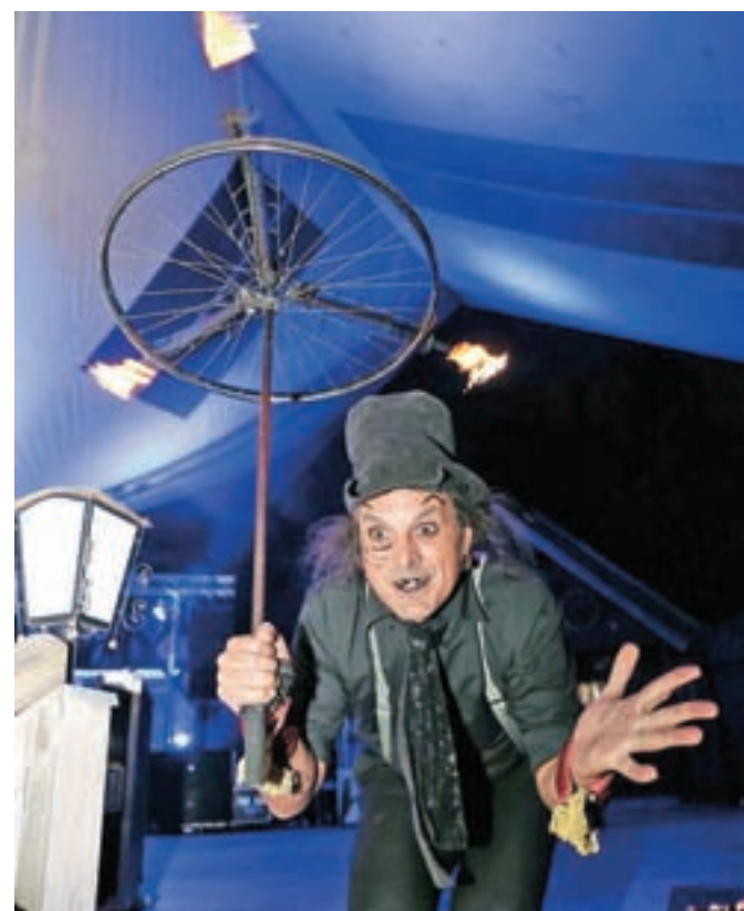
Čupakabra s svojo predstavo vedno očara.

narediti dogodek, ki so ga ljudje navajeni, jim dati čim več zabave – tudi za domačine, mladino, ki se lahko za en večer sprosti in zabava, potem pa gremo v nove zmage v drugem delu poletja.« Za razliko od Blejske noči pa v Bohinju ni manjkala ognjemet, ki so ga, kot pravi Sodja, pripravili zato, ker je ljudem to pač všeč in ga imajo radi: »Leta nazaj smo tekmovali,