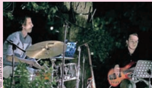
Pungert bo še do konca avgusta utripal v ritmihi džeza.