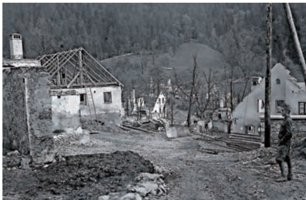
Razdejana Koroška Bela po napadu 14. avgusta 1917.