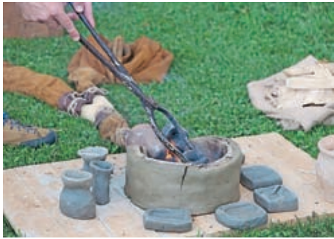
Obiskovalci so lahko talili tudi kovino.