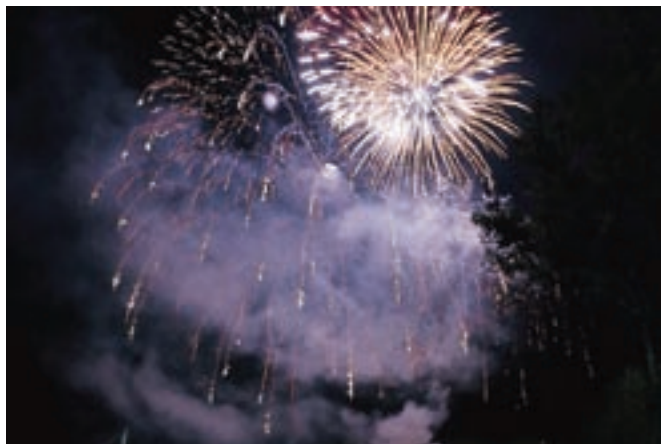
Bohinjsko nebo je razsvetlil ognjemet.