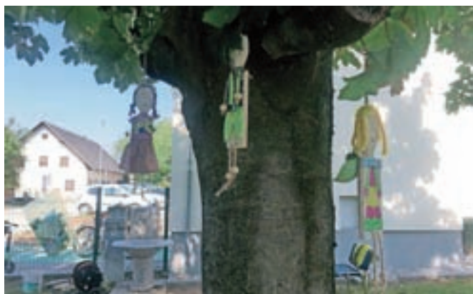
Izdelovali so punčke, fantke in angelčke iz kuhalnic.