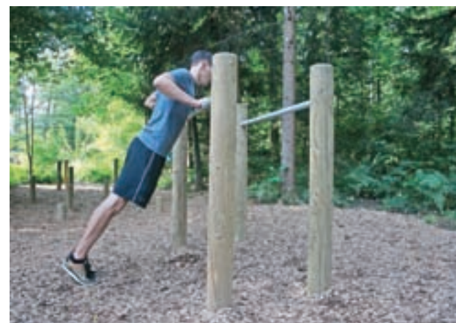
Lažja izvedba; lahko se uporabi tudi za učenje počepov ali za lažjo izvedbo sklec. Spustite se dol in gor ...

okrog petdeset minut, končan. Idealno je, če ga naredimo trikrat tedensko.« Kalan sicer poudarja, da je vadba pomemben del zdravega načina življenja, spremembe pa je treba narediti tudi na drugih področjih.