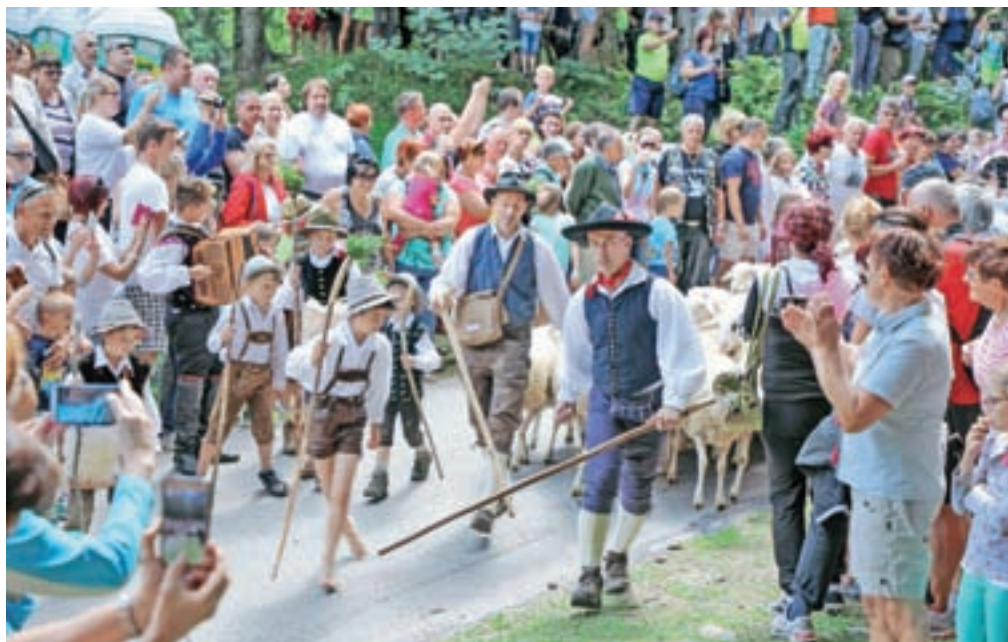
Tradicionalni prigon ovc s planin