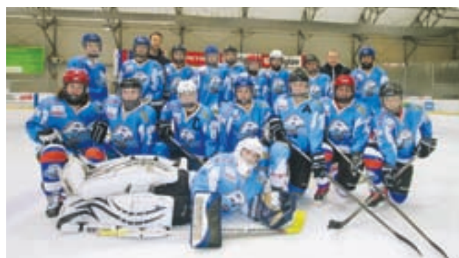
Ženska ekipa Triglava

kranjskega Triglava, saj bo Slovenija od 7. do 13. aprila 2018 na Bledu gostila svetovno prvenstvo za ženske Divizije II,