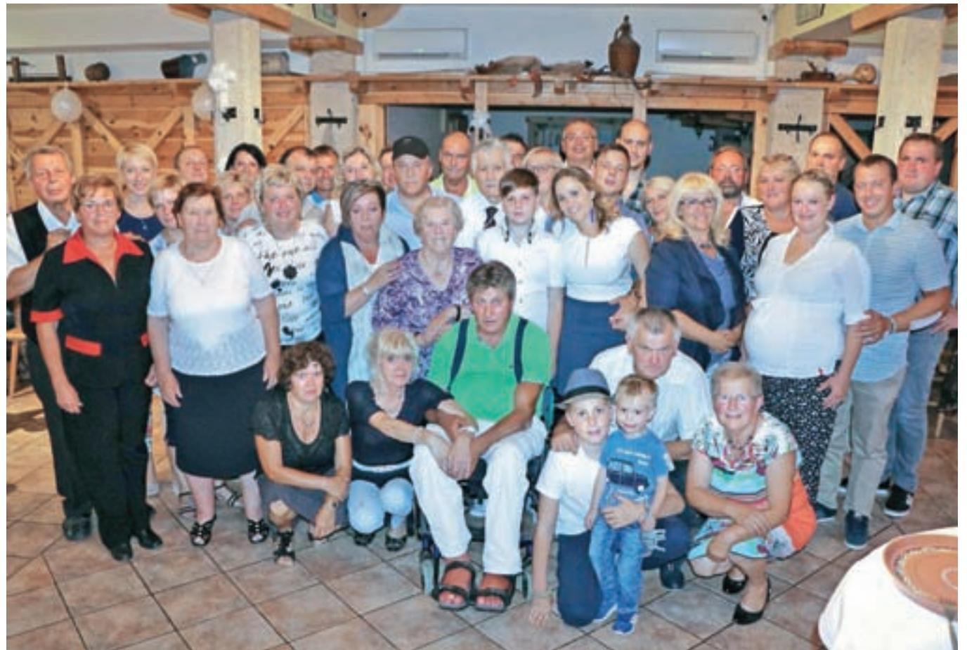
Na Jožetovi petdesetletnici ni manjkalo nasmejanih obrazov.

dopolnil petdeset let 25. julija, mlaj so mu postavljali dan prej in so ga pripeljali prav iz Velesovega. V Struževo je na praznovanje povabil nekaj dni kasneje sorodnike, prijatelje, sodelavce in nekdanje sodelavce. Ob okusni hrani in dobri glasbi se je praznovanje razživelo, dobre volje pa tudi ni zmanjkalo.