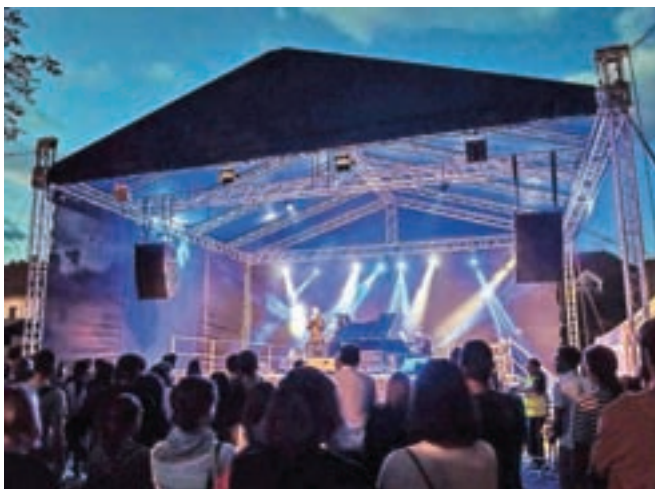
Glavni oder v Keršmančevem parku je v sobotnem večeru napolnil koncert izbranih tišin zasedbe Silence.