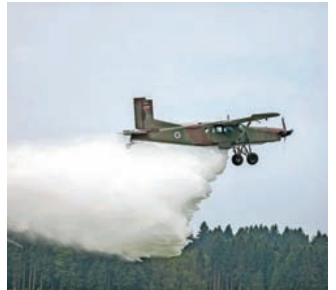
Zelo učinkoviti so pri gašenju požarov, saj turbopropellersko letalo z enim samim naletom odvrže približno osemsto litrov vode.

»Če primerjam letošnje podatke z lanskimi, je statistično zanimivo to, da smo lani v juniju opravili 21 reševalnih akcij, letos pa v istem mesecu 66. V juliju smo lani opravili 54 reševalnih akcij, letos pa 97. Tako lahko rečemo, da se je v poletnem obdobju število reševalnih akcij podvojilo,« je tudi povedal Lanišnik in pojasnil, da je razlog za manjše število opravljenih intervencij policijske letalske enote, da je policija sedaj bolj obremenjena v Mariboru pa tudi