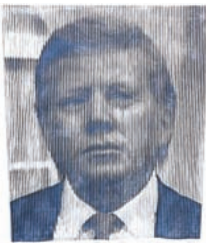
Donald Trump ali John F. Kennedy?