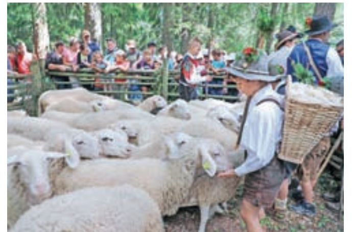
Za pastirski podmladek je poskrbljeno.