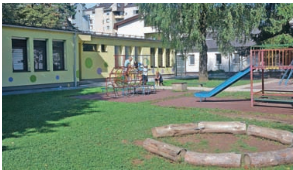
V enoti Pedenjped Vrtca Škofja Loka se bodo otroci razveselili šestih prenovljenih igralnic.