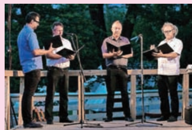
Kvartet Krt je postregel z domačimi skladbami, naslednji večer pa se je poklonil tudi nedavno preminulemu Vilku Ovseniku.