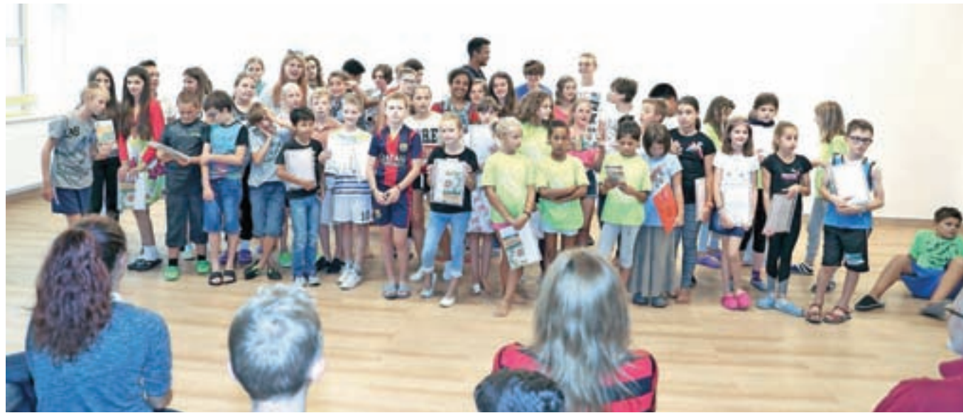
Ob zaključku poletne šole slovenščine

Zavod RS za šolstvo in Center šolskih in obšolskih dejavnosti (CŠOD) že šestindvajset let pripravljata poletno šolo slovenščine za otroke in mladostnike slovenskega porekla, ki živijo v tujini. Tokratne šole v Bohinju se je udeležilo dvainštirideset otrok iz štirinajstih držav.