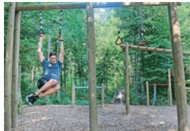
Delamo zgibe. Roke imamo v nadprijemu ali podprijemu. Lahko delamo tudi samo priteg nog k trupu ali priteg nog z rotacijo, kjer poskrbimo za upogibalke kolka in upogibalke trupa, če je to rotacija, pa še za stranske trebušne mišice.

splošno populacijo. »Izberemo vaje in startamo ali na časovno omejitev, 30 sekund vadbe in 30 sekund premora, ali na ponovitve, 10–12 ponovitev in premor. Naredimo tri kroge po deset vaj ali pa je vaj manj in več krogov. Na vsakem orodju lahko delamo primarno vajo, torej tisto, ki je zanj najbolj značilna. Za splošno populacijo so to velikokrat pretežke vaje, zato jih prilagodimo. Na orodja lahko vpneemo tudi kakšne pripomočke, kot so na primer trakovi za TRX-vadbo. Možnosti je veliko,« še pravi Kalan iz Bodi v formi trening studia in predstavi zaključni del treninga – ohlajanje: »Tudi tukaj so možnosti različne. Idealno je, če raztegnemo večje mišične skupine in se sprehodimo do doma. S tem je trening, ki skupaj traja