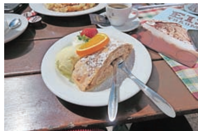
Pridih avstrijskega: jabolčni zavitek in vanilijev sladoleđ