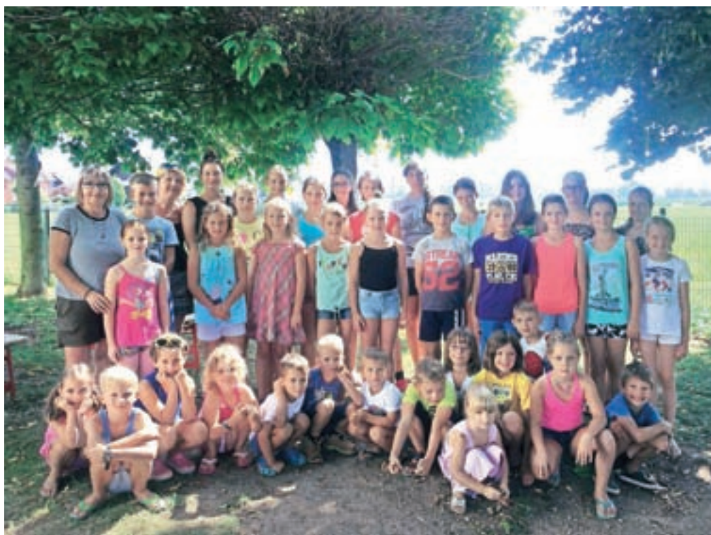
Živ žav je obiskalo štirideset otrok iz celotne občine Šenčur.

Z e deseto leto Kulturno društvo Valentin Kokalj na Visokem organizira poletni Živ žav. V senci za kulturnim domom so otroci mirno sedeli in čakali na navdila animatork. Živ žav poteka en teden, ponavadi prvi teden v avgustu. Letos je bilo kar štirideset otrok, starih od štiri do trinajst let. Otroci so prišli iz cele občine Šenčur, pet animatorjev, ki delajo prostovoljno, pa je mlade nadobudneže urilo v raznih veščinah. V dveurnih delavnicah so izdelovali punčke, fantke in angelčke iz kuhalnic, vaze, okrašene z volno, v njih pa rože iz papirja. Naučili so se tudi šivati, navaden in pravi šiv, izdelali so torbice za deklice, ovitke za telefone in obeske za ključe. Zadnji dan so ustvarjali ogrlice in zapestnice iz