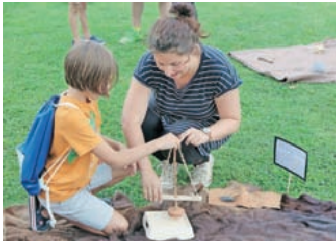
Veščine iz pradavnine so zanimive za vse generacije.

iz Skupine Stik. V veščinah iz pradavnine se niso preizkušali le najmlajši, saj je marsikateri izziv pritegnil tudi njihove starše. »Opažamo, da se prav vsi radi opogumijo in se z lastnimi rokami udeležijo delavnic, starostne omejitve tu res ni, odrasle predvsem zanima ta eksperimentalni vidik, sploh metalurgija,« še dodaja.