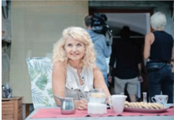
Cvetko, mamu mlade fotografinke Laure, igra Tanja Dimitrievska.