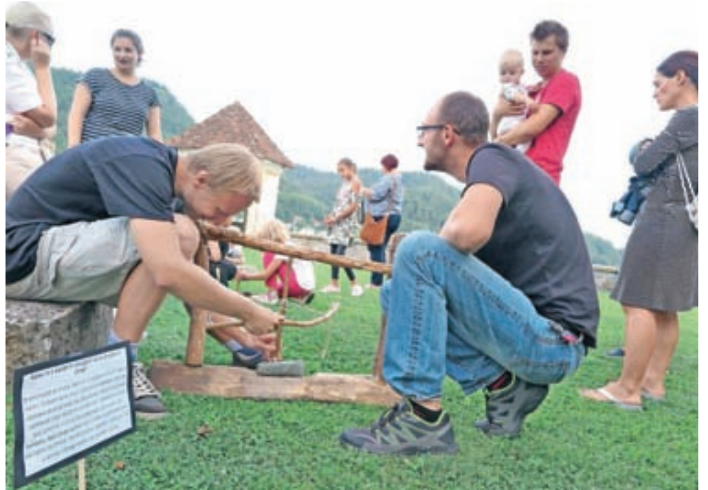
Vrtanje luknje z lokom v kamnito sekuro