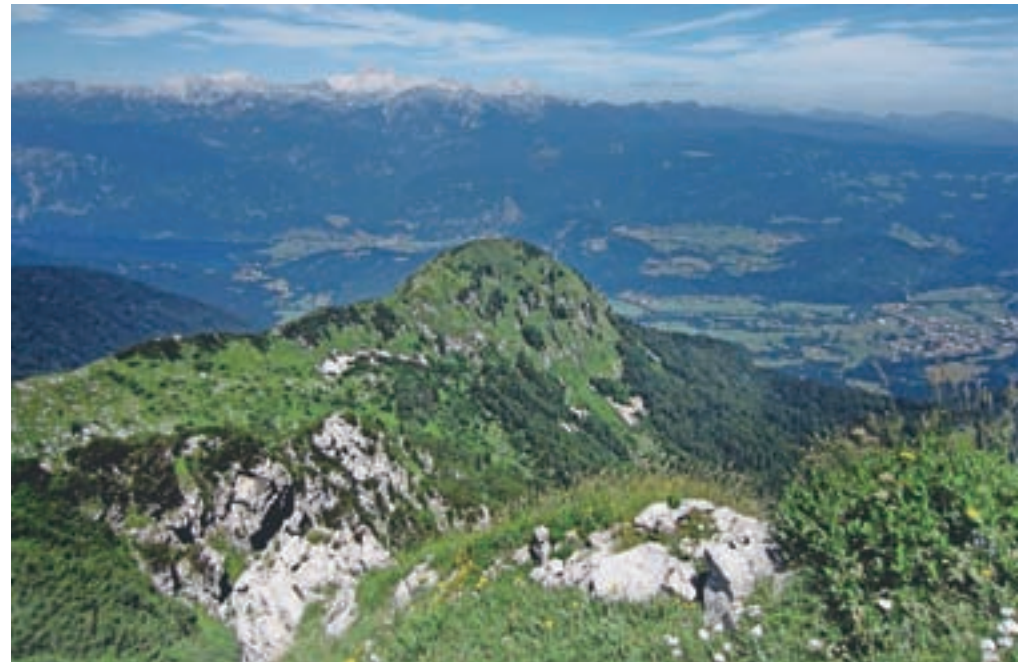
Pogled na Lisec z grebena Spodnjih bohinjskih gora

nekoč vodile proti Črni prsti. Vzpnemo se mimo skal, ko steza začne zavijati v desno. Na drevesu opazimo tudi rdeče trakove, ki bodo naši smerokazi. Pri velikem balvanu, iz katerega rastejo drevesa, nasproti pa je nekaj podrtih smrek, zavijemo levo. Vidimo tudi trakec. Od tod dalje je vzpon orientacijsko nezahteven, kljub temu da hodimo po uradno neoznačeni stezi. Ponekod precej zaraščena steza poteka skozi »žbunje«, kot rada rečem. Skratka, okoli steze je precej gostega zelenja, zanimiva flora z ogromno cvetja. Pot z vsakim višinskim metrom postaja bolj strma. Ko pride mo ven iz gozda, je okolica še vedno obdana z bujnim zelenjem. Prečimo v levo, nato pa zavijemo desno pri velikih kamnih, ki so se sredi tega zelenja vzeli od ne vem kod. Na vrhu kamenja pot zavije desno in zagledali bomo cvetočo alpsko možino.