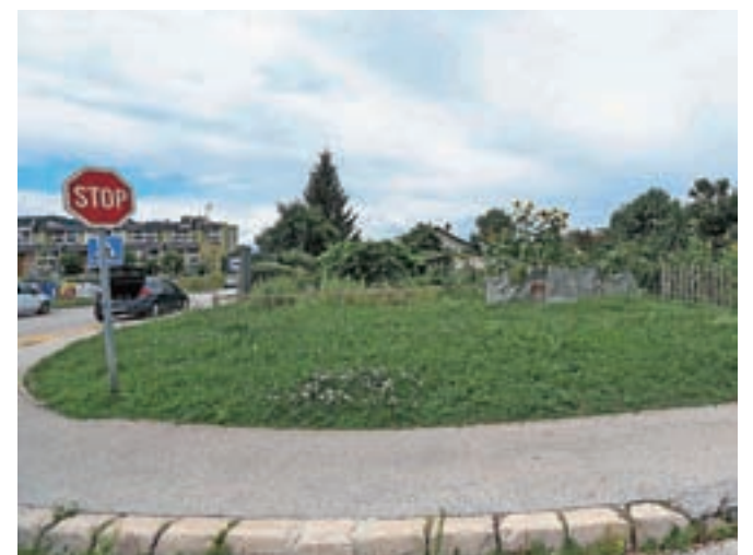
Jeseni naj bi na Planini v Kranju začeli urejati pasji park.

»Res želimo na območju soseske Planina urediti park za kučke. Tako trenutno poteka odmera zemljišč in usklajevanje z lastniki sosednjih parcel. Nadaljnji koraki za ureditev tega parka bodo izvedeni po uskladi-