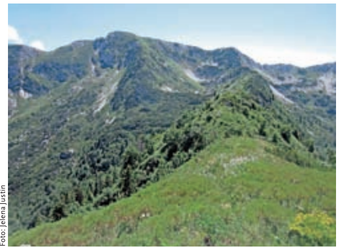
Pogled na greben Spodnjih bohinjskih gora z Lisca

Do sedla nas loči še nekaj minut. Na sedlu se obrnemo desno in nadaljujemo naprej po grebenu. V