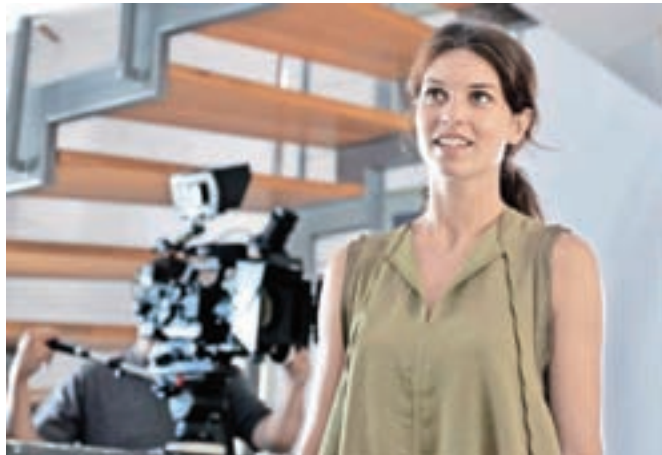
Laura (Lea Mihevc) je lik, ki bo vnesel v Eno zlahtno štorijo veliko nemira.

Gorenskega predstavnika med predstavljenimi nismo zasledili – kandidate so javnosti namreč že predstavili; ti pa bodo čez poletje prebirali srčna pisma, potem se pa seveda odločili in nove ljubezenske zgodbe se bodo začele.