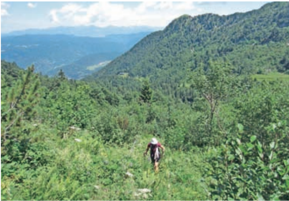
Vzpon na greben Lisca

Od koč sestopimo do stare sirarne in po zeleni dolinici mimo vodnega bajerja. Usmerimo se na zgornjo, levo stezo in precej hitro bomo naleteli na obledele stare markacije, ki so