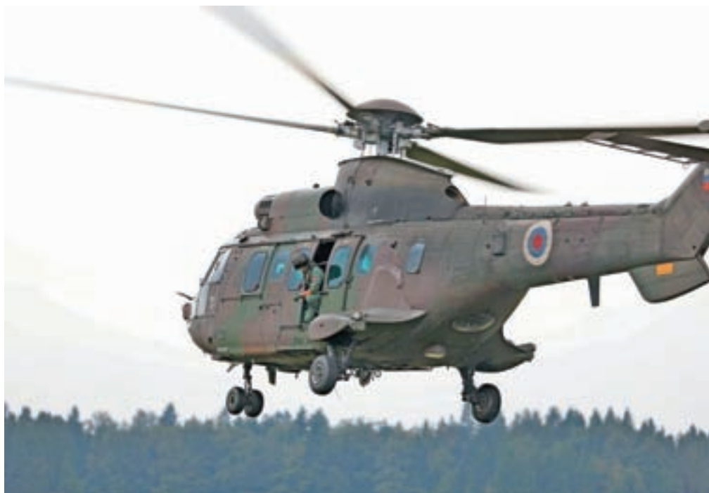
Največkrat helikopterji posredujejo pri nujni medicinski pomoči.

Kot je tudi povedal Lanišnik, z obstoječimi 21 posadkami trenutno naloge še lahko opravljajo, vendar so na zgornji meji zmogljivosti. »Trend pa je takšen, da bo nalog vse več in več, pri čemer floskula, da lahko z manj naredimo več, v letalstvu ne velja,« je dejal Lanišnik in pojasnil, da so sicer relativno dobro opremljeni, vendar so helikopterji znamke Bell 412 po dvajsetih letih operativnih nalog že rahlo zastareli in potrebni nadgradnje. Kot je pojasnil, bi morali predvsem nadgraditi repni rotor in radijske postaje.