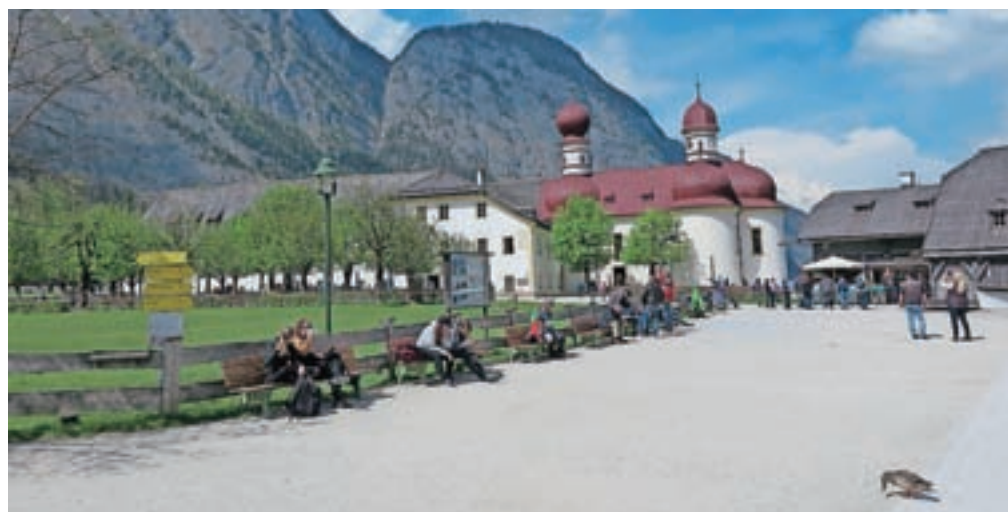
Cerkev sv. Jerneja oz. Bartolomeja je podoba s kupolnimi strehami dobila v dobi baroka.

do prve kočice, v gore ali pač po prvem nežnem vzponu plačate dva evra, odprejo se železna vratca in uživate ob zvokih ter barvah, ki vam jih ponuja soteska.