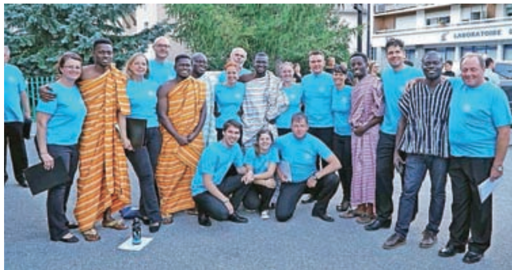
V Mysteriumu vedno znova dokazujejo, da zborovsko petje ne pozna meja.

Kranj – Choralp se vsako leto poleti odvija v idiličnem visokoležečem srednjeveškem mestecu Briançon v francoskih Alpah. Teden dni v juliju mesto preplavijo ubrani glasovi pevcev iz različnih delov sveta. Letos so na festivalu sodelovali pevski zbori One Voice Choir iz Gane, Vox Human z Madžarskega, Vox Disposa iz Konga, KPZ Mysterium iz Slovenije ter veliko posameznikov iz Francije, Belgije, Švice, Italije in od drugod. Skupaj je na festivalu