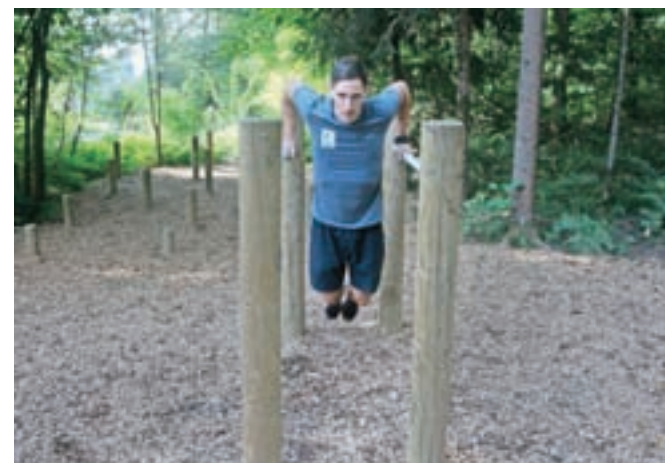
Težja izvedba; primarno je orodje namenjeno izvedbi sklecov.