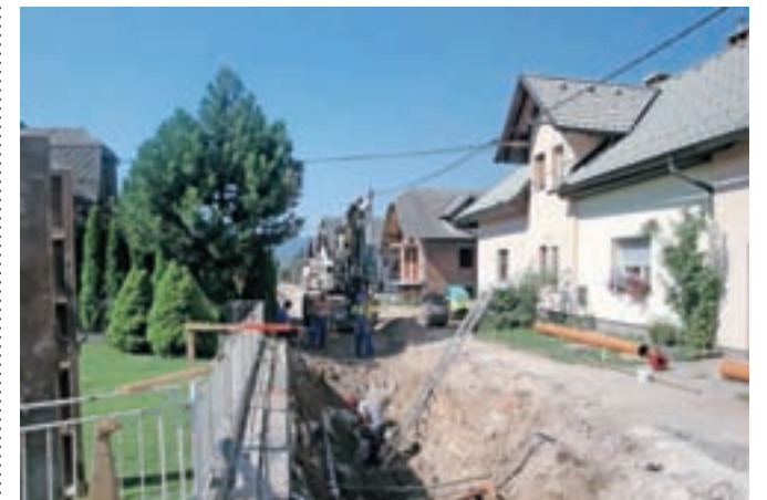
Breg je zadnje naselje v občini, ki še nima zgrajene kanalizacije.