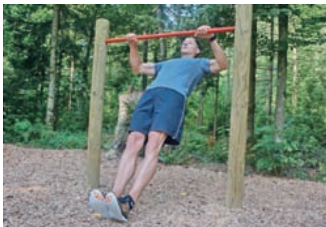
Lažja izvedba je vaja veslanja, kjer je začetni položaj vesa v opori in sledi priteg trupa k drogu.

okrog petdeset minut, končan. Idealno je, če ga naredimo trikrat tedensko.« Kalan sicer poudarja, da je vadba pomemben del zdravega načina življenja, spremembe pa je treba narediti tudi na drugih področjih.