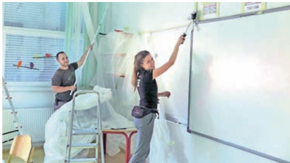
V Mojstrani so se lotili pleskanja šolskih učilnic in igralnic v vrtcu.

Ena od skupin je tako pleskala učilnice in igralnice mojstranskega vrtca in