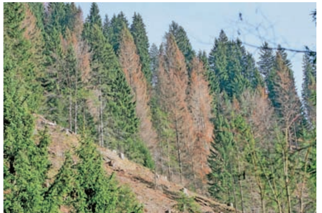
Smrekov lubadar povzroča škodo tudi v gozdovih v Zgornjesavski dolini.