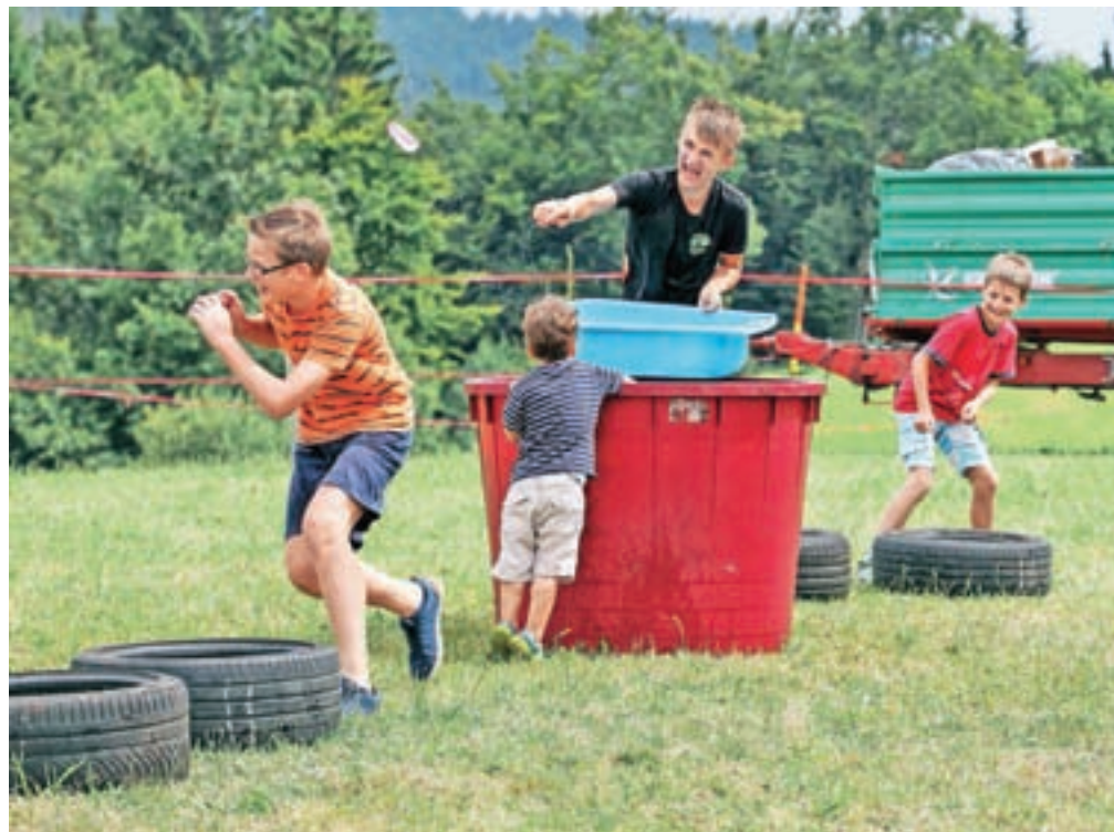
Poletna osvežitev z vodnimi balončki na Prazniku žetve na Žirovskem vrhu