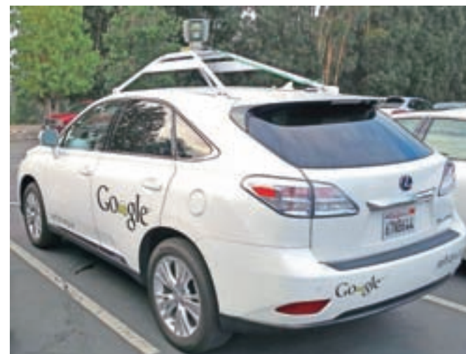
Samovozeči avto (self driving car), nastal v sodelovanju družb Google in Lexus