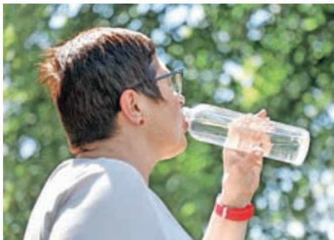
Slovenijo je zadel četrti vročinski val, najhujši letos, s temperaturami blizu 40 stopinj.