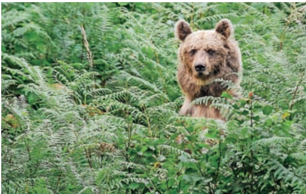
V gozdu bodimo glasni, da medveda opozorimo na svojo prisotnost in se nam sam umakne. (Fotografija je simbolična.)

Na Zavodu za gozdove prav tako priporočajo, da prebivalci v okolici svojih domov ne puščajo organskih odpadkov in hrane. Problematične so predvsem smeti, klavniški odpadki, nezavarovani čebelnjaki, smetnjaki in kompost. To namreč privablja medveda v človekovo bližino in predstavlja enega ključnih vzrokov težav z medvedom.