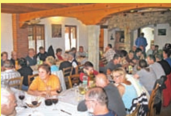
Okusno kosilo po trgatvi