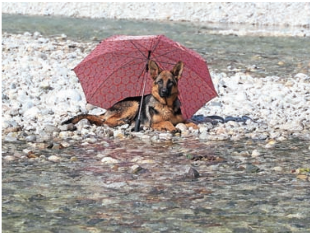
Tudi živalim je vroče, senca in bližina reke sta prijetna osvežitev.

Sobe pacientov v jeseniški bolnišnici in tudi sobe v domovih starejših v Kranju in Tržiču niso klimatizirane, povsod pa so povedali, da poskušajo vzdrževati primerno temperaturo tako, da senčijo in zapirajo okna čez dan, zračijo pa ponoči. Hidriranje še posebno skrbno spremljajo pri nepokretnih pacientih in stanovalcih, na splošno je na vseh omenjenih lokacijah na voljo dovolj osvežilnih napitkov (tudi za