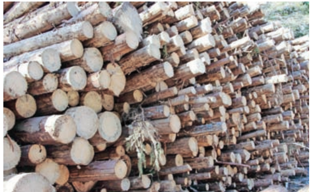
Pri vsakem »kubiku« lubadark je po oceni gozdarjev približno trideset evrov škode.

je razširil tudi v višje ležeče gozdove, na platoje Jelovice, Pokljuke in Mežaklje ter v Karavanke, kjer so najlepší smrekovi sestoji. Platoje Pokljuke in Jelovice 'branimo' pred novimi napadi lubadarja s takojšnjim ukrepanjem. Tam, kjer je lastnica