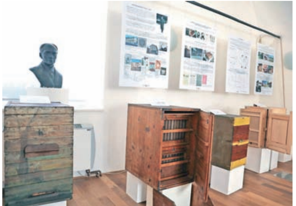
Na razstavi, ki so jo pripravili v Čebelarskem muzeju v Radovljici, je na ogled gradivo iz muzejskih zbirk, ter gradivo, ki so ga muzealci evidentirali na terenu.