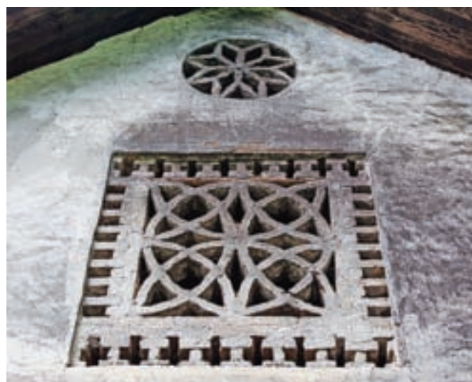
Domišljija pri gradnji opečnih prezračevalnih mrež je brezmejna.

ki so prisotni že na lončevini iz kamene dobe. V primeru lin se stvar le reciklira na drugačen način. Opečne mreže so dokaz, da ekspresivnost ljudske tvornosti in stavbarstva presega funkcionalnost in posega tudi na področje umetnosti. Priča nam o spretnosti in estetskem