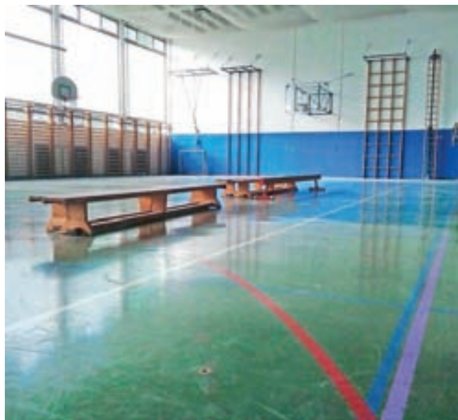
Prenova poda s športnim parketom v telovadnici Osnovne šole Simona Jenka Smlednik je nujno potrebna za izboljšanje varnosti.