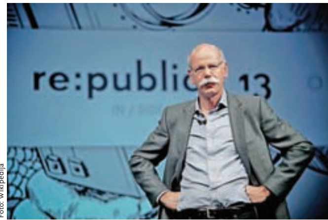
Dieter Zetsche (1953) je že 11 let predsednik avtomobilskega koncerna Daimler in eden najbolje plačanih nemških menedžerjev, lani je na svoj račun dobil 7,6 milijona evrov.