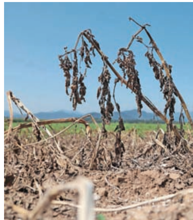
Premalo vode in ekstremne temperature. Posledice so vidne tudi na krompirju.

Pravilnik o zahtevah za zagotavljanje varnosti in zdravja delavcev na delovnih mestih v svojem 25. členu opredeljuje temperaturo zraka, ki jo morajo delodajalci zagotavljati v delovnih prostorih, ta ne sme preseči 28 stopinj Celzija, razen v t. i. vročih delovnih prostorih, kjer so temperature povečane zaradi delovne opreme (na primer peči), a mora delodajalec v tem primeru sprejeti potrebne druge ukrepe, kot so npr. pogostejši in daljši odmori med delovnim časom. Republiški inšpektorat za delo je sicer letos do zdaj ugotovil 24 kršitev 25. člena pravilnika. Pravilnik pa