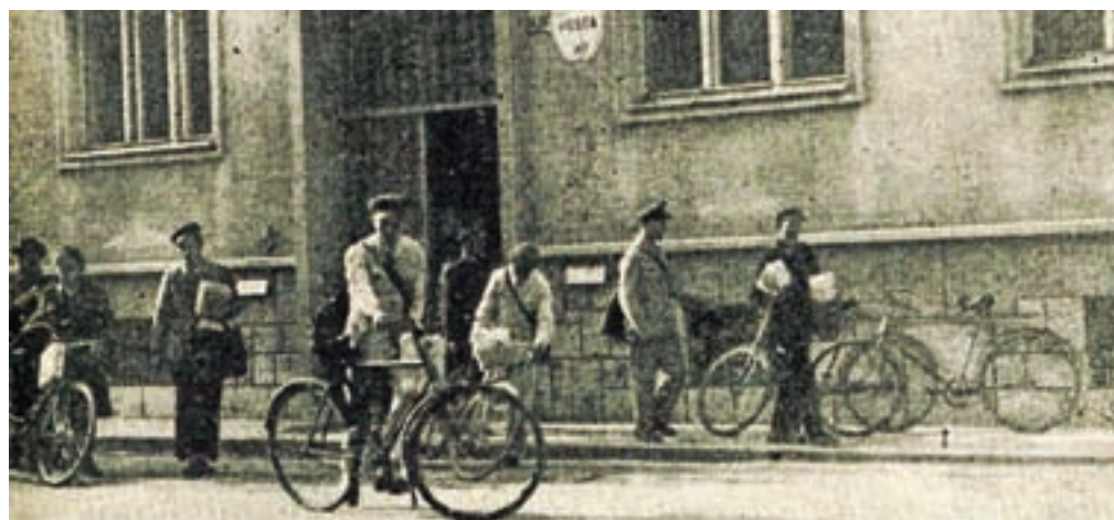
Takole so poštarji leta 1952 ob osmih zjutraj odhajali iz poslopja kranjske pošte. Vsak dan so morali prepešati ali prekolesariti 150 kilometrov in dostaviti 2400 pošiljk, med njimi enkrat tedensko tudi Gorenjski glas.