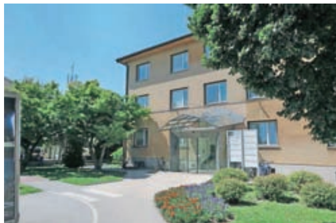
Hiša Na Ljubljanski 70 je v pretežni lasti občine Domžale, kjer že iščejo nove najemnike.

Zaradi selitve vrtca s Savske bo treba zdaj najti tudi nove vsebine za prazno stavbo na Savski 3, ki ima odlično lokacijo v središču mesta in velik vrt, a z iskanjem najemnika na občini ne bodo hiteli, saj si želijo prednosti te nepremičnine kar najbolje izkoristiti.