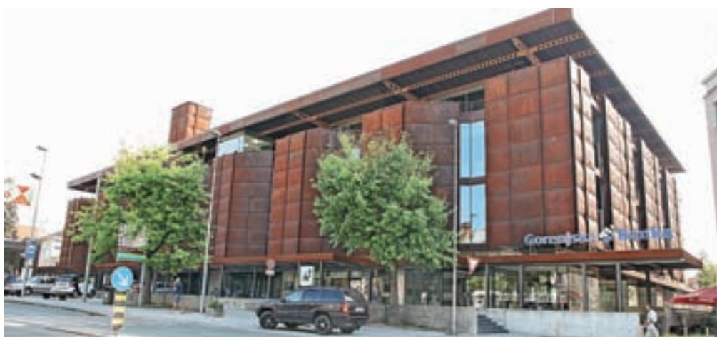
Na nedavni dražbi za Globus ni bilo zanimanja.

V okviru stečajnega postopka so doslej unovčili za nekaj več kot 178 tisoč evrov stečajne mase, vrednost stečajne mase, ki je še niso unovčili, pa predstavljajo nepremičnine, umetniška dela in terjatve do dolžnikov. Cenilec je nepremičnine ocenil na 5,7 milijona evrov, njihova likvidacijska vrednost pa je 3.645.000 evrov. Med terjatvami do dolžnikov sta največji terjatvi do Franca