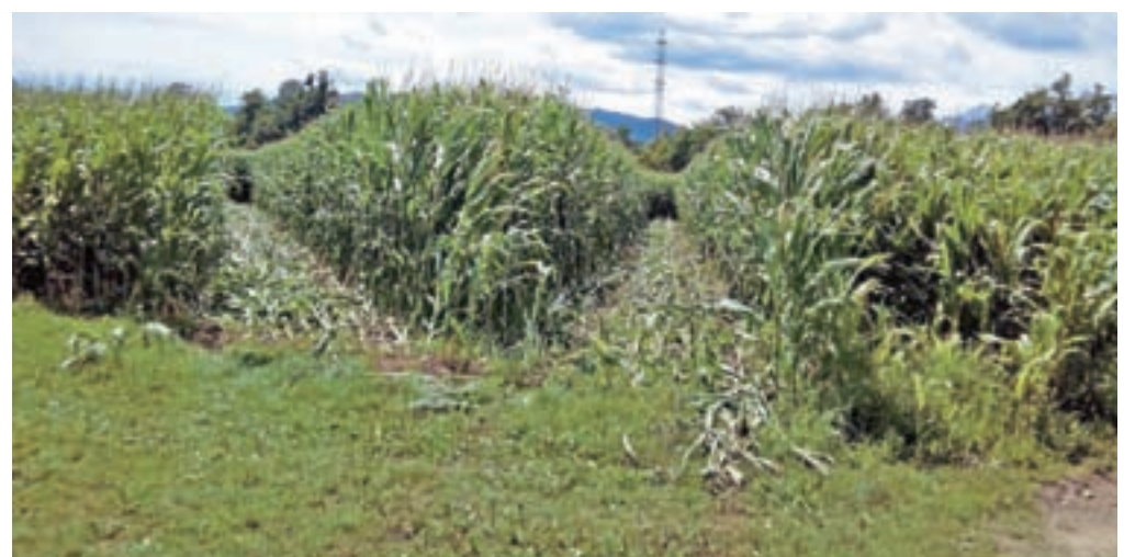
Dvakrat z avtom po koruzni njivi

tudi v kmetijski svetovalni službi in povedali, da so na Tomanovi njivi že vrsto let spremljali pojavljanje in razvoj koruznega hrošča.