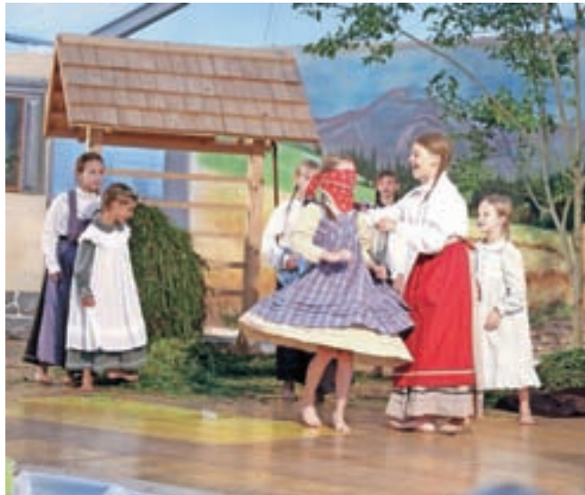
Besedilo igre je precej humorno, med igro pa so zaplesala tudi dekleta iz folklorne skupine.

Predstavo smo si lahko ogledali v petek in soboto, razmišljajo pa, da bi jo z igrali še kdaj. »To je že trinajsta predstava, ki jo je napisala mami in delno jaz, zato je postala že kar lepa tradicija. Ljudje so se tega navadili in vedno radi pridejo pogledat. Teme so vedno kmečke in se nanašajo na naše okolje, snov pa črpamo tudi od starejših okoliških prebivalcev, ki so vir znanja o tem, kako se je včasih živelo na kmetih,« je o igri še povedala režiserka.