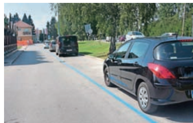
Občina Medvode je ena redkih, kjer je na javnih površinah tudi v samem centru še moč parkirati brezplačno. S postavitvijo parkomatov se bo to spremenilo.

Odredba ureja parkirni režim le na parkiriščih, ki so v lasti občine, izvzeta so tudi parkirišča ob blokovskih naseljih na Svetju in v Preski pa tudi na primer pred Zdravstvenim domom Medvode. So pa poudarili, da je odredba živ dokument in se lahko hitro prilagodi, če se bo za to pokazala potreba.