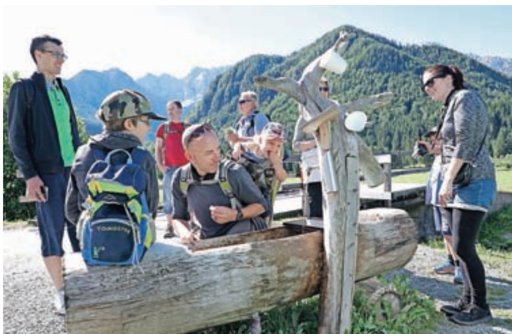
Pri izviru mineralne vode, ki so jo udeleženci pohoda z veseljem poskusili.

udeležence najprej seznanijo s hribi, ki obdajajo Jezersko, in opiše zgodovino njihovega nastanka vse od Kamniško-Savinjskih Alp do nastanka ledeniške doline. Pot, ki se vije ob potoku Jezernica, vodi do naravnega izvira