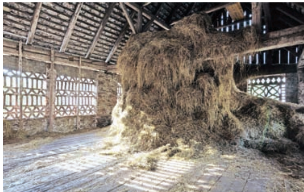
Takšen je pogled z notranje strani skednja na kmetiji na Bukovici.

V Stavbnem redu vojvodine Kranjske iz leta 1875 21. člen predvideva, da je »pravilna mera za zidno opeko 29 centimetrov dolgoti, 14 centimetrov širokosti in 6,5 centimetra debelosti. Pri opeki za obloke, za tlak, za strehe, za žlebove in za olepšave pa so dopuščene vse povoljne izmere.«