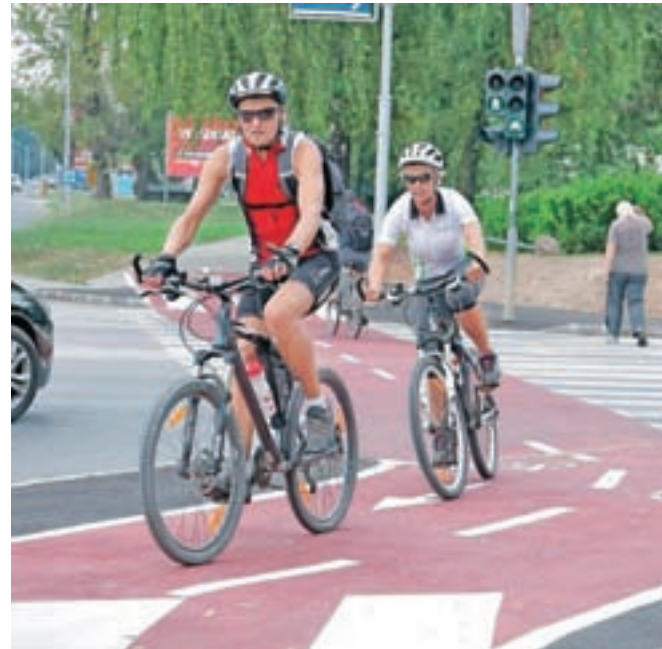
Z upoštevanjem pravil, previdnostjo in zaščitno opremo se je na kolesu moč izogniti marsikateri nesreči.

Na škofjeloškem območju se je kolesarki med vožnjo kolesa snela veriga in je zato izgubila ravnotežje ter padla. Na območju Gorenje vasi pa je padla kolesarka, za katero so ugotovili, da je bolna. Poškodovani so se še trije kolesarji, ki so z Jezerskega proti Preddvoru vozili v večji skupini. Najprej je padel