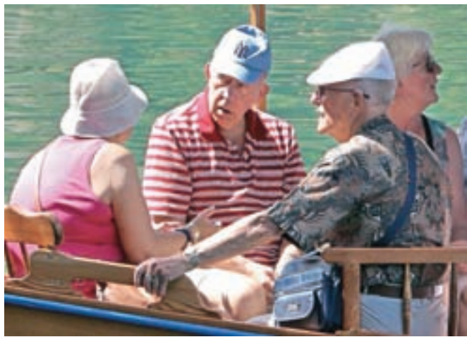
Prvič po petih letih so letni dodatek prejeli vsi upokojnenci – ne glede na višino pokojnine.