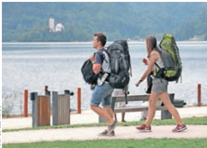
Turistični delavci so junija zabeležili 487 tisoč prihodov turistov, kar je 22 odstotkov več kot istega meseca lani.