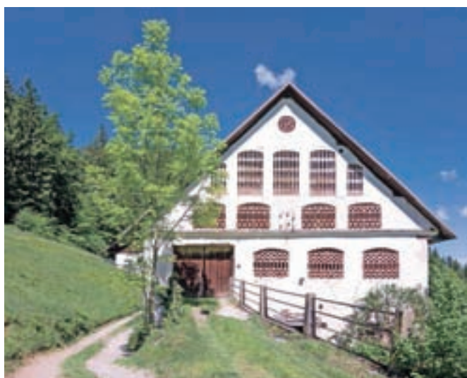
Z opečnimi prezračevalnimi mrežami bogato gospodarsko poslopje na domačiji Zalubnikar.

V naš prostor so vzorec za gradnjo gospodarskih poslopj z opečnatimi mrežami zanesli furlanski zidarji. Gradili so jih predvsem na velikih kmetijah v nižinskem delu obeh dolin, v prvi polovici 20. stoletja pa tudi na Sorškem polju in v dostopnih delih loškega hribovja. Kmetje so največkrat z novimi poslopji menjali dotedanje lesene skednje. Gradilo pa se ni kar tako področje, izvemo na razstavi.