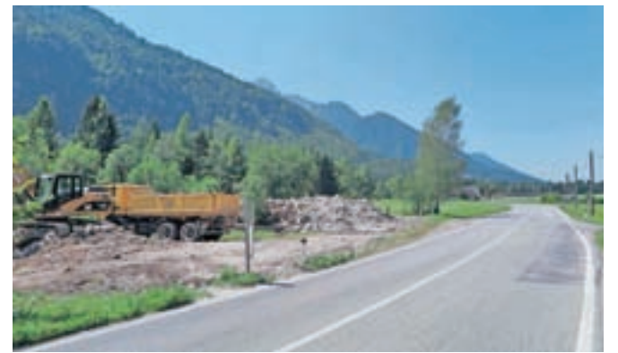
Propadajoči objekt ob cesti tik pred Gozdom - Martuljkom so v začetku tedna podrli in odstranili.