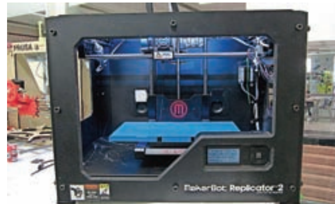
3D-tiskalnik je naprava, ki obeta postati obrtnik in industrijski delavec 21. stoletja.