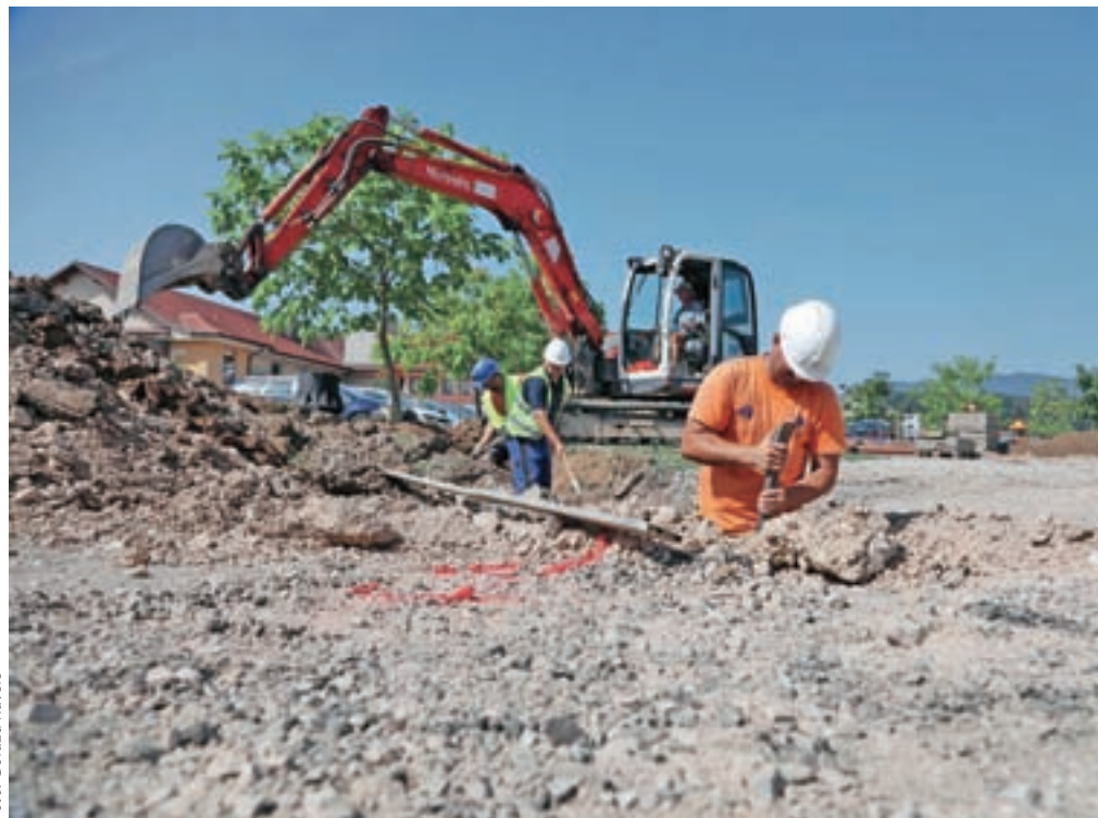
Delavci Cestnega podjetja Kranj te dni začenejo z delom uro prej in tudi prej zaključijo.

Jana Zeni Bešter iz Službe za izposajo in informacije v Mestni knjižnici Kranj pa je sporočila, da je knjižnica poleti ohlajena na prijetnih 26 stopinj, tako da se marsikateri od obiskovalcev pred zunanjo vročino zateče v čitalnico: »Študenti napolnijo študijske sobe, mnogi prebirajo časopise, babice dopoldne pridejo z vnuki, da se malce ohladijo ob igranju družabnih iger, drugi prihajajo po knjige za počitnice. V teh dneh imamo povprečno okoli 1400 obiskovalcev na dan, v primerjavi z istim obdobjem lani je to približno 27 odstotkov več. Nekaj k temu povečanemu obisku verjetno pripomorejo tudi visoke poletne temperature ...« Visoke temperature pa so segle drugega avgusta tudi na Vogel, kjer so zjutraj prvič v zgodovini meritev postaje zaznale tropsko noč. Najnižja temperatura je bila 20,7 stopinje Celzija, kažejo podatki Agencije RS za okolje.