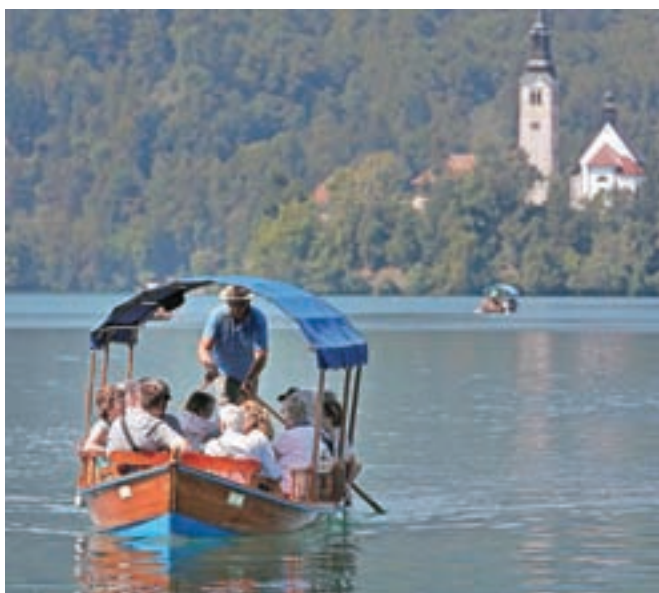
Blejski pletnarji za prevoz na Blejski otok zaračunajo 14 evrov. Agencija za varstvo konkurence poziva k ukrepanju zaradi enotnih cen.

Agencija se je analize lotila na podlagi prijave in poziva k ukrepanju, saj javne prevoze oseb na Blejski otok izvaja le združenje Pletna, ki ima, kot ugotavlja agencija, na trgu monopolni položaj, pletnarji pa naj bi se za ceno prevozov kartelno