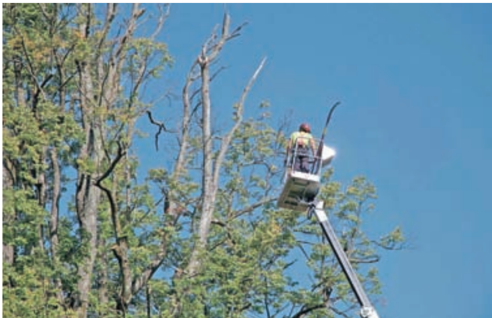
V Cerkljah so sanirali posušene vrhove nekaj sto let starega lipovca.