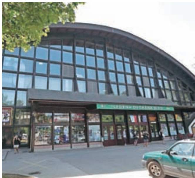
Nov športni pod v Športni dvorani Bled bo omogočil hitro in lahko sestavljanje, posledično bistveno nižje stroške rokovanja in s tem večjo konkurenčnost.

Kot določa razpis, morajo biti investicije prenove športnih podov zaključene oz. predane v uporabo najkasneje do 31. decembra 2017.