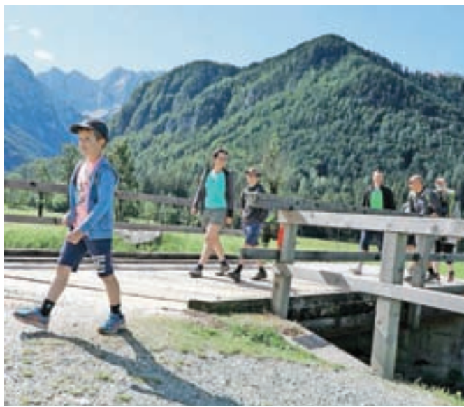
Ogledajo si naravne in kulturne znamenitosti.

nista nikoli obiskala. Vedela sta, da je lepo, zato sta se določila, da bo to letos njuna končna destinacija. »Za pohod so nama povedali lastniki turistične kmetije, kjer sva nastanjena. Izleta sva se rade volje udeležila, saj je za naju to prvi stik s tem krajem,« sta še povedala.