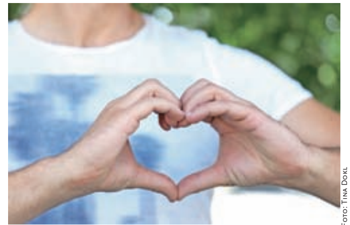
V Sloveniji je lani živelo 186 bolnikov s presajenim srcem.