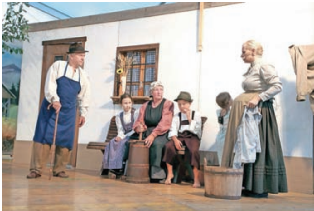
Ti očeta do praga, sin tebe čez prag govori o tem, kakšni so bili včasih odnosi med generacijami in kako so se takrat stvari prenašale iz roda v rod.