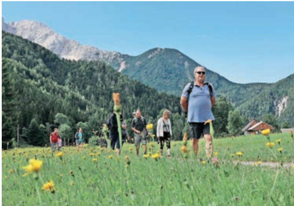
Sprehod po Jezerskem traja dobri dve uri.