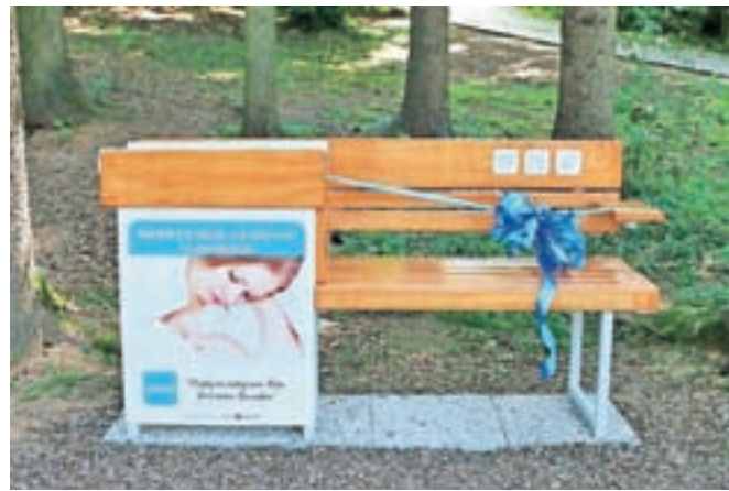
Prva klopca je v Živalskem vrtu Ljubljana.