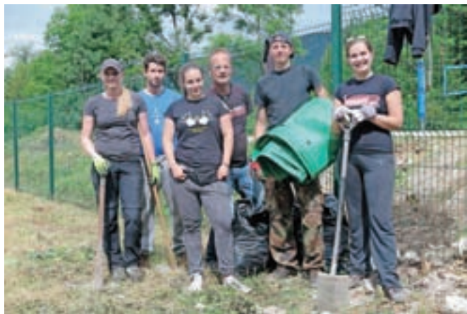
Med najtežjimi nalogami je bilo zahtevno odstranjevanje invazivnega japonskega dresnika v Ratečah.

Šotore, v katerih so prebivali, so si študentje sicer postavili v športnem parku v Kranjski Gori, a so jih za nekaj dni od tam pregnali hudi nalivi. Zatočišče so jim uredili v telovadnici kranjskogorske šole. Popoldneve in večere so si krajšali z družabnimi in športnimi aktivnostmi, na deloviščih pa jih je obiskal tudi predsednik države Borut Pahor