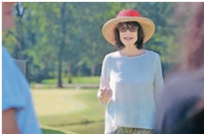
Princesa Jelisaveta Karadorđević je včasih igrala golf. Od zadnjič, ko je obiskala golfsko igrišče na Bledu, pravi, da sedanje Kraljevo klubsko hišo sploh ne more primerjati s prejšnjo, saj je razlika ogromna: »Fenomenalno.«

leta preživljala na Brdu, ker je bilo to imetje njenega očeta. Meni, da je Slovenija izjemno lepa. In kako je biti princesa danes? »Malce arhaično. Drugače pa sem odrasla v izgnanstvu, kar ni bilo ravno običajno življenje, ki bi ga pripisovali princesam – v Keniji, Južni Afriki, Švici, Franciji, Angliji. Dolgo sem živela v Ameriki, poročila sem se v Peru ... Nisem imela ravno običajnega življenja. Moje življenje spominja na veliko avanturo. Vedno sem v premikanju. Sin živi v Belgiji, skupaj z njim in otroki se dobimo na Siciliji, hči je v Kaliforniji ... Veliko sem v letalu – in nikoli ni dolgčas.«