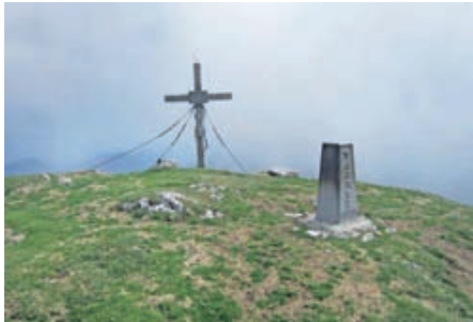
Vajnež, s katerega nato začnemo sestopati proti planini Stamare.

Zapeljemo se proti Jesenicam. Na Slovenskem Javorniku zavijemo proti Javorniškemu Rovtu. Ko prevozimo vas, smo kmalu na izrazitem levem ovinku, ki nadaljuje proti Domu na Pristavi, mi pa zapeljemo naravnost oz. desno na makadamsko