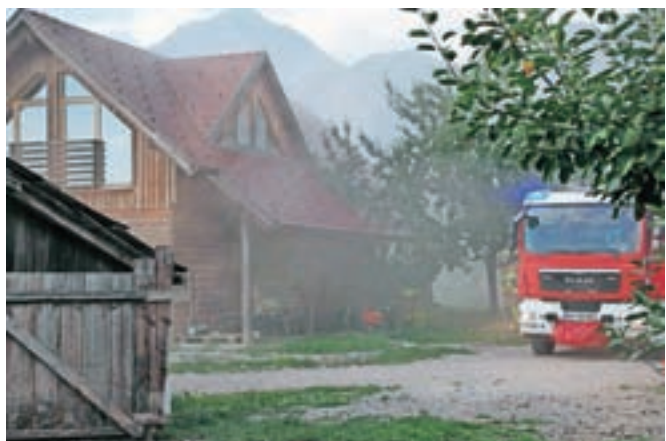
V montažni hiši je zagorela elektroinstalacija, gasilci pa so ogenj hitro pogasili.

Kranj – V Hotemažah je v soboto pozno popoldne zagorela elektroinstalacija v montažni hiši. Gasilci JZ GRS Kranj, PGD Hotemaže in Šenčur so odprli steno pri omarici in požar pogasili. Gorelo je tudi v priložnem skladišču na Ulici Staneta Žagarja v Kranju. Domačini so požar delno pogasili že pred prihodom kranjskih gasilcev, ki so požar pogasili in požarišče pregledali s termovizijsko kamero. Prav tako je konec tedna gorelo na Slovenskem Javorniku, kjer so gasilci GARS Jesenice iz stanovanja odnesli zažgano hrano in prezračili prostore.