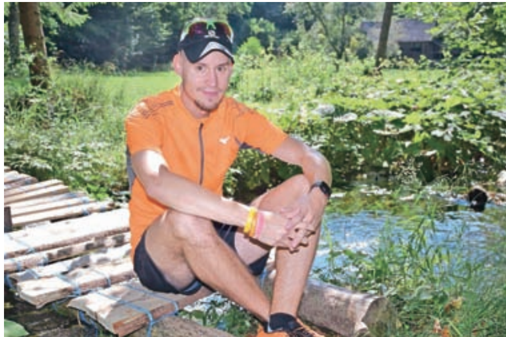
Pogovarjala sva se po njegovem sobotnem treningu. Po 21 kilometrih teka na Šmarno goro, Osolnik, Križno goro in Lubnik je odtel še krog po trasi domačega teka na Kondorjevem letu, kjer bo tek 2. septembra.