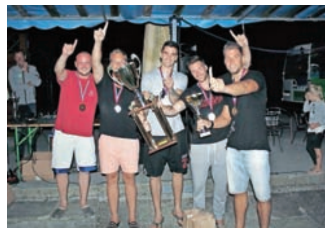
Skupni zmagovalci letošnjega Kvadratlona: ekipa ZZZP