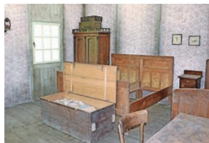
Posteljni okvirji in nekaj pohištva čaka na tekmovalce.