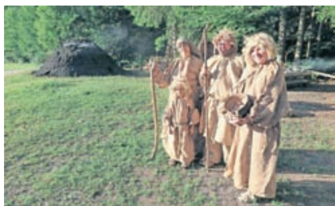
Člani TD Razkrižje so predstavili zgodbo o praljudih.

Razkrižje in Gozd - Martuljek, precej skupnega, predvsem gostoljubne ljudi, veliko naravnih lepot in bogato kulturno dediščino. Vse to oboji izkoriščajo za razvoj turizma, ki je iz leta v leto pomembnejša gospodarska panoga.