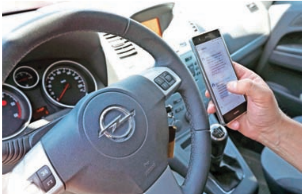
Voznika močno zmoti vsakršna uporaba mobilnega telefona med vožnjo, tudi klic, pri čemer so SMS-sporočila in sporočila po socialnih omrežjih še bolj nevarna, ker še bolj obremenijo možgane.