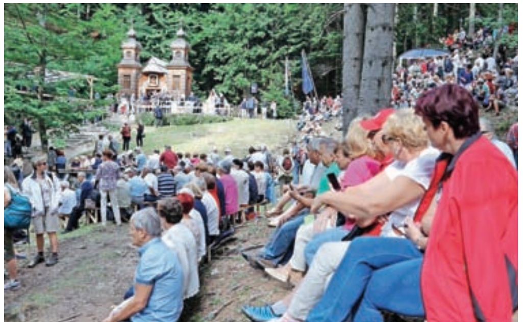
Slovesnosti se je udeležilo okoli tisoč ljudi iz vse Slovenije in tujine. Do kapelice so se iz Kranjske Gore pripeljali s posebnimi avtobusi.