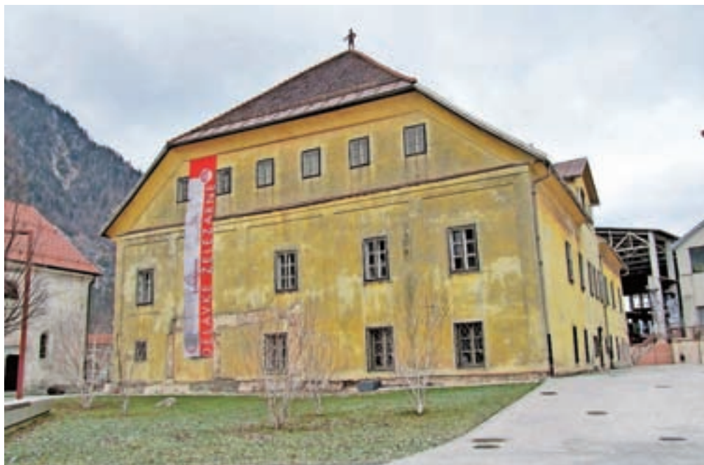
Ruardova graščina je bila zgrajena leta 1538 in je ena najstarejših stavb na Jesenicah.

v njej so poučevali nemščino, kasneje so v njej naselili družine inženirjev Kranjske industrijske družbe, med obema vojnoma pa tudi delavske družine. Leta 1954 se je v graščino vselil Tehniški muzej Železarne Jesenice in še istega leta odprl stalno razstavo. Stanovalce graščine so postopoma izselili. Danes je v stavbi muzej železarstva, prostore pa ima tudi uprava Gornjesavskega muzeja Jesenice.