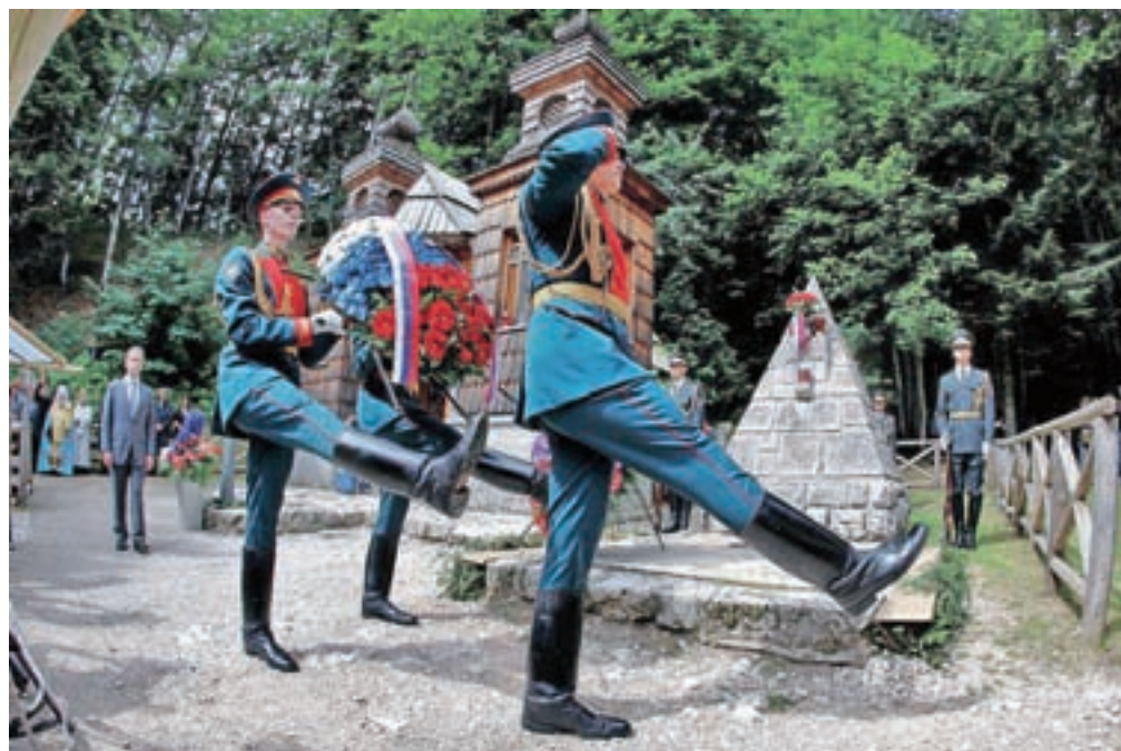
V imenu ruske delegacije je cvetje k spomeniku pri Ruski kapelici položil ruski minister za zveze in množične medije Nikolaj Nikiforov.