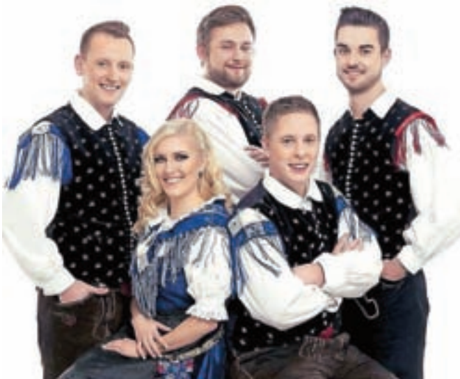
Ansambel Jureta Zajca