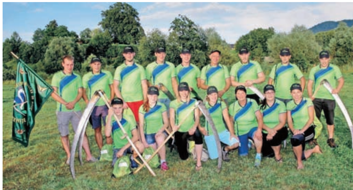
Slovenska reprezentanca v novih dresih pred odhodom na evropsko prvenstvo v Švico