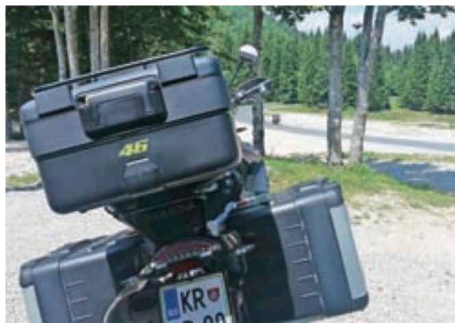
Soriška planina v poletnih dneh privablja številne kolesarje, pohodnike pa tudi motoriste in druge izletnike.

Kljub temu da smo sredi poletja, pa se na planini že pripravljajo na prihajajočo zimsko sezono. Zadnji dve sta bili zaradi neugodnega vremena slabši od pričakovanj, zato letos upajo na boljšo zimo. Do zimske sezone bodo v spodnjem delu smučišča in ob otroški vlečnici povečali kapaciteto zasneževalnega sistema, temu dodali še nekaj topov ter tako omogočili smuko v začetku decembra. »Z dodajanjem vsebin tako v poletnem kot v zimskem času se trudimo za čim pestrejšo ponudbo in računamo, da bo Soriška planina v naslednjih letih postala zares celovita destinacija,« zaključuje sogovornica.