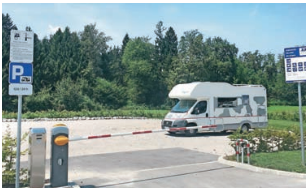
Postajališče za avtodome Camper stop Cubis ima štirinajst parkirnih mest.

Kot ugotavljajo v Mreži postajališč, je v Evropi 1,5 milijona registriranih avtodomov, zato je nujno, da jim tudi Slovenija ponudi primerna postajališča. Slovenija premore 151 mest, kjer »avtodomarji« lahko prenočijo. Tuje