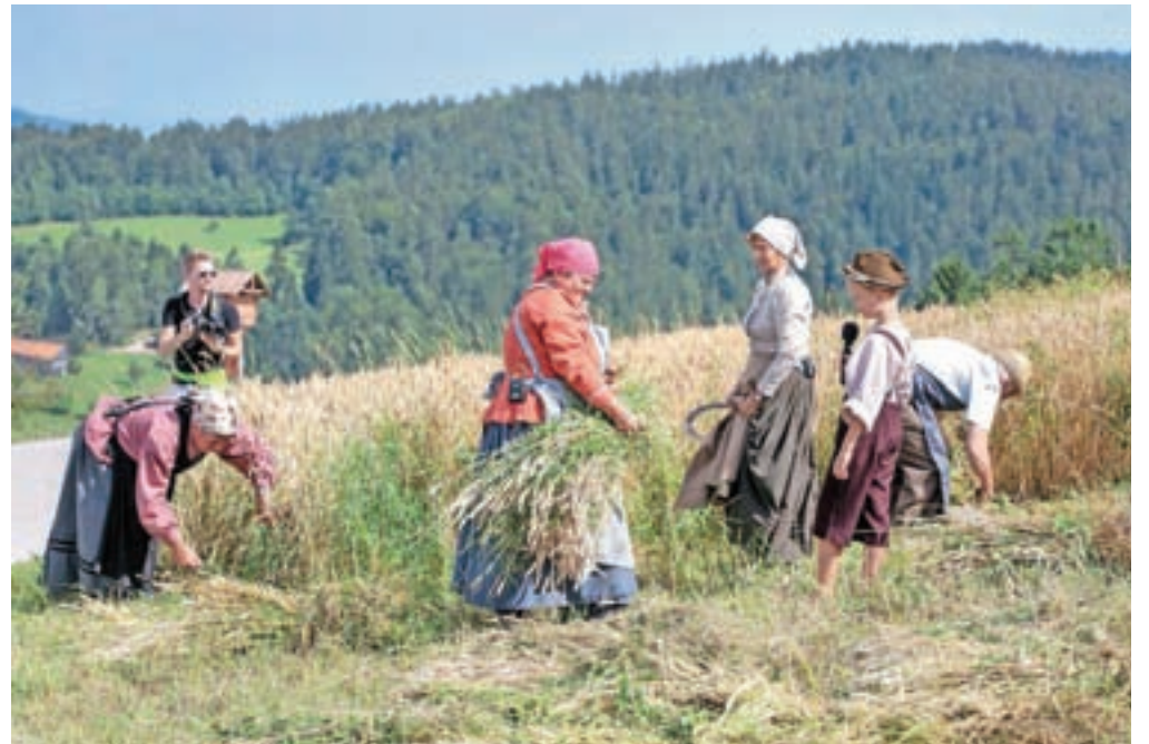
O žetvi niso samo govorili, so jo tudi prikazali.