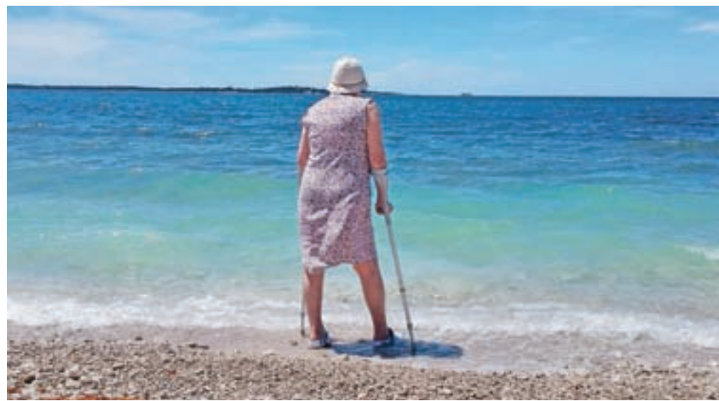
Evropska kartica zdravstvenega zavarovanja ne krije stroškov prevoza zavarovane osebe iz tujine v domovino.

Dodajmo še, da evropska kartica zdravstvenega zavarovanja ne krije stroškov prevoza zavarovane osebe iz tujine v domovino. V nujnih primerih pa so, če spet vzamemo primer začasnega bivanja na Hrvaškem, kriti stroški reševalnega prevoza do najbližje zdravstvene ustanove.