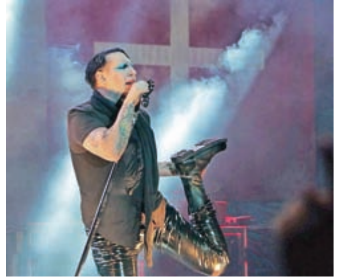
Karizmatični Marilyn Manson je na festivalu MetalDays mnoge razočaral.

ramenih istih bendov. Redni obiskovalci festivala smo tako že malo naveličani glasbene ponudbe, sploh kar se tiče velikih imen. Kljub temu pa so nekateri nosilci festivala postregli z odličnimi nastopi. Izpostaviti velja Amon Amarth, ki so skozi leta močno dvignili raven svojega nastopa in sedaj na odru poleg močne pirotehnik in posebnih kulis uprizarjajo že prave vikinške boje mož na moža. Največje razočaranje festivala pa je bil gotovo Marilyn Manson, ki očitno računa samo še na staro slavo, saj je deloval, kot da ga bo na odru pobralo, pel zelo slabo in koncert zaključil pol ure prej, kot je bilo napovedano.