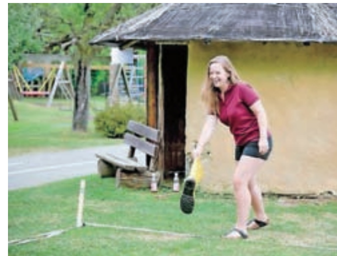
Metanje škornja je tradicionalna koroška kmečka igra.