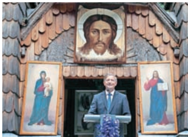
Karl Erjavec, zunanji minister, je bil letos častni pokrovitelj slovesnosti pri Ruski Kapelici.