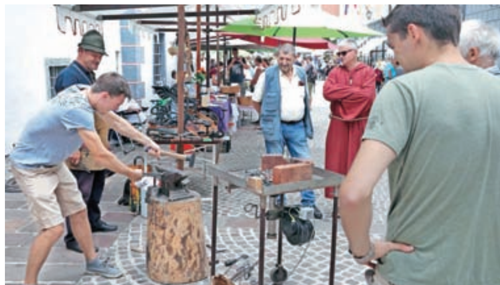
Staro mestno jedro Radovljice se je v nedeljo za hip vrnilo v srednji vek.

Združenje borcev za vrednote NOB območja Radovljica bo tradicionalno spominsko srečanje pri Partizanskem domu na Vodiški planini ob 76. obletnici ustanovitve Cankarjevega bataljona priredilo v soboto, 5. avgusta, ob 11. uri.