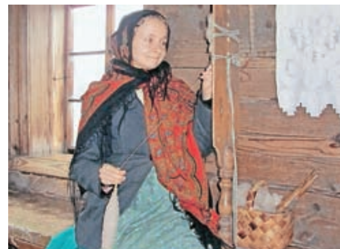
Karelijke so večje predenja in pletenja volnenih izdelkov.