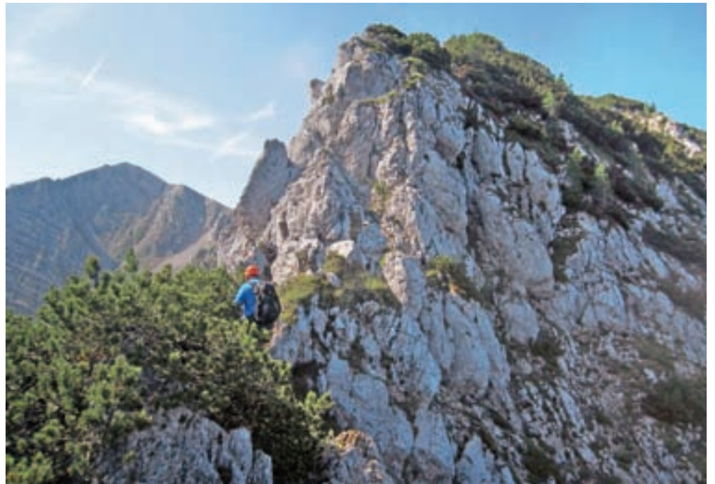
Skalaška pot je na nekaj mestih celo zavarovana.

se pokaže krnica oz. amfiteater Rida, kjer poteka markirana pot s Stola proti Golici. Prijetna pot se hitro povzpne do planine Seča, kjer je smerokaz, ki pa nas pravzaprav niti ne zanima. Na desni namreč opazimo izrazito travnato dolinico, ki se vzpenja na greben. Zapustimo markirano pot in nadaljujemo po dolinici. Slabše vidna stezica v tem delu ni težko sledljiva. Ko dosežemo mejni kamen, se usmerimo desno. Začenja se vzpon skozi ruševje, ki je ponekod precej gosto. Vsekakor po dežju odsvetujem tale vzpon, ker bi bili povsem mokri. Ko dosežemo mejni kamen št. 182, se začenja zahtevnejši svet. Čelado na glavo in že se ob spodaj nepritrjeni jeklenici spuščamo navzdol na škrbino, od koder nadaljujemo po ozkem ruševnatem grebenu. Sledi sestop po krušljivem, izpostavljenem in nevarovanem delu. Pot zavije rahlo v levo in se nazaj na greben povzpne s pomočjo jeklenice. Nadaljujemo po ozkem grebenu in se približujemo skalam in skalnim rogljem. Gremo mimo enega izrazitega, ko so pred nami jeklenica in tri skobe ter izpuljen klin. Povzpne se po navpičnem kamnu navzgor. Na vrhu pa ... zmanjka poti. Sestopimo po krušljivem terenu in se po