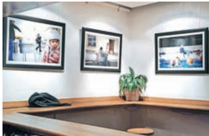
V fotografski objektiv ujet družinski vsakdan

V prvi polovici avgusta je v Cafe Galeriji Pungert na ogled razstava Pripoved vsakdana fotografkinje Polone Avanzo.