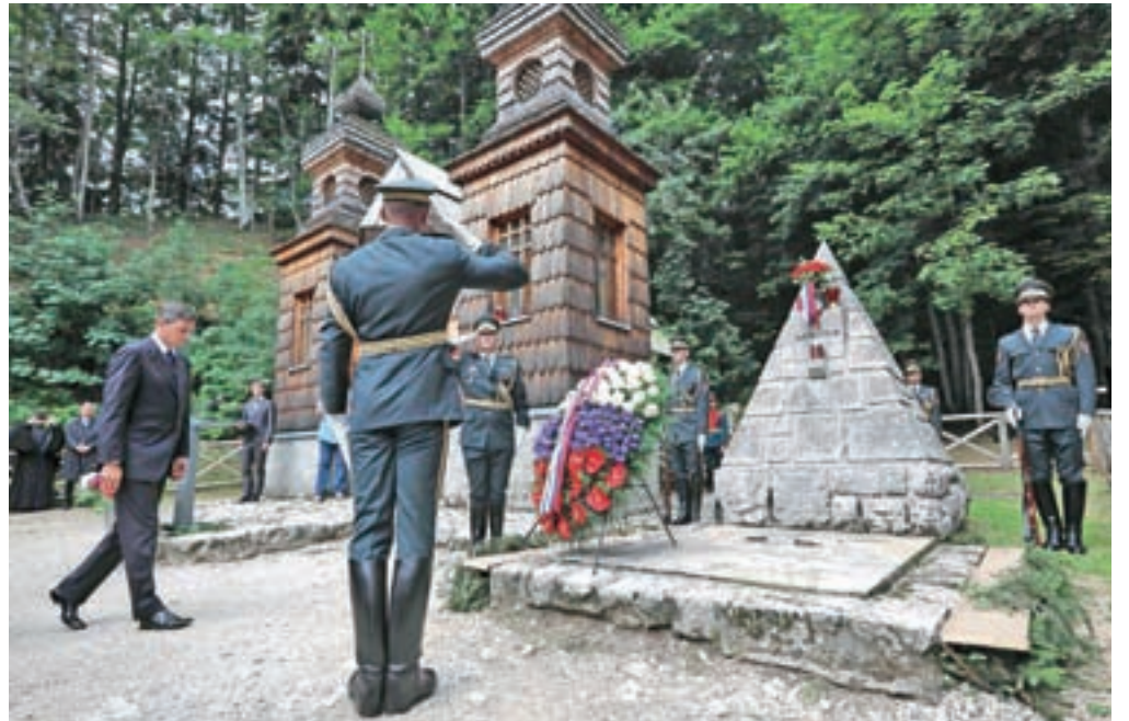
Srečanja so se udeležili visoki predstavniki politike, gospodarstva in cerkveni dostojanstveniki iz Slovenije in Rusije. Venec k spomeniku je položil tudi predsednik Slovenije Borut Pahor.

Erjavec se je v svojem govoru dotaknil tudi aktualnih političnih razmer v mednarodni skupnosti, s katerimi, kot pravi, ne moremo biti zadovoljni. »V zadnjih letih se je nakopičilo veliko problemov. Zlasti skrb vzbujajoče je, da se jih večina dotika naše neposredne sosesčine. Zaskrbljen sem, ker se ti problemi rešujejo neučinkovito in prepočasi. Verjamem, da se mednarodne krize lahko rešijo le s sodelovanjem, z medsebojnim sodelovanjem velesil, zlasti stalnih članic Varnostnega sveta – in ne z medsebojnim izključevanjem. Mednarodno zaupanje je bistvenega pomena za mirno razreševanje kriz. Prijateljstvo z Rusko federacijo vrednotimo prav skozi to spoznanje in zaupanje, ki smo ga skupaj zgradili preko spomina