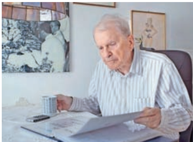
V okviru festivala so v soboto na Bledu predstavili tudi film Stoletje sanj, celovečerni dokumentarni film o najstarejšem slovenskem inovatorju Petru Florjančiču režiserja Vena Jemeršiča.