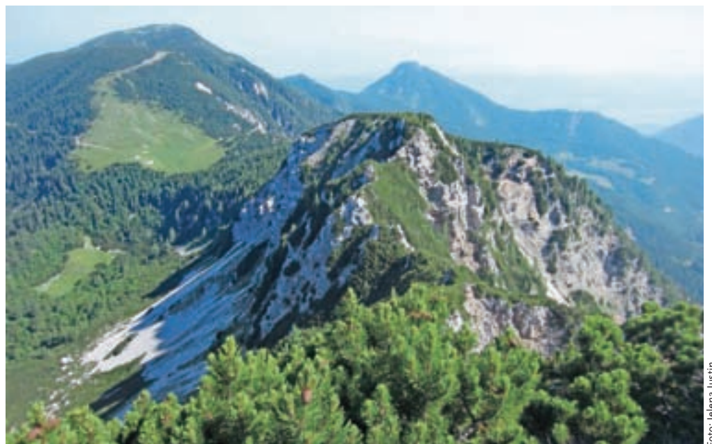
Greben Belščice, kjer poteka Skalaška pot. Trezna glava in trden korak sta nujna.

nekaj korakov povzpne nazaj na greben. V pomoč je jeklenica. Sledi še nekaj korakov ob ruševju in smo zunaj Skalaške poti.