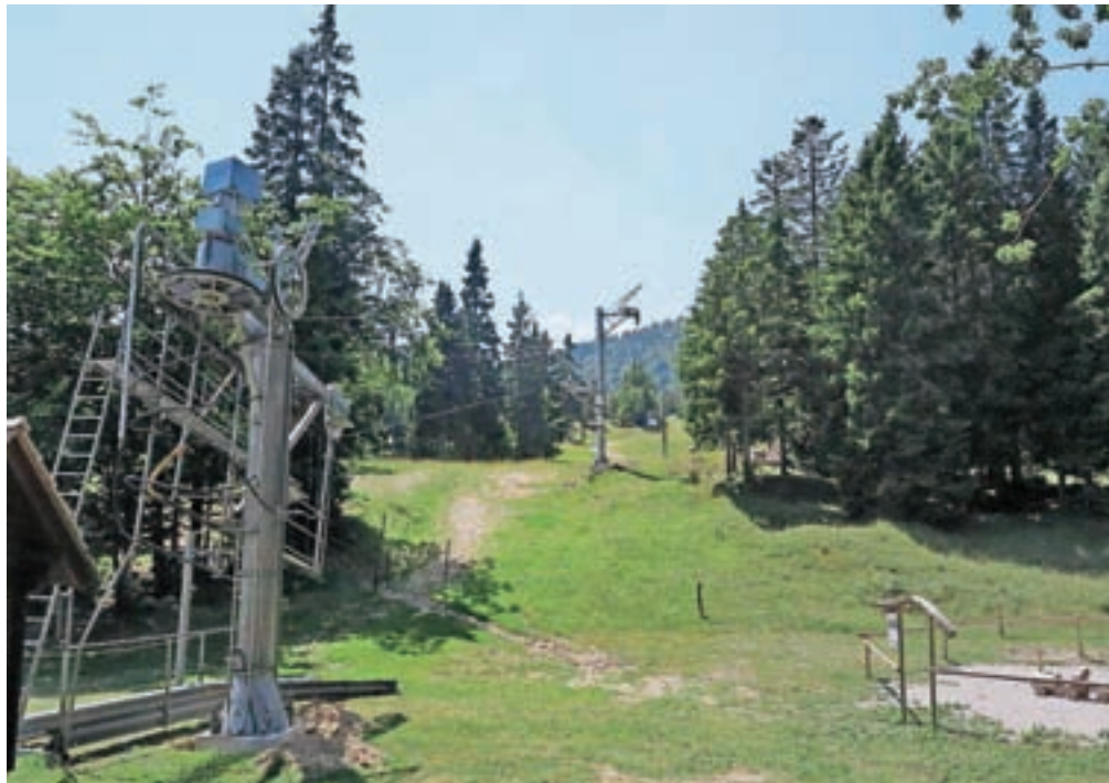
S povečanjem kapacitet umetnega zasneževanja se na planini nadejajo, da bodo smučarsko sezono začeli že decembra.

Zavedajo se, da zgolj zimska sezona ni dovolj za preživetje turističnih delavcev na Soriški planini, zato vse bolj razvijajo tudi poletno turistično ponudbo. »Imamo nekaj lepih kolesarskih poti na mulatjerah, nudimo