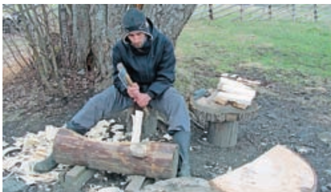
Prebivalce otoka Kiži spremlja les od rojstva do smrti. Fant je mojster izdelovanja skodel.