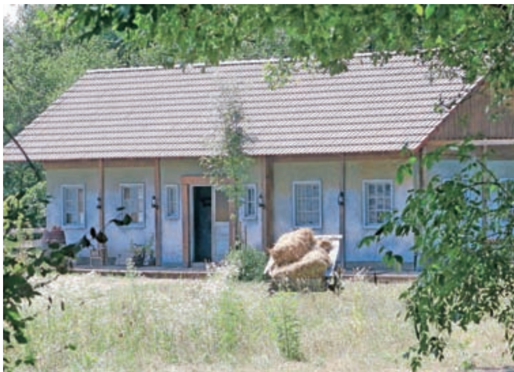
Kreativna ekipa obljublja zanimiv šov, lokacija kmetije z okolico pa je idilična. Vendar videz vara ...