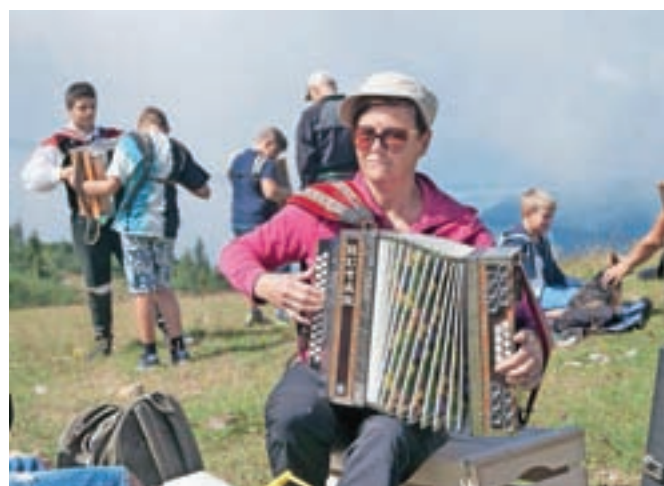
Harmonika nikakor ni glasbilo, rezervirano le za moške.