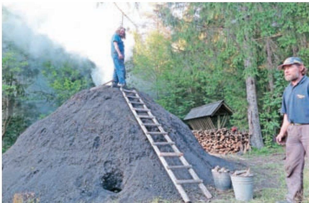
V petek so zakurili kopo, prireditve ob kopsiču pa se bodo vrstile še vse do sobote.