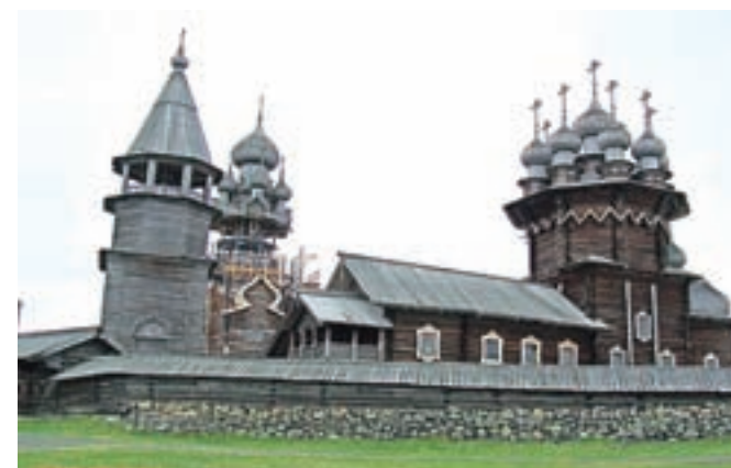
Cerkev Jezusovega spremenjenja na gori, vrhunec ruskega in svetovnega lesnega stavbarstva. Ima dvanindvajset kupol, vendar nekatere zaradi obnove, ki bo trajala do leta 2022, manjkajo.