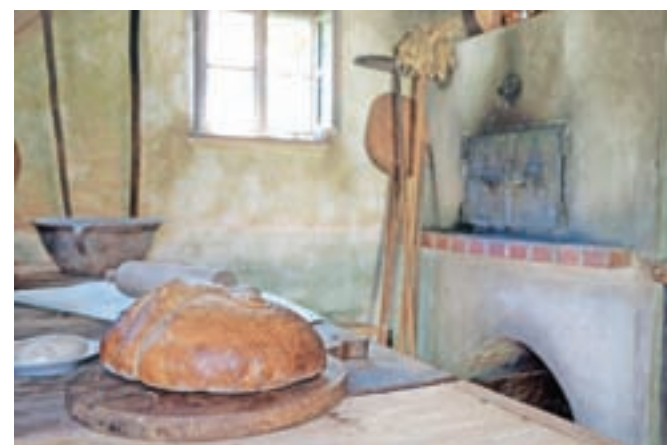
Pekarna je izjemna pridobitev, a verjetno ne bo »kar dana« v uporabo udeležencem šova.