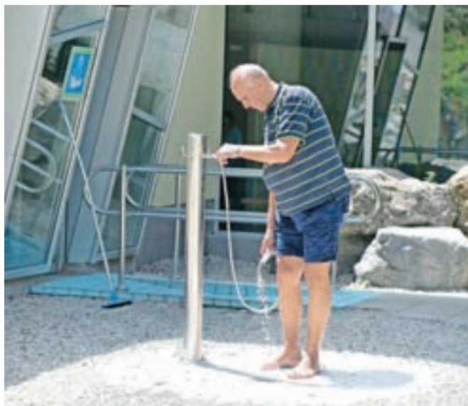
Pomemben del knajpanja so hidroterapije, ki jim bodo v Snoviku v prihodnje posvetili še več pozornosti.

Kneipp društvo Kamnik, ki bo šele tretje tovrstno društvo pri nas (poleg Maribora in Vrhnike) in kamor vabijo vse, ki jih zanimajo Kneippove metode zdravljenja.