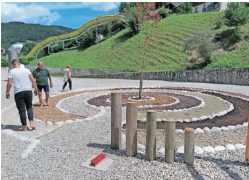
V sklopu projekta Kneippanje v Termah Snovik so uredili bosonogo pot za hojo po različnih vrstah podlage.

V sklopu četrtega stebra (gibanje) so te dni ob osrednjem termalnem objektu uredili ter za svoje