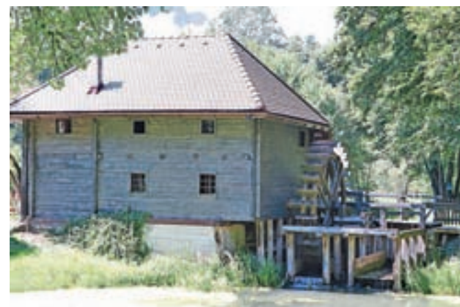
Ustvarjalci jesenske Kmetije so tokrat v novo zgodbo vpeli tudi mlin.