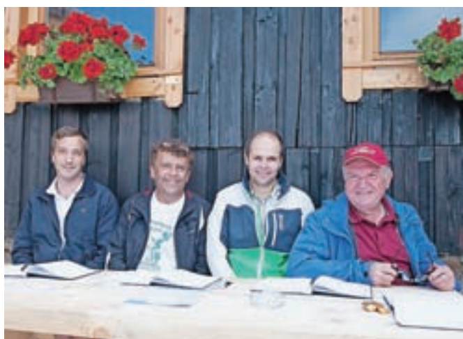
Nastope so budno spremljali člani komisije.