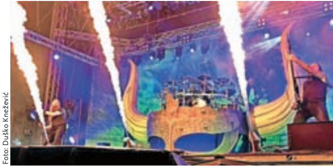
Barviti in udarni pirotehnični nastop zasedbe Amon Amarth

Največji glasbeni festival v Sloveniji mnogim obiskovalcem predstavlja alternativne poletne počitnice. V primerjavi z drugimi festivali ima tudi zelo sproščen urnik koncertov – ostali festivali enako število nastopajočih stisnejo v pol krajši časovni okvir, kar je za obiskovalce lahko zelo naporno in prav nič počitniško. V Tolminu pa glavna atrakcija niso le bendi, temveč lokacija sama, s čudovitim sotočjem Soče in Tolminke ter odlično ponudbo v Tolminu, katerega prebivalci so že