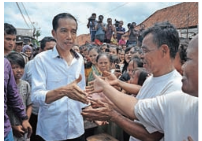
Indonezijski predsednik Joko Widodo poziva svoje državljane, naj kar sami obračunajo s prekupčevalci z mamili.