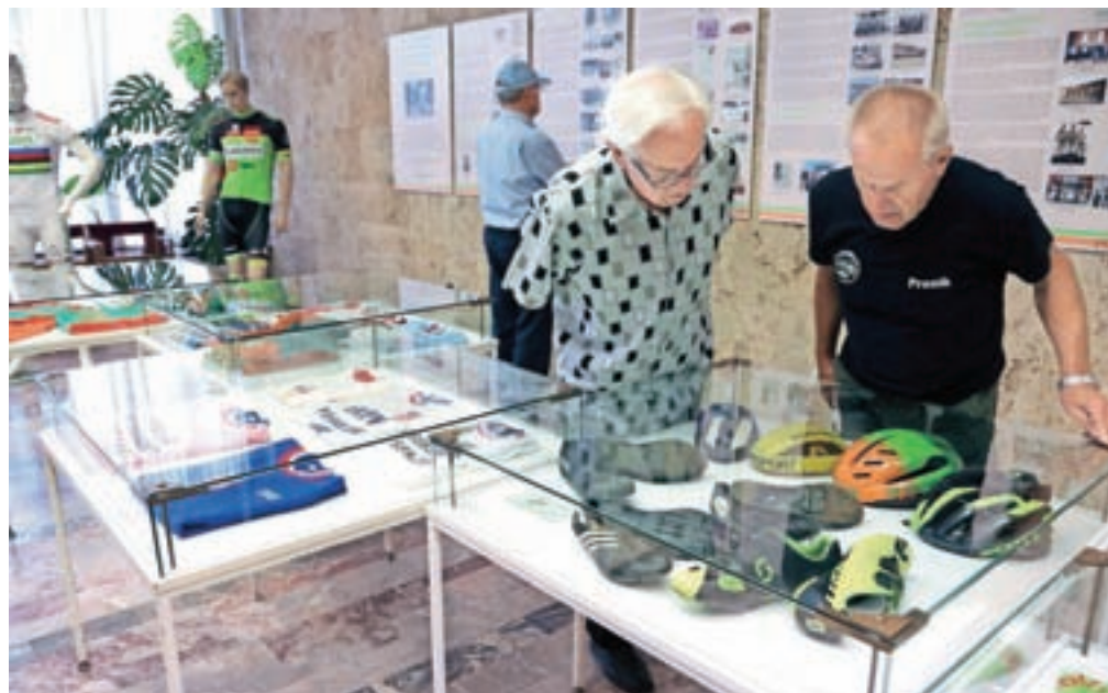
V avli Mestne občine Kranj je še do 4. avgusta na ogled razstava o zgodovini kranjskega kolesarskega kluba.