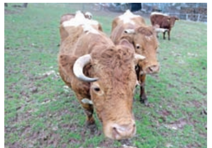
Število goved v ekološki reji je bilo lani za devet odstotkov večje kot leto prej.

Površina kmetijskih zemljišč, namenjena ekološkemu kmetovanju, se je lani povečala za 3864 hektarjev, od tega več kot štiri petine predstavljajo trajni travniki in pašniki. Pridelava ekoloških rastlinskih pridelkov je bila deloma večja, deloma manjša, odvisna od vrste pridelkov. Pridelavek ekološkega sadja v ekstenzivnih in intenzivnih sadovnjakih je bil zaradi pozebe za 29 odstotkov manjši kot leto prej, nasprotno pa je bil pridelavek ekoloških zelenjadnic večji za 13 odstotkov in pridelavek žit za 40 odstotkov.