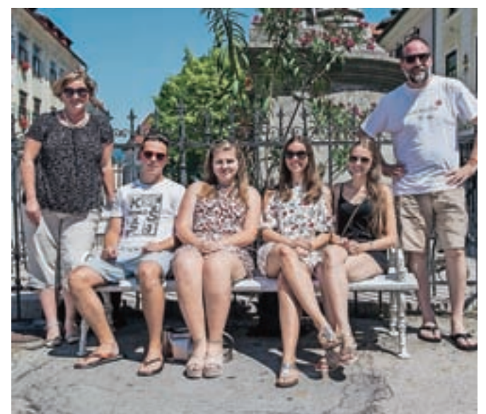
Naši sogovorniki iz izmenjave Erasmus plus