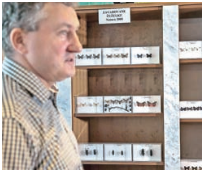
V Sloveniji je v sklopu Nature 2000 zavarovanih dvanajst vrst metuljev in štirinajst vrst hroščev.

Razstava bo v Domžalah na ogled vsaj do januarja, vsak dan (razen ponedeljkov in praznikov) med 10. in 18. uro, člani zavoda EGEA pa jo bodo še dopolnjevali in po potrebi spreminjali. Pripravljajo tudi različne delavnice, predavanja in programe za vse starostne skupine.