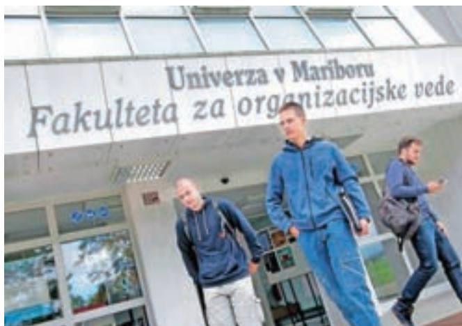
Na visokošolskih zavodih so se začeli vpisi študentov v prve letnike.