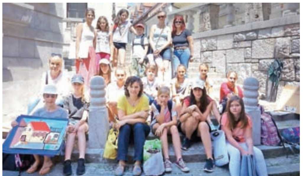
Mladi ustvarjalci prve likovne kolonije so prikazali svoj umetniški talent.