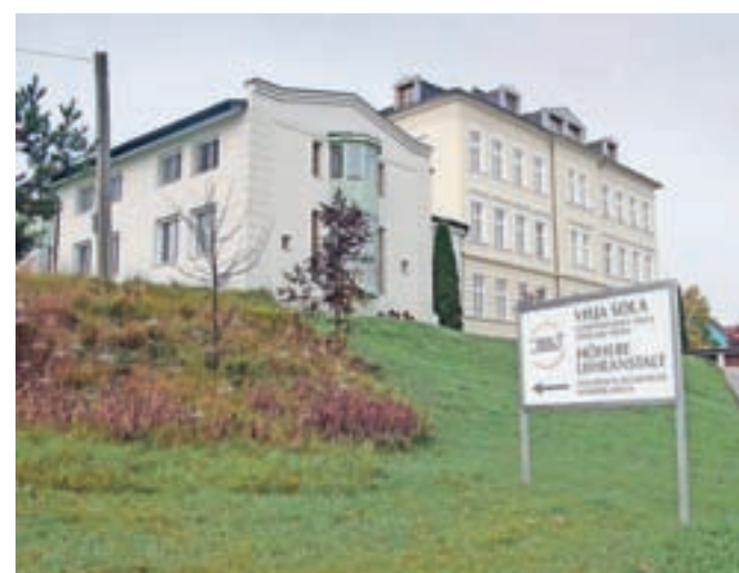
V Šentpetru pri Šentjakobu bodo ostali dosedanji dvojezični napisi.