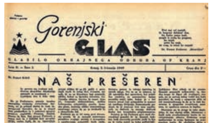
Posebne pozornosti je bila v Gorenjskem glasu deležna stota obletnica smrti dr. Franceta Prešerna.

Gorenjski glas je imel že v prvih letih izhajanja redne rubrike, v katerih je poročal o novorojenih, poročenih in umrlih, o dežurnih trgovinah, lekarnah in trafikah, o izgredih, še posebno tistih, na katerih so posamezniki 'bentili' nad oblastjo. V posebnih rubrikah sta bila kultura in šport, še posebej nogomet. Na tekme kranjskega Udarnika, ki se je leta 1949 preimenoval v Korotan, je prišlo tudi 1500 ljudi. Za tekmo s klubom Gregorčič z Jesenic poročevalec piše, da je bila tekma zvečer in je bila luč tako slaba, da je sodnik komaj kaj videl. Uvedena je bila tudi rubrika Pisma bralcev. V njej beremo tudi o tem, kako je občan ogovoril peka s tovarišem, ta pa mu je odgovoril, da je pekovski mojster in da nista skupaj krav pasla.