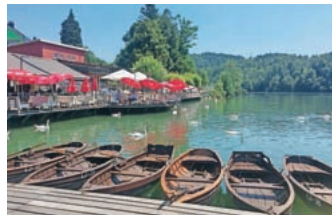
Člani turističnega društva sami izdelujejo zaščitene zbiljske čolne.