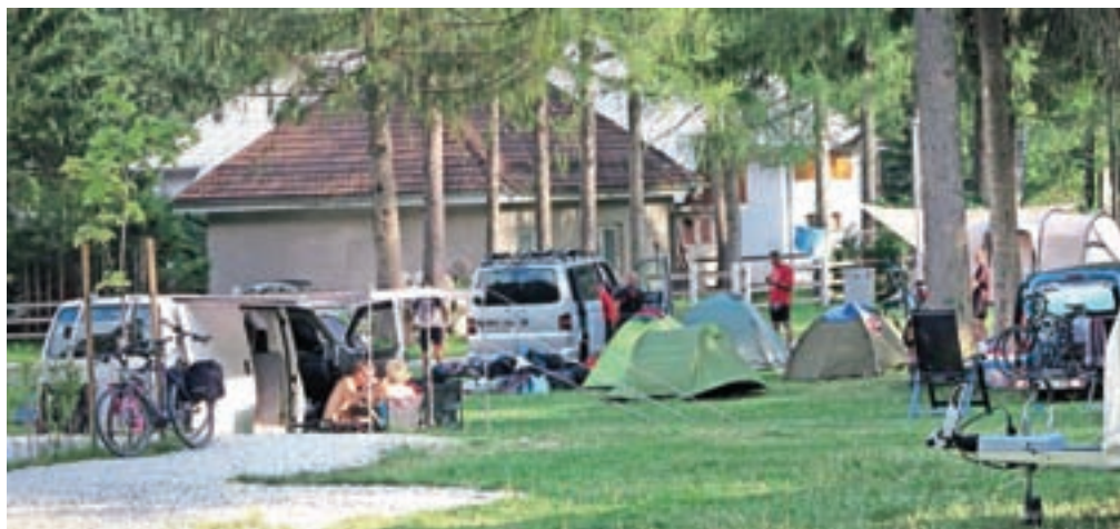
Med gosti so tako mladi, željni aktivnosti v alpskem okolju, kot družine in starejši ljubitelji narave.

Kamp v Gozdu - Martuljku leži v neposredni bližini Hotela Špik. Na treh hektarih površin je na voljo dvesto parcel za skupaj okoli šeststo gostov, ki so, kot pravi Urevc, predvsem ljubitelji miru in aktivnosti v naravi. »Prihajajo tako mladi, ki jim je Gozd - Martuljek dobro izhodišče za gorske ture, kot družine in starejši pari. Kljub temu da je kamp odprt šele eno leto, imamo kar nekaj takšnih, ki se redno vračajo,« je še povedal Urevc.