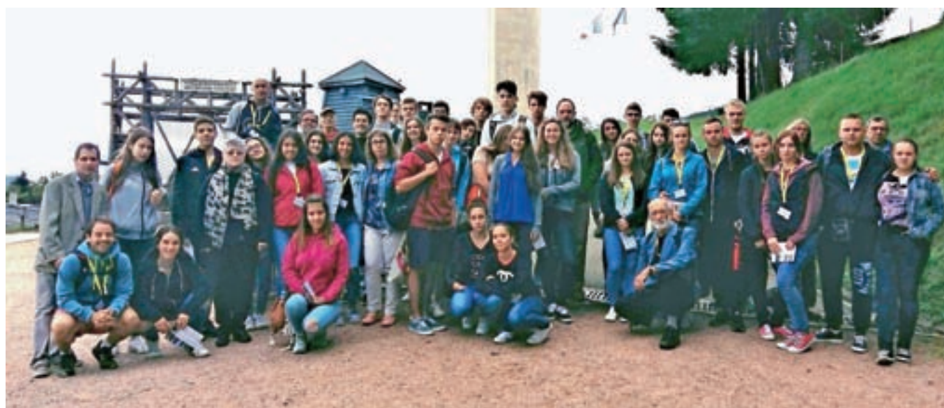
Pred vhodom v koncentracijsko taborišče Natzweiler-Struthof