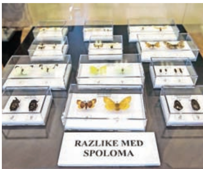
Samci so praviloma večji in lepši, a imajo bistveno krajšo življenjsko dobo od samic.