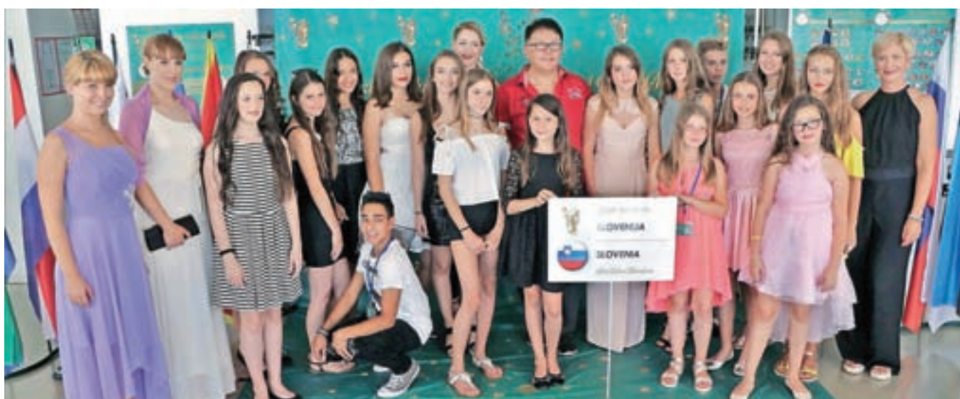
Od vseh pevcev in pevk se je iz Slovenije Blejskega zlatega mikrofona 2017 udeležilo kar lepo število izvrstnih pevcev in pevk, največ do sedaj.