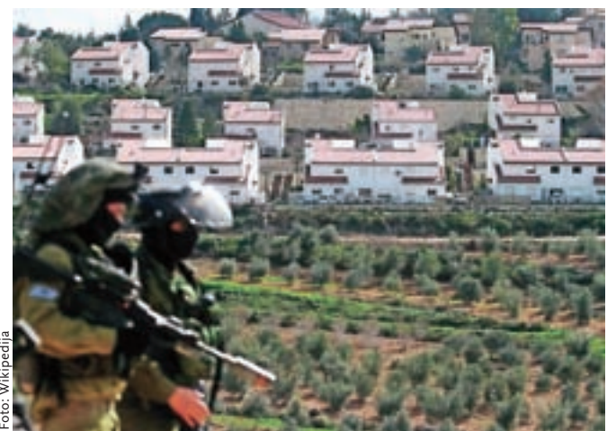
Nova naselja, ki jih Izrael gradi na zasedenih arabskih ozemljih, nakazujejo namen trajne okupacije teh ozemelj.