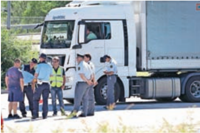
Ta teden so pod drobnogledom prometnih policistov zlasti vozniki tovornih vozil in avtobusov.

Med poostrenim nadzorom voznikov tovornih vozil in avtobusov so našli več nepravilnosti, nihče pa ni bil pijan.