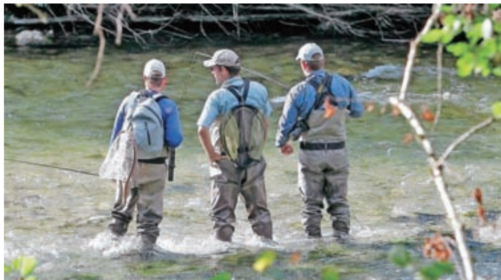
Rekordno ribiško leto v Bohinju

Z rezultati so zadovoljni tudi v Turizmu Bohinj, zanje so namreč ribiči ena najpomembnejših ciljnih skupin, kot eno od osrednjih šestih dejavnosti pa je bilo ribištvo posebej omenjeno tudi v sklopu destinacije Julijske Alpe. »Za nas so turistične aktivnosti, povezane z ribištvo, eden najpomembnejših turističnih produktov, s