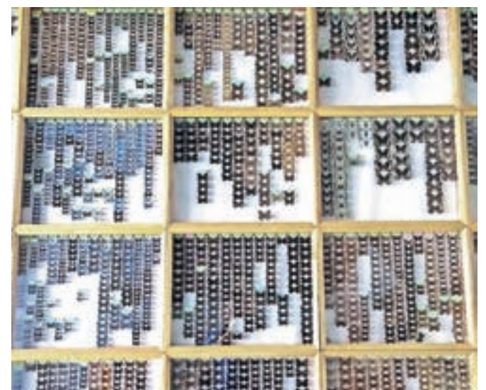
Žuželke predstavljajo najbolj obsežno živalsko vrsto v svetu.