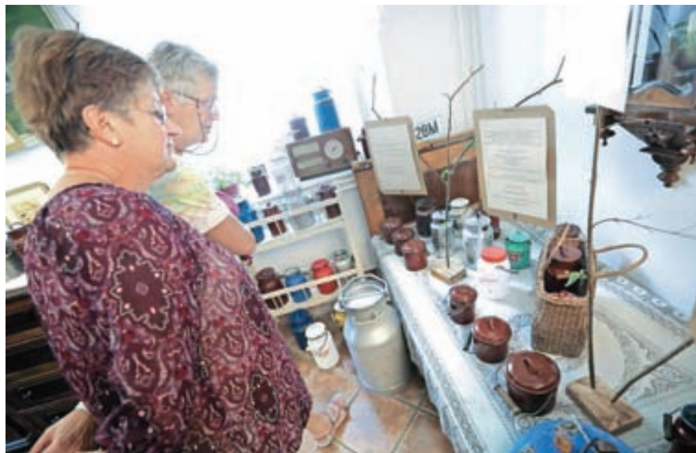
Na razstavi je bilo na ogled kar 147 kanglic.