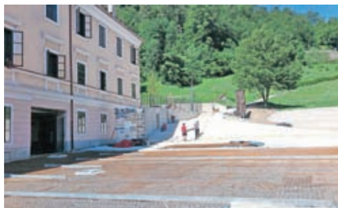
Trg pod gradom bo kmalu dograjen.

Škofja Loka – Gradbeni delavci v Škofji Loki dokončujejo obnovo Trga pod gradom, kot se po odločitvi občinskega sveta zdaj tudi uradno imenuje. Odprli ga bodo prvi teden septembra in bo v prihodnje prizorišče letnih in zimskih dogodkov.