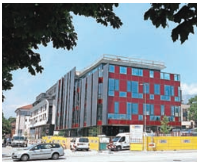
Gradnja radovljiške knjižnice se bo zavlekla

la, končana je bila komunalna oprema na odseku Kopalniške ceste od vrtca do Kranjske ceste, cesta razširjena, opremljena z dvostranskim pločnikom in dodatnimi parkirnimi mesti. Lani je bila zaključena še zunanja ureditev Vurnikovega trga. Občina Radovljica je doslej za gradnjo knjižnice, pripadajočih garažnih mest, komunalne opreme in sofinanciranje zunanje ureditve trga v prvi fazi že namenila približno 2,9 milijona evrov, jeseni so z investitorjem podjetjem Javna razsvetljava podpisali še 2,4 milijona evrov vredno pogodbo za nadaljevanje gradnje. Opremo v vrednosti 450 tisoč evrov je Občina Radovljica kupila ter ustrezno uskladiščila že pred leti.