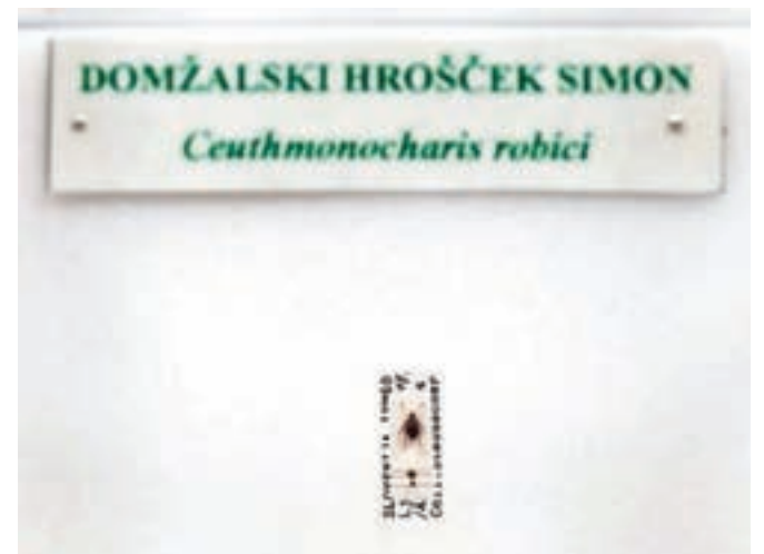
Domžalski endemit iz Babje jame – hrošček simon, ki ga je v 19. stoletju odkril Simon Robič. Ta vrsta hrošča je tudi maskota občine Domžale.