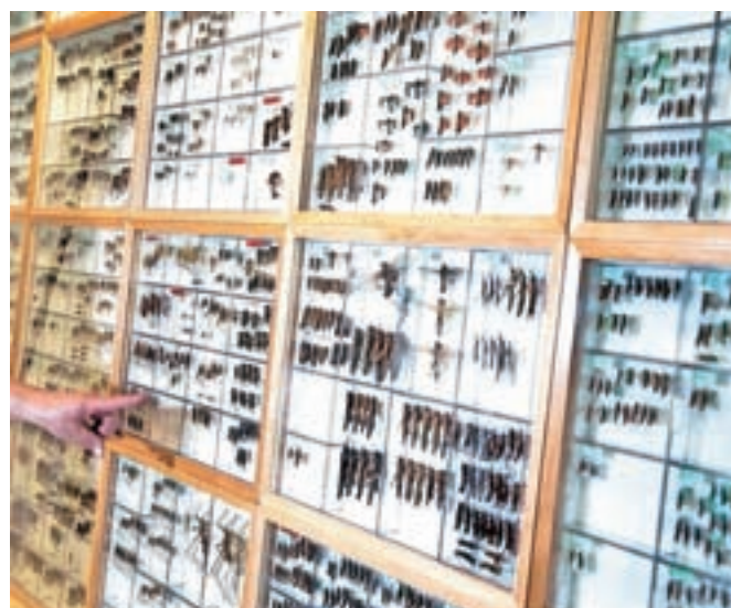
Na razstavi Svet žuželk je na ogled okoli 50 tisoč različnih primerkov, tudi nekaj živih.