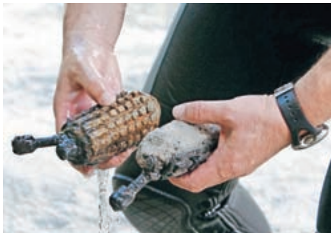
Različnih neeksploziranih ubojnih sredstev je pri nas še veliko, opozarjajo strokovnjaki.