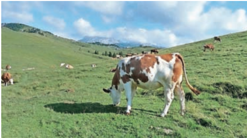
Pašniki s kravami in pastirsko naselje z lesenimi 'bajtami' na Veliko planino poleti vsako leto privabijo več obiskovalcev, predvsem tujcev.

»Velika planina kot turistična destinacija se razvija, ponudba se povečuje, obisk pa je vsako leto večji. Tako smo od začetka poletne sezone zabeležili 50-odstotno rast prepeljanih potnikov na Veliko planino v primerjavi z enakim obdobjem lani. Od začetka leta 2017 pa beležimo kar 22 odstotkov več potnikov kot v letu 2016. Tudi v juliju smo zabeležili občutno več gostov, saj se je na Veliko planino z nihalko pripeljalo kar 54 odstotkov potnikov več kot v lanskem letu. Veseli smo, da se gosti za