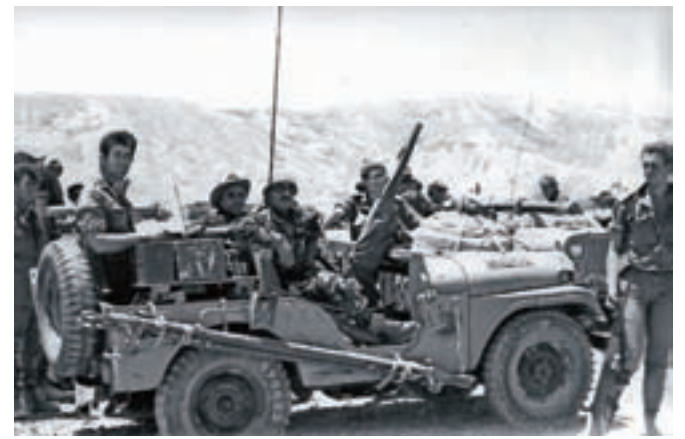
Pred petdesetimi leti: zmagoviti izraelski vojaki med šestdnevno vojno na Sinaju, junija 1967