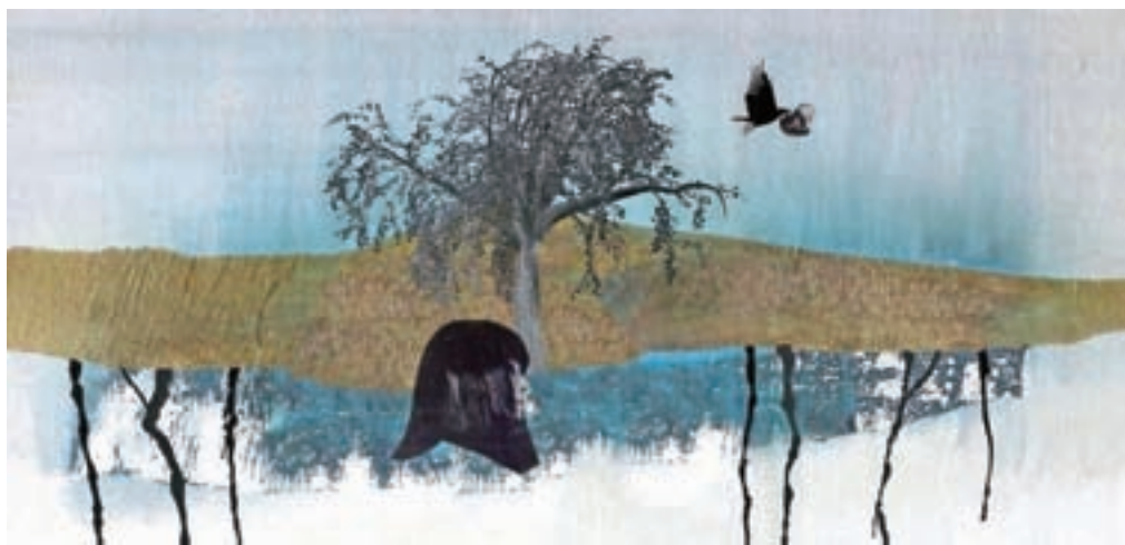
Domišljjski svet, ustvarjen iz plasti kolažne animacije

Zvezde v mlaju so torej popolna skladba za poletne noči, katerih neskončnost širnega veselja ponuja prostor in možnost za združitve dveh src oziroma rečeno v jeziku Bordoja: Nad zvezdami ni nič. Pod njimi pa ob teži čustev beživa in se ponovno srečava.