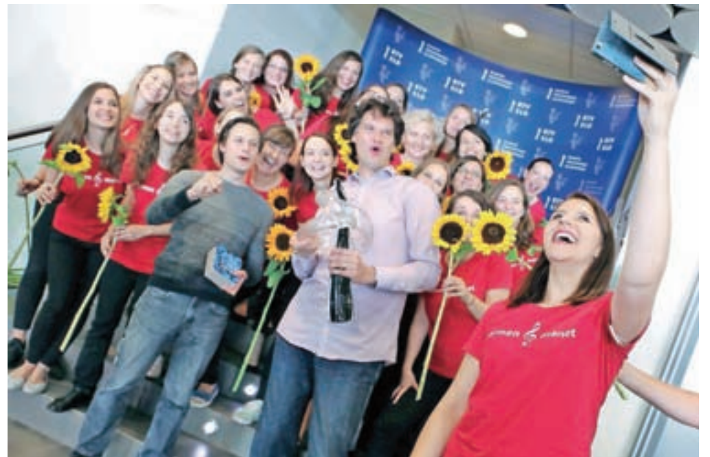
Zmage na zborovski Evroviziji kranjskega ženskega pevskega zbora Carmen manet so se veselili tudi na Televiziji Slovenija. En »utečen« selfie za slavnostni sprejem.