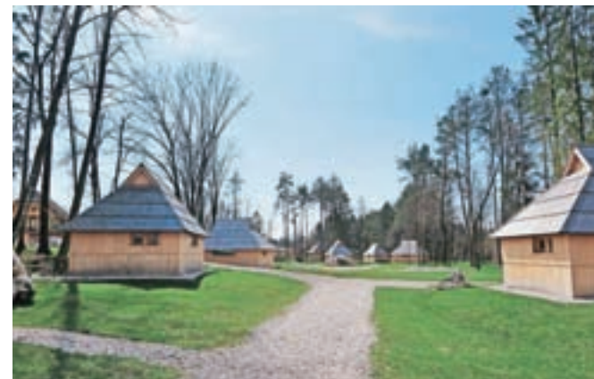
Čeprav se je Eko resort pod Veliko planino v zadnjem letu in pol razvil v eno bolj obiskanih in priljubljenih turističnih točk na Kamniškem, ga vseskozi spremlja črn madež. Inšpektorji si namreč še vedno niso na jasnem, ali je naselje črna gradnja ali ne.

ponovno odpravilo ter vrnilo v ponovni postopek. Izdana je bila nova odločba v zvezi s kozolcem, ki je bila po pritožbi v juliju odstopljena na MOP. V zvezi z gradnjo sedemnajstih tipskih lesenih hišic pa je bila v ponovljenem postopku izdana odločba odpravljena s strani MOP in vrnjena v ponovni postopek, ki še poteka, prav tako kot ugotovitveni postopek glede postavitve novih lesenih manjših nastanitvenih hišic na kmetijskem zemljišču, vse v sklopu Eko resorta,« so nam pojasnili na ministrstvu.