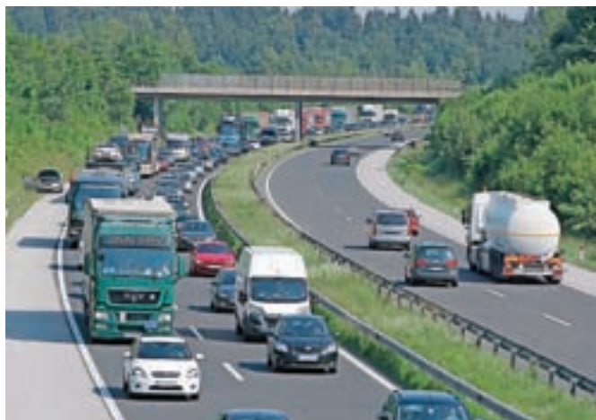
Vrhunec poletne turistične sezone prinaša tudi gnečo na cestah in mejnih prehodih.