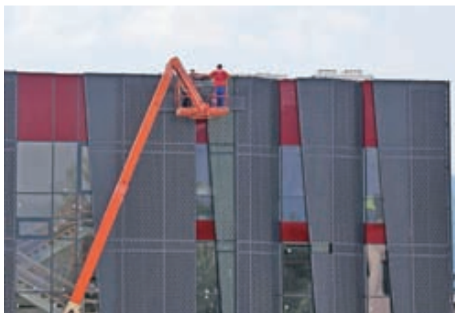
Obrtniška dela stojijo, dokler izvajalec ne bo odpravil napak pri tesnjenju.

Gradnja nove radovljiške knjižnice se je začela že leta 2010, vendar je bila zaradi pomanjkanja finančnih sredstev že po letu dni prvič prekinjena, letu 2014 pa se je pri tretji gradbeni fazi zaradi stečaja izvajalca popolnoma ustavila. Takrat je občina stavbo knjižnice zaščiti-