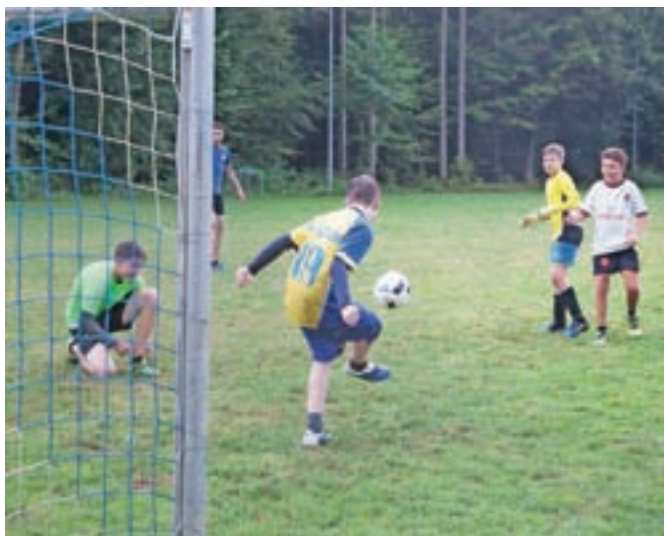
Dvakrat tedensko se lahko otroci in mladostniki udeležujejo nogometnih uric v Velesovem.