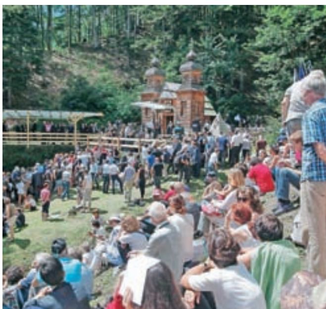
Ruska kapelica, simbol povezanosti in spoštovanja med dvema narodoma