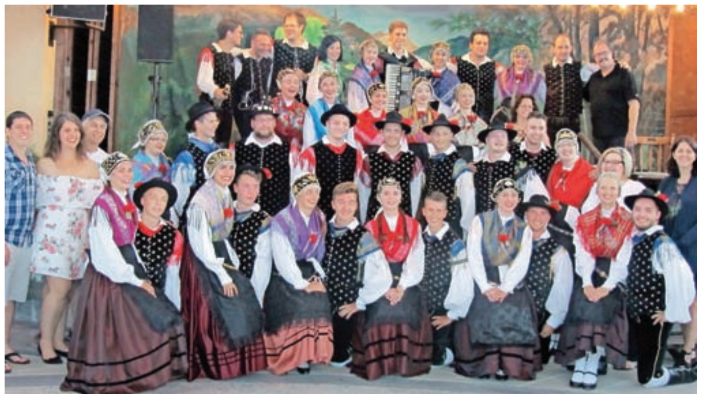
Folklorna skupina Mladi glas Planika iz Toronta z ansablom Saša Avsenika na vrtu Avsenikove gostilne po skupnem nastopu

Mladi glas Planika je bil kot del slovenskega društva v Torontu ustanovljen leta 1947, leta 1974 pa je začel delovati samostojno. V različnih generacijah je doslej plesalo več kot sto plesalk in plesalcev, ki niso pozabili drug drugega, ampak ostajajo še naprej prijatelji in se srečujejo. »Prav prijateljstvo in družabnost skušamo negovati tudi pri mladih, ki plešejo