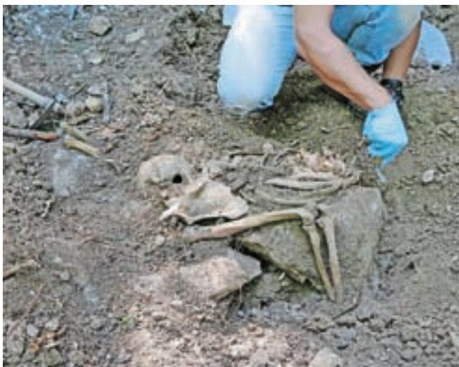
Komu pripadajo najdeni skeleti in koliko jih sploh je, še ni znano.

narodnosti in veroizpovedi: Hrvatje, Srbi, Črnogorci, Nemci, Avstrijci in Slovenci. Evidentiranih grobišč je več, a vsa še niso potrjena. Za njihov izkop in primerno obeležitev si že več let prizadevajo člani Društva Demos na Kamniškem, ki so v okviru projekta Pravica do groba izdali že dve knjigi s pričevanji svojcev ali prič poveljnih pobojev.