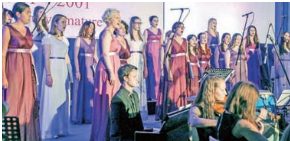
Pevke zbora Carmen manet bodo predstavljale Slovenijo.

skladbi, ki sta prepleteni s slovenskim ljudskim izročilom, napisala prav za to priložnost. Carmen manet (lat. pesem ostane) je ženski pevski zbor 33 pevk, nekdanjih dijakinij Gimnazije Kranj pod vodstvom Primoža Kerštajna, ki se redno udeležuje domačih in tujih tekmovanj in za svoje izvedbe prejema najvišje nagrade. Ali bodo v svojo vitrino dodale novo lovoriko, pa bo znano v soboto zvečer.