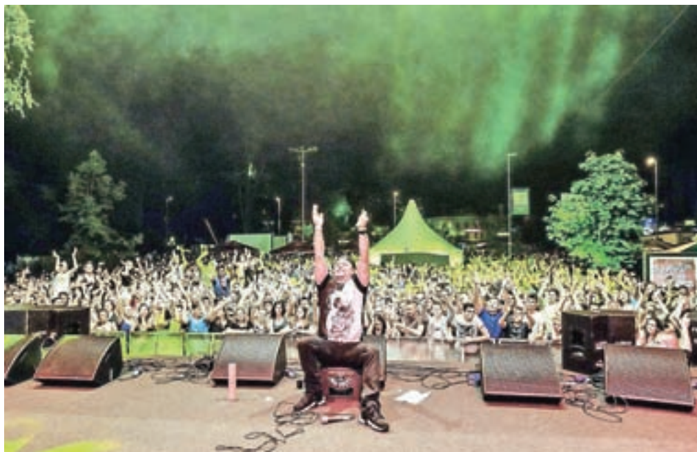
Ob Kranfestu je gorenjska prestolnica vedno polna. Tako naj bi bilo tudi ta konec tedna, ko se obetajo številne zanimive prireditve in koncerti.