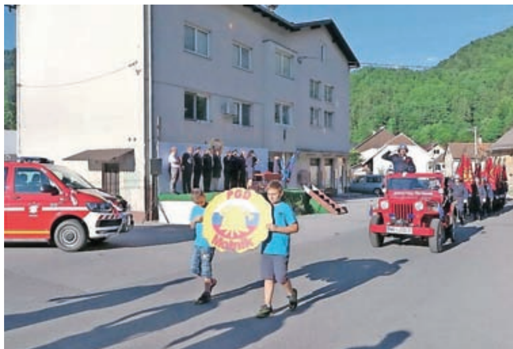
Ob prevzemu novega gasila so v Motniku pripravili tudi gasilsko parado.