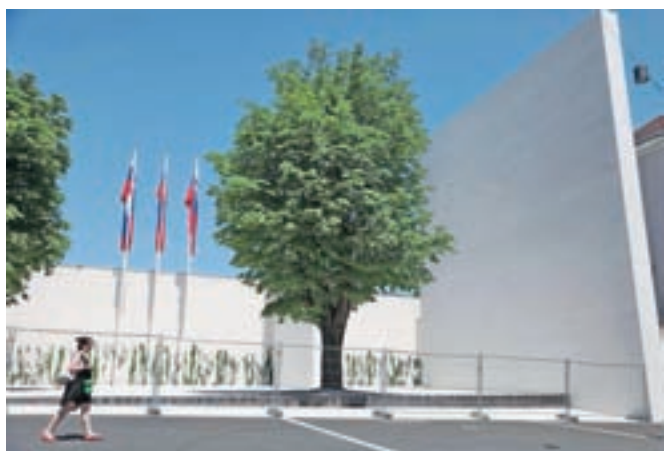
Spomenik vsem žrtvam vojn in z vojnami povezanim žrtvam naj bi nagovarjal k miru in spravi, a je že takoj spet razdelil slovensko politiko.