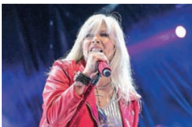
Samantha Fox še vedno veliko nastopa. Prejšnji teden je gostovala na prireditvi Pivo in cvetje.