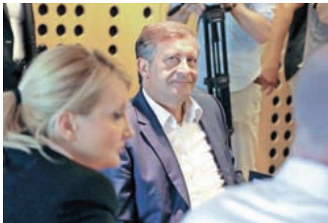
Zunanji minister Karel Erjavec opozarja, da enostranska ravnanja Hrvaške v Piranskem zalivu pomenijo neposreden poseg v suverenost Slovenije in šengna.