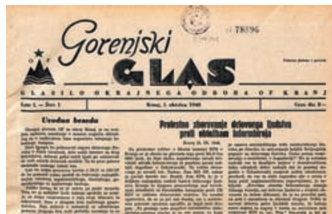
Naslovnica oziroma glava prve redne številke Gorenjskega glasa s prvega oktobra leta 1948

Prva številka Gorenjskega glasa, takrat glasila Okrajnega odbora Osvobodilne fronte Kranj, je izšla 1. oktobra leta 1948. Bralci so morali za štiri časopisne strani plačati