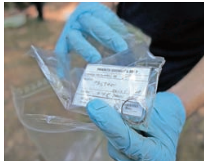
Med izkopom je bilo najdenih tudi nekaj osebnih predmetov, tudi ta prstan.