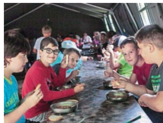
Pod velikim šotorom je lačnim planincem teknila enolončnica.