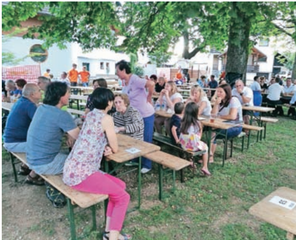
Veselice so še vedno pomemben finančni vir prostovoljnih gasilskih društev za nakup gasilske opreme.