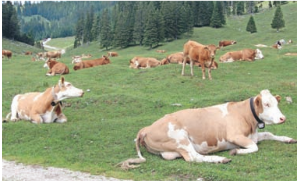
Živali na paši vedo, kaj je dobra trava. Izogibajo se manj vrednih trav, kot je na primer rušnata masnica, pa tudi plevelov.

V travni ruši na planinskem pašniku naj trave zavzemajo vsaj polovični delež, detelje od 20 do 30 odstotkov, ostalo pa so zeli, med katere sodijo tudi zdravilna zelišča in pleveli.