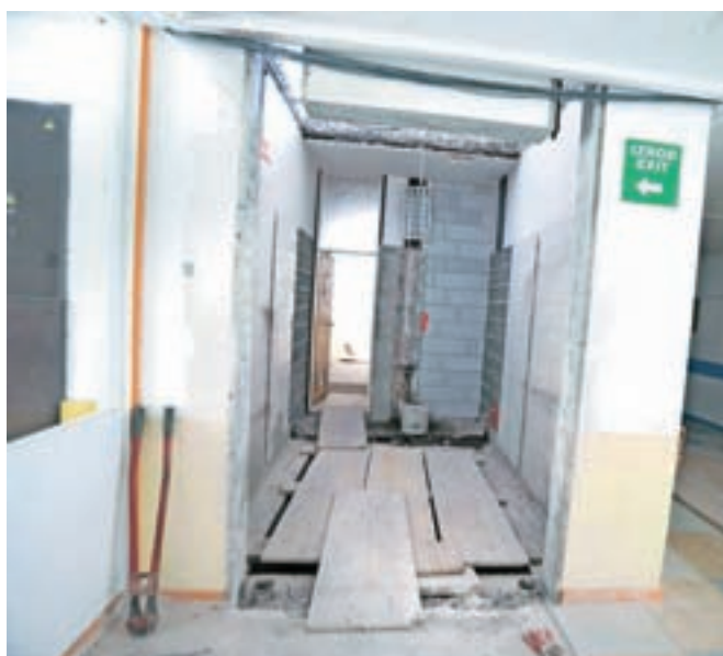
V Osnovni šoli Helene Puhar nadaljujejo prenovo, največja pridobitev pa bo dvigalo.

V pripravi je projektna in razpisna dokumentacija za tri nova otroška igrišča. V Besnici bodo na predlog KS Besnica poleg šolskega igrišča, namenjenega predvsem vrtčevskim otrokom, pridobili novo javno igrišče tudi za preostale šolarje. V Drulovki bodo na lokaciji nekdanjih igral, ki so bila zaradi dotrajanosti odstranjena, postavljena nova igrala. Novo igrišče bodo pridobili tudi otroci v Stražišču, in sicer bo v športnem parku Stražišče poleg odbojarskega in nogometnega