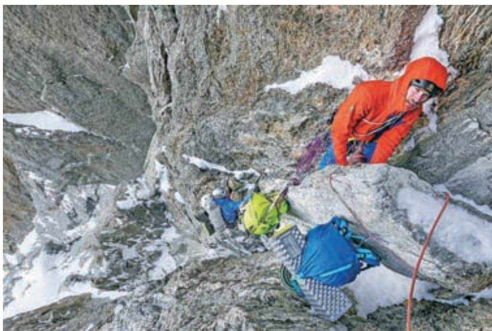
Plezanje najstrmejšega dela med vzponom na Arjuno

nevihta in ujame trdna noč, Urban v slabem soju svetilke najde prostor, primeren za bivakiranje. Zopet bivakiramo brez šotorja, vendar srečni, ker se je vreme