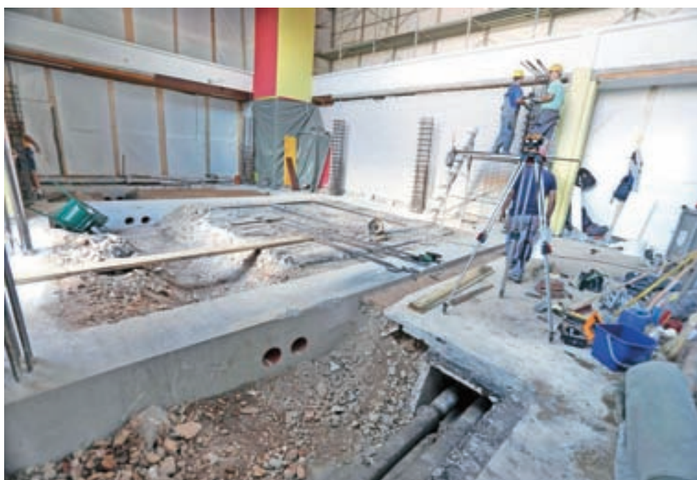
Večja prenova že ves mesec poteka na Osnovni šoli Simona Jenka.

Na posameznih objektih (Janina, Kekec, Ostržek, Ciciban, Biba) bodo zamenjali dotrajana zunanja okna in vrata, v enoti Janina se bo saniral pripadajoči del pomivalnice črne posode. Kuhinjo bodo delno preuredili tudi v enoti Ježek. Jeseni bodo predvidoma izvedli manjša vzdrževalna dela na igriščih. Prenavljajo tudi vrtce pri osnovnih šolah. V Predosljah bodo obnovili pohištvo, v Stražišču prebelili prostore vrtca, na Osnovi šoli Franceta Prešerna bodo izvedli vzdrževalna dela, na Osnovni šoli Simona Jenka bodo preuredili umivalnico, namestili previjalno mizo, ob šolski stavbi pa že prenavljajo tudi igrišče. Na Osnovno šolo Orehek bodo namestili zvočno izolacijo v dveh igralnicah v mansardi starega dela šolske stavbe in zamenjali podo na hodniku pri vходу v prostore vrtca. V vrtcu v Mavčičah bodo vgradili prezračevalni sistem v kuhinji.