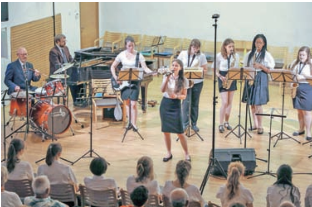
Džezovski ansambel šole St. Catherine's School je zaigral tudi uspešnico Sway.

Zaradi izjemno bogatega in raznolikega glasbenega programa so z ene najboljših neodvisnih šol v