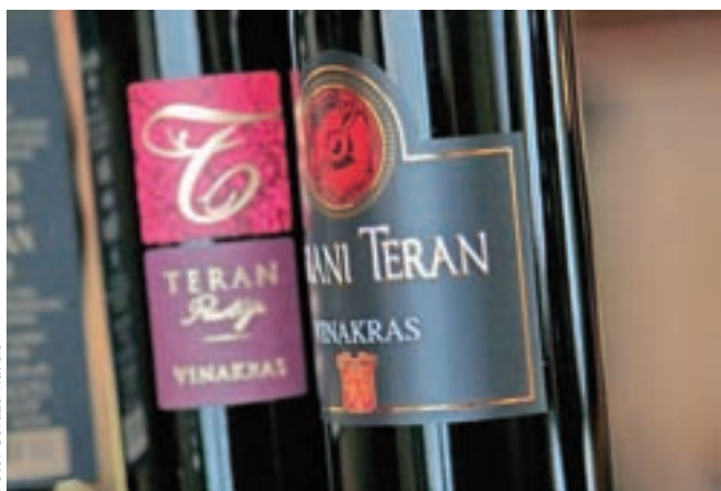
Hrvaški je od srede dodeljena izjema pri uporabi imena teran za označevanje sorte grozdja, ne pa tudi vina.