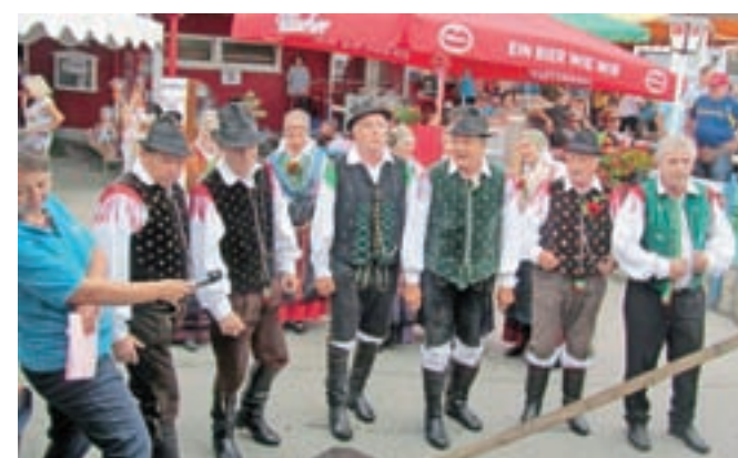
Na lanskem kmečkem prazniku v Celovcu v športnem parku SAK je sodelovala tudi folklorna skupina s Hrušice.

V ponedeljek, 24. julija, bo prišla v Mladinski center na Rebrci / Rechberg pri