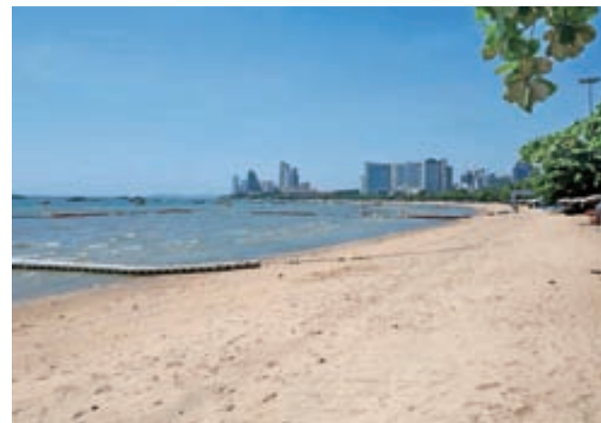
Plaža v tajskem mestu Pattaya, ki velja za »svetovno prestolnico seksa«, sredi junija 2017.