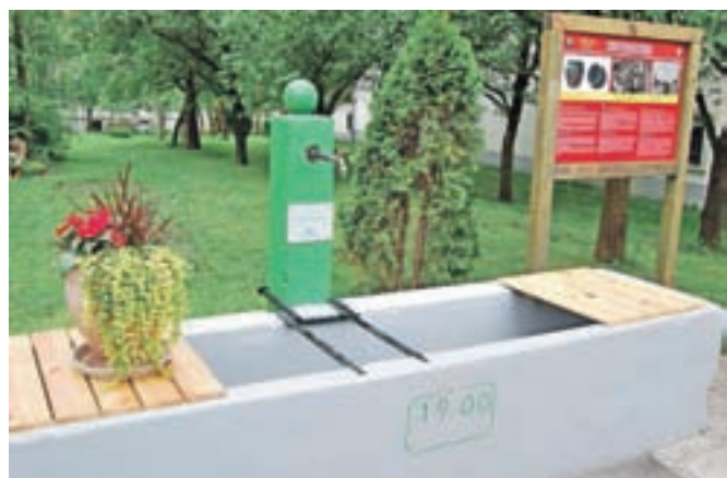
Obnovljeno vaško korito

Begunje – V Begunjah so obnovili staro vaško korito pred Strevčevo domačijo. Vaška korita so bila nekoč pomemben del oskrbe z vodo za domačije in kmetije. Običajno so bila last vaških skupnosti in so služila kot viri pitne vode, za pranje in tudi za napajanje živine. Turistično društvo Begunje je ob koritu postavilo tudi informativno tablo, na kateri je predstavljena manj znana najdba: v sadovnjaku za vodnim koritom so leta 1970 v globini metra in pol naključno našli tri skeletne grobove in keramičen lonček, ki ga lahko štejemo za izdelek staroselske keramike domače proizvodnje iz časa pozne antike.