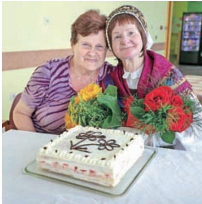
Prijateljica Francka Štremfelj je Anici spekla torto.

narodno nošo, vožnjo s kočijo, harmonikarjem, obiskom predsednice našega društva. Rada bi se zahvalila za tako lepo darilo, drugega ne potrebujem. Takšna dejanja me utrjujejo v pričanju, da je lepo živeti in da velike stvari najdemo v majhnih,« ganjena pravi slavljenka. Dogodek je nabit s čustvi in vsem v domski jedilnici se orosijo oči, ko Anici voščijo tudi na Radiu Sora.