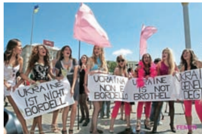
V razvitejših delih sveta proti seks turizmu že protestirajo. Na sliki pripadnice gibanja Femen v Ukrajini: »Ukrajina ni bordel!«