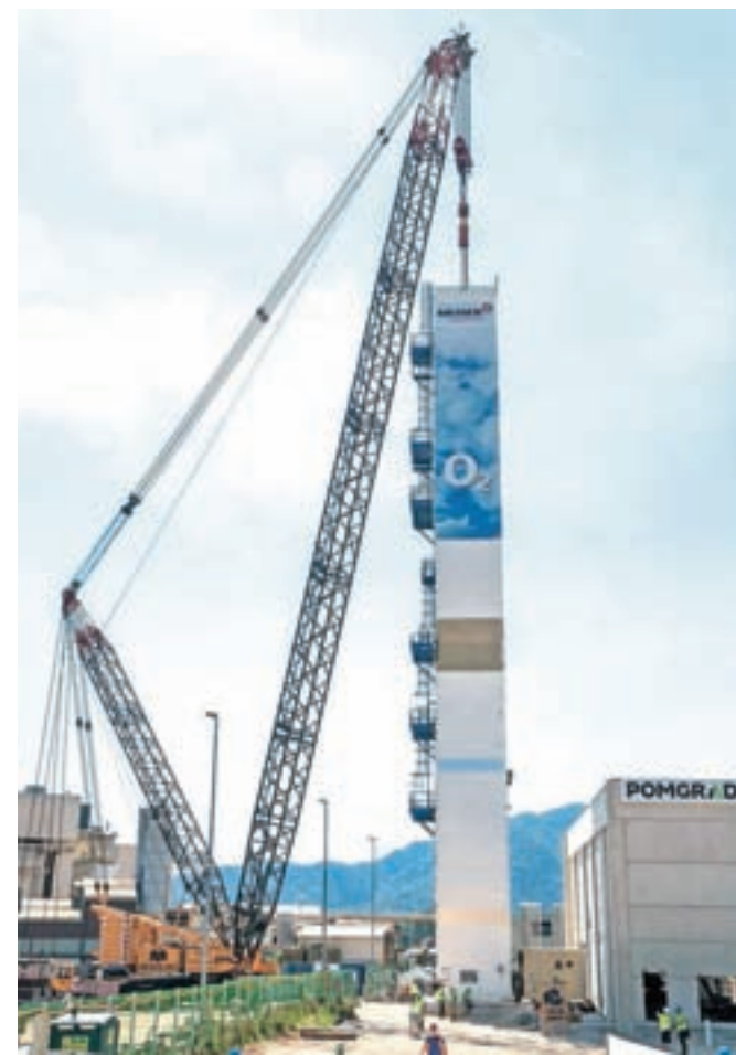
Na Trati, kjer bo do konca leta zgrajen obrat Messerjeve kisikarne, so ta teden že postavili stolp. / Foto: Žare Modlić

V družbi svojim poslovnim partnerjem (teh je v Sloveniji trenutno več kot 2800) kisik zdaj dovažajo iz sestrskih podjetij v Avstriji, Srbiji in na Hrvaškem. »S postavitvijo tega objekta lokalni industriji približamo vir plinov, kar pomeni krajše transportne poti in s tem tudi ugodnejšo ceno,« še dodaja Lukač. »Kisikarno gradimo v neposredni bližini podjetja Knauf Insulation, ki postopno uvaja novo tehnologijo za izboljšanje kakovosti izdelkov in zmanjšanje vplivov na okolje ter bo naš glavni odjemalec. Zdaj jim kisik v tekoči obliki dobavljamo s cisternami. Ko bo obratovanjem začela nova kisikarna, pa jim ga bomo lahko v plinasti obliki dobavljali po cevovodu.«