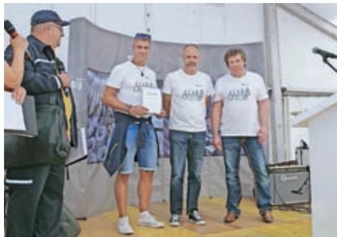
Podelitev priznanj inovatorjem Acronija

Jeklarski koncern Slovenske industrije jekla, ki je v lasti ruske skupine Koks, je pred štirimi leti začel s praznovanjem sicer v Rusiji bolj znanega Dneva metalurga, ki je za delavce SIJ-a predvsem priložnost za druženje in podelitev nagrad.