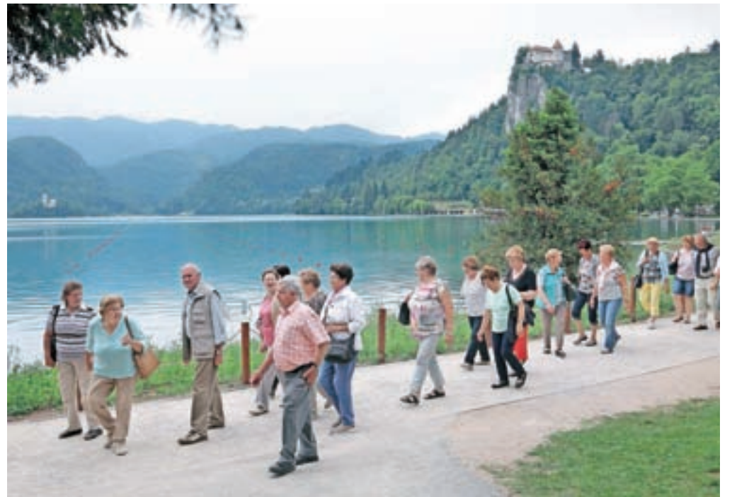
Gorenjski turistični kraji v teh dneh pokajo po šivih.