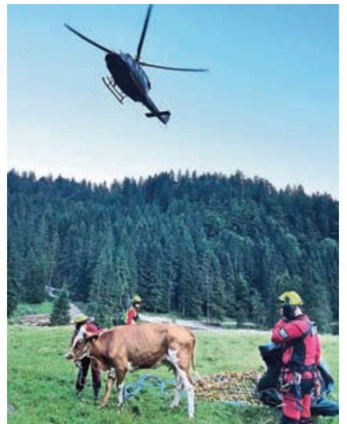
Poškodovano kravo so s helikopterjem prepeljali na planino Blato, kjer jo je prevzel lastnik.