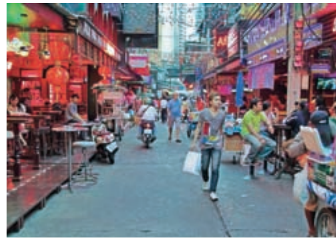
Četrtr v Bangkoku (»red light district«), kjer se dobijo »tiste reči«.

Tajski turistični delavec pred odprtjem novega erotičnega parka na južni obali: »Želimo si, da bi se ljudje zaljubili v Tajvan, pa tudi, da bi se zaljubili med obiskom Tajvana. Upamo, da bomo s parkom pritegnili ljudi na vseh stopnjah ljubezni. Zato načrtujemo celo 'Izgubljeni paradiz' za tiste strtega srca.« Mu verjamete?