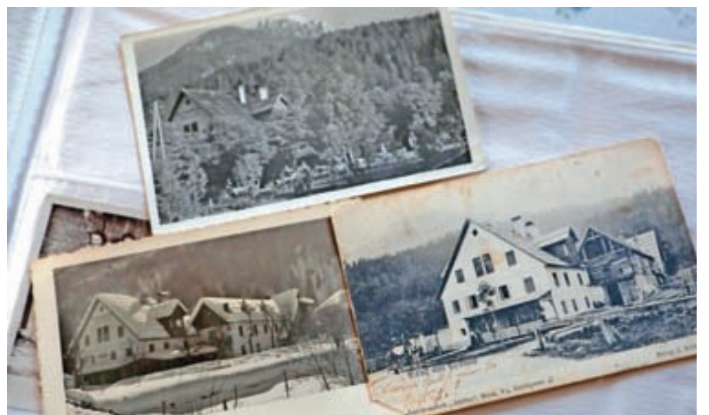
V skrbno shranjenih albumih hranijo tudi fotografije prvotne Koširjeve domačije, v sklopu katere so imeli restavracijo in sobe za tujce.