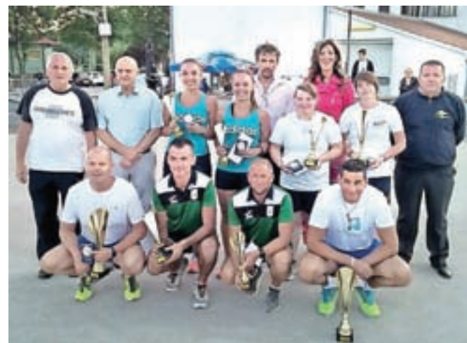
Naši balinarji so se na pomembnem turnirju odlično odrezali.