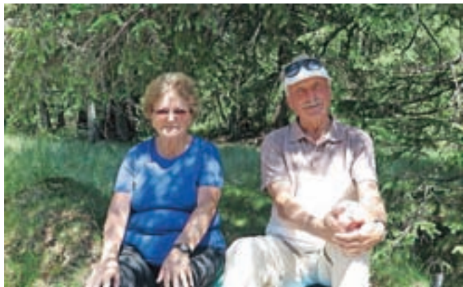
Zakonca Vodnjav v prijetni senčici na poti do Lovrenških jezer