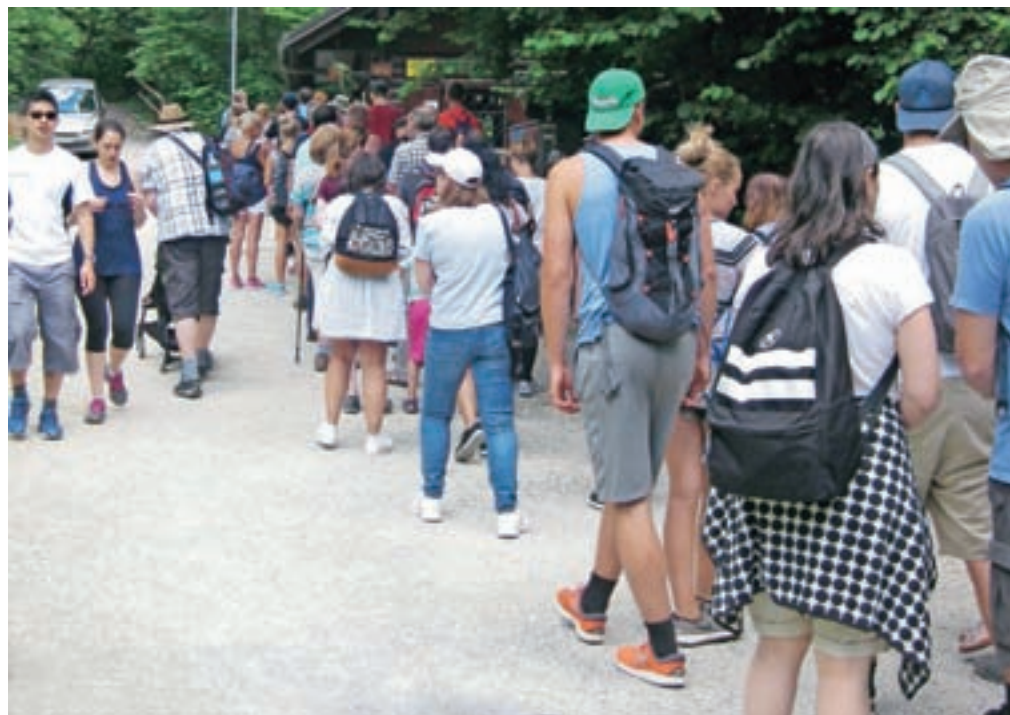
Turistično društvo Gorje, ki upravlja sotesko, ves prihodek od vstopnine vlaga v urejanje soteske.

mreže. Sprehod po soteski je zaradi hladu še zlasti primeren v času visokih poletnih temperatur.