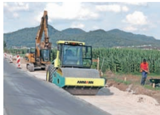
Prenova 850-metrskega odseka ceste skozi Podgorje bo zaključena do začetka septembra.

Odsek je dolg 850 metrov, investicija, ki je ocenjena na slabih 280 tisoč evrov, pa bo poleg prenove samega cestnega otoka in dvosmernega kolesarskega pasu ob vozišču.