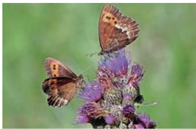
Svetlolisi rjavčki ( Erebia euryale ) se ta čas okoli planine Dolga njiva množično pojavljajo. Na fotografiji sta samici med hranjenjem na osatu.

»Če kdaj vidite samičko z zadkom obrnjenim navzgor, to ne pomeni, da vabi samčka k sebi. To pomeni "nimaš šans". Metulji različnih vrst, razen redkih izjem, kot sta sinji in kraški modrin, med sabo tudi ne morejo imeti potomcev,« je pojasnil Čičerov. Zanimivo, ampak večji kot so metulji, krajši čas živijo. Največji živi samo štirinajst dni. In obratno. Majhni modrini živijo tudi po dva meseca. In kako sploh ločimo samčka od samice? »Samičke imajo večinoma malce debelejšo zadke, že zaradi reproduktivnih organov.« Pa ste vedeli, da je družabno življenje metuljev izredno nekonfliktno? Radi se družijo, med njimi tudi ni izrazitega rivalstva. Res pa je, da nekateri branijo svoj teritorij.