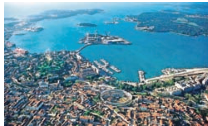
Pogled na Pulj, starodavno mesto in pristanišče. Hrvaška ga je z večino Istre dobila v dar po 2. sv. vojni.

»Naj opozorim, da v času zelo zaostrene retorike med Zagrebom in Ljubljano v zadnjem času ni bilo niti enega incidenta med domačini in slovenskimi turisti. Pred desetimi leti bi se incidenti dogajali vsak drug dan.« To je ob arbitraži izjavil hrvaški filozof Žarko Puhovski. Bo šlo brez incidentov tudi po koncu poletne turistične sezone?