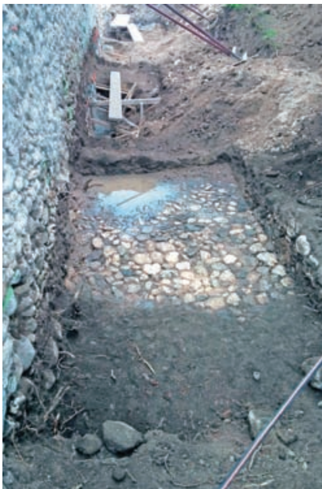
Med prenovo opornega zidu so našli tudi zanimive ostanke preteklosti: srednjeveški tlak in temelje doslej še neodkritih objektov.

»Med delismuogotovili, da zid nima globokih temeljev, zato smo pod njim zgradili