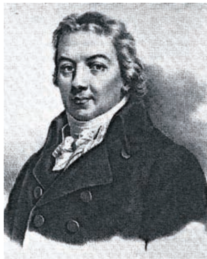
Angleški podeželski zdravnik Edward Jenner (1749–1823) je prvi na svetu ugotovil, da lahko neko nalezljivo bolezen (recimo koze) preprečimo s predhodnim ustreznim cepljenjem (vakcinacijo).

Navedena cepljenja so v Republiki Sloveniji obvezna (z zakonskimi sankcijami). Nekega cepljenja so lahko začasno oproščeni akutno bolni otroci, o čemer odloča lečeči zdravnik. Določenega cepljenja so lahko za stalno oproščeni zgolj nekateri bolni otroci, o čemer odloča na predlog pediatrov posebna komisija pri Ministrstvu za zdravje.