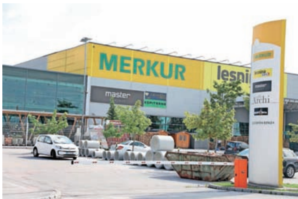
Ameriški kupec naj bi se resno zanimal tudi za nakup trgovskih centrov, ki jih Merkur trgovina najema za svojo dejavnost.