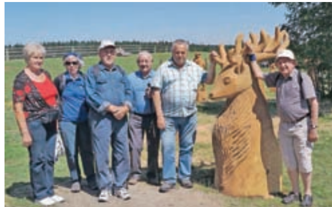
Skupina, ki se je odločila za krajšo pot po Škratovi učni poti