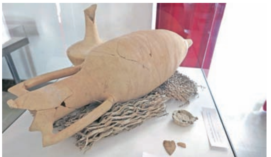
Amfora za vino z Rodosa, enoročajni vrč za vino in oljenka – kranjske najdbe s konca prvega stoletja pred našim štetjem in začetka prvega stoletja našega štetja

Pa vendarle, na dvorišču gradu Khislstein, na