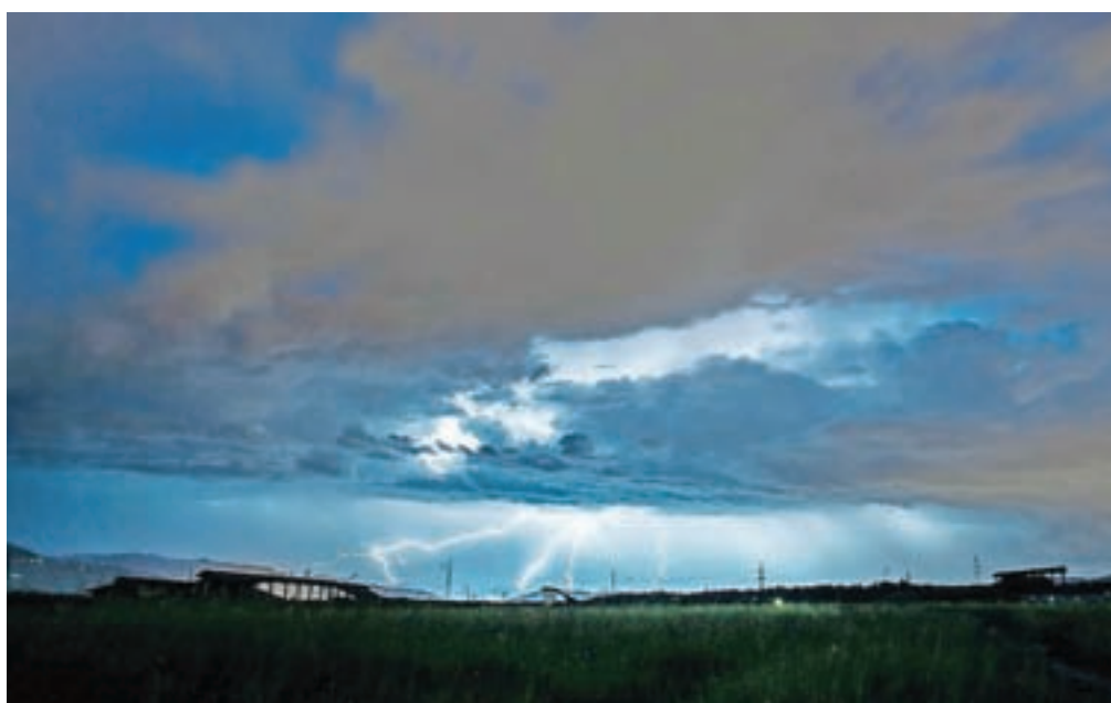
V Sloveniji letno zabeležimo več kot šestdeset tisoč udarov strel, največ seveda v poletnih mesecih.

v zaščitna oblačila. Biti moramo čim nižji. Pazite tudi, če imate na glavi čelado in imate kovinske zakovice. V tem primeru je bolje, da jo snamemo z glave. Izogibamo se tudi osamelih, izpostavljenih predmetov (drevesa,