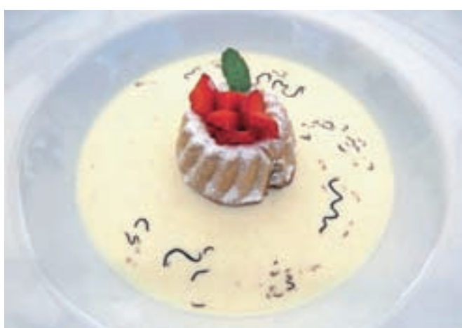
Orehova potička v vaniljevi »župci«