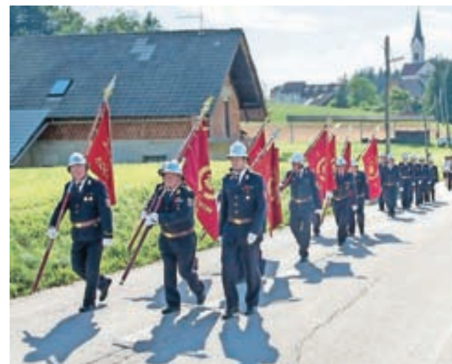
Jubilej društva so počastili tudi z gasilsko paradjo.

Perčič je dejal, da se bodo tako kot doslej tudi naprej trudili ohranjati raven članstva, se udeleževali občinskih tekmovanj, skrbeli, da bo operativna enota izobražena in da bodo sledili trendom z opremo. Zaradi prostorske stiske načrtujejo gradnjo novega gasilskega doma ali gradnjo prizidka obstoječemu. Priprave na gradnjo se bodo začele letos, gradnjo naj bi končali do leta 2019, ko bodo od Gasilske zveze Mestne občine Kranj dobili novo vozilo GVV-1.