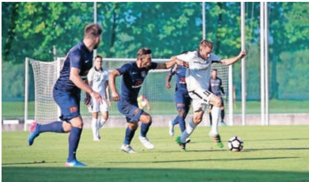
Nogometaši Triglava so na zadnji pripravljalni tekmi v sredo gostili turške pokalne in državne podprave iz Carigrada.