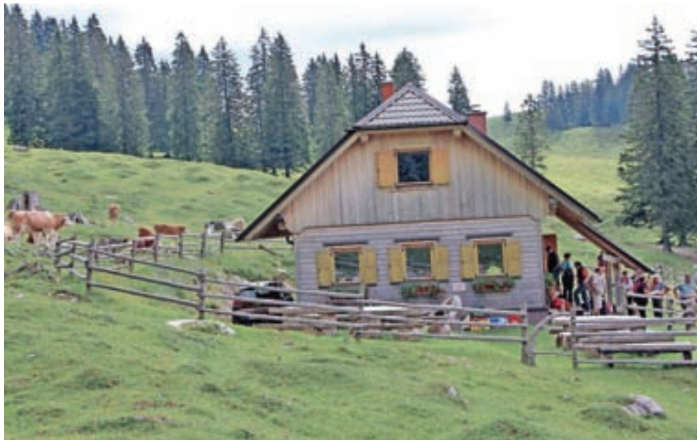
Agrarna skupnost je na planini v zadnjih letih zgradila novo kočjo.

primer škode ob prigonu na pašo ali odgonu s paše. Na planini, ki obsega 157 hektarjev površine, od tega je 83 hektarjev pašnikov, se letos pase okrog 130 goved, med njimi sta tudi dva licencirana bika. Pašna obremenitev je ena glava velike živine (GVŽ) na hektar, paša običajno traja od 108 do 110 dni. Živina je od petnajstih kmetov, a kmetje, ki so člani agrarne skupnosti, jo imajo manj kot nečlani. Agrarna skupnost deluje še po starem zakonu, ker za prilagoditev novemu zakonu še niso izvedli dednih postopkov vsaj za polovico deležev.