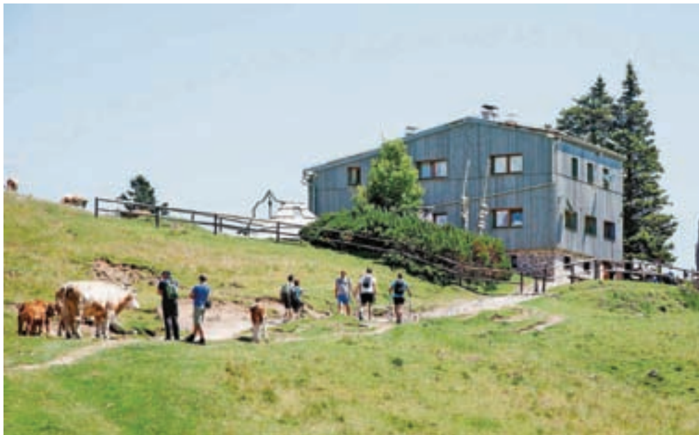
Dan odprtih vrat bo potekal tudi v prenovljenem Domžalskem domu na Mali planini.

V okviru projekta, ki traja od marca do novembra, potekajo različne aktivnosti, med njimi tudi dan odprtih vrat, ki bo jutri, 15. julija. Na njem bodo predstavili uspešne okoljske naložbe na Domu na Menini planini, Domžalskem domu na Mali planini