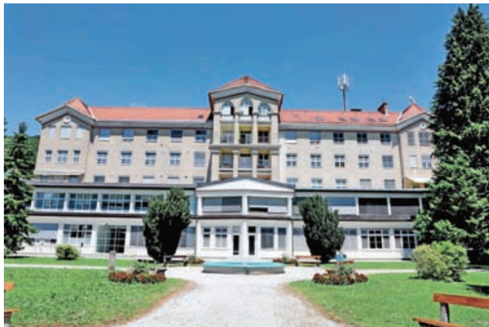
Klinika Golnik je svetla izjema, ki dobaviteljem plačuje redno in v rokih. Mesečno tudi spremljajo realizacijo programa, ki ga zakupijo s pogodbo z Zavodom za zdravstveno zavarovanje Slovenije, kar je nujen ukrep, pravi direktor.

Leta 2016 so v akutni bolnišnični obravnavi za šest odstotkov preseglji prvotno načrtovani program in obravnavali kar 13.746 bolnišničnih primerov. Kljub kadrovskemu pomanjkanju so za 1,7 odstotka preseglji točke načrtovanega ambulantnega