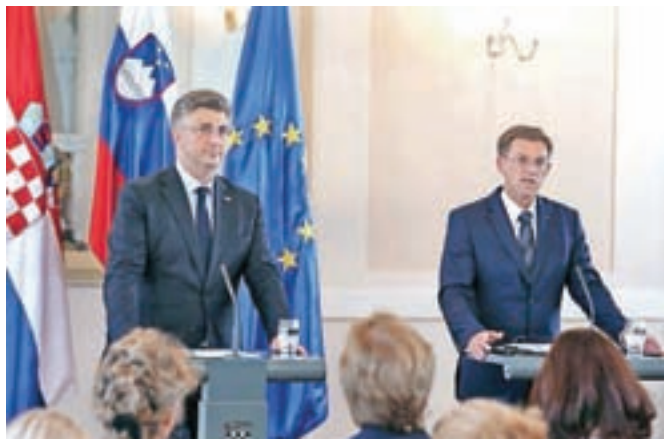
Premierja Slovenije in Hrvaške Miro Cerar in Andrej Plenković pričakovano nista zblížala stališč o uresničevanju arbitražne razzodbe o meji.