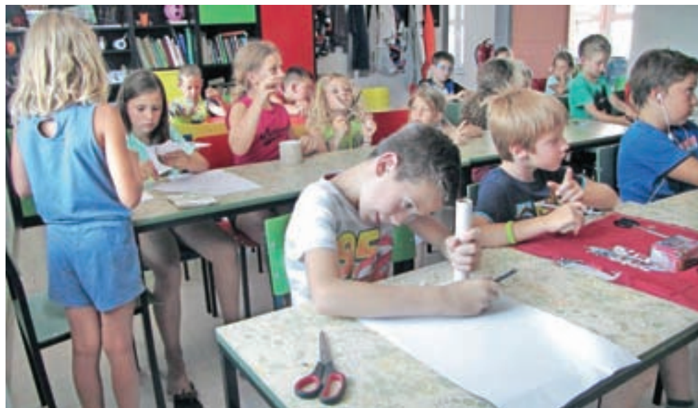
Delavnica izdelovanja darilnih vrečk