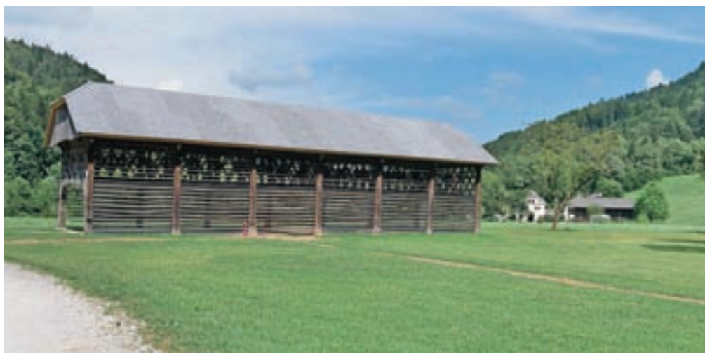
Pretiran hrup izpod kozolca moti bližnje sosede.

Po besedah mlade neveste je bližnji sosed že ob 23. uri poklical policijo, ta pa jima je naložila plačilo kazni zaradi preglasne glasbe. Zato v zapisu na družabnem omrežju vsem prihodnjim