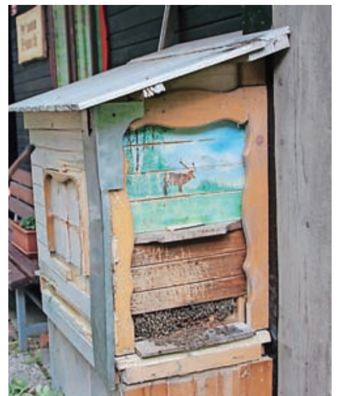
Medved je letos v Kokri povzročil nekaj škode na manjšem čebelnjaku.

rjavega medveda na Gorenjskem,« so v zavodu zapisali v oceno številčnosti in dodali, da je v zadnjih letih vse pogostejše pojavljanje večjih medvedov in medvedk z mladici. Najmanj osem medvedov naj bi bilo v opazovanem obdobju na območju Jelovice in Spodnjih Bohinjskih gora in najmanj trije na območju Poljanske doline in Dolomitov, pri tem pa je verjetno, da se kateri od teh medvedov pojavlja na obeh območjih. Na območju Jelovice in Spodnjih Bohinjskih gora naj bi prisotnost medveda zaznali v loviščih Stara Fužina, Bohinjska Bistrica, Nomenj - Gorjuše, Selca, Sorica, Železniki, Jošt - Kranj, Kropa in Triglav,