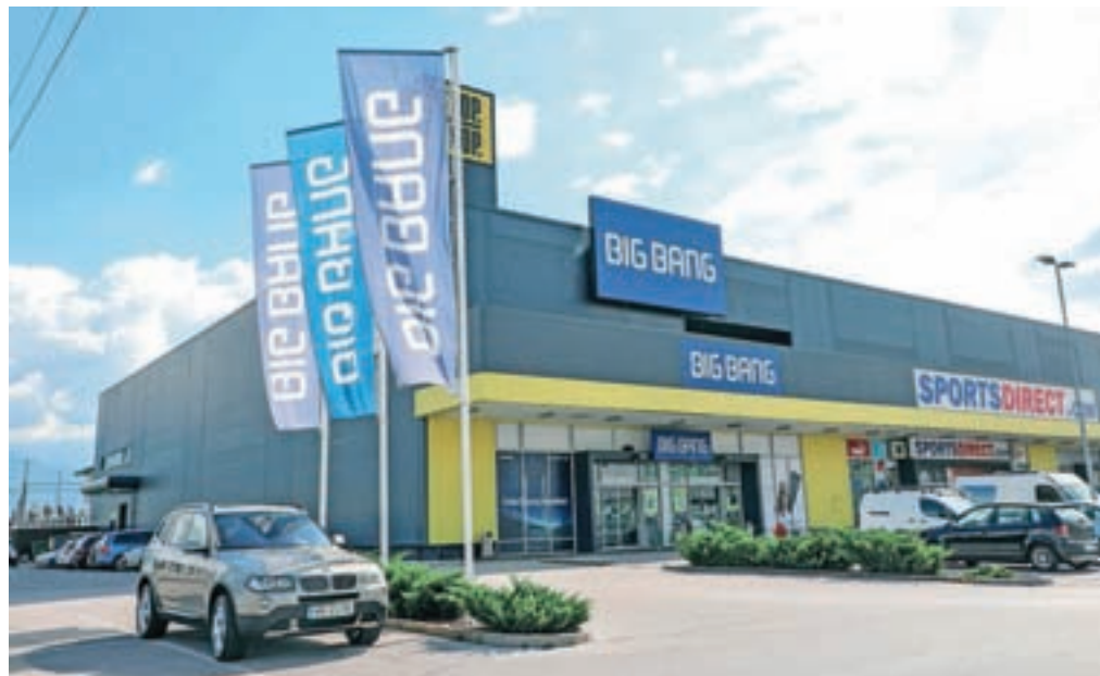
Ta teden se je z nezavezujočim zbiranjem ponudb na podlagi neposrednih pogajanj začela tudi prodaja Big Banga.

Prodaja Merkurja trgovine je potekala vzporedno s prodajo trinajstih Merkurjevih trgovskih centrov, ki jih ima družba Merkur trgovina v najemu in so v lasti družbe Heta Asset Resolution, slabe banke nekdanje avstrijske banke Hypo. Po poročanju časnika Delo naj bi se ameriški sklad HPS Investments Partners že dogovoril za nakup teh trgovskih centrov po ceni 49 milijonov evrov, zelo resno pa naj bi se zanimal tudi za družbo Merkur nepremičnine, ki se je prav tako izločila iz starega Merkurja. Merkur nepremičnine imajo namreč v lasti tudi nekaj trgovskih centrov (tudi poslovno-skladišni kompleks v Naklem ter trgovska centra na Primskovem v Kranju in Jesenicah), katerih najemnik je Merkur trgovina. Kdaj se bo začel postopek prodaje Merkurja nepremičnin, ki je v večinski lasti DUTB, lastnici pa sta še Heta in Gorenjska banka, ni znano.