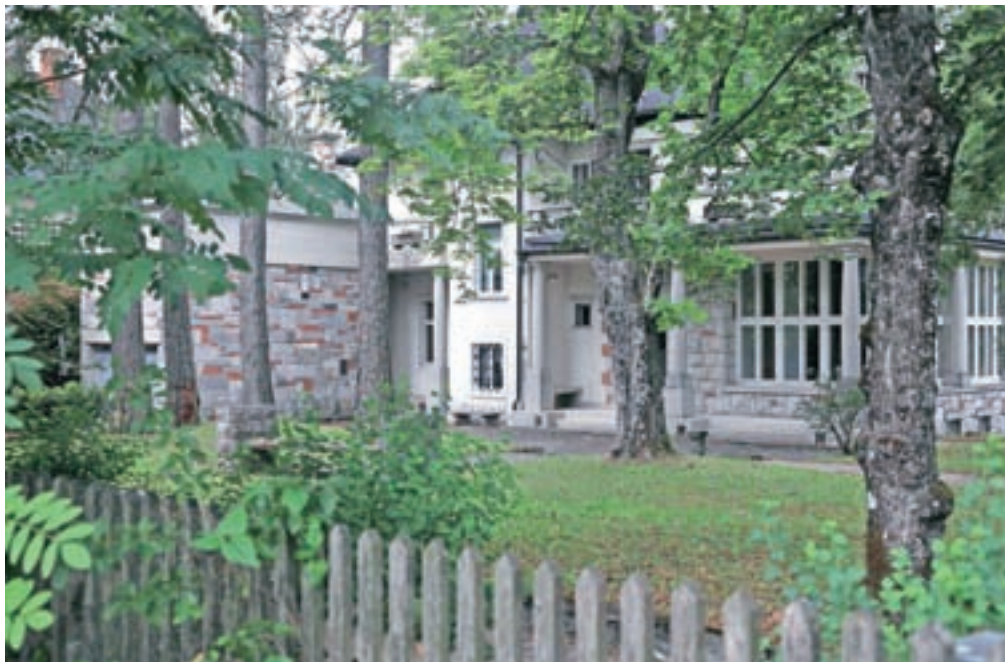
Nova lastnika vile Epos na Bledu sta zakonca Login.

Po oceni nepremičninskih posrednikov naj bi bila samo zemljišče na Mlinem in parcela ob vili Epos vredna okrog sedem milijonov evrov, medtem ko so vilo pred časom prodajali za 3,5 milijona evrov. »V primeru, da bi se nova lastnika lotila gradnje vil, kot je predvideno po prostorskem načrtu, bi lahko z investicijo na tem zemljišču začela takoj. Če imata drugačne namene, pa je treba najprej