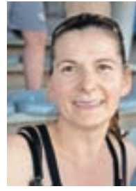
Boja Zec iz Britofa:

»Mislim, da bo ekipa Triglava že v prvem delu sezone nabrala toliko točk, da v nadaljevanju obstane v prvi ligi ne bo vprašljiv. Na koncu računam, da bodo uvrščeni na sedmo ali osmo mesto.«