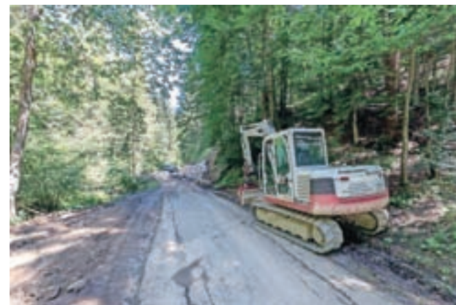
Rekonstrukcija ceste Sivar–Logar proti Megušnici je s 190 tisoč evri največja letošnja občinska investicija v Železnikih.

Železniki – Občina Železniki se je pred kratkim lotila rekonstrukcije dotrajane ceste Sivar–Logar proti Megušnici, ki je s 190 tisoč evri tudi največja letošnja občinska investicija. »Rekonstruirali bomo 840 metrov ceste in jo na novo asfaltirali, predvidene so tudi majhne razširitve. Obnovili bomo še objekte za odvodnjavanje in ojačali tri manjše mostove,« je povedal občinski referent za komunalno Darko Gortnar. Izvajalec je podjetje Mapri Proasfalt s podizvajalcem Todogradom, pogodbeni rok za dokončanje del pa je 30. avgust. Občina Železniki bo za investicije v cestno infrastrukturo letos namenila okoli 800 tisoč evrov. Predvideli so tri večje naložbe v občinske ceste v skupni vrednosti pol milijona evrov, in sicer proti Megušnici, v lokalno cesto Ravne–Šurk, ki so jo že rekonstruirali, in odsek Gotnar–Kovač v Podlonku, kjer so zaradi zahtevnosti del rok za izvedbo podaljšali na 10. avgust.