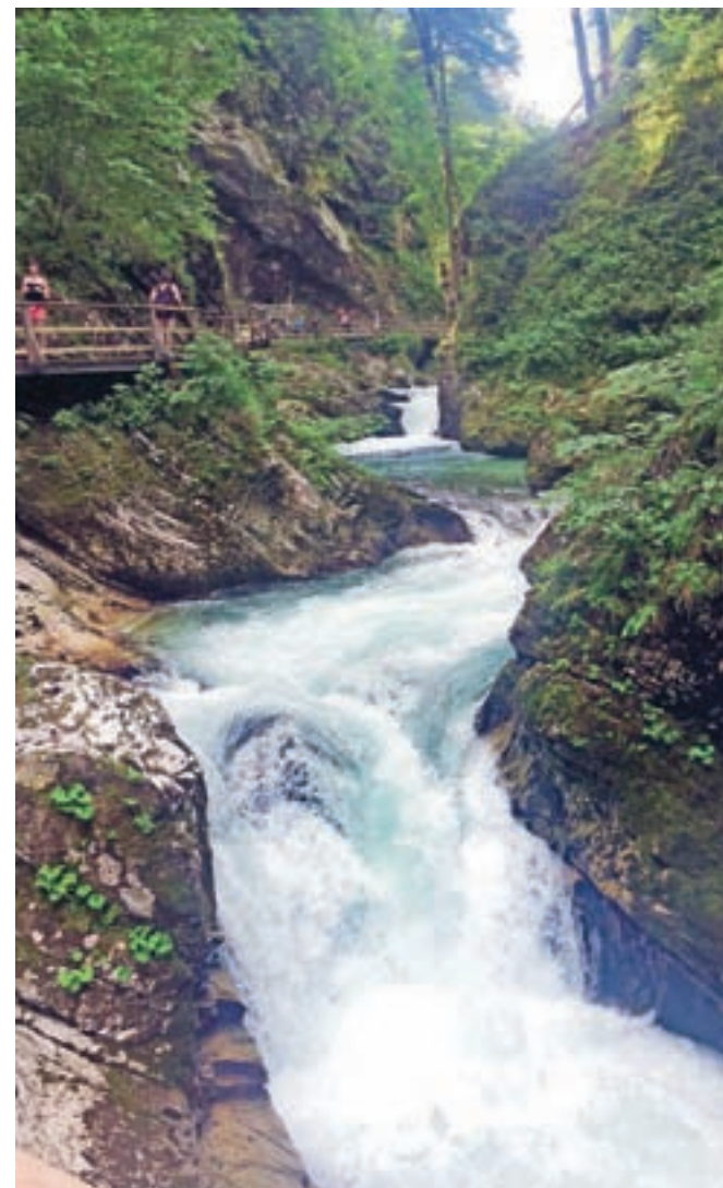
V turističnem društvu so zadovoljni z obiskanostjo soteske.

Soteska Vintgar je 1600 metrov dolga in do 250 metrov globoka soteska, ki jo je izoblikovala gorska reka Radovna med Homom in