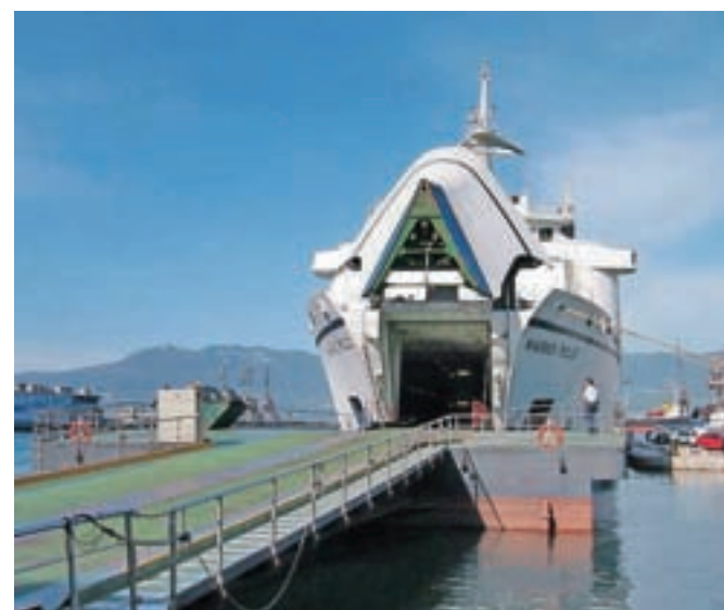
Trajekt Marco Polo v reškem pristanišču. To je tudi največje hrvaško tovarno pristanišče, njegov letni pretovor znaša okrog 15 milijonov ton (koprski pa 18).