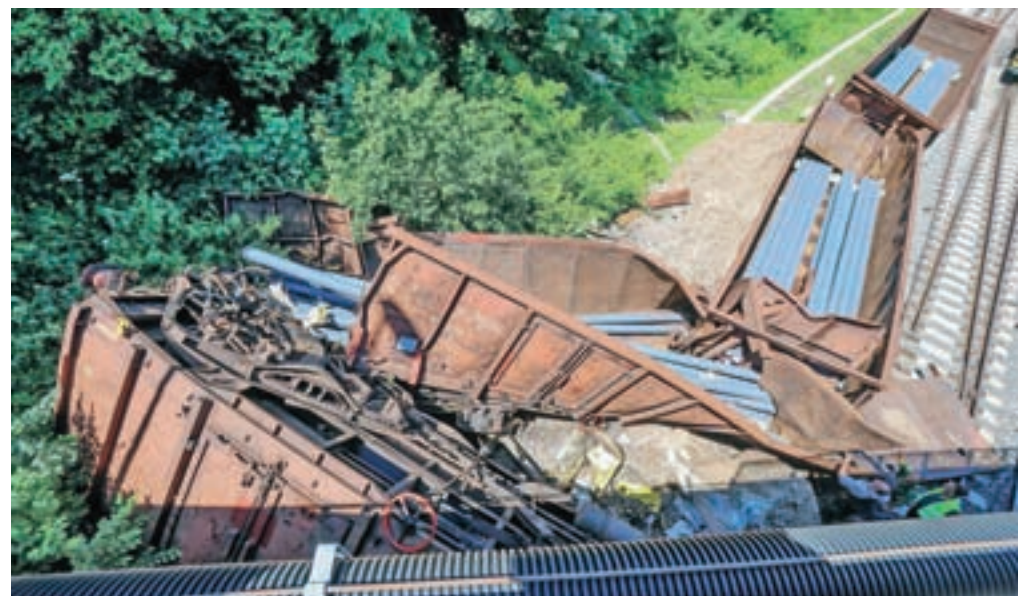
Vsaj trije od šestih iztirjenih vagonov so popolnoma uničeni.

Tovorni vlak, ki je bil na poti z Jesenic v Ljubljano, se je iztiril v torek nekaj pred 18. uro pod nadvozom Ljubljanske ceste v neposredni bližini kranjske železniške postaje, vzrok za nesrečo pa policija in pristojna preiskovalna komisija Slovenskih železnic še vedno ugotavljata. Iztirilo se je pet vagonov daljše tovrstne vlakovne kompozicije, eden od njih se je tudi zagodil pod nadvozom Ljubljanske ceste čez železniško progo. Ker je obstajala verjetnost poškodbe mostu, so policisti za ves promet zaprli Gaštejški klanec, znova