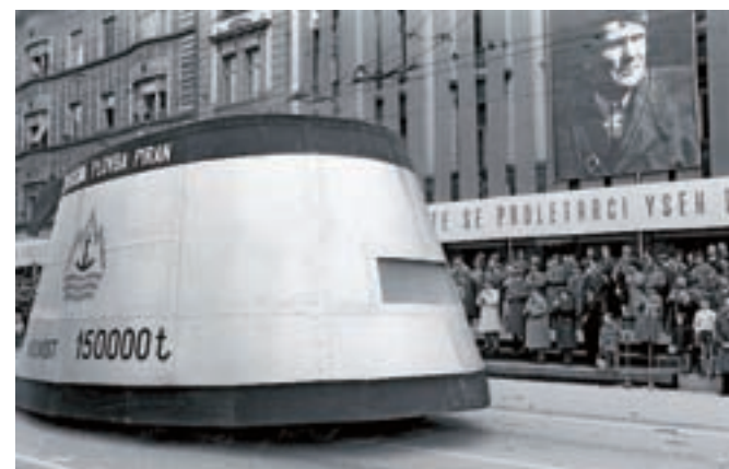
Tako se je na prvomajski paradi v Ljubljani leta 1961 predstavila Splošna plovba Piran, ponos novorojenega slovenskega pomorstva.