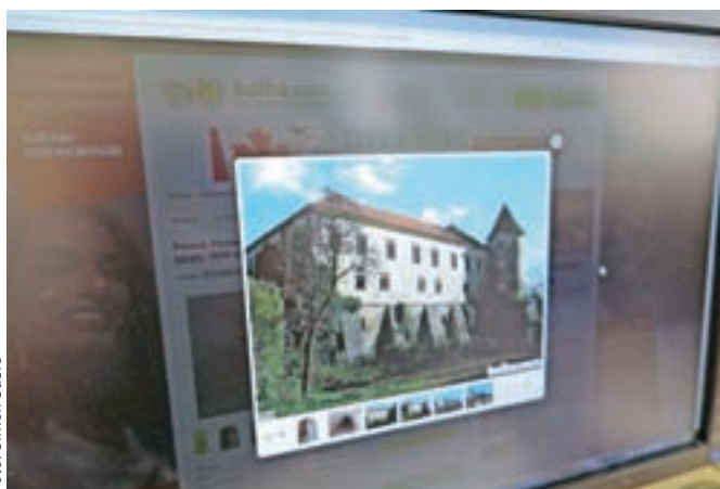
Grad Podčetrtek lastniki prodajajo kar na spletnem portalu bolha.com. S prodajo bi radi iztržili 370 tisoč evrov.