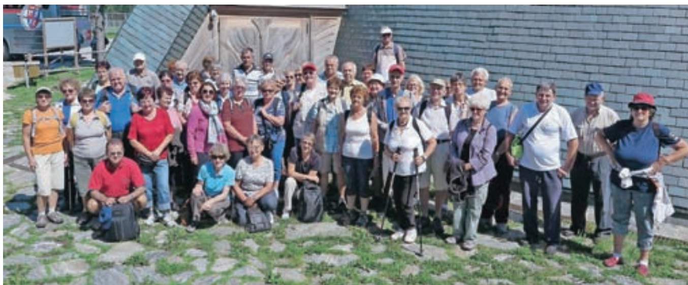
Naši izletniki pred cerkvijo na Rogli